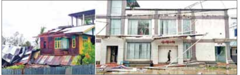
ရခိုင်ပြည်နယ် မြောက်ဦးမြို့နယ်၌ နေအိမ်အဆောက်အအုံများ ပျက်စီးမှု။