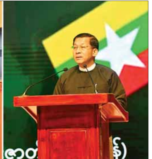
နိုင်ငံတော်စီမံအုပ်ချုပ်ရေးကောင်စီဥက္ကဋ္ဌ နိုင်ငံတော်ဝန်ကြီးချုပ် ဗိုလ်ချုပ်မှူးကြီး မင်းအောင်လှိုင် မြန်မာ-အိန္ဒိယ နှစ်နိုင်ငံ ချစ်ကြည်ရေးနှင့် သံတမန်ဆက်ဆံခြင်း (၇၅)နှစ်ပြည့် စိန်ရတုအထိမ်းအမှတ်အခမ်းအနားတွင် ဆန္ဒပြုဆုတောင်းစကား ပြောကြားစဉ်။