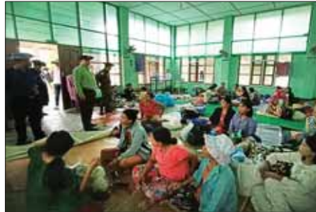
ရခိုင်ပြည်နယ် ကျောက်ဖြူမြို့နယ်၌ မုန်တိုင်းရောက်ပြည်သူများအား တာဝန်ရှိသူများက အားပေးစကားပြောကြားစဉ်။