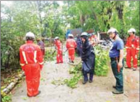
ရခိုင်ပြည်နယ် မာန်အောင်မြို့နယ်၌ မေ ၁၄ ရက်က လမ်းမပေါ်တွင် ပိတ်ဆို့ ပြုလဲကျိုးကျနေသော သစ်ပင်၊ သစ်ကိုင်းများအား မြို့နယ်စီမံ အုပ်ချုပ်ရေးအဖွဲ့ (ခေတ္တ) ဥက္ကဋ္ဌ ဗိုလ်မှူး ညွှန်ကြားရေးမှူးချုပ်နှင့် တပ်မတော်သားများ ဌာနဆိုင်ရာဝန်ထမ်းများ ပါဝင်သော ပူးပေါင်း အဖွဲ့က ခုတ်ထွင်ရှင်းလင်းစဉ်။ သိန်းဖေ (ပြန်/ဆက်)