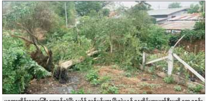
မကွေးတိုင်းဒေသကြီး အောင်လံမြို့နယ်၌ သစ်ပင်များ ပြိုလဲမှုနှင့် နေအိမ်များပျက်စီးမှုကို တွေ့ရစဉ်။ မျိုးသိန်း(ပြန်/ဆက်)