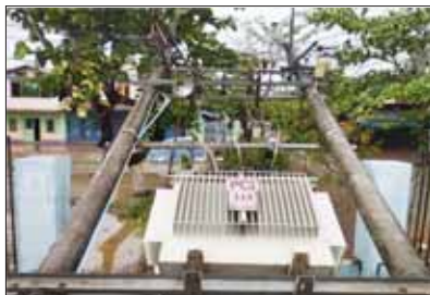
ရခိုင်ပြည်နယ် ငှါမြို့နယ်၌ လျှပ်စစ်ထရန်စဖော်မာ ပြိုလဲမှု။