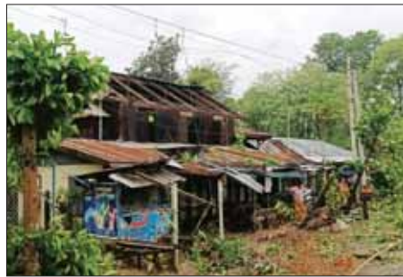
ပဲခူးတိုင်းဒေသကြီး တောင်ငူမြို့နယ်၌ နေအိမ်များပျက်စီးမှု။ ခရိုင်(ပြန်/ဆက်)