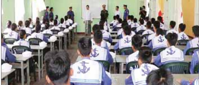
ပြောကြားသည်။ ထို့နောက် ပြည်နယ်ဝန်ကြီးချုပ်နှင့် လိုက်လံနူးတင်ဆက်အားပေးခဲ့ကြောင်း သတင်းရရှိ တိုင်းမျိုးတို့က သင်တန်းသား သင်တန်းသူများအား သတင်းရရှိ ဂုဏ်ပြုထောက်ပံ့ငွေများပေးအပ်ပြီး ရင်းရင်းနှီးနှီး သတင်းစဉ်

နေပြည်တော် မေ ၁၄ ကျောင်းသား ကျောင်းသူ မျိုးဆက်သစ်လူငယ် မောင်မယ်များကို နေရာသီ ကျောင်းစိတ်ရက်ကာလ အတွင်း အသိပညာများ ဖွံ့ဖြိုးတိုးတက်စေရန်၊ အားလပ်ရက်များ အကျိုးရှိစေရန် မိမိဝါသနာပါသည့် ပညာရပ်များကို လေ့လာဆည်းပူးနိုင်စေရန်နှင့် နိုင်ငံတော်အတွက် ရေကြောင်းပညာ၊ လေကြောင်း ပညာကျွမ်းကျင်သော အနာဂတ်မျိုးဆက်သစ် လူငယ်များ ပေါ်ထွန်းလာစေရန် ရည်ရွယ်၍ တပ်မတော် (ရေ) က ရေကြောင်းလူငယ်အခြေခံနှင့် တန်းမြင့်သင်တန်းများ၊ တပ်မတော် (လေ) က အခြေခံ လေကြောင်းလူငယ်သင်တန်း (အကြီးတန်းအဆင့်) နှင့် အခြေခံလေကြောင်း လူငယ်သင်တန်း (အငယ် တန်းအဆင့်) ဖွင့်ပွဲများကို ဧပြီ ၂၄ ရက်တွင် သက်ဆိုင်ရာ