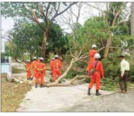
ရန်ကုန်တိုင်းဒေသကြီး သန်လျင်ခရိုင် ကိုကိုးကျွန်းမြို့နယ်အတွင်း မေ ၁၄ ရက်နံနက်ပိုင်းက လေပြင်းတိုက်ခတ်မှုကြောင့် ကျိုးကျခဲ့ သော သစ်ကိုင်းများ ခုတ်ထွင်ရှင်းလင်းခြင်းကို မြို့နယ်အုပ်ချုပ်ရေးမှူး ဦးဆောင်၍ မြို့နယ် အထွေထွေအုပ်ချုပ်ရေး ဦးစီးဌာနဝန်ထမ်းများ၊ မီးသတ်တပ်ဖွဲ့ဝင်များက ဆောင်ရွက်စဉ်။ သတင်းစဉ်