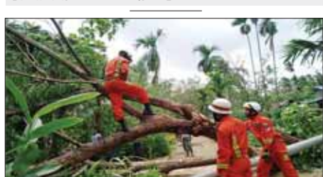
ဧရာဝတီတိုင်းဒေသကြီး ဘိုကလေးမြို့နယ်၌ သစ်ပင်များ ပြိုလဲမှုကို ရှင်းလင်းဆောင်ရွက်စဉ်။