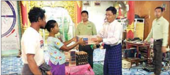
ပင်လယ်ကမ်းစပ်နေ မိသားစု စုစု ဖူးမြို့ရေ ၃၃၈ ဦး လာရောက် ခိုလှုံလျက်ရှိပြီး ပြည်နယ်အစိုးရ အစီအစဉ်ဖြင့် ထောက်ပံ့မှုများနှင့် ရွက်ပေးလျက်ရှိကြောင်း သိရ မြို့ဌာနဆိုင်ရာများနှင့် လူမှု သည်။ အဖွဲ့အစည်းများက ကူညီဆောင် သတင်းစဉ်

ပြည်သူ့အခြေပြုပြင်ဆောင်ရွက် နိုင်ရေး ရုံးချုပ်သို့တင်ပြရန်နှင့် ဝန်ထမ်းရေးရာကိစ္စများ မှာကြား သည်။ ဆက်လက်၍ ဒုတိယဝန်ကြီး သည် မြို့သဘာဝဘေးအန္တရာယ် စီမံခန့်ခွဲမှုကော်မတီ ဥက္ကဋ္ဌ မြို့အုပ်ချုပ်ရေးမှူးနှင့်အတူ မြို့ဦး တောင်ပေါ်ကျောင်းတိုက် ဆရာ တော်ဥပညာသီရိအား ဖူးမြော်ပြီး ကျောင်းတိုက်တွင် မြို့အစီအစဉ် အရ မုန်တိုင်းအန္တရာယ်ခိုလှုံရန် ရောက်ရှိနေသော မြို့မရပ်ကွက် နှင့် အလယ်ရွာ ပင်လယ်ကမ်းခြေ တွင် နေထိုင်သည့် အိမ်ထောင်စု ၄၆ စုမှ လူဦးရေ ၁၈၅ ဦးတို့အား တွေ့ဆုံ၍ အားပေးစကား ပြောကြားကာ မြို့နယ်စီမံခန့်ခွဲမှု ကော်မတီက ထောက်ပံ့သည့် ခေါက်ဆွဲခြောက်နှင့် ကြက်ဥများ ပေးအပ်လျှင်အားပေးသည်။ (ယာဂုံ) ဝတ္တမြို့တွင် ဘုန်းတော်ကြီး ကျောင်း သုံးကျောင်းနှင့် အလယ် ရွာ အခြေခံပညာအလယ်တန်း ကျောင်းတို့၌ မုန်တိုင်းဘေး အန္တရာယ်ကြိုတင်ခိုလှုံရာ စခန်း လေးခုတွင် ဝတ္တမြို့ ရပ်ကွက်များနှင့် အနီးအနား ကျေးရွာများမှ