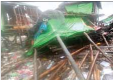
ရခိုင်ပြည်နယ် ကျောက်ဖြူမြို့နယ်၌ နေအိမ်များပျက်စီးမှု။