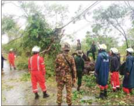
ရခိုင်ပြည်နယ် ကျောက်ဖြူမြို့နယ် မေ ၁၄ ရက်က လမ်းများ၌ သစ်ပင်၊ သစ်ကိုင်းများနှင့် ဓာတ်တိုင်များကျိုးကျနေမှုကို နယ်မြေခံတပ်ရင်း တပ်ဖွဲ့များမှ တပ်မတော်သားများနှင့် ဌာနဆိုင်ရာ ဝန်ထမ်းများက ရှင်းလင်းဆောင်ရွက်ပေးစဉ်။ တင်ထွန်းဦး၊ မြိုးဝေလင်း (ပြန်/ဆက်)