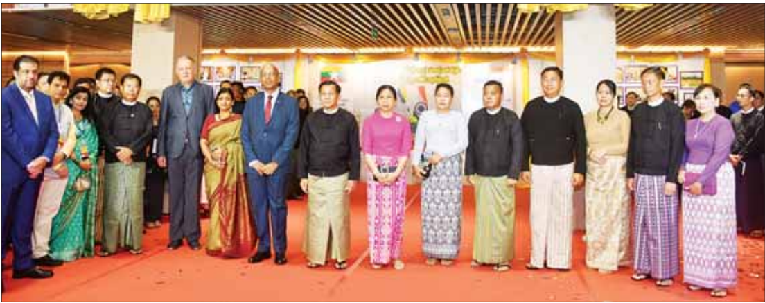
နိုင်ငံတော်စီမံအုပ်ချုပ်ရေးကောင်စီဥက္ကဋ္ဌ နိုင်ငံတော်ဝန်ကြီးချုပ် ဗိုလ်ချုပ်မှူးကြီး မင်းအောင်လှိုင်နှင့် ဇနီး ဒေါ်ကြူကြူလှ၊ မြန်မာနိုင်ငံဆိုင်ရာ အိန္ဒိယနိုင်ငံ သံအမတ်ကြီး H.E. Mr. Vinay Kumar နှင့် ဇနီးနှင့် အခမ်းအနားတက်ရောက်လာကြသူများ စုပေါင်းမှတ်တမ်းတင် ဓာတ်ပုံရိုက်စဉ်။

နေပြည်တော် မေ ၁၄ မြန်မာ-အိန္ဒိယ အပြည်ပြည်ဆိုင်ရာ စီးပွားရေးလုပ်ငန်းရှင်များ အသင်းချုပ်နှင့် မြန်မာ-အိန္ဒိယ ချစ်ကြည်ရေးနှင့် ဖွံ့ဖြိုးတိုးတက်ရေးအသင်းတို့က ကြီးပွားကျင်းပသည့် မြန်မာ-အိန္ဒိယ နှစ်နိုင်ငံချစ်ကြည်ရေးနှင့် သံတမန်ဆက်ဆံခြင်း (၇၅)နှစ်ပြည့် အထိမ်းအမှတ် အခမ်းအနားကို ယနေ့ညနေပိုင်းတွင် ရန်ကုန်တိုင်းဒေသကြီးရှိ အမျိုးသားကဇာတ်ရုံ၌ ကျင်းပပြုလုပ်ရာ နိုင်ငံတော်စီမံအုပ်ချုပ်ရေးကောင်စီဥက္ကဋ္ဌ နိုင်ငံတော်ဝန်ကြီးချုပ် ဗိုလ်ချုပ်မှူးကြီး မင်းအောင်လှိုင် တက်ရောက်ချီးမြှင့်သည်။