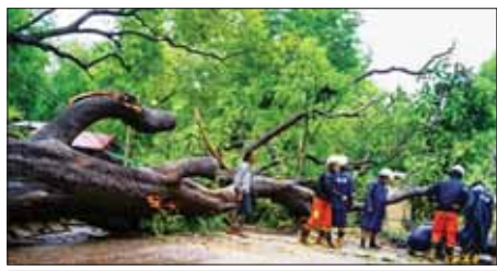
မကွေးတိုင်းဒေသကြီး မင်းဘူးမြို့နယ်၌ သစ်ပင်များ ပြိုလဲမှုကို ရှင်းလင်းဆောင်ရွက်စဉ်။

လဲကျခြင်းကြောင့် လမ်းများ ပိတ်ဆို့မှုဖြစ်ပွားခြင်း၊ ရခိုင် ပြည်နယ် ကျောက်ဖြူမြို့ ရှိ ကျောက်ဖြူ ပညာရေးကောလိပ် သင်ဆောင် အမိုးပျက်စီးခြင်း၊ ဧရာဝတီတိုင်းဒေသကြီး ပန်းတနော်မြို့နယ်တွင် သစ်ပင်နှင့် ဓာတ်တိုင်များ ပြိုလဲခြင်း၊ ဝါးခယ်မမြို့နယ်တွင် လူနေအိမ်နှင့် သစ်ပင်များ ပြိုလဲပျက်စီးခြင်း၊ ဘိုကလေးမြို့နယ် ဟိုင်းကြီးကျွန်း မြို့နယ်၊ ကျောင်းကုန်းမြို့နှင့် ကန်ကြီးထောင်မြို့တို့တွင် လူနေအိမ်နှင့် သစ်ပင်များ ပြိုလဲပျက်စီး၍ လမ်းများပိတ်ဆို့မှုများ ဖြစ်ပေါ်ခဲ့သည်။