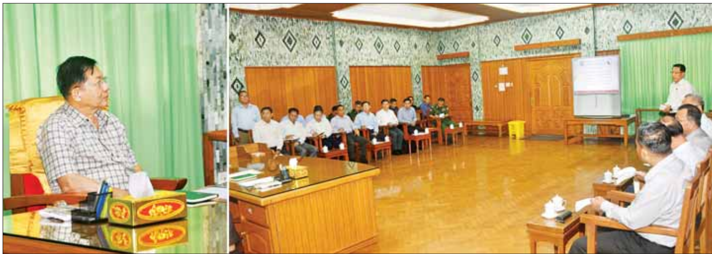
နိုင်ငံတော်စီမံအုပ်ချုပ်ရေးကောင်စီဥက္ကဋ္ဌ နိုင်ငံတော်ဝန်ကြီးချုပ် ဗိုလ်ချုပ်မှူးကြီး မင်းအောင်လှိုင် ဦးဆောင်၍ သဘာဝဘေးအန္တရာယ်ဆိုင်ရာ စီမံခန့်ခွဲရေးအတွက် အရေးပေါ်အစည်းအဝေး ကျင်းပပြုလုပ်စဉ်။