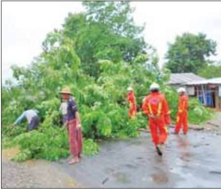
ရခိုင်ပြည်နယ် အမ်းမြို့နယ်၌ မေ ၁၄ ရက်က သစ်ပင်များ ပြုလဲ နေမှုကို ခရိုင်သဘာဝဘေးအန္တရာယ်ဆိုင်ရာစီမံခန့်ခွဲရေး ကော်မတီက ဦးဆောင်မှုဖြင့် ရပ်ကွက်အုပ်ချုပ်ရေးမှူးနှင့်အဖွဲ့များက ခုတ်ထွင် ရှင်းလင်းစဉ်။ မြို့နယ် (ပြန်/ဆက်)