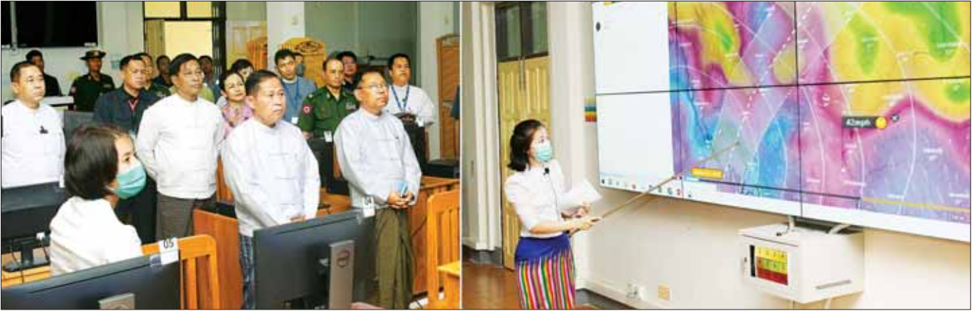
နိုင်ငံတော်စီမံအုပ်ချုပ်ရေးကောင်စီ ဒုတိယဥက္ကဋ္ဌ ဒုတိယဝန်ကြီးချုပ် ဒုတိယဗိုလ်ချုပ်မှူးကြီး စိုးဝင်းနှင့် အဖွဲ့ဝင်များအား အရေးပေါ်အခြေအနေ စီမံခန့်ခွဲမှုဗဟိုဌာန၌ ဌာနမှူး ဒေါ်သီရိမောင် က အလွန်အလွန် အားကောင်းသော ဆိုင်ကလုန်းမုန့်တိုင်း (မိုခါ) ၏ လက်ရှိဖြစ်ပေါ်လျက်ရှိသည့် အခြေအနေများကို ရှင်းလင်းတင်ပြခဲ့ပါ။