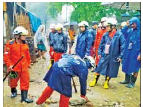
ကော်မတီဥက္ကဋ္ဌနှင့် ဌာနဆိုင်ရာ တာဝန်ရှိသူများက မိုးရွာသွန်းမှု လိုက်လံကြည့်ရှု စစ်ဆေးခဲ့ကြ ကြောင်း မုန်းချောင်းရေတိုးလာမှု အပေါ် မုန်းချောင်းကမ်းပါးပြုကျမှု လျှင်တင်လေး(ပွင့်ဖြူမြေ)

တကျ စီမံဆောင်ရွက်ထားရှိ ရေး၊ သဘာဝဘေးအန္တရာယ်နှင့် ပတ်သက်ပြီး ထူးခြားမှု တစ်စုံ တစ်ရာဖြစ်ပေါ်လာပါက သက်ဆိုင် ရာဌာနများနှင့် ချိတ်ဆက်၍ အရေးပေါ် ကူညီကယ်ဆယ်ရေး လုပ်ငန်းများကို ရယူဆောင်ရွက် ရေး၊ ဘေးလွတ်ရာသို့ ကြိုတင် ပြောင်းရွှေ့နေရာချထားပေးမည့် လုပ်ငန်းစဉ်များကို အသိပညာပေး ရှင်းလင်းဆွေးနွေး ပြောကြားခဲ့ သည့်။ ထို့နောက် မြို့နယ်သာဘာ ဝဘေးအန္တရာယ် စီမံခန့်ခွဲမှု