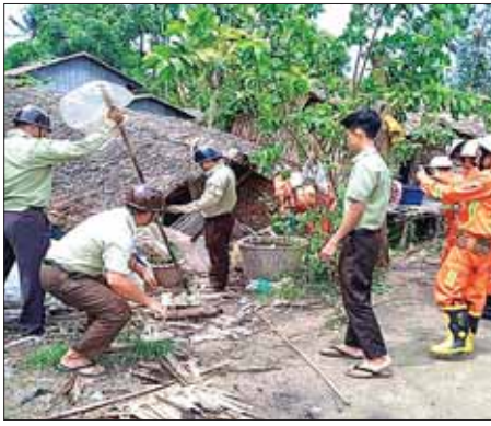
ဧရာဝတီတိုင်းဒေသကြီး ဝါးခယ်မြို့နယ်၌ မေ ၁၄ ရက်က နေအိမ် များ ပြုလဲပျက်စီးမှုကို ဌာနဆိုင်ရာတာဝန်ရှိသူများ စုပေါင်း၍ ရှင်းလင်းဖယ်ရှားပေးစဉ်။ သတင်းစဉ်