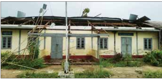
ဧရာဝတီတိုင်းဒေသကြီး အိမ်မဲမြို့နယ်၌ စာသင်ကျောင်း အဖိုးလန်ပျက်စီးမှု။ ဌေးဌေးလှိုင်(ပြန်/ဆက်)