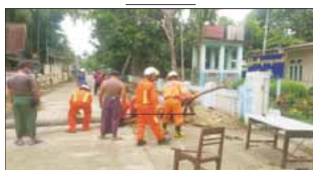
ဧရာဝတီတိုင်းဒေသကြီး ပန်းတနော်မြို့နယ်၌ လျှပ်စစ်ဓာတ်တိုင် ပြိုလဲမှုကို ရှင်းလင်းဆောင်ရွက်စဉ်။