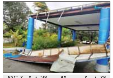
ရခိုင်ပြည်နယ် သံတွဲမြို့ လေဆိပ်အဆောက်အအုံမှန်ခွဲပျက်စီးမှု။