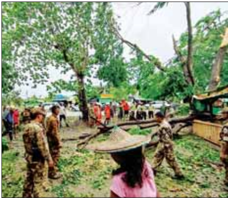
ရခိုင်ပြည်နယ် တောင်ကုတ်မြို့နယ် မေ ၁၄ ရက်က လမ်းများပေါ်တွင် လဲကျနေသည့် သစ်ပင်ကြီးများ၊ သစ်ကိုင်းသစ်ခက်များကို တပ်မတော်သားများနှင့် ဌာနဆိုင်ရာတာဝန်ရှိသူများ စုပေါင်း၍ ရှင်းလင်းဖယ်ရှားပေးစဉ်။ သတင်းစဉ်