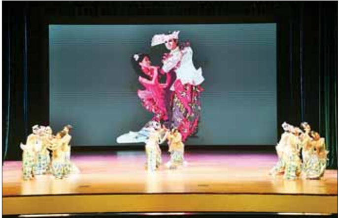
နှစ်နိုင်ငံယဉ်ကျေးမှုအဖွဲ့များ၏ နှစ်နိုင်ငံယဉ်ကျေးမှုအကူပဒေသာများ၊ တေးသီချင်းများဖြင့် ကပြဖော်ပြေစဉ်။