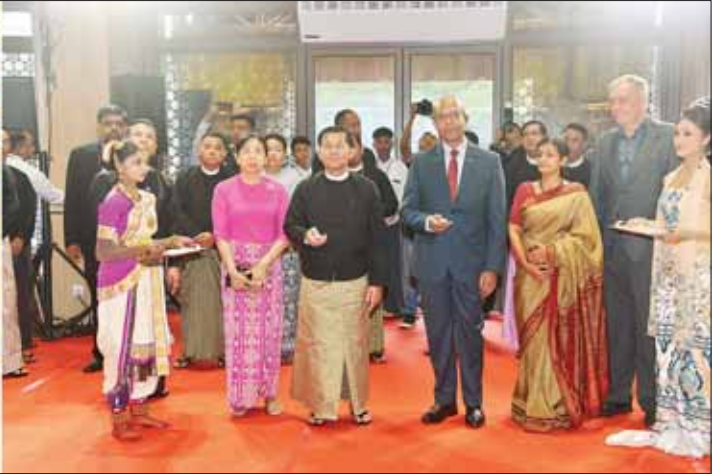
နိုင်ငံတော်စီမံအုပ်ချုပ်ရေးကောင်စီဥက္ကဋ္ဌ နိုင်ငံတော်ဝန်ကြီးချုပ် ဗိုလ်ချုပ်မှူးကြီး မင်းအောင်လှိုင်နှင့် မြန်မာနိုင်ငံဆိုင်ရာ အိန္ဒိယနိုင်ငံ သံအမတ်ကြီး H.E. Mr. Vinay Kumar တို့ မြန်မာ-အိန္ဒိယ နှစ်နိုင်ငံ ချစ်ကြည်ရေးနှင့် သံတမန်ဆက်ဆံခြင်း (၇၅)နှစ်ပြည့် စိန်ရတုအထိမ်းအမှတ်အခမ်းအနားကို စက်ခလုတ်နှိပ်ဖွင့်လှစ်ပေးစဉ်။