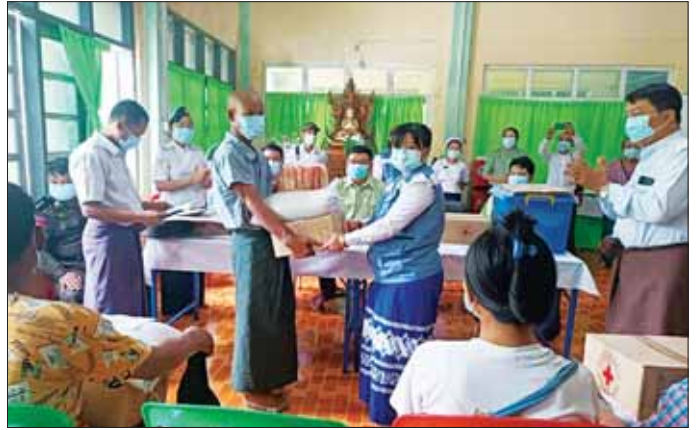
ဧရာဝတီတိုင်းဒေသကြီး အိမ်မဲမြို့နယ်အတွင်း မေ ၁၃ ရက်က လေပြင်းတိုက်ခတ်မှုကြောင့် နေအိမ်ပျက်စီးခဲ့သော အိမ်ထောင်စု ငါးစုအား ကယ်ဆယ်ရေးပစ္စည်းများ ထောက်ပံ့ပေးအပ်ခြင်းကို မေ ၁၄ ရက်က ရွာသစ်ကျေးရွာတိုက်နယ်ဆေးရုံ၌ ပြုလုပ်ရာ အဆိုပါ နေအိမ်ပျက်စီးသွားသော မိသားစုဝင်များအား ခရိုင်သာဘာဝဘေးကြီးကြပ်မှုကော်မတီဥက္ကဋ္ဌ မြို့နယ်သာဘာဝဘေးကြီးကြပ်မှုကော်မတီဥက္ကဋ္ဌနှင့် အဖွဲ့ဝင်များ၊ ခရိုင်ဘေးအန္တရာယ်ဆိုင်ရာ စီမံခန့်ခွဲမှုဦးစီးဌာနတို့မှ ကယ်ဆယ်ရေးပစ္စည်းများကို လက်ဝယ်အရောက် ထောက်ပံ့ပေးအပ်စဉ်။