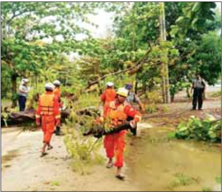
ရခိုင်ပြည်နယ် ဝှံမြို့နယ် မေ ၁၄ ရက်က လေပြင်းတိုက်ခတ်မှုကြောင့် ကျိုးကျနေသည့် သစ်ပင်ကြီးများ၊ သစ်ကိုင်းသစ်ခက်များအား မြို့နယ် မီးသတ်တပ်ဖွဲ့ဝင်များနှင့် မြို့နယ်ရဲတပ်ဖွဲ့ဝင်များက ရှင်းလင်းဖယ်ရှား ပေးစဉ်။ ရွှေရည်ဝင်းကျော်