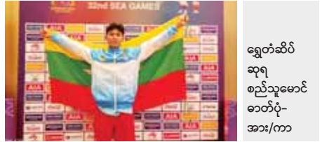
ရွှေတံဆိပ်ဆုရ စည်သူမောင်ဓာတ်ပုံ-အား/ကာ

ဗိုလ်လုပွဲစဉ်ကို အကောင်းဆုံး ပြိုင်ဆင်သွားပါမည်။ ဆီးဂိမ်းဗိုလ်မှာ ထိုင်းအသင်းကို အနိုင်ရအောင် ကြိုးစားခဲ့တဲ့ ကစားသမားတွေရဲ့ စွမ်းဆောင်ရည်က တကယ်ကို အံ့မခန်းပါ။ ဒီအသင်းကို ကိုင်တွယ်ကတည်းက အမြဲတမ်း ထောက်ပံ့ပေးနေတဲ့ နည်းပြ၊ အုပ်ချုပ်မှုအဖွဲ့အားလုံးရဲ့ ပံ့ပိုးမှုကလည်း အရေးပါခဲ့ပါတယ်။ ဒီကစားသမားတွေက သူတို့လုပ်ချင်တာ ဘာဆိုင်ရအောင်လုပ်နိုင်တဲ့ ကစားသမားတွေဆိုတာ ဒီနေ့တွေ့ခဲ့ရပါပြီ။ ဟု မြန်မာအသင်း နည်းပြချုပ် ယုက်က ပြောကြားခဲ့သည်။ ညီမြတ်သော်တာ