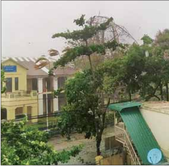
ရခိုင်ပြည်နယ် စစ်တွေမြို့နယ်၌ ဆက်သွယ်ရေးတဝါတိုင် ပြိုလဲပျက်စီးမှု။