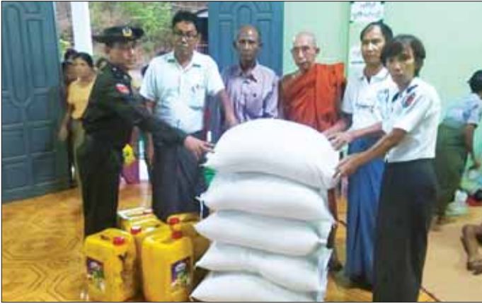
ရခိုင်ပြည်နယ် မြောက်ဦးမြို့နယ် ခရိုင်သာဘာဝဘေးအန္တရာယ်ဆိုင်ရာစီမံခန့်ခွဲမှုအဖွဲ့ ဦးဆောင်မှုဖြင့် ဌာနဆိုင်ရာတာဝန်ရှိသူများအဖွဲ့သည် မေ ၁၃ ရက်က မုန်တိုင်းရောင်ပြည်သူများရှိရာ ယာယီခိုလှုံရာ စခန်းများသို့ သွားရောက်၍ ထောက်ပံ့ပစ္စည်းများ ပေးအပ်စဉ်။