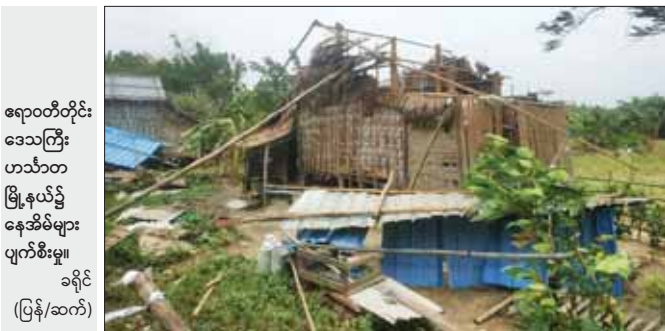
ဧရာဝတီတိုင်း ဒေသကြီး ဟင်္သာတ မြို့နယ်၌ နေအိမ်များ ပျက်စီးမှု။ ခရိုင် (ပြန်/ဆက်)