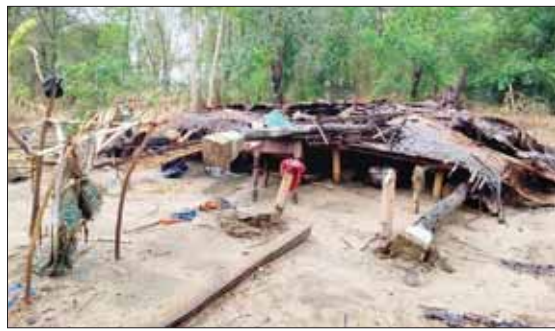
ဧရာဝတီတိုင်း ဒေသကြီး မြန်အောင် မြို့နယ်၌ နေအိမ်များ ပျက်စီးမှု။ ဝင်းဗိုလ်