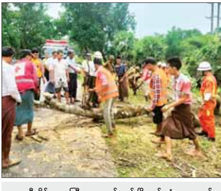
ဧရာဝတီတိုင်းဒေသကြီး ကျောင်းကုန်းမြို့နယ် ကံကလေးအုပ်စု ရန်ကုန်- ပုသိမ်ကားလမ်းမကြီး မိုင်တိုင်အမှတ် ၇၃/မှ ၇၃/၂ ကြား လမ်းမကြီးပေါ်သို့ မလေးရှားပိတောက်ပင် လဲကျနေမှုအား မေ ၁၄ ရက်က မြို့နယ်သဘာဝဘေးကယ်ဆယ်ရေးအဖွဲ့များက ခုတ်ထွင် ရှင်းလင်းဖယ်ရှားစဉ်။ ဝင်းကြိုင် (ပြန်/ဆက်)