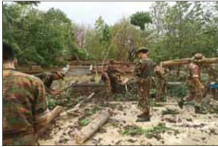
ရခိုင်ပြည်နယ် သံတွဲမြို့နယ်၌ သစ်ပင်များ ပြိုလဲမှုကို တပ်မတော်သား များ ရှင်းလင်းဆောင်ရွက်စဉ်။