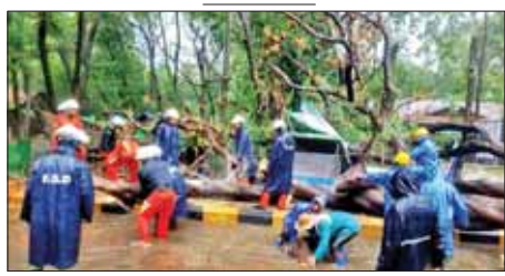
မကွေးတိုင်းဒေသကြီး ဖွင့်ဖြူမြို့နယ်၌ သစ်ပင်များ ပြိုလဲမှုကို ရှင်းလင်းဆောင်ရွက်စဉ်။