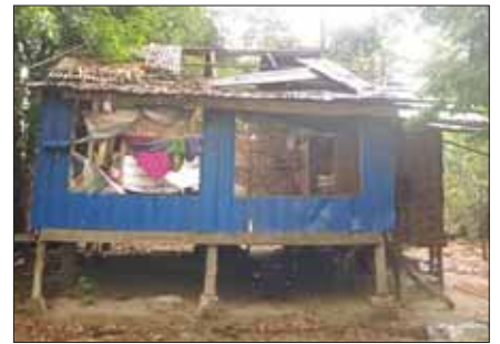
ပဲခူးတိုင်းဒေသကြီး သာယာဝတီမြို့နယ်၌ နေအိမ်များ ပျက်စီးမှု။ သန့်ဇော် (ပြန်/ဆက်)