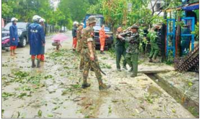
ရခိုင်ပြည်နယ် ကျောက်ဖြူမြို့နယ်၌ တပ်မတော်သားများနှင့် ဌာနဆိုင်ရာများ ပူးပေါင်းမှုဖြင့် သစ်ပင် သစ်ကိုင်းများ ခုတ်ထွင်ရှင်းလင်းစဉ်။