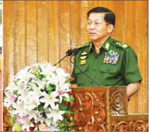
နိုင်ငံတော်စီမံအုပ်ချုပ်ရေးကောင်စီဥက္ကဋ္ဌ တပ်မတော်ကာကွယ်ရေးဦးစီးချုပ် ဗိုလ်ချုပ်မှူးကြီး မင်းအောင်လှိုင် ကြိုက်ဒေသတိုင်းစစ်ဌာနချုပ် ကျိုင်းတုံတပ်နယ်မှ အရာရှိ၊ စစ်သည်၊ မိသားစုများနှင့် တွေ့ဆုံပွဲတွင် အမှာစကားပြောကြားစဉ်။