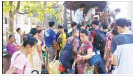
ရခိုင်ပြည်နယ် ကျောက်ဖြူမြို့၌ မေ ၁၁ ရက်က မုန့်တိုင်းဘေးလွတ်ရာ ယာယီခိုလှုံရာ စခန်းများသို့ ရွှေ့ပြောင်းရန် တာဝန်ရှိသူများကြီးကြပ်မှုဖြင့် ဆောင်ရွက်စဉ်။