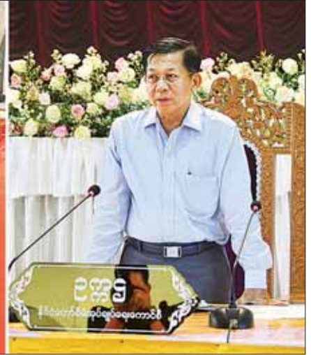
နိုင်ငံတော်စီမံအုပ်ချုပ်ရေးကောင်စီဥက္ကဋ္ဌ နိုင်ငံတော်ဝန်ကြီးချုပ် ဗိုလ်ချုပ်မှူးကြီး မင်းအောင်လှိုင် ရှမ်းပြည်နယ်(အရှေ့ပိုင်း) ကျိုင်းတုံမြို့ရှိ ပြည်နယ်၊ ခရိုင်၊ မြို့နယ်အဆင့် ဌာနဆိုင်ရာတာဝန်ရှိသူများ၊ မြို့၊ မြို့ဖများ၊ အသေးစား၊ အငယ်စားနှင့် အလတ်စား စီးပွားရေး(MSME) လုပ်ငန်းရှင်များအား တွေ့ဆုံအမှာစကားပြောကြားစဉ်။