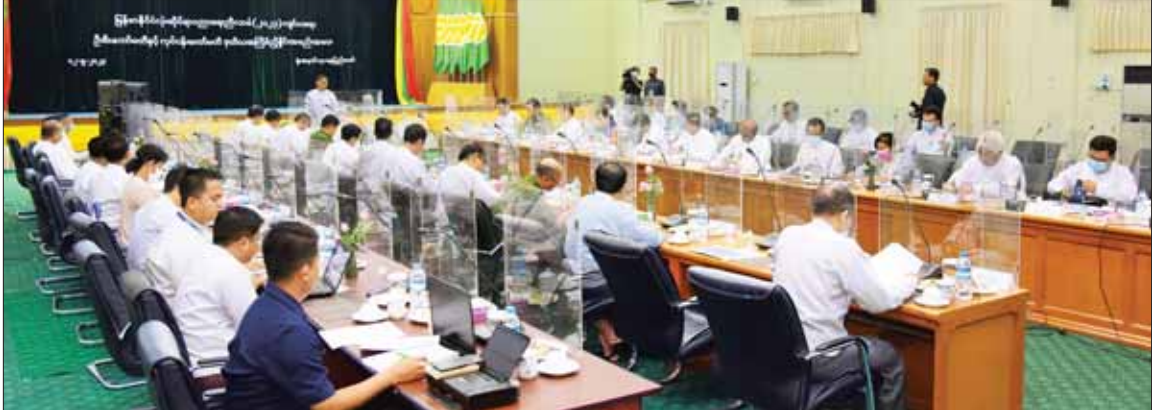
နိုင်ငံတော်စီမံအုပ်ချုပ်ရေးကောင်စီ ဒုတိယဥက္ကဋ္ဌ ဒုတိယဝန်ကြီးချုပ် ဒုတိယဗိုလ်ချုပ်မှူးကြီး စိုးဝင်း မြန်မာနိုင်ငံလုံးဆိုင်ရာပညာရေးညီလာခံ(၂၀၂၃)ကျင်းပရေးဦးစီးကော်မတီနှင့် လုပ်ငန်းကော်မတီ ဒုတိယအကြိမ် ညှိနှိုင်းအစည်းအဝေးတွင် အမှာစကားပြောကြားစဉ်။

နေပြည်တော် မေ ၁၂ မြန်မာနိုင်ငံလုံးဆိုင်ရာ ပညာရေး ညီလာခံ (၂၀၂၃) ကျင်းပရေး ဦးစီး ကော်မတီနှင့် လုပ်ငန်းကော်မတီ ဒုတိယအကြိမ် ညှိနှိုင်းအစည်း အဝေးကို ယနေ့မနန်းလွဲ ၂ နာရီ တွင် နေပြည်တော်ရှိ ပညာရေး ဝန်ကြီးဌာန အစည်းအဝေးခန်းမ၌ ကျင်းပရာ မြန်မာနိုင်ငံလုံးဆိုင်ရာ ပညာရေးညီလာခံ(၂၀၂၃) ကျင်းပ ရေးဦးစီးကော်မတီဥက္ကဋ္ဌ နိုင်ငံ တော်စီမံအုပ်ချုပ်ရေး ကောင်စီ ဒုတိယဥက္ကဋ္ဌ ဒုတိယဝန်ကြီးချုပ် ဒုတိယဗိုလ်ချုပ်မှူးကြီး စိုးဝင်း တက်ရောက် အမှာစကား ပြောကြားသည်။ စာမျက်နှာ ၈ ကော်လံ ၁ ❖