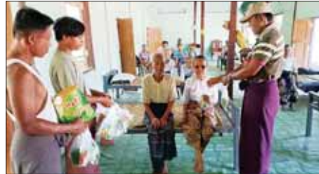
ရခိုင်ပြည်နယ် မာန်အောင်မြို့နယ်၌ မုန့်တိုင်းဘေးကျရောက်နိုင်သည့် သက်ကြီးဘွားများအား ခိုလှုံရာစခန်းသို့ မေ ၁၁ ရက်က ရွှေ့ပြောင်းပေးထားစဉ်။