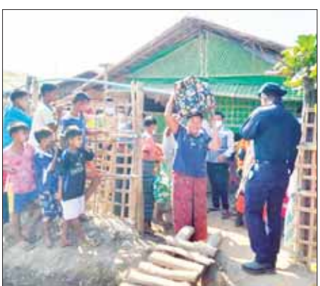
မြို့နယ်(ပြန်/ဆက်)

ရခိုင်ပြည်နယ် ရသေ့တောင် မြို့နယ်၌ မြို့နယ်သဘာဝ ဘေးအန္တရာယ်ဆိုင်ရာ စီမံ ခန့်ခွဲမှုအဖွဲ့၏ ဦးဆောင် ကြီးကြပ်မှုဖြင့် မေ ၁၂ရက်က ရသေ့တောင် မြို့နယ်အတွင်း မြေနိမ့်ပိုင်းတွင် ကျရောက် နေသော နေအိမ်များ ကို ဘေးလွတ်ရာ ကုန်းမြင့်ပိုင်း ကျေးရွာများသို့ ကျေးရွာ အုပ်ချုပ်ရေးမှူးများ၊ လူမှုရေး အသင်းအဖွဲ့များက ကြိုတင် ရွှေ့ပြောင်းပေးစဉ်။