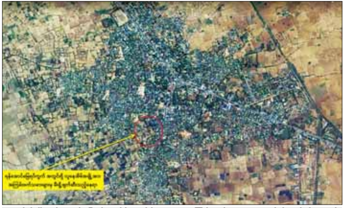
ချောင်းဦးမြို့ ရန်အောင်မြေရပ်ကွက်ရှိ နေအိမ်များအား အကြမ်းဖက်သမားများက မီးရှို့ဖျက်ဆီးခဲ့သည့် နေရာပြပုံ။

ဖြင့် အကြမ်းဖက်သမားများက ရန်အောင်မြေရပ်ကွက်အတွင်းရှိ လူနေအိမ်အချို့အား မီးရှို့ဖျက်ဆီးခဲ့ကြောင်း သိရသည်။ မီးလောင်ရာနေရာသို့ မြန်မာနိုင်ငံရဲတပ်ဖွဲ့ဝင်များနှင့် မီးသတ်တပ်ဖွဲ့ဝင်များက မီးသတ်ယာဉ်သုံးစီး၊ ရေသယ်ယာဉ် လေးစီးတို့ဖြင့် ပိုင်းဝန်း ငြိမ်းသတ်ခဲ့သဖြင့် နံနက် ၄ နာရီ ၁၅ မိနစ်ခန့်တွင် မီးငြိမ်းသွားခဲ့ပြီး မီးလောင်မှုကြောင့် နေအိမ် အလုံး ၂၀ မီးလောင်ပျက်စီးခဲ့သည်။