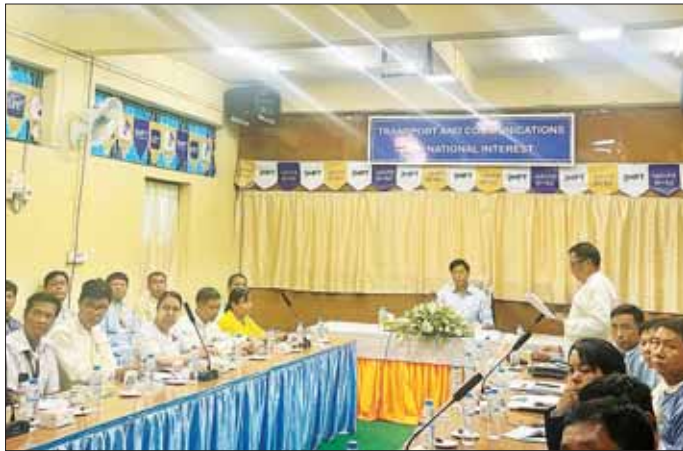
နိုင်ငံ့ဝန်ထမ်းသစ္စာအမိဋ္ဌာန် (၆)ချက် အပါအဝင် ဝန်ထမ်းကျင့်ဝတ်များကို လိုက်နာရန်၊ စိတ်ဓာတ်၊ စည်းကမ်းကောင်းမွန်၍ ဌာနအကျိုးကို သယ်ပိုးနိုင်သူ များဖြစ်လာစေရေး ကြိုးပမ်းအားထုတ်ကြရန်လို

နေပြည်တော် မေ ၁၂ နိုင်ငံတော်စီမံအုပ်ချုပ်ရေးကောင်စီဝင် ဒုတိယဝန်ကြီးချုပ်နှင့် ပို့ဆောင်ရေးနှင့် ဆက်သွယ်ရေး ဝန်ကြီးဌာန ပြည်ထောင်စုဝန်ကြီး ဗိုလ်ချုပ်ကြီး တင်အောင်စန်းသည် ယမန်နေ့မွန်းလွဲပိုင်းက မြန်မာ့ဆက်သွယ်ရေးလုပ်ငန်း ပြည်နယ်မန်နေဂျာရုံးသို့ သွားရောက်၍ ဝန်ကြီးဌာနလက်အောက် ဌာနများဖြစ်သော ပို့ဆောင်ရေးစီမံကိန်းဦးစီးဌာန၊ ကုန်းလမ်းပို့ဆောင်ရေး ညွှန်ကြားမှုဦးစီးဌာန၊ လေကြောင်းပို့ဆောင်ရေး ညွှန်ကြားမှုဦးစီးဌာန၊ မိုးလေဝသနှင့်ဇလဗေဒ ညွှန်ကြားမှုဦးစီးဌာန၊ ကုန်းလမ်းပို့ဆောင်ရေး၊ မြန်မာ့အမျိုးသား လေကြောင်း၊ မြန်မာ့ဆက်သွယ်ရေးလုပ်ငန်းနှင့် မြန်မာ့စာတိုက်တို့မှ ဝန်ထမ်းများနှင့် တွေ့ဆုံသည်။ (ယာပုံ)