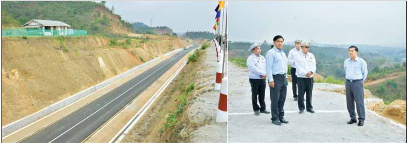
နိုင်ငံတော်စီမံအုပ်ချုပ်ရေးကောင်စီဥက္ကဋ္ဌ နိုင်ငံတော်ဝန်ကြီးချုပ် ဗိုလ်ချုပ်မှူးကြီး မင်းအောင်လှိုင် ကျိုင်းတုံမြို့ရှောင်လမ်း ဖောက်လုပ်ထားရှိမှုအခြေအနေများ ကြည့်ရှုစစ်ဆေးစဉ်။

စာမျက်နှာ ၄ မှ ခရီးသွားများ လာရောက်သည့်အချိန်တွင် အသင့်ဖြစ်စေရေးအတွက် ဒေသသာယာလှပရေးနှင့် တည်းခိုမည့်နေရာများ ကောင်းမွန်စေရေး ဒေသခံများအနေဖြင့် ပြင်ဆင်ဆောင်ရွက်ထားကြစေလိုကြောင်း။