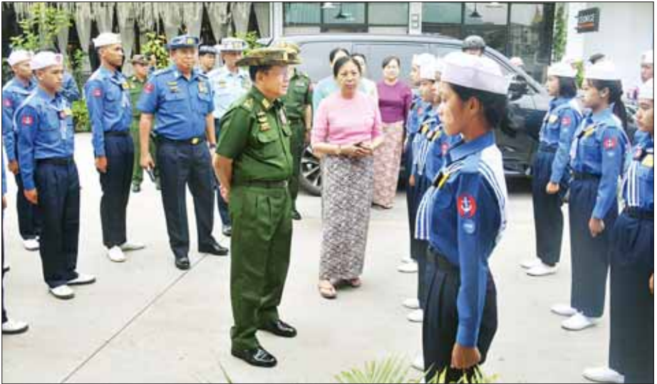
နိုင်ငံတော်စီမံအုပ်ချုပ်ရေးကောင်စီဥက္ကဋ္ဌ တပ်မတော်ကာကွယ်ရေးဦးစီးချုပ် ဗိုလ်ချုပ်မှူးကြီး ဖင်းအောင်လှိုင် တပ်မတော်(ရေ) ရေကြောင်း လူငယ်အခြေခံသင်တန်း ကျင်းပတုံစခန်းမှ သင်တန်းသား သင်တန်းသူများအား ရင်းရင်းနှီးနှီး နှုတ်ဆက်စဉ်။

သင်ကြားပေးလျက်ရှိကြောင်း၊ ထူးချွန်သူများအနေဖြင့် သက်ဆိုင်ရာ ဘာသာရပ်များအလိုက် သိပ္ပံများ၊ ကောလိပ်များနှင့် တက္ကသိုလ်များသို့ ဆက်လက် တက်ရောက်ပြီး ၎င်းတို့အသက်မွေးဝမ်းကျောင်းအတွက် လုပ်ငန်းများကို ဆောင်ရွက်နိုင်ညီဖြစ်ကြောင်း၊ တပ်မတော်သားမိသားစု ဝင်များ ၎င်းကျောင်းများသို့ တက်ရောက်နိုင်ရေး အားပေးဆောင်ရွက်ရန် လိုကြောင်း။