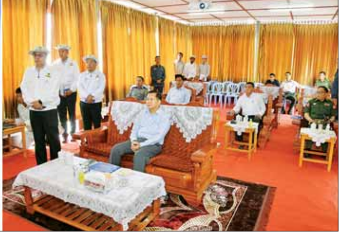
နိုင်ငံတော်စီမံအုပ်ချုပ်ရေးကောင်စီဥက္ကဋ္ဌ နိုင်ငံတော်ဝန်ကြီးချုပ် ဗိုလ်ချုပ်မှူးကြီး မင်းအောင်လှိုင် အား ကျင်းပတဲ့မြို့ရှောင်လမ်း ဖောက်လုပ်ထားရှိမှုအခြေအနေများနှင့် ပတ်သက်ပြီး လမ်းဦးစီးဌာန ညွှန်ကြားရေးမှူး ဦးရဲလင်းက ရှင်းလင်းတင်ပြမည်။