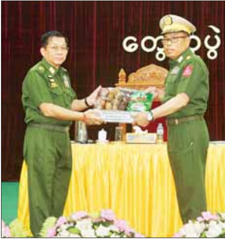
နိုင်ငံတော်စီမံအုပ်ချုပ်ရေးကောင်စီဥက္ကဋ္ဌ တပ်မတော်ကာကွယ်ရေးဦးစီးချုပ် ဗိုလ်ချုပ်မှူးကြီး မင်းအောင်လှိုင် ကျိုင်းတုံတပ်နယ်မှ အရာရှိ၊ စစ်သည်၊ မိသားစုများအတွက် စားသောက်ဖွယ်ရာပစ္စည်းများ ပေးအပ်စဉ်။

ထိုသို့ တွေ့ဆုံအမှာစကား ပြောကြားရာတွင် ကြိုက်ဒေသတိုင်း စစ်ဌာနချုပ်ကျိုင်းတုံတပ်နယ်ရှိ အရာရှိ၊ စစ်သည်၊ မိသားစုများအားလုံးကို ယခုကဲ့သို့ တွေ့ဆုံရသည့်အတွက် ဝမ်းမြောက်မိပါကြောင်း၊ နိုင်ငံတော်တွင်ဖြစ်ပေါ်ခဲ့သည့် အခြေအနေများအရ တပ်မတော်အနေဖြင့် နိုင်ငံတော်၏ တာဝန်များကို ထမ်းဆောင်ခဲ့ရပြီး ယင်းကာလသည် ကိုဗစ်-၁၉ ရောဂါဖြစ်ပွားမှုများ ပြင်းထန်ချိန်၊ စီးပွားရေးကျဆင်းနေချိန်ဖြစ်ကြောင်း၊ အလားတူ နိုင်ငံရေးအရ မတည်ငြိမ်မှုများ ဖြစ်ပေါ်