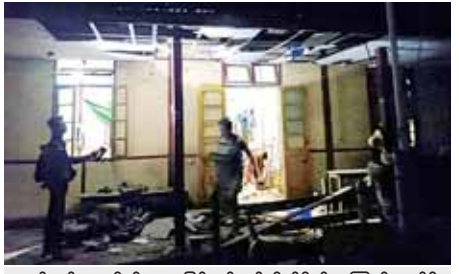
လက်လုပ်ရှော့တိုက်ခံများဖြင့် ပစ်ခတ်တိုက်ခိုက်မှုကြောင့် ဖျက်စီးသွားသည့် အဆောက်အအုံတစ်လုံးကို တွေ့ရစဉ်။