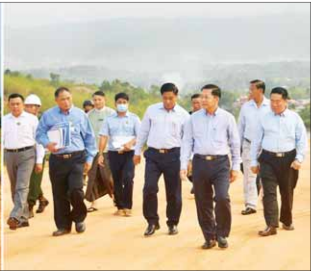
နိုင်ငံတော်စီမံအုပ်ချုပ်ရေးကောင်စီဥက္ကဋ္ဌ နိုင်ငံတော်ဝန်ကြီးချုပ် ဗိုလ်ချုပ်မှူးကြီး မင်းအောင်လှိုင်နှင့် အဖွဲ့ဝင်များ ရှမ်းပြည်နယ် (အရှေ့ပိုင်း) ကျိုင်းတုံလေယာဉ်ကွင်း၊ လေယာဉ်ပြေးလမ်း အဆင့်မြှင့်တင်နိုင်ရေး လုပ်ငန်းဆောင်ရွက်နေမှုအခြေအနေများကို ကြည့်ရှုစစ်ဆေးစဉ်။