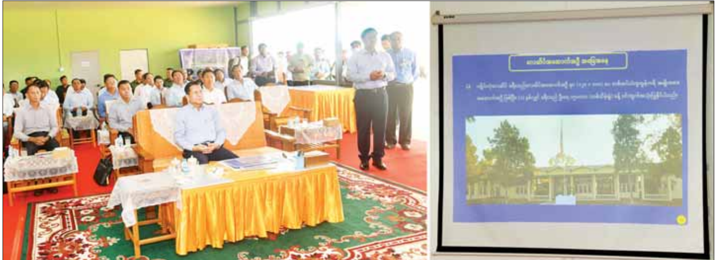
နိုင်ငံတော်စီမံအုပ်ချုပ်ရေးကောင်စီဥက္ကဋ္ဌ နိုင်ငံတော်ဝန်ကြီးချုပ် ဗိုလ်ချုပ်မှူးကြီး မင်းအောင်လှိုင်နှင့် အဖွဲ့ဝင်များအား ဒုတိယဝန်ကြီးချုပ်နှင့် ပို့ဆောင်ရေးနှင့်ဆက်သွယ်ရေးဝန်ကြီးဌာန ပြည်ထောင်စုဝန်ကြီး ဗိုလ်ချုပ်ကြီး တင်အောင်စန်း ရှင်းလင်းတင်ပြစဉ်။