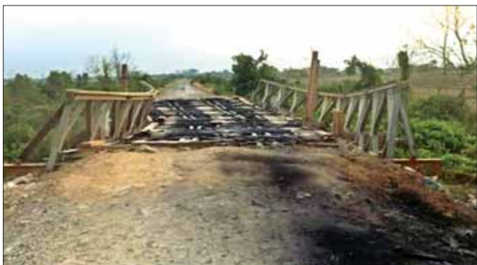
အကြမ်းဖက်သမားများ မီးရှို့ဖျက်ဆီးခဲ့သည့် ကျောက်ကြီး- နတ်သံကွင်းကားလမ်းရှိ သံပေါင်သစ်သားခင်း တံတားအား တွေ့ရစဉ်။

ခြင်း၊ မီးရှို့ဖျက်ဆီးခြင်း စသည့် အဖျက်အမှောင် လုပ်ရပ်များကို ဆင်ခြင်တုံတရား နည်းပါးစွာဖြင့် ကျူးလွန်ပြုလုပ်လျက်ရှိသည်။ ထိုသို့အဖျက်အမှောင် လုပ်ရပ် များ ပြုလုပ်လျက်ရှိရာ မေ ၁၀ ရက် နံနက် ၇ နာရီတွင် ဝဲခူးတိုင်း ဒေသကြီး ကျောက်ကြီးမြို့နယ် နောင်ကုန်းကျေးရွာအနီးကျောက် ကြီး- နတ်သံကွင်း ကားလမ်း မိုင်တိုင်အမှတ် ၁၁ မိုင် ၁ ဖာလုံရှိ သံပေါင်သစ်သားခင်း၊ တံတား အမှတ် (၁/၁၂)၊ စစ်ပင်တံတားအား အကြမ်းဖက်မှုကို လိုလားသည့် သောင်းကျန်းသူအဖွဲ့နှင့် PDF အမည်ခံ အကြမ်းဖက်သမားများ