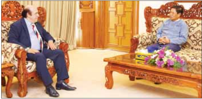
အနေများ၊ တည်ငြိမ်အေးချမ်းရေးနှင့် တရားဥပဒေစိုးမိုးရေးအတွက် ဆောင်ရွက်နေမှု၊ မီဒီယာကဏ္ဍ ဖွံ့ဖြိုးတိုးတက်မှုများကို ရင်းရင်းနှီးနှီး အမြင်ချင်း ရေးနှင့် နိုင်ငံတကာမီဒီယာ ဖလှယ်ခဲ့ကြသည်။ များနှင့် စပ်လျဉ်းသည့်ကိစ္စရပ် သတင်းစဉ်

နေပြည်တော် မေ ၁၁ နိုင်ငံခြားရေးဝန်ကြီးဌာန ပြည်ထောင်စုဝန်ကြီး ဦးသန်းဆွေသည် ဂျပန်နိုင်ငံ တိုကျိုမြို့ရှိ ဂျပန်နိုင်ငံခြား သတင်းထောက်များအသင်း (Foreign Correspondent Club of Japan-FCCJ) ၏ ဥက္ကဋ္ဌဟောင်း Mr. KHALDON AZHARI နှင့် ယနေ့ နံနက်ပိုင်းတွင် နေပြည်တော်ရှိ နိုင်ငံခြားရေးဝန်ကြီးဌာန ပြည်ထောင်စုဝန်ကြီး၏ ဧည့်ခန်းမ၌ လက်ခံတွေ့ဆုံသည်။ (ယာပုံ) ထိုသို့တွေ့ဆုံစဉ် မြန်မာနိုင်ငံ၏ ဖြစ်ပေါ်တိုးတက်မှုအခြေအနေများ၊ တည်ငြိမ်အေးချမ်းရေးနှင့် တရားဥပဒေစိုးမိုးရေးအတွက် ဆောင်ရွက်နေမှု၊ မီဒီယာကဏ္ဍ ဖွံ့ဖြိုးတိုးတက်မှုများကို ရင်းရင်းနှီးနှီး အမြင်ချင်း ရေးနှင့် နိုင်ငံတကာမီဒီယာ ဖလှယ်ခဲ့ကြသည်။ များနှင့် စပ်လျဉ်းသည့်ကိစ္စရပ် သတင်းစဉ်