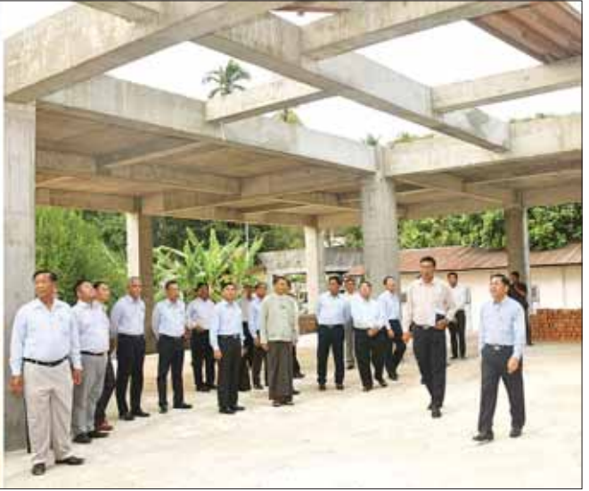
နိုင်ငံတော်စီမံအုပ်ချုပ်ရေးကောင်စီဥက္ကဋ္ဌ နိုင်ငံတော်ဝန်ကြီးချုပ် ဗိုလ်ချုပ်မှူးကြီး မင်းအောင်လှိုင်နှင့် အဖွဲ့ဝင်များ ကျိုင်းတုံဟော်နန်းပုံစံတူ တည်ဆောက်ရေးလုပ်ငန်း ဆောင်ရွက်ပြီးစီးမှုအခြေအနေများကို ကြည့်ရှုစစ်ဆေးစဉ်။