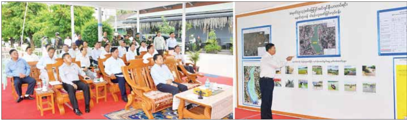
နိုင်ငံတော်စီမံအုပ်ချုပ်ရေးကောင်စီဥက္ကဋ္ဌ နိုင်ငံတော်ဝန်ကြီးချုပ် ဗိုလ်ချုပ်မှူးကြီး မင်းအောင်လှိုင်နှင့် အဖွဲ့ဝင်များအား နောင်တုံ့ကန်ပြုပြင်ထိန်းသိမ်းထားရှိမှုအခြေအနေများကို တာဝန်ရှိသူတစ်ဦးက ရှင်းလင်း တင်ပြစဉ်။

စာမျက်နှာ ၃ မှ ဆောင်ရွက်မှုအခြေအနေများ၊ ထို့ကြောင့် သဘာဝ ပတ်ဝန်းကျင်ထိခိုက်မှု အနည်းဆုံးဖြစ်အောင် ဆောင်ရွက်နိုင်မှုအခြေအနေများ၊ ရေအောက်မြေမျက်နှာ သွင်ပြင်တိုင်းတာခြင်းနှင့် ပုံထုတ်ခြင်းလုပ်ငန်း ဆောင်ရွက်လျက်ရှိမှုနှင့် ကန်ရေသန့်ရှင်းမှုစရိတ် ခေတ်မီစက်ကိရိယာ၊ ယန္တရားများကို အသုံးပြု ဆောင်ရွက်လျက်ရှိသည့် အခြေအနေများကို တင်ပြ သည်။ တင်ပြမှုများအပေါ် နိုင်ငံတော်စီမံအုပ်ချုပ်ရေး ကောင်စီဥက္ကဋ္ဌ နိုင်ငံတော်ဝန်ကြီးချုပ်က လိုအပ် သည့်များ လမ်းညွှန်မှာကြားခဲ့ပြီး ကန်ပတ်လမ်း တစ်လျှောက် လိုက်လံကြည့်ရှုစစ်ဆေးခဲ့ကြောင်း သတင်းစဉ်