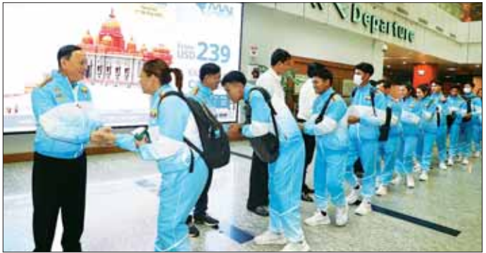
နှစ်ဦး၊ အမျိုး သမီးအားကစားသမား နှစ်ဦး၊ ဗိုလ်ချုပ် အားကစားသမား ခြောက်ဦးတို့ လိုက်ပါသွားကြောင်း (အားနှစ်) အားကစားနည်းမှ အုပ်ချုပ်/နည်းပြ ငါးဦး၊ သိရသည်။ အမျိုးသား အားကစားသမား ရှစ်ဦး၊ အမျိုးသမီး သတင်းစဉ်

အဆိုပါ အားကစားအဖွဲ့များတွင် ဖိတ်ကြားခံပုဂ္ဂိုလ် တစ်ဦး၊ အုပ်ချုပ်မှုအဖွဲ့ တစ်ဦး၊ မြန်မာနိုင်ငံ လေ့လှော်အဖွဲ့ချုပ် ဥက္ကဋ္ဌနှင့် အုပ်ချုပ်မှုအဖွဲ့ နှစ်ဦး၊ ဂျူဒိုအားကစားနည်းမှ အုပ်ချုပ်/ နည်းပြ ငါးဦး၊ အမျိုးသားအားကစားသမား ခြောက်ဦး၊ အမျိုးသမီးအားကစားသမား ခုနစ်ဦး၊ အလေးမအားကစားနည်းမှ အုပ်ချုပ်/နည်းပြ နှစ်ဦး၊ အမျိုးသား အားကစားသမား