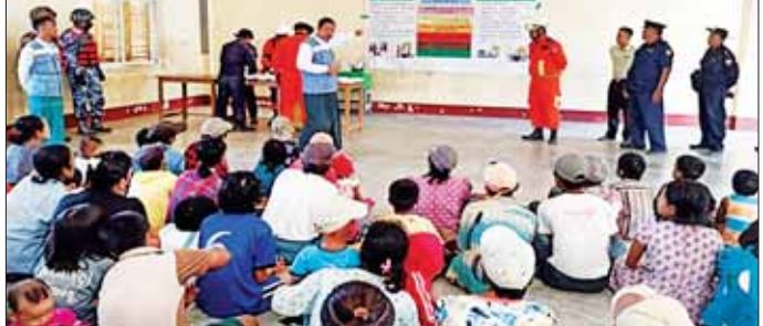
ရောဂါတိုင်းဒေသကြီး လစဉ်ပေးပို့ပေးနိုင်ရေးအတွက် မီးသတ်တပ်ဖွဲ့ဝင်များ သဘာဝဘေးအန္တရာယ်ဆိုင်ရာ အသိပေးနှိုးဆော်ခြင်းနှင့် အသိပညာပေးဆောင်ရွက်စဉ်။

များ၊ ရိက္ခာများ အသင့်စုဖွဲ့ထားရှိ ခြင်းများကို အရှိန်အဟုန်ဖြင့် ဆောင်ရွက်လျက်ရှိသည်။ ထိုသို့ ဆောင်ရွက်လျက်ရှိရာ ယနေ့တွင် ကချင်ပြည်နယ်၊ မိုးကောင်းမြို့နယ်၊ မိုးညှင်းမြို့ နယ်၊ ပုလောမြို့နယ်၊ တနင်္သာရီ တိုင်းဒေသကြီး ကော့သောင်းမြို့ နယ်၊ ပုလောမြို့နယ်၊ ပဲခူးတိုင်း ဒေသကြီး ကဝမြို့နယ်၊ သာယာဝတီ ပြည်နယ်၊ မကွေးတိုင်းဒေသကြီး ရေနံချောင်းမြို့နယ်၊ မန္တလေးတိုင်း ဒေသကြီး အောင်မြေသာစံမြို့ နယ်၊ မွန်ပြည်နယ် မုဒုံမြို့နယ်၊ ရခိုင်ပြည်နယ် ပေါက်တောမြို့ နယ်၊ ရသေ့တောင်မြို့နယ်၊ ပုဏ္ဏား ကျွန်းမြို့နယ်၊ ရန်ကုန်တိုင်းဒေသ ကြီး ဒဂုံမြို့သစ် (မြောက်ပိုင်း)