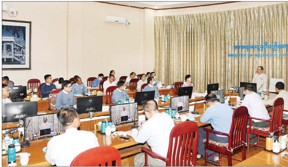
လုံးဆိုင်ရာ ပညာရေးညီလာခံ (၂၀၂၃) တွင် သာသနာရေးနှင့် ယဉ်ကျေးမှုဝန်ကြီးဌာနက ဖျော်ဖြေရေးလုပ်ငန်းများ၊ စာတမ်းဖတ်ပွဲများ၊ ပြခန်းခင်းကျင်းပြသရေးလုပ်ငန်းများကို တာဝန်ယူဆောင်ရွက်ရမည်

သာသနာရေးနှင့် ယဉ်ကျေးမှုဝန်ကြီးဌာနက မြန်မာနိုင်ငံလုံးဆိုင်ရာ ပညာရေးညီလာခံ (၂၀၂၃) တွင် တာဝန်ယူဆောင်ရွက်မည့်လုပ်ငန်းများနှင့် စပ်လျဉ်း၍ ညှိနှိုင်းအစည်းအဝေးကို ယနေ့ မွန်းလွဲ ၂ နာရီတွင် ရုံးအမှတ် (၃၅) သာသနာရေးနှင့် ယဉ်ကျေးမှုဝန်ကြီးဌာန လောကနတ်အစည်းအဝေးခန်းမ၌ ကျင်းပသည်။ (ယာပုံ)