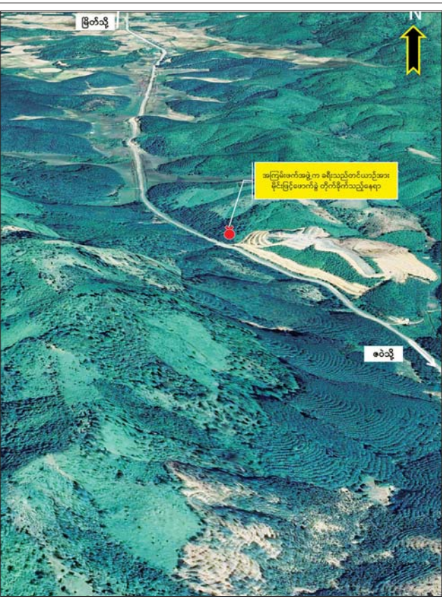
မြိတ်မြို့မှ မောတောင်သို့ ထွက်ခွာလာသည့် ခရီးသည်တင်မော်တော် ယာဉ်အား PDF အမည်ခံအကြမ်းဖက်သမားများက လက်လုပ်မိုင်းဖြင့် ဖောက်ခွဲတိုက်ခိုက်ခဲ့သည့်နေရာပြပုံ။