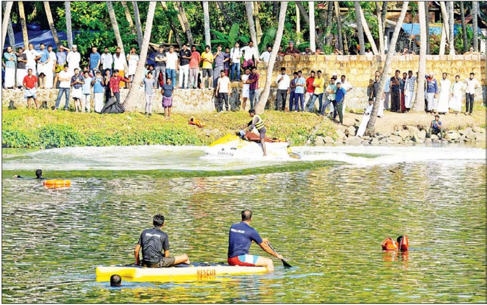
လှေတိမ်းမှောက်မှုဖြစ်ပွားပြီးနောက် ကယ်ဆယ်ရေးလုပ်သားများ ရှာဖွေကယ်ဆယ်ရေး ဆောင်ရွက်နေမှုကို မေ ၈ ရက်က တွေ့ရစဉ်။

နယူးဒေလီ မေ ၈ အိန္ဒိယနိုင်ငံ တောင်ပိုင်း ကီရာလာပြည်နယ်၌ မေ ၇ ရက်က လှေတစ်စင်း တိမ်းမှောက်မှုကြောင့် လူ ၂၁ ဦးထက် မနည်း သေဆုံးမှုဖြစ်ပွားကြောင်း ဒေသအာဏာပိုင်များက မေ ၈ ရက်တွင် ပြောသည်။