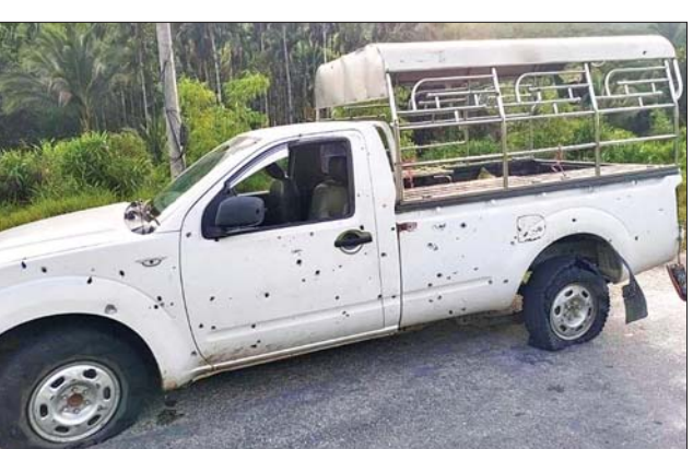
တိုက်ခိုက်ခဲ့သည့် အကြမ်းဖက် သမားများကို ဖမ်းဆီးအရေးယူ နိုင်ရေးနှင့် နယ်မြေဒေသတည်ငြိမ် အေးချမ်းရေးအတွက် လုံခြုံရေး တပ်ဖွဲ့ဝင်များက လိုအပ်သည့် လုံခြုံရေးလုပ်ငန်းများ ဆက်လက် ဆောင်ရွက်လျက်ရှိသည်။ အထက်ပါဖြစ်စဉ်မှ ဆေးရုံ တက်ရောက်ကုသမှု ခံယူလျက် ရှိသည့် လူနာများအား ယနေ့ မွန်းလွဲပိုင်းတွင် ကမ်းရိုးတန်း ဒေသ တိုင်းစစ်ဌာနချုပ် တိုင်းမှူး ဗိုလ်ချုပ် စောသန်းလှိုင်နှင့် တာဝန် ရှိသူများက သွားရောက်ကြည့်ရှု အားပေးပြီး စားသောက်ဖွယ်ရာ များနှင့် ထောက်ပံ့ငွေများ ပေးအပ် ခဲ့ကြောင်း သတင်းရရှိသည်။ သတင်းစဉ်

လသာကျေးရွာအကြား မိုင်တိုင် အမှတ် ၃၃/၃ နေရာသို့ရောက်ရှိစဉ် CRPHI NUG အဖွဲ့၏ လက်ဝေခံ PDF အမည်ခံအကြမ်းဖက်သမား များက လက်လုပ်မိုင်းဖြင့် ဖောက်ခွဲ တိုက်ခိုက်ခဲ့မှုကြောင့် အပြစ်မဲ့ခရီးသွားပြည်သူ အမျိုးသား တစ်ဦးသေဆုံးပြီး ခြောက်ဦး ထိခိုက်ဒဏ်ရာများ ရရှိခဲ့ကြောင်း နှင့် အဆိုပါဒဏ်ရာရပြည်သူများ ကို လုံခြုံရေးတပ်ဖွဲ့ဝင်များက မြိတ်မြို့ရှိ တပ်မတော်ဆေးရုံသို့ ပို့ဆောင်၍ လိုအပ်သည့်ဆေးဝါး ကုသမှုများ ဆောင်ရွက်ပေးလျက် ရှိကြောင်း သိရှိရသည်။ ထိုသို့ အပြစ်မဲ့အရပ်သား ပြည်သူများ စီးနင်းလိုက်ပါလာ သည့် ခရီးသွားမော်တော်ယာဉ် အား ဆင်ခြင်တုံတရားမဲ့စွာ မိုင်းခွဲ