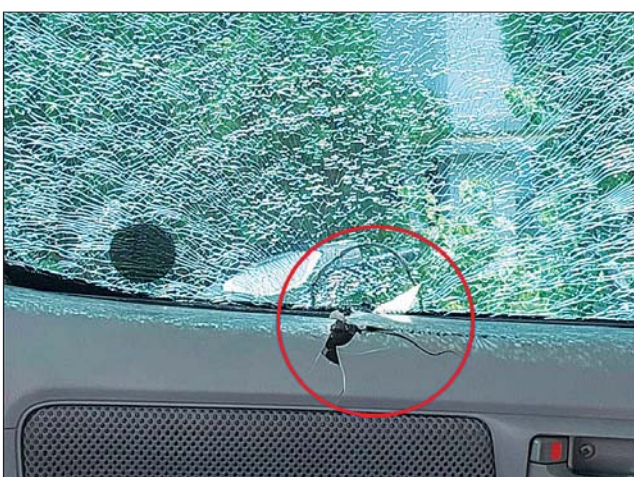
ရီသည်။ ဖြစ်စဉ်တွင် လူထိခိုက်ဒဏ်ရာ ရရှိမှုမရှိကြောင်းနှင့် လုံခြုံရေးလိုက်ပါလာသည့် မော်တော်ယာဉ်တစ်စီး၌ လက်နက်ငယ်ကျည်အချို့ထိမှန်ခဲ့ကြောင်း သိရှိရသည်။ နိုင်ငံတော်အနေဖြင့် အာဆီယံတူညီဆန္ဒ(၅)ရပ်အနက် စတုတ္ထ

ဖြစ်စဉ်မှာ အာဆီယံတူညီဆန္ဒ(၅)ရပ်အနက် စတုတ္ထမြောက် အချက်ဖြစ်သည့် လူသားချင်းစာနာမှုအကူအညီများ ပံ့ပိုးရေးအတွက် AHA Centre မှ ကိုယ်စားလှယ်များ၊ မြန်မာနိုင်ငံဆိုင်ရာ အင်ဒိုနီးရှားနိုင်ငံနှင့် စင်ကာပူနိုင်ငံသံရုံးတို့မှ ကိုယ်စားလှယ်များသည် လုံခြုံရေးတပ်ဖွဲ့ဝင်များ လိုက်ပါလျက် မေ ၇ ရက်နံနက်ပိုင်းတွင် တောင်ကြီးမြို့မှ ဆီဆိုင်မြို့သို့ ထွက်ခွာလာခဲ့ရာ ဆီဆိုင်မြို့နယ်နန့်အောရွာ၏ မြောက်ဘက်မီတာ ၂၀၀ ခန့် အကွာသို့ အရောက်၌ အသင့် စောင့်ဆိုင်းနေသည့် အကြမ်းဖက် သမားများက လက်နက်ငယ်များဖြင့် ပစ်ခတ်တိုက်ခိုက်ခဲ့သဖြင့် လုံခြုံရေးတပ်ဖွဲ့ဝင်များက မြန်လည်ပစ်ခတ်ခဲ့ရာ အကြမ်းဖက်သမားများသည် ဆုတ်ခွာထွက်ပြေးသွားခဲ့ကြောင်း သိရှိရပြီး ဖြစ်စဉ်ဖြစ်ပွားရာ နေရာအနီးတစ်ဝိုက်အား နယ်မြေခံလုံခြုံရေးတပ်ဖွဲ့ဝင်များက လိုအပ်သည့် နယ်မြေစိုးမိုးရေးလုပ်ငန်းများ ဆက်လက်ဆောင်ရွက်လျက်