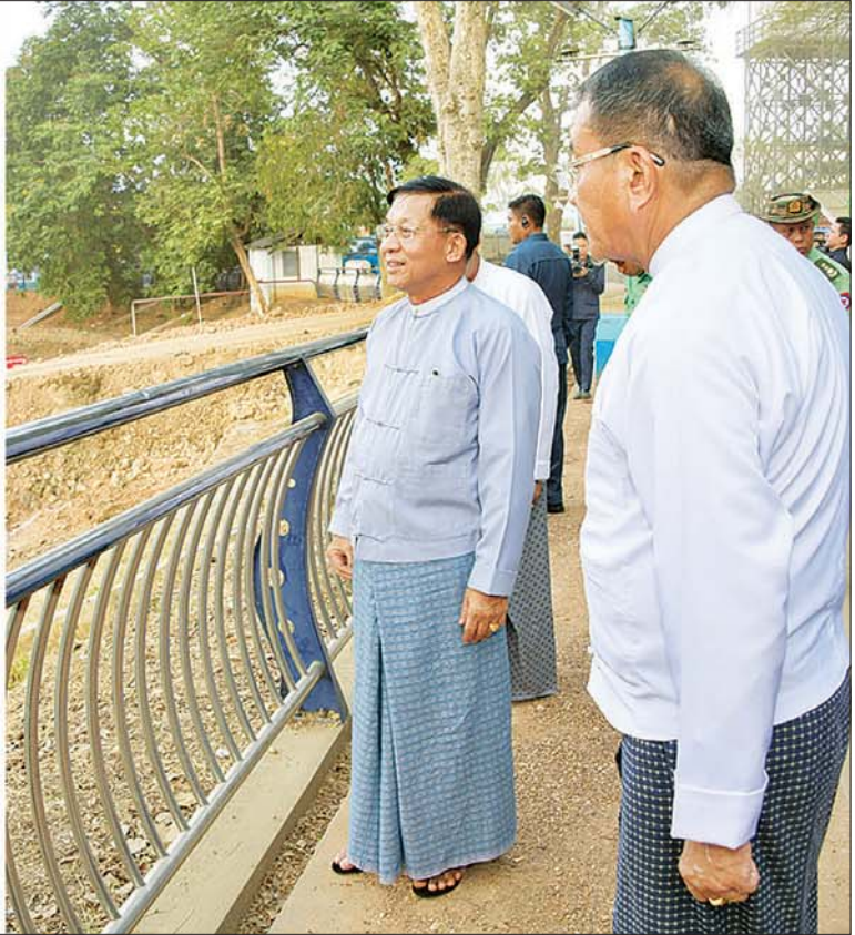
နိုင်ငံတော်စီမံအုပ်ချုပ်ရေးကောင်စီဥက္ကဋ္ဌ နိုင်ငံတော်ဝန်ကြီးချုပ် ဗိုလ်ချုပ်မှူးကြီး မင်းအောင်လှိုင် ပျဉ်းမနားမြို့ ကန်တော်မင်္ဂလာရှမ်းကန်ကို ခေတ်မီစက်ယန္တရားများ အသုံးပြု၍ အဆင့်မြှင့်တင်ဆောင်ရွက်နေမှု အခြေအနေကို ကြည့်ရှုစစ်ဆေးစဉ်။