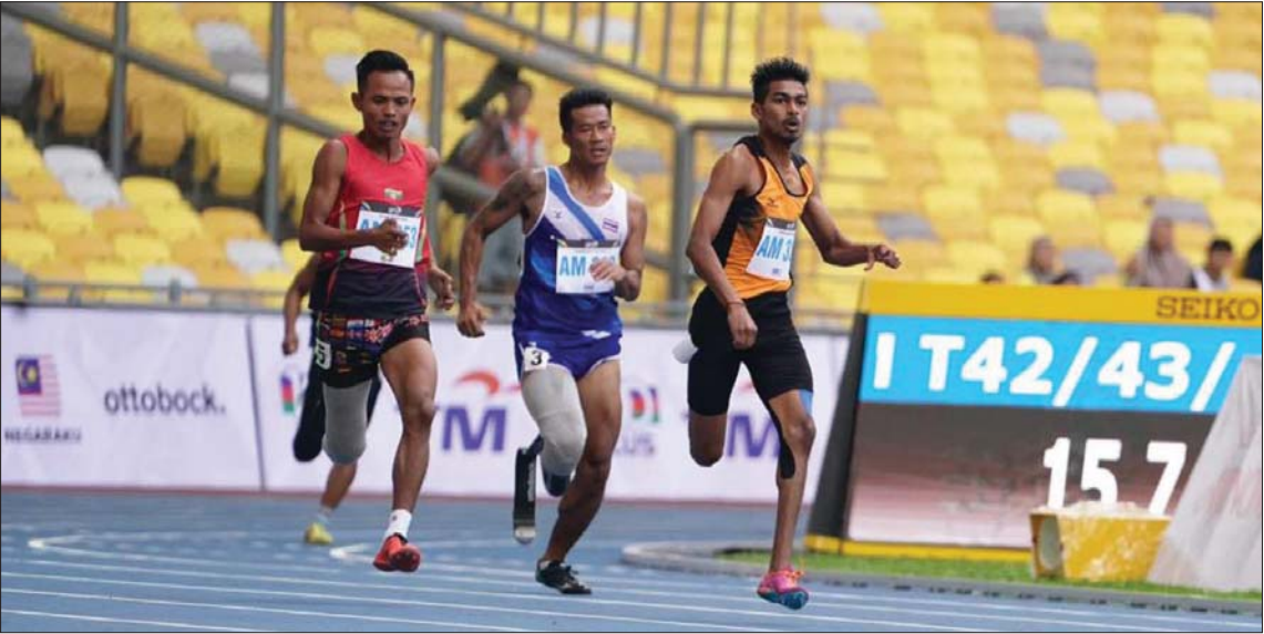
၂၀၂၂ ခုနှစ် (၁၁) ကြိမ်မြောက် အာဆီယံ မသန်စွမ်းအားကစားပြိုင်ပွဲတွင် မသန်စွမ်းအားကစားသမားများ ယှဉ်ပြိုင်နေစဉ်။

ပြေးခုန်ပစ်ကစားနည်း ပြေးခုန်ပစ်ကစားနည်း (Athletics) ပြိုင်ပွဲများတွင် အပြေးနှင့် အခုန်ပွဲစဉ် ယှဉ်ပြိုင်မှုများ၌ Able Person များနှင့် သဘာဝချင်း မကွာခြားသော်လည်း အပစ်ပြိုင်ပွဲများတွင်မူ အသုံးပြုသည့် သံလုံး၊ သံပြားများ၏ အရွယ်အစား၊ အလေးချိန်မှာ အနည်းငယ်ကွာခြားမှု