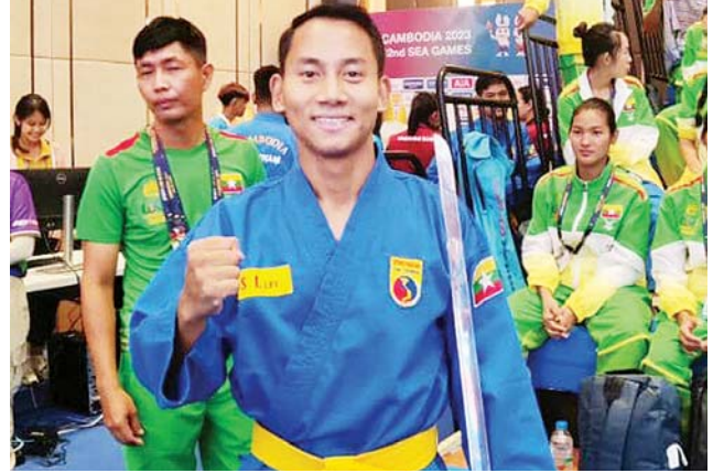
ရွှေတံဆိပ်ဆုရ အိုက်စိုးလင်း

က ဆက်လက်ကျင်းပရာ မြန်မာ ဗိုလ်ချုပ်အဖွဲ့ ရွှေတံဆိပ်၊ ငွေတံဆိပ်၊ ကြေးတံဆိပ် ထပ်မံ ဆွတ်ခူး