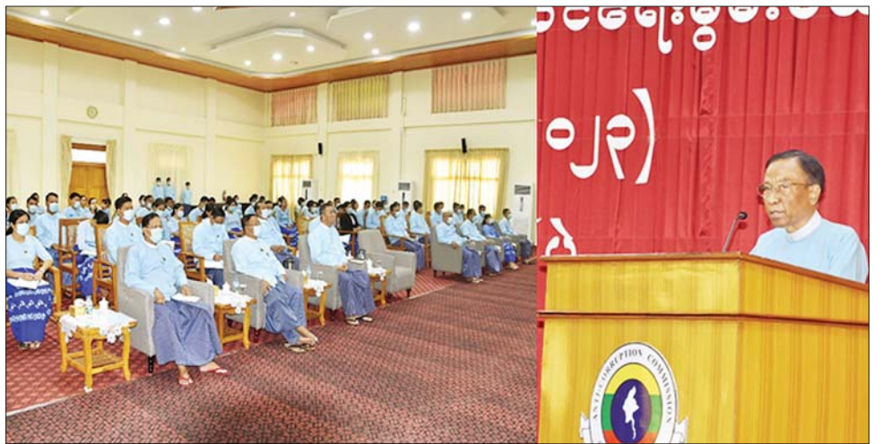
ကောင်း၊ ရန်ကုန်၊ မန္တလေး၊ တောင်ကြီးနှင့် ကောင်း တက်ရောက်ကြပြီး သင်တန်းကာလမှာ မော်လမြိုင်မြို့တို့ရှိ ကော်မရှင်ရုံးခွဲများမှ သင်တန်း မေ ၈ ရက်မှ ဇွန် ၂ ရက်အထိ ရက်သတ္တပတ် လေးပတ် သား သင်တန်းသူ ၁၆ ဦးတို့က Online မှလည်း ကြားမြင်မည်ဖြစ်ကြောင်း သိရသည်။ သတင်းစဉ်

သင်တန်းသို့ ကော်မရှင်ရုံးမှ သင်တန်းသား ၃၄ ဦးက In-House အဖြစ်လည်း