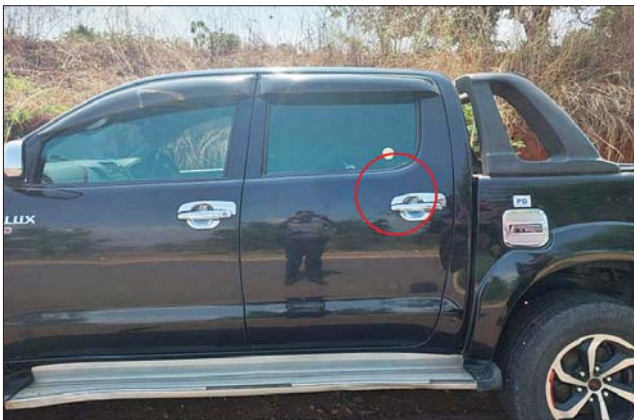
ဆီဆိုင်မြို့နယ် ရေဖြူကျေးရွာရှိ ယာယီတိုက်ပွဲရှောင် အိမ်ထောင်စုဝင်များအတွက် ထောက်ပံ့ရေးပစ္စည်းများ ထောက်ပံ့ရန် သွားရောက်သည့် AHA Centre မှ ကိုယ်စားလှယ်များ၊ မြန်မာနိုင်ငံဆိုင်ရာ အင်ဒိုနီးရှားနိုင်ငံနှင့် စင်ကာပူနိုင်ငံသံရုံးတို့မှ ကိုယ်စားလှယ်များ လိုက်ပါလာသည့် ယာဉ်တန်းအား အကြမ်းဖက်သမားများက ပစ်ခတ်တိုက်ခိုက်မှုကြောင့် မော်တော်ယာဉ်ထိခိုက်ပျက်စီးမှုကို တွေ့ရစဉ်။

နေပြည်တော် မေ ၈ ရှမ်းပြည်နယ်(တောင်ပိုင်း) ဆီဆိုင်မြို့နယ် ရေဖြူကျေးရွာရှိ ယာယီတိုက်ပွဲရှောင် အိမ်ထောင်စုဝင်များအတွက် ထောက်ပံ့ရေးပစ္စည်းများ ပေးအပ်ရန် တောင်ကြီးမြို့မှ ဆီဆိုင်မြို့သို့ သွားရောက်သည့် မော်တော်ယာဉ်တန်းအား အကြမ်းဖက်သမားများက ပစ်ခတ်တိုက်ခိုက်ခဲ့ကြောင်း သိရှိရသည်။ လက်နက်ငယ်များဖြင့်ပစ်ခတ်