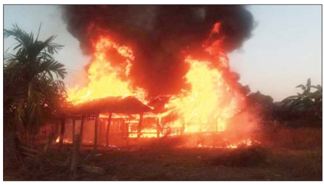
KIA အဖွဲ့မှ အကြမ်းဖက်မှုကို လိုလားသူများနှင့် PDF အမည်ခံ အကြမ်းဖက်သမားများက လက်နက်ကြီးများဖြင့် ပစ်ခတ်မှုကြောင့် သာယာကုန်းကျေးရွာရှိ နေအိမ်များ မီးလောင်မှုကို တွေ့ရစဉ်။