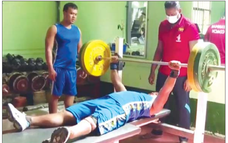
မသန်စွမ်းအလေးမပြိုင်ပွဲအတွက် လေ့ကျင့်နေသော မြန်မာအားကစားသမားတစ်ဦး။

Goal Ball ကစားနည်း Goal Ball ကစားနည်းသည် အမြင်အာရုံချို့တဲ့သူများသာ ယှဉ်ပြိုင်ကစားရပြီး ဂိုးပေါက် နှစ်ဖက်ရှိ ကွင်းတွင် တစ်ဖက် သုံးဦးစီဖြင့် ပစ်ပေါက်စဉ် အသံမြည်သည့် အသံကြားရသည့် ဘောလုံးကို ပစ်ပေါက်ဂိုးသွင်းခြင်း၊ စာမျက်နှာ ၁၇ သို့