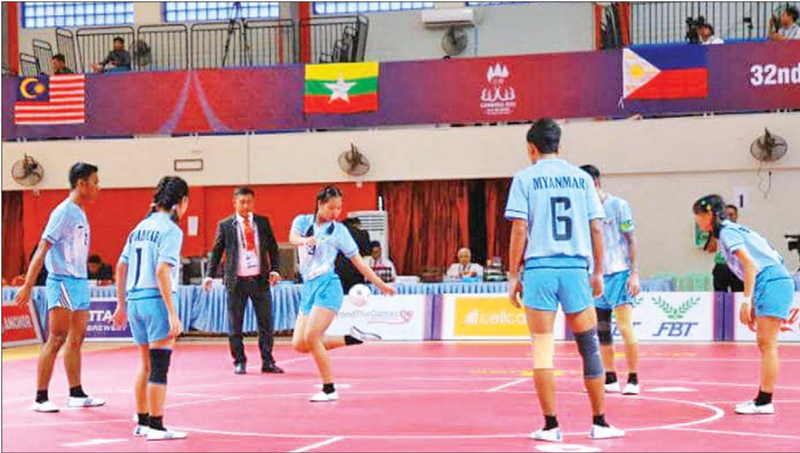
Linking Event-3 အမျိုးသား+အမျိုးသမီးပြိုင်ပွဲတွင် ရွှေတံဆိပ်ဆုရ မြန်မာခြင်းလုံးအသင်း ယှဉ်ပြိုင်နေစဉ်။