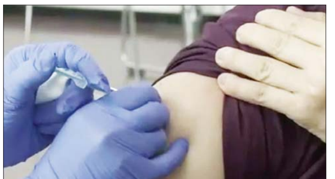
ပေးသွားမည်ဖြစ်ပြီး ဗိုင်းရပ်စ် ဝန်ကြီးဌာနက တိုက်တွန်း အကြံ ကူးစက်ခံရပြီးနောက် နေအိမ်တွင် ပြုထားသည်။

သို့သော်လည်း ကူးစက်သူ အရေအတွက် ဆက်လက်တိုးလာ နိုင်သေးသဖြင့် ယခုဘဏ္ဍာရေးနှစ် တစ်လျှောက်လုံးတွင် ကာကွယ် ဆေးများ အခမဲ့ဆက်လက်ထိုးနှံ