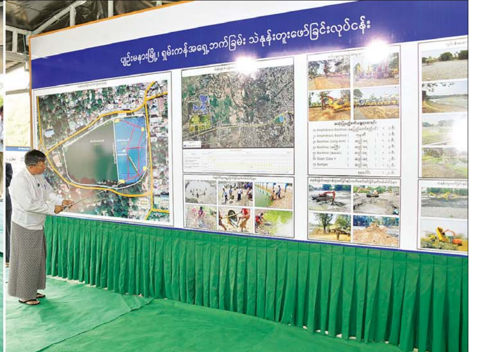
နိုင်ငံတော်စီမံအုပ်ချုပ်ရေးကောင်စီဥက္ကဋ္ဌ နိုင်ငံတော်ဝန်ကြီးချုပ် ဗိုလ်ချုပ်မှူးကြီး မင်းအောင်လှိုင်နှင့် အဖွဲ့ဝင်များအား နေပြည်တော်ကောင်စီဥက္ကဋ္ဌ ဦးတင်ဦးလွင်က ရှင်းလင်းတင်ပြစဉ်။