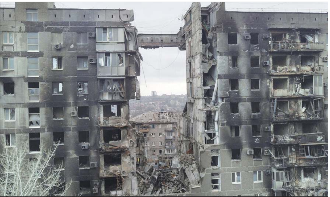
ရုရှား-ယူကရိန်း ပြည်တွင်းစစ်ကြောင့် ပျက်စီးသွားသော အဆောက်အအုံတစ်ခုကို တွေ့ရစဉ်။

မှန်လည်းမှန်ပါတယ်။ ယနေ့ အိမ်ဖြူ တော်ရှိ neocolonialism တွေရဲ့ မဆင် မခြင် ပြုမူမှုတွေကြောင့် အချိန်မရွေး နျူစစ်ပွဲအောက်ရောက်နေတဲ့ ကမ္ဘာကြီး၊ အကျပ်အတည်းမျိုးစုံနဲ့ ဆိုးရွားလာနေ တဲ့ ကမ္ဘာ့ပြည်သူတွေရဲ့ အဖြစ်များဟာ အလွန်ကိုမဖြစ်သင့်တဲ့ အရာများပဲ ဖြစ်ပါတယ်။ ငြိမ်းချမ်းရေးလိုလားသူ ဘယ်နိုင်ငံ၊ ဘယ်ခေါင်းဆောင်မဆို အလေးအနက်ထား စဉ်းစားဆင်ခြင် ရမယ့် အရာများဖြစ်ပါတယ်။ ကမ္ဘာ့ပြည်သူတွေရဲ့ငြိမ်းချမ်းရေးကို အဓိကခြိမ်းခြောက်နေတဲ့ ယူကရိန်း ပဋိပက္ခကို အမြန်ဖြေရှင်းရမယ့်အစား