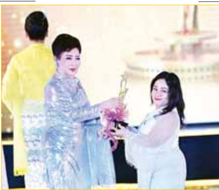
အကောင်းဆုံး ဝတ်စားဆင်ယင်ထုံးပွဲဆု (ရုပ်ရှင်အထူးဆု ၂၀၂၀) “ကမ္မဇလ” ဇာတ်ကားမှ ဒီဇိုင်းဆွဲ ဌေးဌေးတင် ဆုလက်ခံယူစဉ်။