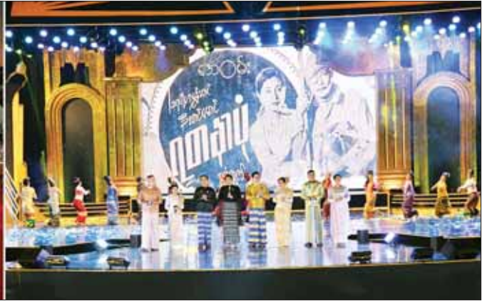
နိုင်ငံတော်စီမံအုပ်ချုပ်ရေးကောင်စီ ဒုတိယဥက္ကဋ္ဌ ဒုတိယဝန်ကြီးချုပ် ဒုတိယဗိုလ်ချုပ်မှူးကြီး စိုးဝင်းနှင့် စန်း ဒေါ်သန်းသန်းနွယ်၊ အခမ်းအနား တက်ရောက်သူများ မြန်မာ့ရုပ်ရှင်ထူးချွန်ဆု ချီးမြှင့်ပွဲအခမ်းအနားတွင် ဖျော်ဖြေမှုကို ကြည့်ရှုအားပေးစဉ်။

စာမျက်နှာ ၅ မှ တိုးတက်မှုသည် အင်အားတစ်ရပ်ဟုဆိုပါက ရုပ်ရှင်ကဏ္ဍဖွံ့ဖြိုးတိုးတက်အောင် ဆောင်ရွက်နေကြသည့် ရုပ်ရှင်ထုတ်လုပ်သူများ၊ အတတ်ပညာရှင်များ၊ သရုပ်ဆောင်များ အားလုံး၏ အခန်းကဏ္ဍသည် မည်မျှအရေးကြီးသည်ကို တွေးဆဆင်ခြင်နိုင်ကြမည်ဖြစ်ပါကြောင်း။