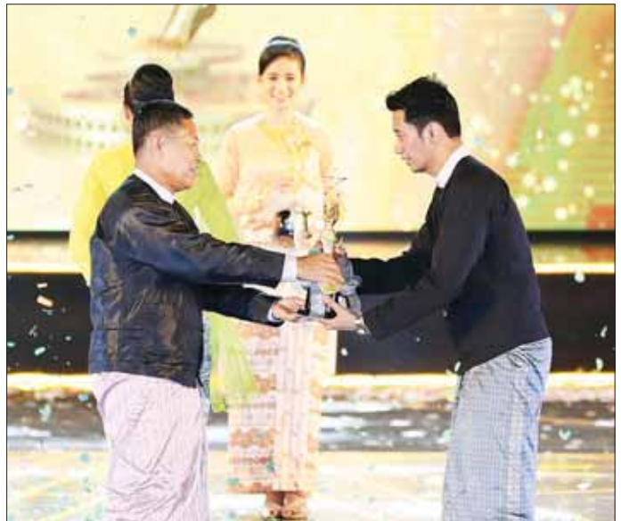
နိုင်ငံတော်စီမံအုပ်ချုပ်ရေးကောင်စီ ဒုတိယဥက္ကဋ္ဌ ဒုတိယဝန်ကြီးချုပ် ဒုတိယဗိုလ်ချုပ်မှူးကြီး စိုးဝင်း (၂၀၁၉) ခုနှစ်အတွက် အကောင်းဆုံး အမျိုးသားဇာတ်ဆောင်ဆုရ ဖြင့်မြတ်အား အကယ်ဒမီရွှေစင်ရုပ်တု ပေးအပ်ချီးမြှင့်စဉ်။