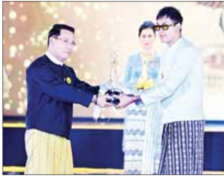
ပြည်ထောင်စုဝန်ကြီး ဦးမောင်မောင်အုန်း (၂၀၁၉) ခုနှစ်အတွက် အကောင်းဆုံး အမျိုးသားဇာတ်ပို့ဆုရ ရွှေထူးအား ဆုချီးမြှင့်စဉ်။