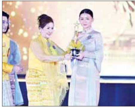
အကယ်ဒမီ ခင်သန်းနု (၂၀၁၉) ခုနှစ်အတွက် အကောင်းဆုံး အမျိုးသမီးဇာတ်ပို့ဆုရ ခင်ဝင့်ပါအား ဆုချီးမြှင့်စဉ်။

စာမျက်နှာ ၆ မှ လုပ်ငန်းများကို စဉ်ဆက်မပြတ်လေ့လာပြီး အနာဂတ်တွင် နိုင်ငံတကာအဆင့်မီ ရုပ်ရှင်အနုပညာရှင်များကို ဖန်တီးနိုင်ကြရန်လည်း တိုက်တွန်းလိုပါကြောင်း၊ ထိုသို့ ဖန်တီးရင်း တစ်ဖက်ကလည်း မိမိတို့၏ အမျိုးသားယဉ်ကျေးမှု စရိုက်လက္ခဏာများကိုလည်း ထိန်းသိမ်းကာကွယ်စောင့်ရှောက်သွားကြရမည် ဖြစ်ပါကြောင်း၊ ထိုသို့ ဖန်တီးရင်း ထိန်းသိမ်းကာကွယ်စောင့်ရှောက်ရင်း ရုပ်ရှင်အနုပညာရှင် အတတ်ပညာရှင်များ ဘဝနှင့် နေထိုင်လူမှုစီးပွားဘဝ ရုန်းကန်ရာတွင်လည်း မိမိတို့ကို ချစ်ခင်လေးစား တန်ဖိုးထားကြသည့် ရုပ်ရှင်ချစ် ပရိသတ်အများစုတို့ အပေါ် တုံ့ပြန်တန်ဖိုးထားလေးစားလျက် ရုပ်ရှင်အနုပညာရှင်တစ်ဦးအပေါ် တွင်သာ အာရုံစိုက်ပြီး ဘဝနှင့် ရင်း၍ မြှုပ်နှံဆောင်ရွက်ခဲ့ရသည့် မိမိချစ်ခင်နှစ်သက် မြတ်နိုးတန်ဖိုးထားသည့် ရုပ်ရှင်အနုပညာလုပ်ငန်းများကို အနှောင့်အယှက်ကင်းကင်းဖြင့် ထာဝရရည်သန် ဆောင်ရွက်နိုင်ကြပါစေဟုလည်း ဆန္ဒပြုအပ်ပါကြောင်း။