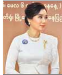
အကယ်ဒမီ နိုင်သင်းကြည်