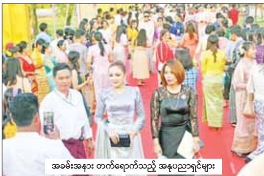
အခမ်းအနား တက်ရောက်သည့် အနုပညာရှင်များ