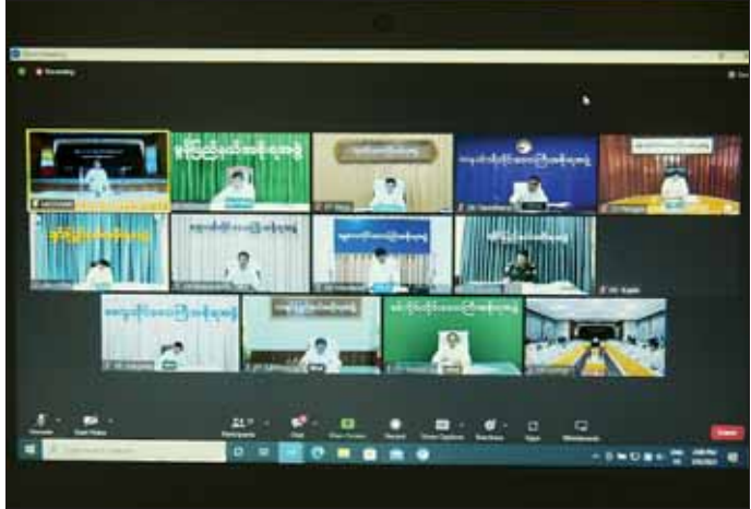
တိုင်းဒေသကြီးနှင့် ပြည်နယ်ဝန်ကြီးချုပ်များ အမျိုးသားသဘာဝဘေးအန္တရာယ်ဆိုင်ရာ စီမံခန့်ခွဲမှု ကော်မတီ အရေးပေါ်လုပ်ငန်းညှိနှိုင်းအစည်းအဝေးသို့ ဗီဒီယို ကွန်ဖရင့်စနစ်ဖြင့် တက်ရောက်ကြစဉ်။

ယင်းနောက် အမျိုးသားသဘာဝဘေးအန္တရာယ် ဆိုင်ရာ စီမံခန့်ခွဲမှုကော်မတီဥက္ကဋ္ဌ နိုင်ငံတော်စီမံ အုပ်ချုပ်ရေးကောင်စီ ဒုတိယဥက္ကဋ္ဌ ဒုတိယ ဝန်ကြီးချုပ် ဒုတိယဗိုလ်ချုပ်မှူးကြီး စိုးဝင်းက နိဂုံးချုပ်အမှာစကားပြောကြားကာ အစည်းအဝေးကို ရုပ်သိမ်းလိုက်သည်။ သတင်းစဉ်