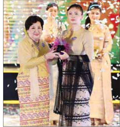
အကယ်ဒမီ ဝါဝါဝင်းရွှေ (၂၀၂၂) ခုနှစ်အတွက် အကောင်းဆုံးအမျိုးသမီး ဇာတ်ဆောင်ဆုရ ရွှေမုံရတ် အား ဆုချီးမြှင့်စဉ်။