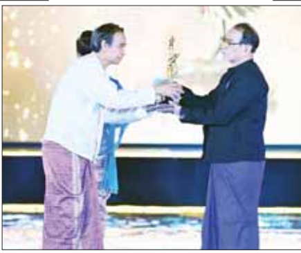
“နိုင်ငံကြီးသား” ဇာတ်ကားဖြင့် အကောင်းဆုံးရုပ်ရှင်ဇာတ်ညွှန်းဆု (၂၀၁၉) ရရှိသည့် မောင်မြတ်ဆွေ ဆုလက်ခံယူစဉ်။