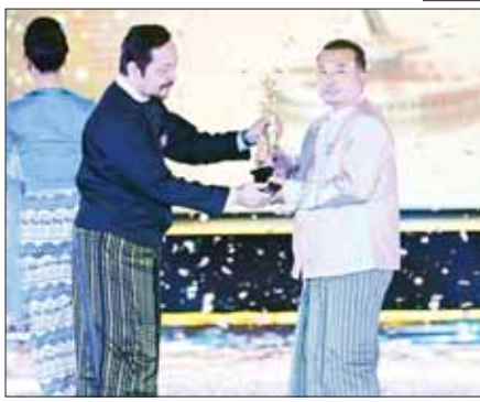
“လိပ်ပြာထောင်ချောက်” ဇာတ်ကားဖြင့် အကောင်းဆုံးရုပ်ရှင် တည်းဖြတ်ဆု (၂၀၂၂) ရရှိသည့် ကြည်သာ ဆုလက်ခံယူစဉ်။