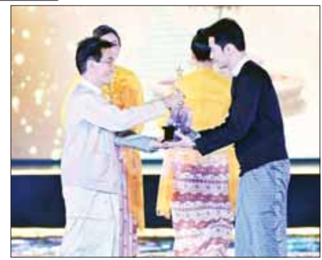
အကောင်းဆုံးရုပ်ရှင် ဇာတ်ကားဆု (၂၀၂၀) ရရှိသည့် “ပိတောက်ကတဲဂီတ” ဇာတ်ကားအတွက် ဆုချီးမြှင့်စဉ်။