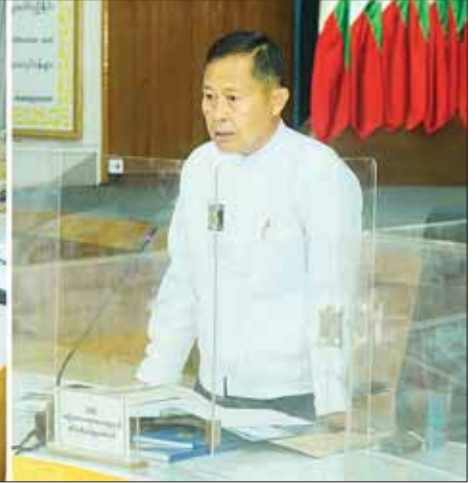
နိုင်ငံတော်စီမံအုပ်ချုပ်ရေးကောင်စီ ဒုတိယဥက္ကဋ္ဌ ဒုတိယဝန်ကြီးချုပ် ဒုတိယဗိုလ်ချုပ်မှူးကြီး စိုးဝင်း အမျိုးသားသဘာဝဘေးအန္တရာယ်ဆိုင်ရာစီမံခန့်ခွဲမှုကော်မတီ အရေးပေါ်လုပ်ငန်းညှိနှိုင်းအစည်းအဝေးတွင် အမှာစကားပြောကြားစဉ်။