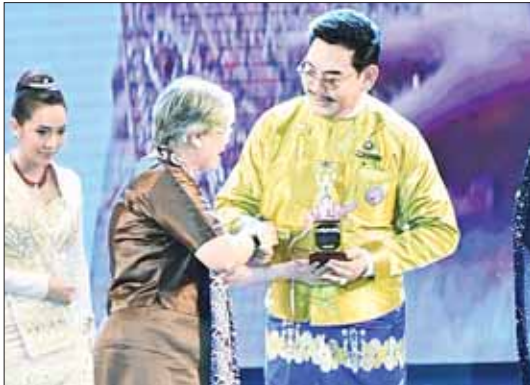
အကယ်ဒမီဆွေဇင်ထိုက် ရန်အောင်အား အကောင်းဆုံးအမျိုးသားဝတ်စားဆင်ယင်မှုအကြီးတန်းဆု ပေးအပ်ချီးမြှင့်စဉ်။