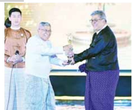
“ပိတောက်ကတဲဂီတ” ဇာတ်ကားဖြင့် အကောင်းဆုံးရုပ်ရှင် ခါရိုက်တာဆု (၂၀၂၀) ရရှိသည့် ခါရိုက်တာမီးပွား ဆုလက်ခံယူစဉ်။