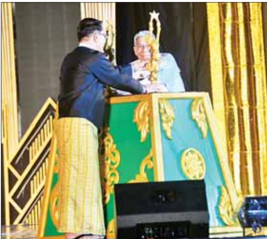
ပြည်ထောင်စုဝန်ကြီးဦးမောင်မောင်အုန်းနှင့် မြန်မာနိုင်ငံ ရုပ်ရှင်အစည်းအရုံးဥက္ကဋ္ဌ အကယ်ဒမီများရှင် ဦးကြည်စိုးထွန်းတို့ အကယ်ဒမီရွှေစင်ရုပ်တုကို ဒစ်ဂျစ်တယ်စက်ခလုတ်ခုံပေါ်တွင် စိုက်ထူဖွင့်လှစ်ပေးစဉ်။

ထို့ကြောင့်လည်း မိမိတို့ နိုင်ငံတော်စီမံအုပ်ချုပ်ရေးကောင်စီက ချမှတ်ထားသည့် နိုင်ငံတော်အစိုးရ၏ လူမှုရေးဦးတည်ချက်(၄)ရပ်ထဲတွင် “တိုင်းရင်းသား လူမျိုးအပေါင်းတို့၏ လေ့ထုံးတမ်းအစဉ်အလာများကို လေးစားလိုက်နာပြီး အမျိုးသားရေးစိတ်ဓာတ်ကို အခြေခံသည့် ကိုးကွယ်ယုံကြည်မှု ယဉ်ကျေးမှုအမျိုးသားရေးစရိုက်လက္ခဏာများ မပျောက်ပျက်အောင် ထိန်းသိမ်းစောင့်ရှောက်ရေး” ဆိုသည့်အချက်ကို ထည့်သွင်းဆောင်ရွက်ထားခြင်းဖြစ်ပါကြောင်း၊ နိုင်ငံတော်အစိုးရအနေဖြင့် မိမိတို့နိုင်ငံ၊ မိမိတို့လူမျိုး၏ ယဉ်ကျေးမှုများ၊ အမျိုးသားရေးစရိုက်လက္ခဏာများ မပျောက်ပျက်အောင် မည်မျှ အလေးအနက်ထားဆောင်ရွက်နေသည်ကို အားလုံးတွေ့မြင်ကြရမည်ဖြစ်ပါကြောင်း၊ အဆိုပါ ဦးတည်ချက်အောင်မြင်ရန်အတွက် ရုပ်ရှင်အနုပညာသမားများ၏ ပူးပေါင်းပါဝင်မှုသည် အလွန်အရေးပါသည်ဟု ပြောကြား