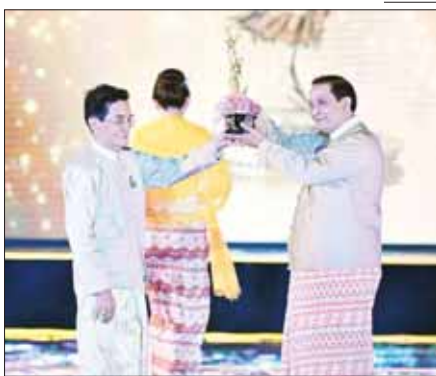
အကောင်းဆုံးရုပ်ရှင် ဇာတ်ကားဆု (၂၀၂၂) ရရှိသည့် “ဝေးမနေချင်ဘူး” ဇာတ်ကားအတွက် ဆုချီးမြှင့်စဉ်။