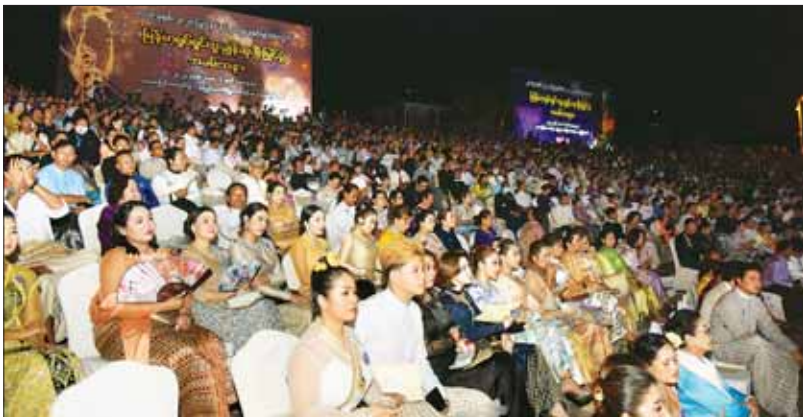
မြန်မာ့ရုပ်ရှင်ထူးချွန်ဆုချီးမြှင့်ပွဲအခမ်းအနား တက်ရောက်ကြသည့် ပရိသတ်များ။