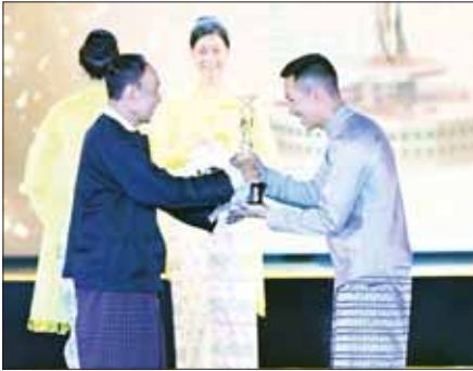
“ဒဏ္ဍာရီမိုး” ဇာတ်ကားဖြင့် အကောင်းဆုံးရုပ်ရှင်ဇာတ်ပုံဆု (၂၀၁၉) ရရှိသည့် အကာတိုး ဆုလက်ခံယူစဉ်။