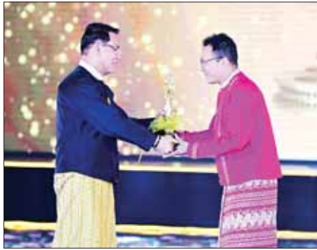
ပြည်ထောင်စုဝန်ကြီး ဦးမောင်မောင်အုန်း (၂၀၂၀) ပြည့်နှစ်အတွက် အကောင်းဆုံး အမျိုးသားဇာတ်ပို့ဆုရ အုန်းသီးအား ဆုချီးမြှင့်စဉ်။