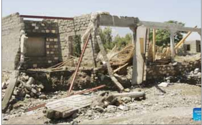
အာဖဂန်နစ္စတန်နိုင်ငံ နန်ဂါဟာပြည်နယ်၌ မိုးသည်းထန်စွာရွာသွန်းပြီး ရေကြီးမှုကြောင့် အဆောက်အအုံ ပျက်စီးနေမှုကို တွေ့ရစဉ်။

ကလေးငယ် သုံးဦးအပါအဝင် လူလေးဦး သေဆုံးခဲ့ကြောင်း ထုတ်ပြန်ချက်တွင် ဖော်ပြထား သည်။ ရေကြီးရေလျှံမှုများကြောင့် အိမ်ခြေ ၃၀၀ ခန့် ဆုံးရှုံးစွာ ပျက်စီးခဲ့ရပြီး လယ်မြေဧက ထောင်ပေါင်း များစွာလည်း ပျက်စီးခဲ့ကြောင်း အဆိုပါ ထုတ်ပြန်ချက်တွင် ဖော်ပြထား သည်။