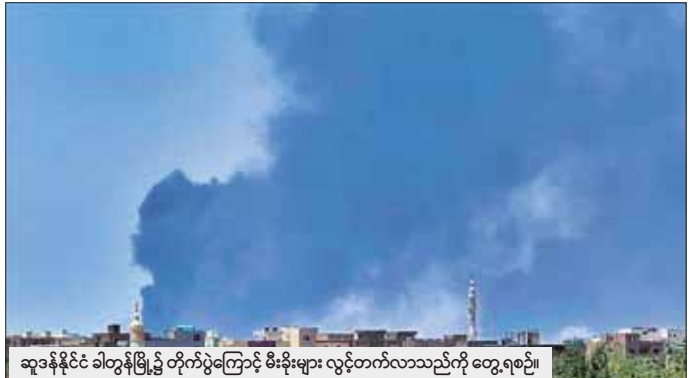
ဆူဒန်နိုင်ငံ ခါတွန်မြို့၌ တိုက်ပွဲကြောင့် မီးခိုးများ လွင့်တက်လာသည်ကို တွေ့ရစဉ်။

အပစ်အခတ်ရပ်စဲရေးအတွက် သဘောတူညီမှု များ ကြေညာထားသော်လည်း ဆူဒန်တွင် တိုက်ပွဲများ ဆက်လက်ဖြစ်ပွားနေဆဲဖြစ်သည်။ ဧပြီ ၁၅ ရက် ဆူဒန်တွင် တိုက်ပွဲများ စတင်ဖြစ်ပွားသည့်အချိန်မှ စတင်ကာ လူပေါင်း ၅၅၀ သေဆုံးပြီးဖြစ်ကြောင်း ဆူဒန်ကျန်းမာရေးအာဏာပိုင်များက ပြောသည်။ ဆော်ဒီအာရေဗျသည် ဆူဒန်နိုင်ငံအပေါ် လွှမ်းမိုးမှုရှိ မည်ဟု ယူဆရသည်။ ငြိမ်းချမ်းရေး ဆွေးနွေးပွဲပြုလုပ် မြင်းဖြင့် လူသားချင်းစာနာထောက်ထားမှုဆိုင်ရာ ပြဿနာများ ဖြစ်လာနိုင်သည်ဟူသော စိုးရိမ်မှုကို ဖြေလျှော့ပေးနိုင်သည်ဟု လေ့လာသူများက ပြော သည်။ အင်အိတ်အိုက