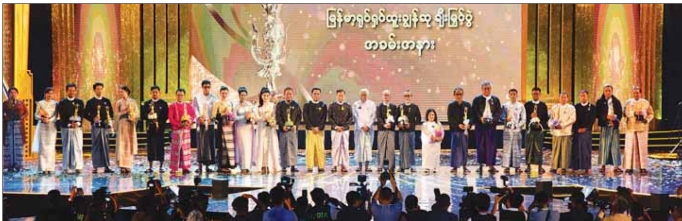
နိုင်ငံတော်စီမံအုပ်ချုပ်ရေးကောင်စီ ဒုတိယဥက္ကဋ္ဌ ဒုတိယဝန်ကြီးချုပ် ဒုတိယဗိုလ်ချုပ်မှူးကြီး စိုးဝင်းနှင့်အဖွဲ့ ၂၀၁၉ ခုနှစ်၊ ၂၀၂၀ ပြည့်နှစ်နှင့် ၂၀၂၁ ခုနှစ်များအတွက် မြန်မာ့ရုပ်ရှင်ထူးချွန်ဆုရရှိသူများနှင့်အတူ စုပေါင်းမှတ်တမ်းတင်ဓာတ်ပုံရိုက်စဉ်။