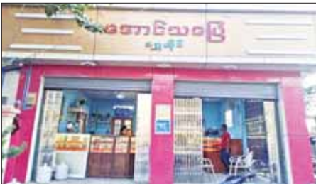
၂၂ - ၁၂ - ၂၀၂၂ ရက်က ဓားပြတိုက်ခံရသည့် ပုသိမ်ကြီးမြို့နယ် နာရီစင်အနီး “အောင်သပြေ” ရွှေဆိုင်နှင့် ဓားပြတိုက်သည့် CCTV မှတ်တမ်းဓာတ်ပုံ။