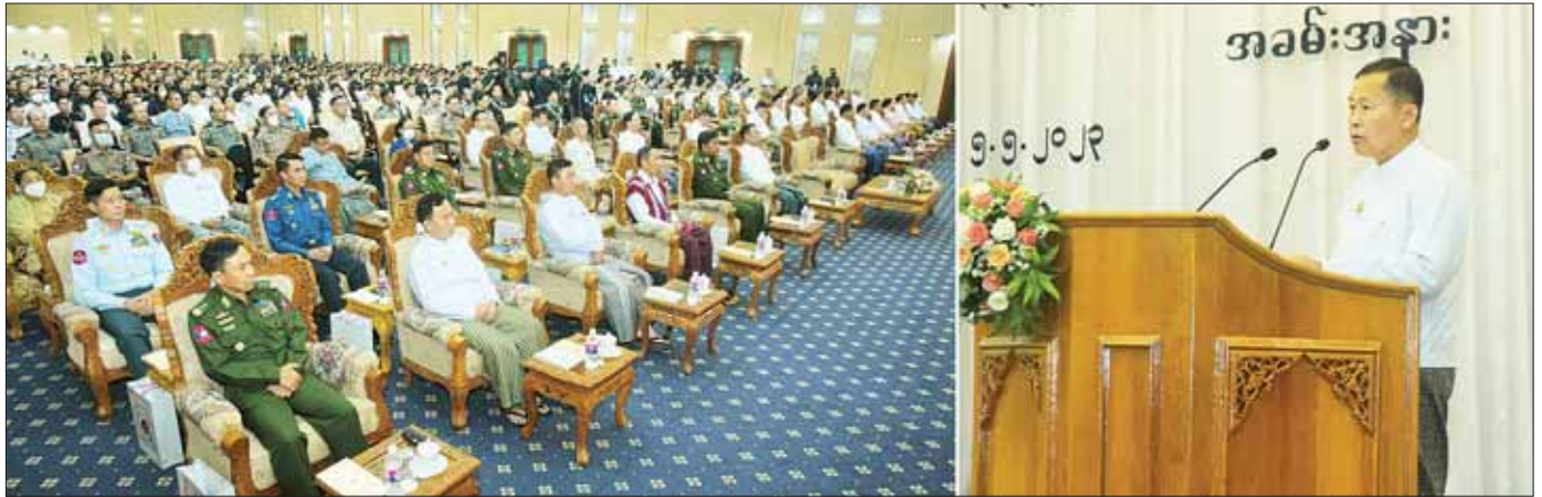
နိုင်ငံတော်စီမံအုပ်ချုပ်ရေးကောင်စီဒုတိယဥက္ကဋ္ဌ ဒုတိယဝန်ကြီးချုပ် ဒုတိယဗိုလ်ချုပ်မှူးကြီး စိုးဝင်း (၇၇) နှစ်မြောက် မြန်မာနိုင်ငံမီးသတ်တပ်ဖွဲ့နေ့အခမ်းအနားတွင် အမှာစကားပြောကြားစဉ်။