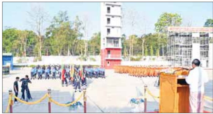
ရန်ကုန်တိုင်းဒေသကြီး ဝန်ကြီးချုပ် ဦးစိုးသိန်း မရမ်းကုန်းမြို့နယ်ရှိ မြန်မာနိုင်ငံမီးသတ်တပ်ဖွဲ့ ဌာနချုပ် စစ်ရေးပြကွင်း၌ ကျင်းပသည့် (၇၇) နှစ်မြောက် မြန်မာနိုင်ငံမီးသတ်တပ်ဖွဲ့နေ့ အခမ်းအနားတွင် အမှာစကားပြောကြားစဉ်။

ရောက်ကြသည်။ ဦးစွာ တိုင်းဒေသကြီးနှင့် ပြည်နယ်များမှ ဝန်ကြီးချုပ်များ၊ တိုင်းမှူးများနှင့် တာဝန်ရှိသူများက (၇၇) နှစ်မြောက် မြန်မာနိုင်ငံမီးသတ်တပ်ဖွဲ့နေ့ အခမ်းအနား မိန့်ခွန်းများ ပြောကြားကြသည်။ ထို့နောက် သက်ဆိုင်ရာတိုင်းဒေသကြီးနှင့် ပြည်နယ် ဝန်ကြီးချုပ်များ၊ တိုင်းမှူးများနှင့် တာဝန်ရှိသူများက ဆုရရှိကြသည့် မီးသတ်တပ်ဖွဲ့ဝင်များကို ဂုဏ်ပြုချီးမြှင့်ပေးပြီး၊ ဂုဏ်ပြုဆုတံဆိပ်များနှင့် ဂုဏ်ပြုမှတ်တမ်းလွှာများ ပေးအပ်ချီးမြှင့်ကြသည်။ ဆက်လက်၍ တိုင်းဒေသကြီးနှင့် ပြည်နယ် ဝန်ကြီးချုပ်များ၊ တိုင်းမှူးများနှင့် တာဝန်ရှိသူများက ပြခန်းများတွင် ခင်းကျင်းပြသထားသည့် မီးသတ်ပစ္စည်းကိရိယာများအား လှည့်လည်ကြည့်ရှုကြပြီး မီးသတ်တပ်ဖွဲ့ဝင်များ၏ မီးငြိမ်းသတ်ရေးနှင့် ရှာဖွေကယ်ဆယ်ရေး သရုပ်ပြသမှုများကို ကြည့်ရှုအားပေးခဲ့ကြောင်း သတင်းရရှိသည်။ သတင်းစဉ်