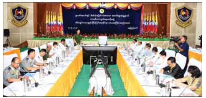
မူးယစ်ဆေးဝါးနှင့်စိတ်ကိုပြောင်းလဲစေသော ဆေးဝါးများအန္တရာယ် တားဆီးကာကွယ်ရေးဗဟိုအဖွဲ့၏ ထိန်းချုပ်စာတုပစ္စည်းကြီးကြပ်ရေးဆိုင်ရာ (ပထမ) အကြိမ် အစည်းအဝေးကျင်းပနေပုံ။

မူးယစ်ဆေးဝါးနှင့် စိတ်ကိုပြောင်းလဲစေသော ဆေးဝါးများ တရားမဝင် သယ်ဆောင်ရေးဝယ်မှု တိုက်ဖျက်ရေးဆိုင်ရာ ကမ္ဘာ့ကုလသမဂ္ဂ ကွန်ဗင်းရှင်း ၏ ဇယား ၁ နှင့် ၂ ဖြင့်လည်းကောင်း၊ မြန်မာနိုင်ငံ၏ လိုအပ်ချက်အရ သတ်မှတ်သည့် ဇယား ၃ ဖြင့် လည်းကောင်း စုစုပေါင်း ၃၉ မျိုးကို ထိန်းချုပ်စာတု ပစ္စည်းများအဖြစ် သတ်မှတ်ထားပါကြောင်း၊ ထိန်းချုပ် စာတုပစ္စည်းများ တရားမဝင်သို့လှောင်၊ သယ်ဆောင်၊ ရောင်းဝယ်မှုများကို မူးယစ်ဆေးဝါးနှင့် စိတ်ကို ပြောင်းလဲစေသော ဆေးဝါးများဆိုင်ရာ ဥပဒေဖြင့် လည်းကောင်း၊ အလားတူ ထိန်းချုပ်စာတုစာရင်းတွင် မပါဝင်သည့် အခြားစာတုပစ္စည်းများကို တရားဝင် ခွင့်ပြုချက် တစ်စုံတစ်ရာမပါရှိဘဲ သို့လှောင်၊ သယ်ဆောင်၊ ရောင်းဝယ်မှုများပြုလုပ်ပါက စာတု ပစ္စည်းနှင့် ဆက်စပ်ပစ္စည်းများအန္တရာယ်မှ တားဆီး ကာကွယ်ရေးဥပဒေဖြင့်လည်းကောင်း ကြပ်မတ် အရေးယူ ဆောင်ရွက်လျက်ရှိပါကြောင်း။ အခြားစာတုပစ္စည်းများတွင်လည်း မူးယစ် ဆေးဝါးနှင့် စိတ်ပြောင်းလဲစေသောဆေးဝါးချက်ရည် အသုံးပြုနိုင်သည့် စာတုပစ္စည်းရာခိုင်နှုန်းများစွာ ရောစပ်ပါဝင်သော စာတုပစ္စည်းများကို အဓိကထား သို့လှောင်၊ သယ်ဆောင်ကြောင်း တွေ့ရှိရသဖြင့် ထိန်းချုပ်ရေးလုပ်ငန်းစဉ်များကို ကျယ်ပြန့်စွာ ဆောင်ရွက်ကြရန် လိုလာသည်ကို တွေ့ရမည်ဖြစ်ပါ ကြောင်း၊ မူးယစ်ဆေးဝါးနှင့် စိတ်ကိုပြောင်းလဲစေ သောဆေးဝါးများ တရားမဝင်ရောင်းဝယ်ဖောက်ဖား မှုနှင့် အလှည့်ဆက်လက်ထုတ်လုပ်မှုကို ပိုမိုထိန်းချုပ်နိုင်ရေး အတွက် စိစစ်ကြပ်မတ်ရာတွင် ထိန်းချုပ်စာတုပစ္စည်း