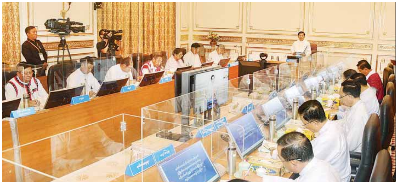
နိုင်ငံတော်စီမံအုပ်ချုပ်ရေးကောင်စီဥက္ကဋ္ဌ နိုင်ငံတော်ဝန်ကြီးချုပ် ဗိုလ်ချုပ်မှူးကြီး မင်းအောင်လှိုင် နယ်စပ်ဒေသနှင့်တိုင်းရင်းသားလူမျိုးများ၏ ဖွံ့ဖြိုးတိုးတက်မှုအကောင်အထည်ဖော်ရေးဗဟိုကော်မတီလုပ်ငန်း ညှိနှိုင်းအစည်းအဝေးအမှတ်စဉ် (၁/၂၀၂၃)တွင် အမှာစကားပြောကြားစဉ်။