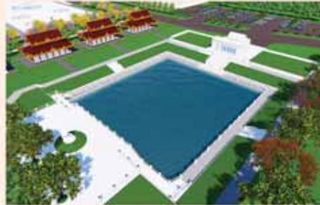
ပုဇွန်ကန်

၁။ နိုင်ငံတော်စီမံအုပ်ချုပ်ရေးကောင်စီဥက္ကဋ္ဌ၊ တပ်မတော်ကာကွယ်ရေးဦးစီးချုပ် ဝိုင်းချုပ်မှူးကြီးမင်းအောင်လှိုင် ဦးဆောင်သည့် (၇)ရက်သား၊ သမီး၊ ဘုရားဒါယကာ၊ ဒါယိကာမတို့က "မာရဝိဇယ" ပုဒ္ဓရုပ်ပွားတော်မြတ်ကြီးကို မြန်မာနိုင်ငံတွင် ထေရဝါဒပုဒ္ဓသာသနာတော်ကြီး နိုင်မာစွာထွန်းလင်းတောက်ပလျက်ရှိမှုအား ကမ္ဘာကိုပြသရန်၊ မြန်မာနိုင်ငံသည် ထေရဝါဒပုဒ္ဓဘာသာကိုးကွယ်မခါးဘဲတို့ချက်ဖြစ်စေရန်၊ တိုင်းပြည်အေးချမ်းသာယာမှုရှိစေရန်၊ ကမ္ဘာကြီးငြိမ်းချမ်းသာယာမှုဖြစ်စေရန် စသည့်ရည်ရွယ်ချက် ၄ ရပ်ဖြင့်တည်ထားကိုးကွယ်ရန် ရည်သန်လျက် ပြည်ထောင်စုစနယ်မြေ နေပြည်တော်၊ ဒဂုံကသိရိမြို့နယ်အတွင်း၌ သာသနာတော်ထုံး ရုပ်ပွားဆင်းတုတော်ထုံး မြန်မာ့ရိုးရာတည်ထုံးများနှင့်အညီ တည်ဆောက်ပူဇော်လျက် ရှိပါသည်။