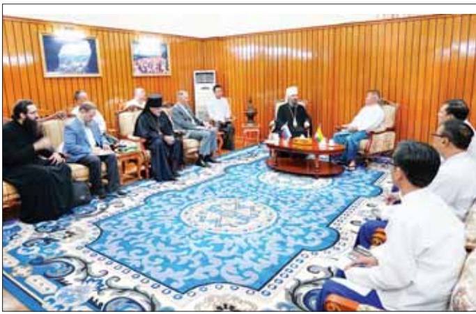
အရှေ့တောင်အာရှ ဒေသလုံးဆိုင်ရာ အော်သိုဒေါ့ဘုန်းတော်ကြီး ဦးအောင်သော် (ဝယ်) နှင့် ပူးတွဲအဖွဲ့ဝင်များ တွေ့ဆုံနေပုံ။

နေပြည်တော် မေ ၅ ဟိုတယ်နှင့် ခရီးသွားလာရေး ဝန်ကြီးဌာန ပြည်ထောင်စုဝန်ကြီး ဦးအောင်သော်၊ ဝန်ကြီးဌာနမှ ညွှန်ကြားရေးမှူးချုပ်များ၊ ဒုတိယ ညွှန်ကြားရေးမှူးချုပ်များနှင့် ဘာသာရပ် တာဝန်ခံများသည် ယနေ့နံနက်ပိုင်းတွင် ရုရှား ဖက်ဒရေးရှင်းနိုင်ငံ စင်ကာပူနှင့် အရှေ့တောင်အာရှ ဒေသလုံး ဆိုင်ရာ အော်သိုဒေါ့ဘုန်းတော်ကြီး His Eminence Sergiy ဦးဆောင် သော ကိုယ်စားလှယ်အဖွဲ့ကို ဝန်ကြီးဌာနပြည်ထောင်စုဝန်ကြီး ၏ ဧည့်ခန်းမ၌ လက်ခံတွေ့ဆုံ သည်။ (ယာဝု) တွေ့ဆုံစဉ် ပြည်ထောင်စု ဝန်ကြီးက ရှေးဦးစွာ နှုတ်ခွန်းဆက် စကားပြောကြားပြီး အော်သိုဒေါ့ ဘုန်းတော်ကြီးက နိုင်ငံတစ်နိုင်ငံ တွင် ဘာသာရေး အဆုံးအမသည်