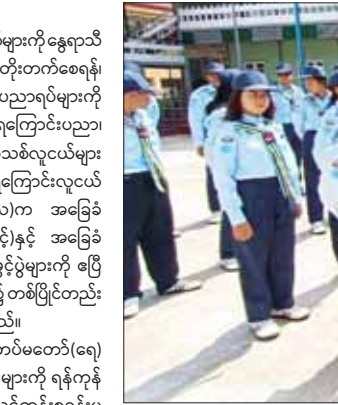
လူငယ်သင်တန်းစခန်း ၁၁ ခု၌ သင်တန်းသား သင်တန်းသူ စုစုပေါင်း ၇၁၂ ဦးတို့ကို လေ့ကျင့်သင်ကြားပေးလျက်ရှိသည်။ အလားတူ တပ်မတော်(လေ) က အခြေခံလေကြောင်းလူငယ် သင်တန်း (အကြီးတန်းအဆင့်)နှင့် အခြေခံလေကြောင်းလူငယ်သင်တန်း (အငယ်တန်းအဆင့်) သင်တန်းများကို မွန်ပြည်နယ် မော်လမြိုင်မြို့ရှိ လေကြောင်းလူငယ်သင်တန်းစခန်းမှ သင်တန်းသား သင်တန်းသူ

နေပြည်တော် မေ ၅ ကျောင်းသား ကျောင်းသူ မျိုးဆက်သစ်လူငယ်မောင်မယ်များကို နေရာသီ ကျောင်းပိတ်ရက်ကာလအတွင်း အသိပညာများ ဖွံ့ဖြိုးတိုးတက်စေရန်၊ အားလပ်ရက်များအကျိုးရှိစေရန်၊ မိမိဝါသနာပါသည့် ပညာရပ်များကို လေ့လာဆည်းပူးနိုင်စေရန် နှင့် နိုင်ငံတော်အတွက် ရေကြောင်းပညာ၊ လေကြောင်းပညာကျွမ်းကျင်သော အနာဂတ်မျိုးဆက်သစ်လူငယ်များ ပေါ်ထွန်းလာစေရန်ရည်ရွယ်၍ တပ်မတော်(ရေး) က ရေကြောင်းလူငယ် အခြေခံနှင့် တန်းမြင့်သင်တန်းများ၊ တပ်မတော်(လေ)က အခြေခံလေကြောင်း လူငယ်သင်တန်း (အကြီးတန်းအဆင့်)နှင့် အခြေခံလေကြောင်း လူငယ်သင်တန်း(အငယ်တန်းအဆင့်)ဖွင့်ပွဲများကို ဧပြီ ၂၄ ရက်တွင် သက်ဆိုင်ရာမြို့နယ်ရှိ သင်တန်းစခန်းများ၌ တစ်ပြိုင်တည်း စတင်ဖွင့်လှစ်ခဲ့ပြီး လေ့ကျင့်သင်ကြားပေးလျက်ရှိသည်။ ထိုသို့လေ့ကျင့်သင်ကြားလျက်ရှိရာ ယနေ့တွင် တပ်မတော်(ရေး) က ရေကြောင်းလူငယ်အခြေခံနှင့် တန်းမြင့်သင်တန်းများကို ရန်ကုန်တိုင်းဒေသကြီး ရန်ကုန်မြို့ရှိ ရေကြောင်းလူငယ်သင်တန်းစခန်းမှ သင်တန်းသား သင်တန်းသူစုစုပေါင်း ၉၇ ဦး၊ ကိုကိုးကျွန်းမြို့ရှိ ရေကြောင်းလူငယ်သင်တန်းစခန်းမှ သင်တန်းသား သင်တန်းသူ စုစုပေါင်း ၇၁ ဦး၊ တနင်္သာရီတိုင်းဒေသကြီး ဟိုန်းခဲမြို့ရှိ ရေကြောင်းလူငယ်သင်တန်းစခန်းမှ သင်တန်းသား သင်တန်းသူစုစုပေါင်း ၆၀ တို့ကို သက်ဆိုင်ရာ နယ်မြေ အသီးသီးမှ တာဝန်ရှိသူကဏ္ဍများက လေ့ကျင့်သင်ကြားပေးလျက်ရှိပြီး သက်ဆိုင်ရာမြို့နယ်အသီးသီးရှိ တပ်မတော်(ရေး)ရေကြောင်း