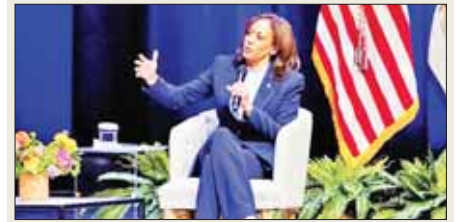
အမေရိကန် ဒုတိယသမ္မတ ကာမလာဟားရစ်။

ဝါရှင်တန် မေ ၅ အမေရိကန် ဒုတိယသမ္မတ ကာမလာဟားရစ်သည် နည်းပညာ ကုမ္ပဏီကြီး လေးခု၏ အကြီးအကဲများကို ၎င်းတို့၏ ထုတ်ကုန်သည် ဖြစ်သည့်အေအိုင် (ဉာဏ်ရည်တု) လုံခြုံစိတ်ချမှုရှိစေရန် တောင်းဆို ခဲ့သည်။ ၎င်းသည် နည်းပညာကုမ္ပဏီကြီးများ၏အိမ်အိမ်အိမ်များကို မေ ၄ ရက်က အိမ်ဖြူတော်တွင် တွေ့ဆုံခဲ့သည်။ ၎င်းတို့မှာ ဂူဂဲလ်၊ မိုက်ခရို ဆော့ဖ်ဝဲနှင့် အခြားကုမ္ပဏီ နှစ်ခုတို့ဖြစ်ကြသည်။ အေအိုင်စနစ်သည် ပြည်သူများ၏ဘဝကို မြှင့်တင်ပေးနိုင်ပြီး အဓိက လူမှုရေးပြဿနာများ ကို ဖြေရှင်းပေးနိုင်သည်။ သို့သော်လည်း အဆိုပါနည်းပညာကြောင့် ဘေးကင်းရေးနှင့် လုံခြုံရေးတို့အတွက်လည်း မြှင့်တင်လာနိုင် ကြောင်းနှင့် ပြည်သူများ၏ကိုယ်ရေးကိုယ်တာများနှင့် အခွင့်အရေး များကိုလည်း ချိုးဖောက်လာနိုင်ကြောင်း ၎င်းက ပြောကြားခဲ့သည်။ နည်းပညာကုမ္ပဏီကြီးများအနေဖြင့် ၎င်းတို့၏ထုတ်ကုန်လုံခြုံစိတ်ချ ရမှုအတွက်လည်း ကျင့်ဝတ်နှင့် ဥပဒေဆိုင်ရာတာဝန်များရှိသည်ဟု ၎င်းကပြောကြားခဲ့သည်။ အမျိုးသားအေအိုင် သူတေသနအင်စတီကျု များကို တည်ထောင်ရန်အတွက် အမေရိကန်က ဒေါ်လာသန်း ၁၄၀ ရင်းနှီးမြှုပ်နှံထားသည်ဟု ကြေညာခဲ့သည်။ အေအိုင်စနစ်၏ ဘေးကင်း လုံခြုံရေးကိုစွဲလှုပ်များအပါအဝင် စည်းမျဉ်းစည်းကမ်းများနှင့် ပတ်သက်၍ ပြည်တွင်းအေအိုင်စနစ် ကျွမ်းကျင်သူများနှင့်တိုင်ပင် ပြီး ဥရောပသမဂ္ဂနှင့်အတူ လက်တွဲလုပ်ကိုင်သွားရန် မြှော်လင့်ထား သည်ဟု အမေရိကန်အဆင့်မြင့် အရာရှိကြီးတစ်ဦးက ပြောသည်။ ဥရောပသမဂ္ဂသည် အေအိုင်ဥပဒေကို ရေးဆွဲလျက်ရှိသည်။ အင်န်အိတ်ချီကော