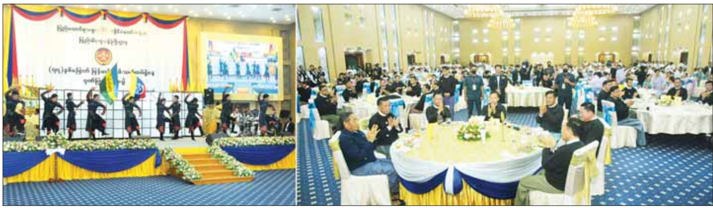
နိုင်ငံတော်စီမံအုပ်ချုပ်ရေးကောင်စီဒုတိယဥက္ကဋ္ဌ ဒုတိယဝန်ကြီးချုပ် ဒုတိယဗိုလ်ချုပ်မှူးကြီး စိုးဝင်းနှင့်အဖွဲ့ဝင်များ (၇၇) နှစ်မြောက် မြန်မာနိုင်ငံမီးသတ်တပ်ဖွဲ့နေ့ ဂုဏ်ပြုပွဲစာစားပွဲတွင် မြန်မာနိုင်ငံမီးသတ်တပ်ဖွဲ့ဝင်များ၏ ဖျော်ဖြေတင်ဆက်မှုကို ကြည့်ရှုအားပေးစဉ်။

စာမျက်နှာ ၇ မှ အခြားသော ဓာတ်၊ ဇီဝ၊ ရေဒီယို သတ္တိကြွပစ္စည်းများ၏ အန္တရာယ်များလည်း ဖြစ်ပွားလာသည်ကို တွေ့ကြုံရမည်ဖြစ်ကြောင်း၊ ထို့ကြောင့် မီးသတ်တပ်ဖွဲ့ဝင်များအနေဖြင့်လည်း တိုးတက်ဖြစ်ပေါ်ပြောင်းလဲလာသည့် ဘေးအန္တရာယ်များ၏ စိန်ခေါ်မှုများကို ရင်ဆိုင်နိုင်ရန်နှင့် နိုင်ငံတကာမီးသတ်တပ်ဖွဲ့များနှင့် ရင်ပေါင်တန်းဆောင်ရွက်နိုင်ရန်အတွက် မီးသတ်တပ်ဖွဲ့၏ လုပ်ငန်းစဉ်ဆောင်ရွက်မှု တိုးတက်မြှင့်တင်ရေးအတွက် ကြိုးပမ်းဆောင်ရွက်သွားကြရန် အလေးအနက်ထား မှာကြားလိုကြောင်း။