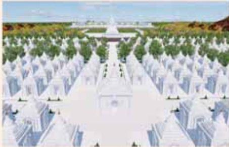
ကျောက်စာရုံစေတီ(၁၂ x ၁၂ x ၀၈)၀၀ ဝ ခု တန်ဖိုး-၂၇၉ သိန်း