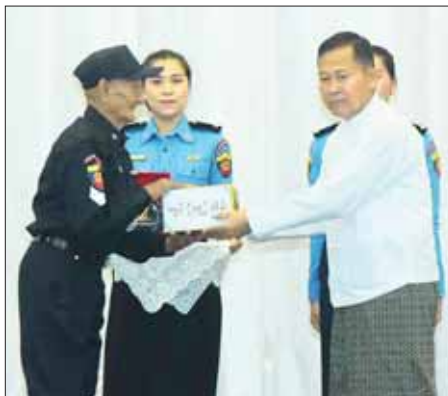
နိုင်ငံတော်စီမံအုပ်ချုပ်ရေးကောင်စီဒုတိယဥက္ကဋ္ဌ ဒုတိယဝန်ကြီးချုပ် ဒုတိယဗိုလ်ချုပ်မှူးကြီး စိုးဝင်း စစ်မှုထမ်း (ငြိမ်း)/မီးသတ်ဝန်ထမ်း (ငြိမ်း) တပ်ကြပ်ကြီး ဦးထွန်းကြည် (အသက် ၉၂ နှစ်) အား ဂုဏ်ပြုဆုနှင့် ဂုဏ်ပြုဆုငွေများ ချီးမြှင့်စဉ်။

○ မီးသတ်တပ်ဖွဲ့အဖြစ် ပေါ်ပေါက်လာသည့် အချိန်မှစ၍ ယနေ့အချိန်အထိ နိုင်ငံတော်၏အကျိုး၊ တိုင်းရင်းသားပြည်သူများ၏အကျိုးကို အစဉ်ရရှိဆောင်ရွက်ပြီး ဘယ်လိုအခြေအနေမျိုးတွင်မဆို နိုင်ငံရေးအရောင်အသွေးမရှိဘဲ သမိုင်းအစဉ်အလာကောင်းများနှင့် ပြည်သူ့အကျိုးပြုတပ်ဖွဲ့တစ်ခုအဖြစ် ရပ်တည်လာခဲ့သည့်အတွက် မီးသတ်တပ်ဖွဲ့သည် နိုင်ငံရေးအရောင်အသွေးကင်းမဲ့သော အဖွဲ့အစည်းတစ်ခုဖြစ်