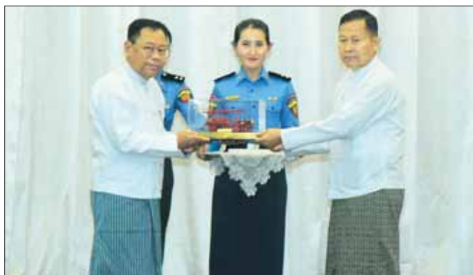
နိုင်ငံတော်စီမံအုပ်ချုပ်ရေးကောင်စီဒုတိယဥက္ကဋ္ဌ ဒုတိယဝန်ကြီးချုပ် ဒုတိယဗိုလ်ချုပ်မှူးကြီး စိုးဝင်းအား ပြည်ထောင်စုဝန်ကြီး ဒုတိယဗိုလ်ချုပ်ကြီး စိုးထွဋ်က (၇၇) နှစ်မြောက် မြန်မာနိုင်ငံမီးသတ်တပ်ဖွဲ့နေ့အထိမ်းအမှတ် အမှတ်တရလက်ဆောင် ပေးပို့စဉ်။

(၇၇)နှစ်အတွင်း မြန်မာနိုင်ငံမီးသတ်တပ်ဖွဲ့အနေဖြင့် ပြည်သူ့လူထုအတွင်း မီးဘေးလုံခြုံရေး၊