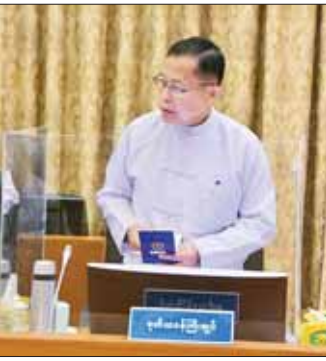
နိုင်ငံတော်စီမံအုပ်ချုပ်ရေးကောင်စီ ဒုတိယဥက္ကဋ္ဌ ဒုတိယဝန်ကြီးချုပ် ဒုတိယဗိုလ်ချုပ်မှူးကြီး စိုးဝင်း ဖြည့်စွက်ဆွေးနွေးစဉ်။

တစ်ခုလုံး ကျောင်းစတင်ခဲ့ကြသည့် လူငယ်ပေါင်း ၁၉၄၄၀၇၁ ဦးရှိရာတွင် အလယ်တန်းအဆင့် (၅) တန်းတက်ရောက်သူ ၁၁၁၃၇၃၈ ဦးဖြစ်သဖြင့် တက်ရောက်ရာခိုင်နှုန်း ၅၇ ဒသမ ၂၉ ရာခိုင်နှုန်း၊ လျော့နည်းရာခိုင်နှုန်း ၄၂ ဒသမ ၇၁ ရာခိုင်နှုန်းရှိပါကြောင်း၊ (၈)တန်းအထိ တက်ရောက်ပညာသင်ကြားသူ ၇၇၈၇၄၁၂ ဦး၊ တက်ရောက်ရာခိုင်နှုန်း ၄၀ ဒသမ ၀၆ ရာခိုင်နှုန်းဖြင့် လျော့နည်းရာခိုင်နှုန်း ၅၉ ဒသမ ၉၄ ရာခိုင်နှုန်းရှိပါကြောင်း၊ (၉) တန်းတက်ရောက်သူ ၇၆ ဒသမ ၈၁ ရာခိုင်နှုန်း၊ (၈)တန်း တက်ရောက်သူ ၅၈ ဒသမ ၁၁ ရာခိုင်နှုန်း၊ ကလေး ပြည်နယ်မှ (၅)တန်း တက်ရောက်သူ ၇၃ ဒသမ ၆ ရာခိုင်နှုန်း၊ (၈)တန်း တက်ရောက်သူ ၄၈ ဒသမ ၂၉ ရာခိုင်နှုန်း၊ ကရင်ပြည်နယ်မှ (၅)တန်း တက်ရောက်သူ ၅၃ ဒသမ ၅၃ ရာခိုင်နှုန်း၊ (၈)တန်း တက်ရောက်သူ ၃၁ ဒသမ ၁ ရာခိုင်နှုန်း၊ ချင်းပြည်နယ်မှ (၅)တန်း တက်ရောက်သူ ၅၇ ဒသမ ၉၃ ရာခိုင်နှုန်း၊ (၈)တန်း တက်ရောက်သူ ၃၇ ဒသမ ၄၅ ရာခိုင်နှုန်း၊ မြန်မာပြည်နယ်မှ (၅)တန်း တက်ရောက်သူ ၅၉ ဒသမ ၈ ရာခိုင်နှုန်း၊ (၈)တန်း တက်ရောက်သူ ၃၇ ဒသမ ၅