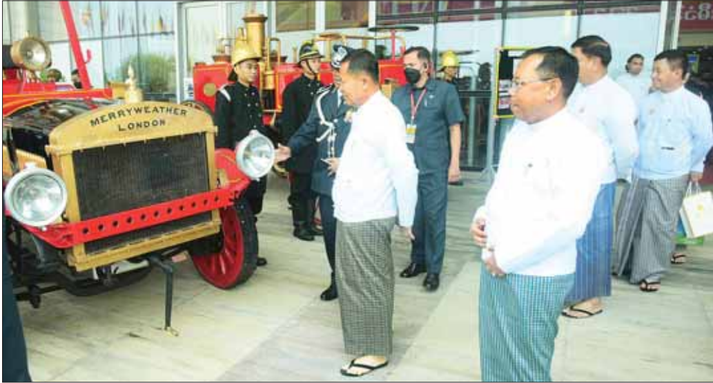
နိုင်ငံတော်စီမံအုပ်ချုပ်ရေးကောင်စီဥက္ကဋ္ဌ ဒုတိယဝန်ကြီးချုပ် ဒုတိယဗိုလ်ချုပ်မှူးကြီး စိုးဝင်းနှင့်အဖွဲ့ဝင်များ (၇၇) နှစ်မြောက် မြန်မာနိုင်ငံစီမံသတ်တပ်ဖွဲ့နေ့အခမ်းအနားတွင် ခင်းကျင်းပြသထားသည့် ရှေးဟောင်းစီမံသတ်ယာဉ်များကို ကြည့်ရှုစစ်ဆေးစဉ်။

စီးဘေးလုံခြုံရေးနှင့် ရှာဖွေကယ်ဆယ်ရေး လုပ်ငန်းများ ဆောင်ရွက်မှုကဏ္ဍတွင် "Some People Run to Problem, Another Run to Again We Know Hero" ဟူသည့်အစဉ်း "လူတစ်ချို့ ဟာ ပြဿနာနဲ့ဝေးရာကို ပြေးကြပြီး ပြဿနာကို