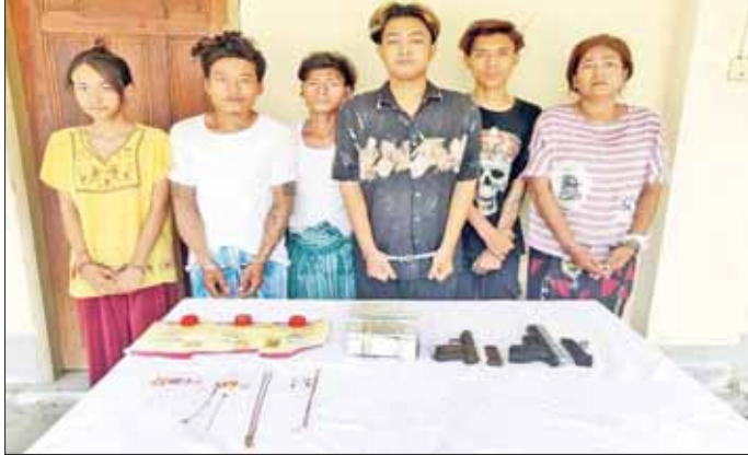
ဓားပြတိုက်ရာတွင် ပါဝင်ခဲ့သည့် တရားခံများနှင့် သိမ်းဆည်း ရမိခဲ့သည့် လက်နက်/ခဲယမ်း၊ ငွေကြေးနှင့် ရွှေထည်ပစ္စည်းများ၏ မှတ်တမ်းဓာတ်ပုံ။

တိုက်လုယက်ရာတွင် အသုံးပြုခဲ့ သည့် ပစ္စတိုနှစ်လက်၊ ကျည်အိမ် နှစ်ခု၊ ပြိုင်-၃၈၀ ကျည် နှစ်တောင့်၊ ငွေကျပ် သိန်း ၂၀၀၊ ရွှေထည်ပစ္စည်း များ၊ ပုံစံဖျက်ထားသည့် ရွှေ မျိုးစုံ ၁၆ ခု (ကာလတန်ဖိုး ၆၀ သိန်း ၉ သောင်းကျပ်) တို့နှင့်အတူ ဖမ်းဆီးရမိခဲ့သည်။