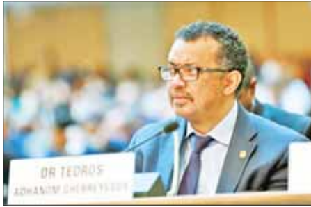
ကမ္ဘာ့ကျန်းမာရေးအဖွဲ့ကြီး၏ ညွှန်ကြားရေးမှူးချုပ် တက်ဒရိုစ် အက်ဒါဟာနွန်ဂီဘာရီ ယက်ဆု။

ဂျီနီဗာမြို့၌ ပြုလုပ်သည့် အစည်းအဝေးတွင် ကမ္ဘာ့ကျန်းမာရေး အဖွဲ့ကြီး၏ညွှန်ကြားရေးမှူးချုပ် တက်ဒရိုစ် အက်ဒါဟာနွန်ဂီဘာရီ ယက်ဆုက ယခုလို ကြေညာခဲ့ခြင်းဖြစ်သည်။ ကမ္ဘာ့ကျန်းမာရေးအဖွဲ့ကြီး