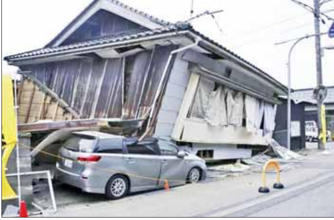
အင်အားပြင်းငလျင်လှုပ်မှုကြောင့် ကားတစ်စီးပေါ်သို့ အိမ်ပြိုကျနေသည့်ကို တွေ့ရစဉ်။

မေ ၅ ရက်တွင် ဒေသ စံတော်ချိန် ညနေ ၂ နာရီ ၄၂ မိနစ် ၀၈ နှစ်ကျင်က ပြင်းအား ၆ အဆင့်ရှိ ငလျင်လှုပ်ခဲ့ကြောင်း သိရသည်။ အဆိုပါ ငလျင်မှာ နို့တိုဒေသ အတွင်း အနက် ၂ ကီလိုမီတာကို