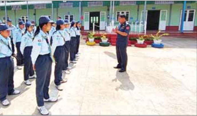
စုစုပေါင်း ၄၀၂ ရန်ကုန်တိုင်းဒေသကြီး မင်္ဂလာဒုံမြို့ရှိ လေကြောင်းလူငယ် သင်တန်းစခန်းမှ သင်တန်းသား သင်တန်းသူ စုစုပေါင်း ၄၀၂၊ မကွေးတိုင်း ဒေသကြီး မကွေးမြို့ရှိ လေကြောင်းလူငယ် သင်တန်းစခန်းမှ သင်တန်း သား သင်တန်းသူ စုစုပေါင်း ၄၀၂၊ မန္တလေးတိုင်းဒေသကြီး မိတ္ထီလာမြို့ရှိ လေကြောင်းလူငယ်သင်တန်းစခန်းမှ သင်တန်းသား သင်တန်းသူ စုစုပေါင်း ၄၀၂၊ ရှမ်းပြည်နယ်(အရှေ့ပိုင်း) ကျိုင်းတုံမြို့ရှိ လေကြောင်း လူငယ်သင်တန်းစခန်းမှ သင်တန်းသား သင်တန်းသူ စုစုပေါင်း ၄၀၂၊ ရှမ်းပြည်နယ်(တောင်ပိုင်း) တောင်ကြီးမြို့ရှိ လေကြောင်းလူငယ် သင်တန်းစခန်းမှ သင်တန်းသား သင်တန်းသူ စုစုပေါင်း ၄၀၂ တို့ကို သက်ဆိုင်ရာနယ်မြေအသီးသီးမှ တာဝန်ရှိသူကဏ္ဍများက လေ့ကျင့် သင်ကြားပေးလျက်ရှိပြီး သက်ဆိုင်ရာမြို့နယ်များရှိ တပ်မတော် (လေ) လေကြောင်း လူငယ်သင်တန်းစခန်း ၁၇ ခု၌ သင်တန်းသား သင်တန်းသူ စုစုပေါင်း ၆၈၀ တို့ကို လေ့ကျင့်သင်ကြားပေးလျက်ရှိသည်။

တပ်မတော်(ရေး)က ရေကြောင်း လူငယ်သင်တန်းသား သင်တန်း သူများအား လေ့ကျင့်သင်ကြား ပေးစဉ်။