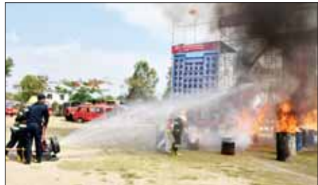
ချယ်ရီမြေ(မူဆယ်)

မြို့နယ်မီးသတ် တပ်ဖွဲ့ဝင်များ၏ မီးငြိမ်းသတ်ရေး၊ ရှာဖွေ ကယ်ဆယ်ရေး၊ အထပ်မြင့် အဆောက်အအုံများတွင် အသက် ကယ်ခြင်းများအား သရုပ်ဖော် ပြသသည်။ (ယာပုံ) ဆက်လက်၍ (၇၇)နှစ်မြောက် မြန်မာနိုင်ငံ မီးသတ်တပ်ဖွဲ့နေ့ကို ဂုဏ်ပြုသောအားဖြင့် မီးသတ်