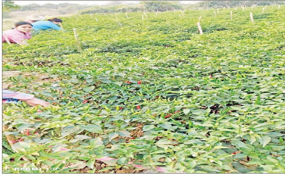
အစုံ တစ်ပိဿာလျှင် ငွေကျပ် ၃၀၀၀ ဈေးနှုန်းများဖြင့် လည်း အခြားငရုတ်များထက် အထွက်နှုန်းကောင်းပြီး အရောင်းအဝယ်ဖြစ်လျက်ရှိကြောင်း၊ တိုးတိုးအောင် ဈေးနှုန်းပိုမိုရရှိကြောင်း သတင်းရရှိသည်။ ငရုတ်သည် စိုက်ပျိုးမှုကုန်ကျစရိတ်များသော် DOCA(မန္တလေး)

စိုက်ပျိုးမှုကုန်ကျစရိတ်များသော်လည်း အထွက်နှုန်းကောင်းပြီး ဈေးကောင်းရရှိသော တိုးတိုးအောင် ငရုတ်မျိုးများကို ယခုနှစ်တွင် စတင်စိုက်ပျိုးလာကြကြောင်း၊ တိုးတိုးအောင်ငရုတ်တစ်ဧက ကုန်ကျစရိတ်အနေဖြင့် စတင်စိုက်ပျိုးသည့် ဒီဇင်ဘာလမှစတင် ခူးဆွတ်သည့် မတ်လဆန်းအထိ မျိုး၊ သွင်းအားစု၊ လုပ်သားခ၊ စုစုပေါင်း ငွေကျပ် ၃၀-၃၅ သိန်းခန့် ကုန်ကျကြောင်း သိရသည်။ ယခုအချိန်တွင် ငရုတ်သီးများ လှိုင်လှိုင်ထွက်ရှိနေပြီဖြစ်ကြောင်း၊ ငရုတ်သီးခူးဆွတ်ရာတွင် ၃-၅ ရက်ခြား တစ်ကြိမ်ခူးဆွတ်ရကြောင်း၊ အထွက်နှုန်းအနေဖြင့် စတင်ခူးဆွတ်ချိန်တွင် ပိဿာ ၂၀၀ ခန့် ထွက်ရှိကြောင်း၊ ယခုအချိန်တွင် ပိဿာ ၅၀၀-၆၀၀ ခန့် ထွက်ရှိနေပြီဖြစ်ကြောင်း၊ ဈေးနှုန်းအနေဖြင့် တိုးတိုးအောင်ငရုတ်သီးအစုံ တစ်ပိဿာလျှင် ငွေကျပ် ၄၀၀၀-၄၂၀၀ ရှိပြီး အခြားငရုတ်သီးများမှာ