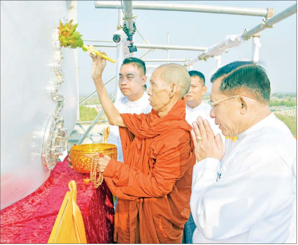
မာရဝိဇယဗုဒ္ဓရုပ်ပွားတော်မြတ်ကြီးတည်ဆောက်ရေး ဩဝါဒါစရိယ ပျဉ်းမနားမြို့ မင်္ဂလာဇေယျူ ပါဠိ တက္ကသိုလ်ကျောင်းတိုက် ပဓာနနာယက ဆရာတော် အဂ္ဂမဟာပဏ္ဍိတ အဂ္ဂမဟာ သဒ္ဓမ္မဇောတိကဇော တာဒန္တဝိမလဗုဒ္ဓိ ဥဏ္ဍလုံမွေးရှင်တော်အား အမွှေးနံ့သာရည်များ ပက်ဖျန်းပူဇော်စဉ်။