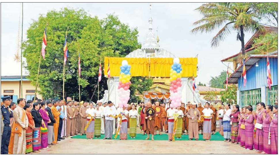
ယင်းနောက် သံဃာတော်များ၊ တိုင်းမှူးနှင့် တာဝန်ရှိသူများက နှစ်(၁၀၀)ပြည့် ပွဲတော်အထိမ်းအမှတ်အဖြစ် ဗုဒ္ဓဝင်ပြခန်းကို ဖဲကြိုးဖြတ်ဖွင့်လှစ်ကြပြီး ဗုဒ္ဓဝင်ပြခန်းများကို လှည့်လည်ကြည့်ရှုကြသည်။ ဆက်လက်၍ ဟံသာမုနိမာရဇိန်ဘုရားကြီးအား လုံးတော်ပြည့် ရွှေသင်္ကန်းကပ်လှူခြင်းနှင့် နှစ်(၁၀၀)ပြည့် ပွဲတော်ရေစက်ချအလှူတော်မင်္ဂလာကို ကျင်းပပြုလုပ်ရာ နိုင်ငံတော်ဩဝါဒါစရိယ ရှမ်းပြည်နယ် လွိုင်လင်မြို့ သာသနာဝိပုလ ဓာတ်တော်ကျောင်းတိုက်ဦးစီးပဓာနနာယက ဆရာတော်ထံမှ ငါးပါးသီလခံယူစောင့်တည်ပြီး သံဃာတော်များက ရွတ်ပွားချီးမြှင့်တော်မူသော ပရိတ်တရားတော်များကို နာယူကြကာ တိုင်းမှူးနှင့် စေတနာရှင် အလှူရှင်များက သံဃာတော်များအား လှူဖွယ်ပစ္စည်းများနှင့် အလှူငွေများအား ဆက်ကပ်လှူဒါန်းကြသည်။ ထို့နောက် မိုင်းရှူးမြို့ရှိ ဟံသာမုနိမာရဇိန် ဘုရားကြီးအား လုံးတော်ပြည့်ရွှေသင်္ကန်းကပ်လှူခြင်းနှင့် နှစ်(၁၀၀)ပြည့်ပွဲတော်အဖြစ်မြောက်ရေးအတွက် စေတနာရှင်အလှူရှင်များ၏ လှူဒါန်းမှုစာရင်းများကို တာဝန်ရှိသူတစ်ဦးက ဖတ်ကြားလျှောက်ထားပြီး လှူဒါန်းမှု အစုစုအတွက် ရေစက်သွန်းချ အမျှဝေကြကာ

မြို့မိ မြို့ဖများ၊ လူမှုရေးအသင်းအဖွဲ့များ၊ ဒေသခံတိုင်းရင်းသား ပြည်သူများနှင့် စေတနာရှင် အလှူရှင်များ တက်ရောက်ကြသည်။ ဦးစွာ တိုင်းမှူးက ဟံသာမုနိမာရဇိန်ဘုရားကြီးအား ပန်း၊ ဆီမီး၊ ရေချမ်း၊ သစ်သီး၊ ဆွမ်းတို့ဖြင့် ဆက်ကပ်လှူဒါန်းသည်။ ထို့နောက် နိုင်ငံတော်ဩဝါဒါစရိယ ရှမ်းပြည်နယ် လွိုင်လင်မြို့ သာသနာဝိပုလ ဓာတ်တော်ကျောင်းတိုက် ဦးစီးပဓာနနာယက ဆရာတော်၊ တိုင်းမှူးနှင့် တာဝန်ရှိသူများက မိုင်းရှူးမြို့ရှိ ဟံသာမုနိမာရဇိန်ဘုရားကြီးအား လုံးတော်ပြည့် ရွှေသင်္ကန်းကပ်လှူခြင်းနှင့် နှစ်(၁၀၀)ပြည့် ပွဲတော်အထိမ်းအမှတ်မုခ်ဦးအား ဖဲကြိုးဖြတ်ဖွင့်လှစ်ပေးပြီး (ယာပုံ) သံဃာတော်များက “ဇယန္တောဗောဓိယာမူလေ” ဇယမင်္ဂလာ အောင်ဂါထာတော်အား (၃) ကြိမ် ရွတ်ဆိုကာ မုခ်ဦးအား အမွှေးနံ့သာရည်များဖြင့် ပက်ဖျန်းကြသည်။