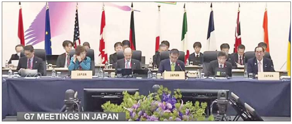
ဂျီ - ၇ မှ ဒစ်ဂျစ်တယ်နှင့် နည်းပညာဆိုင်ရာဝန်ကြီးများ အစည်းအဝေးပြုလုပ်စဉ်။