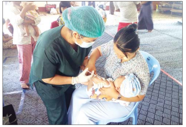
ကလေးငယ်များအား တိုးချဲ့ကာကွယ်ဆေးထိုးနှံပေးလျက်ရှိရာ မျှော်သိရိမြို့နယ် ဝဏ္ဏသိဒ္ဓိရပ်ကွက် ဓမ္မရက္ခိတမ္ဗရာဇ် မေ ၁ ရက် က ကလေးငယ်တစ်ဦးအား ကာကွယ်ဆေးထိုးနှံပေးစဉ်။ ၀၁၄

နိုင်ငံ အဝန်း သစ်တော စွမ်းဖြင့် စိမ်းလန်း စေရမည်