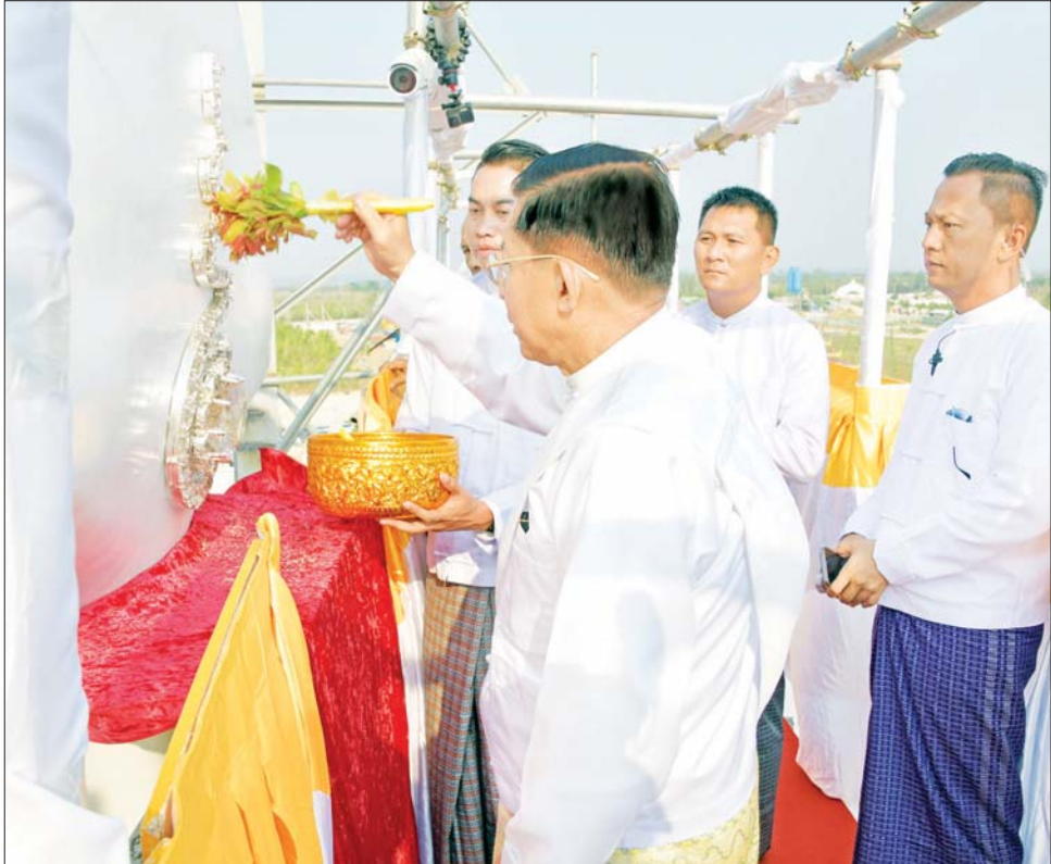
နိုင်ငံတော်စီမံအုပ်ချုပ်ရေးကောင်စီဥက္ကဋ္ဌ နိုင်ငံတော်ဝန်ကြီးချုပ် ဗိုလ်ချုပ်မှူးကြီး မင်းအောင်လှိုင် ဥဏ္ဍလုံ မွေးရှင်တော်အား အမွှေးနံ့သာရည်များ ပက်ဖျန်းပူဇော်စဉ်။

စာမျက်နှာ ၃ မှ ရတနာရွှေမိုးငွေမိုးများ ရွာသွန်းပြီး ယင်းနောက် “ဗုဒ္ဓသာသနံ စိရိတိဋ္ဌတု” သုံးကြိမ် ရွတ်ဆိုဆုတောင်း၍ အခမ်းအနားကို ရုပ်သိမ်းပြီး နိုင်ငံတော်စီမံအုပ်ချုပ်ရေးကောင်စီဥက္ကဋ္ဌ နိုင်ငံတော် ဝန်ကြီးချုပ်နှင့် ဇနီးတို့က အခမ်းအနားအောင်မြင်ခြင်း အထိမ်းအမှတ် ရတနာရွှေမိုးငွေမိုးများ ရွာသွန်းပြီး ကြသည်။ သဗ္ဗညုဘုရားရှင်တို့၏ လက္ခဏာတော်ကြီး ၃၂ပါးတွင်ပါဝင်သည့် ဥဏ္ဍလုံမွေးရှင်တော်ဟူသည့်