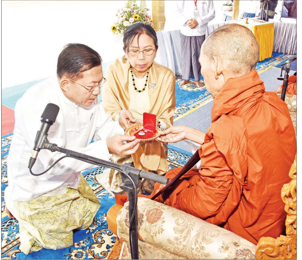
နိုင်ငံတော်စီမံအုပ်ချုပ်ရေးကောင်စီဥက္ကဋ္ဌ နိုင်ငံတော်ဝန်ကြီးချုပ် ဗိုလ်ချုပ်မှူးကြီး မင်းအောင်လှိုင်နှင့် ဇနီး ဒေါ်ကြူကြူလှ မာရဝိဇယ ဗုဒ္ဓရုပ်ပွားတော်မြတ်ကြီးအား ဥက္ကလုံမွေးရှင်တော်အဖြစ် စီသွင်းပူဇော် မည့် စိန်ရတနာများကို သက်တော်ထင်ရှား သဗ္ဗညုဘုရားရှင်အား ရည်မှန်းပြီး ပါဠိဆရာတော်ကြီးထံ သာဟတ္ထိကဒါနမြောက် ကိုယ်တိုင်လက်ရောက် ဆက်ကပ်လှူဒါန်း ပူဇော်စဉ်။

ဂါထာတော်နှင့် သဗ္ဗသင်္ဂါဟက မေတ္တာပို့ လင်္ကာ နှစ်ပိုဒ်ကို သံပြိုင်ညီညာ သုံးကြိမ်ရွတ်ဆိုပူဇော်ကြ သည်။ သာဓုအနုမောဒနာခေါ်ဆို ထို့နောက် ဦးဆောင်ဘုရားဒါယကာ နိုင်ငံတော် စီမံအုပ်ချုပ်ရေးကောင်စီဥက္ကဋ္ဌ နိုင်ငံတော်ဝန်ကြီးချုပ် ဗိုလ်ချုပ်မှူးကြီး မင်းအောင်လှိုင်နှင့် ဇနီး ဒေါ်ကြူကြူလှတို့က မာရဝိဇယ ဗုဒ္ဓရုပ်ပွားတော်မြတ် ကြီးအား ဥက္ကလုံမွေးရှင်တော်အဖြစ် စီသွင်းပူဇော် မည့် စိန်ရတနာများကို သက်တော်ထင်ရှား သဗ္ဗညု ဘုရားရှင်အား ရည်မှန်းပြီး ပါဠိဆရာတော်ကြီးထံ သာဟတ္ထိကဒါနမြောက် ကိုယ်တိုင်လက်ရောက် ဆက်ကပ်လှူဒါန်း ပူဇော်ကြကာ ပါဠိဆရာတော်ကြီး က ချီးမြှင့်တော်မူသည့် ဥက္ကလုံမွေးရှင်တော်ဆိုင်ရာ ဓမ္မကထာကို နာယူတော်မူကြပြီး ဥက္ကလုံမွေးရှင်တော် လက္ခဏာတော် ဘုရားရိုးလင်္ကာကို ရွတ်ဆိုပူဇော်၍ သာဓုအနုမောဒနာ ခေါ်ဆိုကြသည်။ ယင်းနောက် ပါဠိဆရာတော်ကြီးနှင့် ဦးဆောင် ဘုရားဒါယကာ နိုင်ငံတော်စီမံအုပ်ချုပ်ရေးကောင်စီ ဥက္ကဋ္ဌ နိုင်ငံတော်ဝန်ကြီးချုပ်တို့သည် ဥက္ကလုံမွေးရှင်