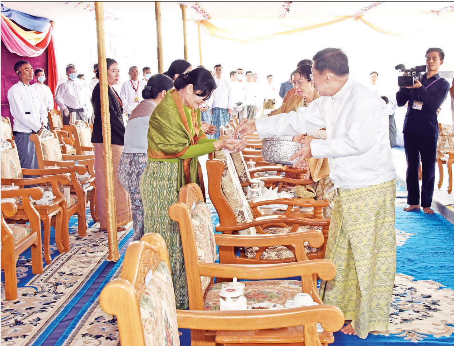
ဦးဆောင်ဘုရားဒါယကာ နိုင်ငံတော်စီမံအုပ်ချုပ်ရေးကောင်စီဥက္ကဋ္ဌ နိုင်ငံတော်ဝန်ကြီးချုပ် ဗိုလ်ချုပ်မှူးကြီး မင်းအောင်လှိုင်နှင့်ဇနီး ဒေါ်ကြူကြူလှတို့ အခမ်းအနားအောင်မြင်ခြင်းအထိမ်းအမှတ် ရတနာရွှေမိုးငွေမိုးများ ရွာသွန်းပြီးစဉ်။

ထည့်သွင်းတည်ဆောက်လျက်ရှိ ထိုကဲ့သို့ ရုပ်ပွားတော်မြတ်ကြီး ထုဆစ်နေသည့် နည်းတူ သာသနိက အဆောက်အအုံများစွာကိုလည်း ထည့်သွင်းတည်ဆောက်လျက်ရှိပြီး ယခုအခါ သာသနိက အဆောက်အအုံများနှင့် ဗုဒ္ဓဥယျာဉ် တည်ဆောက်မှုမှာ ၈၂ ဒသမ ၃ ရာခိုင်နှုန်းခန့် ပြီးစီးပြီဖြစ်ကြောင်း သတင်းရရှိသည်။ သတင်းစဉ်