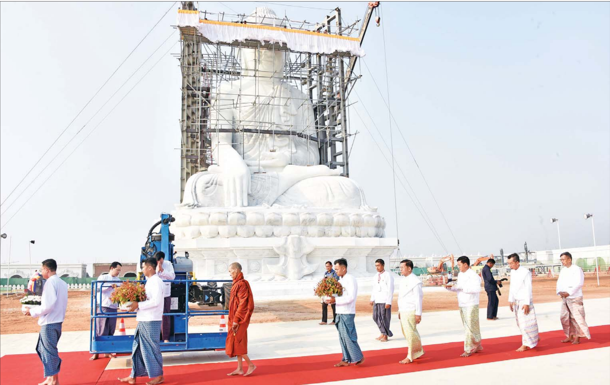
ပါဠိဆရာတော်ကြီးနှင့် ဦးဆောင်ဘုရားဒါယကာ နိုင်ငံတော်စီမံအုပ်ချုပ်ရေးကောင်စီဥက္ကဋ္ဌ နိုင်ငံတော်ဝန်ကြီးချုပ် ဗိုလ်ချုပ်မှူးကြီး မင်းအောင်လှိုင်တို့ ဥဏ္ဍလုံမွေးရှင်တော် စီသွင်းပူဇော်မည့် မင်္ဂလာနေရာသို့တက်ရောက် နေရာယူကြစဉ်။