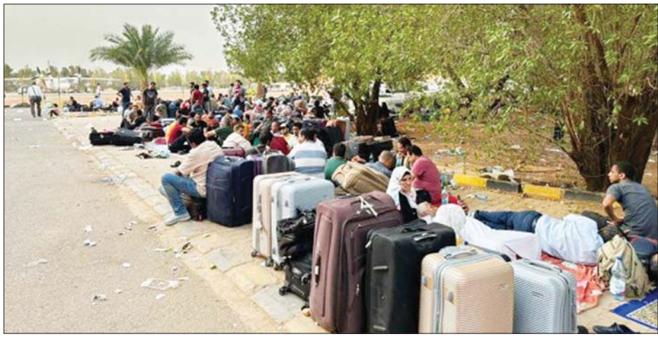
ဆူဒန်နိုင်ငံ အွန်ဒါးမန်းမြို့ရှိ လေဆိပ်တစ်ခုအနီး ဘေးလွတ်ရာသို့ ပြောင်းရွှေ့ရန် စောင့်ဆိုင်းနေကြသူ များကို ဧပြီ ၂၆ ရက်က တွေ့ရစဉ်။

ရပ်စဲရေးကို နောက်ထပ် ၇၂ နာရီ သက်တမ်းတိုး ကြောင်း ကြေညာလိုက်သည်။ လူသားချင်း စာနာထောက်ထားမှုဆိုင်ရာ ဖြတ်သန်းသွားလာမှုရရှိရန် နိုင်ငံသားများ ရွှေ့ပြောင်း သွားလာရာတွင် လွယ်ကူချောမွေ့စေရန်နှင့် ဘေးလွတ် ရာသို့ရောက်ရှိရန် ပစ်ခတ်တိုက်ခိုက်မှုရပ်စဲရေးကို သက်တမ်းတိုးခြင်းဖြစ်ကြောင်း RSF က ပြောသည်။ လက်ရှိအချိန်အထိ ဆူဒန်ကျွန်းမာရေးဝန်ကြီး ဌာန၏ ထုတ်ပြန်ချက်အရ နှစ်ဖွဲ့ပစ်ခတ်တိုက်ခိုက်မှု အတွင်း သေဆုံးသူ ၅၀၀ ကျော်နှင့် ထိခိုက်ဒဏ်ရာ ရရှိသူ ၄၀၀၀ ကျော်ရှိကြောင်း သိရသည်။ ဆင်ဟွာ