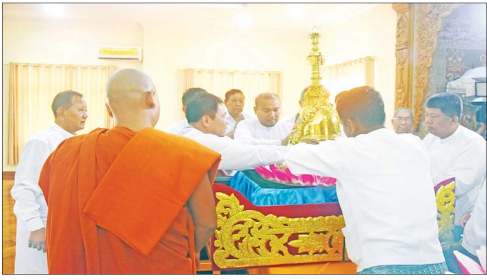
ဆောက်တည်ကြပြီး သင်္ကန်းနှင့်လှူဖွယ်ပစ္စည်းများ ဆက်ကပ်လှူဒါန်းကြသည်။ ထို့နောက် မြတ်ဗုဒ္ဓစွယ်တော်ပွားနှစ်ဆူအား တောင်ငူမြို့အတွင်း လှည့်လည်ပင့်ဆောင်အပူဇော်ခံကာ မော်တော်ယာဉ်များဖြင့် သမိုင်းဝင်ရွှေဆံတော်စေတီတော်မြတ်ကြီး ရင်ပြင်တော်ရှိ စွယ်တော်မြတ်

နေပြည်တော် မေ ၁ သီရိလင်္ကာနိုင်ငံနှင့် တရုတ်ပြည်သူ့သမ္မတနိုင်ငံတို့မှ ပွားယူပင့်ဆောင်ထားသည့် ဗုဒ္ဓမြတ်စွယ်တော် နှစ်ဆူအား ခေတ္တကိန်းဝပ်စံပယ်တော်မူရာ သီတဂူကေတုမတီဗုဒ္ဓတက္ကသိုလ်မှ တောင်ငူမြို့ သမိုင်းဝင် ရွှေဆံတော်စေတီတော်မြတ်ကြီး ရင်ပြင်တော်ရှိ စေတနာရှင် အလှူရှင်များ ဆောက်လုပ်လှူဒါန်းထားသည့် စွယ်တော်မြတ်နှစ်ဆူ ကိန်းဝပ်စံပယ်အပူဇော်ပွဲကို ယနေ့နံနက်ပိုင်းက သီတဂူကေတုမတီဗုဒ္ဓတက္ကသိုလ်ရှိ ပဋိသောတဂါမိနိဓမ္မမိမာန်တော်၌ ပြုလုပ်ရာ တောင်ပိုင်းတိုင်းစစ်ဌာနချုပ် တိုင်းမှူး ဗိုလ်ချုပ် ထိန်ဝင်းနှင့် အဖွဲ့ဝင်များ၊ စေတနာရှင် အလှူရှင်များ တက်ရောက်ကြသည်။