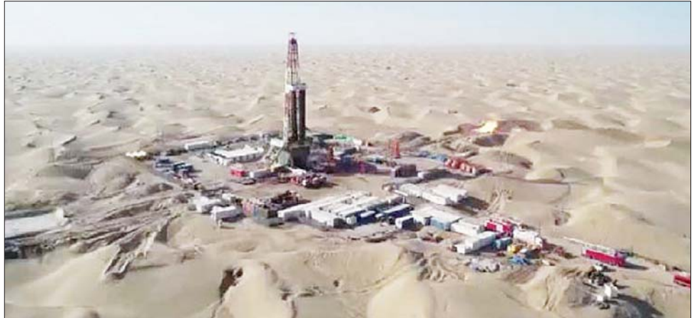
တာ့ခီလီမာကန် သဲကန္တာရအစွန်းတွင်ရှိသည့် ရေနံနှင့်သဘာဝဓာတ်ငွေ့လုပ်ငန်းကို တွေ့ရစဉ်။

ဦးဆောင်၍ တရုတ်နိုင်ငံ အနောက် ဒေသ၏ အနက်ရှိုင်းဆုံး ရေနံနှင့် မြောက်ပိုင်း ရှင်ကျန်းပီဂါ ကိုယ်ပိုင် သဘာဝဓာတ်ငွေ့ တွင်းတူးဖော်မှု အုပ်ချုပ်ခွင့်ရဒေသတွင် အာရှ ကိုမေ ၁ ရက်က စတင်ဆောင်ရွက်