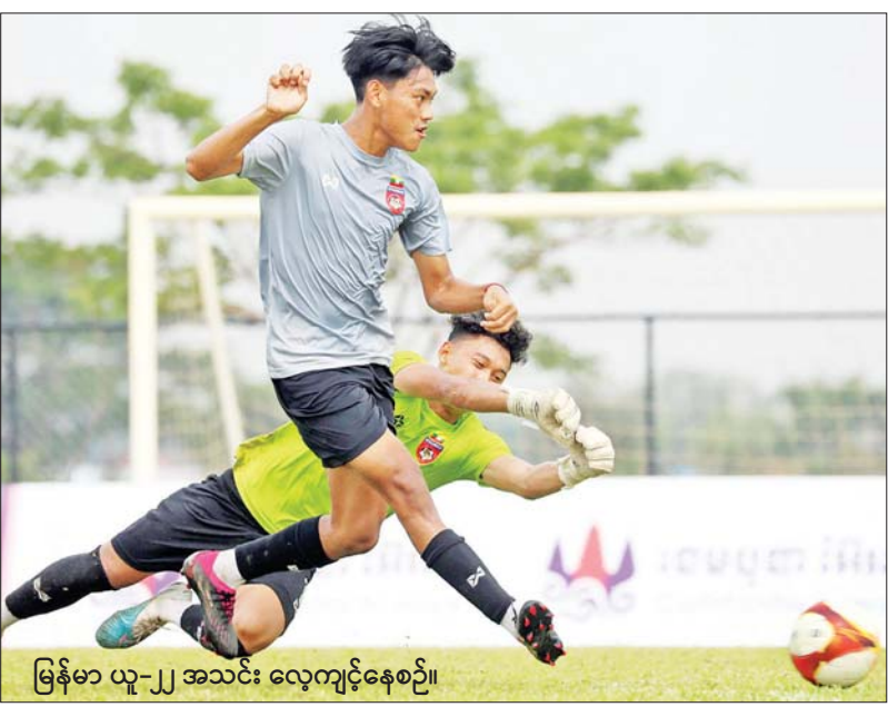
မြန်မာ ယူ-၂၂ အသင်း လေ့ကျင့်နေစဉ်။

ရန်ကုန် မေ ၁ ကမ္ဘောဒီးယားနိုင်ငံက အိမ်ရှင်အဖြစ်လက်ခံကျင်းပ လျက်ရှိသည့် (၃၂) ကြိမ်မြောက် ဆီးဂိမ်းအမျိုးသား ဘောလုံးပြိုင်ပွဲ အုပ်စု (က) ဒုတိယနေ့ကို မေ ၂ ရက် (ယနေ့) ဆက်လက်ကျင်းပမည်ဖြစ်သည်။ အုပ်စု (က) ဒုတိယနေ့အဖြစ် ယနေ့မြန်မာစံတော်ချိန် မွန်းလွဲ ၃ နာရီခွဲတွင် မြန်မာနှင့် တီမော၊ မြန်မာ စံတော်ချိန် ညနေ ၆ နာရီခွဲတွင် အိမ်ရှင် ကမ္ဘောဒီးယားနှင့် ဖိလစ်ပိုင်အသင်းတို့ ယှဉ်ပြိုင် ကစားမည်ဖြစ်သည်။ မြန်မာအသင်းသည် ပထမပွဲစတင်ကစားရခြင်း ဖြစ်သော်လည်း ကျန်သုံးသင်းမှာမူ ဒုတိယပွဲယှဉ်ပြိုင် ရခြင်းဖြစ်သည်။ အုပ်စု (က) ဒုတိယနေ့တွင် အင်ဒို နီးရှားပွဲစဉ် မပါဝင်ဘဲ ကျန်လေးသင်း ယှဉ်ပြိုင်ခြင်း ဖြစ်သည်။ မြန်မာအသင်းသည် အုပ်စုပထမပွဲအဖြစ် စာမျက်နှာ ၉ ကော်လံ ၁ ၀