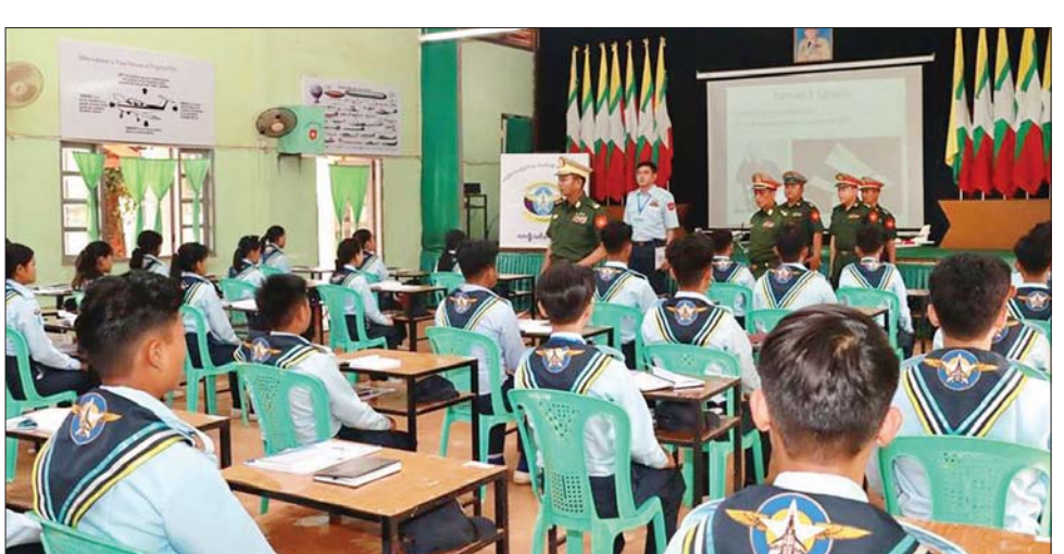
သင်တန်းသား သင်တန်းသူ ၄၀ ၊ မန္တလေးတိုင်းဒေသကြီး မန္တလေး မြို့ရှိ လေကြောင်းလူငယ်စခန်းမှ သင်တန်းသား သင်တန်းသူ ၄၀ ၊ မိတ္ထီလာမြို့ရှိ လေကြောင်းလူငယ် စခန်းမှ သင်တန်းသား သင်တန်း သူ စုစုပေါင်း ၄၀နှင့် ပဲခူးတိုင်း ဒေသကြီး တောင်ငူမြို့ရှိ လေကြောင်း လူငယ်စခန်းမှ သင်တန်းသား သင်တန်းသူစုစု ပေါင်း ၄၀ တို့ကို သက်ဆိုင်ရာ နယ်မြေအသီးသီးမှ တာဝန်ရှိသူ နည်းပြများက လေ့ကျင့်သင်ကြား ပေးလျက်ရှိပြီး သက်ဆိုင်ရာ သင်တန်းစခန်း သင်တန်းသား သင်တန်းသူ အင်အား ၆၈၀ ဖြင့် သက်ဆိုင်ရာ နယ်မြေအသီးသီး အလိုက် လေ့ကျင့်သင်ကြားပေး လျက်ရှိသည်။ ကြည့်ရှုအားပေး ထိုသို့ ရေကြောင်းလူငယ် အခြေခံနှင့် တန်းမြင့်သင်တန်းများ၊ အခြေခံ လေကြောင်းလူငယ် သင်တန်း (အကြီးတန်းအဆင့်) နှင့် အခြေခံလေကြောင်းလူငယ် သင်တန်း(အငယ်တန်းအဆင့်) သင်တန်းများ လေ့ကျင့်သင်ကြား ပို့ချနေမှုများကို သက်ဆိုင်ရာ တိုင်းစစ်ဌာနချုပ် အသီးသီးမှ တိုင်းမှူးများနှင့် တာဝန်ရှိသူများ က သွားရောက်ကြည့်ရှုအားပေး ကာ လိုအပ်သည်များ ညှိနှိုင်း ဆောင်ရွက် ပေးခဲ့ကြောင်း သတင်းရရှိသည်။ သတင်းစဉ်

စခန်းမှ သင်တန်းသား သင်တန်း သူ ၅၀ တို့ကို သက်ဆိုင်ရာ နယ်မြေအသီးသီးမှ တာဝန်ရှိသူ နည်းပြများက လေ့ကျင့်သင်ကြား ပေးလျက်ရှိပြီး သက်ဆိုင်ရာ မြို့နယ်များရှိ တပ်မတော် (ရေ) ရေကြောင်းလူငယ်စခန်း ၁၁ ခုမှ သင်တန်းသား သင်တန်းသူ စုစုပေါင်း ၇၁၅ ဦးတို့ကို လေ့ကျင့် သင်ကြားပေးလျက်ရှိသည်။ လေကြောင်းလူငယ်သင်တန်း အလားတူ တပ်မတော်(လေ) က အခြေခံလေကြောင်း လူငယ် သင်တန်း (အကြီးတန်းအဆင့်) နှင့် အခြေခံလေကြောင်းလူငယ် သင်တန်း (အငယ်တန်းအဆင့်) သင်တန်းများကို ကချင်ပြည်နယ် မြစ်ကြီးနားမြို့ရှိ လေကြောင်း လူငယ်စခန်းမှ သင်တန်းသား သင်တန်းသူ စုစုပေါင်း ၄၀၊ ရှမ်း ပြည်နယ်(မြောက်ပိုင်း) လားရှိုး မြို့ရှိ လေကြောင်းလူငယ်စခန်းမှ သင်တန်းသား သင်တန်းသူ ၄၀ ၊ ဧရာဝတီတိုင်းဒေသကြီး ပုသိမ်မြို့ ရှိ လေကြောင်းလူငယ်စခန်းမှ