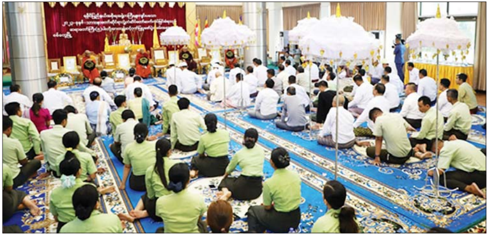
နဝကမ္မအလှူငွေများ ဆက်ကပ် ကလျာဏထံမှအနုမောဒနာတရား လှူဒါန်းကြပြီးသံတွဲမြို့ မဟာဇောမိ နာကြားကာ လှူဒါန်းမှုအစုစုတို့ စာသင်တိုက်ဆရာတော် ဘဒ္ဒန္တ အတွက် ရေစက်သွန်းချ အမျှပေး ဝေကြ၍ သံဃာတော်များအား နေ့ဆွမ်းဆက်ကပ်လှူဒါန်းကြောင်း သတင်းရရှိသည်။ သတင်းစဉ်

ကျောင်းတိုက် ပဓာနနာယက ဆရာတော် ဘဒ္ဒန္တဣန္ဒာစရိယ ထံမှ ငါးပါးသီလခံယူဆောက် တည်ကြသည်။ ထို့နောက် ကျောက်ဖြူမြို့နယ်ကျောင်းတိုက် ပဓာန နာယကဆရာတော်က သမ္မောဒနီယ ဩဝါဒကထာ မိန့်ကြား ချီးမြှင့်တော်မူသည်။ ယင်းနောက် ပြည်နယ်ဝန်ကြီး ချုပ်၊ တိုင်းမှူးနှင့် တက်ရောက်လာ ကြသူများက သာသနာတော် ဆိုင်ရာဘွဲ့တံဆိပ်တော် ဆက်ကပ် ခြင်းခံရသည့် ဆရာတော်ကြီး များအား ထပ်ဆင့်ဂုဏ်ပြုလွှာ များ၊ လှူဖွယ်ဝတ္ထုပစ္စည်းများနှင့်