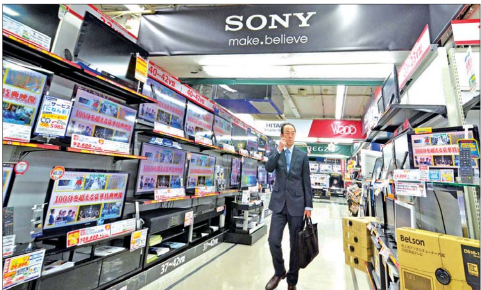
နှုန်း တိုးတက်ခဲ့သည်။ ၆၄ ထရီလီယံမှ ၃၃ ရာခိုင်နှုန်း ချိတ်ဆက် ဝန်ဆောင်မှုကဏ္ဍတွင် သည် မတ်လအထိ တစ်နှစ်တာ တွင် PlayStation 5 ဗီဒီယို ဂိမ်းစက် ၁၉ ဒသမ ၁ သန်းဖိုး ရောင်းချနိုင်ခဲ့ပြီး ယခင်နှစ်ထက် အလုံးစုံ ၇ ဒသမ ၆ သန်းအထိ ပိုမိုရောင်းချခဲ့ရသည်။ ဆင်ဟွာ

အဆိုပါ ဂျပန်အိတ်ကုမ္ပဏီနှင့် ဖျော်ဖြေရေး ကုမ္ပဏီကြီးသည် ယခုမတ်လတွင် ကုန်ဆုံးခဲ့သည့် ဘဏ္ဍာနှစ်အတွက် အမြတ်ငွေ ယန်း ၉၃၇ ဒသမ ၁၃ ဘီလီယံရှိပြီး ယခင်နှစ်ကထက် ၆ ဒသမ ၂ ရာခိုင်နှုန်း တိုးတက်လာကာ ၎င်း၏ လုပ်ငန်းလည်ပတ်မှု အမြတ်မှာ ယန်း ၁ ဒသမ ၂၁ ထရီလီယံအထိ ၀ ဒသမ ၅ ရာခိုင်