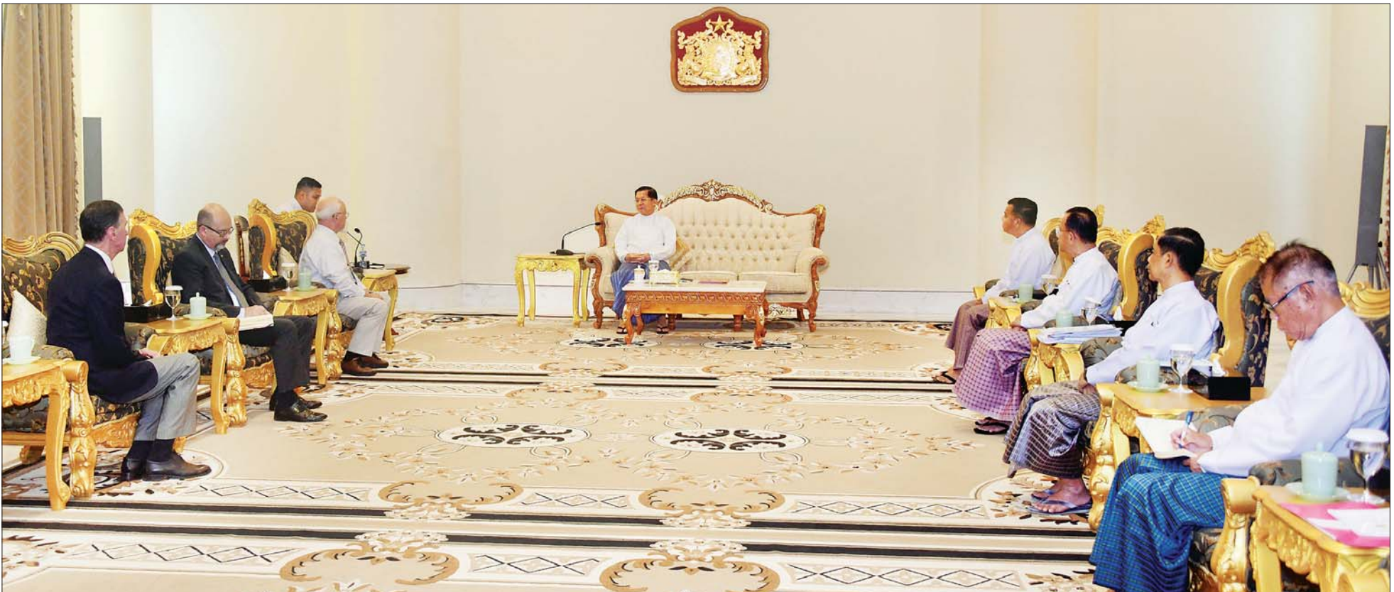
နိုင်ငံတော်စီမံအုပ်ချုပ်ရေးကောင်စီဥက္ကဋ္ဌ နိုင်ငံတော်ဝန်ကြီးချုပ် ဗိုလ်ချုပ်မှူးကြီး မင်းအောင်လှိုင် ထံ ရုရှား-မြန်မာ ချစ်ကြည်ရေးနှင့် ပူးပေါင်းဆောင်ရွက်ရေးအသင်း ဒုတိယဥက္ကဋ္ဌ Mr. Anatoly Bulochnikov ဦးဆောင်သော ကိုယ်စားလှယ်အဖွဲ့က လာရောက်ဂါရဝပြု တွေ့ဆုံစဉ်။