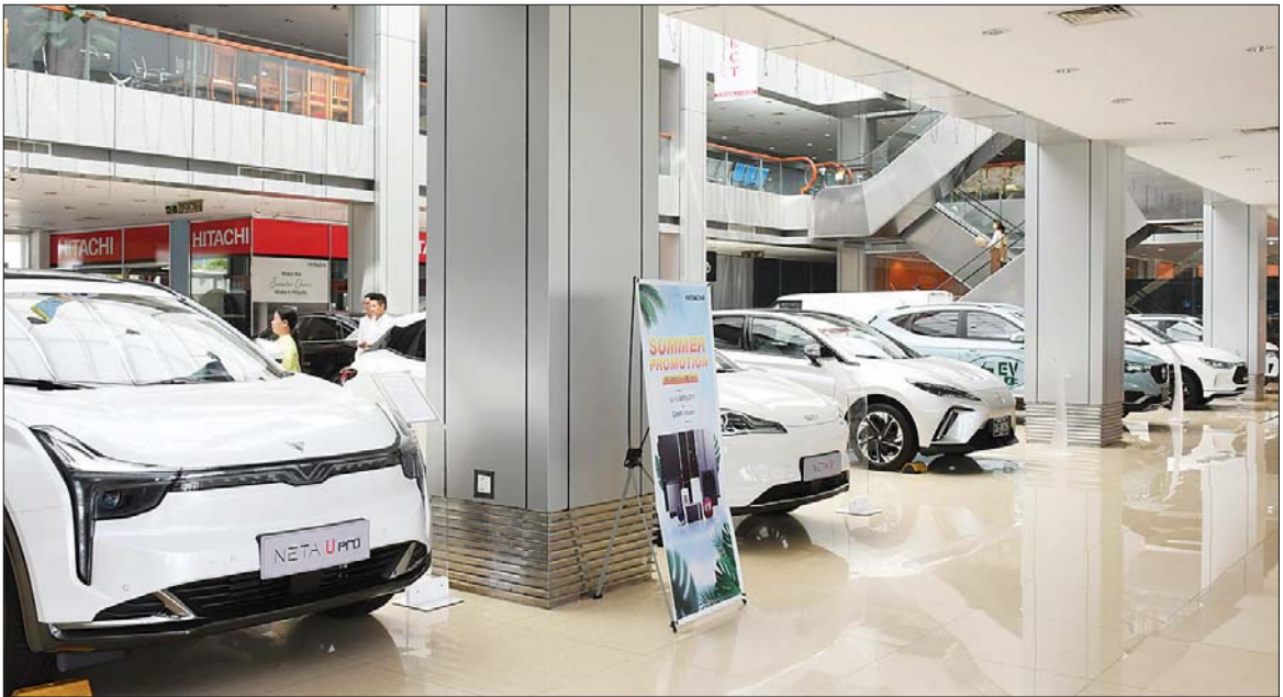
နေပြည်တော်ရှိ Sinma Living Mall မှ လျှပ်စစ်သုံးယာဉ်များကို ပြသထားစဉ်။

ရန်ကုန်တိုင်းဒေသကြီးအတွင်း အမှန် တကယ် နေထိုင်သူတွေအနေနဲ့ EV ယာဉ် တွေကို စလစ်(ပုံစံ-ဃ) မတင်ပြဘဲ အမှန် တကယ်နေထိုင်တဲ့ လိပ်စာနဲ့ မှတ်ပုံတင် ဆောင်ရွက်မယ်ဆိုရင် ရန်ကုန်တိုင်းဒေသ ကြီးမှတ်ပုံတင်ရုံးတွေနဲ့ ပဲခူးတိုင်းဒေသ ကြီးမှတ်ပုံတင်ရုံးတွေမှာ မှတ်ပုံတင်ရုံး မှာ အထောက်အထားတောင်းခံခြင်း မပြုဘဲ မှတ်ပုံတင်ဆောင်ရွက်ပေးသွား မှာဖြစ်ပါတယ်။