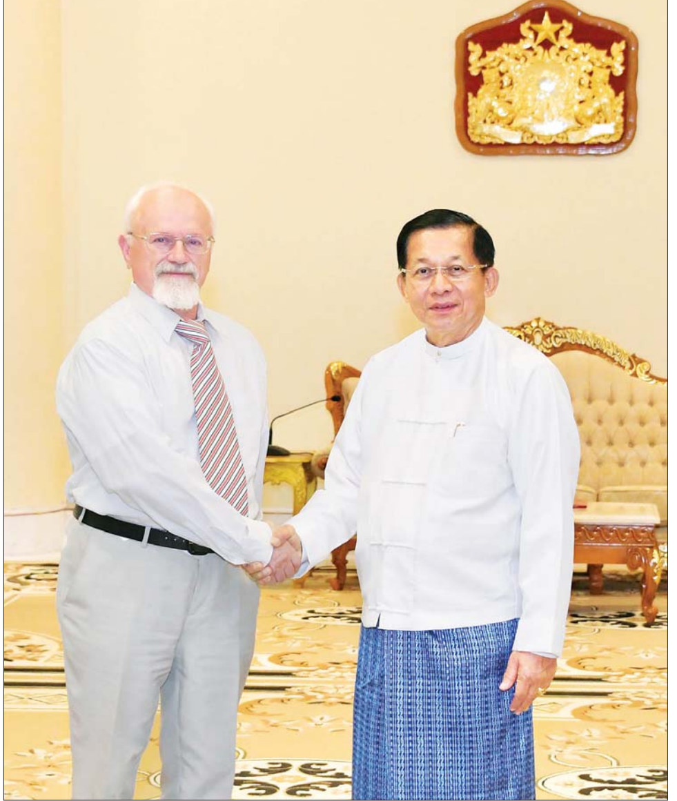
နိုင်ငံတော်စီမံအုပ်ချုပ်ရေးကောင်စီဥက္ကဋ္ဌ နိုင်ငံတော်ဝန်ကြီးချုပ် ဗိုလ်ချုပ်မှူးကြီး မင်းအောင်လှိုင်နှင့် ရုရှား-မြန်မာ ချစ်ကြည်ရေးနှင့် ပူးပေါင်းဆောင်ရွက်ရေးအသင်း ဒုတိယဥက္ကဋ္ဌ Mr. Anatoly Bulochnikov တို့ ရင်းရင်းနှီးနှီး နှုတ်ဆက်စဉ်။

ရင်းရင်းနှီးနှီး ဆွေးနွေးခဲ့ကြသည်။ မှတ်တမ်းတင်ဓာတ်ပုံရိုက် တွေ့ဆုံပွဲအပြီးတွင် နိုင်ငံတော်စီမံအုပ်ချုပ်ရေးကောင်စီဥက္ကဋ္ဌ နိုင်ငံတော်ဝန်ကြီးချုပ်နှင့် ရုရှား-မြန်မာ ချစ်ကြည်ရေးနှင့် ပူးပေါင်းဆောင်ရွက်ရေးအသင်း ဒုတိယဥက္ကဋ္ဌတို့သည် အမှတ်တရ လက်ဆောင်ပစ္စည်းများ အပြန်အလှန်ပေးအပ်ကြပြီး မှတ်တမ်းတင်ဓာတ်ပုံရိုက်ကြသည်။ တက်ရောက် အဆိုပါတွေ့ဆုံပွဲသို့ နိုင်ငံတော်စီမံအုပ်ချုပ်ရေးကောင်စီဥက္ကဋ္ဌ နိုင်ငံတော်ဝန်ကြီးချုပ်နှင့်အတူ ကောင်စီတွဲဖက်အတွင်းရေးမှူး ဒုတိယဗိုလ်ချုပ်ကြီး ရဲဝင်းဦး၊ ပြည်ထောင်စုဝန်ကြီးများဖြစ်ကြသည့် ဒေါက်တာကံဇော်၊ ဦးကိုကိုလှိုင်၊ ဦးအောင်သော်နှင့် တာဝန်ရှိသူများ တက်ရောက်ကြပြီး ရုရှား-မြန်မာ ချစ်ကြည်ရေးနှင့် ပူးပေါင်းဆောင်ရွက်ရေးအသင်း ဒုတိယဥက္ကဋ္ဌနှင့်အတူ ကိုယ်စားလှယ်အဖွဲ့မှ တာဝန်ရှိသူများ တက်ရောက်ခဲ့ကြကြောင်း သတင်းရရှိသည်။ သတင်းစဉ်