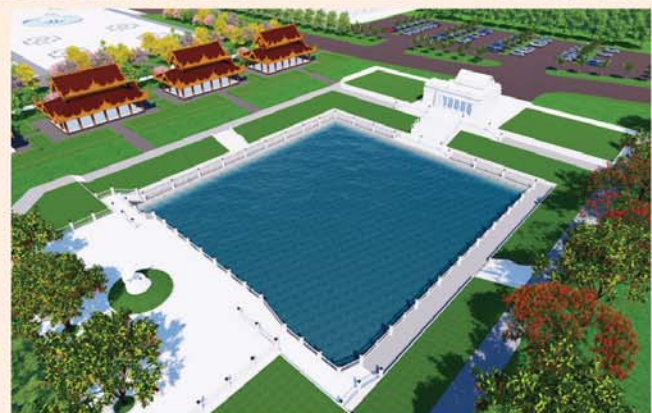
ကျောက်စာရုံစေတီ(၁၂ x ၁၂ x ၁၈)ပေ ၁ ဆူ တန်ဖိုး- ၂၇၉ သိန်း