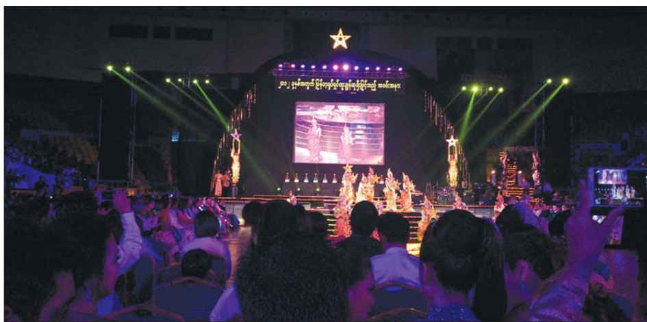
၂၀၁၂ ခုနှစ် မြန်မာ့ရုပ်ရှင် ထူးချွန်ဆုချီးမြှင့်သည့် အခမ်းအနားဖွင့်ပွဲအခမ်းအနား၌ ရုပ်ရှင်ချစ်အနုပညာရှင်နှင့် ဧည့်ပရိသတ်များအား တွေ့မြင်ရစဉ်။

ရုပ်ရှင်လောကသားများ မျှော်လင့်တောင့်တဆုံးနှင့် ရုပ်ရှင်ချစ်ပရိသတ်များ စိတ်ဝင်စားမှုအရှိဆုံး မြန်မာ့ရုပ်ရှင်ထူးချွန်ဆု အကယ်ဒမီဆုပေးပွဲကို ၁၉၅၂ ခုနှစ်တွင် စတင်ကျင်းပခဲ့သည်။ ၁၉၅၂ ခုနှစ်နှင့် ၁၉၅၃ ခုနှစ်တို့တွင် အကောင်းဆုံးဇာတ်ကားဆု (ပ၊ ဒု၊ တ)၊ အကောင်းဆုံးအမျိုးသားပညာသည်ဆုနှင့် အကောင်းဆုံးအမျိုးသမီးပညာသည်ဆု ဟူ၍ ရုပ်ရှင်ထူးချွန်ဆုသုံးမျိုးသာ သတ်မှတ်ချီးမြှင့်ခဲ့သည်။ ၁၉၅၄ ခုနှစ်တွင် ဒါရိုက်တာထူးချွန်ဆုကို တိုးမြှင့်ချီးမြှင့်ခဲ့သည်။ ၁၉၅၅ ခုနှစ်တွင် ဇာတ်ကား