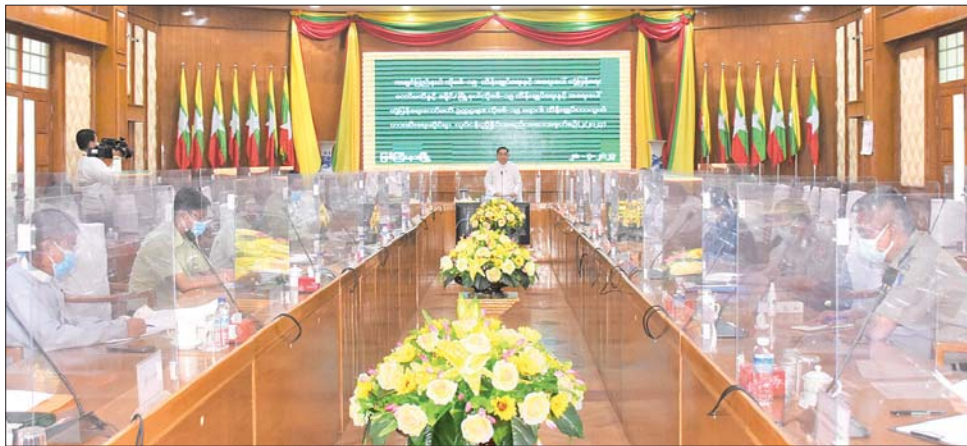
အဖွဲ့ရုံး မလိခခန်းမ၌ ကျင်းပ တွင် ပြည်နယ် ကိုဗစ်-၁၉ရောဂါ ကော်မတီအဆင့်ဆင့် အနေဖြင့် ထိန်းချုပ်ရေးနှင့် အရေးပေါ်တုံ့ပြန် ပြည်သူများ ကိုဗစ်-၁၉ ရောဂါ ကာကွယ်ဆေးနှင့် ထပ်ဆောင်း ကာကွယ်ဆေးများ ထိုးနှံနိုင်ရေး၊

မြစ်ကြီးနား ဧပြီ ၂၈ ကချင်ပြည်နယ် ကိုဗစ်-၁၉ရောဂါ ထိန်းချုပ်ရေးနှင့် အရေးပေါ်တုံ့ပြန် ရေးကော်မတီအနေဖြင့် မြန်မာ နိုင်ငံအတွင်း ကိုဗစ်-၁၉ ရောဂါ မျိုးရိုးဗီဇပြောင်း ရောဂါပိုး ထပ်မံ ကူးစက်လာမှုနှင့် စပ်လျဉ်း၍ ပြည်နယ်အတွင်း ကိုဗစ်-၁၉ ရောဂါကြိုတင်ကာကွယ်တားဆီး နိုင်ရေး ခရိုင်/မြို့နယ်ကိုဗစ်-၁၉ ထိန်းချုပ်ရေးနှင့် အရေးပေါ် တုံ့ပြန်ရေးကော်မတီ ဥက္ကဋ္ဌများ နှင့် လုပ်ငန်းညှိနှိုင်းအစည်း အဝေးကို ဧပြီ ၂၈ ရက် နံနက် ၁၀ နာရီက ပြည်နယ်အစိုးရ