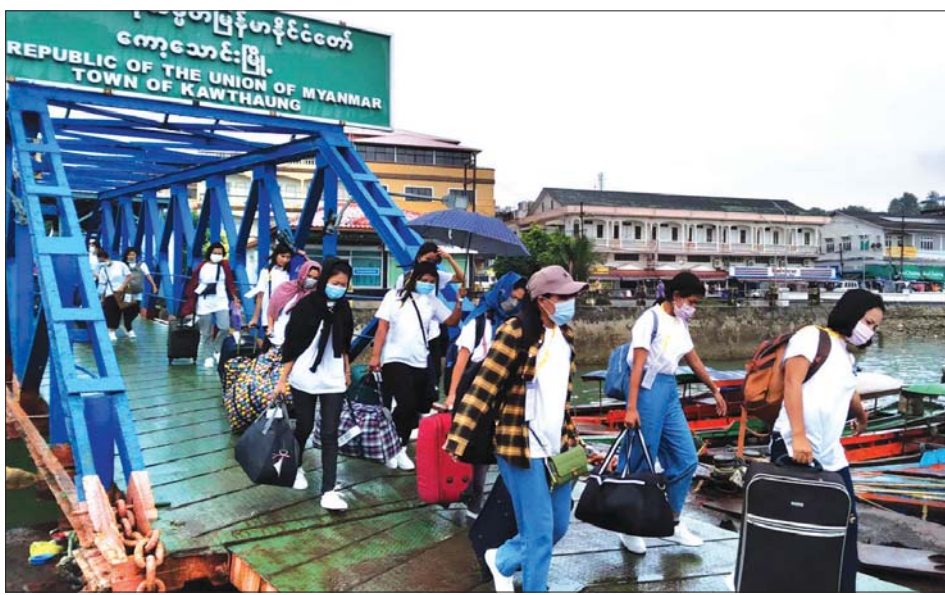
ထိုင်းနိုင်ငံဘက်သို့ MoU စနစ်ဖြင့် သွားရောက်လုပ်ကိုင်မည့် မြန်မာအလုပ်သမားများကို တွေ့ရစဉ်။

မြန်မာနိုင်ငံသည် ILO အဖွဲ့ဝင်နိုင်ငံတစ်နိုင်ငံအနေဖြင့် အတည်ပြုပါဝင်ထားသော အသင်းအဖွဲ့များ လွတ်လပ်စွာဖွဲ့စည်းခွင့်နှင့် စည်းရုံးခွင့်ဆိုင်ရာ ပြဋ္ဌာန်းချက်အမှတ် (၈၇) ကို ILO နှင့် ပူးပေါင်း၍ အပြည့်အဝလိုက်နာ အကောင်အထည်ဖော် ဆောင်ရွက်လျက်ရှိသည်။ အလုပ်ရှင်နှင့် အလုပ်သမားများအကြား၊ အလုပ်သမားအချင်းချင်းအကြား အလုပ်သမားရေးရာကိစ္စရပ်များ ဖြေရှင်းဆောင်ရွက်ရာတွင် အလုပ်သမားများအား ကိုယ်စားပြု၍ လွတ်လပ်စွာ ဆွေးနွေးဆောင်ရွက်နိုင်ရန်အတွက် ၂၀၁၁ ခုနှစ် အလုပ်သမားအဖွဲ့အစည်းဥပဒေနှင့် အညီ အခြေခံအလုပ်သမားအဖွဲ့အစည်း ၂၈၂၄ ဖွဲ့၊ မြို့နယ်အလုပ်သမားအဖွဲ့အစည်း ၁၅၆ ဖွဲ့၊ တိုင်းဒေသကြီး/ပြည်နယ် အလုပ်သမားအဖွဲ့အစည်း ၂၅ ဖွဲ့၊ အလုပ်သမားအဖွဲ့ချုပ် ကိုးဖွဲ့၊ မြန်မာနိုင်ငံလုံးဆိုင်ရာအလုပ်သမားရေးရာအဖွဲ့ တစ်ဖွဲ့၊ အခြေခံအလုပ်ရှင်အဖွဲ့အစည်း ၂၆ ဖွဲ့၊ မြို့နယ်အလုပ်ရှင်အဖွဲ့အစည်း တစ်ဖွဲ့နှင့် အလုပ်ရှင်အဖွဲ့ချုပ် တစ်ဖွဲ့ စုစုပေါင်း ၃၀၄၃ ဖွဲ့တို့ကို အလုပ်ရှင်၊ အလုပ်သမားအဖွဲ့အစည်းများအဖြစ် အသိအမှတ်ပြုလက်မှတ်များ ထုတ်ပေးခဲ့ပြီး ၎င်းအဖွဲ့အစည်းများအား ကိုယ်စားပြုသည့် အလုပ်သမားများအနေဖြင့် အလုပ်သမားရေးရာကိစ္စရပ်များတွင် အစိုးရကိုယ်စားလှယ်များ၊ အလုပ်ရှင်ကိုယ်စားလှယ်များနှင့် ပူးပေါင်းဆောင်ရွက်လျက်ရှိသည်။