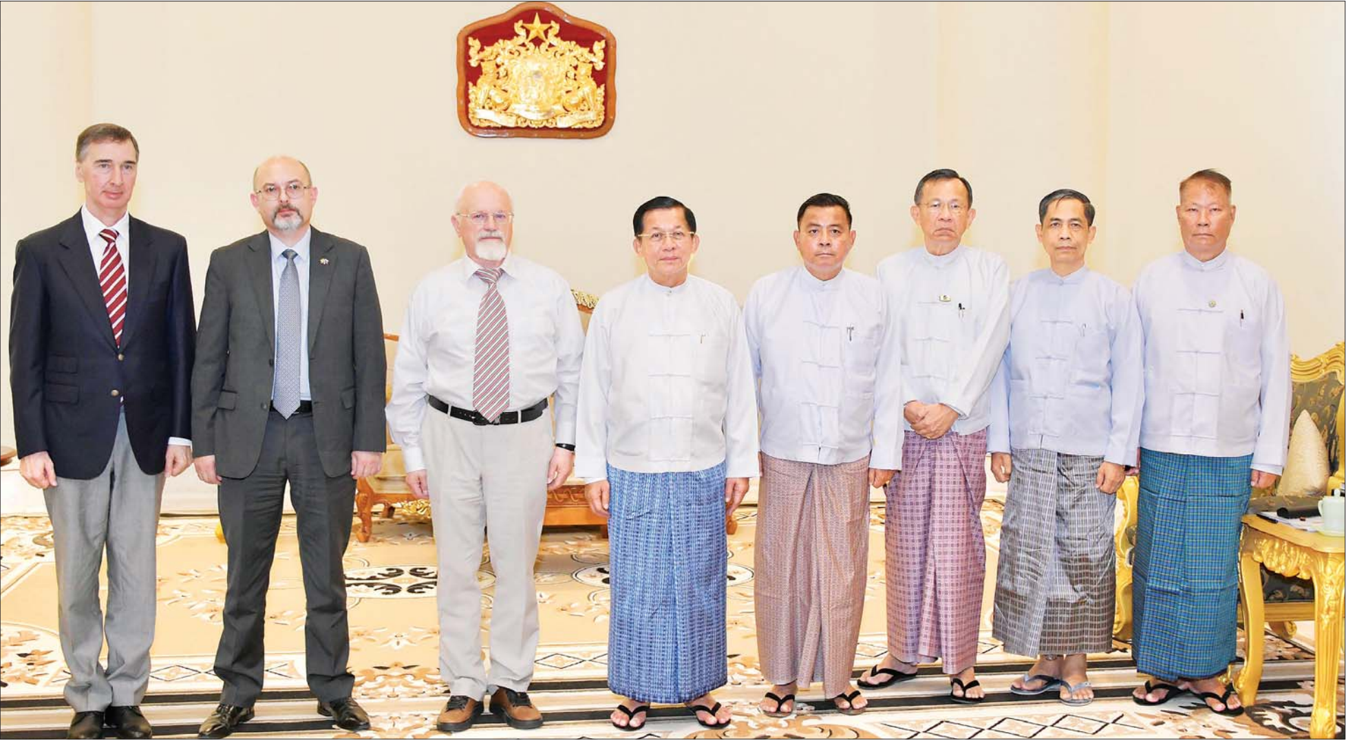
နိုင်ငံတော်စီမံအုပ်ချုပ်ရေးကောင်စီဥက္ကဋ္ဌ နိုင်ငံတော်ဝန်ကြီးချုပ် ဗိုလ်ချုပ်မှူးကြီး မင်းအောင်လှိုင်နှင့်အဖွဲ့ဝင်များ ရုရှား-မြန်မာ ချစ်ကြည်ရေးနှင့် ပူးပေါင်းဆောင်ရွက်ရေးအသင်း ဒုတိယဥက္ကဋ္ဌ Mr. Anatoly Bulochnikov ဦးဆောင်သော ကိုယ်စားလှယ်အဖွဲ့နှင့်အတူ စုပေါင်းမှတ်တမ်းတင် ဓာတ်ပုံရိုက်စဉ်။

❖ ရေအားလျှပ်စစ်ဓာတ်အား ထုတ်လုပ်ရေးစီမံကိန်းများတွင် ပူးပေါင်းဆောင်ရွက်သွားမည့်အခြေအနေများ၊ စိုက်ပျိုးရေးလုပ်ငန်းများ ဖွံ့ဖြိုးတိုးတက်ရေး ပူးပေါင်းဆောင်ရွက်သွားမည့် အခြေအနေများ၊ နှစ်နိုင်ငံအကြား ခရီးသွားလုပ်ငန်းများ ဖွံ့ဖြိုးတိုးတက်ရေး ဆက်လက်ဆောင်ရွက်သွားမည့် အခြေအနေများ၊ နှစ်နိုင်ငံအကြား ခရီးသွားလုပ်ငန်းများ ဖွံ့ဖြိုးတိုးတက်ရေး ဆက်လက်ဆောင်ရွက်သွားမည့် အခြေအနေများ၊ နှစ်နိုင်ငံအကြား ယဉ်ကျေးမှုဖလှယ်ရေးဆိုင်ရာကိစ္စရပ်များ ရင်းရင်းနှီးနှီးဆွေးနွေး