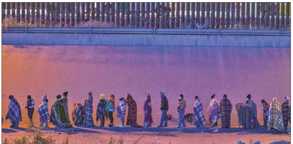
မက္ကဆီကိုနယ်စပ်တွင် ရွှေ့ပြောင်းနေထိုင်သူများကိုတွေ့ရစဉ်။ ကိုဗစ် - ၁၉ ကန့်သတ်ချက်များ ဖြေလျှော့ လာမည့် ရွှေ့ပြောင်းနေထိုင်သူဦးရေမှာ ပို၍များပြား ပေးပြီးနောက် မေ ၁၁ ရက် နောက်ပိုင်းတွင် လာမည်ဟု ခန့်မှန်းထားကြသည်။ အမေရိကန်သို့ အထောက်အထားမဲ့ ဝင်ရောက် အင်န်အိတ်ချ်ကေ

အမေရိကန်သို့ ဝင်ရောက်လိုသည့်လူများသည် အဆိုပါစင်တာများတွင် စစ်ဆေးမှုခံယူရမည်ဖြစ် သည်။ ထိုသို့စစ်ဆေးပြီးနောက် အမေရိကန်သို့ ဝင်ရောက်ရန် ခွင့်ပြုချက်ရရှိပါက အဆင်ပြေချောမွေ့ ရန် အကူအညီများ ထောက်ပံ့ပေးသွားမည်ဟု အရာရှိများက ပြောသည်။ အမေရိကန်တောင်ပိုင်း နယ်စပ်သို့ အထောက်အထားမဲ့ ဝင်ရောက်လာ သည့် ရွှေ့ပြောင်းနေထိုင်သူဦးရေမှာ ၂၀၂၂ ခုနှစ် စက်တင်ဘာလတွင် ၂ ဒသမ ၇၆ သန်း ရှိလာပြီ ဖြစ်သည်။ အမေရိကန်သမ္မတ ဂျိုးဘိုင်ဒင် လက်ထက်တွင် နယ်စပ်ပြဿနာ ဖြစ်ပွားသည်ဟု ရိပ်တိဘလီကန်များက ဝေဖန်ကြသည်။