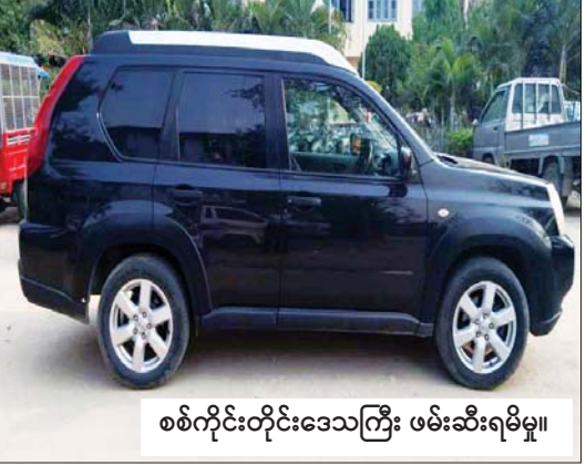
စစ်ကိုင်းတိုင်းဒေသကြီး ဖမ်းဆီးရမိမှု။