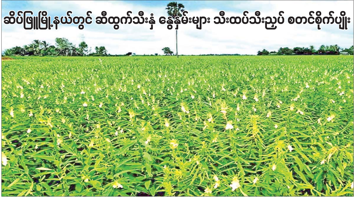
ဆိပ်ဖြူမြို့နယ်တွင် ဆီထွက်သီးနှံ နွေနှမ်းများ သီးထပ်သီးညှပ် စတင်စိုက်ပျိုး နေပြည်တော် ဧပြီ ၁၉ သီးညှပ်အဖြစ် စိုက်ပျိုးကြကြောင်း၊ နှမ်းမျိုးအနေဖြင့် နှမ်းဖြူ၊ နှမ်းနက်၊ နှမ်းနီ စသည်ဖြင့် စိုက်ပျိုးကြပြီး စိုက်ပျိုးမြေများမှာ မြစ်ရိုးတစ်လျှောက် မြေသားမြေမာများတွင် စာမျက်နှာ ၃ ကော်လံ ၁ □