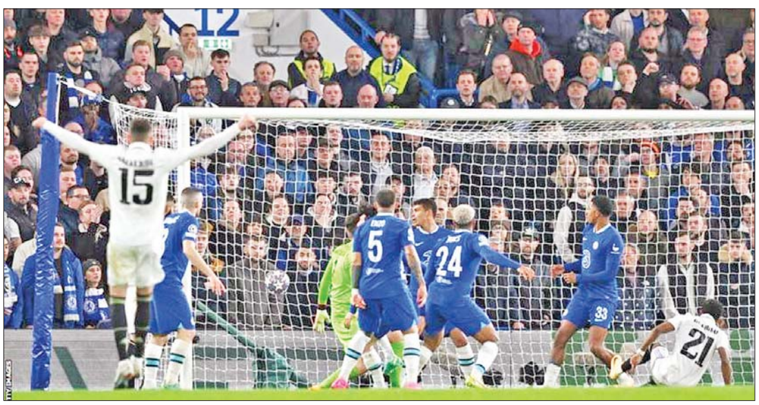
ချယ်ဆီးအသင်းနှင့် ရိုးရဲမက်ဒရစ်အသင်းတို့ ယှဉ်ပြိုင်ကစားစဉ်။

ဧပြီ ၁၉ ရက် နံနက် ၁ နာရီခွဲက တစ်ချိန်တည်း ယှဉ်ပြိုင်ကစားခဲ့ သည့် ယူအီးအက်ဖ်အေ ချန်ပီယံ လိဂ် ကွာတားဖိုင်နယ် ဒုတိယ အကျော့ပွဲစဉ်များတွင် ရိုးရဲ မက်ဒရစ်အသင်း အနိုင်ရပြီး အေစီမီလန်အသင်း သရေကျခဲ့ သည်။ ချယ်ဆီးနှင့် ရိုးရဲမက်ဒရစ် အသင်းတို့ပွဲစဉ်တွင် ပွဲကြည့် ပရိသတ် ၃၉၀၀၀ ကျော် လာရောက်ကြည့်ရှုခဲ့ပြီး ရိုးရဲ မက်ဒရစ်အသင်းက ရိုဒရီဂို၏ သွင်းဂိုးများဖြင့် နှစ်ဂိုးပြတ် အနိုင်ရရှိခဲ့သည်။