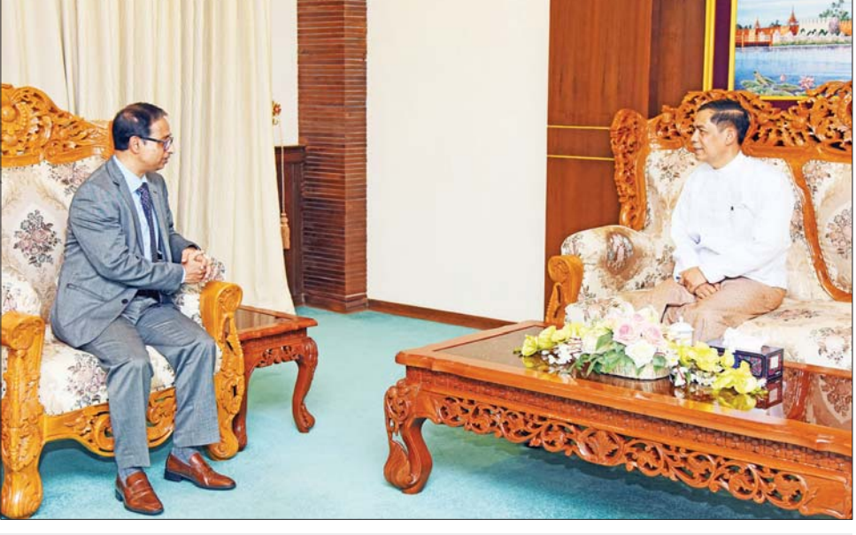
ပြည်ထောင်စုဝန်ကြီး ဦးကိုကိုလှိုင် မြန်မာနိုင်ငံဆိုင်ရာ ဘင်္ဂလားဒေ့ရှ်ပြည်သူ့သမ္မတနိုင်ငံ သံအမတ်ကြီး မစ္စတာ မန်ဂျူရှလ် ကရင်ခမ်း ချောင်ဒရီ အား လက်ခံတွေ့ဆုံစဉ်။