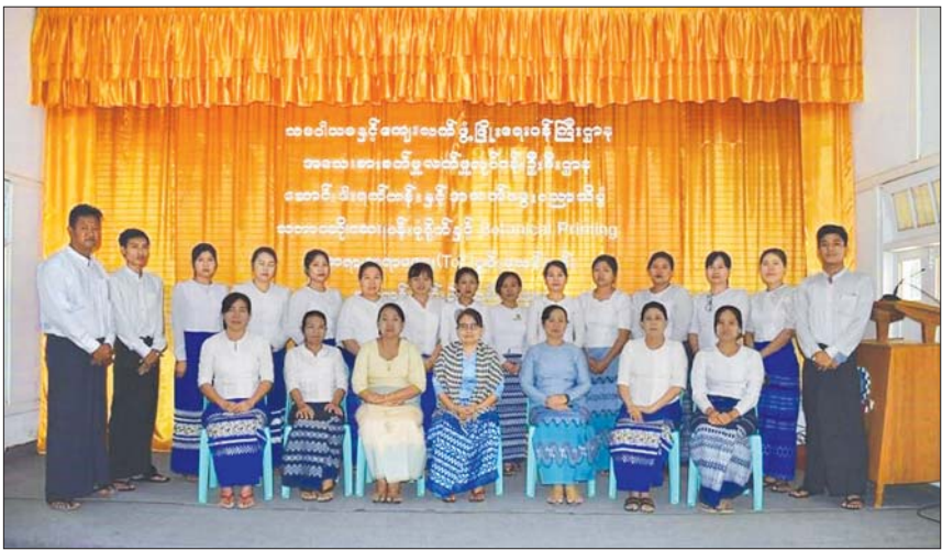
သင်တန်းဆင်းပွဲနှင့် ဂုဏ်ပြုပွဲတွင် ကျောင်းအုပ်ကြီးက အမှာစကားပြောကြားပြီး သင်တန်းဆင်း လက်မှတ်များနှင့် ဂုဏ်ပြုမှတ်တမ်းလွှာများကိုလည်းကောင်း၊ ဝန်ထမ်းများအား နှစ်သစ်ကူးလက်ဆောင်များကို ပေးအပ်ခဲ့ကြောင်း သိရသည်။ သွင်ထူးဉာဏ်ဇော် (မန္တလေး)

အမရပူရ ဧပြီ ၁၉ မန္တလေးတိုင်းဒေသကြီး အမရပူရမြို့နယ်ရှိ ဆောင်းဒါးရက်ကန်းနှင့် အသက်မွေးပညာ သိပ္ပံ သဘာဝဆိုင်ဆေး၊ ပန်းပုံရိုက်နှင့် Botanical Printing ဆရာ ဆရာမများ မွမ်းမံသင်တန်းဆင်းပွဲ၊ ၂၀၂၂- ၂၀၂၃ ဘဏ္ဍာနှစ်အတွင်း လုပ်ငန်းများ ဆောင်ရွက်ရာတွင် ပူးပေါင်းဆောင်ရွက်မှု ပေးအပ်သောဆောင်ရွက်ရသောလုပ်ငန်းများကို အထူးအလေးထားဆောင်ရွက်ခဲ့သည့် ဝှေးချွန်အရာထမ်း၊ အမှုထမ်း နှစ်ဦးအား ဝှေးချွန်ဆုချီးမြှင့်ခြင်းနှင့် ၂၀၂၃ ပညာသင်နှစ် ပုံမှန်သင်တန်းများတွင် သင်တန်းသားရရှိရေးအတွက် ပူးပေါင်းဆောင်ရွက်ခဲ့သော အရာထမ်း၊ အမှုထမ်းများအား ဂုဏ်ပြုပွဲကို ဧပြီ ၁၈ ရက်က အဆိုပါ သိပ္ပံအစည်းအဝေးခန်းမ၌ ကျင်းပသည်။