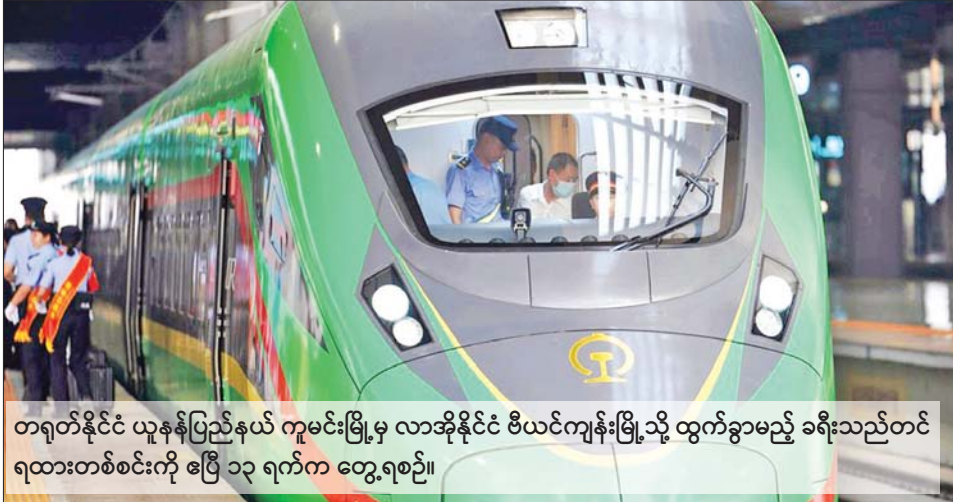
တရုတ်နိုင်ငံ ယူနန်ပြည်နယ် ကူမင်းမြို့မှ လာအိုနိုင်ငံ ဗီယင်ကျန်းမြို့သို့ ထွက်ခွာမည့် ခရီးသည်တင် ရထားတစ်စင်းကို ဧပြီ ၁၃ ရက်က တွေ့ရစဉ်။

တရုတ်-လာအိုရထားလမ်းသည် ဧပြီ ၁၃ ရက်က နယ်စပ်ဖြတ်ကျော် ခရီးသည်တင် ရထား ပြေးဆွဲမှု စတင်ပြီးနောက် ပထမ ရက်သတ္တပတ်အတွင်း နယ်စပ်ဖြတ်ကျော် ခရီးသည် တင်ရထားပြေးဆွဲမှုပေါင်း ၂၅၉၇ ကြိမ် ကိုင်တွယ်ဆောင်ရွက်နိုင် ခဲ့ကြောင်း မိုဟန်နယ်စပ် ဝင်/ ထွက် စစ်ဆေးရေးဂိတ်က ပြောသည်။