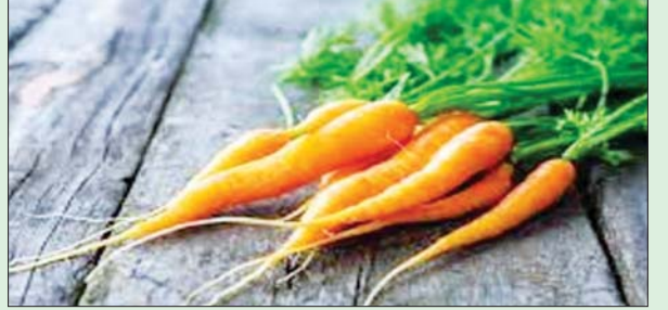
သတင်းအရင်းအမြစ် - စီးပွား/ကူးသန်း

ပဲခူးတိုင်းဒေသကြီး ပြည်ခရိုင် ပေါက်ခေါင်းမြို့နယ်တွင် မုန့်လာဥနီ များ စိုက်ပျိုးထားရှိကြောင်း၊ မုန့်လာဥနီကို စက်တင်ဘာလတွင် စိုက်ပျိုးပြီး ဒီဇင်ဘာလတွင် စတင်ထွက်ရှိကြောင်း၊ မုန့်လာဥနီ အပင်သည် နှစ်နှစ်ခံ အပင်မျိုးဖြစ်၍ နှစ်ရာသီအသက်ရှင်နေသော အပင်တစ်မျိုးဖြစ်ပြီး စိုက်ပျိုးရာတွင် မျိုးစေ့ကိုသာစိုက်ပျိုးကြောင်း သိရသည်။