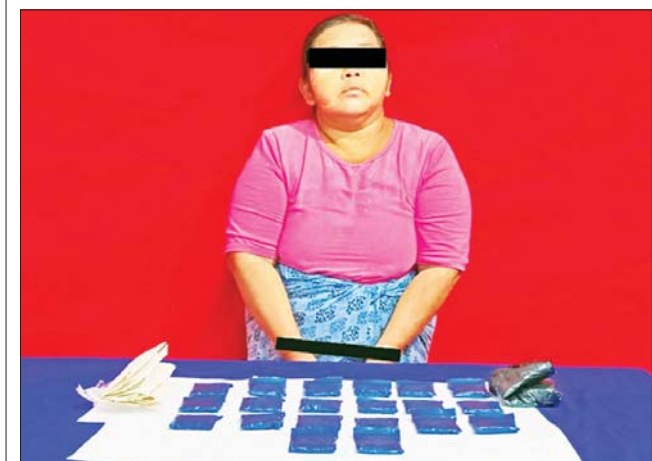
မမိုးမိုးအား သိမ်းဆည်းရမိသည့် စိတ်ကြွေးသွပ်ဆေးပြားများနှင့် အတူ တွေ့ရစဉ်။

တိုက်ဖျက်ရေးအထူးအဖွဲ့၏ စီမံ ခန့်ခွဲမှုဖြင့် စစ်ဆေးမှုများဆောင် ရွက်ခဲ့ရာ ရွှေဘိုမြို့ အမှတ်(၈) တပ်ထိပ် ပူးပေါင်းစစ်ဆေးရေး ဂိတ်၌ တာဝန်ကျပူးပေါင်းအဖွဲ့က လိုင်စင်မဲ့ Nissan X-Trail မော်တော်ယာဉ်တစ်စီး (ခန့်)မှန်း တန်ဖိုးငွေကျပ် ၁၀၀၀၀၀၀)ကို ပို့ကုန်သွင်းကုန်ဥပဒေအရ လည်း ကောင်း၊ မြို့နယ်သစ်တောဦးစီး ဌာန အသီးသီးအလိုက် ဦးဆောင် သော ပူးပေါင်းအဖွဲ့များက စစ်ဆေးမှုများ ဆောင်ရွက်ခဲ့ရာ ကသာမြို့နယ်နှင့် ရွှေဘိုမြို့နယ် အတွင်း တရားမဝင် ကျွန်းသစ် ၁ ဒသမ ၀၆၀ တန်း၊ အင်ဒိုသားဆိုင်စုံ ၂ ဒသမ ၇၂၁ တန်း (ခန့်)မှန်းတန်ဖိုး ငွေကျပ် ၅၇၆၂၇၀)ကို သစ်တော ဥပဒေအရလည်းကောင်း၊ စုစု ပေါင်း ခန့်မှန်းတန်ဖိုးငွေကျပ် ၁၀၅၇၆၂၇၀ ကို ဖမ်းဆီးအရေး ယူဆောင်ရွက်လျက်ရှိသည်။ သို့ဖြစ်၍ ဧပြီ ၁၈ ရက်တွင် ဖမ်းဆီးရမိမှု စုစုပေါင်းမှာ အမှုတွဲ ကိုးမှု၊ ခန့်မှန်းတန်ဖိုး ငွေကျပ် ၇၁၉၉၉၀၇၁ ဖြစ်ကြောင်း တရား မဝင်ကုန်သွယ်မှု တိုက်ဖျက်ရေး ဦးဆောင်ကော်မတီမှ သိရသည်။ သတင်းစဉ်