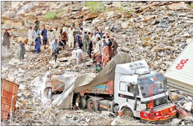
နေရာ၌ ဖြစ်ပွားခဲ့သော အဆိုပါ မြေပြိုမှုတွင် အသက်ရှင်ကျန်ရစ် သူများကို ကယ်ဆယ်ရေးသမား များက ရှာဖွေလျက်ရှိသည်။ အဆိုပါ မြေပြိုမှုကြောင့် လူအမြောက်အမြား ဒဏ်ရာရရှိခဲ့ ကြောင်း အာဏာပိုင်များက ပြောသည်။ မြေပြိုမှုသည် ဧပြီ ၁၈ ရက် ဒေသစံတော်ချိန် နံနက် နှစ်နာရီ က ဖြစ်ပွားခဲ့ခြင်းဖြစ်ကြောင်း ကုန်တင်ကားမောင်းသမားတစ်ဦး အင်န်အိတ်ချ်က

အစ္စလာမာဘတ် ဧပြီ ၁၉ ပါကစ္စတန် အနောက်မြောက် ပိုင်းတွင် ကြီးမားသော မြေပြိုမှု တစ်ခုက အဓိကအရေးပါသော အဝေးပြေးလမ်းတစ်ခုကို ဧပြီ ၁၈ ရက် အစောပိုင်းက ပိတ်ဆို့မှု ဖြစ်စေခဲ့ပြီးနောက် ရှာဖွေ ကယ်ဆယ်ရေး လုပ်ငန်းများကို ဆောင်ရွက်လျက်ရှိသည်။ အဆိုပါ ဖြစ်စဉ်ကြောင့် ကုန်တင်ကား ဒါဇင်ကျော် မြေများ ဖုံးလွှမ်းသွားခဲ့ပြီး လူ သုံးဦး သေဆုံးခဲ့သည်။ ပါကစ္စတန်နှင့် အာဖဂန် နစ္စတန်အကြား အဓိကအရေးပါ သော ကုန်သွယ်ရေးလမ်းပေါ်ရှိ တော့ခါခန် နယ်စပ်ဖြတ်ကျော်