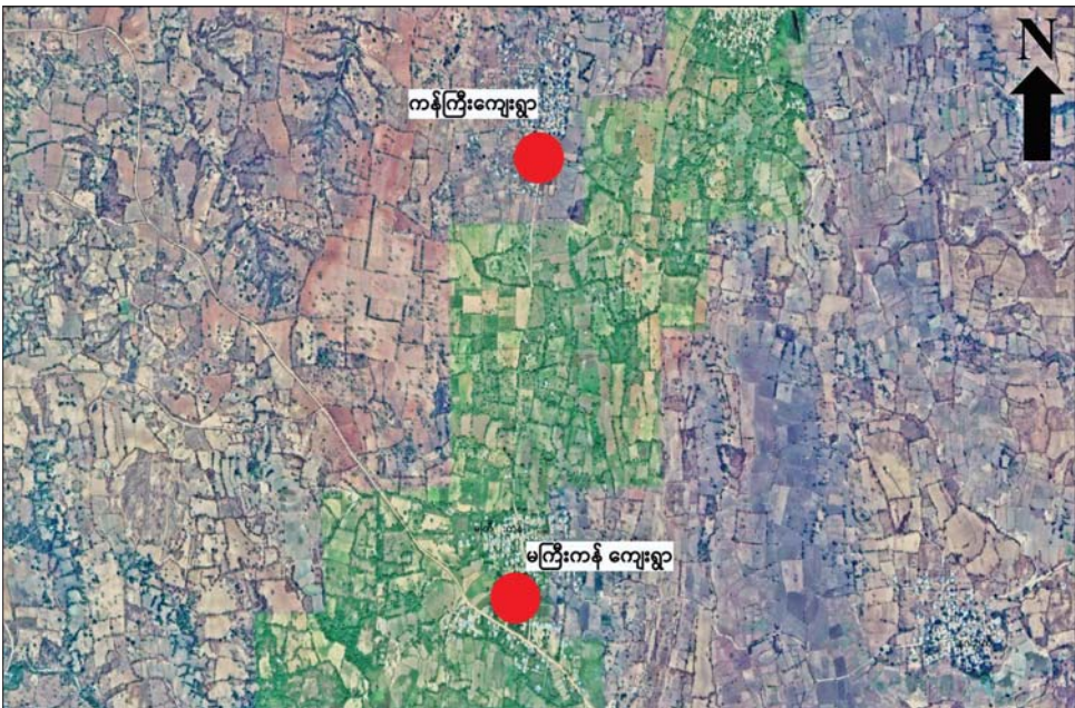
မြိုင်မြို့နယ် မကြီးကန်ကျေးရွာနှင့် ကန်ကြီးကျေးရွာတို့အတွင်း PDF အမည်ခံ အကြမ်းဖက်သမားများ သိုဝှက်ထားသည့် ခဲယမ်း၊ ဗုံးသီးများနှင့် ဆက်စပ်ပစ္စည်းများ အများအပြား ဖော်ထုတ်သိမ်းဆည်းရမိသည့် ဖြစ်စဉ်ပြပုံ

၁၅ စီးတို့ကို ဖော်ထုတ်သိမ်းဆည်းရမိခဲ့သည်။ ရှေးအတွက် လိုအပ်သည့် လုံခြုံရေးလုပ်ငန်းများကို လုံခြုံရေးတပ်ဖွဲ့ဝင်များအနေဖြင့် မြိုင်မြို့နယ် ဆက်လက်ဆောင်ရွက်သွားမည်ဖြစ်ကြောင်း သတင်း ရရှိသည်။