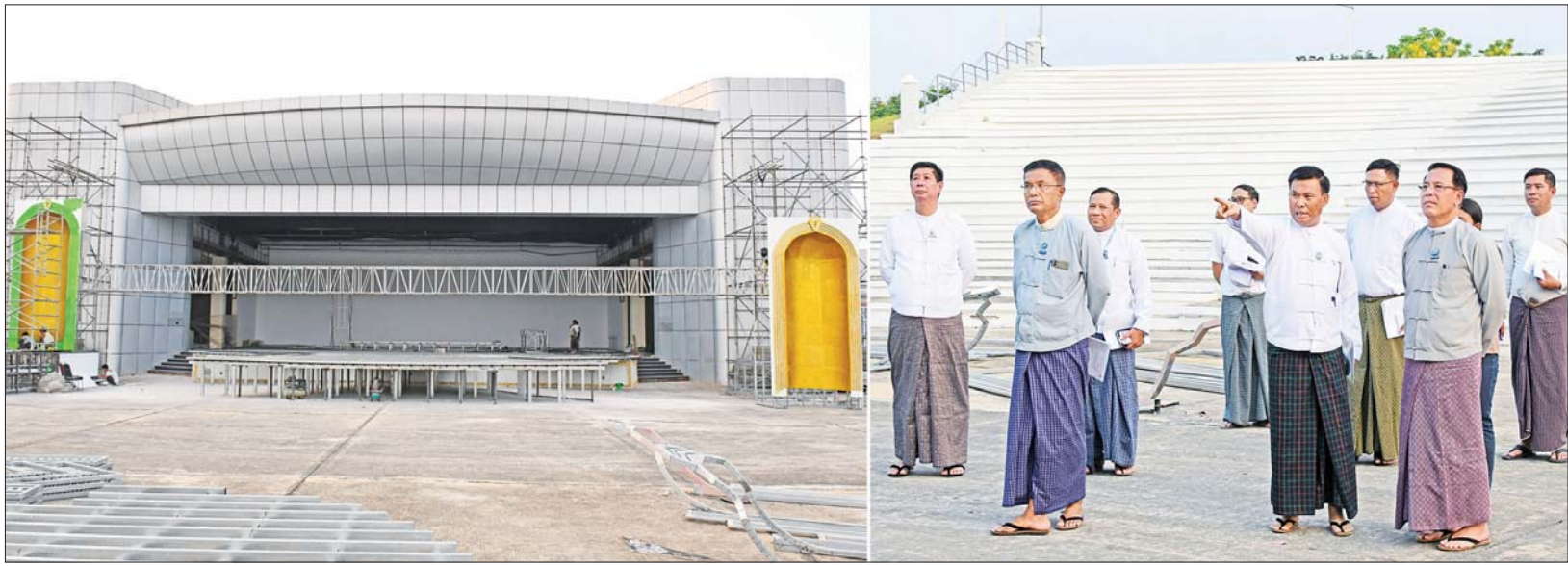
ပြည်ထောင်စုဝန်ကြီး ဦးမောင်မောင်အုန်းနှင့် အဖွဲ့ဝင်များ မြန်မာ့ရုပ်ရှင်ထူးချွန်ဆုပေးပွဲ အခမ်းအနားကျင်းပနိုင်ရေးအတွက် ကြိုတင်ပြင်ဆင်ဆောင်ရွက်နေမှုများ ကြည့်ရှုစစ်ဆေးစဉ်။

နေပြည်တော် ဧပြီ ၁၈ ၂၀၂၃ ခုနှစ်၊ ၂၀၂၀ ပြည့်နှစ်နှင့် ၂၀၂၂ ခုနှစ်များအတွက် မြန်မာ့ရုပ်ရှင်ထူးချွန်ဆု ချီးမြှင့်ပွဲအခမ်းအနားကို မေ ၆ ရက်တွင် နေပြည်တော် မြို့တော်ခန်းမအနီးရှိ လဟာပြင်ကဇာတ်ရုံ၌ ခမ်းနားထည်ဝါစွာ ကျင်းပသွားမည် ဖြစ်သည်။