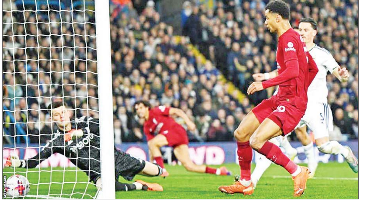
လိဒ်အသင်းဘက်သို့ လီဗာပူးတိုက်စစ်ကစားသမား ဂတ်ပို ဂိုးသွင်းယူစဉ်။