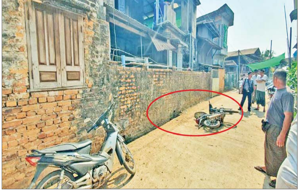
သံဖြူဇရပ်မြို့နယ် ပငကျေးရွာ ရေကစားမဏ္ဍပ်အား လက်ပစ်ဗုံးဖြင့် ဖောက်ခွဲဖျက်ဆီးရန် ပြုလုပ်စဉ် လက်ပစ်ဗုံး ကျရောက်ပေါက်ကွဲခဲ့သည့် နေရာကို တွေ့ရစဉ်။