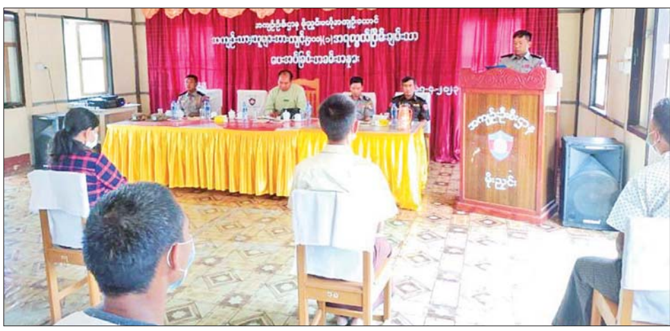
ပြစ်ဒဏ်လွတ်ငြိမ်းခွင့်ရရှိသူများအား လွတ်လက် လည်း နေရပေသို့ ကောင်းမွန်စွာပြန်နိုင်ရေး မှတ်၊ စားစရိတ်၊ ခရီးစရိတ်၊ လုပ်အားဆုငွေများကို ကားဂိတ်များသို့ စနစ်တကျ ပို့ဆောင်ပေးခဲ့ကြောင်း ပေးအပ်ခဲ့ကြောင်းနှင့် အကျဉ်းထောင်/စခန်းများမှ သတင်းရရှိသည်။ သတင်းစဉ်

မြစ်ကြီးနား ဧပြီ ၁၈ နိုင်ငံတော်စီမံအုပ်ချုပ်ရေးကောင်စီ ဥက္ကဋ္ဌသည် မြန်မာ့နှစ်သစ်မင်္ဂလာ အခါသမယအထိမ်းအမှတ် အားဖြင့်လည်းကောင်း၊ ပြည်သူ့လူထုနှလုံးစိတ်ဝမ်း အေးချမ်းရေးနှင့် လူသားချင်းစာနာထောက်ထားမှု ကို အလေးထားသောအားဖြင့် လည်းကောင်း အကျဉ်းထောင်/အချုပ်ထောင်/စခန်းအသီးသီးတွင် ပြစ်ဒဏ်ကျခံလျက်ရှိသော အကျဉ်းသား အကျဉ်းသူ ၃၀၁၅ ဦးတို့အား ရာဇဝတ်ကျင့်ထုံးဥပဒေပုဒ်မ ၄၀၁၊ ပုဒ်မခွဲ(၁)အရ “နေကတစ်ကြိမ်ပြစ်မှုထပ်မံကျူးလွန် ပါက ၎င်းပြစ်ဒဏ်အပြင် ယခုကျခံရန်ကျန်ရှိသော ပြစ်ဒဏ်များကိုပါ ဆက်လက်ကျခံရမည်” ဟူသော စည်းကမ်းသတ်မှတ်ချက်ဖြင့် ပြစ်ဒဏ်လွတ်ငြိမ်းခွင့် ပြုလိုက်ရာ ကချင်ပြည်နယ်ဦးစီးမှူးရုံး ကွပ်ကဲမှု အောက်ရှိ အကျဉ်းထောင်/ အချုပ်ထောင်/ စခန်း အသီးသီးမှ အကျဉ်းသား ၁၁၆ ဦး၊ အကျဉ်းသူ ၉ ရှစ်ဦး၊ တရုတ်နိုင်ငံခြားသား တစ်ဦး စုစုပေါင်း ၁၂၅ ဦး ဧပြီ ၁၇ ရက်တွင် ပြစ်ဒဏ်လွတ်ငြိမ်းခွင့်ရခဲ့ကြောင်း သိရသည်။ ထောက်ပံ့ပေး ထိုသို့ ပြစ်ဒဏ်လွတ်ငြိမ်းခွင့် ပေးရာတွင် လွတ်မြောက်သည့် အကျဉ်းသား အကျဉ်းသူများအား ဌာနဆိုင်ရာအဖွဲ့အစည်းများ ဖိတ်ကြား၍ ဆုံးမ ဩဝါဒစကားများ ပြောကြားခဲ့ပြီး ကချင်ပြည်နယ် အတွင်း လွတ်မြောက်သည့် အကျဉ်းသား အကျဉ်းသူ များအား ကချင်ပြည်နယ်အစိုးရအဖွဲ့မှ လွတ်လူ တစ်ဦးလျှင် ငွေကျပ် ၁၀၀၀၀ နှုန်းဖြင့် ထောက်ပံ့ပေး ခဲ့ကြောင်း သိရသည်။ စနစ်တကျ ပို့ဆောင်ပေး ထို့နောက် အကျဉ်းဦးစီးဌာနအနေဖြင့်လည်း