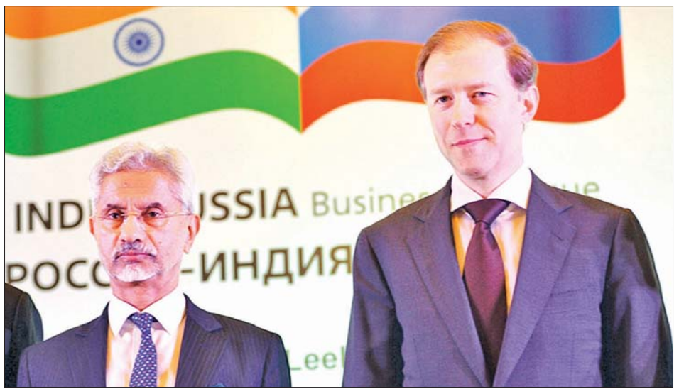
အိန္ဒိယနိုင်ငံ နယူးဒေလီ၌ ကျင်းပသော အိန္ဒိယ - ရုရှားစီးပွားရေးဆွေးနွေးပွဲသို့ တက်ရောက်လာသော ရုရှားကုန်သွယ်ရေးနှင့် စက်မှုဝန်ကြီး ဒန်းနစ်ဗယ်လန်တီနိုဗစ်ချ်နှင့် အိန္ဒိယနိုင်ငံခြားရေးဝန်ကြီးဆူဘာရှာမန်ရမ်ဂျိုင်ရှန်ကာတို့ကို တွေ့ရစဉ်။

ခဲ့ကြသည်။ အိန္ဒိယနိုင်ငံသည် ယခုအခါတွင် ရုရှားနိုင်ငံမှ ရေနံ အဓိကဝယ်ယူသူဖြစ်လာခဲ့သည်။ အိန္ဒိယနိုင်ငံက မတ်လအထိ ၁၂ လတာကာလအတွင်း ရုရှားနိုင်ငံမှ စုစုပေါင်း ရေနံတင်သွင်းမှု ပမာဏသည် ယခင်အလားတူကာလထက် လေးပုံတစ်ပုံနီးပါးရှိပြီး အမေရိကန်ဒေါ်လာ ၄၆ ဘီလီယံ ခန့်ရှိသည်။ အိန္ဒိယနိုင်ငံသည် ရုရှားနိုင်ငံနှင့် ကုန်သွယ်မှု လိုငွေတိုးလာမှုကို လျှော့ချလိုသည်။ နှစ်နိုင်ငံကုန်သွယ်မှုဆွေးနွေးမှုသည် နှစ်နိုင်ငံစီးပွားရေး ဆက်ဆံမှုပိုမိုတိုးတက်လာသည်ကို ဖော်ပြသော ခြေလှမ်းတစ်ရပ်ဖြစ်ကြောင်း ကျွမ်းကျင်သူများက သုံးသပ်သည်။ အင်န်အိတ်ချ်ကေ