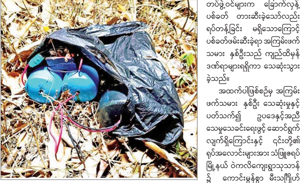
သံဖြူဇရပ်မြို့နယ် ပငကျေးရွာ ရေကစားမဏ္ဍပ်အား လက်ပစ်ဗုံးဖြင့် ဖောက်ခွဲဖျက်ဆီးရန် ပြုလုပ်ခဲ့သူ PDF အမည်ခံ အကြမ်းဖက်သမား နှစ်ဦး သိုဝှက်ထားသည့် လက်လုပ်မိုင်းများအား တွေ့ရစဉ်။