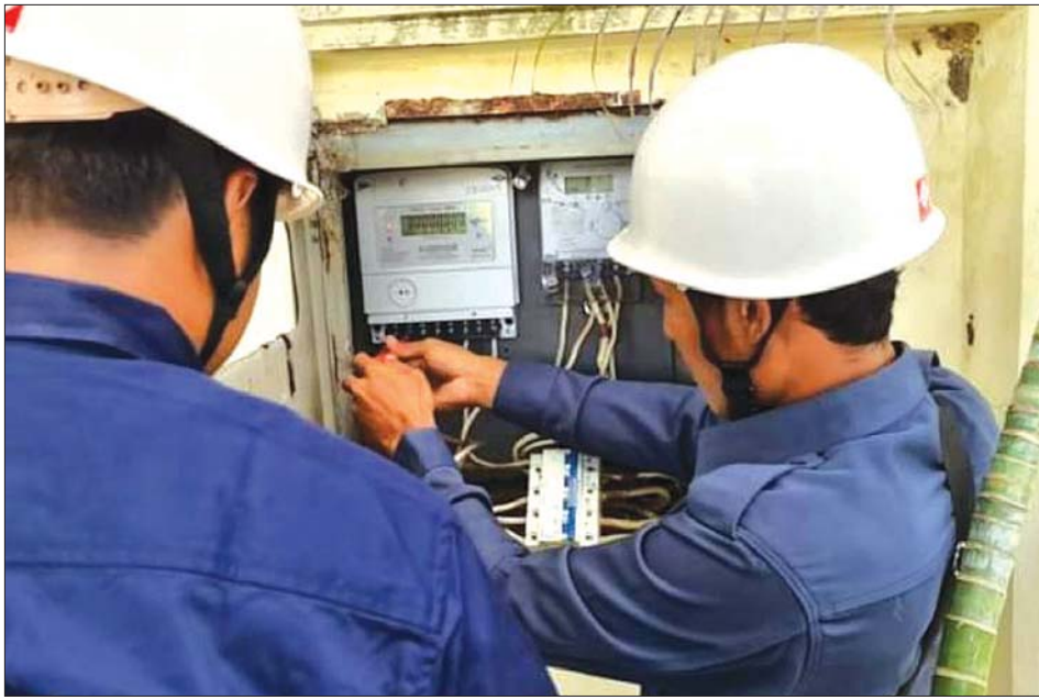
လျှပ်စစ်ဝန်ထမ်းများက လျှပ်စစ်မီတာများအား စစ်ဆေးနေစဉ်။

လျှပ်စစ်ဓာတ်အား သုံးစွဲသူပြည်သူများ၏ နေအိမ်များ၊ စက်ရုံ၊ အလုပ်ရုံများကို door to door စနစ်ဖြင့် ဝန်ဆောင်မှုပေးကာ ရောင်းချလျက်ရှိနေသည်။ လျှပ်စစ်ဓာတ်အား သုံးစွဲသူများအား လျှပ်စစ်ဓာတ်အား “ကြိုက်သလောက်သုံး၊ ကျသလောက်ပေး” တစ်လ သုံးသမျှ လျှပ်စစ်ဓာတ်အားခကို နောက်လမှ ပေးရ သော အကြွေးစနစ်ဖြင့် လျှပ်စစ်ဓာတ်အား ဖြန့်ဖြူး ပေးလျက်ရှိနေသည်။ “ယနေ့ ရောင်းရငွေသည်- မနက်ဖြန်အတွက်အရင်းဖြစ်သည်။” “ယခုလပေးချေ ရသောဓာတ်အားခသည် နောက်လလျှပ်စစ်ဓာတ်အား ထုတ်လုပ်ရေးအတွက် အရင်းဖြစ်သည်” ဟု စာရေးသူ ရှေ့တွင် ရေးသားထားသည့်အတိုင်း လျှပ်စစ်စွမ်းအား ဝန်ကြီးဌာန မြန်မာ့လျှပ်စစ်ဓာတ်အား လုပ်ငန်းသည်