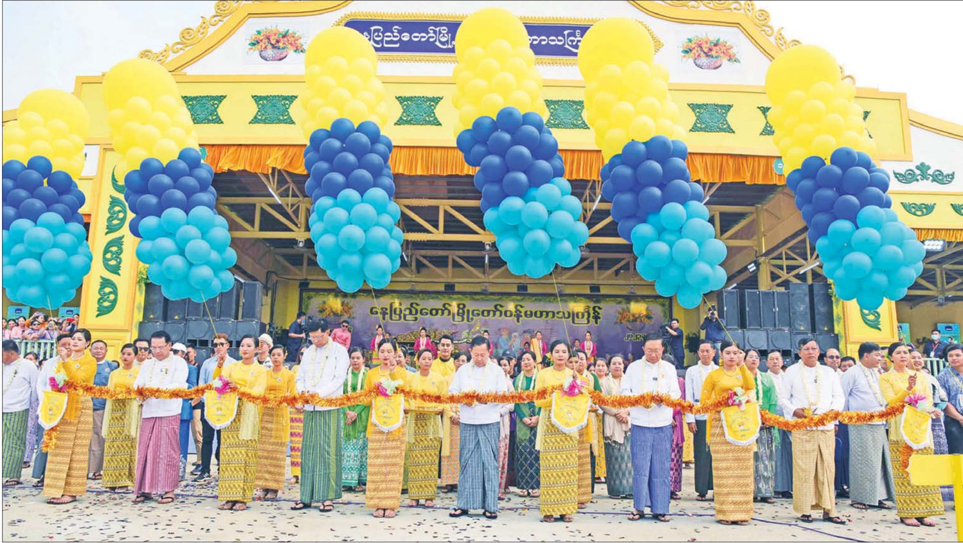
နိုင်ငံတော်စီမံအုပ်ချုပ်ရေးကောင်စီ ဒုတိယဥက္ကဋ္ဌ ဒုတိယဝန်ကြီးချုပ် ဒုတိယဗိုလ်ချုပ်မှူးကြီး စိုးဝင်း၊ နိုင်ငံတော်စီမံအုပ်ချုပ်ရေးကောင်စီဝင် ပြည်ထောင်စုဝန်ကြီး ဗိုလ်ချုပ်ကြီး မြထွန်းဦး၊ ပြည်ထောင်စုဝန်ကြီး ဦးဝင်းရှိန်၊ ပြည်ထောင်စုဝန်ကြီး ဦးမောင်မောင်အုန်းနှင့် နေပြည်တော်ကောင်စီဥက္ကဋ္ဌ မြို့တော်ဝန် ဦးတင်ဦးလွင်တို့ နေပြည်တော်မြို့တော်ဝန် မဟာသင်္ကြန်မဏ္ဍပ်ကို ဖဲကြိုးဖြတ်ဖွင့်လှစ်ပေးစဉ်။