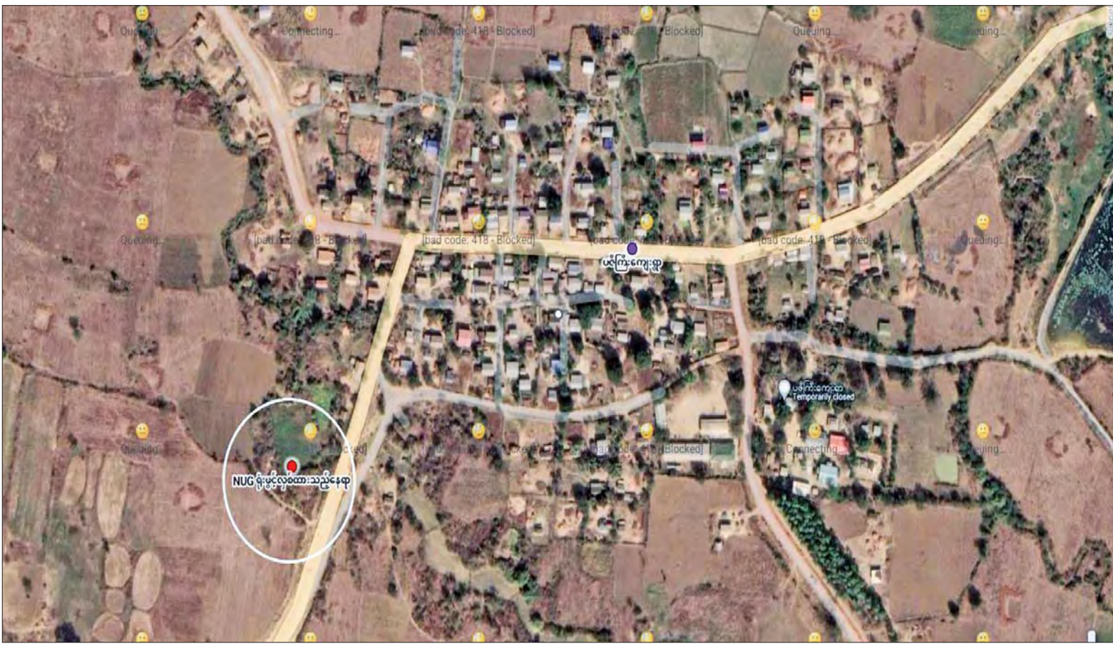
ပဇိကြီးကျေးရွာ အပြင်ဘက်ရှိ NUG ရုံးဖွင့်လှစ်ထားသည့်နေရာပြပုံ။

ပူးပေါင်း၍ စစ်ကိုင်းတိုင်းမြောက်ခြမ်း အဓိက စစ်ရေးလှုပ်ရှားရာနှင့် စစ်ကိုင်း တိုင်းတောင်ခြမ်းသို့ လက်နက်/ခဲယမ်း များနှင့် လေ့ကျင့်ပြီး အကြမ်းဖက်သမား များစေလွှတ်ရာ လမ်းကြောင်းပေါ်ရှိ အဓိက စခန်းထောက်နေရာဖြစ်ကြောင်း၊ PDF အကြမ်းဖက်စစ်သင်တန်းဆင်းပွဲများ မကြာခဏပြုလုပ်ခြင်း၊ နယ်မြေတစ်ဝိုက် မိုင်းထောင်ခြင်း၊ အခိုင်အမာစခန်းများ တည်ဆောက်ခြင်းဖြင့် PDF များ၏ လွတ်မြောက်နယ်မြေအဖြစ် လျာထား ဆောင်ရွက်လာခြင်းဖြစ်ကြောင်း၊ ထိုသို့ အကြမ်းဖက်လုပ်ရပ်များအတွက် ဥပဒေမဲ့ ပြုလုပ်နေမှုများကိုလည်း Social Media