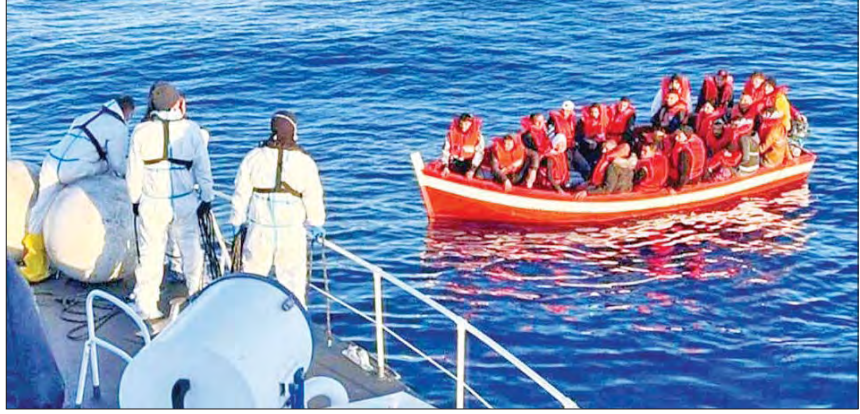
အီတလီကမ်းခြေစောင့်တပ်မှ ကမ်းဆယ်ရေးလုပ်ငန်းများလုပ်ဆောင်နေသည်ကို တွေ့ရစဉ်။

အထိ မြေထဲပင်လယ်ကိုဖြတ်ကျော်၍ အာဖရိက နှင့်အခြားသောနေရာများမှ အီတလီနိုင်ငံသို့ ဝင်ရောက်လာသည့် ရွှေပြောင်းနေထိုင်သူ ၃၀၀၀ ကျော်ရှိသည်ဟု အီတလီအစိုးရက ပြောသည်။ ပြီးခဲ့သည့်နှစ်ကနှင့် နှိုင်းယှဉ်လျှင် အဆိုပါအရေအတွက်မှာ လေးဆ ပို၍များပြား လာခြင်းဖြစ်သည်။