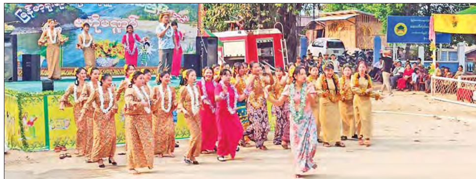
ကချင်ပြည်နယ် ချီဖွေမြို့နယ်၌ မြန်မာ့ရိုးရာ မဟာသင်္ကြန် ပွဲတော်ဗဟိုမဏ္ဍပ် ဖွင့်ပွဲကျင်းပစဉ်။ မြို့နယ်(ပြန်/ဆက်)