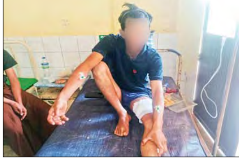
ထိခိုက်ဒဏ်ရာရရှိသူ ချစ်ကိုကို၊ (၂၄)နှစ်