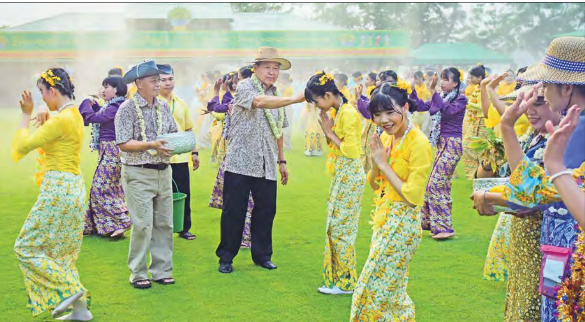
နိုင်ငံတော်စီမံအုပ်ချုပ်ရေးကောင်စီ ဒုတိယဥက္ကဋ္ဌ ဒုတိယတပ်မတော်ကာကွယ်ရေးဦးစီးချုပ်၊ ကာကွယ်ရေးဦးစီးချုပ်(ကြည်း) ဒုတိယဗိုလ်ချုပ်မှူးကြီး စိုးဝင်း ယိမ်းအဖွဲ့များနှင့် ဧည့်ပရိသတ်များကို အောင်သပြေခက်ဖြင့် အတာရေ ပက်ဖျန်းပေးစဉ်။