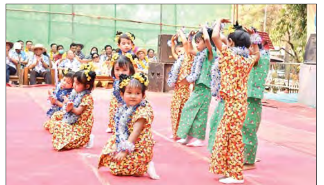
မန္တလေးတိုင်းဒေသကြီး သောင်ဦးမြို့နယ် ဗဟိုမဏ္ဍပ်၌ ကလေးငယ်များ၏ ဖျော်ဖြေတင်ဆက်မှု။ ဒီပါလင်း