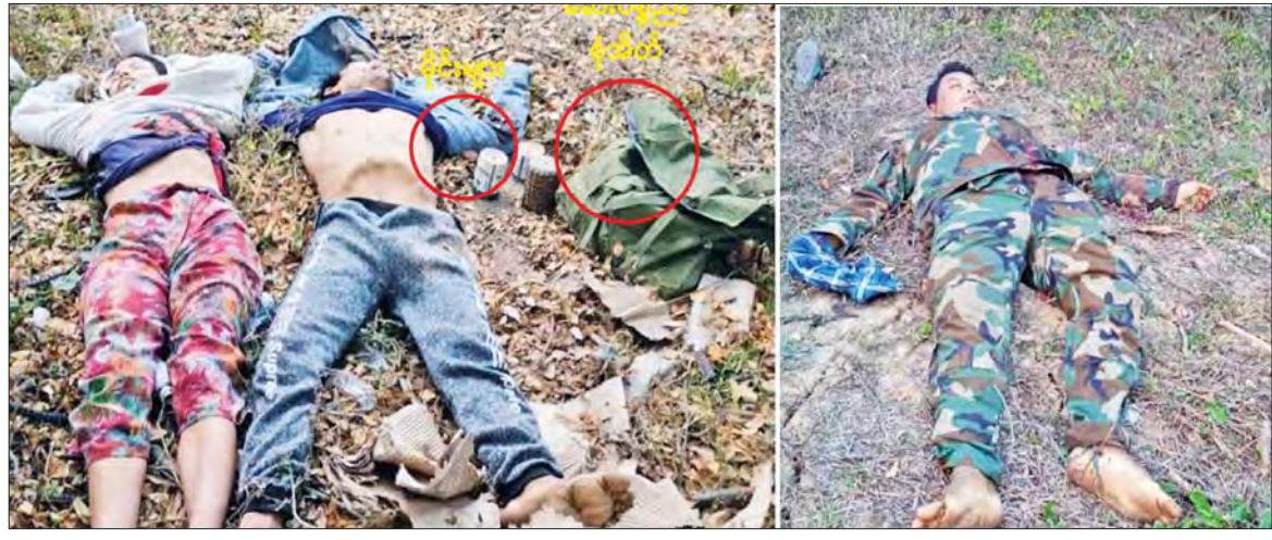
၉-၄-၂၀၂၃ ရက်တွင် KIA/PDF အကြမ်းဖက်သမားများအား မိုင်းများ၊ ဆေးပစ္စည်းစုံအိတ်နှင့်အတူ ပစ်ခတ်ဖမ်းဆီးရမိပုံ။ ၉-၄-၂၀၂၃ ရက်တွင် KIA/PDF အကြမ်းဖက်သမား များအား ပစ်ခတ်ဖမ်းဆီးရမိပုံ။

အဖွဲ့ကြောင့် ပျက်စီးခဲ့သည့် ဘုန်းကြီး ကျောင်း၊ စာသင်ကျောင်းနှင့် လူနေအိမ် များအား လုံခြုံရေးတပ်ဖွဲ့ဝင်များက ပြန်လည်ပြုပြင်ပေးခဲ့ရသည်။ ဖေဖော်ဝါရီ ၉ ရက်တွင် ကန့်ဘလူ မြို့နယ် စံပယ်နံ့သာကျေးရွာနှင့်တန့်ဆည် မြို့နယ် အင်ကုက္ကားကျေးရွာများရှိ ဒေသခံပြည်သူများအား လာရောက် ပစ်ခတ်တိုက်ခိုက်ခဲ့သဖြင့် ကျေးရွာသူ/ ကျေးရွာသား ရှစ်ဦးသေဆုံးခဲ့ပြီး ကလေး သူငယ် နှစ်ဦး ဒဏ်ရာရရှိခဲ့ကြောင်း၊ မတ် ၂ ရက်တွင် ကန့်ဘလူမြို့နယ် ချပ်ကြီး ကျေးရွာ၌ လုံခြုံရေးတပ်ဖွဲ့ဝင်များနှင့် ပြည်သူ့စစ်အဖွဲ့များ နယ်မြေလုံခြုံရေး ဆောင်ရွက်နေစဉ် ၎င်းအကြမ်းဖက်အဖွဲ့