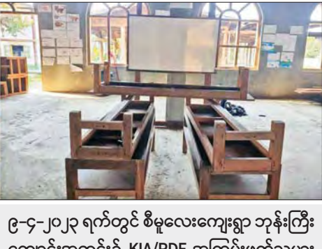
၉-၄-၂၀၂၃ ရက်တွင် စီမူလေးကျေးရွာ ဘုန်းကြီး ကျောင်းအတွင်း KIA/PDF အကြမ်းဖက်သမား များက တရားမဝင် စာသင်ကျောင်းဖွင့်လှစ် သင်ကြားထားမှု။

ရေး ရှောင်တိမ်းစဉ် ပဇိကြီးကျေးရွာအနီး နှင့် အခမ်းအနားနေရာတစ်ဝိုက် ပတ်လည်ထောင်ထားသော အကြမ်းဖက် သမား၏ မိုင်းကွင်းမှ လက်လုပ်မိုင်းအများ အပြားအား နင်းမိခြင်း၊ လူလုပ်ပဒေသာ မိုင်းများ ထပ်ဆင့်ပေါက်ကွဲခြင်းတို့ကြောင့် ထိခိုက်သေဆုံးမှုများရှိကြောင်းကို ၎င်းတို့ ကိုယ်တိုင် ထုတ်လွှင့်ထားသော ရုပ်/သံ ဗီဒီယိုများအရ သိရှိရသည်။