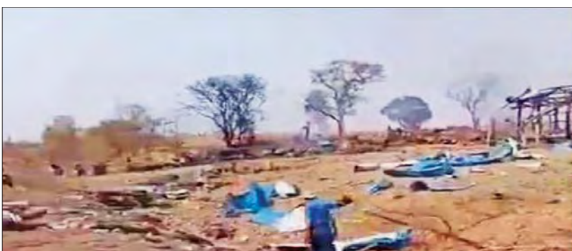
ဖြစ်စဉ်ဖြစ်ပွားရာနေရာတွင် မိုင်းများပေါက်ကွဲခြင်းနှင့် မိုင်းများ ထောင်ထားကြောင်း ရွာသားများ ပြောကြားသည့် ဗီဒီယိုမှတ်တမ်း။

ကန့်ဘလူမြို့နယ် ပဇိကြီးကျေးရွာ ဝန်းကျင်သည် KIA သောင်းကျန်းသူနှင့် PDF အမည်ခံ အကြမ်းဖက်သမားများ