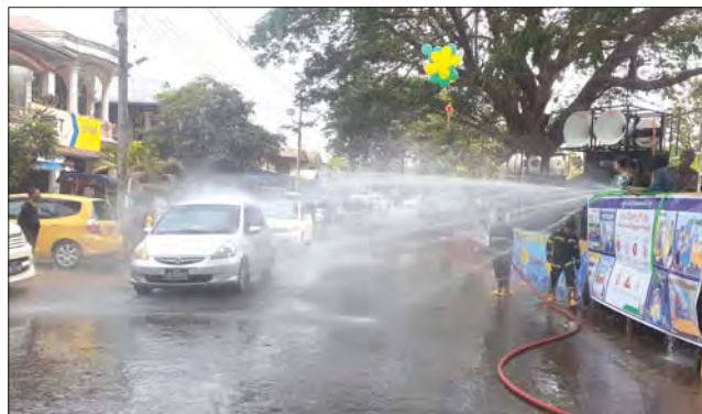
ကရင်ပြည်နယ် လှိုင်းဘွဲ့မြို့နယ် ရေကစားမဏ္ဍပ်၌ ပျော်ရွှင်စွာ ရေပက်ကစားနေသူများ။ စောဒိ(ပြန်/ဆက်)