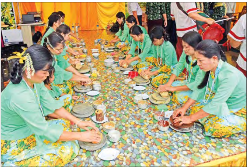
သနပ်ခါးသွေး ပါဝင်ဆင်နွှဲနေသည့်ပျိုမေများ။