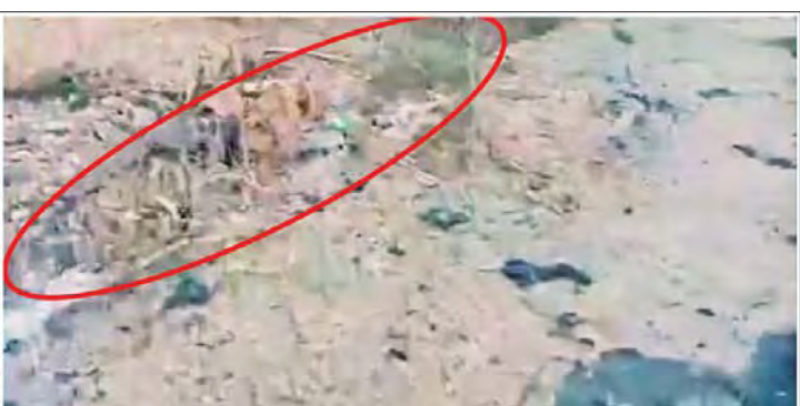
ဖြစ်စဉ်ဖြစ်ပွားရာနေရာတွင် PDF အကြမ်းဖက်သမားများ ပြုလုပ်ထားသည့် ဆက်သွယ်ရေးမြောင်း။