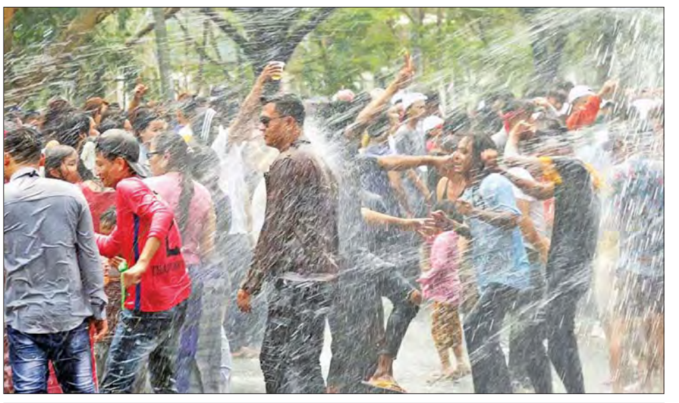
မဟာသင်္ကြန်အကြိုနေ့တွင် မန္တလေးမြို့၌ ပြည်သူများ အေးချမ်းပျော်ရွှင်စွာ ရေကစားနေကြစဉ်။

လည်းကောင်း၊ ဝန်ကြီးဌာနများနှင့် ယိမ်းအကအဖွဲ့များက ယိမ်းအကအလှများဖြင့် လည်းကောင်း ကပြပျော်ဖြေကြရာ သင်္ကြန်ချစ်သူ ပြည်သူများ ပျော်ရွှင်စွာဖြင့် ပါဝင်ဆင်နွှဲကြသည်။ ယခုနှစ် မြန်မာ့ရိုးရာ အတာသင်္ကြန် ပွဲတော်ကာလအတွင်း မန္တလေးမြို့ရှိ ပြည်သူများ ပိုမိုပျော်ရွှင်စွာ သင်္ကြန်ပွဲတော်ကို ဆင်နွှဲနိုင်ရေးအတွက် ချမ်းမြသာစည်မြို့နယ်ရှိ မင်္ဂလာမန္တလေး မြန်မာ့ရိုးရာ လမ်းလျှောက်အတာသင်္ကြန်နှင့် ကျီးတောင်ဘက်ခြမ်းရှိ (၂၆ လမ်း၊ ၆၆ လမ်းမှ ၇၈ လမ်းအထိ) လမ်းလျှောက်သင်္ကြန်တို့