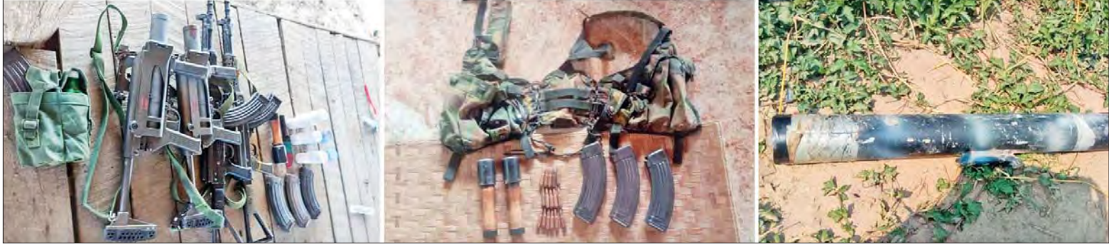
၉-၄-၂၀၂၃ ရက်တွင် KIA/PDF အကြမ်းဖက်သမားများထံမှ လက်နက်၊ ခဲယမ်းများနှင့် ဆက်စပ်ပစ္စည်းများ သိမ်းဆည်းရမိပုံ။