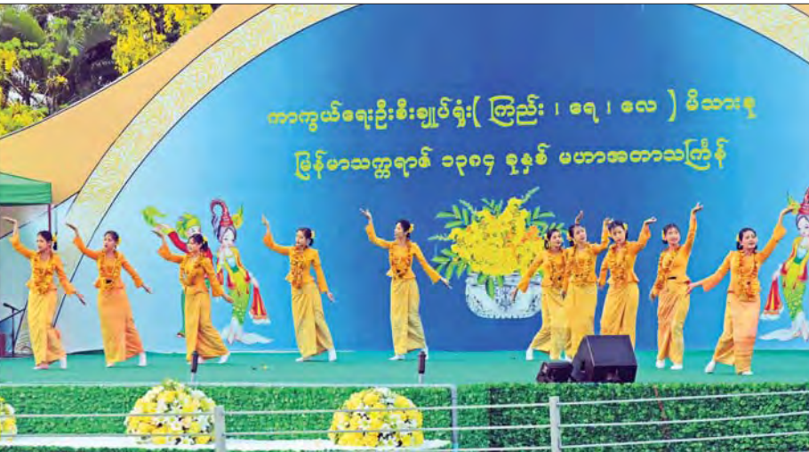
နိုင်ငံတော်စီမံအုပ်ချုပ်ရေးကောင်စီ ဒုတိယဥက္ကဋ္ဌ ဒုတိယတပ်မတော်ကာကွယ်ရေးဦးစီးချုပ်၊ ကာကွယ်ရေးဦးစီးချုပ်(ကြည်း) ဒုတိယဗိုလ်ချုပ်မှူးကြီး စိုးဝင်း ယိမ်းအဖွဲ့ သမီးပျိုများ သင်္ကြန်သီချင်းဖြင့် ကပြဖျော်ဖြေမှုကို ကြည့်ရှုအားပေးစဉ်။

ကာကွယ်ရေးဦးစီးချုပ်ရုံး (ကြည်း၊ ရေ၊ လေ) မိသားစုများ၏ မြန်မာ့ရိုးရာအစဉ် အလာနှင့်အညီ မြန်မာသက္ကရာဇ် ၁၃၈၄ ခုနှစ် မြန်မာ့ရိုးရာ မဟာသင်္ကြန်ပွဲတော် ရေကစားမဏ္ဍပ် ဖွင့်ပွဲအခမ်းအနားကို ယနေ့ ညနေပိုင်းတွင် နေပြည်တော် ဇေယျာသီရိရှိ မြက်ခင်းပြင်၌ ကျင်းပ ပြုလုပ်သည်။ အဆိုပါ ဖွင့်ပွဲအခမ်းအနားကို နိုင်ငံ တော် စီမံအုပ်ချုပ်ရေးကောင်စီဥက္ကဋ္ဌ နိုင်ငံတော် ဝန်ကြီးချုပ်၊ တပ်မတော် ကာကွယ်ရေးဦးစီးချုပ် ဗိုလ်ချုပ်မှူးကြီး မင်းအောင်လှိုင် ကိုယ်စား နိုင်ငံတော်စီမံ အုပ်ချုပ်ရေးကောင်စီ ဒုတိယဥက္ကဋ္ဌ ဒုတိယဝန်ကြီးချုပ်၊ ဒုတိယတပ်မတော် ကာကွယ်ရေးဦးစီးချုပ် ကာကွယ်ရေး ဦးစီးချုပ်(ကြည်း) ဒုတိယဗိုလ်ချုပ်မှူးကြီး စိုးဝင်းနှင့် ဇနီး ဒေါ်သန်းသန်းနွယ်၊ ညွှန်ကြားရေးမှူး (ကြည်း၊ ရေ၊ လေ) ဗိုလ်ချုပ်ကြီး မောင်မောင်အေးနှင့် ဇနီး၊ ပြည်ထောင်စုအဆင့်ပုဂ္ဂိုလ်များနှင့် ဇနီး များ၊ ကာကွယ်ရေးဦးစီးချုပ်ရုံးမှ တပ်မတော်အရာရှိကြီးများနှင့် ဇနီးများ၊ အရာရှိ၊ စစ်သည်၊ မိသားစုများ၊ အနုပညာ ရှင်များ၊ ယိမ်းအဖွဲ့များနှင့် ဖိတ်ကြားထား