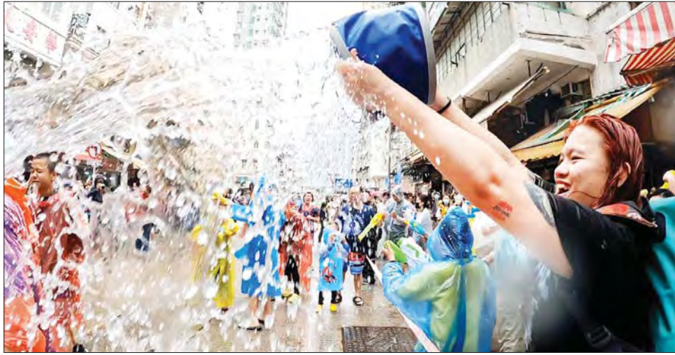
ဆောင်ခရွန်ပွဲတော်တွင် ပျော်ရွှင်စွာ ရေပန်းဖျန်းကစားနေသော ထိုင်းပြည်သူများကို တွေ့ရစဉ်။

ဘန်ကောက်၊ ဧပြီ ၁၃ ထိုင်းနိုင်ငံတစ်ဝန်း ပြည်သူများသည် ရိုးရာနှစ်သစ်ကူးအားလပ်ရက်ကို ရေများပန်းဖျန်းပြီး ဆင်နွှဲကြသည်။ အဆိုပါပွဲတော်ကို နှစ်ပေါင်း လေးနှစ်ကြာပြီးနောက် ပထမဆုံးအကြိမ် ယခုကဲ့သို့ ခမ်းနားသိုက်မြိုက်စွာ ကျင်းပခဲ့ကြသည်။