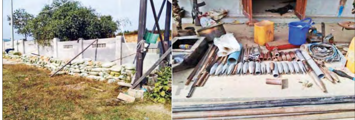
၁-၃-၂၀၂၃ ရက်တွင် PDF အမည်ခံ အကြမ်းဖက်သမားများက ထီးချိုင့်မြို့နယ် မရသိမ်ကျေးရွာရှိ အခြေခံပညာမူလတန်း ကျောင်းအတွင်း စခန်းချအခြေပြု အကာအကွယ်ရယူ၍ အကြမ်းဖက်လုပ်ရပ်များလုပ်ဆောင်ရန် ပြင်ဆင်ထားသည့် မှတ်တမ်း ဓာတ်ပုံများ။

ကန့်ဘလူမြို့နယ် ပဇာတိကျေးရွာ အနီးဖြစ်စဉ်တွင် PDF အကြမ်းဖက်သမားများ ကို ဦးတည်တိုက်ခိုက်ခဲ့ရာ အကြမ်းဖက်မှု ကို အားပေးထောက်ခံသည့် အရပ်ဝတ် အကြမ်းဖက်သမားအချို့ ဆက်စပ်သေဆုံး မှုများရှိနိုင်ကြောင်းနှင့် အကြမ်းဖက် မှုများတွင် ဆက်စပ်ပါဝင်သူများသည် အရပ်ဝတ်ပင် ဝတ်ဆင်ထားစေကာမူ အကြမ်းဖက်မှု တိုက်ဖျက်ရေးဥပဒေအရ အကြမ်းဖက်မှုတွင် အကျိုးဝင်သူများ ဖြစ်ပါသည်။ အကြမ်းဖက်မှု တိုက်ဖျက် ရေးဥပဒေပုဒ်မ ၃ ပုဒ်မခွဲ(ခ)၊ ပုဒ်မခွဲငယ် (၁၆)တွင် “အကြမ်းဖက်အုပ်စုဖွဲ့စည်းရန်၊ အကြမ်းဖက်အုပ်စုတစ်ခုခုတွင် သိလျက် နှင့်ပါဝင်ဆောင်ရွက်ရန်၊ တာဝန်ပေး၍ လှုပ်ရှားဆောင်ရွက်စေရန်ပြုလုပ်မှုများ” သည်အကြမ်းဖက်မှုဖြစ်သည်ဟု လည်း ကောင်း ပုဒ်မခွဲ(၁)တွင် “အကြမ်းဖက် သမားဆိုသည်မှာ အကြမ်းဖက်မှု တစ်ခုခု ကို တိုက်ခိုက်ဖြစ်စေ၊ သွယ်ဝိုက်၍ဖြစ်စေ ဥပဒေနှင့်မညီဘဲ တစ်နည်းနည်းဖြင့် ကျူးလွန်သူ သို့မဟုတ် ကျူးလွန်ရန် အားထုတ်သူ ကိုယ်တိုင်သော်လည်း ကောင်း၊ အကြမ်းဖက်မှုတွင် ကြံရာပါ အဖြစ်