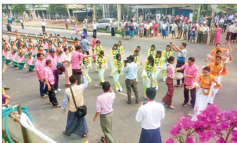
သန်လျင်မြို့နယ် မြန်မာ့ရိုးရာ ယဉ်ကျေးမှု အတာသင်္ကြန် ဖျော်ဖြေရေးနှင့် ရေကစားမဏ္ဍပ် ဖွင့်ပွဲကို ဧပြီ ၁၃ ရက်က မြို့နယ် အထွေထွေအုပ်ချုပ်ရေး ဦးစီးဌာနရုံးရှေ့ မဏ္ဍပ်၌ကျင်းပစဉ်။ (အဆိုပါမဏ္ဍပ်တွင် ယိမ်းအကများ၊ ဂီတအနုပညာရှင်များ၏ သီဆိုဖျော်ဖြေမှုများ၊ စတုဒိသာ ကျွေးမွေး လှူဒါန်းမှုများဖြင့် စည်ကားစွာ ကျင်းပမည်ဖြစ် သည်။) သန်းဝင်း(သန်လျင်)