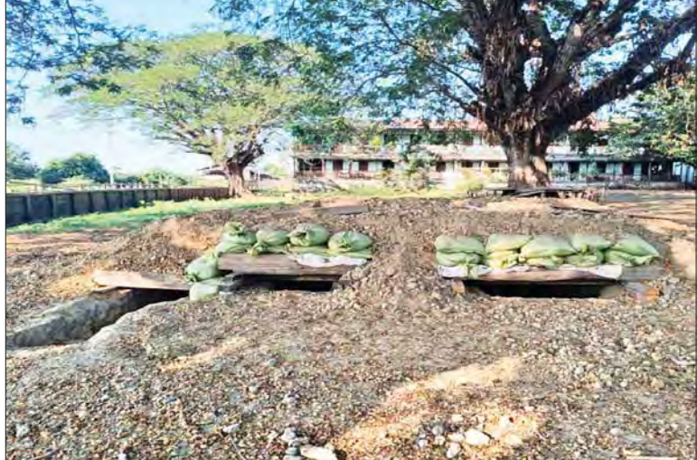
၇-၂-၂၀၂၃ ရက်တွင် KIA အဖွဲ့နှင့် PDF အမည်ခံအကြမ်းဖက် သောင်းကျန်းသူ အဖွဲ့များက မိုးတားလေးကျေးရွာရှိ အခြေခံပညာ အထက်တန်းကျောင်းဝင်းအတွင်း ခံစစ်စခန်းသဖွယ် ဆောက်လုပ်ထားသည့် မှတ်တမ်းဓာတ်ပုံ။

အကြမ်းဖက်သမားများအနေဖြင့် ၎င်းတို့ အခြေပြုနေထိုင်ခဲ့သည့် အထောက် အထားများ မကျန်စေရန်အတွက် စာသင်ကျောင်းအား မီးရှို့၊ ဖောက်ခွဲ ဖျက်ဆီးခဲ့ကြပြီး ဖရိုဖရဲဖြင့် ထွက်ပြေး သွားခဲ့ကြောင်း သိရှိရသည်။ လက်နက်/ခဲယမ်းများ သိမ်းဆည်းရမိ ဆက်လက်၍ ၂၀၂၃ ခုနှစ် ဖေဖော်ဝါရီ ၇ ရက်ခန့်မှစတင်ကာ ကသာမြို့နယ် မိုးတားလေးကျေးရွာရှိ ဘုန်းတော်ကြီး ကျောင်းများ၊ ဘုရားစေတီပုထိုးများ၊ စာသင်ကျောင်းများအတွင်းသို့ အခိုင် အမာခံရောက်နေထိုင်ကာ ဆက်ကြေး ကောက်ခံခြင်း၊ ဒေသခံပြည်သူများအား နှိပ်စက်သတ်ဖြတ်ခြင်းများ ပြုလုပ်နေ ကြောင်း ဒေသခံပြည်သူတို့၏ လျှို့ဝှက် သတင်းပေးပို့ချက်အရ အကြမ်းဖက် ချေမှုန်းရေးစစ်ဆင်ရေး (Counter - Terrorism Operation) ကို ဇန်နဝါရီ ၁၈ ရက်မှ ၂၂ ရက်အထိ ပြုလုပ်ခဲ့ပြီး တိုက်ပွဲ ခုနစ်ကြိမ်ဖြစ်ပွားခဲ့ကာ လက်နက်/ခဲယမ်း များ သိမ်းဆည်းရမိခဲ့သည်။ အကြမ်းဖက်