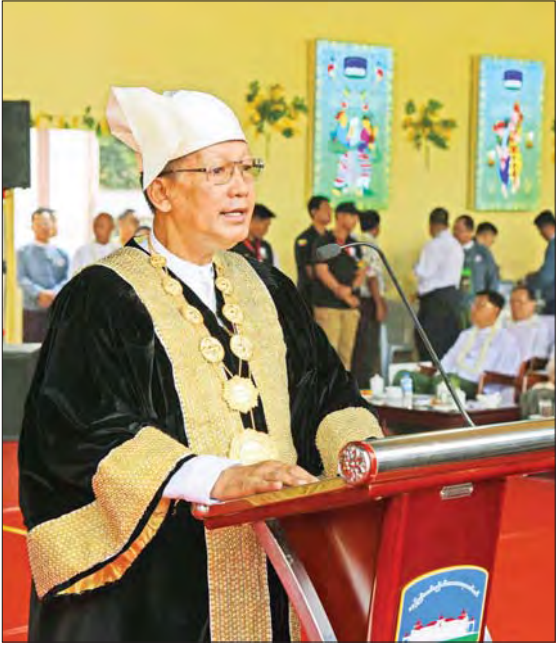
နေပြည်တော်ကောင်စီဥက္ကဋ္ဌ မြို့တော်ဝန် ဦးတင်ဦးလွင် နှစ်သစ်ကူး နှုတ်ခွန်းဆက်စကား ပြောကြားစဉ်။