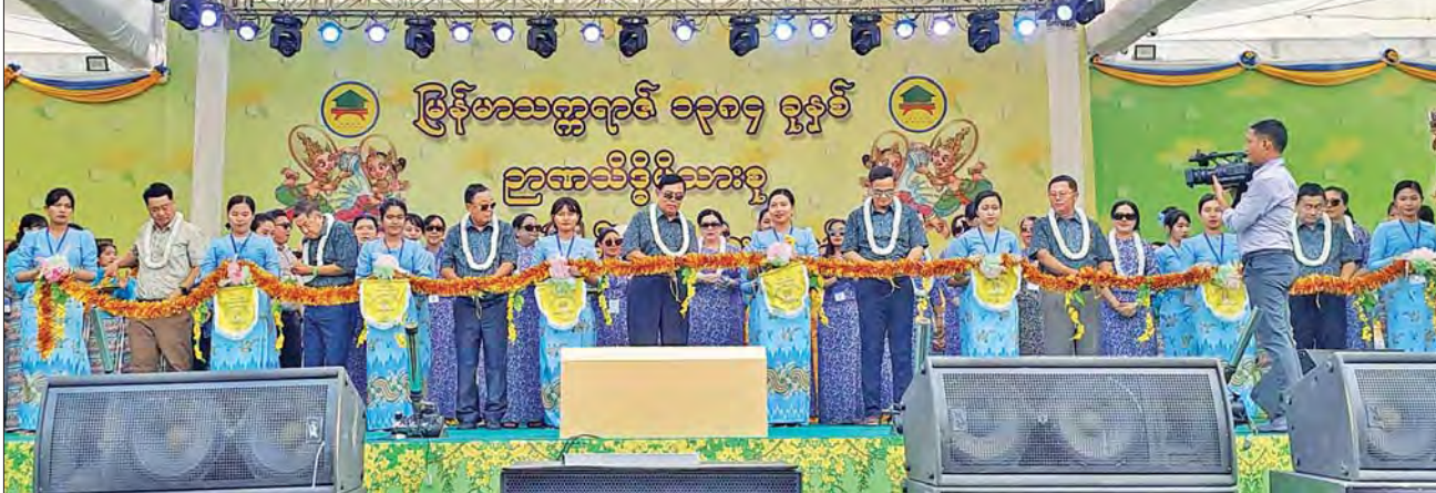
လမ်းဦးစီးဌာန၊ တံတားဦးစီးဌာနနှင့် မြို့ပြနှင့် အိမ်ရာဖွံ့ဖြိုးရေးဦးစီးဌာနတို့မှ ညွှန်ကြားရေးမှူးချုပ်များနှင့် ဇနီးများ၊ ဌာနကြီးမှူးများ၊ ဝန်ထမ်းမိသားစုများ၊ နိုင်ငံကျော် အဆိုတော်များ၊ ယိမ်းအကအဖွဲ့များ၊ ဖိတ်ကြားထားသည့် ဧည့်သည်တော်များ တက်ရောက်ကြသည်။ (အပေါ်ပုံ) ထို့နောက် မြန်မာ့ရိုးရာအတာသင်္ကြန်ပွဲတော် ရေကစားမဏ္ဍပ်ကို ဆောက်လုပ်ရေးဝန်ကြီးဌာန ပြည်ထောင်စုဝန်ကြီး ဦးမျိုးသန့်၊ ဒုတိယဝန်ကြီး ဦးဝင်းဖေ၊ အမြဲတမ်းအတွင်းဝန် ဦးဝဏ္ဏဇော်နှင့် ညွှန်ကြားရေးမှူးချုပ်များက ဖဲကြိုးဖြတ်ဖွင့်လှစ်ပေးကြသည်။ (အပေါ်ပုံ)

အခမ်းအနားသို့ ဆောက်လုပ်ရေးဝန်ကြီးဌာန ပြည်ထောင်စုဝန်ကြီး ဦးမျိုးသန့်နှင့် ဇနီး၊ ဒုတိယဝန်ကြီး ဦးဝင်းဖေနှင့် ဇနီး၊ အမြဲတမ်းအတွင်းဝန် ဦးဝဏ္ဏဇော်နှင့် ဇနီး၊ အဆောက်အဦဦးစီးဌာန