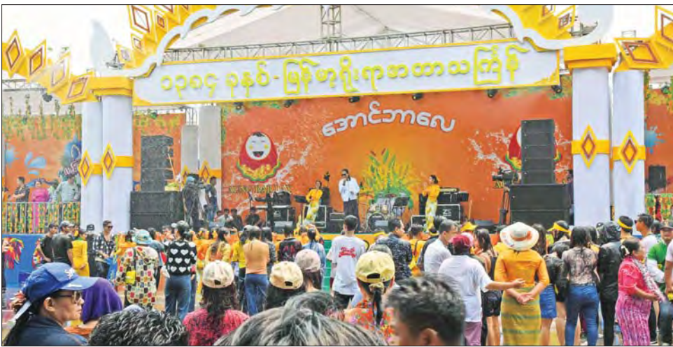
နိုင်ငံကျော်တေးသံရှင်များ၏ ပျော်ဖြေတင်ဆက်မှုကို တွေ့ရစဉ်။