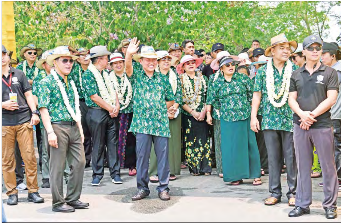
နိုင်ငံတော်စီမံအုပ်ချုပ်ရေးကောင်စီ ဒုတိယဥက္ကဋ္ဌ ဒုတိယဝန်ကြီးချုပ် ဒုတိယဗိုလ်ချုပ်မှူးကြီး စိုးဝင်းနှင့် အဖွဲ့ဝင်များ ခေတ် ၄ ခေတ် သင်္ကြန်ပွဲ ဆင်နွှဲသရုပ်ဖော်မှုများကို ကြည့်ရှုအားပေးစဉ်။