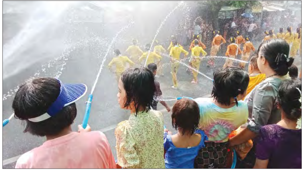
ပဲခူးတိုင်းဒေသကြီး ဖြူးမြို့နယ် ဗဟိုမဏ္ဍပ်၌ ရေကစားနေသူများ။ နေမျိုးလွင်(ပြန်/ဆက်)