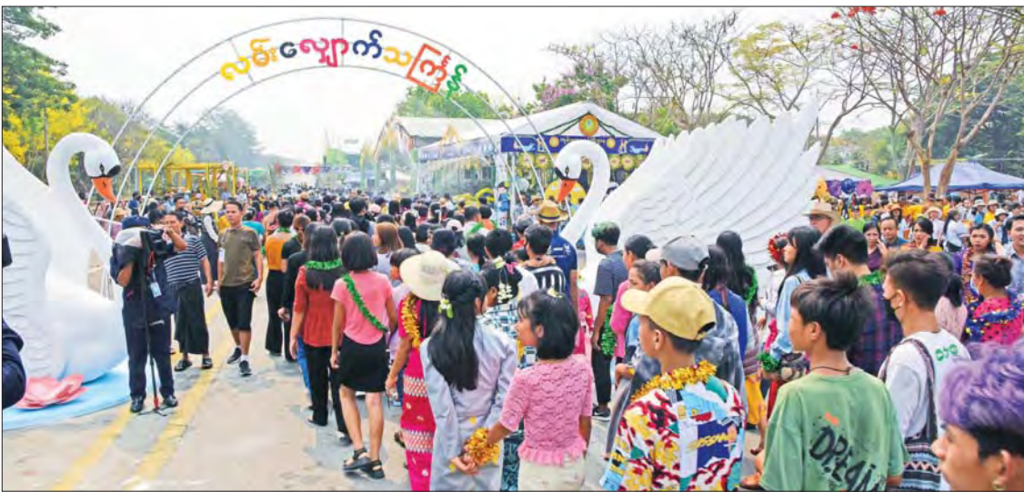
လမ်းလျှောက်သင်္ကြန်တွင် ပြည်သူများ ပျော်ရွှင်စွာ ပါဝင်ဆင်နွှဲနေမှုကို တွေ့ရစဉ်။