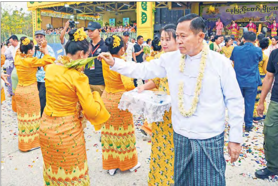
နိုင်ငံတော်စီမံအုပ်ချုပ်ရေးကောင်စီ ဒုတိယဥက္ကဋ္ဌ ဒုတိယဝန်ကြီးချုပ် ဒုတိယဗိုလ်ချုပ်မှူးကြီး စိုးဝင်း သင်္ကြန်ယိမ်းအကအဖွဲ့များအား သပြေခက်ဖြင့် အတာသင်္ကြန်ရေပက်ဖျန်းပေးစဉ်။