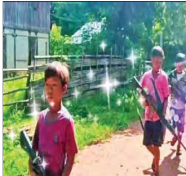
ကလေးသူငယ်များအား လက်နက်ကိုင်ဆောင်စေ၍ အကြမ်းဖက်ဆောင်ရွက်မှုများတွင် ပါဝင်လာအောင် ဆောင်ရွက်နေသည့် မှတ်တမ်းဓာတ်ပုံများ။

ကြိုးပမ်းလာခဲ့သည်။ အဆိုပါအကြမ်းဖက် အဖွဲ့သည် ၂၀၂၂ ခုနှစ် ဧပြီ ၄ ရက်မှ စတင်၍ ပင်လည်ဘူးမြို့နယ်အတွင်းသို့ လုံခြုံရေးတပ်ဖွဲ့များမရှိစဉ် ပစ်ခတ် ဝင်ရောက်၍ ဆေးရုံ၊ စာသင်ကျောင်း၊ မီးသတ်အဆောက်အဦ၊ မြန်မာ့စီးပွားရေး ဘဏ်၊ ဘုရားကုန်းနှင့် လူနေအဆောက် အဦများကိုအကာအကွယ်ယူကာမြို့နယ် အထွေထွေ အုပ်ချုပ်ရေးမှူးရုံးနှင့် ရဲစခန်း တို့ကို သာလွန်အင်အားဖြင့် ဝင်ရောက် တိုက်ခိုက်ခဲ့သဖြင့် အပြစ်မဲ့ပြည်သူနှင့် ဝန်ထမ်းများ သေဆုံးထိခိုက်ဒဏ်ရာရရှိ ခဲ့ကြောင်း၊ ဒီဇင်ဘာ ၇ ရက်တွင် ကန့်ဘလူမြို့နယ် စာမျက်နှာ ၁၈ သို့