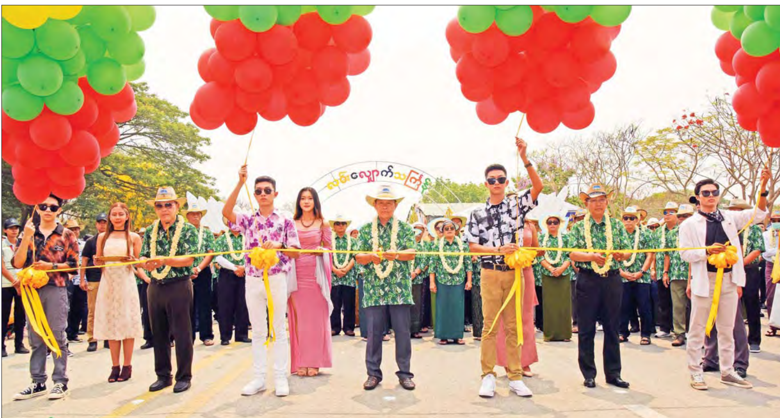
နိုင်ငံတော်စီမံအုပ်ချုပ်ရေးကောင်စီ ဒုတိယဥက္ကဋ္ဌ ဒုတိယဝန်ကြီးချုပ် ဒုတိယဗိုလ်ချုပ်မှူးကြီး စိုးဝင်း၊ ပြည်ထောင်စုဝန်ကြီး ဦးမောင်မောင်အုန်းနှင့် နေပြည်တော်မြို့တော်ဝန် ဦးတင်ဦးလွင်တို့ နေပြည်တော်လမ်းလျှောက်သင်္ကြန်မုခ်ဦးကို ဖဲကြိုးဖြတ်ဖွင့်လှစ်ပေးစဉ်။

နေပြည်တော်၌ မြို့တော်ဝန် မဟာသင်္ကြန်မဏ္ဍပ်အပြင် နေပြည်တော်