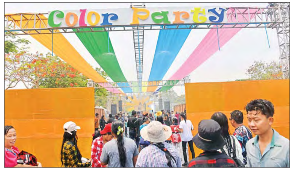
နေပြည်တော်လမ်းလျှောက်သင်္ကြန်၌ လာရောက်လည်ပတ်ကြသူများဖြင့် စည်ကားလျက်ရှိစဉ်။

ခဲ့ကြသည့်အပြင် သနပ်ခါးသင်္ကြန်ဇန်တွင် သနပ်ခါးများလိမ်းခြယ်ပြီး အတာသင်္ကြန်ကို ပျော်ရွှင်စွာ ပါဝင်ဆင်နွှဲ၍ ရအောင်စီစဉ် ဆောင်ရွက်ပေးထားခြင်း၊ တိုင်းရင်းသားသင်္ကြန်ဇန်တွင် တိုင်းရင်းသားရိုးရာ ယဉ်ကျေးမှုများကို ပြသထားပြီး တိုင်းရင်းသားညီအစ်ကို မောင်နှမများနှင့်အတူ ရေပတ်ကစားနိုင်ရန် စီစဉ်ဆောင်ရွက်ထားခြင်း၊ ဖျော်ဖြေရေးဇန်တွင် နိုင်ငံတကာအဆင့်မီ ဖျော်ဖြေတင်ဆက်မှုများနှင့် အလှပြပျော်ဖြေရေးအစီအစဉ်များ ထည့်သွင်း စီစဉ်ဆောင်ရွက်ထားခြင်း၊ လူကြီးများ ပါဝင်ဆော့ကစားနိုင်သည့် ရေလွှာလျှောစီးနှင့် ကလေးငယ်များအတွက် ပျော့အိကစားကွင်းများ ထည့်သွင်း တည်ဆောက်ထားခြင်းတို့ကြောင့် ပြည်သူများနှင့် ကလေးငယ်များပါ ပျော်ရွှင်