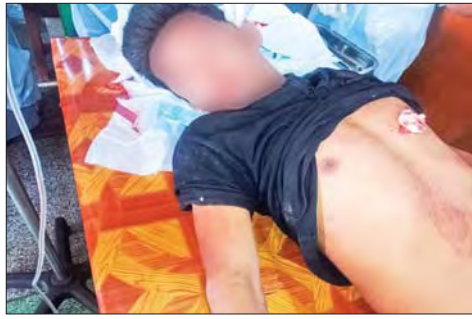
ထိခိုက်ဒဏ်ရာရရှိသူ မျိုးမြတ်သူ၊ (၂၃)နှစ်