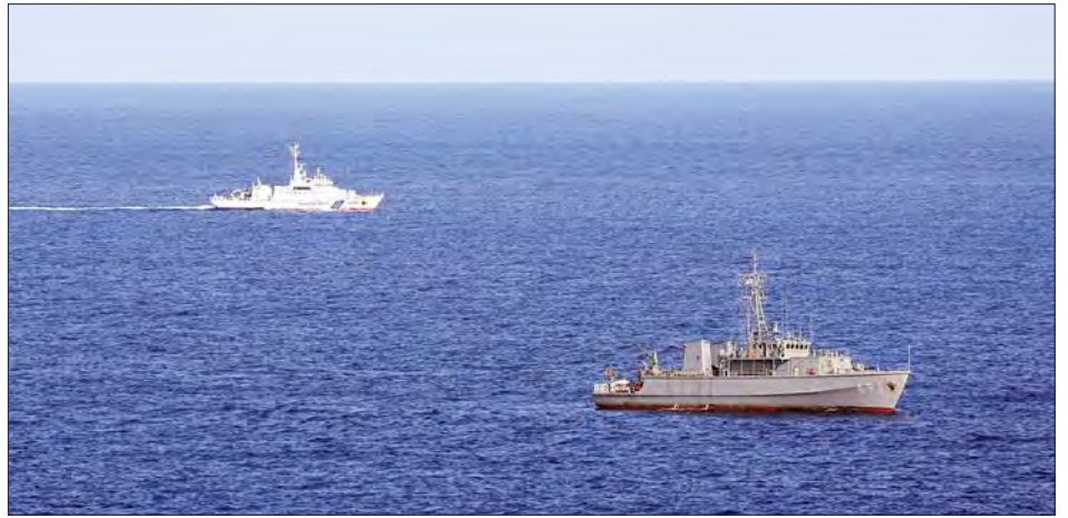
ပျောက်ဆုံးနေသော ရဟတ်ယာဉ်ကို ရှာဖွေလျက်ရှိသည့် ကမ်းဆယ်ရှာဖွေရေးသင်္ဘောများကို တွေ့ရစဉ်။

ဂျပန်ကိုယ်ပိုင်ကာကွယ်ရေးတပ်ဖွဲ့နှင့် ကမ်းခြေစောင့်တပ်ဖွဲ့တို့သည် လွန်ခဲ့သော သီတင်းပတ်က ဂျပန်နိုင်ငံ အနောက်တောင်ပိုင်း၌ လူ ၁၀ ဦးနှင့်အတူ ပျောက်ဆုံးခဲ့သော မြေပြင်ကိုယ်ပိုင် ကာကွယ်ရေးတပ်ဖွဲ့၏ ရဟတ်ယာဉ်တစ်စင်းကို ဆက်လက်ရှာဖွေခဲ့ကြသည်။