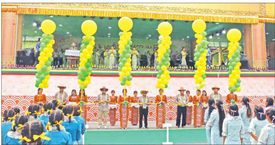
ထို့နောက် ဗဟိုမဏ္ဍပ်၌ ယိမ်းအကအလှများ ဖျော်ဖြေတင်ဆက်မှု၊ နာမည်ကျော် တေးသီချင်းများ၊ ဒေသခံအဆိုတော်များ၏ ခေတ်ပေါ်တေးသီချင်းဖြင့် သီဆိုဖျော်ဖြေတင်ဆက်မှုများကို ဒေသခံပြည်သူများနှင့်အတူ အားပေးကြည့်ရှုခဲ့ကြောင်း သိရသည်။ ပြည်နယ် (ပြန်/ဆက်)

ဦးခက်ထိန်နန်က ဗဟိုမဏ္ဍပ်အား ဖွင့်လှစ်လိုက်ကြောင်း ကြေညာရာ ပြည်နယ်တရားလွှတ်တော်တရား သူကြီးချုပ် ဦးတူးဂျာ၊ ပြည်နယ် ဝန်ကြီးများဖြစ်ကြသည့် လုံခြုံရေး နှင့် နယ်စပ်ရေးရာဝန်ကြီး ဗိုလ်မှူး ကြီး အောင်ကြည်လင်း၊ စီးပွား ရေးရာဝန်ကြီး ဦးမျိုးဆွေ၊ သယံဇာတရေးရာဝန်ကြီး ဦးတိန်ဆောင် နှင့် တိုင်းရင်းသားရေးရာဝန်ကြီး ဦးကျော်မင်းခိုင်တို့က ဖဲကြိုးဖြတ် ဖွင့်လှစ်ပေးသည်။ (အပေါ်ယာပုံ)