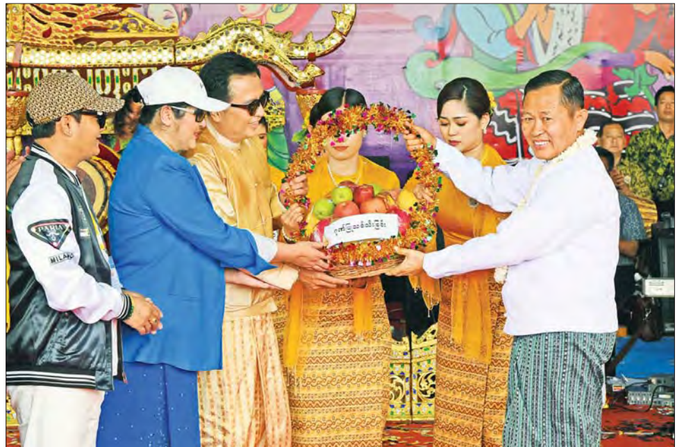
နိုင်ငံတော်စီမံအုပ်ချုပ်ရေးကောင်စီ ဒုတိယဥက္ကဋ္ဌ ဒုတိယဝန်ကြီးချုပ် ဒုတိယဗိုလ်ချုပ်မှူးကြီး စိုးဝင်း နိုင်ငံကျော်တေးသံရှင်များနှင့် အနုပညာရှင်များအား ဂုဏ်ပြုသစ်သီးခြင်း ပေးအပ်စဉ်။