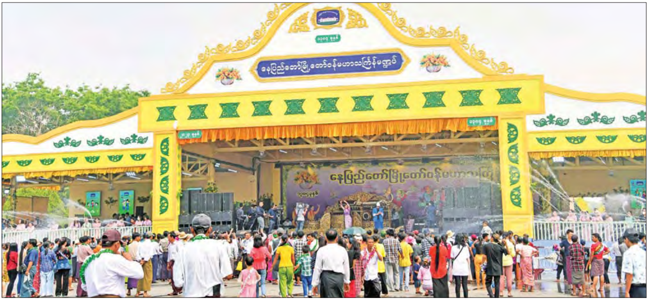
နေပြည်တော်မြို့တော်ဝန်မဟာသင်္ကြန်မဏ္ဍပ်၌ နိုင်ငံကျော်အနုပညာရှင်များ၊ တေးသံရှင်များက တေးသီချင်းများဖြင့် သီဆိုကပြပျော်ဖြေကြစဉ်။

အလားတူ ကာကွယ်ရေးဦးစီးချုပ်ရုံး(ကြည်း) မဟာသင်္ကြန်ရေကစားမဏ္ဍပ်တွင်လည်း နိုင်ငံကျော် အနုပညာရှင်များ၊ တေးသံရှင်များက တေးသီချင်းများဖြင့် လာရောက် ပျော်ဖြေခဲ့ကြသည့်အပြင် သင်္ကြန်ယိမ်းအဖွဲ့များကလည်း ညီညာလှပသည့် ယိမ်းအက အလှများဖြင့် ပါဝင်ဖြည့်စွက်ပျော်ဖြေခဲ့ကြသည့်အတွက် ရေပက်ခံကားများနှင့် ရေကစားကြသည့် ပြည်သူများဖြင့် စည်ကားခဲ့သည်။