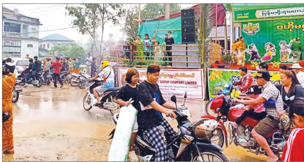
ရှမ်းပြည်နယ် မိုင်းယောင်းမြို့ ဗဟိုမဏ္ဍပ်၌ ရေကစားနေသူများနှင့် ရေပက်ခဲနေသူများ။ မိုင်းအောင်ဇော်လင်း