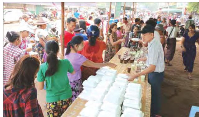
မွန်ပြည်နယ် ကျိုက်ထိုမြို့ ပြည်သူ့ဈေးရေ စတုဒိသာမဏ္ဍပ်၌ ကျွေးမွေးလှူဒါန်းမှုများ။ မြို့နယ်(ပြန်/ဆက်)