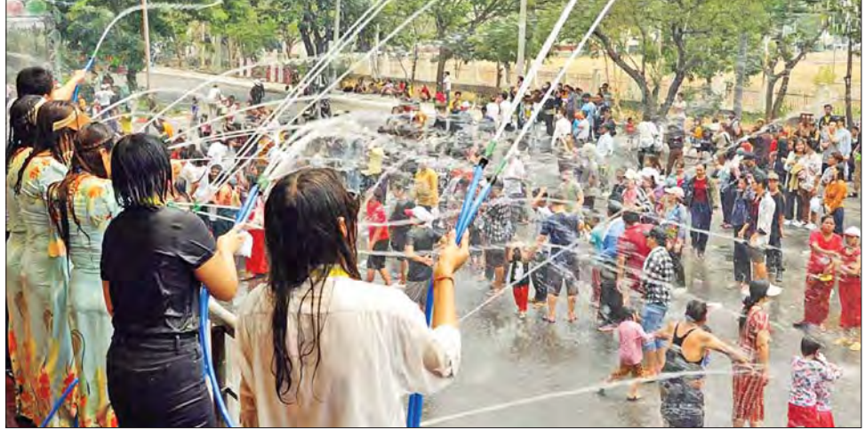
မဟာသင်္ကြန်အကြိုနေ့တွင် မန္တလေးမြို့၌ ပြည်သူများ အေးချမ်းပျော်ရွှင်စွာ ရေကစားနေကြစဉ်။

၌လည်း နိုင်ငံကျော်အဆိုတော်များနှင့် အနုပညာရှင်များ၏ ပျော်ဖြေမှုများ၊ စတုဒိသာမဏ္ဍပ်များ၊ ရေကစားမဏ္ဍပ်များနှင့် အပန်းဖြေအနားယူနိုင်မည့် အစီအစဉ်ကောင်းများ ထည့်သွင်း၍ ကျင်းပလျက်ရှိရာ ပြည်သူများ စိတ်ပျော်ရွှင်ချမ်းမြေ့စွာဖြင့် ဆင်နွှဲကြသည်။ အလားတူ သင်္ကြန်ချစ်သူ မိသားစုများ၊ သူငယ်ချင်း၊ မိတ်ဆွေများ စုပေါင်း၍ သင်္ကြန်ရေပက်ခံကားများ၊ ဆိုင်ကယ်များကို တပျော်တပါး ရေပက်ဖျန်းခြင်း၊ မြို့နယ်၊ ရပ်ကွက်များအလိုက်