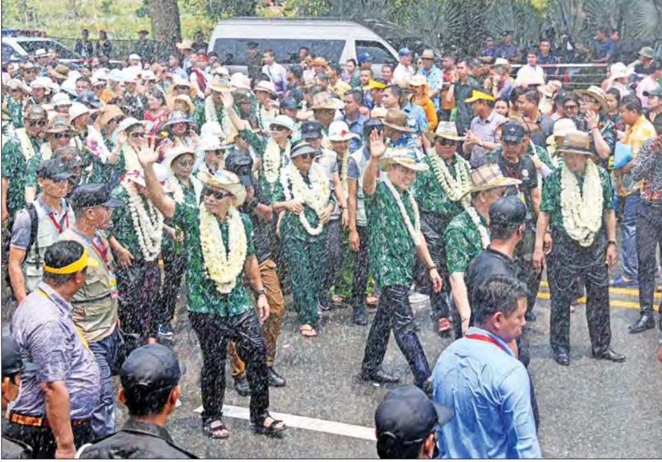
နိုင်ငံတော်စီမံအုပ်ချုပ်ရေးကောင်စီ ဒုတိယဥက္ကဋ္ဌ ဒုတိယဝန်ကြီးချုပ် ဒုတိယဗိုလ်ချုပ်မှူးကြီး စိုးဝင်းနှင့် အဖွဲ့ဝင်များ နေပြည်တော်လမ်းလျှောက်သင်္ကြန်ဇုန်အတွင်း လှည့်လည်ကြည့်ရှုအားပေးပြီး ဝန်ထမ်းများ၊ ဝန်ထမ်းမိသားစုများ၊ ပြည်သူများနှင့်အတူ တစ်ခဲနက် အတာရေသတင်ပွဲကို ပျော်ရွှင်စွာဆင်နွှဲစဉ်။