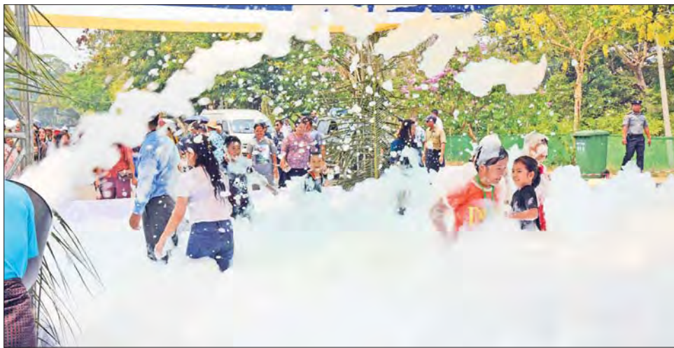
ကစားကွင်းတွင် ကလေးငယ်များ ပျော်ရွှင်စွာ ကစားနေမှုကို တွေ့ရစဉ်။

စာမျက်နှာ ၄ မှ ရည်ရွယ်၍ နေပြည်တော်လမ်းလျှောက် ထည့်သွင်းကျင်းပလျက်ရှိသည်။ လူငယ်နှင့် ကလေးငယ်များအတွက် ပြည်နယ်များတွင် စည်ကားသိုက်မြိုက်စွာ ယခုနှစ် အတာသင်္ကြန်ပွဲတော်တွင် သင်္ကြန်ကို သင်္ကြန်အကြီးအမှတ်စဉ်ကား ဇုန် (၁) တွင် သနပ်ခါးသင်္ကြန်၊ ဇုန် (၂) တွင် တိုင်းရင်းသားသင်္ကြန်၊ ဇုန် (၃) တွင် မြန်မာမှုမပျောက်ပျက်စေရန်နှင့် နိုင်ငံတကာအဆင့်တန်းမီ အလှပြ ပျော်ဖြေရေးအစီအစဉ်များနှင့် ဇုန် (၄) တွင် ဝန်ထမ်းများအချင်းချင်း၊ ဝန်ထမ်း စည်ပင်ဧည့်ရိပ်သာလမ်းဆုံအထိ ဇုန် (၄) ဇုန် သတ်မှတ်ကာ ခေတ်နှင့်အညီ ဖျော်ဖြေရေးအစီအစဉ်များနှင့် ဇုန် (၄) တွင် မဟာအတာသင်္ကြန်ပွဲတော်ကို နေပြည်တော်၊ ရန်ကုန်နှင့် မန္တလေးမြို့ကြီး များ အပါအဝင် တိုင်းဒေသကြီးနှင့်