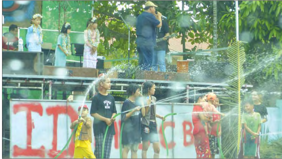
မွန်ပြည်နယ် ချောင်းဆုံမြို့နယ်၌ အတာရေသဘင်ပွဲဆင်နွှဲနေကြသူ ပြည်သူများ။ မြို့နယ်(ပြန်/ဆက်)

မြန်မာ့ရိုးရာနှစ်သစ်ကူး သင်္ကြန်အကြိုနေ့ ဧပြီ ၁၃ ရက်တွင် မြို့နယ်အသီးသီး၌ သင်္ကြန်ရေကစားမဏ္ဍပ်နှင့် ဖျော်ဖြေရေးမဏ္ဍပ်ဖွင့်ပွဲများကို ကျင်းပကြပြီး အဆိုပါ မဏ္ဍပ်များအပါအဝင် လမ်းလျှောက်သင်္ကြန်နေရာများ၌ ပြည်သူများ ပျော်ရွှင်စွာ ရေကစားနေကြပုံများ၊ စတုဒိသာကျွေးမွေးလှူဒါန်းမှုများကို စုစည်းဖော်ပြလိုက်ပါသည်။