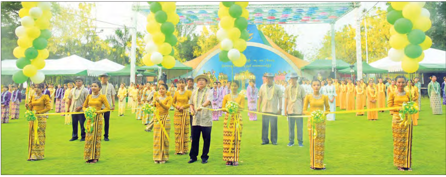
နိုင်ငံတော်စီမံအုပ်ချုပ်ရေးကောင်စီ ဒုတိယဥက္ကဋ္ဌ ဒုတိယတပ်မတော်ကာကွယ်ရေးဦးစီးချုပ်၊ ကာကွယ်ရေးဦးစီးချုပ်(ကြည်း) ဒုတိယဗိုလ်ချုပ်မှူးကြီး စိုးဝင်း ကာကွယ်ရေး ဦးစီးချုပ်ရုံး (ကြည်း၊ ရေ၊ လေ) မိသားစုရေကစားမဏ္ဍပ်ကို ဖဲကြိုးဖြတ်ဖွင့်လှစ်ပေးစဉ်။

နေပြည်တော် ဧပြီ ၁၃ သင်္ကြန်ဆိုသည်မှာ “သင်္ကြံ” ဆိုသော ပါဠိပုဒ်မှ ဆင်းသက်လာပြီး “ကူးပြောင်းခြင်း” ဟု အဓိပ္ပာယ်ရသည်။ နှစ်ဟောင်းမှ နှစ်သစ်သို့ ကူးပြောင်းသော အဓိပ္ပာယ် ဖြစ်သည်။ သင်္ကြန်ကို အတာသင်္ကြန် ဟုလည်းခေါ်သည်။ အတာသည်လည်း နှစ်ဟောင်းမှ နှစ်သစ်သို့ ကူးပြောင်းခြင်း ဟူ၍ပင် အဓိပ္ပာယ်ရသည်။ နှစ်ဟောင်းမှ အညစ်အကြေးများကို ရေစင်ရေသန့် တို့နှင့် ပက်ဖျန်းခြင်းကြောင့် စိတ်ကို ကြည်လင်အေးမြစေပြီး ငြိမ်းအေးပါစေ ကြောင်း ဆန္ဒပြုကြလျက် နွေရာသီအပူ များကို အေးမြစေကြောင်း ရေပက်ဖျန်း၍ သင်္ကြန်ပွဲတော်ကို နိုင်ငံတစ်ဝန်းလုံးတွင် ခြံမြဲခြံမြဲသံသံဖြင့် ပျော်ရွှင်စွာ ဆင်နွှဲလေ့ ရှိကြသည်။ ထိုသို့ပျော်ရွှင်စွာ ဆင်နွှဲလျက်ရှိရာ