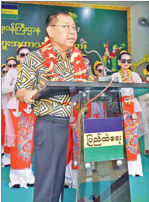
မြန်မာ့ရိုးရာမဟာသင်္ကြန်ပွဲတော်ကို ဖဲကြိုးဖြတ်ဖွင့်လှစ်ပေးသည်။ ဆက်လက်၍ ဒုတိယဝန်ကြီးချုပ်နှင့် ပြည်ထောင်စုဝန်ကြီး ဒုတိယဗိုလ်ချုပ်ကြီး စိုးထွဋ်နှင့် ဇနီး၊ ဦးဆောင်သော အဖွဲ့က ယိမ်းအကအဖွဲ့များနှင့် တက်ရောက်လာသူများကို အတာသင်္ကြန်ရေဖြင့် ပက်ဖျန်းပေးခဲ့ပြီး

ပြည်ထဲရေးဝန်ကြီးဌာနမိသားစု မြန်မာ့ရိုးရာမဟာသင်္ကြန်ပွဲတော် ဖွင့်ပွဲအခမ်းအနားတွင် ဒုတိယဝန်ကြီးချုပ်နှင့် ပြည်ထောင်စုဝန်ကြီး ဒုတိယဗိုလ်ချုပ်ကြီး စိုးထွဋ် က နှစ်သစ်ကူးနှုတ်ခွန်းဆက် အမှာစကား ပြောကြားပြီး (အပေါ်ယာပုံ) ဒုတိယဝန်ကြီးချုပ်နှင့် ပြည်ထောင်စုဝန်ကြီး ဒုတိယဗိုလ်ချုပ်ကြီး စိုးထွဋ်၊ ဒုတိယဝန်ကြီး ဗိုလ်ချုပ် တိုးရီနှင့် ဒုတိယဝန်ကြီး မြန်မာနိုင်ငံရဲတပ်ဖွဲ့ ရဲချုပ် ဗိုလ်ချုပ် ဇင်မင်းထက်တို့က