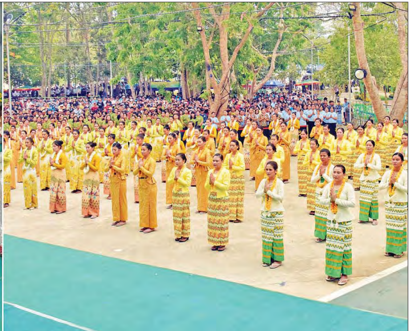
တပ်ဖွဲ့/ ဦးစီးဌာနများမှ ဝန်ထမ်းနှင့် ဝန်ထမ်းမိသားစုများကလည်း မြန်မာ့ရိုးရာယဉ်ကျေးမှု နှင့်အညီ ပျော်ရွှင်စွာ ပါဝင်ဆင်နွှဲခဲ့ကြကြောင်း သိရသည်။ သတင်းစဉ်