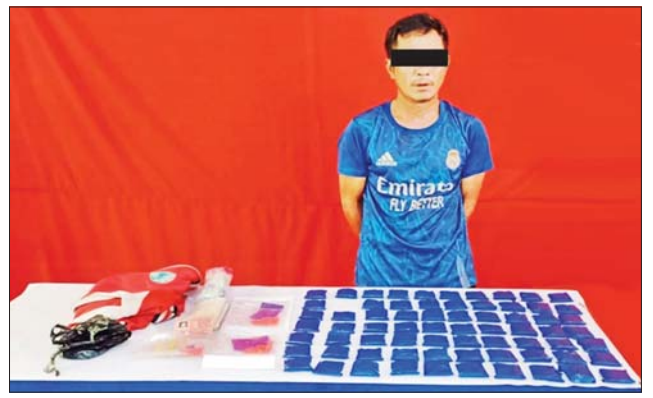
မြင့်ဌေး(ခ)စောဘဒို အား သိမ်းဆည်းရမိသည့် စိတ်ကြွရူးသွပ်ဆေးပြားများနှင့်အတူ တွေ့ရစဉ်။