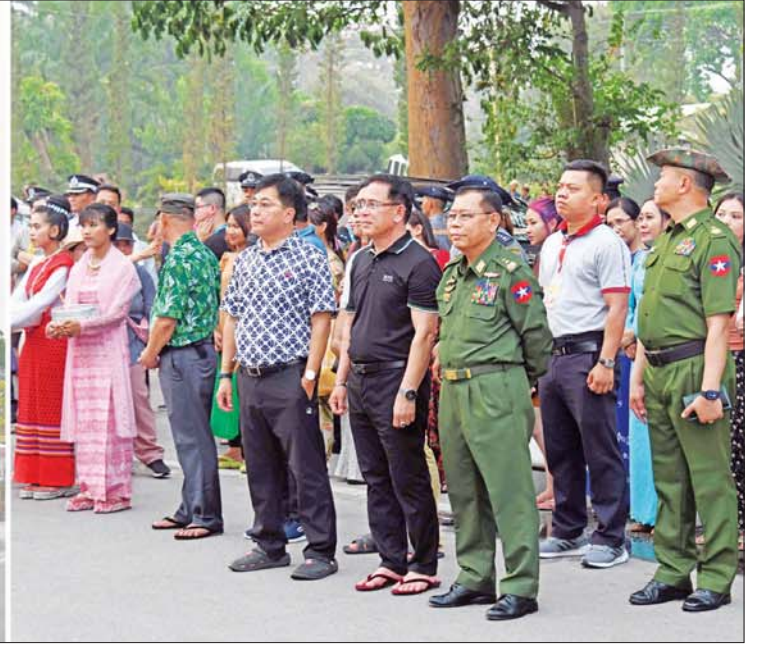
နိုင်ငံတော်စီမံအုပ်ချုပ်ရေးကောင်စီဝင် ဒုတိယဝန်ကြီးချုပ်နှင့် ပြည်ထောင်စုဝန်ကြီး ဒုတိယဗိုလ်ချုပ်ကြီး စိုးထွဋ်၊ ပြည်ထောင်စုဝန်ကြီး ဦးမောင်မောင်အုန်းနှင့်အဖွဲ့ဝင်များ လမ်းလျှောက်သင်္ကြန်ဗဟိုမဏ္ဍပ်၌ ဝန်ကြီးဌာနအလိုက် ယိမ်းအဖွဲ့များက ယိမ်းအလှအကများဖြင့် ဖျော်ဖြေမှုများကို ကြည့်ရှုစစ်ဆေးစဉ်။