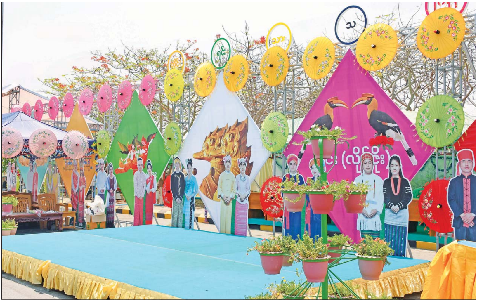
နေပြည်တော်လမ်းလျှောက်သင်္ကြန်ကျင်းပရန် ကြိုတင်ပြင်ဆင်ဆောင်ရွက်ထားရှိမှုများကို တွေ့ရစဉ်။

နေပြည်တော် ဧပြီ ၁၂ ၂၀၂၃ ခုနှစ် မြန်မာ့ရိုးရာ အတာသင်္ကြန်ပွဲတော် ကာလအတွင်း ပြည်ထောင်စုနယ်မြေ နေပြည်တော်ရှိ ဝန်ထမ်းများနှင့် ဝန်ထမ်းမိသားစုများ၊ ပြည်သူများ ပိုမိုပျော်ရွှင်စွာ ဆင်နွှဲနိုင်စေရန် အတွက် နေပြည်တော် လမ်းလျှောက်သင်္ကြန်ကို ခမ်းခမ်းနားနားနှင့် စည်ကားသိုက်မြိုက်စွာ ကျင်းပသွားမည်ဖြစ်သည်။ အဆိုပါ နေပြည်တော် လမ်းလျှောက်သင်္ကြန်ကို အကြို နေ့မှစတင်၍ ပျဉ်းမနား-တောင်ညိုလမ်းမပေါ်ရှိ နေပြည်တော် မြို့တော်ဝန် မဟာသင်္ကြန် မဏ္ဍပ်အနီးမှ စည်ပင်စည်ရိပ်သာ လမ်းဆုံအထိ ဇုန်များသတ်မှတ်ကာ ဝန်ထမ်းများနှင့် ပြည်သူများ အားလုံး ချစ်ကြည်ရင်းနှီးစွာ ဖြင့် ပျော်ရွှင်မှုရရှိစေရန် ရည်ရွယ်၍ ခေတ်နှင့်အညီ ကျင်းပဆောင်ရွက်သွားမည်ဖြစ်ကြောင်း သိရသည်။