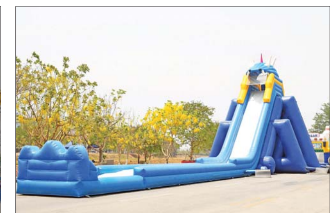
နေပြည်တော် လမ်းလျှောက်သင်္ကြန်ကျင်းပရန် ကြိုတင်ပြင်ဆင်ဆောင်ရွက်ထားရှိမှုများကို တွေ့ရစဉ်။