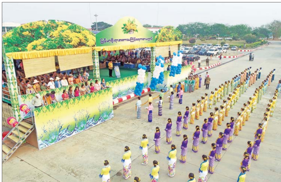
နှင့် ယိမ်းအဖွဲ့များအား အမွှေးယင်းနောက် ဌာနအသီးသီးမှ ပျော်ဖြေကြပြီး အခမ်းအနားကို နံ့သာရည်များပက်ဖျန်း၍ ပျော်ရွှင် ယိမ်းအဖွဲ့များက သင်္ကြန်ယိမ်းရတ်သိမ်းခဲ့ကြောင်း သိရသည်။ စွာ ရေကစားကြသည်။ အကများ၊ သင်္ကြန်သီချင်းများဖြင့် သတင်းစဉ်

မြန်မာ့လေ့ထုံးတမ်းအစဉ်အလာများနှင့်အညီ ရိုးရာမပျက် ဆက်လက်ထိန်းသိမ်းရန်၊ ကိုယ်စိတ်နှစ်ပါး ရွှင်လန်းချမ်းမြေ့စွာဖြင့် ရေသဘင်ပွဲတော်တွင် ပါဝင်ဆင်နွှဲရန်နှင့် စည်းလုံးခြင်း၊ ညီညွတ်ခြင်း၊ အလှူဒါနပြုခြင်း စသည့် မင်္ဂလာအပေါင်း ပြည့်စုံစွာဖြင့် နှစ်သစ်ကို အတူတကွ ကြိုဆိုကြရမည်ဖြစ်ပါကြောင်း ပြောကြားသည်။ ဆက်လက်၍ ဒုတိယဝန်ကြီးချုပ်နှင့် ပို့ဆောင်ရေးနှင့်ဆက်သွယ်ရေးဝန်ကြီးဌာန ပြည်ထောင်စုဝန်ကြီးသည် ဌာနအကြီးအမှူးများနှင့်အတူ ရေကစားမဏ္ဍပ်ကို ဖဲကြိုးဖြတ် ဖွင့်လှစ်ပေးပြီး အကြီးအကဲများနှင့် မိသားစုများက ဝန်ထမ်းများ၊ ဝန်ထမ်းမိသားစုများ