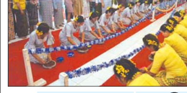
ပြည်တွင်းသတင်း စာ ၅

ပုဏ္ဏားကျွန်းမြို့၌ ရခိုင်ရိုးရာ နံ့သာသွေးပွဲတော် စည်ကားသိုက်မြိုက်စွာကျင်းပ