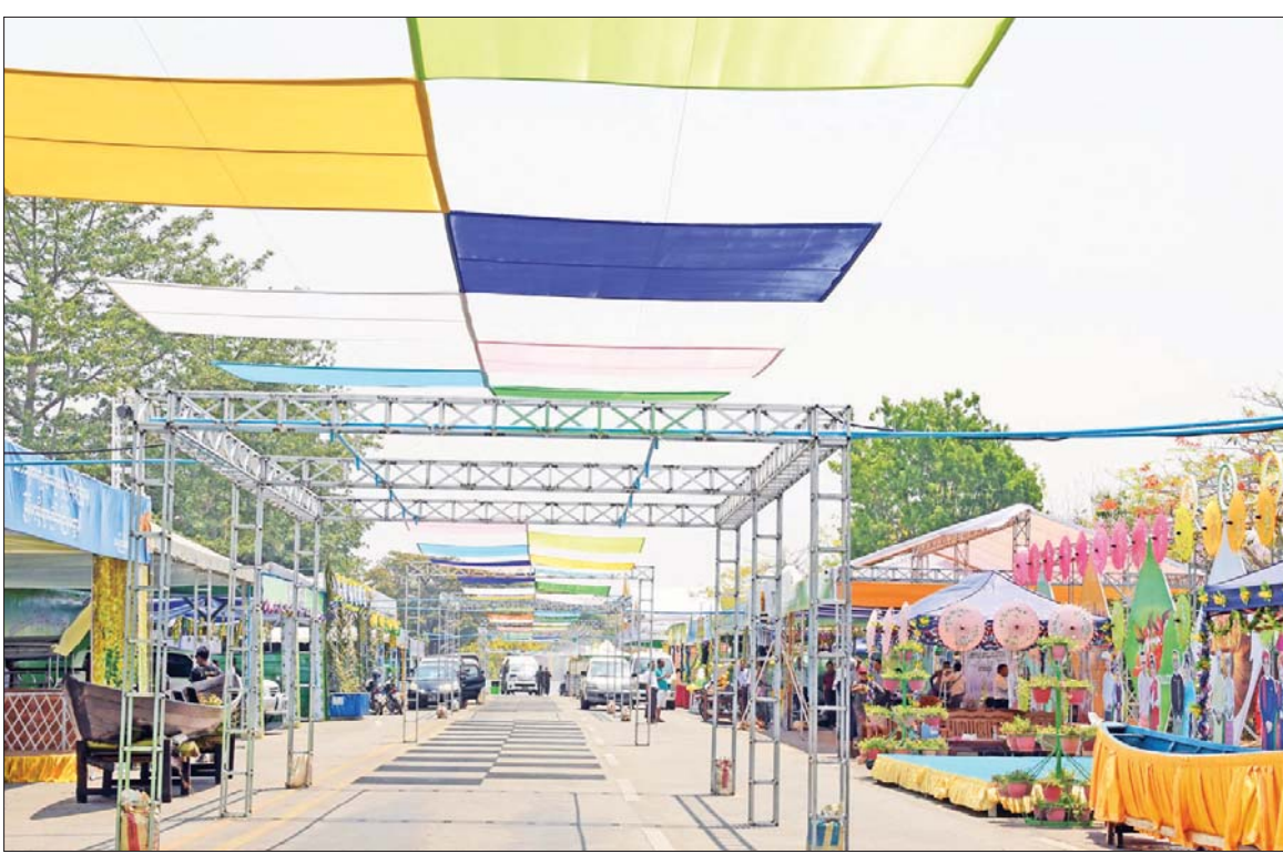
နေပြည်တော် လမ်းလျှောက်သင်္ကြန်ကျင်းပရန် ကြိုတင်ပြင်ဆင်ဆောင်ရွက်ထားရှိမှုကို တွေ့ရစဉ်။

နေပြည်တော် လမ်းလျှောက်သင်္ကြန်အောင်မြင်စွာ ကျင်းပနိုင်ရေးအတွက် ကဏ္ဍပေါင်းစုံမှ ဆောင်ရွက်မှုကြောင့် ပြီးစီးနေပြီဖြစ်ကာ လူငယ်များသာမက လူကြီးများပါ ပျော်ပျော်ရွှင်ရွှင်နှင့် ပျော်ပျော်ပါးပါး ဖြစ်စေရန် သေချာဂရုစိုက်ပြင်ဆင်လျက်ရှိကြောင်း၊ သင်္ကြန်အကြိုနေ့တွင် နေပြည်တော် လမ်းလျှောက်သင်္ကြန်ကို နံနက်ပိုင်းမှစတင်၍ ဖွင့်လှစ်မည်ဖြစ်ကြောင်း၊ မွန်းတည့် ၁၂ နာရီနောက်ပိုင်း