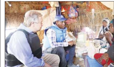
နိုင်ငံတကာသတင်း စာ ၁၃

ဆိုမာလီယာနိုင်ငံ၌ လူသားချင်း စာနာထောက်ထားမှုအကူအညီများ အရေးပေါ်လိုအပ်သည်ဟု ကုလသမဂ္ဂအကြီးအကဲတောင်းဆို