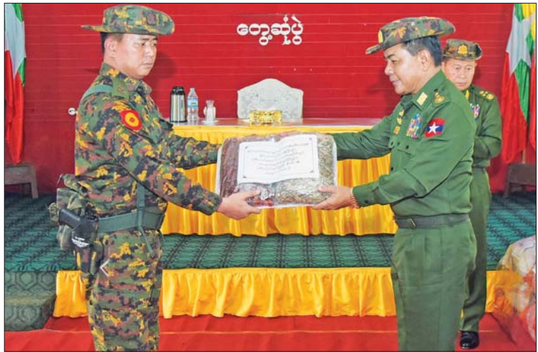
ညှိနှိုင်းကွပ်ကဲရေးမှူး(ကြည်း၊ ရေ၊ လေ) ဗိုလ်ချုပ်ကြီး မောင်မောင်အေး နောင်ဗိုး တပ်နယ်မှ အရာရှိ၊ စစ်သည်၊ မိသားစုများအတွက် စားသောက်ကုန်ပစ္စည်းများ ပေးအပ်စဉ်။

စားသောက်ကုန်များပေးအပ် တွေ့ဆုံပွဲများအပြီးတွင် နိုင်ငံတော် စီမံအုပ်ချုပ်ရေးကောင်စီ ဒုတိယဥက္ကဋ္ဌ ဒုတိယ တပ်မတော်ကာကွယ်ရေးဦးစီး ချုပ် ကာကွယ်ရေးဦးစီးချုပ် (ကြည်း) ဒုတိယ ဗိုလ်ချုပ်မှူးကြီး စိုးဝင်းက တပ်နယ်အသီးသီးမှ အရာရှိ၊ စစ်သည်၊ မိသားစုများအတွက် တပ်မတော်စက်ရုံ များမှထုတ်လုပ်သည့် စားသောက်ကုန် ပစ္စည်းများကို ပေးအပ်ရာ တာဝန်ရှိသူများ က လက်ခံရယူသည်။ အလားတူ နိုင်ငံတော် စီမံအုပ်ချုပ်ရေးကောင်စီ ဒုတိယ ဥက္ကဋ္ဌ ဒုတိယတပ်မတော် ကာကွယ်ရေးဦးစီး ချုပ် ကာကွယ်ရေးဦးစီးချုပ် (ကြည်း)၏ ဇနီး ဒေါ်သန်းသန်းနွယ်က ဒေသထွက်