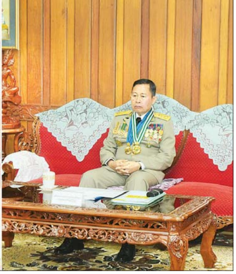
နိုင်ငံတော်စီမံအုပ်ချုပ်ရေးကောင်စီ ဒုတိယဥက္ကဋ္ဌ ဒုတိယဝန်ကြီးချုပ် ဒုတိယတပ်မတော်ကာကွယ်ရေးဦးစီးချုပ် ကာကွယ်ရေးဦးစီးချုပ်(ကြည်း) ဒုတိယဗိုလ်ချုပ်မှူးကြီး သီရိပျံချို မဟာသရေစည်သူ စိုးဝင်း ထူးချွန်ဆုရ ဗိုလ်လောင်းများအား ဂုဏ်ပြုအမှာစကားပြောကြားစဉ်။