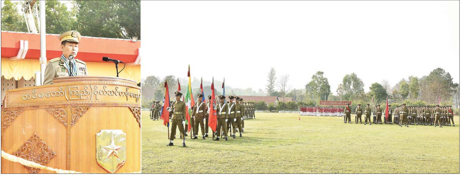
နိုင်ငံတော်စီမံအုပ်ချုပ်ရေးကောင်စီ ဒုတိယဥက္ကဋ္ဌ ဒုတိယတပ်မတော်ကာကွယ်ရေးဦးစီးချုပ် ကာကွယ်ရေးဦးစီးချုပ် (ကြည်း) ဒုတိယဗိုလ်ချုပ်မှူးကြီး သီရိပျံချီ မဟာသရေစည်သူ စိုးဝင်း တပ်မတော်(ကြည်း)ဗိုလ်သင်တန်းကျောင်း(ဗဟူး) ဗိုလ်လောင်းသင်တန်း အမှတ်စဉ်(၁၂၆) သူရတပ်ခွဲ သင်တန်းဆင်းပွဲတွင် မိန့်ခွန်းပြောကြားစဉ်။

ပေးအပ်လာသည့် တာဝန်များကို အောင်မြင်အောင်ဆောင်ရွက်ရန်မှာကြားဆက်လက်၍ နိုင်ငံတော်စီမံအုပ်ချုပ်