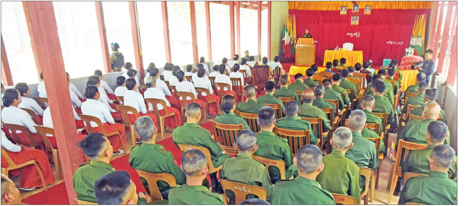
နိုင်ငံတော်စီမံအုပ်ချုပ်ရေးကောင်စီ ဒုတိယဥက္ကဋ္ဌ ဒုတိယတပ်မတော်ကာကွယ်ရေးဦးစီးချုပ် ကာကွယ်ရေးဦးစီးချုပ်(ကြည်း) ဒုတိယဗိုလ်ချုပ်မှူးကြီး စိုးဝင်း ကျိုင်းခမ်း တပ်နယ်ရှိ အရာရှိ၊ စစ်သည်၊ မိသားစုများနှင့် တွေ့ဆုံပွဲတွင် အမှာစကားပြောကြားစဉ်။

နေပြည်တော် ဧပြီ ၇ နိုင်ငံတော် စီမံအုပ်ချုပ်ရေးကောင်စီ ဒုတိယဥက္ကဋ္ဌ ဒုတိယတပ်မတော် ကာကွယ်ရေးဦးစီးချုပ်(ကြည်း) ဒုတိယဗိုလ်ချုပ်မှူးကြီး စိုးဝင်းသည် ဇနီး ဒေါ်သန်းသန်းနွယ်၊ ညှိနှိုင်းကွပ်ကဲရေးမှူး (ကြည်း၊ ရေလေ) ဗိုလ်ချုပ်ကြီး မောင်မောင်အေးနှင့်ဇနီး၊ ကာကွယ်ရေးဦးစီးချုပ်မှူး တပ်မတော် အရာရှိကြီးများ၊ အရှေ့ပိုင်းတိုင်းစစ်ဌာနချုပ် တိုင်းမှူးတို့လိုက်ပါ၍ ယနေ့ နံနက်ပိုင်းတွင် နောင်ပိုးနှင့် ကျိုင်းခမ်း တပ်နယ်တို့ရှိ နယ်မြေခံတပ်များသို့ သွားရောက်၍ အရာရှိ၊ စစ်သည်၊ မိသားစုများအား သီးခြားစီ တွေ့ဆုံအမှာစကား ပြောကြားသည်။