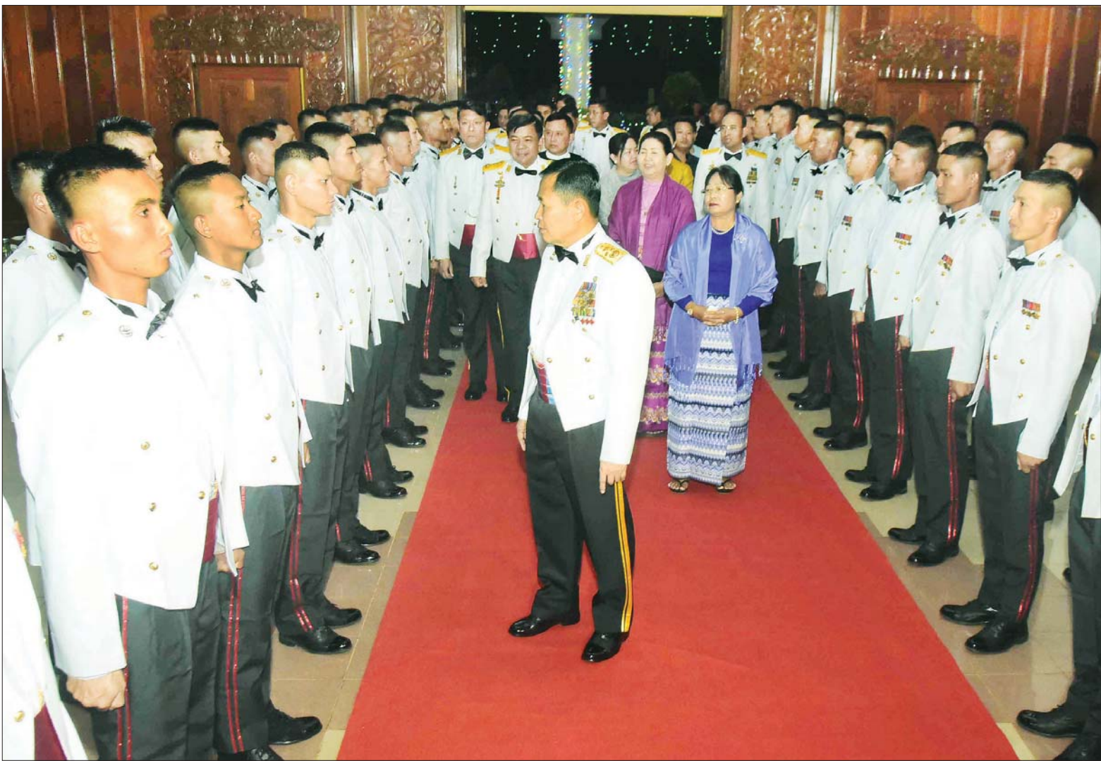
နိုင်ငံတော်စီမံအုပ်ချုပ်ရေးကောင်စီဒုတိယဥက္ကဋ္ဌ ဒုတိယတပ်မတော်ကာကွယ်ရေးဦးစီးချုပ် ကာကွယ်ရေးဦးစီးချုပ်(ကြည်း) ဒုတိယဗိုလ်ချုပ်မှူးကြီး စိုးဝင်း ကျောင်းဆင်းအရာရှိများအား ရင်းရင်းနှီးနှီး နှုတ်ဆက်စဉ်။

နေပြည်တော် ဧပြီ ၇ တပ်မတော် (ကြည်း) ဗိုလ်သင်တန်းကျောင်း(ဗထူး) ဗိုလ်လောင်းသင်တန်း အမှတ်စဉ်(၁၂၆) သူရတပ်ခွဲသင်တန်းဆင်းဂုဏ်ပြုညစာစားပွဲအခမ်းအနားကို ယနေ့ညပိုင်းတွင် ဗထူးမြို့ တပ်မတော်(ကြည်း) ဗိုလ်သင်တန်းကျောင်း(ဗထူး) စစ်ရာထူးခန့်ထားရေးခန်းမဆောင်၌ ကျင်းပရာ နိုင်ငံတော်စီမံအုပ်ချုပ်ရေးကောင်စီဥက္ကဋ္ဌ တပ်မတော်ကာကွယ်ရေး ဦးစီးချုပ်ကိုယ်စား နိုင်ငံတော်စီမံအုပ်ချုပ်ရေးကောင်စီ ဒုတိယဥက္ကဋ္ဌ ဒုတိယတပ်မတော်ကာကွယ်ရေးဦးစီးချုပ် ကာကွယ်ရေးဦးစီးချုပ် (ကြည်း) ဒုတိယဗိုလ်ချုပ်မှူးကြီးစိုးဝင်း တက်ရောက်ချီးမြှင့်သည်။ အဆိုပါ အခမ်းအနားသို့ နိုင်ငံတော်စီမံအုပ်ချုပ်ရေးကောင်စီ ဒုတိယဥက္ကဋ္ဌ ဒုတိယတပ်မတော်ကာကွယ်ရေးဦးစီးချုပ်၏ဇနီး ဒေါ်သန်းသန်းနွယ်၊ ညွှန်ကြားမှုဦးစီးဌာန (ကြည်း၊ ရေ၊ လေ) ဗိုလ်ချုပ်ကြီးမောင်မောင်အေးနှင့်ဇနီး၊ ရှမ်းပြည်နယ်ဝန်ကြီးချုပ် ဦးအောင်ဇော်အေးနှင့်ဇနီး၊ ကာကွယ်ရေးဦးစီးချုပ်ရုံးမှ တပ်မတော်အရာရှိကြီးများ၊ အရှေ့ပိုင်းတိုင်းစစ်ဌာနချုပ် တိုင်းမှူးနှင့်ဇနီး၊ ဗထူးတပ်နယ်မှ တပ်မတော်အရာရှိကြီးများနှင့် ဇနီးများ၊ ကျောင်းဆင်း ဗိုလ်လောင်းများ၏ မိဘအုပ်ထိန်းသူများဖြစ်သည့် တပ်မတော်(ကြည်း)ဗိုလ်သင်တန်းကျောင်း(ဗထူး)မှ နည်းပြအရာရှိများနှင့် ဆရာ၊ ဆရာမများ၊ ဖိတ်ကြားထားသည့် ဧည့်သည်တော်များ တက်ရောက်ကြသည်။ ဦးစွာ နိုင်ငံတော်စီမံအုပ်ချုပ်ရေးကောင်စီဒုတိယဥက္ကဋ္ဌ ဒုတိယတပ်မတော်ကာကွယ်ရေးဦးစီးချုပ် ကာကွယ်ရေးဦးစီးချုပ်(ကြည်း) ဒုတိယဗိုလ်ချုပ်မှူးကြီးစိုးဝင်းနှင့်အဖွဲ့ဝင်များသည် ကျောင်းဆင်း