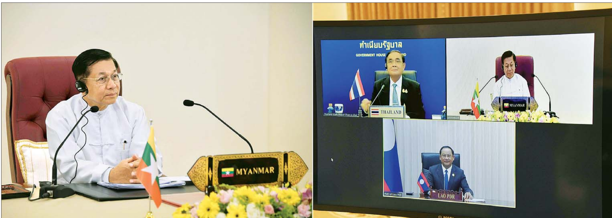
နိုင်ငံတော်စီမံအုပ်ချုပ်ရေးကောင်စီဥက္ကဋ္ဌ နိုင်ငံတော်ဝန်ကြီးချုပ် ဗိုလ်ချုပ်မှူးကြီး မင်းအောင်လှိုင် မြန်မာနိုင်ငံ၊ ထိုင်းနိုင်ငံနှင့် လာအိုနိုင်ငံတို့အကြား နယ်စပ်ဖြတ်ကျော်မီးခိုးမြူငွေညစ်ညမ်းမှုဆိုင်ရာ သုံးဦးသုံးဖလှယ်အစည်းအဝေးတွင် Video Conferencing ဖြင့် တွေ့ဆုံဆွေးနွေးစဉ်။