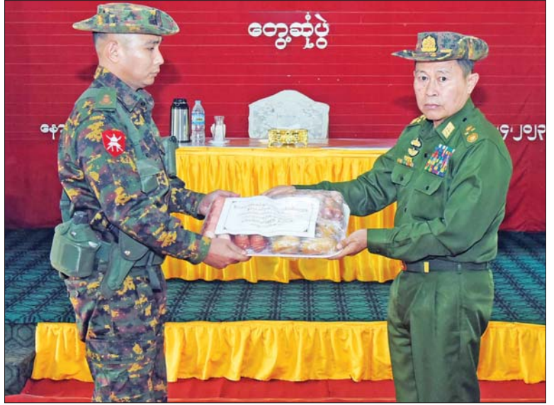
နိုင်ငံတော်စီမံအုပ်ချုပ်ရေးကောင်စီ ဒုတိယဥက္ကဋ္ဌ ဒုတိယတပ်မတော်ကာကွယ်ရေး ဦးစီးချုပ် ကာကွယ်ရေးဦးစီးချုပ်(ကြည်း) ဒုတိယဗိုလ်ချုပ်မှူးကြီး စိုးဝင်း နောင်ပိုး တပ်နယ်မှ အရာရှိ၊ စစ်သည်၊ မိသားစုများအတွက် စားသောက်ကုန်ပစ္စည်းများ ပေးအပ်စဉ်။

တစ်နိုင်စိုက်ပျိုး/မွေးမြူရေးလုပ်ငန်းများ သည် ထိရောက်သော သက်သာချောင်ချိမှု ဖြစ်စေကြောင်း၊ သက်သာချောင်ချိမှု ကောင်းမွန်ခြင်းဖြင့် လုပ်ငန်းတာဝန် ထမ်းဆောင်မှုအပေါ် စိတ်ဓာတ်ရေးရာ