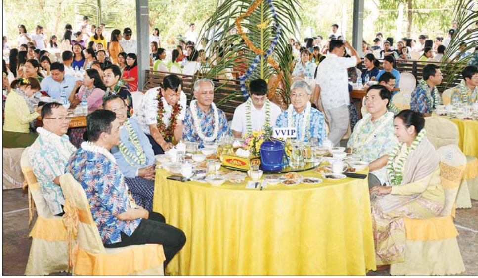
ဦးသန်းအောင်ကျော်၊ မြန်မာနိုင်ငံဆိုင်ရာ တရုတ်ပြည်သူ့သမ္မတနိုင်ငံ သံအမတ်ကြီး H.E. Mr. Chen Hai ၊ အမြဲတမ်းအတွင်းဝန်၊ ညွှန်ကြားရေးမှူးချုပ်များနှင့် ဒုတိယညွှန်ကြားရေးမှူးချုပ်များ၊ ဖိတ်ကြားထားသော ဧည့်သည်တော်များနှင့်အတူ ဝန်ထမ်းများ တက်ရောက်ကြသည်။ အခမ်းအနား၌ စီးပွားရေးနှင့် ကူးသန်းရောင်းဝယ်ရေးဝန်ကြီးဌာန ပြည်ထောင်စုဝန်ကြီး

နေပြည်တော် ဧပြီ ၇ စီးပွားရေးနှင့် ကူးသန်းရောင်းဝယ်ရေးဝန်ကြီးဌာန ဝန်ထမ်းမိသားစုများ၏ မဟာသင်္ကြန်အကြို ရေကစားဧည့်ခံပွဲ အခမ်းအနားကို ယနေ့ မွန်းလွဲ ၃ နာရီတွင် နေပြည်တော် ရုံးအမှတ်(၃) ဝန်ကြီးဌာန ပရဝဏ်အတွင်း ကျင်းပသည်။ အခမ်းအနားသို့ ရင်းနှီးမြှုပ်နှံမှုနှင့် နိုင်ငံခြားစီးပွားဆက်သွယ်ရေးဝန်ကြီးဌာန ပြည်ထောင်စုဝန်ကြီး ဒေါက်တာကံဇော်၊ အလုပ်သမား ဝန်ကြီးဌာန ပြည်ထောင်စုဝန်ကြီး ဒေါက်တာပွင့်ဆန်း၊ ဒုတိယဝန်ကြီးများ ဖြစ်ကြသော ဒေါက်တာဝါဝါမောင်၊ ဦးညွှန်အောင်နှင့် ပြည်ထောင်စုရွေးကောက်ပွဲတော်မရှင်၊ အဖွဲ့ဝင်၊