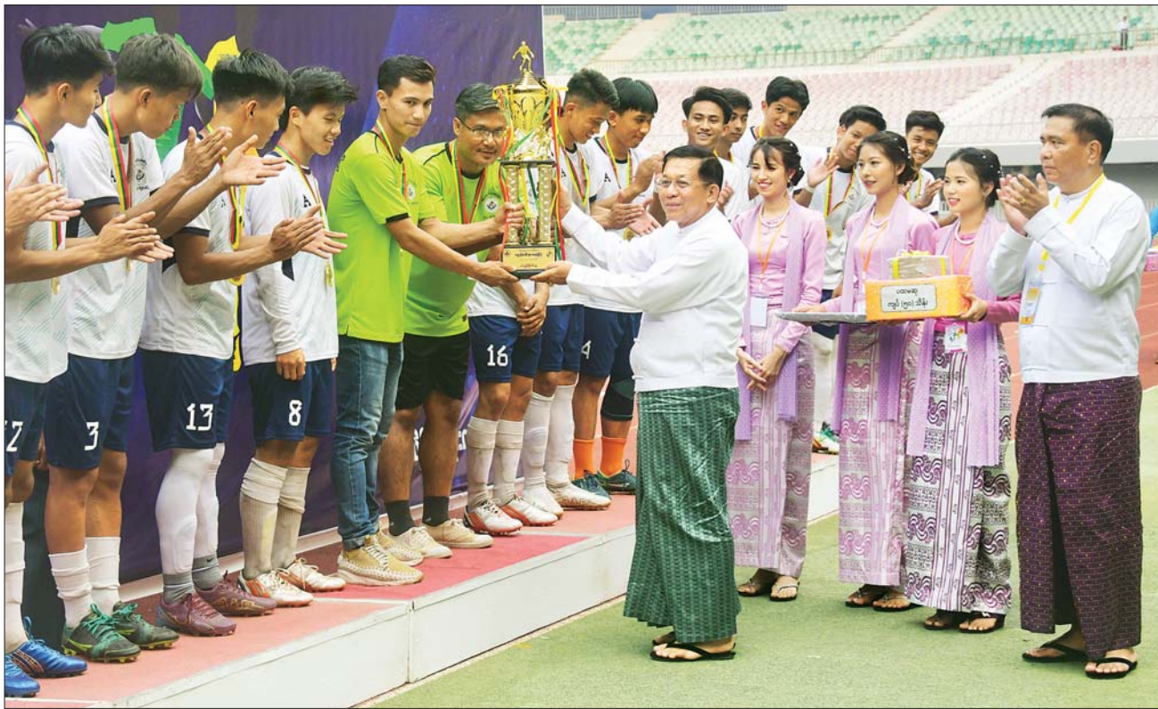
နိုင်ငံတော်စီမံအုပ်ချုပ်ရေးကောင်စီဥက္ကဋ္ဌ နိုင်ငံတော်ဝန်ကြီးချုပ် ဗိုလ်ချုပ်မှူးကြီး မင်းအောင်လှိုင် ပထမဆုရရှိသည့် နည်းပညာတက္ကသိုလ် (အထက်မြန်မာပြည်) (က) အသင်းအား တံခွန်စိုက်ဖလား ပေးအပ်ချီးမြှင့်စဉ်။

ကြည့်ရှုအားပေးအခမ်းအနားသို့ နိုင်ငံတော်စီမံအုပ်ချုပ်ရေးကောင်စီ တွဲဖက်အတွင်းရေးမှူး ဒုတိယဗိုလ်ချုပ်ကြီး ရဲဝင်းဦး၊ ကောင်စီဝင်များ၊ ပြည်ထောင်စု ဝန်ကြီးများ၊ ပြည်ထောင်စုအဆင့် ပုဂ္ဂိုလ်များ၊ နေပြည်တော်ကောင်စီ ဥက္ကဋ္ဌ၊ တပ်မတော် အရာရှိကြီးများ၊ နေပြည်တော်တိုင်း စစ်ဌာနချုပ်တိုင်းမှူး၊ ဒုတိယဝန်ကြီးများ၊ တိုင်းဒေသကြီးနှင့် ပြည်နယ်အသီးသီးရှိ သိပ္ပံနှင့် နည်းပညာဝန်ကြီးဌာနအောက် တက္ကသိုလ်ပေါင်းစုံမှ ပါမောက္ခချုပ်များနှင့် ပါမောက္ခများ၊ အားကစားအသင်းများအလိုက် အုပ်ချုပ်သူများ၊ နည်းပြများနှင့် အားကစားသမားများ၊ ဝန်ကြီးဌာနများမှ တာဝန်ရှိသူများနှင့် ဝန်ထမ်းများ၊ မြန်မာနိုင်ငံ ဘောလုံးအဖွဲ့ချုပ်မှ တာဝန်ရှိသူများ၊ အားကစားဝါသနာရှင်များ တက်ရောက်