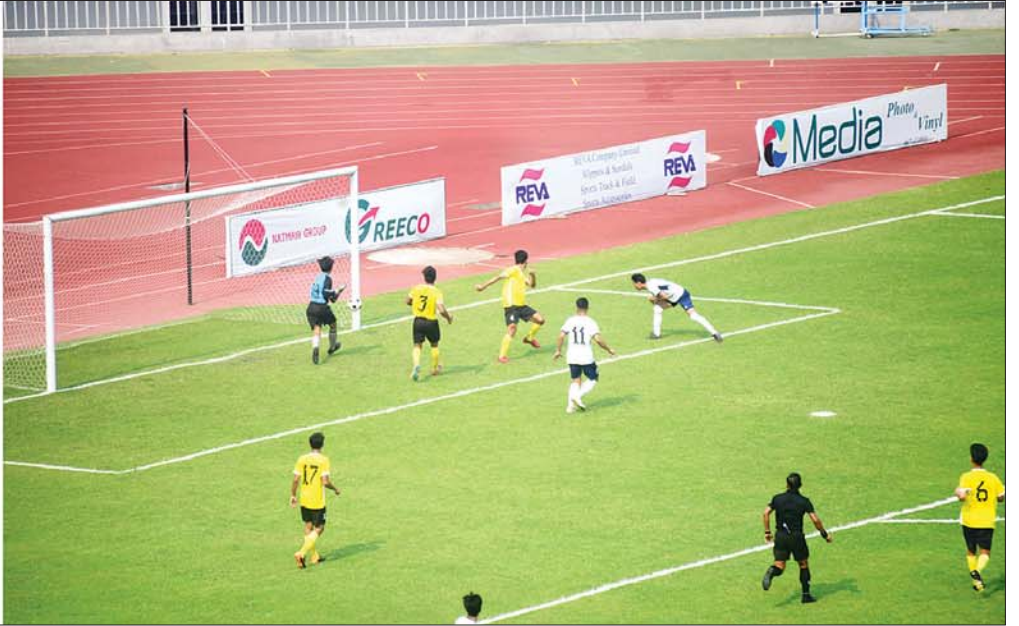
နိုင်ငံတော်စီမံအုပ်ချုပ်ရေးကောင်စီဥက္ကဋ္ဌ နိုင်ငံတော်ဝန်ကြီးချုပ် ဗိုလ်ချုပ်မှူးကြီး မင်းအောင်လှိုင်နှင့်အဖွဲ့ဝင်များ သိပ္ပံနှင့် နည်းပညာဝန်ကြီးဌာန တက္ကသိုလ်ပေါင်းစုံ ဘောလုံးပြိုင်ပွဲ ဗိုလ်လုပွဲယှဉ်ပြိုင်ကစားနေမှုကို တက်ရောက်ကြည့်ရှုအားပေးကြစဉ်။