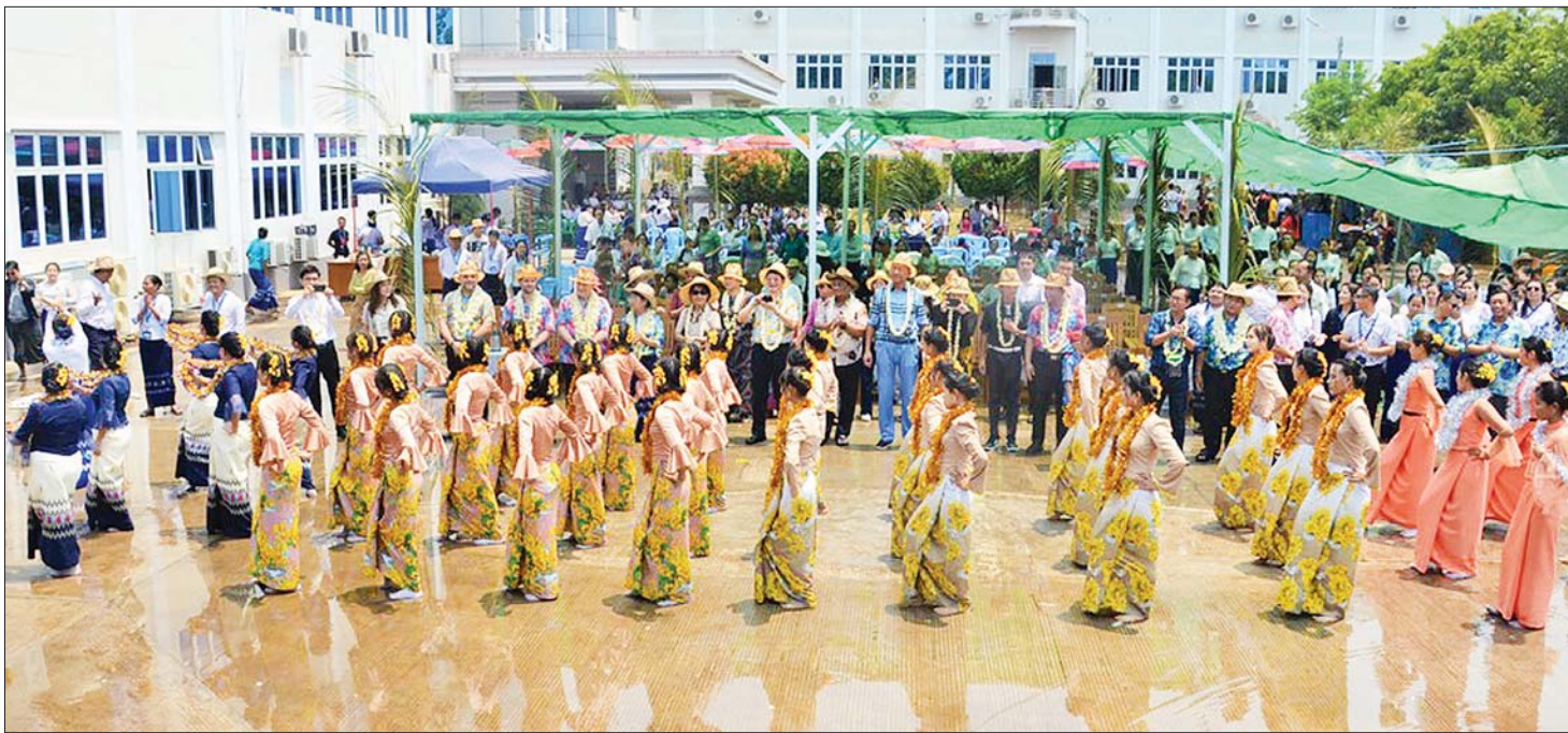
များ၊ တေးသံသာများဖြင့် ဧည့်ခံဖျော်ဖြေကြသည်။ ဝန်ကြီး၊ ဌာနအကြီးအကဲများနှင့် အခမ်းအနားသို့ တက်ရောက်လာသော ဧည့်သည်တော်များက အတာရေများ အပြန်အလှန်ပတ်ဖျန်းကြပြီး ဦးစီးဌာနများနှင့် လုပ်ငန်းများ ကိုယ်စားပြု ယိမ်းအကအဖွဲ့များ အား ဂုဏ်ပြုချီးမြှင့်ငွေများ ပေးအပ်ခဲ့ကြောင်း သိရသည်။ သတင်းစဉ်

နေပြည်တော် ဧပြီ ၇ လျှပ်စစ်စွမ်းအားဝန်ကြီးဌာန၏ ၁၃၈၄ ခုနှစ် မြန်မာ့ရိုးရာယဉ်ကျေးမှု မဟာသင်္ကြန်ပွဲတော် အခမ်းအနားကို ယနေ့နံနက်ပိုင်းတွင် နေပြည်တော်ရှိ လျှပ်စစ်စွမ်းအားဝန်ကြီးဌာန ရုံးအမှတ်(၂၇)၌ ကျင်းပသည်။ အဆိုပါ မဟာသင်္ကြန်ပွဲတော် အခမ်းအနားသို့ နိုင်ငံတော်စီမံအုပ်ချုပ်ရေးကောင်စီ အဖွဲ့ဝင်များ ဖြစ်ကြသည့် ဒေါက်တာကျော်ထွန်း၊ ဦးခွန်စံလွင်၊ လျှပ်စစ်စွမ်းအားဝန်ကြီးဌာန ပြည်ထောင်စုဝန်ကြီး ဦးသောင်းဟန်၊ အလုပ်သမားဝန်ကြီးဌာန ပြည်ထောင်စုဝန်ကြီး ဒေါက်တာပွင့်ဆန်း၊ ဒုတိယဝန်ကြီးများ၊ မြန်မာနိုင်ငံဆိုင်ရာ တရုတ်ပြည်သူ့သမ္မတနိုင်ငံ သံအမတ်ကြီး၊ လျှပ်စစ်စွမ်းအားဝန်ကြီးဌာန ကြီးကြပ်မှုအောက်ရှိ ပြည်ထောင်စုဝန်ကြီးရုံး၊ ဦးစီးဌာနနှင့် လုပ်ငန်းများမှ ညွှန်ကြားရေးမှူးချုပ်များ၊ ဦးဆောင်ညွှန်ကြားရေးမှူးများနှင့် အရာထမ်း၊ အမှုထမ်းများ၊ ဖိတ်ကြားထားသည့် ဧည့်သည်တော်များတက်ရောက်ကြပြီး စတုဒိသာဧည့်ခံကျွေးမှုအား အတူတကွသုံးဆောင်၍ ဖျော်ရွှင်စွာ ပါဝင်ဆင်နွှဲကြကာ ဦးစီးဌာနများနှင့် လုပ်ငန်းများကိုယ်စားပြု သင်္ကြန်အလှူမယ် ယိမ်းအကအဖွဲ့များက ယိမ်းအက