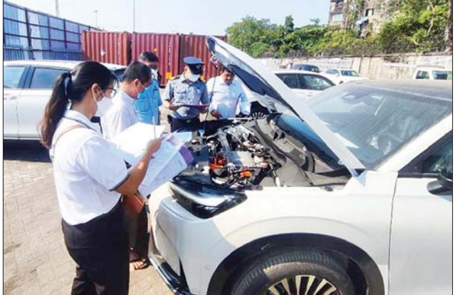
မော်တော်ယာဉ်များ တင်သွင်းမှု အတွက် အကောက်ခွန်ကင်းလွတ် ခွင့်ပြုထားကြောင်း သိရသည်။ သတင်းစဉ်

နေပြည်တော် ဧပြီ ၇ အမျိုးသားအဆင့် လျှပ်စစ်သုံး ယာဉ်နှင့် ဆက်စပ်လုပ်ငန်းများ ဖွံ့ဖြိုးတိုးတက်ရေး ဦးဆောင် ကော်မတီ၏ ခွင့်ပြုချက်ဖြင့် Earth Renewable Energy Co., Ltd. မှတင်သွင်းလာသော Honda ENS1 အမျိုးအစား လျှပ်စစ်သုံး မော်တော်ယာဉ် အစီး ၅၀ သည် ရန်ကုန်ဆိပ်ကမ်းသို့ ရောက်ရှိလာ သဖြင့် ယနေ့တွင် လုပ်ထုံး လုပ်နည်းနှင့်အညီ ထုတ်ယူခွင့်ပြု ခဲ့ကြောင်းနှင့် အဆိုပါလျှပ်စစ်သုံး