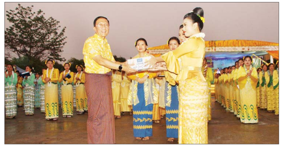
မြန်မာ့ယဉ်ကျေးမှု ဓလေ့ထုံးစံ ချစ်ခင်မြတ်နိုး ဆင်နွှဲနိုင်ကြစေရန်နှင့် မြန်မာ့ ထိန်းသိမ်းနိုင်ကြစေရန်၊ ရာသီ ပွဲတော်အဖြစ် ပျော်ရွှင်စွာ ပါဝင် ဆင်နွှဲနိုင်ကြစေရန်နှင့် မြန်မာ့ ထိန်းသိမ်းနိုင်ကြစေရန် အပြည့်၊ စည်းလုံးညီညွတ်စွာဖြင့် နိုင်ငံ့တာဝန်များကို ကြိုးပမ်း

ပြိုင်ပွဲတွင် ပထမဆု ရရှိသော အကောက်ခွန်ဦးစီးဌာန(ယာပုံ)၊ ဒုတိယဆု ရရှိသော ပြည်တွင်း အခွန်များ ဦးစီးဌာန၊ တတိယဆု ရရှိသော ပြည်ထောင်စုဝန်ကြီးရုံး (ရုံးအမှတ်-၂၆)၊ စတုတ္ထဆု ရရှိ သော ရသုံးမှန်းခြေငွေစာရင်း ဦးစီးဌာန၊ ပဉ္စမဆုရရှိသော စီမံကိန်းစီမံရေးနှင့် တိုးတက်မှု အစီရင်ခံရေးဦးစီးဌာနနှင့် နှစ် သိမ့်ဆု ရရှိသော ကျန်ဌာနများကို ဆုများ ချီးမြှင့်ကြသည်။ မြန်မာ့ရိုးရာ မဟာသင်္ကြန်ပွဲ အထိမ်းအမှတ် ဝန်ထမ်းများ သင်္ကြန်ယိမ်းအကပြိုင်ပွဲကို စီမံ ကိန်းနှင့် ဘဏ္ဍာရေးဝန်ကြီးဌာန ဝန်ထမ်းမိသားစုများ အနေဖြင့်