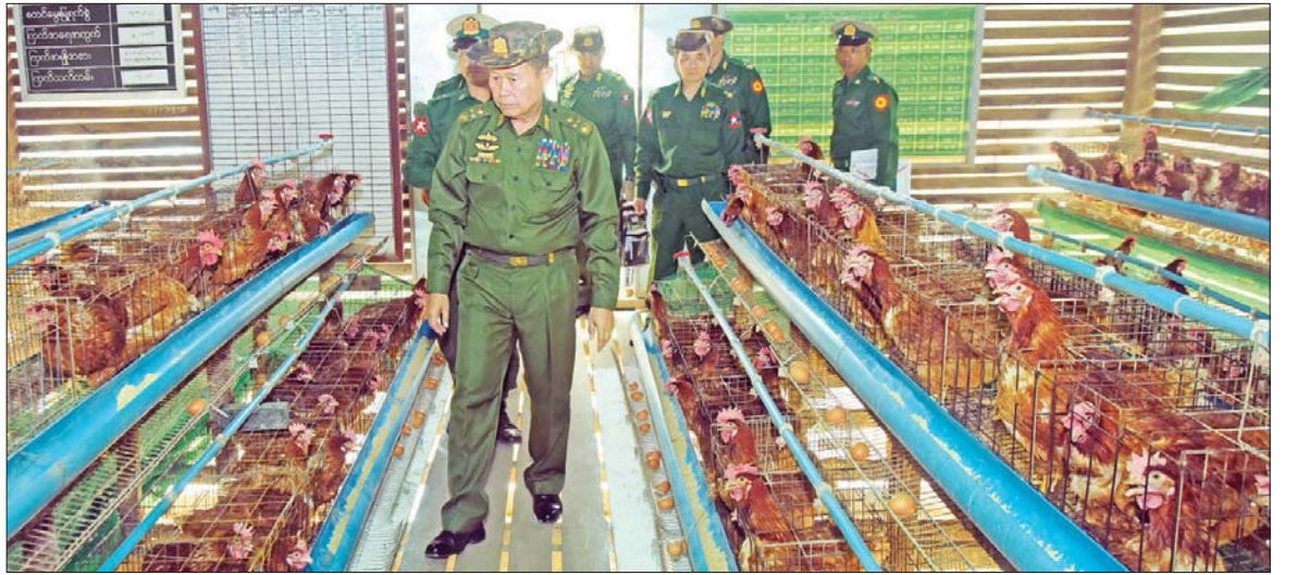
နိုင်ငံတော်စီမံအုပ်ချုပ်ရေးကောင်စီ ဒုတိယဥက္ကဋ္ဌ ဒုတိယတပ်မတော်ကာကွယ်ရေးဦးစီးချုပ် ကာကွယ်ရေးဦးစီးချုပ်(ကြည်း) ဒုတိယဗိုလ်ချုပ်မှူးကြီး စိုးဝင်း ကျိုင်းခမ်းတပ်နယ်ရှိ ဥစားကြက်များ မွေးမြူထားရှိမှုကို ကြည့်ရှုစစ်ဆေးစဉ်။

ဝေဖန်ပိုင်းခြားတတ်ရန် စာကောင်း ပေမွန်များကို ဖတ်ရှုလေ့လာနေရန်လို ကြောင်း၊ ပေးအပ်သော တာဝန်များ ကောင်းမွန်စွာ ဆောင်ရွက်နိုင်ရန် ကိုယ်ခန္ဓာ ကျန်းမာကြံ့ခိုင်ရေးအတွက် စဉ်ဆက်မပြတ် လေ့ကျင့်နေရန်လို ကြောင်းနှင့် ကျန်းမာရေးဆိုင်ရာ လမ်းညွှန်ချက်များကို တစ်ဦးချင်းစီက အသိစိတ်ဓာတ်ရှိစွာဖြင့် လိုက်နာ လုပ်ဆောင်ရန်လိုကြောင်း ပြောကြားပြီး တက်ရောက်လာကြသည့် အရာရှိ၊ စစ်သည်၊ ရဲမေ တစ်ဦးချင်းစီ၏ တင်ပြ ချက်များအပေါ် လိုအပ်သည်များ တာဝန် ရှိသူများနှင့် ပေါင်းစပ်ညှိနှိုင်း ဆောင်ရွက် ပေးသည်။