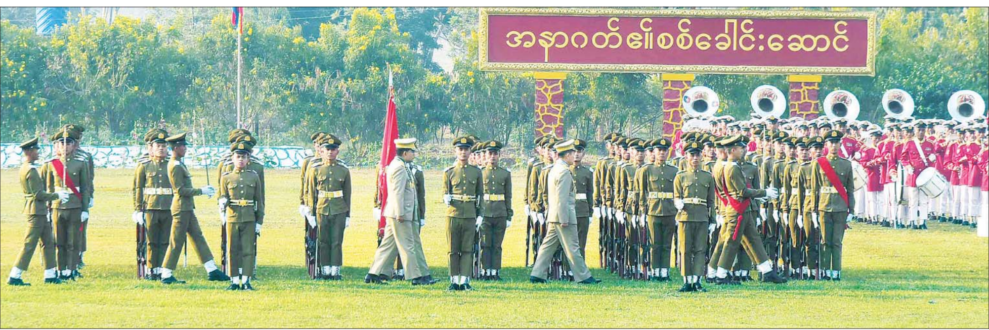
နိုင်ငံတော်စီမံအုပ်ချုပ်ရေးကောင်စီ ဒုတိယဥက္ကဋ္ဌ ဒုတိယတပ်မတော်ကာကွယ်ရေးဦးစီးချုပ် ကာကွယ်ရေးဦးစီးချုပ် (ကြည်း) ဒုတိယဗိုလ်ချုပ်မှူးကြီး သီရိပျံချို မဟာသရေစည်သူ စိုးဝင်း ဗိုလ်လောင်းတပ်ခွဲများအား စစ်ဆေးစဉ်။

နေပြည်တော် ဧပြီ ၇ တပ်မတော်(ကြည်း) ဗိုလ်သင်တန်းကျောင်း(ဗထူး) ဗိုလ်လောင်းသင်တန်းအမှတ်စဉ် (၁၂၆) သူရတပ်ခွဲသင်တန်းဆင်း ပုဂံပြုစစ်ရေးပြအခမ်းအနားကို ယနေ့ နံနက်ပိုင်းတွင် ဗထူးမြို့ တပ်မတော် (ကြည်း) ဗိုလ်သင်တန်းကျောင်း(ဗထူး) စစ်ရေးပြကျင်းပရာ နိုင်ငံတော်စီမံအုပ်ချုပ်ရေးကောင်စီဥက္ကဋ္ဌ တပ်မတော်ကာကွယ်ရေးဦးစီးချုပ် ဗိုလ်ချုပ်မှူးကြီး သတိုးမဟာသရေစည်သူ သတိုးသီရိသုဓမ္မ မင်းအောင်လှိုင် ကိုယ်စား နိုင်ငံတော်စီမံအုပ်ချုပ်ရေးကောင်စီဒုတိယဥက္ကဋ္ဌ ဒုတိယတပ်မတော်ကာကွယ်ရေးဦးစီးချုပ် ကာကွယ်ရေးဦးစီးချုပ် (ကြည်း) ဒုတိယဗိုလ်ချုပ်မှူးကြီး သီရိပျံချို မဟာသရေစည်သူ စိုးဝင်း တက်ရောက် မိန့်ခွန်းပြောကြားသည်။