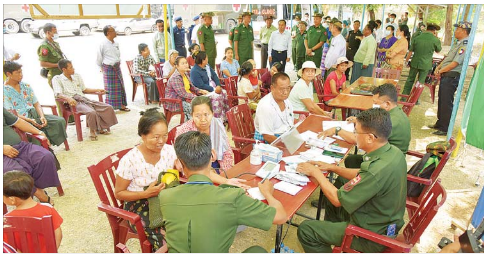
ဒေသကြီး ဝန်ကြီးချုပ်ဦးမြတ်ကျော်နှင့် စစ်ကိုင်း တပ်နယ်မှ တာဝန်ရှိသူများက သွားရောက်ကြည့်ရှု အားပေးပြီး အာဟာရဖြည့် စားသောက်ဖွယ်ရာများ ပေးအပ်သည်။ ထို့ပြင် တိုင်းဒေသကြီးဝန်ကြီးချုပ်နှင့် တိုင်းစစ်

ထို့နောက် ဆေးကုသမှုခံယူနေသည့် ဒေသခံ ပြည်သူများစားသောက်ရေးအဆင်ပြေစေရန်အတွက် တာဝန်ရှိသူများနှင့် ဒေသခံစေတနာရှင် ပြည်သူများ က နေ့လယ်စာဖြင့် ဧည့်ခံကျွေးမွေးကြသည်။ ယင်းသို့ ဆောင်ရွက်ပေးနေမှုများကို တိုင်း