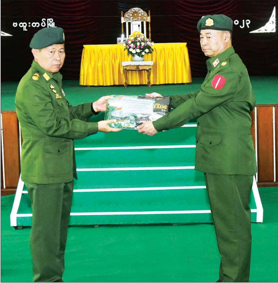
နိုင်ငံတော်စီမံအုပ်ချုပ်ရေးကောင်စီဒုတိယဥက္ကဋ္ဌ ဒုတိယတပ်မတော်ကာကွယ်ရေးဦးစီးချုပ် ကာကွယ်ရေးဦးစီးချုပ်(ကြည်း) ဒုတိယဗိုလ်ချုပ်မှူးကြီး စိုးဝင်း သင်တန်းသားများ၊ ဗိုလ်လောင်းများနှင့် အရာရှိ၊ စစ်သည်၊ မိသားစုများအတွက် စားသောက်ဖွယ်ရာများ ပေးအပ်စဉ်။