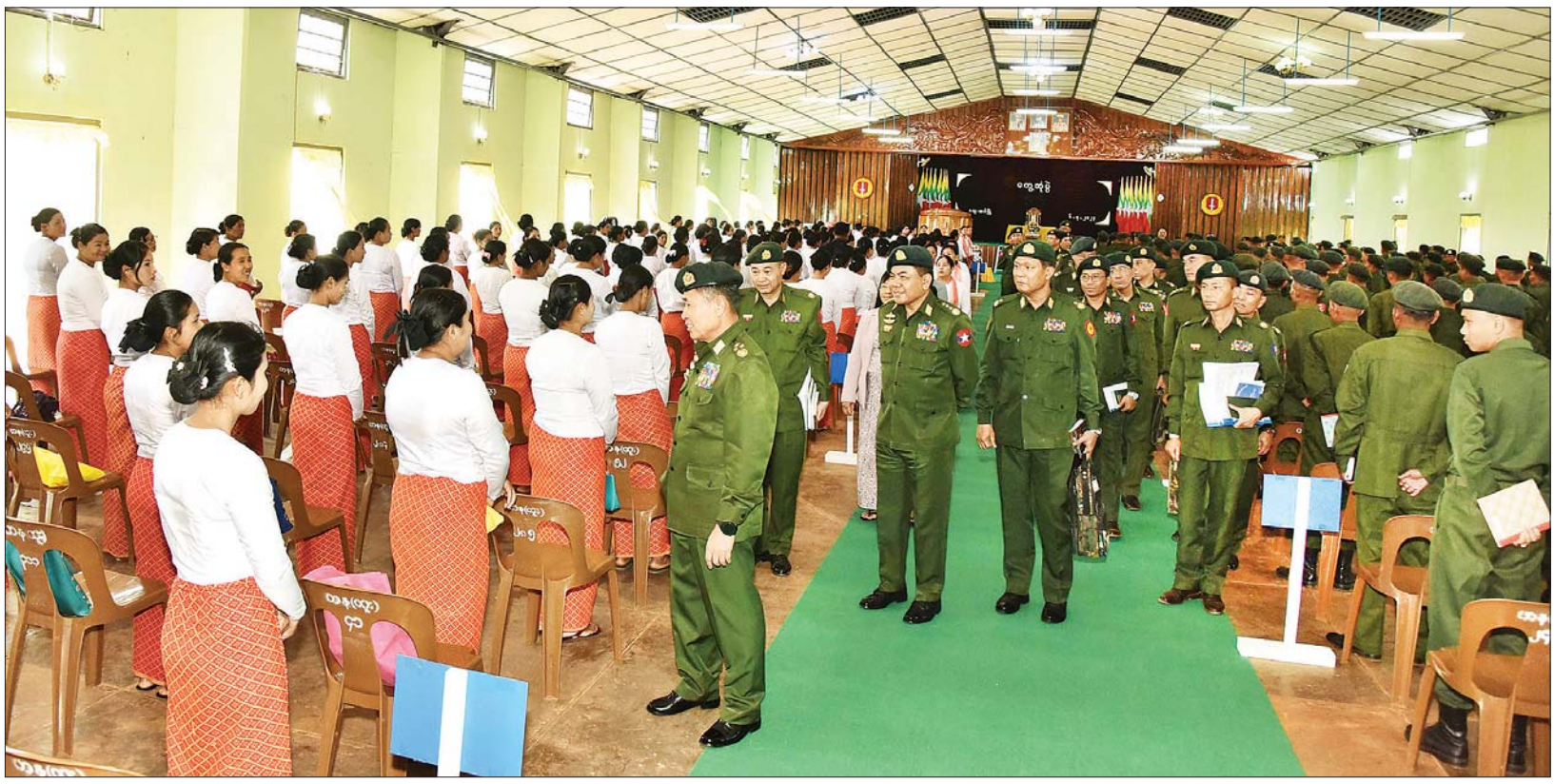
နိုင်ငံတော်စီမံအုပ်ချုပ်ရေးကောင်စီဒုတိယဥက္ကဋ္ဌ ဒုတိယတပ်မတော်ကာကွယ်ရေးဦးစီးချုပ် ကာကွယ်ရေးဦးစီးချုပ် (ကြည်း) ဒုတိယဗိုလ်ချုပ်မှူးကြီး စိုးဝင်း ဗထူးတပ်နယ်ရှိ အရာရှိ၊ စစ်သည်၊ မိသားစုများအား ရင်းရင်းနှီးနှီး နှုတ်ဆက်စဉ်။

နေပြည်တော် ဧပြီ ၆ နိုင်ငံတော် စီမံအုပ်ချုပ်ရေးကောင်စီ ဒုတိယဥက္ကဋ္ဌ ဒုတိယတပ်မတော် ကာကွယ်ရေးဦးစီးချုပ် ကာကွယ်ရေးဦးစီးချုပ် (ကြည်း) ဒုတိယဗိုလ်ချုပ်မှူးကြီး စိုးဝင်းသည် ယနေ့နံနက်ပိုင်းတွင် ဗထူးတပ်နယ်မှ ခြေလှင်တပ်စုများ သင်တန်းသားများ၊ ဗိုလ်လောင်းများနှင့် တပ်မတော် (ကြည်း) အရာခံနှင့် အကြပ်ကြီးသင်ကျောင်းရှိ ကွန်ပျူတာဒီပလိုမာတပ်ကြပ်ကြီး စာရေးသင်တန်းသားများအား တပ်မတော် (ကြည်း) တိုက်ခိုက်ရေးကျောင်း (ဗထူး) အောင်ဆန်းခန်းမနှင့် တပ်မတော် (ကြည်း) အရာခံနှင့် အကြပ်ကြီးသင်ကျောင်းခန်းမတို့တွင် သီးခြားစီ တွေ့ဆုံ၍ လည်းကောင်း၊ မွန်းလွဲပိုင်းတွင် တပ်နယ်မှ အရာရှိ၊ စစ်သည်၊ မိသားစုများအား တပ်မတော် (ကြည်း) စာမျက်နှာ ၃ ကော်လံ ၁ ၀