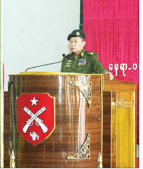
နိုင်ငံတော်စီမံအုပ်ချုပ်ရေးကောင်စီဒုတိယဥက္ကဋ္ဌ ဒုတိယတပ်မတော်ကာကွယ်ရေးဦးစီးချုပ် ကာကွယ်ရေးဦးစီးချုပ်(ကြည်း) ဒုတိယဗိုလ်ချုပ်မှူးကြီး စိုးဝင်း တပ်မတော်(ကြည်း) အရာခံနှင့် အကြပ်ကြီးသင်ကျောင်းရှိ ကွန်ပျူတာဒီပလိုမာတပ်ကြပ်ကြီး စာရေးသင်တန်းသားများအား တွေ့ဆုံအမှာစကား ပြောကြားစဉ်။