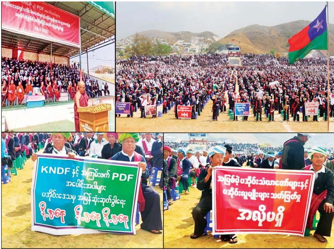
ပအိုဝ်းကိုယ်ပိုင်အုပ်ချုပ်ခွင့်ရဒေသအတွင်း KNDF/KNPP အဖွဲ့တို့နှင့် PDF အမည်ခံ အကြမ်းဖက်အဖွဲ့တွေက ပအိုဝ်းသံဃာတော်များနှင့် လူမျိုးများအား လူမဆန်စွာ သတ်ဖြတ်မှုအပေါ် ပြင်းထန်စွာ ဆန့်ကျင်ရှုတ်ချကြောင်း ဆန္ဒထုတ်ဖော်မှုများ။

ဒီအိတ်ဖွင့်ပေးစာမှာ ရေးသားထားတဲ့ အချက်တွေကတော့ ပြီးခဲ့တဲ့ မတ်လ ၁၆ ရက်နေ့က နိုလင်းဟောဇာအနေနဲ့ ကုလသမဂ္ဂ အထွေထွေညီလာခံမှာ မြန်မာနိုင်ငံနဲ့ ပတ်သက်ပြီး တစ်ဖက်သတ် စွပ်စွဲပြောကြားချက်တွေကို တုံ့ပြန်အသိပေးထောက်ပြလိုရင်း ဖြစ်ပါတယ်။ သက်ဆိုင်ရာ နိုင်ငံခြားရေးဝန်ကြီးဌာနက ဘယ်လိုတုံ့ပြန်ထားတယ်ဆိုတာ မသိပေမယ့် နိုလင်းဟောဇာရဲ့ ပြောကြားချက်တွေဟာ တည်ဆဲအစိုးရကို ဆန့်ကျင်နေတဲ့ လူပုဂ္ဂိုလ်၊ အဖွဲ့အစည်းတွေရဲ့ လူမှုကွန်ရက်က အခြေအမြစ်မရှိတဲ့ သတင်းအတု၊ သတင်းအမှားတွေ၊ ဝါဒဖြန့်မှုတွေ၊ ပေးပို့ချက်တွေကို အခြေခံပြီး သံယောင်လိုက်ပြောဆိုထားခြင်းဖြစ်တာ