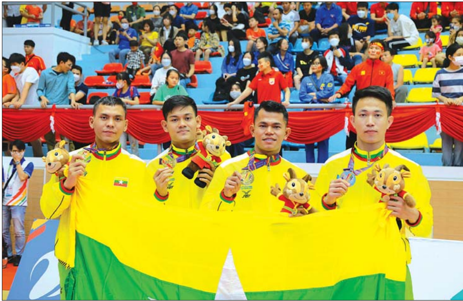
(၃၁) ကြိမ်မြောက် အရှေ့တောင်အာရှအားကစားပြိုင်ပွဲကို ဟနွိုင်းမြို့ရှိ Soc Son အားကစားရုံ၌ ကျင်းပရာ ဗိုဗီနမ်အားကစားနည်းမှ မြန်မာနိုင်ငံကိုယ်စားပြု အားကစားအဖွဲ့က ကိုးခုမြောက် ရွှေတံဆိပ်ကို ရယူပေးစဉ်။ (၂၀၂၂ ခုနှစ် မေ ၂၂ ရက်)

ကျင်းပပြီးစီးခဲ့သည့် (၃၁) ကြိမ်မြောက် အရှေ့တောင်အာရှ အားကစားပြိုင်ပွဲကြီးကို ဗီယက်နမ်နိုင်ငံ၌ ၂၀၂၁ ခုနှစ်အတွင်း ကျင်းပရန် ဖြစ်သော်လည်း ဗီယက်နမ်နိုင်ငံအတွင်း ဖြစ်ပေါ်နေသည့် ကိုဗစ်-၁၉ ရောဂါအခြေအနေကြောင့် ပြိုင်ပွဲရက်ကို ၂၀၂၂ ခုနှစ် မေလအတွင်း ပြောင်းရွှေ့ကျင်းပခဲ့ရသည်။ ထိုကဲ့သို့သော အခြေအနေအရ (၃၁)ကြိမ်မြောက် အရှေ့တောင်အာရှအားကစားပြိုင်ပွဲနှင့် (၃၂)ကြိမ်မြောက် အရှေ့တောင်အာရှ အားကစားပြိုင်ပွဲမှာ တစ်နှစ်ခန့်သာခြား၍ ကျင်းပခဲ့ခြင်းဖြစ်သည်။