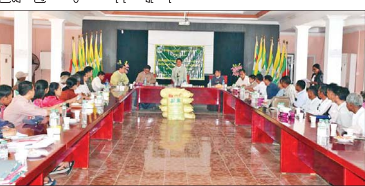
ခြေငြာစာများကို ထုတ်ပေးရန် ချေးငွေ စာချုပ် ချုပ်ဆိုခဲ့ပြီး တက်ရောက်လာ သည့် ဒေသခံတောင်သူများအား စိုက်ပျိုး ရေးသွင်းအားစုခြေငြာစာများကို တာဝန် ရှိသူများက ပေးအပ်ရာ တောင်သူများ ကိုယ်စား တောင်သူတစ်ဦးက ကျေးဇူးတင် စကား ပြန်လည်ပြောကြားခဲ့ကြောင်း သိရသည်။

မြို့နယ်စိုက်ပျိုးရေးဦးစီးမှူး ဦးလှိုင်မြင့် က မြို့နယ်အတွင်း ယခုနှစ် နွေစပါး စိုက်ပျိုးမှုအခြေအနေများနှင့် နိုင်ငံစီးပွား မြှင့်တင်ရေး ရန်ပုံငွေဖြင့် ဆောင်ရွက်မည့် လုပ်ငန်းရှင်၊ မျိုးစေ့ထုတ်အစုအဖွဲ့နှင့် သမဝါယမအသင်းများဖြင့် နွေစပါး စီမံကိန်း စိုက်ဧက ၃၅၂၂ ဧကအတွက် တစ်ဧကလျှင် နှစ်သိန်းကျပ်နှုန်းဖြင့် ညီမျှသည့် သွင်းအားစုစိုက်ပျိုးရေး