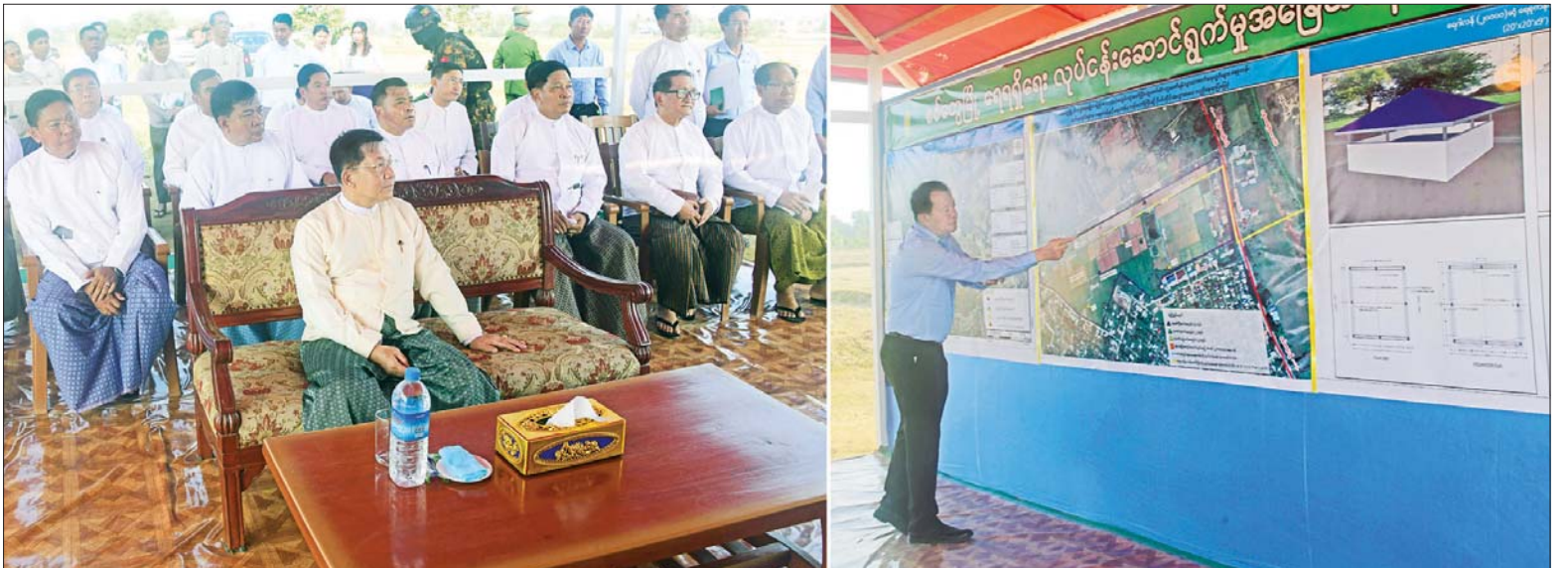
နိုင်ငံတော်စီမံအုပ်ချုပ်ရေးကောင်စီဥက္ကဋ္ဌ နိုင်ငံတော်ဝန်ကြီးချုပ် ဗိုလ်ချုပ်မှူးကြီး မင်းအောင်လှိုင်နှင့်အဖွဲ့ဝင်များအား တာဝန်ရှိသူတစ်ဦးက စစ်တွေမြို့၏ ရေလိုအပ်ချက် အခြေအနေများကို ရှင်းလင်းတင်ပြစဉ်။

နေပြည်တော် မတ် ၃၀ နိုင်ငံတော်စီမံအုပ်ချုပ်ရေးကောင်စီဥက္ကဋ္ဌ နိုင်ငံတော်ဝန်ကြီးချုပ် ဗိုလ်ချုပ်မှူးကြီး မင်းအောင်လှိုင်သည် ယနေ့ညနေပိုင်းတွင် ခရီးစဉ်တွင် လိုက်ပါလာသည့် အဖွဲ့ဝင်များ၊ ရခိုင်ပြည်နယ် ဝန်ကြီးချုပ် ဦးထိန်လင်း၊ အနောက်ပိုင်းတိုင်းစစ်ဌာနချုပ် တိုင်းမှူး ဗိုလ်ချုပ် ထင်လတ်ဦးနှင့် တာဝန်ရှိသူများလိုက်ပါပြီး ရခိုင်ပြည်နယ် စစ်တွေမြို့ မြို့ရေပေးဝေရေးလုပ်ငန်းများ ဆောင်ရွက်နေသည့် ကန်တော်ကြီးအတွင်းသို့ ရေများ ပြန်လည်ဖြည့်တင်းပေးဆောင်ရွက်နေမှု အခြေအနေများကို သွားရောက်ကြည့်ရှုစစ်ဆေးသည်။