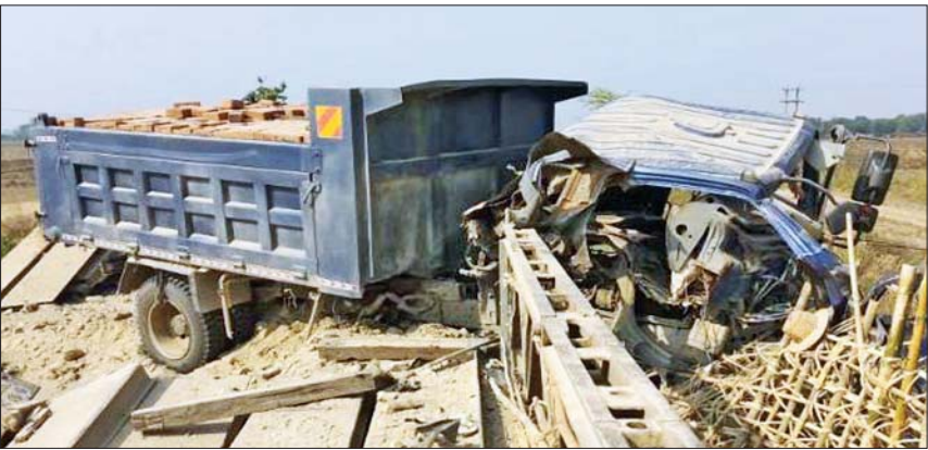
ကားမိုင်းပေါက်ကွဲသည့် မှတ်တမ်းဓာတ်ပုံ။

အဆိုပါ နေရာတစ်ဝိုက်အား လုံခြုံရေး တပ်ဖွဲ့ဝင်များက လိုအပ်သည့် နယ်မြေ လုံခြုံရေးလုပ်ငန်းများ ဆောင်ရွက်လျက်ရှိ ကြောင်းနှင့် ဒဏ်ရာရရှိသူများအား ကျောက်ကြီး မြို့နယ် ပြည်သူ့ဆေးရုံသို့ပို့ဆောင်ဆေးကုသမှု ခံယူစေလျက်ရှိကြောင်း သတင်းရရှိသည်။ သတင်းစဉ်