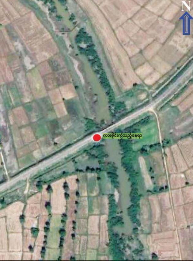
KNLA အဖွဲ့မှ အကြမ်းဖက်မှုကို လိုလားသောအဖွဲ့က ကျောက်ကြီး- နတ်သံကွင်းသွား ကားလမ်းရှိ ရန်ချိုးအောင်တံတားအနီး မိုင်းထောင် ဖောက်ခွဲသည့် ဖြစ်စဉ်နေရာပြပုံ။