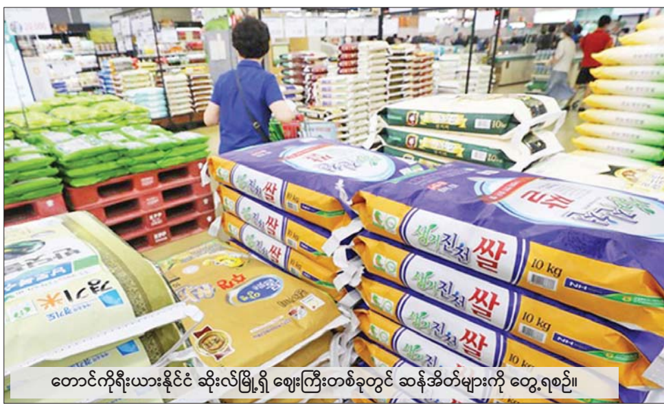
တောင်ကိုရီးယားနိုင်ငံ ဆိုးလ်မြို့ရှိ ဈေးကြီးတစ်ခုတွင် ဆန်အိတ်များကို တွေ့ရစဉ်။

ဆိုးလ် မတ် ၃၀ ခတ်မြေဩဇာ ဈေးနှုန်းများ မြင့်တက်လာခြင်းကြောင့် ပြီးခဲ့ သည့်နှစ်က တောင်ကိုရီးယားနိုင်ငံ ၏ ဆန်ထုတ်လုပ်မှုကုန်ကျစရိတ် မြင့်တက်လာကြောင်း မတ် ၃၀ ရက် စာရင်းအင်းရုံးအချက် အလက်များအရ သိရသည်။ လယ်သမားများသည် ၂၀၂၂ ခုနှစ်က စပါး ၂၀ ကီလိုဂရမ် စိုက်ပျိုးရန် ၃၁၆၃၁ ဝမ် (အမေရိ ကန်ဒေါ်လာ ၂၄ ဒေါ်လာ) သုံးစွဲခဲ့ ရာ ယခင်နှစ်ကထက် ၉ ဒသမ ၃ ရာခိုင်နှုန်း တိုးမြင့်လာကြောင်း ကိုရီးယား စာရင်းဇယားများအရ သိရသည်။ ပြီးခဲ့သည့်နှစ်က စပါး ထုတ်လုပ်မှု ကုန်ကျစရိတ်မှာ