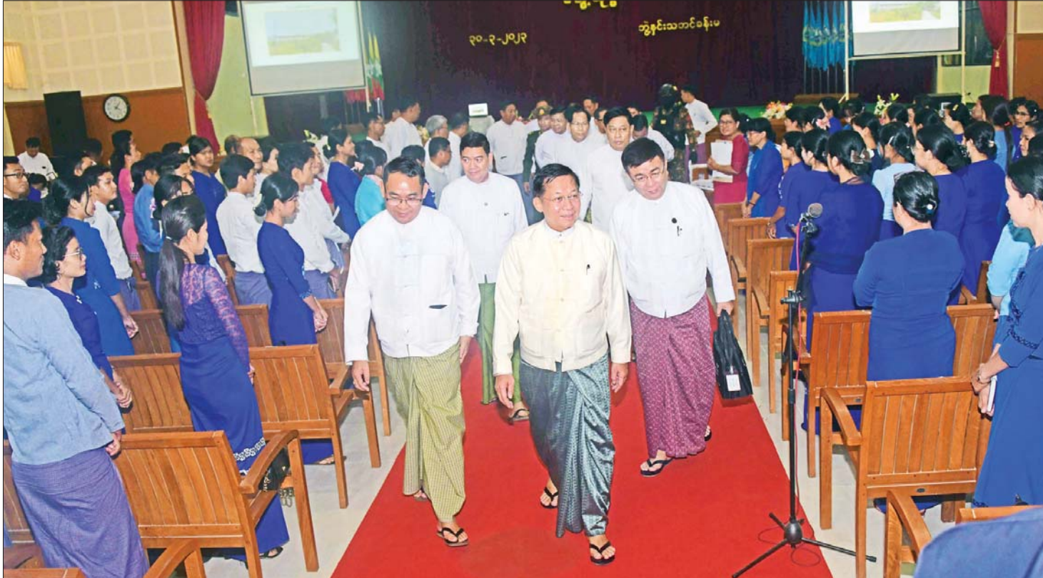
နိုင်ငံတော်စီမံအုပ်ချုပ်ရေးကောင်စီဥက္ကဋ္ဌ နိုင်ငံတော်ဝန်ကြီးချုပ် ဗိုလ်ချုပ်မှူးကြီး မင်းအောင်လှိုင် စစ်တွေတက္ကသိုလ်၌ ပါမောက္ခဌာနမှူးများ၊ နည်းပြဆရာ ဆရာမများအား ရှင်းလင်းနှီးနှီးနှုတ်ဆက်စဉ်။

ရှင်းလင်းတင်ပြမှုများနှင့် ပတ်သက်၍ နိုင်ငံတော် စီမံအုပ်ချုပ်ရေးကောင်စီဥက္ကဋ္ဌ နိုင်ငံတော်ဝန်ကြီး ချုပ်က “တက္ကသိုလ်” သို့မဟုတ် “တက္ကသိုလ်” ဟူသည်မှာ အဆင့်မြင့် အတတ်ပညာ၊ အသိပညာ နည်းပညာရပ်များကို သင်ကြားလေ့ကျင့်ပေးပြီး ကိုယ်ကျင့်တရားကောင်းမွန်အောင် ပွဲကိုင်ပေးသည့် ဌာနပင်ဖြစ်ကြောင်း၊ နိုင်ငံနှင့် ဒေသ၏စွမ်းအားကို မြှင့်တင်ပေးခြင်းဖြစ်ပြီး နိုင်ငံနှင့်ဒေသတိုးတက်ရေး အတွက် လိုအပ်သည့် အသိပညာနှင့် အတတ်ပညာ