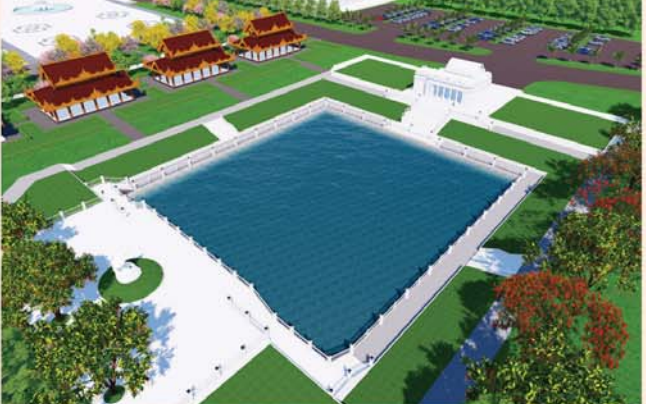
ကျောက်စာရုံစေတီ(၁၂ x ၁၂ x ၁၈)ပေ ၁ ဆူ တန်ဖိုး- ၂၇၉ သိန်း