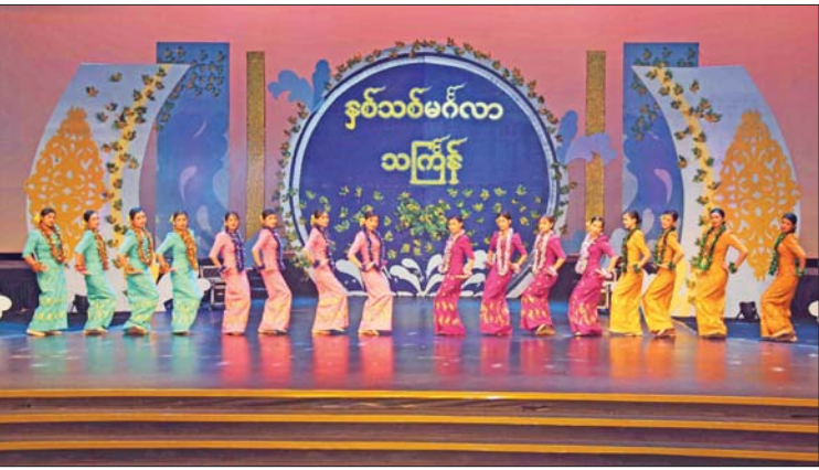
တေးသီချင်းများဖြင့် ရိုက်ကူးရေး ဆောင်ရွက်ခဲ့ကြသည်။

မြန်မာသက္ကရာဇ် ၁၃၈၄ ခုနှစ် မြန်မာ့ရိုးရာ မဟာသင်္ကြန်ပွဲတော်ကို နိုင်ငံတစ်ဝန်းတွင် စည်ကားသိုက်မြိုက်စွာ ကျင်းပနိုင်ရန် စီစဉ်ဆောင်ရွက်လျက် ရှိရာ မြန်မာ့အသံနှင့် ရုပ်မြင်သံကြား အနေဖြင့်လည်း “ခါသင်္ကြန်အဆိုအက” အစီအစဉ်ကို ယခင်နှစ်များနှင့်တူ တင်ဆက်နိုင်ရေး ဌာနဆိုင်ရာများ၊ တက္ကသိုလ်နှင့်ကျောင်းများ၊ ပုဂ္ဂလိက အသင်းအဖွဲ့များမှ သင်္ကြန်ယိမ်းအဖွဲ့များဖြင့် ရိုက်ကူးရေး ဆောင်ရွက်လျက်ရှိ သည်။