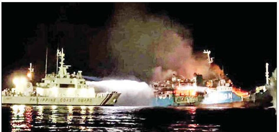
မီးလောင်နေသည့် ရေယာဉ်အား မီးငြိမ်းသတ်နေသည်ကို တွေ့ရစဉ်။

မနီလာ မတ် ၃၀ ဖိလစ်ပိုင်နိုင်ငံတောင်ပိုင်း၌ မတ် ၂၉ ရက် ညပိုင်းက လူပေါင်း ၂၀၀ ကျော်ကို တင်ဆောင်လာသည့် ကူးတို့ရေယာဉ်မီးလောင်မှုဖြစ်ပွားရာ ကလေး ခြောက်ဦးအပါအဝင် ၂၉ ဦး သေဆုံးခဲ့ကြောင်း ဖိလစ်ပိုင် ကမ်းခြေစောင့်တပ်က မတ် ၃၀ ရက်တွင် ပြောသည်။