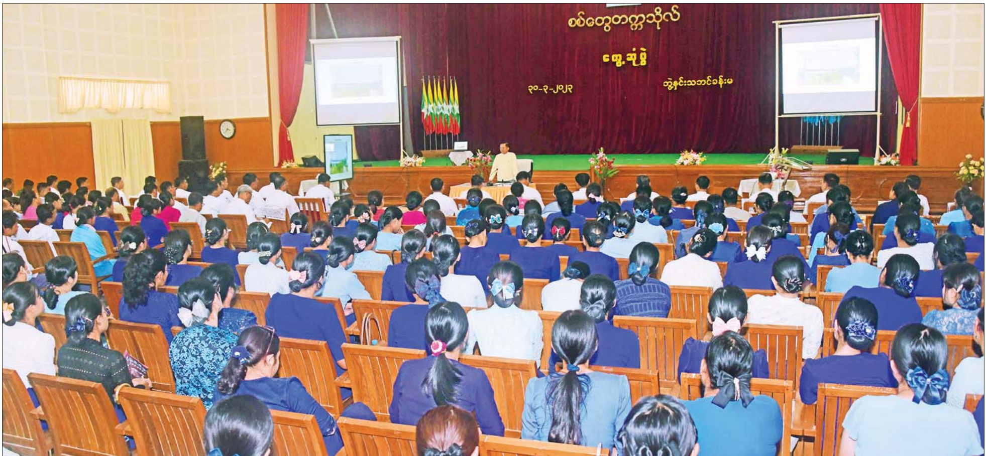
နိုင်ငံတော်စီမံအုပ်ချုပ်ရေးကောင်စီဥက္ကဋ္ဌ နိုင်ငံတော်ဝန်ကြီးချုပ် ဗိုလ်ချုပ်မှူးကြီး မင်းအောင်လှိုင် စစ်တွေတက္ကသိုလ်၌ ပါမောက္ခချုပ်၊ ပါမောက္ခဌာနမှူးများ၊ နည်းပြဆရာ ဆရာမများအား တွေ့ဆုံအမှာစကားပြောကြားစဉ်။