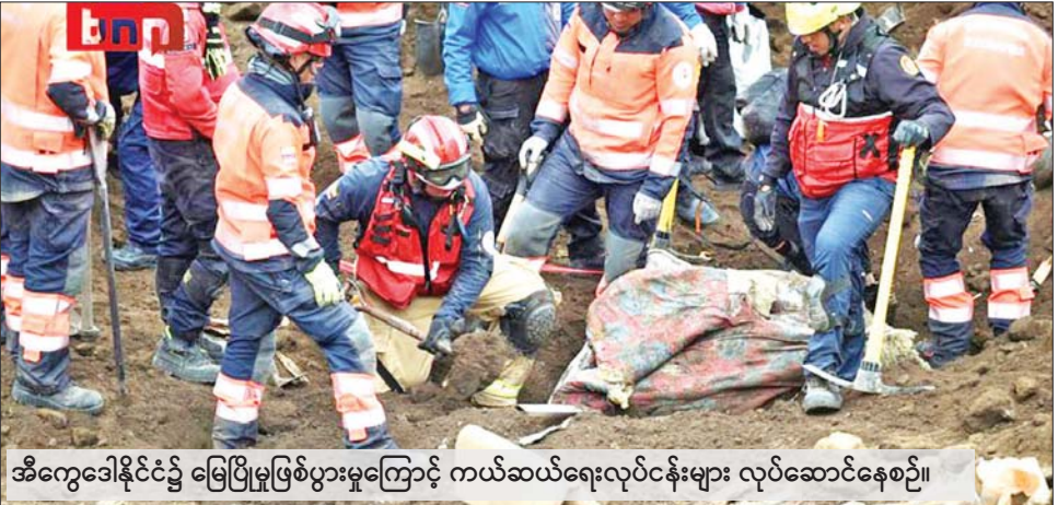
အီကွေဒေါနိုင်ငံ၌ မြေပြိုမှုဖြစ်ပွားမှုကြောင့် ကယ်ဆယ်ရေးလုပ်ငန်းများ လုပ်ဆောင်နေစဉ်။

အင်ဒီရန်ကျေးလက်ဒေသတွင် ၂၄ ဒသမ ၃ ဟက်တာကျော် ပျက်စီး ခဲ့ကြောင်း ဘေးအန္တရာယ်ဆိုင်ရာ စီမံခန့်ခွဲမှု အတွင်းရေးမှူးရုံးမှ ထုတ်ပြန်ထားသည်။ ကယ်ဆယ် ရေးသမားများ၊ တပ်မတော်သား များနှင့် ဒေသခံများက ပျောက်ဆုံး နေသူ ၆၇ ဦးကို အရှိန်မြှင့်ရှာဖွေနေ ကြောင်း သိရသည်။ မြေပြိုမှုကြောင့် စုစုပေါင်း ၃၁ ဦး ဒဏ်ရာရရှိခဲ့ပြီး ၃၂ ဦး ကို ကယ်ဆယ်နိုင်ခဲ့ကြောင်း၊ လူပေါင်း ၅၀၀ ကျော်နှင့် အိမ်ခြေ ၁၆၃ လုံး ထိခိုက်ခဲ့ကြောင်း မတ် ၂၈ ရက်ညက ထုတ်ပြန်သည့် နောက်ဆုံးအစီရင်ခံစာအရ သိရ သည်။ ဆင်ယာ