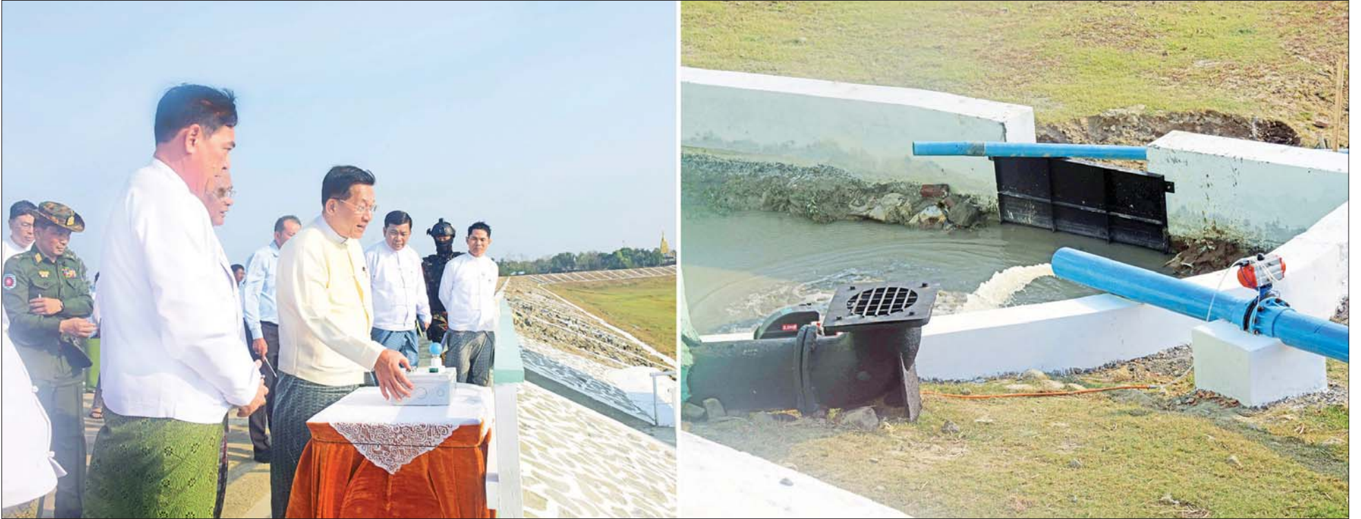
နိုင်ငံတော်စီမံအုပ်ချုပ်ရေးကောင်စီဥက္ကဋ္ဌ နိုင်ငံတော်ဝန်ကြီးချုပ် ဗိုလ်ချုပ်မှူးကြီး မင်းအောင်လှိုင် သင်္ကန်းဆည်နှင့် ကန်တော်ကြီးသို့ မြေအောက်ရေအကူပိုက်လိုင်းမှ ရေသွယ်တန်းမှုကို စက်ခလုတ်နှိပ်၍ စတင် ဖွင့်လှစ်ပေးစဉ်။