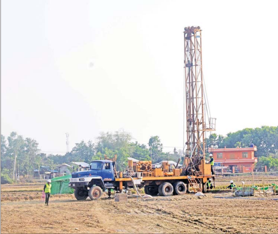
နိုင်ငံတော်စီမံအုပ်ချုပ်ရေးကောင်စီဥက္ကဋ္ဌ နိုင်ငံတော်ဝန်ကြီးချုပ် ဗိုလ်ချုပ်မှူးကြီး မင်းအောင်လှိုင်နှင့်အဖွဲ့ဝင်များ စက်ရေတွင်းများ တူးဖော်နေမှုကို လိုက်လံကြည့်ရှုစစ်ဆေးစဉ်။