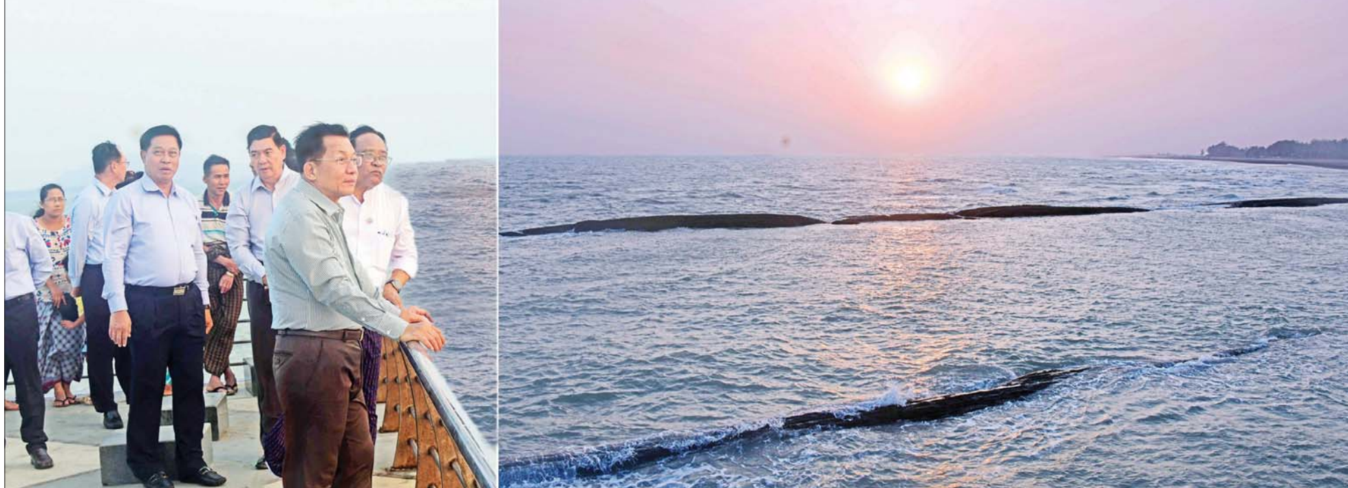
နိုင်ငံတော်စီမံအုပ်ချုပ်ရေးကောင်စီဥက္ကဋ္ဌ နိုင်ငံတော်ဝန်ကြီးချုပ် ဗိုလ်ချုပ်မှူးကြီး မင်းအောင်လှိုင်နှင့်အဖွဲ့ဝင်များ စစ်တွေမြို့ View Point ၌ ကြည့်ရှုစဉ်။

ဖြစ်ကြောင်း။ နိုင်ငံတစ်ခု ဖွံ့ဖြိုးတိုးတက်ရေးအတွက် ပညာ ရေးသည် လွန်စွာအရေးကြီးပြီး မိမိတို့နိုင်ငံအနေဖြင့် လွန်ခဲ့သည့် ကာလများကို လေ့လာကြည့်ပါက အတန်းလိုက် တန်းစဉ်ကျေးပြောင်းမှုများ နည်းပါးခဲ့ ကြောင်း၊ ရခိုင်ပြည်နယ်တွင်လည်း တန်းစဉ် ကျေးပြောင်းမှုများ နည်းပါးခဲ့သည်ကို တွေ့ရှိရကြောင်း၊ ထိုသို့ဖြစ်ပေါ်ခဲ့ခြင်းမှာ နိုင်ငံတော်အတွက် စိန်ခေါ်မှု ဖြစ်ပြီး နိုင်ငံဖွံ့ဖြိုးတိုးတက်မှုကို ထိခိုက်စေနိုင် ကြောင်း၊ စာမျက်နှာ ၅ သို့