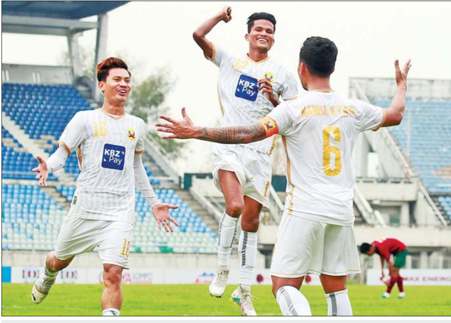
AFC Cup ပြိုင်ပွဲ ယှဉ်ပြိုင်ခွင့်ရထားသည့် ရှမ်းယူနိုက်တက်အသင်း။

ရန်ကုန် မတ် ၃၀ အာရှဘောလုံးအဖွဲ့ချုပ်က စီစဉ်ကျင်းပ မည့် ၂၀၂၃-၂၀၂၄ ရာသီ AFC Cup ပြိုင်ပွဲ တွင် မြန်မာကလပ်အသင်းများ ယှဉ်ပြိုင် ခွင့်ရထားပြီး ရှမ်းယူနိုက်တက်အသင်းက အုပ်စုအဆင့်၊ ရန်ကုန်ယူနိုက်တက်အသင်း က ခြေစစ်ပွဲ Play-off အဆင့်မှ စတင် ကစားရမည်ဖြစ်သည်။ အာရှဘောလုံးအဖွဲ့ချုပ်၏ သတ်မှတ် ချက်အရ မြန်မာကလပ်အသင်းများသည် ယခုရာသီမှစတင်ကာ အာရှချန်ပီယံလိဂ် ခြေစစ်ပွဲတွင် ယှဉ်ပြိုင်ခွင့်မရတော့ဘဲ AFC Cup ပြိုင်ပွဲတစ်ခုတည်းတွင်သာ ယှဉ်ပြိုင်ခွင့် ရတော့မည်ဖြစ်သည်။ ထို့ကြောင့် လိဂ်ချန်ပီယံအသင်းက အုပ်စု အဆင့်၊ လိဂ်ပြိုင်ပွဲ ဒုတိယဆုရအသင်း စာမျက်နှာ ၇ ကော်လံ ၁ ●