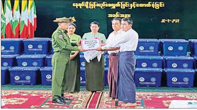
နယ်မြေခွဲတပ်မှ တာဝန်ရှိသူများ၊ ဦးစွာ တာဝန်ရှိသူများက ဌာနခိုင်ရာ တာဝန်ရှိသူများနှင့် နေရပ်ပြန် အိမ်ထောင်စုဝင်များ တက်ရောက်ကြသည်။ အဖွဲ့မှ ထောက်ပံ့သည့် အိမ်ထောင်စု တစ်စုလျှင် ထောက်ပံ့ငွေ ၅၀၀၀၀၀ နှုန်းဖြင့် အိမ်ထောင်စု ၆၄၄ စု အတွက် ထောက်ပံ့သည့် အိမ်ထောင်စု ၂၂၀ ကို

နေပြည်တော် မတ် ၂၉ ရခိုင်ပြည်နယ် ကျောက်တော်မြို့နယ်အတွင်းရှိ ယာယီခိုလှုံရာစခန်းများ၌ ခေတ္တခိုလှုံနေထိုင်လျက်ရှိသော ယာယီတိုက်ပွဲရောင်အိမ်ထောင်စုဝင် မိသားစုများသည် ၎င်းတို့၏ သဘောဆန္ဒဖြင့် မူလနေရပ်ဒေသများသို့ ပြန်လည်နေထိုင်ကြမည်ဖြစ်ရာ အဆိုပါ ယာယီတိုက်ပွဲရောင် အိမ်ထောင်စုဝင်များ လတ်တလော စားသောက်နေထိုင်ရေး အဆင်ပြေစေရန်အတွက် ထောက်ပံ့ငွေနှင့် လူသုံးကုန်ပစ္စည်းမျိုးစုံ ထောက်ပံ့ပေးအပ်ခြင်းကို ယနေ့ နံနက်ပိုင်းတွင် ကျောက်တော်မြို့ ကမ္ဘာ့ပန်ဆီနစ်မဏ္ဍ ဖြုလုပ်ရာ အနောက်ပိုင်းတိုင်း စစ်ဌာနချုပ်၊