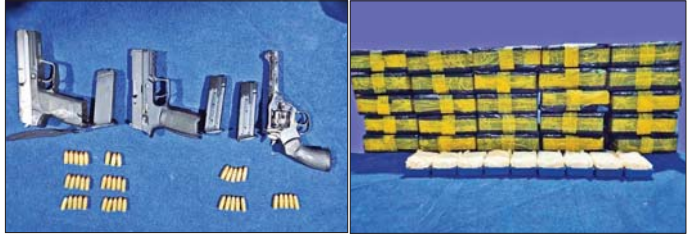
ခားပြတိုက်လူယက်ရာတွင် အသုံးပြုခဲ့သည့် လက်နက်/ခဲယမ်းနှင့် သိမ်းဆည်းရမိ မူးယစ်ဆေးဝါးများ။