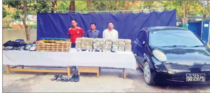
ခားပြတိုက်မှမြစ်စဉ်မှ တရားခံများနှင့် သိမ်းဆည်းရမိသည့် လက်နက်/ခဲယမ်း၊ မူးယစ်ဆေးဝါး၊ ငွေကြေး များနှင့် မော်တော်ယာဉ်၏ မှတ်တမ်းဓာတ်ပုံ။

အချိန်နှင့်တစ်ပြေးညီမဆုတ်မနှစ် ကြိုးပမ်းဖော်ထုတ်ခြင်း၊ တာဝန် သိပြည်သူ့ အချို့ကလည်း အချိန် နှင့်တစ်ပြေးညီ သတင်းပေးပို့ ပူးပေါင်း ပါဝင်ခြင်းများကြောင့် ခားပြတိုက် လူယက်ခဲ့သည့် ဖြစ်စဉ်အား ၂၄ နာရီအတွင်း ဖော်ထုတ် ဖမ်းဆီးနိုင်ခဲ့ခြင်း ဖြစ်သည်။ ထိရောက်စွာအရေးယူမည် အဆိုပါ ဖမ်းဆီးရမိ တရားခံ များအား ဥပဒေအရထိရောက်စွာ အရေးယူနိုင်ရေး ဆက်လက် ဆောင်ရွက်သွားမည်ဖြစ်ကြောင်း နှင့် ခားပြတိုက်လူယက်မှုအောင် သွားသည့် ရွှေထည်ပစ္စည်းများ အား ထုခွဲရောင်းချရာ၌ တရား မဝင် လက်ခံဝယ်ယူခဲ့သည့် “စိန်ကျော်မိုး ရွှေသန့်စင်နှင့် မီးလင်းရွှေ ရောင်းဝယ်ရေးဆိုင်” ကိုလည်း တရားဥပဒေအရ ထိရောက်စွာ အရေးယူဆောင်ရွက် သွားမည်ဖြစ်ကြောင်း၊ ခားပြတိုက် လူယက်မှုတွင် ပါဝင်ကျူးလွန် ခဲ့သည့် တရားခံပြေး နှစ်ဦးကို လည်း ဆက်လက်ဖော်ထုတ်၍ အမြန်ဆုံးဖမ်းဆီးနိုင်ရေး ဆောင် ရွက်သွားမည်ဖြစ်ကြောင်းနှင့် မိဘ ပြည်သူများအနေဖြင့် အဆိုပါ တရားခံပြေးများအား တွေ့မြင် သိရှိရပါက လျှို့ဝှက်စွာသတင်း ပေး တိုင်ကြားနိုင်ပါကြောင်း၊ သတင်းပေးသူနှင့် ဖမ်းဆီးပေးသူ များအား ထိုက်တန်စွာ လျှို့ဝှက်၍ ဆုငွေများ ချီးမြှင့်ပေးမည်ဖြစ် ကြောင်းနှင့် လုံခြုံရေးတပ်ဖွဲ့ဝင် များအနေဖြင့်လည်း ရပ်ရွာ အေးချမ်းသာယာရေး၊ တရား ဥပဒေစိုးမိုးရေးနှင့် ဒုစိုက်မှုများ တားဆီးဖော်ထုတ် ဖမ်းဆီးရမိနိုင် ရေးတို့အတွက် နေ့ညမပြတ် ဆက်လက် ဆောင်ရွက်လျက်ရှိ ကြောင်း သိရသည်။ သတင်းစဉ်