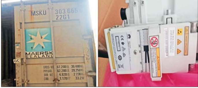
မြန်မာစက်မှုဆိပ်ကမ်းကုန်သေတ္တာစစ်ဆေးရေးစခန်း၌ သိမ်းဆည်းရမိမှု။

လွှာ (ID) တွင် ကြေညာထားခြင်းမရှိသည့် လျှပ်စစ်ပစ္စည်းမျိုးစုံ (ခန့်မှန်းတန်ဖိုးငွေကျပ် ၃၇၂၃၁၆၅၀) ကိုလည်းကောင်း၊ မြန်မာစက်မှုဆိပ်ကမ်းကုန်သေတ္တာစစ်ဆေးရေးစခန်း၌ သွင်းကုန်ကြေညာလွှာ (ID) တွင် ကြေညာထားခြင်းမရှိသည့် Huawei Power Rating နှစ်ခု (ခန့်မှန်းတန်ဖိုး ငွေကျပ် ၃၀၀၀၉၂၈၄) ကိုလည်းကောင်း၊ လားရှိုးမြို့နယ် အကောက်ခွန်ဦးစီးဌာနမှူး ဦးဆောင်သော စစ်ဆေးရေးအဖွဲ့က မန္တလေး-လားရှိုး မူဆယ် ပြည်ထောင်စုလမ်းမကြီးပေါ်ရှိ ဆိုရ်ယပ်တယ် စစ်ဆေးရေးဂိတ်အနီးတွင် မန္တလေးမြို့မှ မူဆယ်မြို့သို့ မောင်းနှင်လာသော မော်တော်ယာဉ်တစ်စီးပေါ်၌ တရားမဝင် ပိတောက်သစ်ခွားဆိုင်ကုန် ၃ ဒဿ ၈၀၀ တန် (ခန့်မှန်းတန်ဖိုးငွေကျပ် ၃၅၀၀၀၀၀)နှင့် အဆိုပါသစ်များ တင်ဆောင်လာသည့် မော်တော်ယာဉ်တစ်စီး (ခန့်မှန်းတန်ဖိုးငွေကျပ် ၂၅၀၀၀၀၀) ကို လည်းကောင်း၊ စုစုပေါင်းခန့်မှန်းတန်ဖိုးငွေကျပ် ၉၂၇၈၀၉၃၄ ကို ဖမ်းဆီးရ