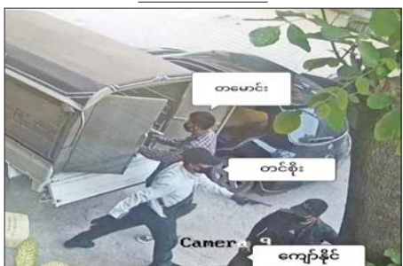
၂၇-၃-၂၀၂၃ ရက်တွင် ချမ်းအေးသာစံမြို့နယ် အောင်နန်းရိပ်သာ အနောက်ရပ်ကွက်ရှိ “စိန်ကျော်မိုးရွှေသန့်စင်နှင့် မီးလင်းရွှေ ရောင်းဝယ်ရေးဆိုင်” အား ဓားပြတိုက်လုယက်စဉ် တွေ့ရှိရသည့် CCTV မှတ်တမ်းဓာတ်ပုံ။