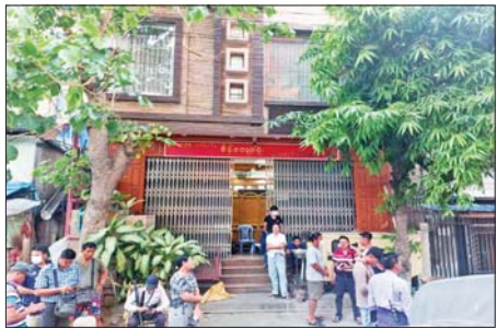
၂၇-၃-၂၀၂၃ ရက်တွင် ချမ်းအေးသာစံမြို့နယ် အောင်နန်းရိပ်သာ အနောက်ရပ်ကွက်ရှိ ဓားပြတိုက်လုယက်ခံရသည့် “စိန်ကျော်မိုးရွှေသန့်စင်နှင့် မီးလင်းရွှေ ရောင်းဝယ်ရေးဆိုင်” ၏ မှတ်တမ်းဓာတ်ပုံ။