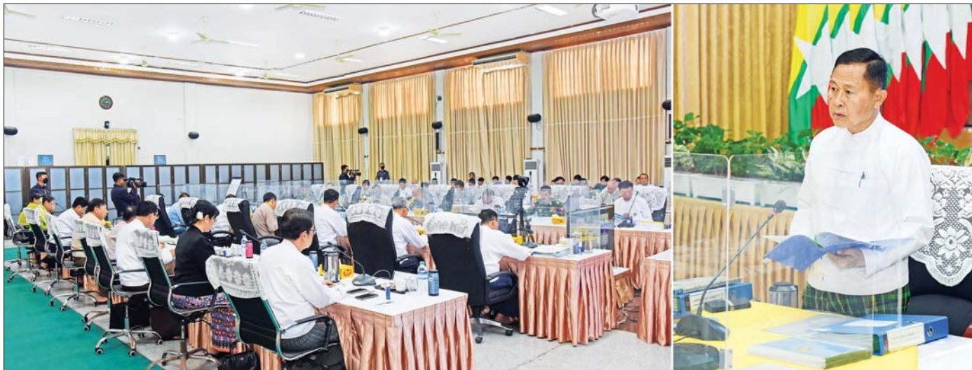
နိုင်ငံတော်စီမံအုပ်ချုပ်ရေးကောင်စီ ဒုတိယဥက္ကဋ္ဌ ဒုတိယဝန်ကြီးချုပ် ဒုတိယဗိုလ်ချုပ်မှူးကြီး စိုးဝင်း တရားမဝင်ကုန်သွယ်မှုတိုက်ဖျက်ရေး ဦးဆောင်ကော်မတီ လုပ်ငန်းညှိနှိုင်းအစည်းအဝေး (၂/၂၀၂၃) တွင် အမှာစကားပြောကြားစဉ်။

နိုင်ငံတော်စီမံအုပ်ချုပ်ရေးကောင်စီ ဒုတိယဥက္ကဋ္ဌ ဒုတိယဝန်ကြီးချုပ် ဒုတိယဗိုလ်ချုပ်မှူးကြီး စိုးဝင်း တရားမဝင်ကုန်သွယ်မှုတိုက်ဖျက်ရေးဦးဆောင်ကော်မတီ လုပ်ငန်းညှိနှိုင်းအစည်းအဝေး (၂/၂၀၂၃) သို့ တက်ရောက်အမှာစကားပြောကြား တရားမဝင်ကုန်သွယ်မှုများကို ထိရောက်စွာ တားဆီးစစ်ဆေးပြီး ဥပဒေနှင့်အညီ အရေးယူနိုင်မှသာ ပြည်တွင်း MSME များ ဖွံ့ဖြိုးတိုးတက်လာမည်