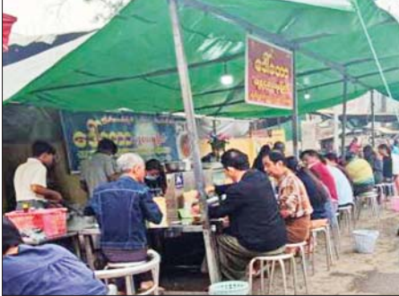
၁၂-၃-၂၀၂၃ ရက်တွင် ချမ်းအေးသာစံမြို့နယ် သီရိပေမာ အနောက်ရပ်ကွက်၊ ၂၆ x ၂၇ လမ်းကြား၌ ဓားပြတိုက်လုယက်ခံရသည့် ဒေါ်တောမုန့်တီဆိုင် မှတ်တမ်းဓာတ်ပုံ။