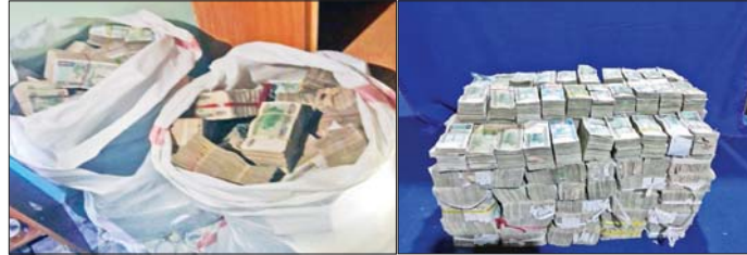
ပြန်လည်သိမ်းဆည်းရမိသည့် ခားပြတိုက်လူယက်မှုအောင်သွားသော ငွေကျပ် ၈၃၇ သိန်း။