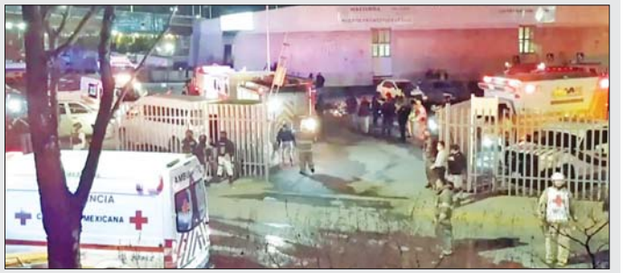
ထိန်းသိမ်းရေး စင်တာအပြင်ဘက်တွင် အရေးပေါ်ကယ်ဆယ်ရေး ဝန်ထမ်းများကို တွေ့ရစဉ်။ စင်တာများသို့ ဝိုင်းရံသည့်အပြင် တရားဝင် သို့ ဝင်ရောက်ရန် ကြိုးပမ်းသူပေါင်း သန်းတစ်ထက် အထောက်အထားများမရှိဘဲ ယမန်နှစ်အတွင်း နီးပါးရှိသည်ဟု သိရသည်။ မက္ကဆီကို နယ်စပ်ကိုဖြတ်ကျော်ကာ အမေရိကန် အင်န်အိတ်ချ်ကေ

ရပ်စ်၊ အယ်လ်ဆာဗေဒို၊ ဗင်နီဇွဲလားနှင့် အခြားသော တောင်အမေရိကနိုင်ငံများမှ ရွှေ့ပြောင်းနေထိုင် သူများ ဖြစ်ကြသည်။ အဆိုပါထိန်းသိမ်းရေး စင်တာမီးလောင်မှုနှင့် ပတ်သတ်၍ မက္ကဆီကို သမ္မတ အန်ဒရက်စ် မန်ရှူးရယ် လိုပက်စ် အော်ပရာဒို က မတ် ၂၉ ရက်တွင် ထုတ်ဖော်ပြောကြား ခဲ့သည်။ နေရပ်ပြန်ပို့ခံရမည်ဟုသိသော ထိန်းသိမ်း ခံထားရသူများသည် မွေ့ရာကို စီးရီးဆွေပြရာမှ မီးလောင်မှု ဖြစ်ပွားခဲ့သည်ဟု ၎င်းကပြောသည်။ အမေရိကန်သို့ ဝင်ရောက်ရန် စောင့်ဆိုင်းနေသည့် ရွှေ့ပြောင်းနေထိုင်သူပေါင်း ၁၀၀၀၀ ထက်မနည်း ရှိသည်ဟု အဆိုပါဒေသရှိ အင်န်ဂျီအိုတစ်ခုက ပြောသည်။ ၎င်းတို့ထဲမှ အချို့မှာ မက္ကဆီကို အာဏာပိုင်များ၏ ဖမ်းဆီးခြင်းခံရပြီး ထိန်းသိမ်းရေး