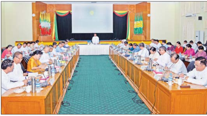
ပြည်ထောင်စုဝန်ကြီး ခေါက်တာညွန့်ဖေ ပညာရေးညီလာခံ (၂၀၂၃) ကျင်းပရေး အကြံပြုညှိနှိုင်းအစည်း အဝေးတွင် အမှာစကားပြောကြားစဉ်။

နေပြည်တော် မတ် ၂၉ ပညာရေးညီလာခံ (၂၀၂၃)ကျင်းပ ရေး အကြံပြုညှိနှိုင်းအစည်းအဝေး ကို ယနေ့နံနက် ၁၀ နာရီက နေပြည်တော် ပညာရေးဝန်ကြီး ဌာန အစည်းအဝေးခန်းမ၌ ကျင်းပရာ ပညာရေးဝန်ကြီး ဌာန ပြည်ထောင်စုဝန်ကြီး ခေါက်တာညွန့်ဖေ၊ ဒုတိယ ဝန်ကြီးများ၊ ဆက်စပ်ဝန်ကြီး ဌာနများမှ အမြဲတမ်းအတွင်းဝန် များ၊ ညွှန်ကြားရေးမှူးချုပ်များ၊ ပါမောက္ခချုပ်များ၊ ကျောင်းအုပ် ကြီးများနှင့် တာဝန်ရှိသူများ တက်ရောက်ကြသည်။ ကျင်းပရန် စီစဉ်ဆောင်ရွက် ခြင်းစွာ ပြည်ထောင်စုဝန်ကြီး က မြန်မာနိုင်ငံ၏ အနာဂတ်ပညာ ရေး ကောင်းမွန်စေရေးအတွက် ရည်ရွယ်ကျင်းပသည့် ပညာရေး ညီလာခံကို ပညာရေးဝန်ကြီးဌာန