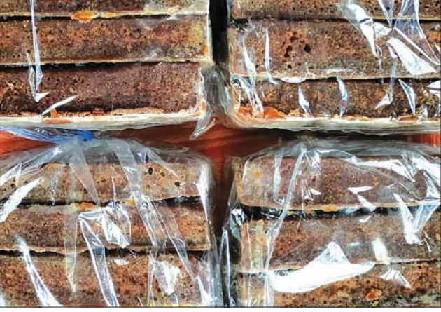
မိုင်းယောင်းဒေသထွက် ကြံသကာများကို တွေ့ရစဉ်။