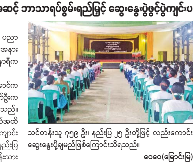
သင်တန်းသူ ၅၅၀ ဦး၊ နည်းပြ ၂၅ ဦးတို့ဖြင့် လည်းကောင်း ဆွေးနွေးပို့ချမည်ဖြစ်ကြောင်းသိရသည်။