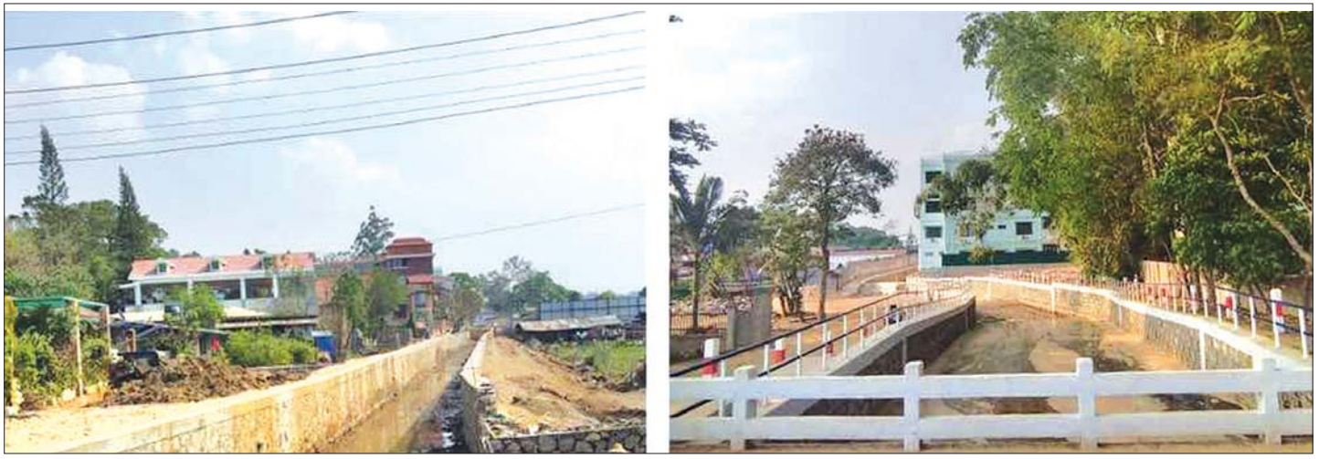
ဂဲလောင်းချောင်း ကျောက်ရိုးစီခြင်းလုပ်ငန်းပြီးစီးမှု မှတ်တမ်းဓာတ်ပုံ။

ထိုသို့ ပြင်ဦးလွင်မြို့၏ အသက်သွေးကြော ဖြစ်သည့် ဂဲလောင်းချောင်းအတွင်းသို့ ပြင်ဦးလွင် မြို့ပေါ် ရပ်ကွက်အသီးသီး၏ ရေမြောင်းများမှ ဂဲလောင်းချောင်းအတွင်းသို့ စည်းကမ်းမဲ့ အမှိုက် စွန့်ပစ်ခြင်း၊ မိလ္လာရေဆိုးပိုက်များ စွန့်ထုတ်ခြင်းနှင့် ဂဲလောင်းချောင်းမြေဧရိယာကို ခွင့်ပြုချက်မရှိဘဲ ကျော်လွန်ဆောင်ရွက်ထားသည့် အဆောက်အအုံ