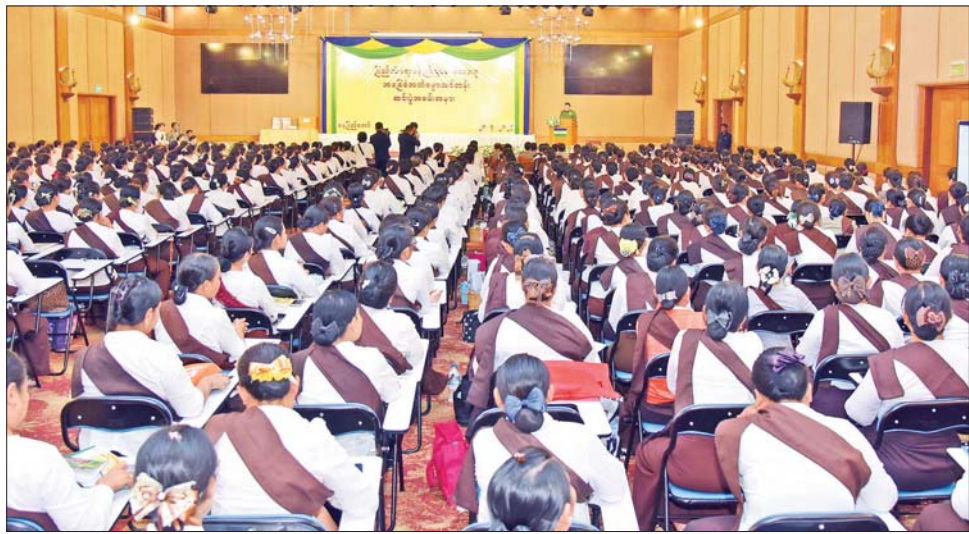
အမှတ်တရလက်ဆောင်များ ပေးအပ်ခဲ့ပြီး သင်တန်း တက်ရောက်ခဲ့ကြသည့် သင်တန်းသား သင်တန်းသူ၊ ကျောင်းသား ကျောင်းသူများကို ရင်းရင်းနှီးနှီး နှုတ်ဆက်သည်။ အဆိုပါ ယဉ်ကျေးလိမ္မာသင်တန်းကို ပြည်ထဲရေး ဝန်ကြီးဌာန၊ ပြည်ထောင်စုဝန်ကြီးရုံး၊ မြန်မာနိုင်ငံ ရဲတပ်ဖွဲ့၊ အထွေထွေအုပ်ချုပ်ရေးဦးစီးဌာန၊ အထူးစုံစမ်းစစ်ဆေးရေးဦးစီးဌာန၊ အကျဉ်းဦးစီးဌာန နှင့် မီးသတ်ဦးစီးဌာနတို့မှ တပ်ဖွဲ့ဝင်/ ဝန်ထမ်းများ၏ မိသားစုဝင် သား/သမီး၊ ကျောင်းသား ကျောင်းသူများ အနက် Grade(2) မှ Grade(12) အထိ စုစုပေါင်း ၄၆၉ ဦးကို တန်းခွဲလေးခုခွဲ၍ ဖွင့်လှစ်ပို့ချခဲ့ကြောင်း သိရသည်။

ယင်းနောက် ယဉ်ကျေးလိမ္မာသင်တန်း၊ သင်တန်းဆင်းပွဲအခမ်းအနားကို နေပြည်တော်ရှိ ရုံးအမှတ်(၈)၊ မြန်မာနိုင်ငံရဲတပ်ဖွဲ့ဌာနချုပ်၊ အရိန္ဒမာ ခန်းမ၌ ဆက်လက်ကျင်းပရာ ဒုတိယဝန်ကြီး ဗိုလ်ချုပ် တိုးရီက အမှာစကားပြောကြားသည်။ ထို့နောက် ဒုတိယဝန်ကြီးနှင့် တာဝန်ရှိသူများက သင်တန်းနည်းပြ ဆရာမများကို ဂုဏ်ပြု