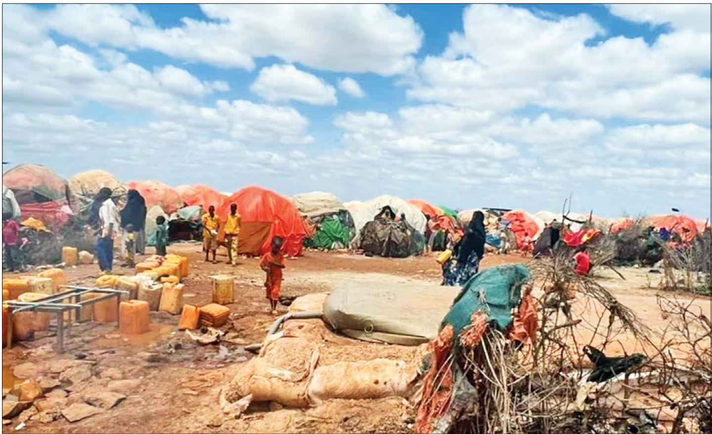
မိုးခေါင်မှုကြောင့် နေရပ်စွန့်ခွာသူများအား ဆိုမာလီယာတိုင်အုံဒါ ကယ်ဆယ်ရေးစခန်းတစ်ခု၌ နေရာချထားပေးမှုကို တွေ့ရစဉ်။

လာမည့် ဧပြီလမှ ဇွန်လအတွင်း လူပေါင်း ၆ ဒသမ ၅ သန်းကျော်မှာ ဆိုးရွားသည့် အငတ်ဘေးနှင့် အစားအစာလုံခြုံမှုမရှိခြင်းပြဿနာနှင့် ရင်ဆိုင်ရဖွယ်ရှိသည်ဟု ခန့်မှန်းထားသည်။ ဆိုမာလီနိုင်ငံ ဆိုင်ရာကုလသမဂ္ဂလူသားချင်းစာနာထောက်ထားမှု တုံ့ပြန်ရေးအစီအစဉ်အရ ဆိုမာလီရှိ လူပေါင်း ၇ ဒသမ ၆ သန်းရှိသော ပြည်သူများ၏ လိုအပ်ချက်ကို