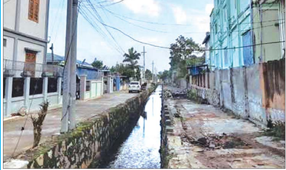
ဂဲလောင်းချောင်းဘေး ကျော်လွန်အဆောက်အအုံများ ဖယ်ရှားရှင်းလင်းပြီးစီးမှု မှတ်တမ်းဓာတ်ပုံ။

ဂဲလောင်းချောင်းရေစီးရေလာ ကောင်းမွန်ရေး နှင့် ဂေဟစနစ်ရေရှည် တည်တံ့ခိုင်မြဲရေးအတွက် ဒေသခံလူထု၏ စာမျက်နှာ ၁၁ သို့