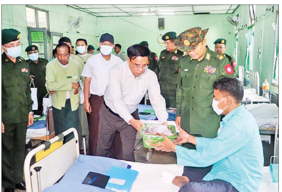
အား သွားရောက်ကြည့်ရှုအားပေးခဲ့သည်။ ဆက်လက်၍ တိုင်းဒေသကြီး ဝန်ကြီးချုပ် ဦးမျိုးဆွေဝင်းသည် ဝေါမြို့နယ် ဆပ်သွားခြံတာဆုံ ရှိ Cargo X-Ray စစ်ဆေးရေးဂိတ်သို့ သွားရောက် ကြည့်ရှုစစ်ဆေးခဲ့ပြီး တရားမဝင်ကုန်ပစ္စည်းများနှင့် မူးယစ်ဆေးဝါး သယ်ဆောင်မှုမရှိစေရေး၊ ယာဉ်ကြော ပိတ်ဆို့မှုမရှိစေရေးနှင့် လုံခြုံရေးအသိ လုံခြုံရေး သတိဖြင့်ဆောင်ရွက်ရန် မှာကြားခဲ့ပြီး တာဝန်ကျ တပ်ဖွဲ့ဝင်များအတွက် ထောက်ပံ့ငွေများ ပေးအပ်ခဲ့ သည်။ ၎င်းနောက် ဝေါမြို့နယ် ကျိုက်လှကျေးရွာ ရှိ တစ်နှစ်သုံးသီးစိုက် ရက် ၉၀ စပါး မျိုးသန့် မျိုးပွား စံပြစိုက်ခင်းသို့ သွားရောက်ပြီး ဒေသနှင့် ကိုက်ညီသော သက်တမ်းတိုပြီး အထွက်နှုန်းကောင်း သည့် စပါးမျိုးများ မြို့နယ်အလိုက် တိုးချဲ့၍ တောင်သူ အစုအဖွဲ့စနစ်ဖြင့် စိုက်ပျိုးဆောင်ရွက်ရန် တာဝန်ရှိသူများအား မှာကြားခဲ့ကြောင်း သိရ သည်။ တင်စိုး(ပဲခူး)

တိုင်းဒေသကြီးအစိုးရအဖွဲ့ ရန်ပုံငွေ ၁၈၀ ဒသမ ဖြေရ သန်း အကုန်အကျခံကာ ဆိုလာရေတင်စနစ်ဖြင့် ကုန်းမြင့်လယ်မြေ ဧက ၁၅၀ နေ့စပါးစိုက်ပျိုး အောင်မြင်ဖြစ်ထွန်းနေမှုအား ကြည့်ရှုစစ်ဆေး သည်။ ဆက်လက်၍ တိုင်းဒေသကြီး ဝန်ကြီးချုပ်နှင့် အဖွဲ့သည် ညောင်လေးပင် - ပြန်တန်ဆာ(မြို့ရှောင် လမ်း) ဖောက်လုပ်နေမှုအား ကြည့်ရှုစစ်ဆေးခဲ့ပြီး လမ်းခရီးယာအတွင်း ကျူးကျော်မှုမရှိစေရေးနှင့် လမ်းဘေးရေမြောင်းများ တစ်ပါတည်းထည့်သွင်း ဆောင်ရွက်ရန် မှာကြားသည်။ ထို့နောက် ညောင်လေးပင်ခရိုင်အတွင်း နိုင်ငံစီးပွားမြှင့်တင်ရေး ရန်ပုံငွေဖြင့် ပဲတီစိမ်းစိုက်တောင်သူများက အရင်း ကျပ်ပဲတီစိမ်း ပြန်လည်ပေးဆပ်နေမှုအား ကြည့်ရှု အားပေးခဲ့သည်။ ညောင်လေးပင်ခရိုင်အတွင်း နိုင်ငံ စီးပွားမြှင့်တင်ရေး ပဲတီစိမ်းစိုက်ဧက ၆၈၀၀၀ ရှိ ပြီး ယခုအချိန်ထိ ၆၀ ရာခိုင်နှုန်းကျော် ပြန်လည် ပေးသွင်းလျက်ရှိကြောင်း သိရသည်။ ထို့နောက် တိုင်းဒေသကြီး ဝန်ကြီးချုပ်နှင့်အဖွဲ့ သည် ညောင်လေးပင်မြို့တွင်း ရေစီးရေလာကောင်း မွန်စေရေး ရွာသစ်ချောင်း ပြန်လည်တူးဖော်နေမှု အား ကြည့်ရှုစစ်ဆေးသည်။ ယင်းနောက် တိုင်းဒေသကြီး ဝန်ကြီးချုပ်နှင့်အဖွဲ့ သည် ဒိုက်ဦးမြို့နယ် အောင်စိုးမိုးကျေးရွာ Gasifire စွန့်ပစ်စမ်းခွဲသုံး လျှပ်စစ်ဓာတ်အားပေးစနစ်ဖြင့် ဆန်စက်နှင့် ဆီစက်လည်ပတ်ဆောင်ရွက်နေမှု