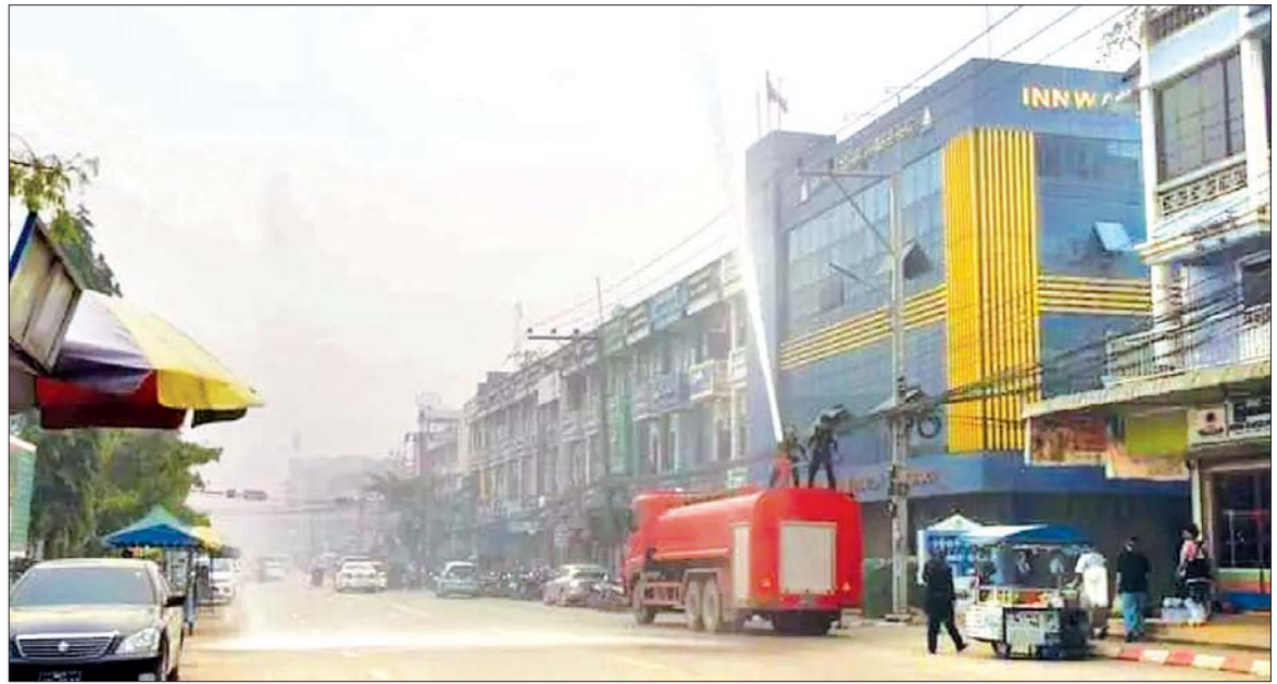
တာချီလိတ်မြို့နယ်အတွင်း လေထုညစ်ညမ်းမှု ဆိုးရွားစွာ ဖြစ်ပေါ်နေမှုကြောင့် မီးသတ်ဦးစီးဌာနမှ ရေများပက်ဖျန်းပေးနေစဉ်။

နေပြည်တော်အပါအဝင် တိုင်းဒေသ ကြီး ပြည်နယ်များ၌ ၂၀၂၂ ခုနှစ်အတွင်း မီးလောင်မှုဖြစ်စဉ်များအနက် မီးဖိုမီးမှ အကြိမ်ရေ ၂၃၀၊ ပေါဆဲမီးမှ ၄၂၈ ကြိမ်၊ အလိုအလျောက် မီးလောင်မှု ၂၁ ကြိမ်၊ လျှပ်စစ်မီးမှ ၄၆၁ ကြိမ်၊ မသမာသူရှိုမီး ၂၁၉ ကြိမ်၊ တောင်မီးလောင်ကျွမ်းမှု ၄၄ ကြိမ်၊ သောင်းကျန်းသူရှိုမီး ၉၇ ကြိမ်၊ မိုးကြိုးပစ်မှုကြောင့် ခုနစ်ကြိမ် စုစုပေါင်း ၁၅၀၇ ကြိမ် မီးလောင်မှုဖြစ်ပေါ်ခဲ့သည်။ အဆိုပါ မီးလောင်မှုများကြောင့်