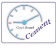
Clock Brand (၄/၃၅၅၄/၂၀၂၃)