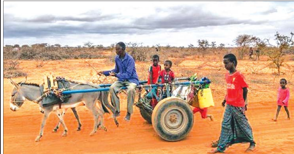
မိုးခေါင်မှုဒဏ်ခံစားနေရသည့် ဆိုမာလီနိုင်ငံသားများကို တွေ့ရစဉ်။

ကုလသမဂ္ဂ ဒုက္ခသည်များဆိုင်ရာ မဟာမင်းကြီးရုံးက ပြောသည်။ အဆိုပါဒေသမှာလည်း မိုးခေါင် ရေရှားမှုဒဏ်ကို ခံစားနေရသည့် ဒေသဖြစ်သည်။ ဆိုမာလီ တစ်နိုင်ငံထဲတွင်ပင် ပဋိပက္ခများနှင့် မိုးခေါင်မှုကြောင့် ပြည်တွင်းရွှေ့ပြောင်းနေထိုင်နေရသူ ၂၈၇၀၀၀ ရှိသည်ဟု သိရသည်။ လူသန်းပေါင်းများစွာ အိုးမဲ့အိမ်မဲ့ဖြစ်ခဲ့ရ ဆိုမာလီနိုင်ငံသည် သမိုင်းတွင် အရှည်လျားဆုံးနှင့်အဆိုးရွားဆုံး မိုးခေါင်မှုဒဏ်ကိုခံစားနေရခြင်း ဖြစ်ပြီး ကာလရှည်ကြာ မိုးခေါင်မှုကြောင့် နိုင်ငံကို ဆိုးဆိုးရွားရွား ထိခိုက်စေခဲ့သည်။ ဆိုမာလီယာ၌ တိရစ္ဆာန် ၃ ဒသမ ၅ သန်း သေကျေပျက်စီးခဲ့ရပြီး မွေးမြူရေးလုပ်ငန်းများလည်း ပျက်ပြားခဲ့ရသည်။ ယင်းအတွက်ကြောင့် ကလေးငယ်များ နို့မသောက်သုံးရဘဲ လူသန်းပေါင်းများစွာ အိုးမဲ့အိမ်မဲ့ ဖြစ်ခဲ့ရသည်။ ။ ကိုးကား - ဆင်ဟွာ