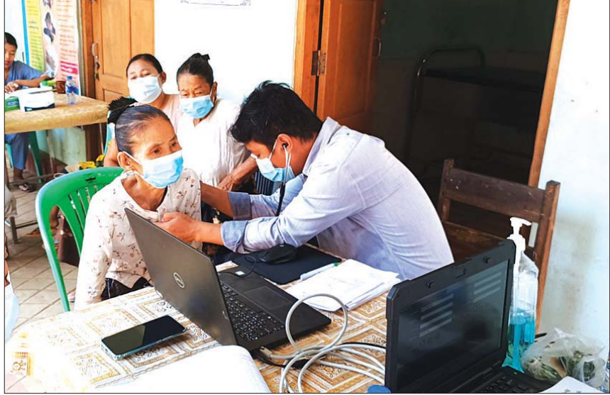
နဒီ(ပြန်/ဆက်)

အား ရွေ့လျားကွန်ပျူတာ ဓာတ်မှန်စက်ဖြင့် ဓာတ်မှန်ရိုက်စစ်ဆေးပေးပြီး ရောဂါတွေ့ရှိသူ များအား သလိပ်စစ်ဆေး၍ သက်ဆိုင်ရာဆေး များနှင့် လိုအပ်သော ကုသမှုများ ညွှန်ကြား ပေးခဲ့ကြောင်း၊ ရောဂါတွေ့ရှိသူများအတွက် ခြောက်လစာဆေးများကို ပေးအပ်ခဲ့ပြီး ကျန်းမာရေးဝန်ထမ်းများထံမှ တစ်ဆင့် တစ်လစာဆေးကို ထုတ်ယူနိုင်ကြောင်း နယ်လှည့်ကွင်းဆင်းအဖွဲ့ တာဝန်ရှိသူတစ်ဦး က ပြောသည်။ အဆိုပါ နယ်လှည့်စစ်ဆေးသပ်၊ စစ်ဆေး၊ ကုသခြင်းလုပ်ငန်းများကို သထုံမြို့နယ်အတွင်း မတ် ၂၀ ရက် မှစတင်ကာ ၃၀ ရက်အထိ သထုံ မြို့နယ်နှင့် သုဝဏ္ဏဝတီမြို့အတွင်း ရပ်ကွက် ကျေးရွာတို့ရှိ စုရပ် ၁၀ နေရာ၌ နေ့စဉ်နံနက် ၉ နာရီမှ မွန်းလွဲ ၃ နာရီအထိ တစ်ရက်လျှင် စုရပ်တစ်နေရာစီ လိုက်လံဆောင်ရွက်နေပြီး မတ် ၂၈ ရက် အထိ စုရပ် ရှစ်နေရာ၌ စစ်ဆေး ခဲ့ရာ ရောဂါပိုးတွေ့ရှိသူ ၄၅ ဦးရှိကြောင်း မြို့နယ် ပြည်သူ့ကျန်းမာရေးဦးစီးဌာနမှ သိရ သည်။