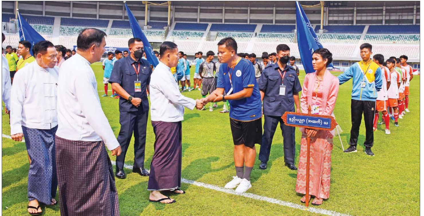
နိုင်ငံတော်စီမံအုပ်ချုပ်ရေးကောင်စီ ဒုတိယဥက္ကဋ္ဌ ဒုတိယဝန်ကြီးချုပ် ဒုတိယဗိုလ်ချုပ်မှူးကြီး စိုးဝင်း ပြိုင်ပွဲဝင်အသင်းများနှင့် အားကစားအဖွဲ့များအား ရင်းရင်းနှီးနှီး လိုက်လံနှုတ်ဆက်စဉ်။

နည်းပညာတက္ကသိုလ်များနှင့် ကွန်ပျူတာ တက္ကသိုလ်များ၏တက္ကသိုလ်ပေါင်းစုံ ဘောလုံးပြိုင်ပွဲ ကို အုပ်စု (၄) စုခွဲ၍ ယှဉ်ပြိုင်ကစားကြမည်ဖြစ်ရာ အုပ်စု(၁) ကွန်ပျူတာတက္ကသိုလ်(အထက်မြန်မာပြည်) အသင်း(က)တွင် မန္တလေးကွန်ပျူတာတက္ကသိုလ်၊ ကွန်ပျူတာတက္ကသိုလ်(ပင်လုံ၊ ဗန်းမော်)၊ အသင်း(ခ) တွင် ကွန်ပျူတာတက္ကသိုလ် (မန္တလေး၊ လားရှိုး၊ တောင်ကြီး)၊ အသင်း(ဂ) တွင် ကွန်ပျူတာတက္ကသိုလ် (မကွေး၊ မိတ္ထီလာ) တို့မှ အားကစားသမားများ