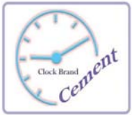
နာရီတံဆိပ် (၄/၃၅၅၅/၂၀၂၃)