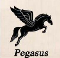
Pegasus (၄/၃၅၅၄/၂၀၂၃)

အထက်ပါကုန်အမှတ်တံဆိပ် "ကြယ်စိမ်း၊ Green Star ၊ နာရီတံဆိပ်၊ Clock Brand၊ မြင်းပျံ၊ Pegasus" အစရှိသော ကုန်အမှတ်တံဆိပ်အမည်များဖြင့် "ဘီလပ်မြေ ထုတ်လုပ်ခြင်း" NICE CLASSIFICATION Class(19)အုပ်စု အရ (Class 190004-Asbestos Cement, Class 190093-Cement for Blast Furnaces, Class 190092-Cement for Furnaces, Class 190058-Cement Posts, Class 190036-Cement, Class 190056-Fireproof Cement Coatings, Class 190070-magnesia cement)အား ထုတ်လုပ်ရောင်းချလျက်ရှိပါသည်။