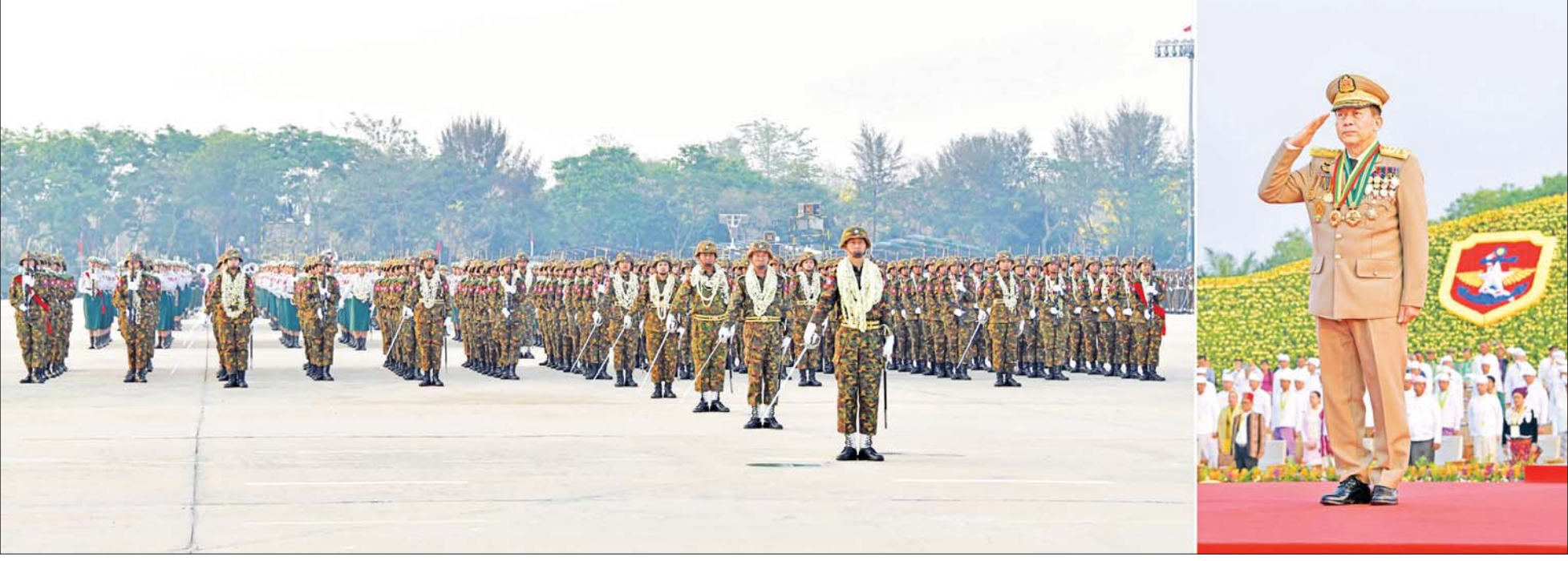
နိုင်ငံတော်စီမံအုပ်ချုပ်ရေးကောင်စီဥက္ကဋ္ဌ တပ်မတော်ကာကွယ်ရေးဦးစီးချုပ် ဗိုလ်ချုပ်မှူးကြီး သတိုးမဟာသရေစည်သူ သတိုးသိရိသုဓမ္မ မင်းအောင်လှိုင်အား စစ်ရေးပြစစ်ကြောင်းကြီးများမှ တပ်မတော်သားများက အလေးပြုကြစဉ်။

ရှေ့ဖိုးမှ ဦးစွာ စစ်ရေးပြအခမ်းအနားတွင် ပါဝင်ချိတက်ကြမည့် တပ်မတော် (ကြည်း၊ ရေ၊ လေ)မှ အရာရှိ၊ စစ်သည်များ၊ တပ်မတော် (ကြည်း) အမျိုးသမီး စစ်ရေးပြတပ်ခွဲ၊ မြန်မာနိုင်ငံ ရဲတပ်ဖွဲ့ဝင်များနှင့် မြန်မာနိုင်ငံရဲတပ်ဖွဲ့ အမျိုးသမီးစစ်ရေးပြတပ်ခွဲတို့သည် စစ်ရေးပြစစ်ကြောင်းကြီးများအလိုက် သစ်တပ် စစ်ရေးပြကွင်း၌ စတင်စုရုံးရောက်ရှိနေရာယူကြပြီး စစ်ရေးပြအစီအစဉ်အတိုင်း ဆောင်ရွက်ကြသည်။