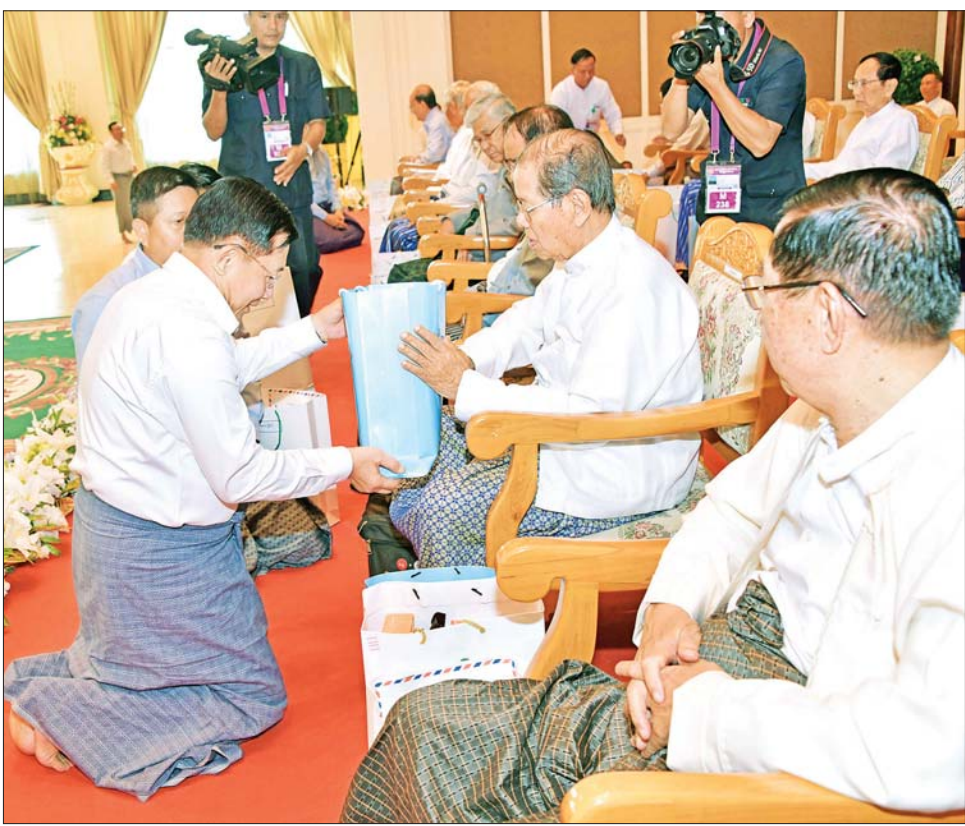
နိုင်ငံတော်စီမံအုပ်ချုပ်ရေးကောင်စီဥက္ကဋ္ဌ တပ်မတော်ကာကွယ်ရေးဦးစီးချုပ် ဗိုလ်ချုပ်မှူးကြီး မင်းအောင်လှိုင် အငြိမ်းစားတပ်မတော်အရာရှိကြီးများထံ ဂါရဝပြုလက်ဆောင်ပစ္စည်းများ ပေးအပ်စဉ်။

တပ်မတော်၏ အစဉ်အလာ ကောင်းတစ်ခုဖြစ် အခမ်းအနားတွင် နိုင်ငံတော် စီမံအုပ်ချုပ်ရေးကောင်စီ ဥက္ကဋ္ဌ တပ်မတော်ကာကွယ်ရေးဦးစီးချုပ် ဗိုလ်ချုပ်မှူးကြီး မင်းအောင်လှိုင် က ဂါရဝပြုစကား ပြောကြားရာ တွင် တပ်မတော်၏ အစဉ်အလာ