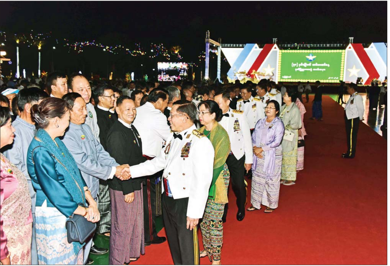
နိုင်ငံတော်စီမံအုပ်ချုပ်ရေးကောင်စီဥက္ကဋ္ဌ တပ်မတော်ကာကွယ်ရေးဦးစီးချုပ် ဗိုလ်ချုပ်မှူးကြီး မင်းအောင်လှိုင်နှင့် ဇနီး ဒေါ်ကြူကြူလှ အခမ်းအနားသို့ တက်ရောက်လာကြသူများအား ရင်းရင်းနှီးနှီးနှုတ်ဆက်စဉ်။

အဖွဲ့တို့မှ တာဝန်ရှိသူများ၊ တက္ကသိုလ်လေ့ကျင့်ရေးတပ်များမှ တပ်ဖွဲ့ဝင်များ၊ တိုင်းရင်းသားဖွံ့ဖြိုးရေးတက္ကသိုလ်မှ ဆရာဆရာမများနှင့် ကျောင်းသားကျောင်းသူများ၊ အထူးဖိတ်ကြားထားသည့် ဧည့်သည်တော်များ တက်ရောက်ကြသည်။ ရင်းရင်းနှီးနှီးနှုတ်ဆက် ဦးစွာ နိုင်ငံတော်စီမံအုပ်ချုပ်ရေးကောင်စီဥက္ကဋ္ဌ တပ်မတော်ကာကွယ်ရေးဦးစီးချုပ် ဗိုလ်ချုပ်မှူးကြီး မင်းအောင်လှိုင်နှင့် ဇနီး ဒေါ်ကြူကြူလှတို့သည် (၇၈) နှစ်မြောက် တပ်မတော်နေ့ အထိမ်းအမှတ် ဧည့်ခံပွဲနှင့် ဂုဏ်ပြုညစာစားပွဲသို့ တက်ရောက်လာကြသူများအား ရင်းရင်းနှီးနှီးနှုတ်ဆက်သည်။