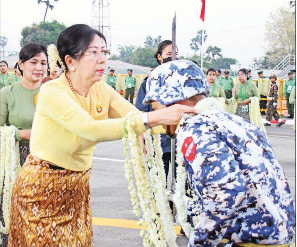
နိုင်ငံတော်စီမံအုပ်ချုပ်ရေးကောင်စီဥက္ကဋ္ဌ တပ်မတော်ကာကွယ်ရေးဦးစီးချုပ် ဗိုလ်ချုပ်မှူးကြီး သတိုးမဟာသရေစည်သူ သတိုးသီရိသုဓမ္မ မင်းအောင်လှိုင်၏ ဇနီး ဒေါ်ကြူကြူလှ ဂုဏ်ပြုပန်းကုံးစွပ်၍ ကြိုဆိုစဉ်။