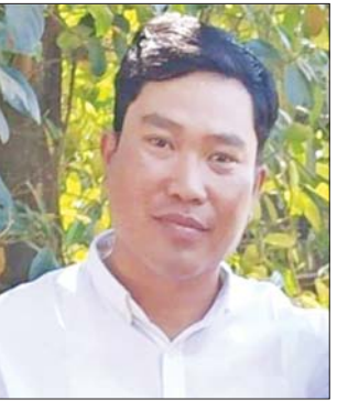
ဟန်ဇော်မင်း