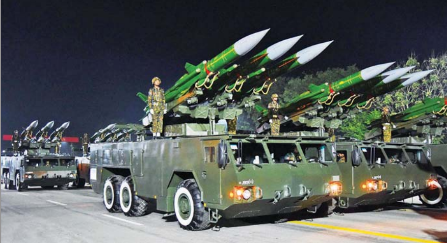
(၇၈) နှစ်မြောက် တပ်မတော်နေ့စစ်ရေးပြအခမ်းအနားတွင် ယန္တရားစစ်ကြောင်း ချီတက်စဉ်။