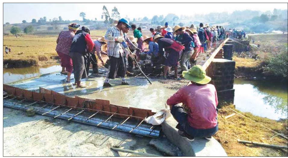
ကလေးမြို့နယ် သာမိုင်းခမ်းကျေးရွာ ကွန်ကရစ်တံတားဆောက်လုပ်မှုတွင် ပါဝင်လုပ်အားပေးနေသော ကျေးရွာနေပြည်သူများ။

ကမ္ဘာပေါ်ရှိ နိုင်ငံအများစုတွင် တူညီသော ရည်မှန်းချက်များ ရှိကြသည်။ ၎င်းမှာ ဖွံ့ဖြိုးတိုးတက်သောနိုင်ငံများနှင့် ဖွံ့ဖြိုးတိုးတက်ဆဲနိုင်ငံများသည် ဖွံ့ဖြိုးတိုးတက်သော နိုင်ငံအဆင့်သို့ ပြောင်းလဲခြင်းနှင့် စိုက်ပျိုးရေးအခြေခံစီးပွားရေးမှ စက်မှုအခြေခံစီးပွားရေး သို့မဟုတ် မြို့ပြစီးပွားရေးအဆင့်သို့ ပြောင်းလဲခြင်းပင်ဖြစ်သည်။ ထိုသို့ ဆောင်ရွက်ရာတွင် နိုင်ငံ၏ဖွံ့ဖြိုးတိုးတက်မှုကို နိုင်ငံသူနိုင်ငံသားများ ပူးပေါင်းဆောင်ရွက်ခြင်းဖြင့် အောင်မြင်ခဲ့သောနိုင်ငံမှာ တောင်ကိုရီးယားနိုင်ငံပင်ဖြစ်သည်။