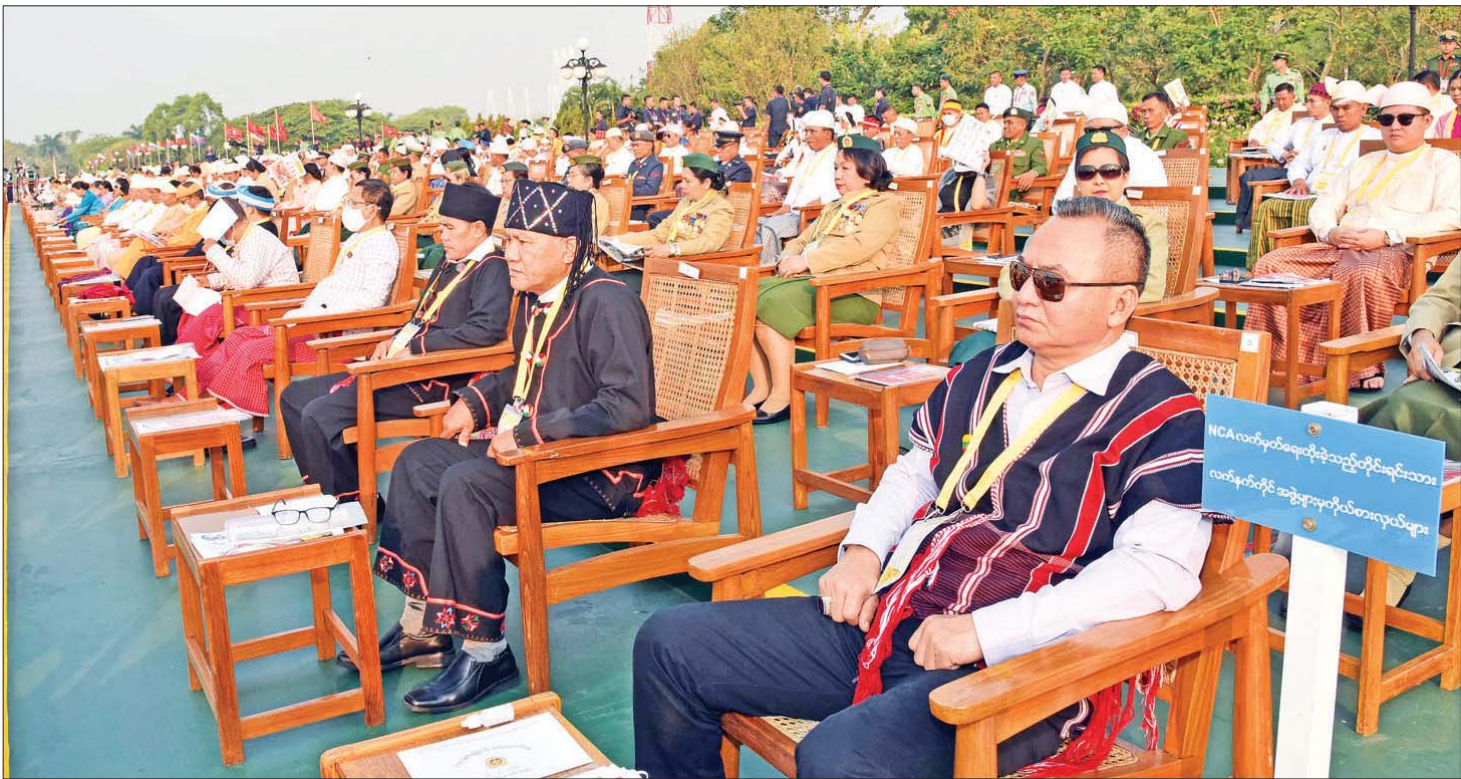
(၇၈)နှစ်မြောက် တပ်မတော်နေ့ စစ်ရေးပြအခမ်းအနားသို့ တက်ရောက်လာကြသူများအား တွေ့ရစဉ်။

စစ်ကြောင်းမှူး ဗိုလ်မှူးချုပ် ဇော်မြင့်ဦး ဦးဆောင် သည့် ဂုဏ်ပြုတပ်ခွဲ၊ ကာကွယ်ရေးဦးစီးချုပ်ရုံး (ကြည်း)ကိုယ်စားပြု (အမျိုးသမီး) စစ်ရေးပြတပ်ခွဲ၊ ကာကွယ်ရေးဦးစီးချုပ်ရုံး (ကြည်း) ကိုယ်စားပြု စာမျက်နှာ ၇ သို့