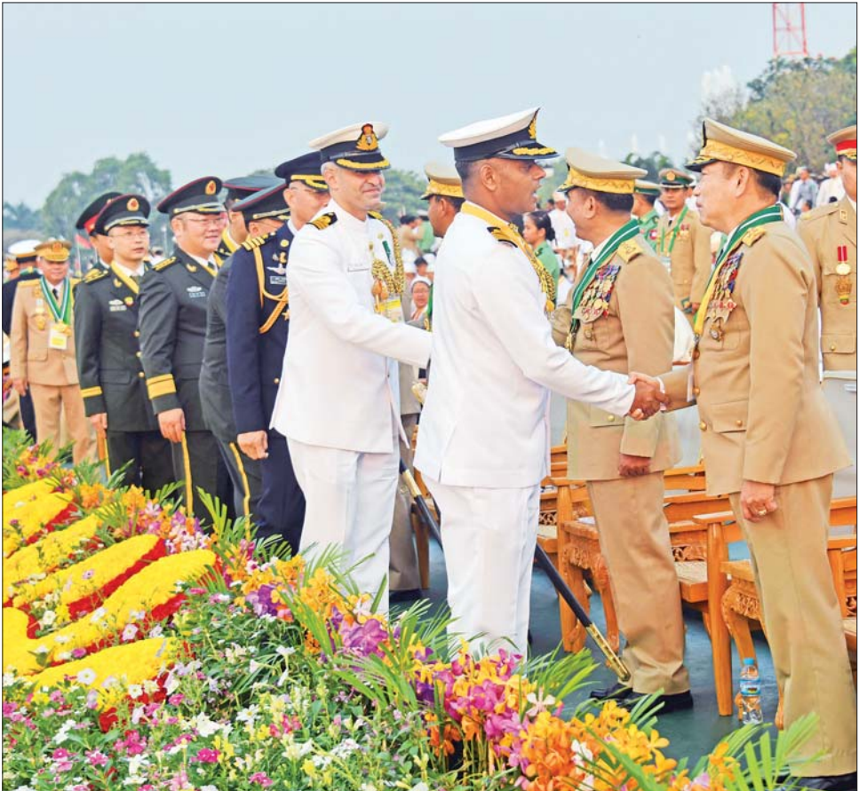
(၇၈)နှစ်မြောက် တပ်မတော်နေ့ စစ်ရေးပြအခမ်းအနားသို့ တက်ရောက်လာကြသည့် နိုင်ငံခြားစစ်သံရုံးများ မှ စစ်သံမှူးများအား ရင်းရင်းနှီးနှီးနှုတ်ဆက်စဉ်။

စစ်ကြောင်းမှူး ဗိုလ်မှူးချုပ် တင်အောင်ဆွေ ဦးဆောင်သည့် ဂုဏ်ပြုတပ်ခွဲ၊ ဆက်သွယ်ရေး ညွှန်ကြားရေးမှူးရုံးကိုယ်စားပြု စစ်ရေးပြတပ်ခွဲ၊ ကာကွယ်ရေးပစ္စည်း ထုတ်လုပ်ရေးအရာရှိချုပ်ရုံး ကိုယ်စားပြုစစ်ရေးပြတပ်ခွဲ၊ ဆေးဝန်ထမ်းညွှန်ကြား ရေးမှူးရုံးကိုယ်စားပြု စစ်ရေးပြတပ်ခွဲ၊ လျှပ်စစ်နှင့်