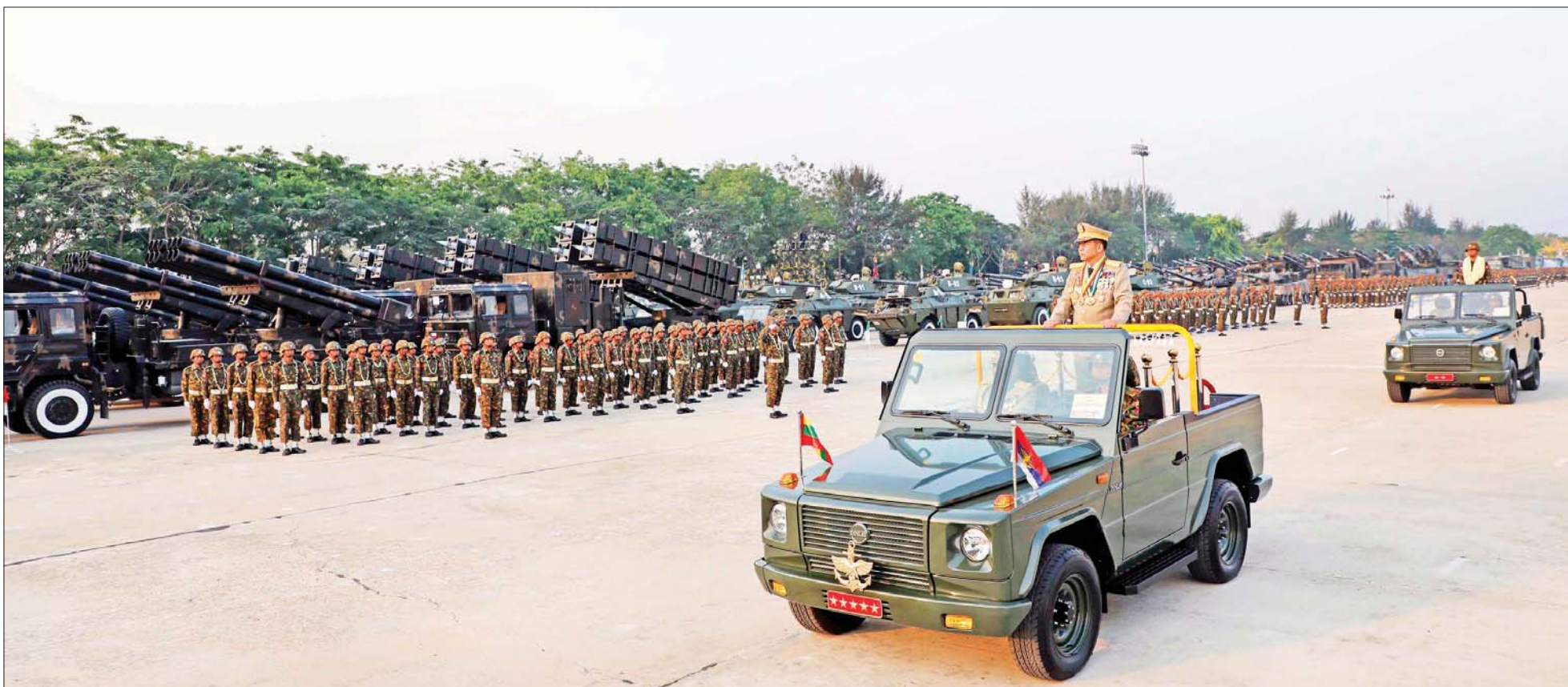
နိုင်ငံတော်စီမံအုပ်ချုပ်ရေးကောင်စီဥက္ကဋ္ဌ တပ်မတော်ကာကွယ်ရေးဦးစီးချုပ် ဗိုလ်ချုပ်မှူးကြီး သတိုးမဟာသရေစည်သူ သတိုးသီရိသုဓမ္မ မင်းအောင်လှိုင် စစ်ရေးပြစစ်ကြောင်းကြီးများအား လိုက်လံစစ်ဆေးစဉ်။