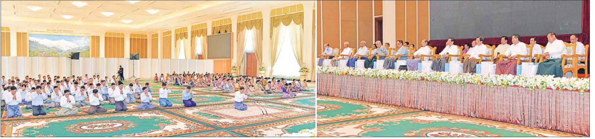
နိုင်ငံတော်စီမံအုပ်ချုပ်ရေးကောင်စီဥက္ကဋ္ဌ တပ်မတော်ကာကွယ်ရေးဦးစီးချုပ် ဗိုလ်ချုပ်မှူးကြီး မင်းအောင်လှိုင်နှင့် ဇနီး ဒေါ်ကြူကြူလှ၊ တပ်မတော် (ကြည်း၊ ရေ၊ လေ) မိသားစုများက (၇၈) နှစ်မြောက် တပ်မတော်နေ့စစ်ရေးပြအခမ်းအနားသို့တက်ရောက်ကြသည့် တပ်မတော်တွင်တာဝန်ထမ်းဆောင်ခဲ့သည့် အငြိမ်းစားတပ်မတော်အရာရှိကြီးများအား ဂါရဝပြုကန်တော့စဉ်။