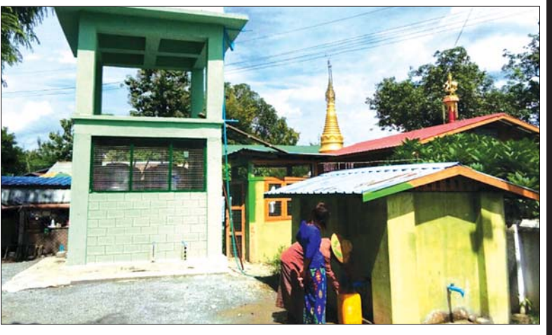
ပုသိမ်ကြီးမြို့နယ် လက်သစ်ကျေးရွာ၌ ကျေးရွာလူထုပူးပေါင်းပါဝင်၍ ရေစင်ဆောက်လုပ်နေပုံနှင့် ဆောက်လုပ်ပြီးစီးသောပုံ။

လုပ်ငန်းတွင် ကျေးရွာအစည်းအဝေးများ၊ သင်တန်းများ၊ လေ့လာရေးခရီးစဉ်များ၊ သတင်းထုတ်ပြန်ခြင်းများကို ဆောင်ရွက်ကြပြီး ဝင်ငွေတိုးပွားရေးလုပ်ငန်းများအနေဖြင့် စိုက်ပျိုးရေးလုပ်ငန်းများ၊ မွေးမြူရေး