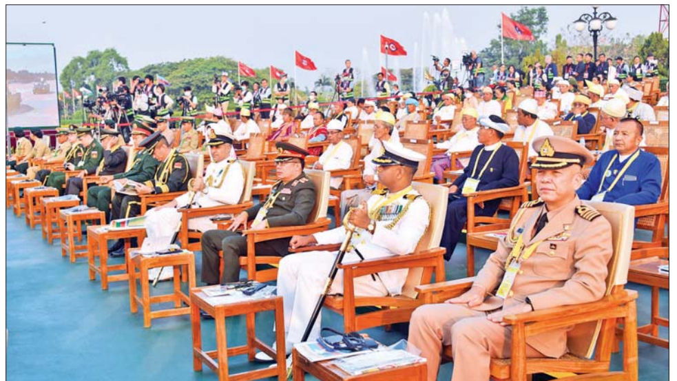
(၇၈) နှစ်မြောက် တပ်မတော်နေ့ စစ်ရေးပြအခမ်းအနားသို့ တက်ရောက်သည့် နိုင်ငံခြားစစ်သံရုံးများမှ စစ်သံမှူးများ။