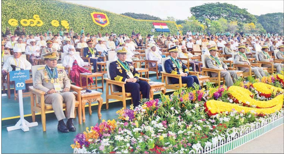
(၇၈) နှစ်မြောက် တပ်မတော်နေ့စစ်ရေးပြအခမ်းအနားသို့ တက်ရောက်ကြသူများအား တွေ့ရစဉ်။