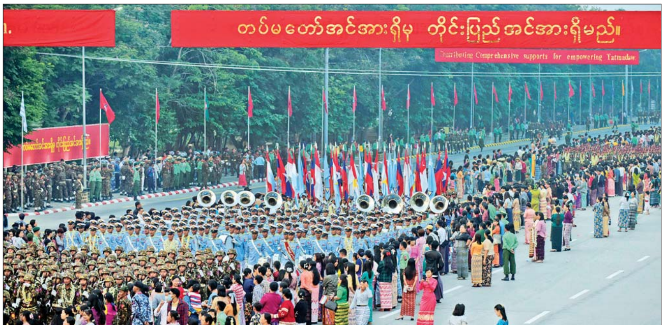
စစ်ကြောင်းများချီတက်ကြစဉ်။