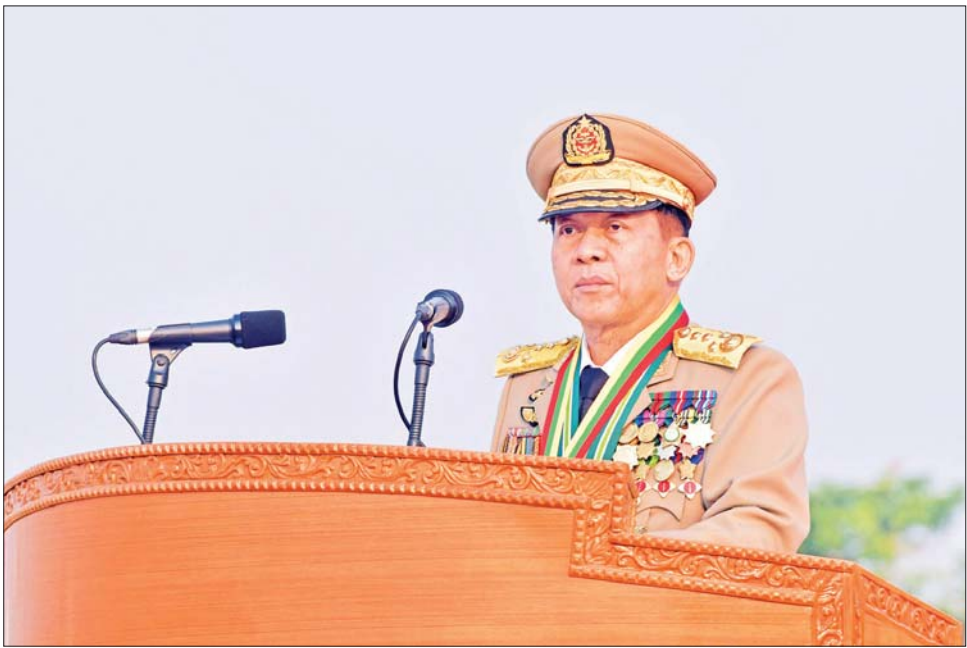
နိုင်ငံတော်စီမံအုပ်ချုပ်ရေး ကောင်စီဥက္ကဋ္ဌ တပ်မတော် ကာကွယ်ရေးဦးစီးချုပ် ဗိုလ်ချုပ်မှူးကြီး သတိုးမဟာသရေစည်သူ သတိုးသီရိသုဓမ္မ မင်းအောင်လှိုင် (၇၈)နှစ်မြောက် တပ်မတော်နေ့ စစ်ရေးပြအခမ်းအနား၌ မိန့်ခွန်းပြောကြားစဉ်။

※ စည်းလုံးညီညွတ်ခြင်းဟာ အင်အားကို ဖြစ်စေတယ်။ ဒါ့ကြောင့် တပ်မတော်အင်အား တောင့်တင်းခိုင်မာမှုရှိရေးအတွက် တပ်တွင်းစည်းလုံးညီညွတ်မှုဖြစ်သလို နိုင်ငံအင်အား တောင့်တင်း ခိုင်မာမှုရှိရေးအတွက် တပ်မတော်နဲ့ပြည်သူ စည်းလုံးညီညွတ်နေဖို့ တိုင်းရင်းသားပြည်သူများရဲ့ သားသမီးများဖြစ်တဲ့ ရဲဘော်တို့ဟာ တပ်ပြင်စည်းရုံးရေးကို လည်း အလေးထားလုပ်ဆောင်ကြရမယ်