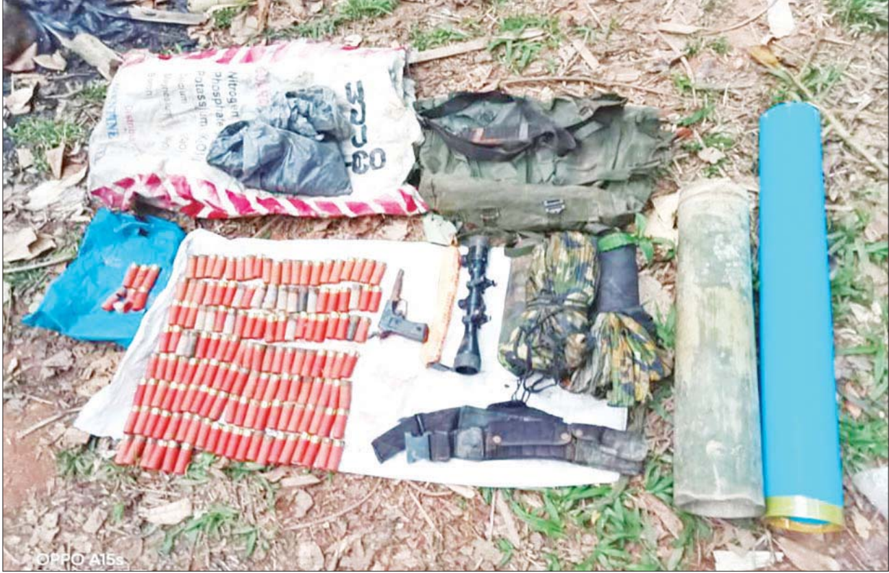
၂၀၂၃ ခုနှစ် မတ် ၂၅ ရက်က ပျဉ်းမနားမြို့နယ် မရမ်းတောင် (အထက်) ကျေးရွာအနီး၌ သိမ်းဆည်းရမိခဲ့သည့် ခဲယမ်းနှင့် ဖောက်ခွဲရေး ဆက်စပ်ပစ္စည်းများ မှတ်တမ်းဓာတ်ပုံ။

ဖမ်းဆီးရမိတရားခံများ၏ ထွက်ဆိုချက်အရ နေပြည်တော် PDF အမည်ခံ အကြမ်းဖက်အဖွဲ့ခေါင်းဆောင် ဖမ်းဆီးရန်ကျန်တရားခံ ဗိုလ်တေ(ခ)ဟန်မင်းထွန်း၏ စေခိုင်းမှုဖြင့် သိမ်းဆည်းရမိ ၁၀၇ မမ ရှော့တိုက်ခွဲများနှင့် ဖောက်ခွဲရေးပစ္စည်းများ အသုံးပြုကာ ရက်စက် ယုတ်မာသော အကြံဖြင့် အပြစ်မဲ့ပြည်သူများ ထိခိုက်သေကျေပျက်စီး စေရန် ရည်ရွယ်၍ (၇၈)နှစ်မြောက် တပ်မတော်နေ့တွင် နေပြည်တော် ကောင်စီနယ်မြေအတွင်း အပြစ်မဲ့ပြည်သူများစုဝေး၍ ပျော်ပွဲရွှင်ပွဲများ ပြုလုပ်နေသည့်နေရာများ၊ ခမ်းနားထည်ဝါစွာ စစ်ရေးပြအခမ်းအနား ကျင်းပပြုလုပ်နေသည့် စစ်ရေးပြကွင်း(ရှမ်းစု) နေရာတို့ကို အချိန်ကိုက် ပစ်ခတ်ဖောက်ခွဲခြင်းများ လုပ်ဆောင်ရန် စီစဉ်ထားသော်လည်း လုံခြုံ ရေး တပ်ဖွဲ့ဝင်များက ကြိုတင်သတင်းလက်ဦးမှုရယူကာ ဖော်ထုတ် ဖမ်းဆီးနိုင်ခဲ့ခြင်းကြောင့် အချိန်မီ တားဆီးကာကွယ်နိုင်ခဲ့ခြင်းဖြစ် ကြောင်း ဖော်ထုတ်သိရှိရပြီး ၎င်းတို့နှင့် သက်ဆိုင်သည့် ဆက်စပ်တရားခံ များကိုလည်း ဆက်လက်ဖော်ထုတ်ဖမ်းဆီးနိုင်ရေး ဆောင်ရွက်သွား မည်ဖြစ်သည်။