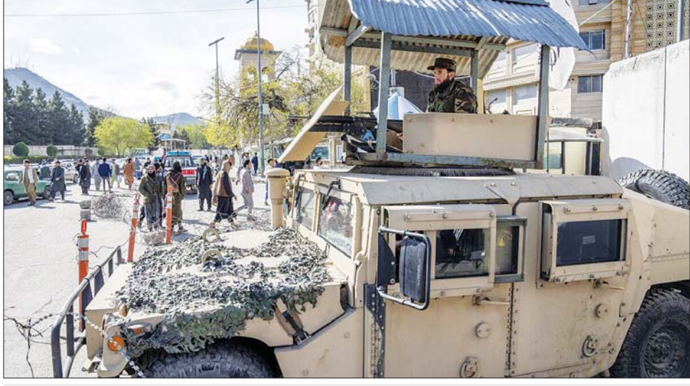
အာဖဂန်နိုင်ငံ ကဘူးလ်မြို့၌ နိုင်ငံခြားရေးဝန်ကြီးဌာနအနီး ပေါက်ကွဲမှုဖြစ်ပွားသည့်နေရာတွင် လုံခြုံရေး တပ်ဖွဲ့များ စောင့်ကြပ်မှုကို တွေ့ရစဉ်။

အာဖဂန်နစ္စတန် နိုင်ငံခြားရေး ဝန်ကြီးဌာနအနီး၌ မတ် ၂၇ ရက် က အသေခံပုံးခွဲတိုက်ခိုက်မှုကြောင့် အရပ်သားခြောက်ဦး သေဆုံးပြီး အများအပြား ဒဏ်ရာ ရရှိခဲ့ကြောင်း ပြည်ထဲရေးဝန်ကြီးဌာနက ပြောကြားသည်။ ၂၀၂၁ ခုနှစ် ဩဂုတ်လတွင် တာလီဘန်တို့က အမေရိကန် ကျောထောက်နောက်ခံပြု အစိုးရကို ဖြုတ်ချကာ အာဏာပြန်လည် ရယူခဲ့ပြီးနောက် လုံခြုံရေး သိသိသာသာတိုးတက်လာခဲ့သော်လည်း အိုင်အက်စ်အဖွဲ့၏ ခြိမ်းခြောက်မှုမှာလည်း ပိုမိုတိုးလာခဲ့သည်။ နိုင်ငံခြားရေးဝန်ကြီးဌာနသို့ ဦးတည်သည့်လမ်း၌ မာလစ်ခံ အက်ဂါဒေသရှိ စစ်ဆေးရေးဂိတ် တစ်ခုသို့ ချဉ်းကပ်လာသော အသေခံပုံးခွဲသမားကို လုံခြုံရေး