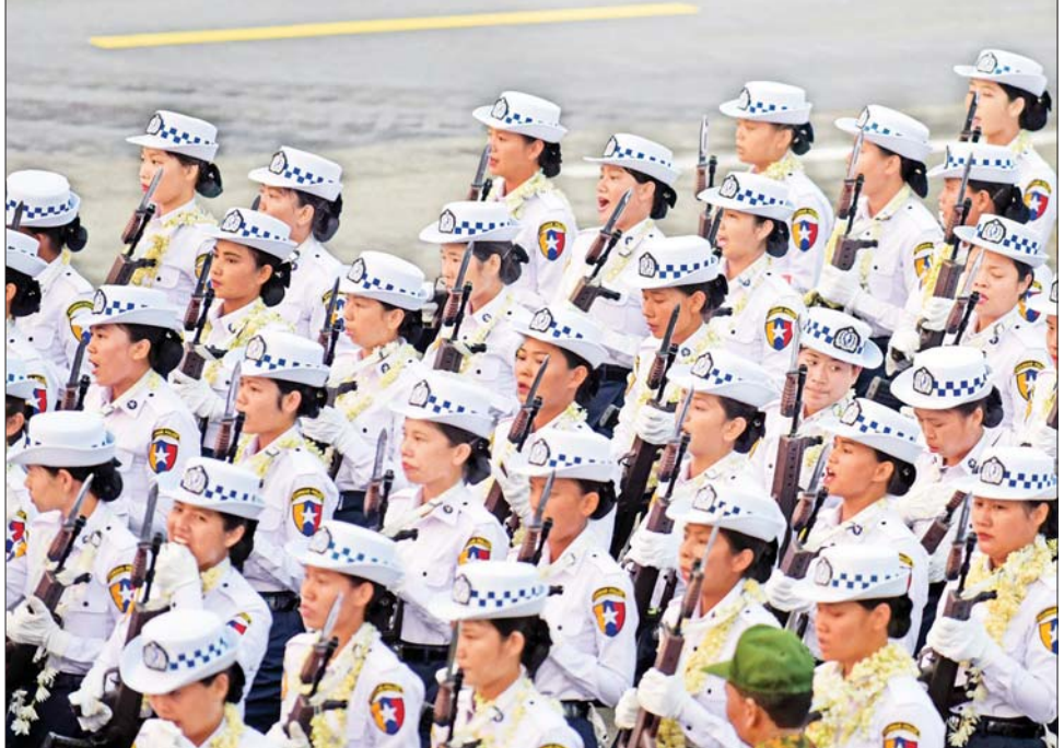
စစ်ရေးပြစစ်ကြောင်းကြီးများမှ အမျိုးသမီး စစ်ရေးပြတပ်ခွဲများက ချီတက်အလေးပြုကြစဉ်။