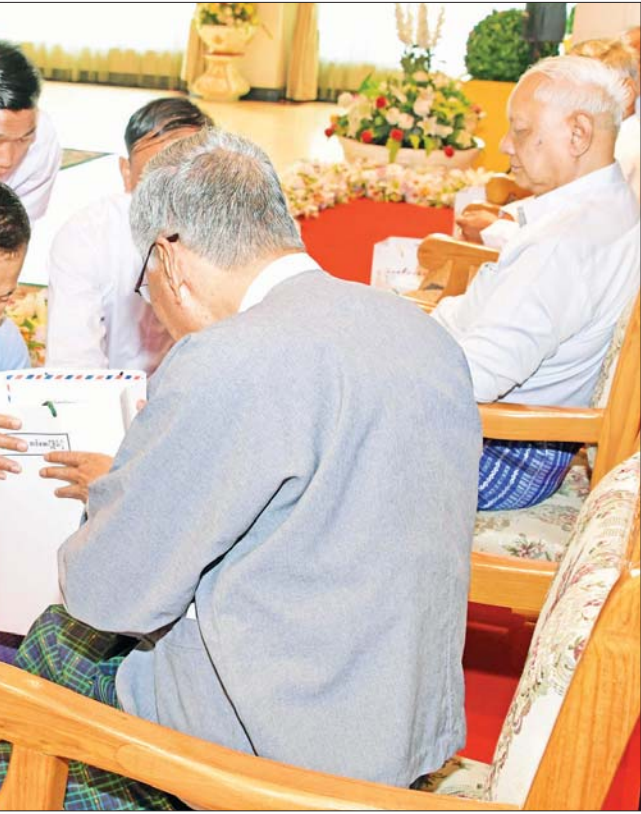
နိုင်ငံတော်စီမံအုပ်ချုပ်ရေးကောင်စီ ဒုတိယဥက္ကဋ္ဌ ဒုတိယတပ်မတော်ကာကွယ်ရေးဦးစီးချုပ် ကာကွယ်ရေးဦးစီးချုပ် (ကြည်း) ဒုတိယဗိုလ်ချုပ်မှူးကြီး စိုးဝင်း အငြိမ်းစားတပ်မတော်အရာရှိကြီးများထံ ဂါရဝပြုလက်ဆောင်ပစ္စည်းများ ပေးအပ်စဉ်။

ရင်းရင်းနှီးနှီး နှုတ်ဆက် ယင်းနောက် နိုင်ငံတော်စီမံ အုပ်ချုပ်ရေးကောင်စီ ဥက္ကဋ္ဌ တပ်မတော်ကာကွယ်ရေးဦးစီးချုပ် နှင့် ဇနီးတို့သည် အခမ်းအနား တက်ရောက်လာကြသည့် အငြိမ်း စား တပ်မတော်အရာရှိကြီးများ နှင့် ဇနီးများအား ရင်းရင်းနှီးနှီး နှုတ်ဆက်ခဲ့ကြောင်း သတင်း ရရှိသည်။