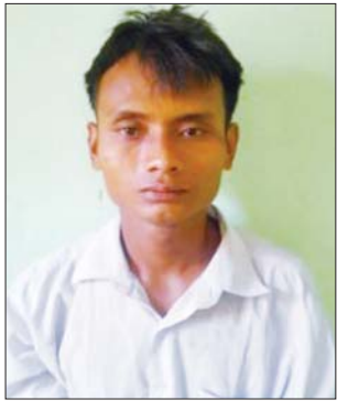
ဝင်းမျိုးထက်(ခ)ဝင်းနိုး(ခ) ဘီလား