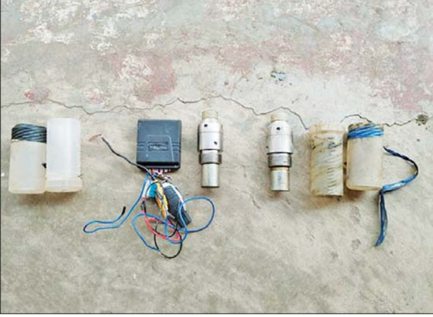
၂၀၂၃ ခုနှစ် မတ် ၂၄ ရက်တွင် ပျဉ်းမနားမြို့နယ် ဇီးဖြူပင်ကျေးရွာ အဝေးရာဆည်အနီး ချုံပုတ်အတွင်းမှ သိမ်းဆည်းရမိခဲ့သည့် ဖောက်ခွဲ ရေးပစ္စည်းများ၏ မှတ်တမ်းဓာတ်ပုံ။