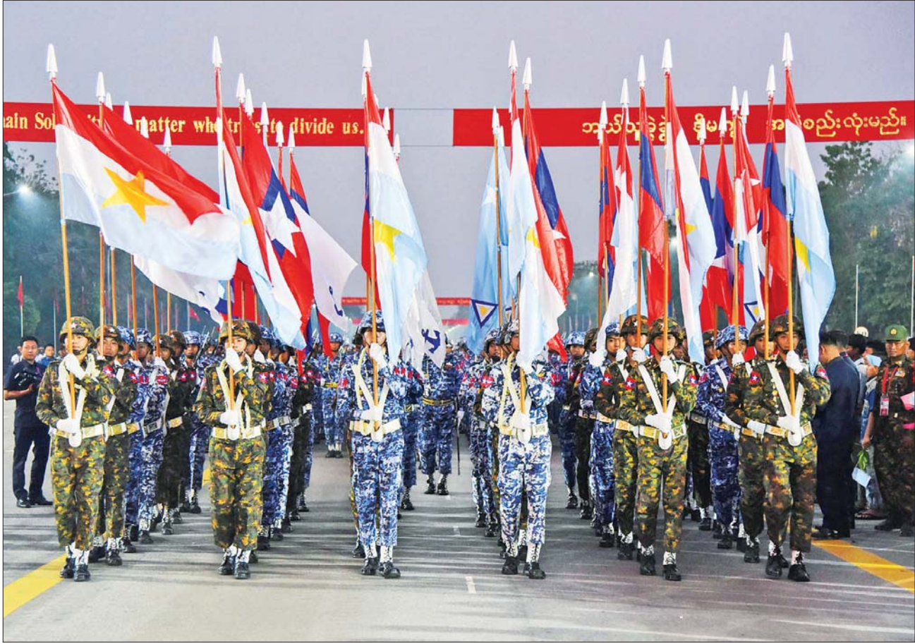
(၇၈) နှစ်မြောက် တပ်မတော်နေ့စစ်ရေးပြအခမ်းအနားတွင် စစ်ကြောင်းကြီးများ ချီတက်ကြစဉ်။