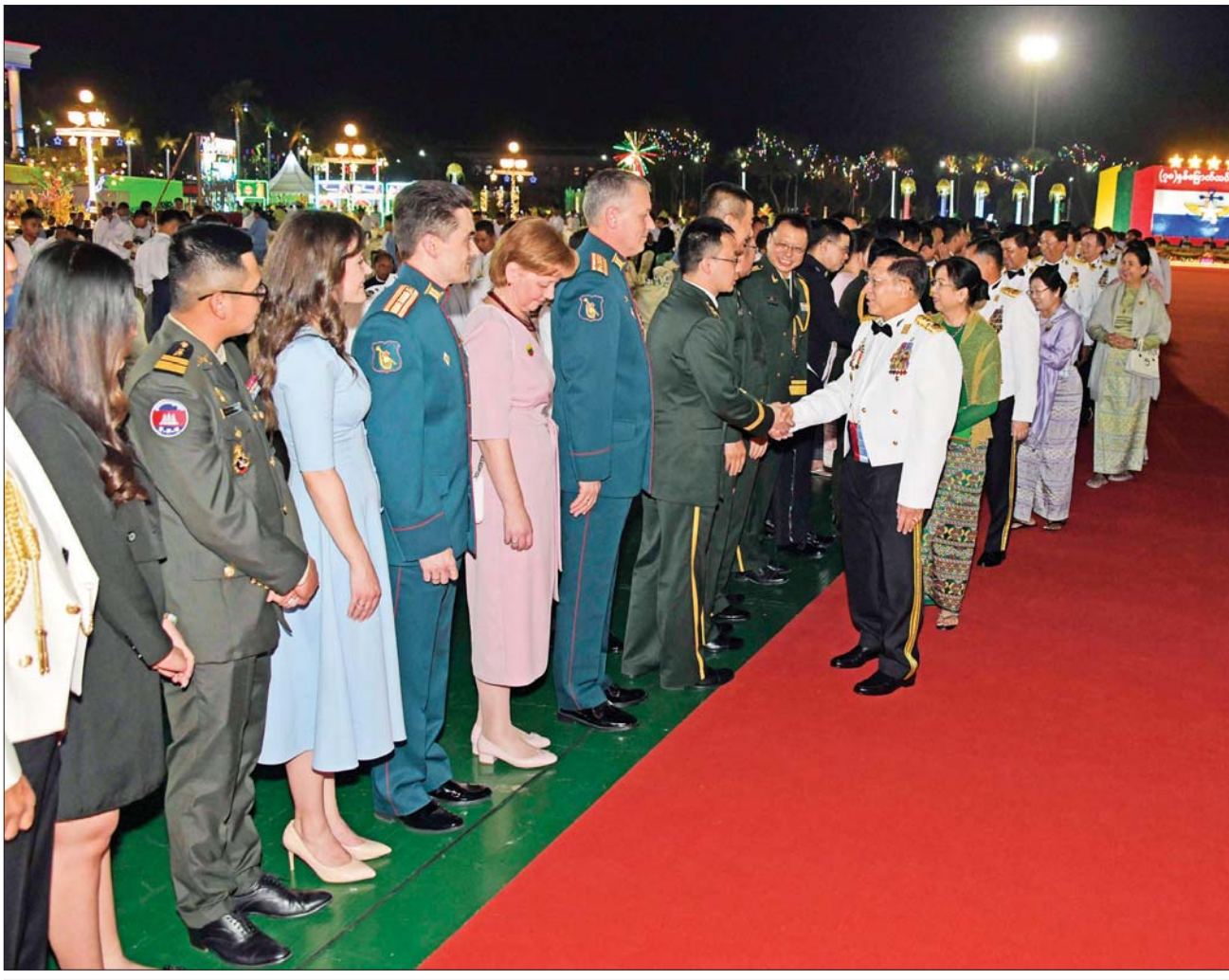
နိုင်ငံတော်စီမံအုပ်ချုပ်ရေးကောင်စီဥက္ကဋ္ဌ တပ်မတော်ကာကွယ်ရေးဦးစီးချုပ် ဗိုလ်ချုပ်မှူးကြီး မင်းအောင်လှိုင်နှင့် ဇနီး ဒေါ်ကြူကြူလှ အခမ်းအနားသို့ တက်ရောက်လာကြသည့် နိုင်ငံခြားစစ်သံရုံးများမှ စစ်သံမှူးများနှင့် တာဝန်ရှိသူများအား ရင်းရင်းနှီးနှီးနှုတ်ဆက်စဉ်။

တပ်မတော်ကာကွယ်ရေးဦးစီးချုပ်များ၏ မိသားစုဝင်များ၊ အငြိမ်းစားတပ်မတော် (ကြည်း၊ ရေ၊ လေ) အရာရှိကြီးများ၊ လွတ်လပ်ရေးမော်ကွန်းဝင် ပထမအဆင့်၊ ဒုတိယအဆင့်နှင့် တတိယအဆင့်မော်ကွန်းဝင်ပုဂ္ဂိုလ်များ၊ အကြံပေး ပုဂ္ဂိုလ်များ၊ ဒုတိယဝန်ကြီးများ၊ တပ်မတော်သား အငြိမ်းစားသံအမတ်ကြီးများ၊ နေပြည်တော်ကောင်စီဝင်များ၊ နိုင်ငံခြားစစ်သံရုံးများမှ စစ်သံမှူးများနှင့် တာဝန်ရှိသူများ၊ တစ်နိုင်လုံးပစ်ခတ် တိုက်ခိုက်မှုရပ်စဲရေးသဘောတူစာချုပ် (NCA) လက်မှတ် ရေးထိုးထားသည့် တိုင်းရင်းသား လက်နက်ကိုင်အဖွဲ့များမှ ကိုယ်စားလှယ်များ၊ နိုင်ငံရေး ပါတီများမှ ဥက္ကဋ္ဌများနှင့် တာဝန်ရှိသူများ၊ အောင်ဆန်းသူရိယာတွဲရရှိခဲ့သူများ၏ မိသားစုဝင်များနှင့် ဆွေမျိုးများ၊ သီဟသူရဘွဲ့၊ သူရဘွဲ့နှင့် တပ်မတော်စွမ်းရည်သတ္တိဆိုင်ရာ ဂုဏ်ထူးဆောင်ဘွဲ့၊ သူရဲကောင်းမှတ်တမ်းဝင် တံဆိပ်ရရှိခဲ့ကြသည့် အရာရှိ၊ စစ်သည်များနှင့် မိသားစုဝင်များ၊ ဆွေမျိုးများ၊ မြန်မာနိုင်ငံ စစ်မှုထမ်းပေးကင်းအဖွဲ့ဝင်များ၊ အသွင်ပြောင်းပြည်သူ့စစ်၊ မူလပြည်သူ့စစ်နှင့် နယ်ခြားစောင့်ဗဟိုအကြံပေးကွပ်ကဲရေး အဖွဲ့များ၊