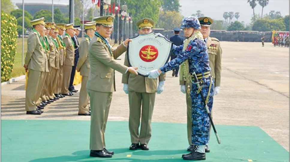
တပ်မတော်နေ့ကျင်းပရေးဦးစီးကော်မတီဥက္ကဋ္ဌ ညှိနှိုင်းကွပ်ကဲရေးမှူး(ကြည်း၊ ရေ၊ လေ) ဗိုလ်ချုပ်ကြီး မောင်မောင်အေး စံပြတပ်ခွဲပထမဆုရရှိသည့် ကာကွယ်ရေးဦးစီးချုပ်ရုံး(ရေ)ကိုယ်စားပြု စစ်ရေးပြဂုဏ်ပြုတပ်ခွဲကို ဒိုင်းဆုချီးမြှင့်စဉ်။

အကောင်းဆုံးဆုရရှိသည့် ဘုရင့်နောင်စစ်ကြောင်း အလံတော်အဖွဲ့တို့ကို စစ်ထောက်ချုပ် ဒုတိယဗိုလ်ချုပ်ကြီး ကျော်စွာလင်း က ဂုဏ်ပြုဒိုင်းဆုများနှင့် ဂုဏ်ပြုဆုငွေများ ပေးအပ်ချီးမြှင့်သည်။ ဆက်လက်၍ တပ်မတော်(ကြည်း၊ ရေ၊ လေ) (အမျိုးသမီး) တပ်ခွဲစစ်ရေးပြ တတိယဆုရရှိသည့် ကာကွယ်ရေးဦးစီးချုပ်ရုံး(ကြည်း) (အမျိုးသမီး) စစ်ရေးပြတပ်ခွဲ(၁)၊ အကောင်းဆုံးစခန်း တတိယဆုရရှိသည့် ကမ်းရိုးတန်းဒေသ တိုင်းစစ်ဌာချုပ် ကိုယ်စားပြု စစ်ရေးပြတပ်ခွဲ၊ စစ်ချီသီချင်း အကောင်းဆုံး တတိယဆုရရှိသည့် ဆေးဝန်ထမ်းညွှန်ကြားရေးမှူးရုံး ကိုယ်စားပြု စစ်ရေးပြတပ်ခွဲ၊ စစ်စည်းကမ်း အကောင်းဆုံးတတိယဆုရရှိသည့် ကာကွယ်ရေးပစ္စည်းထုတ်လုပ်ရေး အရာရှိချုပ်ရုံး ကိုယ်စားပြု စစ်ရေးပြတပ်ခွဲ၊ စစ်ရေးပြအကောင်းဆုံး တတိယဆုရရှိသည့် ကာကွယ်ရေးဦးစီးချုပ်ရုံး(လေ)ကိုယ်စားပြု စစ်ရေးပြတပ်ခွဲ(၂)၊ မြန်မာနိုင်ငံရဲတပ်ဖွဲ့ (အမျိုးသမီး) စစ်ရေးပြ ဒုတိယဆုရရှိသည့် မြန်မာနိုင်ငံရဲတပ်ဖွဲ့