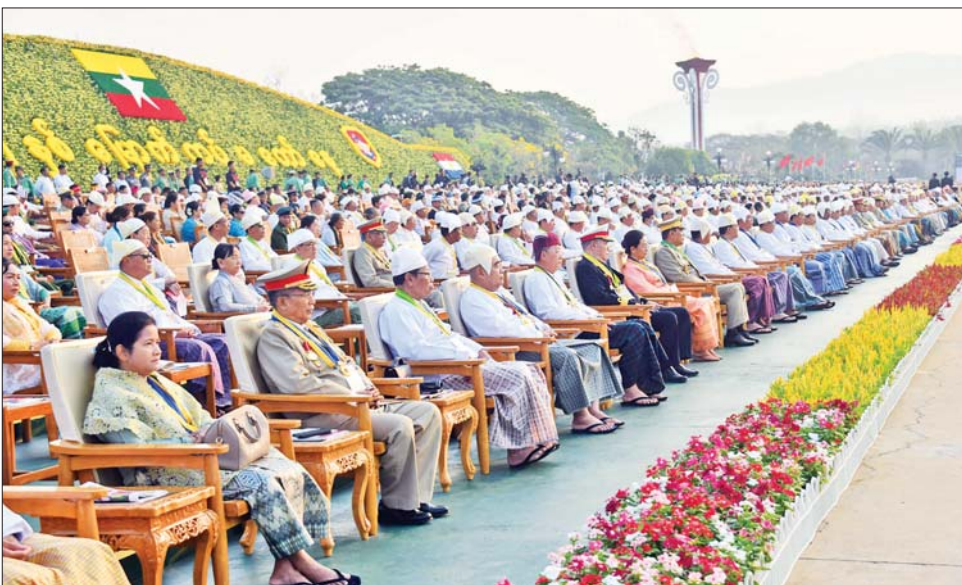
(၇၈) နှစ်မြောက် တပ်မတော်နေ့ စစ်ရေးပြအခမ်းအနားသို့ တက်ရောက်ကြသူများအား တွေ့ရစဉ်။