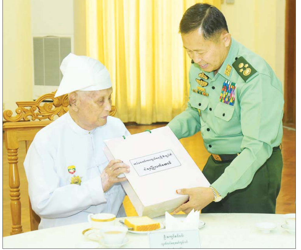
နိုင်ငံတော်စီမံအုပ်ချုပ်ရေးကောင်စီ ဒုတိယဥက္ကဋ္ဌ ဒုတိယတပ်မတော်ကာကွယ်ရေးဦးစီးချုပ် ကာကွယ်ရေးဦးစီးချုပ်(ကြည်း) ဒုတိယဗိုလ်ချုပ်မှူးကြီး စိုးဝင်း လွတ်လပ်ရေးမော်ကွန်းဝင်ပုဂ္ဂိုလ်များအား ဂါရဝပြုလက်ဆောင်ပေးအပ်စဉ်။

❖ ကျောဖုံးမှ အားပေးစကားပြောကြား ထိုသို့တွေ့ဆုံစဉ် နိုင်ငံတော်စီမံအုပ်ချုပ်ရေးကောင်စီ ဒုတိယဥက္ကဋ္ဌ ဒုတိယတပ်မတော်ကာကွယ်ရေးဦးစီးချုပ် ကာကွယ်ရေးဦးစီးချုပ်(ကြည်း)နှင့်