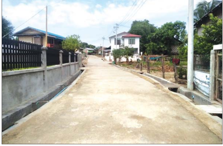
နေပြည်တော် ဒဂုံဇာသိရိမြို့နယ် ရွာကျေးရွာလမ်းကို စီမံကိန်း မဆောင်ရွက်မီနှင့် စီမံကိန်း ဆောင်ရွက်အပြီးပုံ။

သာ ကွာဝေးသော ကိုရီးယားနိုင်ငံတောင်ပိုင်း ချောင်ဆန်နမ်ပြည်နယ် ချောင်းဒိုဒေသ ရှင်းဒိုကျေးရွာသို့ ရောက်ရှိခဲ့သည်။ ရေလွှမ်းမိုးမှုကြောင့် ထိခိုက်ပျက်စီးနေသော လမ်းများကို ပြင်ဆင်ခြင်း၊ ရေကာတာများ ဆောက်လုပ်ခြင်း၊ အိမ်အမိုးများ အားကို အသစ်လဲလှယ်ခြင်းတို့ကို အစိုးရမှ အမိန့်ညွှန်ကြားချက်ဖြင့် စေခိုင်းခြင်းမပြုဘဲ ကျေးရွာသူကျေးရွာသားများကိုယ်တိုင် တက်ညီလက်ညီဖြင့် ဆောင်ရွက်နေသည်ကို မြင်တွေ့ခဲ့ရသည်။