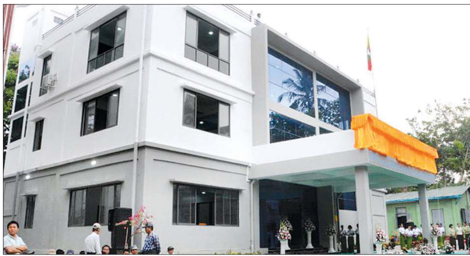
သန့်လျှင်

ထို့နောက် ရုံးသစ်အဆောက်အအုံကို တိုင်းဒေသကြီး အစိုးရအဖွဲ့ဝန်ကြီးချုပ် ဦးစိုးသိန်းနှင့် ရန်ကုန်တိုင်းစစ်ဌာနချုပ်တိုင်းမှူး ဗိုလ်ချုပ်ညွန့်ဝင်းဆွေတို့က ဖွင့်လှစ်ပေးသည်။ ဆက်လက်၍ တိုင်းဒေသကြီး ဝန်ကြီးချုပ်နှင့် အဖွဲ့ဝင်များသည် ရုံးသစ်အဆောက်အအုံကို လှည့်လည်ကြည့်ရှုစစ်ဆေးကြသည်။ အဆိုပါ သုံးထပ်ရုံးသစ် အဆောက်အအုံကို ရန်ကုန်တိုင်းဒေသကြီးအစိုးရအဖွဲ့ ခွင့်ပြုရန်ပုံငွေဖြင့် တည်ဆောက်ခဲ့ခြင်းဖြစ်ကြောင်း သိရသည်။