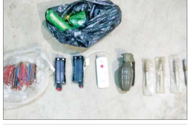
၂၀၂၃ ခုနှစ် မတ် ၂၄ ရက်တွင် တရားခံပြေး သန်းထွန်း(ခ)ချင်းတွင်း ပိုင်ဆိုင်သည့် ပျဉ်းမနားမြို့နယ် ဇီးဖြူပင်ကျေးရွာရှိ နေအိမ်အတွင်းမှ သိမ်းဆည်းရမိခဲ့သည့် ဖောက်ခွဲရေးဆက်စပ်ပစ္စည်းများ၏ မှတ်တမ်း ဓာတ်ပုံ။