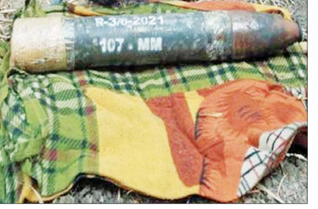
၂၀၂၃ ခုနှစ် မတ် ၂၄ ရက်တွင် ပျဉ်းမနားမြို့နယ် ဇီးဖြူပင်ကျေးရွာရှိ NLD ပါတီဝင် တရားခံပြေး ဟန်ဇော်မင်း၏ နေအိမ်ခြံဝင်းအတွင်းမှ သိမ်းဆည်းရမိခဲ့သည့် ၁၀၇ မမ ရှော့တိုက်ခွဲ တစ်လုံး၏ မှတ်တမ်းဓာတ်ပုံ။