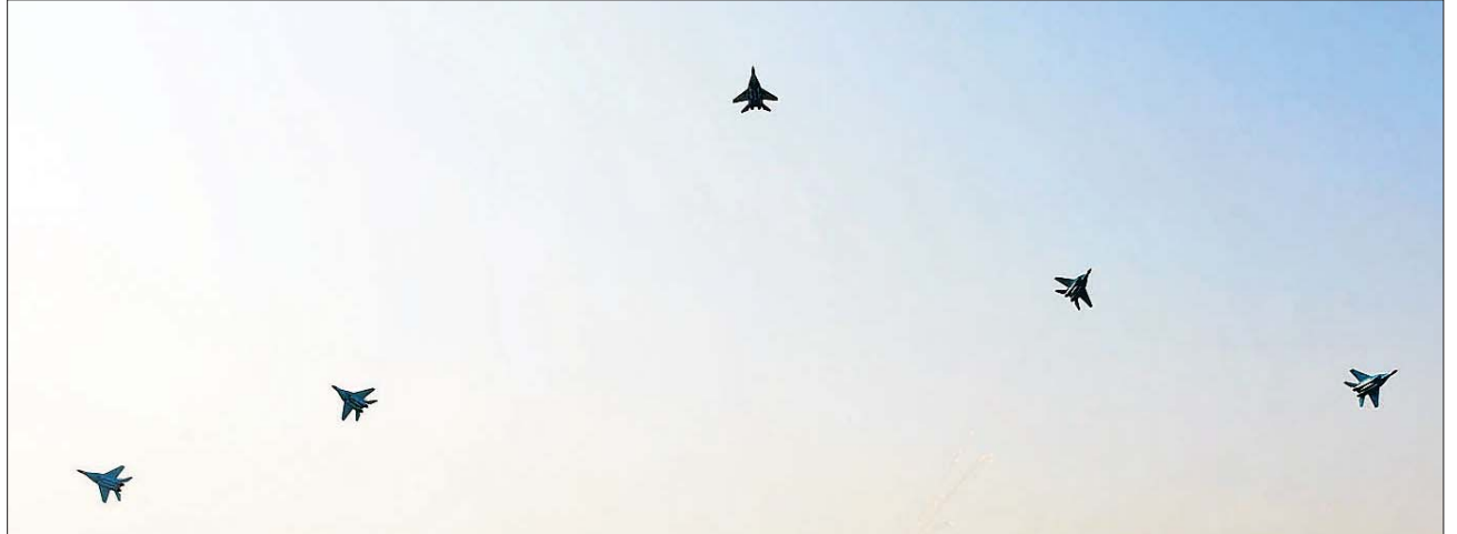
နိုင်ငံတော်စီမံအုပ်ချုပ်ရေးကောင်စီဥက္ကဋ္ဌ တပ်မတော်ကာကွယ်ရေးဦးစီးချုပ် ဗိုလ်ချုပ်မှူးကြီး သတိုးမဟာသရေစည်သူ သတိုးသိရီသုဓမ္မ မင်းအောင်လှိုင် အား တပ်မတော် (လေ) မှ လေယာဉ်များက ပျံသန်းအလေးပြုကြစဉ်။