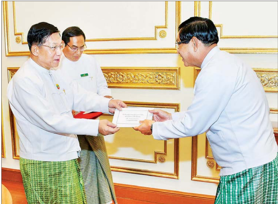
နိုင်ငံတော်စီမံအုပ်ချုပ်ရေးကောင်စီဥက္ကဋ္ဌ နိုင်ငံတော်ဝန်ကြီးချုပ် ဗိုလ်ချုပ်မှူးကြီး မင်းအောင်လှိုင် ရန်ကုန်တိုင်းဒေသကြီးအတွက် နိုင်ငံစီးပွားမြှင့်တင်ရေးရန်ပုံငွေကို တိုင်းဒေသကြီး ဝန်ကြီးချုပ်ထံ ပေးအပ်စဉ်။

နိုင်ငံတော်စီမံအုပ်ချုပ်ရေးကောင်စီဥက္ကဋ္ဌ နိုင်ငံ တော်ဝန်ကြီးချုပ်က အဖွင့်အမှာစကားပြောကြား ရာတွင် နိုင်ငံတစ်နိုင်ငံအနေဖြင့် နိုင်ငံဖွံ့ဖြိုးတိုးတက် ရေးအတွက် နိုင်ငံရေး၊ စီးပွားရေး၊ အုပ်ချုပ်ရေး၊ နိုင်ငံတကာဆက်ဆံရေးနှင့် ကာကွယ်ရေးတို့အတွက် အစီအမံများ ချမှတ်ဆောင်ရွက်ရကြောင်း၊ မိမိတို့ နိုင်ငံတော်စီမံအုပ်ချုပ်ရေးကောင်စီအနေဖြင့်လည်း နိုင်ငံတော်ကို တာဝန်ယူဆောင်ရွက်ချိန်တွင် ရည်မှန်း ချက် (၅) ရပ်နှင့် ဦးတည်ချက် (၁၂) ရပ်ကို ချမှတ်၍ အကောင်အထည်ဖော် ဆောင်ရွက်လျက်ရှိကြောင်း၊ ထို့ကြောင့် မိမိတို့ဆောင်ရွက်နေရသည့် အခန်းကဏ္ဍ သည် နိုင်ငံတော်အဆင့် ဆောင်ရွက်နေခြင်း ဖြစ်သောကြောင့် လုပ်ငန်းများဆောင်ရွက်ရာ တွင် အလေးထားစဉ်းစား ဆောင်ရွက်ကြရန် လိုကြောင်း။