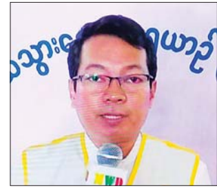
ရင်တွင်းပီတိစကားပြောကြားသည့် တာဝန်ရှိသူများ။

တယ်။ ဆေးကုသမှုပေးခဲ့တဲ့နေရာ တွေက လူနာတွေနဲ့ တာဝန်ရှိသူ တွေရဲ့ ရင်တွင်းကလာတဲ့ ကျေးဇူးတင်စကား၊ ဆုတောင်း မေတ္တာ စကားသံများကိုကြား တဲ့အခါမှာ ကျွန်တော်တို့ရဲ့ဆွေမျိုး သားချင်းတွေကို ကျန်းမာရေး စောင့်ရှောက်မှုပေးရသလို ရင်ထဲ မှာခံစားရပါတယ်။ တပ်မတော် ကာကွယ်ရေးဦးစီးချုပ်ရဲ့ လမ်းညွှန် ချက်နဲ့အညီ ပင်လယ်သွားဆေးကု ရေယာဉ် သံလွင်ရဲ့ (၁၆) ကြိမ် မြောက် နယ်လှည့်ဆေးကုသမှု ခရီးစဉ်မှာ သက်ဆိုင်ရာ တိုင်းစစ် ဌာနချုပ်၊ ရေတပ်စခန်း ဌာနချုပ်နဲ့ တပ်များ၊ ဌာနဆိုင်ရာအသီးသီးမှ တာဝန်ရှိသူများ၊ ပရဟိတအသင်း အဖွဲ့များမှ တစ်တပ်တစ်အားပါဝင် ဖြည့်ဆည်းပေးခဲ့တဲ့ အတွက် ကမ်းရိုးတန်း တစ်လျှောက်နဲ့ ကျန်းမာမှုမှာ နေထိုင်တဲ့ မိဘ ပြည်သူတွေရဲ့ ကျန်းမာရေးဆိုင်ရာ ဆေးကုသမှုလုပ်ငန်းတွေကို ထိ ရောက်စွာဆောင်ရွက်ပေးနိုင်တဲ့ အတွက် ပြည်သူ့ပုဂ္ဂိုလ်သွယ်ဆိုတဲ့ အဓိပ္ပာယ်ကို အောင်မြင်စွာဖော် ဆောင်နိုင်ခဲ့ကြောင်း ပြောကြား လိုပါတယ်။