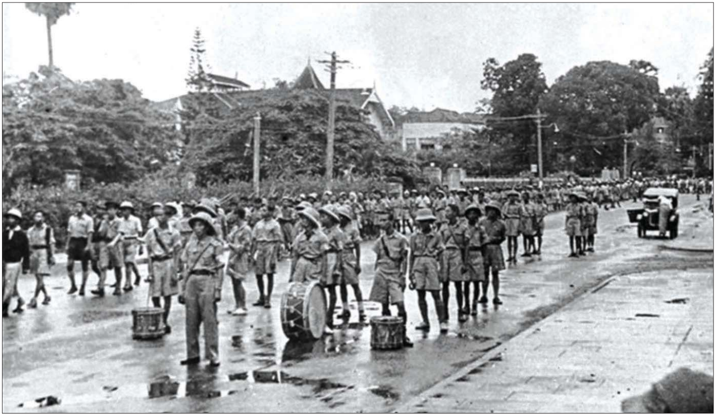
မြန်မာ့လွတ်လပ်ရေးပြန်လည်ရရှိရန် တိုက်ပွဲဝင်ခဲ့သော ဗမာ့လွတ်လပ်ရေးတပ်မတော်(BIA)တပ်ဖွဲ့ဝင်များ ရန်ကုန်မြို့သို့ ရောက်ရှိလာစဉ်။

“မြန်မာတို့ဘဝ အနှစ် ၁၂၀ မကျော်ခင် ရာဇဝင်ခေတ်တွေမှာ သမိုင်းတစ်လျှောက် ဂုဏ်မောက်စွာဖြင့် နေနိုင်ခဲ့ကြသည်မှာလည်း ကြည်နူးစရာများရှိခဲ့သလို သူ့ကျွန် လက်အောက် ကျရောက်နေချိန်မှာ တစ်မျိုးသားလုံး ညှိုးငယ်ခဲ့ရပုံနှင့် သူ့ဘဝတာလေး ကို ရာဇဝင်ပြန်လည်ရေးခဲ့လျှင် လွတ်လပ်ရေးရရှိရန် တောစခန်းမှာ ကြိုးစားခဲ့ရသော အခြေအနေများသည် ကြောက်ခမန်း၊ လန့်ခမန်း၊ လမ်းကြမ်းများဟု စာဖွဲ့ထားခြင်းဖြင့် ထိုတိုက်ပွဲဝင်ကာလသည် မည်မျှကြမ်းတမ်းခဲ့ကြောင်း ခံစားတင်ပြထား။”