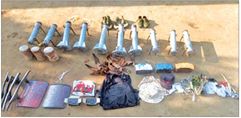
စနစ်တကျ ဖျက်ဆီးခဲ့ကြောင်း သိရသည်။ ထိုသို့ နယ်မြေဒေသ တည်ငြိမ်အေးချမ်းရေးကို ပျက်ပြားစေရန်ရည်ရွယ်၍ အကြမ်းဖက်ပစ်ခတ် တိုက်ခိုက် ဖောက်ခွဲရေးလုပ်ငန်းများ လုပ်ဆောင်နေ သည့် အကြမ်းဖက်သမားများကို ဖမ်းဆီးရမိ နိုင်ရေးနှင့် နယ်မြေဒေသ တည်ငြိမ်အေးချမ်းရေး အတွက် လုံခြုံရေးတပ်ဖွဲ့ဝင်များက လုံခြုံရေးလုပ်ငန်း စဉ်များနှင့်အညီ ဆက်လက်ဆောင်ရွက်လျက်ရှိ ကြောင်း သတင်းရရှိသည်။ သတင်းစဉ်

စိန်ပြောင်း ၁၀ လက်၊ လက်လုပ်ရှေ့ထွက်မိုင်းသုံးလုံး၊ လက်လုပ်မိုင်း သုံးလုံး၊ ၁၂ ဇိုကျည် ၂၂ တောင့်၊ ကျည်ကာအင်္ကျီ တစ်ထည်၊ ကျည်ကာအင်္ကျီတွင် ထည့်သောသံပြား နှစ်ချပ်၊ ဆိုင်ကယ်ဘက်ထရီအိုး နှစ်လုံး၊ ပြောက်ကျားဦးထုပ်တစ်လုံး၊ လျှာထိုးဦးထုပ် တစ်လုံး၊ ပြောက်ကျားလည်တိုဖိနပ် သုံးရစ်၊ လက်လုပ် စိန်ပြောင်း ဒေါက်တိုင် လေးချောင်း၊ ဝါးညှပ် သုံးချ၊ ဆေးထိုးပိုက် ၂၀ CC အချောင်း ၂၀၊ အရှည်ပေ ၃၀ ခန့် ရှိ ဝိုင်ယာကြိုး သုံးခွေ၊ အရှည်ပေ ၂၀၀ ခန့်ရှိ နိုင်လွန် ကြိုး တစ်ခွေနှင့် အရှည် ၁၀၀ ပေခန့်ရှိ ငါးမျှားကြိုး (တိုက်ကြိုး) တစ်ခွေတို့ကို သိမ်းဆည်းရမိခဲ့သဖြင့်