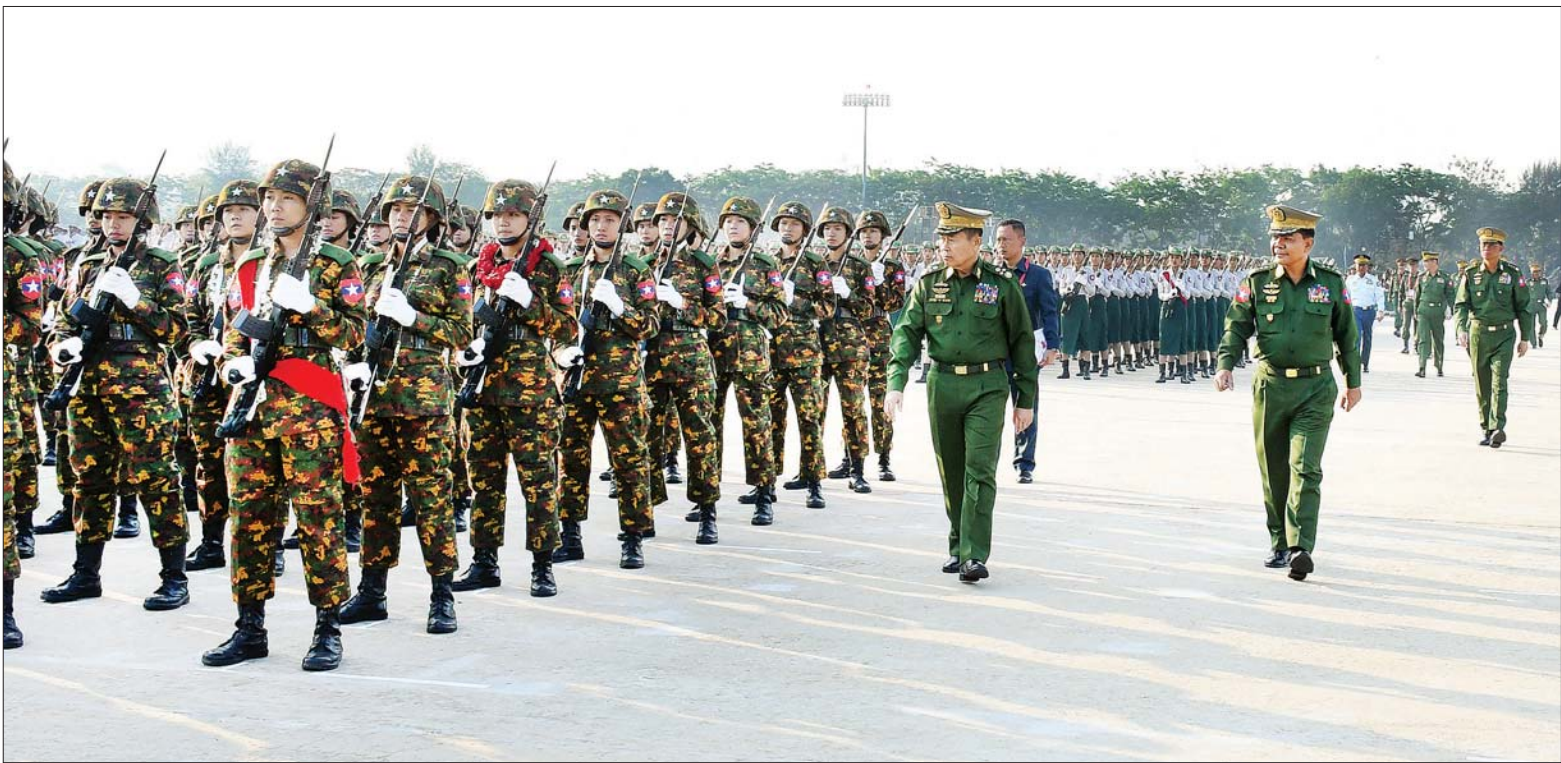
နိုင်ငံတော်စီမံအုပ်ချုပ်ရေးကောင်စီ ဒုတိယဥက္ကဋ္ဌ ဒုတိယတပ်မတော်ကာကွယ်ရေးဦးစီးချုပ် ကာကွယ်ရေးဦးစီးချုပ်(ကြည်း) ဒုတိယဗိုလ်ချုပ်မှူးကြီး စိုးဝင်း (၇၈)နှစ်မြောက်တပ်မတော်နေ့ စစ်ရေးပြအခမ်းအနား၌ ပါဝင်စစ်ရေးပြကြမည့် စစ်ရေးပြစစ်ကြောင်းကြီးများ ဝတ်စုံပြည့်စစ်ရေးပြလေ့ကျင့်နေမှုကို ကြည့်ရှုစစ်ဆေးစဉ်။

နေပြည်တော် မတ် ၂၄ ၂၀၂၃ ခုနှစ် မတ်လ ၂၇ ရက်နေ့တွင် ကျရောက်မည့် (၇၈) နှစ်မြောက် တပ်မတော်နေ့ စစ်ရေးပြအခမ်းအနား တွင် ပါဝင်ချီတက် စစ်ရေးပြကြမည့် စစ်ရေးပြ စစ်ကြောင်းကြီးများသည် ယနေ့နံနက်ပိုင်းတွင် နေပြည်တော် စစ်ရေးပြကွင်း၌ ဝတ်စုံပြည့် စစ်ရေးပြ လေ့ကျင့်မှုများ ဆောင်ရွက်ကြသည်။ စစ်ရေးပြ လေ့ကျင့်မှုတွင် အနော်ရထာစစ်ကြောင်း၊ ကျန်စစ်သား စစ်ကြောင်း၊ ဘုရင့်နောင်စစ်ကြောင်း၊ အောင်ဇေယျစစ်ကြောင်း၊ ဆင်ဖြူရှင် စစ်ကြောင်း၊ ဗန္ဓုလစစ်ကြောင်းနှင့် အောင်ဆန်း စစ်ကြောင်းများပါဝင်ပြီး စုရပ်ဖြစ်သည့် သစ်တပ်ကွင်းမှ စစ်ရေးပြ ကွင်းသို့ တပ်မတော်စစ်တီးဝိုင်းအဖွဲ့ များ၏ တီးခတ်မှုနှင့်အတူ စစ်ချီသီချင်း များသီဆို၍ ညီညာစွာချီတက်ကြပြီး စစ်ရေးပြအခမ်းအနား အစီအစဉ်အတိုင်း လေ့ကျင့်ဆောင်ရွက်ကြသည်။ စာမျက်နှာ ၆ ကော်လံ ၁