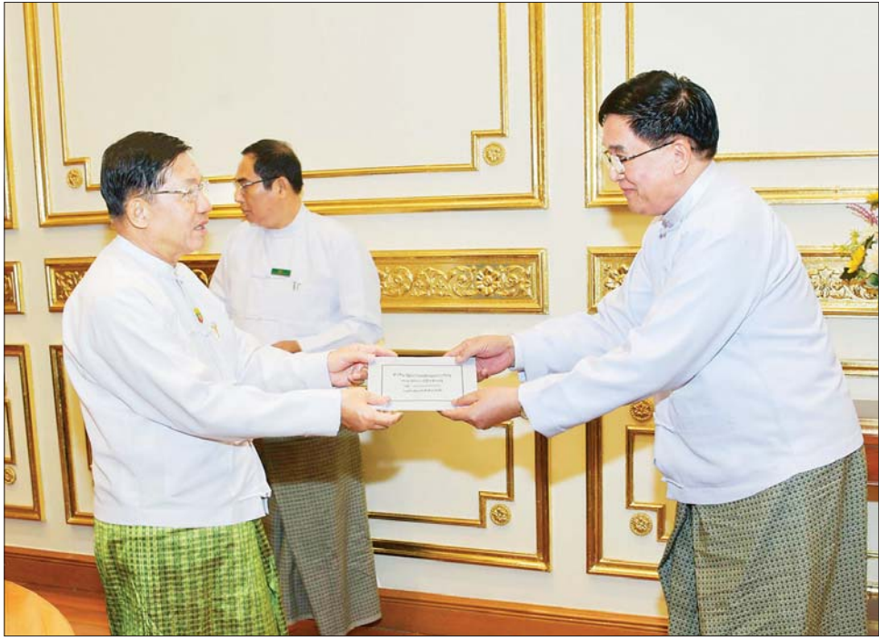
နိုင်ငံတော်စီမံအုပ်ချုပ်ရေးကောင်စီဥက္ကဋ္ဌ နိုင်ငံတော်ဝန်ကြီးချုပ် ဗိုလ်ချုပ်မှူးကြီး မင်းအောင်လှိုင် မကွေးတိုင်းဒေသကြီးအတွက် နိုင်ငံစီးပွားမြှင့်တင်ရေးရန်ပုံငွေကို တိုင်းဒေသကြီး ဝန်ကြီးချုပ်ထံ ပေးအပ်စဉ်။

ဝါစိုက်ဧကများ ပြန်လည်စိုက်ပျိုးရန်လို ဝါစိုက်ပျိုးမှုနှင့်ပတ်သက်၍ တိုင်းပြည်၏ အဓိက စိုက်ပျိုးသည့် သီးနှံများအနက် ဝါသည် တစ်ခုအပါ အဝင် ဖြစ်ပြီး ၄ ဒသမ ၅ သိန်း ဧကစိုက်ပျိုးကြောင်း၊ ၂၀၁၁ ခုနှစ်တွင် ဧက ရှစ်သိန်းအထိ စိုက်ပျိုးခဲ့ပြီး နောက်ပိုင်းတွင် အကြောင်းအမျိုးမျိုးကြောင့် စိုက်ပျိုး မှု ရာခိုင်နှုန်းကျဆင်းခဲ့ကြောင်း၊ ယခင်နှစ် ဝါထွက်ရှိမှု အနေဖြင့် တစ်ဧကလျှင် ၄၃၈ ဒသမ ၅ ပိဿာနှုန်းဖြင့် စုစုပေါင်း ဝါပိဿာချိန် ၁၉၈ ဒသမ ၇ သန်း ရရှိခဲ့ပြီး ယခုလက်ရှိတွင် နိုင်ငံ၏ ဝါလိုအပ်ချက်သည် ပိဿာ ပေါင်း ၃၆၃ သန်းလိုအပ်ချက်ရှိကြောင်း၊ ထို့ကြောင့် ပိဿာချိန် ထက်ဝက်နီးပါးခန့် လိုအပ်ချက်ရှိနေသည် ကို တွေ့ရှိရကြောင်း၊ မိမိတို့အနေဖြင့် တစ်ဧက အထွက်နှုန်းကို ပိဿာ ၇၀၀ နှုန်းအထိ ထွက်ရှိနိုင်ရေး ကြိုးပမ်းဆောင်ရွက်နိုင်မည်ဆိုပါက ပြည်ပမှ တင်သွင်းနေမှုများကို လျှော့ချနိုင်မည်ဖြစ်ကြောင်း၊ ထို့ကြောင့် ဝါစိုက်ပျိုးသည့် တိုင်းဒေသကြီးနှင့် ပြည်နယ်များအနေဖြင့် ယခင်ဝါစိုက်ဧကများအတိုင်း ပြန်လည်စိုက်ပျိုးနိုင်စေရေး လိုအပ်သည်များ ဆောင်ရွက်ပေးနိုင်ရန် လိုကြောင်း၊ ဝါစိုက်တောင်သူ များနှင့် တွေ့ဆုံဆွေးနွေးမှုများ ဆောင်ရွက်၍ လိုအပ် သည်များကိုလည်း ဖြည့်ဆည်းဆောင်ရွက်ပေးရန် လိုကြောင်း၊ မိမိတို့နိုင်ငံတွင် ချည်မျှင်ရှည်ဝါကို အဓိကထား၍ စိုက်ပျိုးကြသည်ကို တွေ့ရှိရပြီး အရည်အသွေး ပြည့်မီသည့် ချည်မျှင်ထွက်ရှိနိုင်အောင်