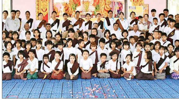
အဆိုပါသင်တန်းကို ကင်းသာကျေးရွာနှင့် တစ်မိုင်ကျောက်ကွင်းမှ ကျောင်းသား ကျောင်းသူ ၁၈၀ တက်ရောက်ပြီး သင်တန်းကာလကို မတ် ၈ ရက်မှ ၂၀ ရက်အထိ သင်တန်းနည်းပြ ဆရာ ဆရာမ ၁၆ ဦးဖြင့် အခြေခံ ဗုဒ္ဓဘာသာရပ်၊ ယဉ်ကျေးခြင်းဆိုင်ရာနှင့် ၃၈ ဖြာ မင်္ဂလာတော်များ သင်ကြား ပေးခဲ့ကြောင်း သိရသည်။ တင်ဖိုးလွင်