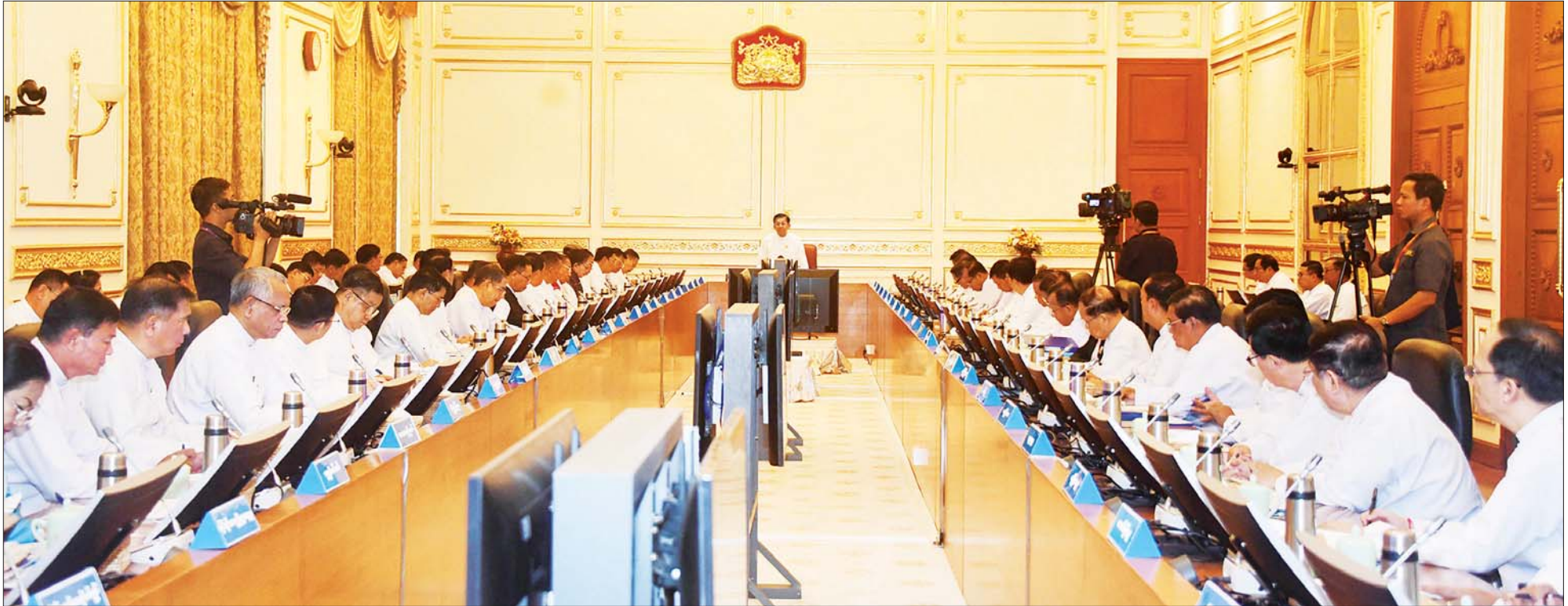
နိုင်ငံတော်စီမံအုပ်ချုပ်ရေးကောင်စီဥက္ကဋ္ဌ နိုင်ငံတော်ဝန်ကြီးချုပ် ဗိုလ်ချုပ်မှူးကြီး မင်းအောင်လှိုင် ကောင်စီအဖွဲ့ဝင်များ၊ ပြည်ထောင်စုဝန်ကြီးများ၊ တိုင်းဒေသကြီးနှင့် ပြည်နယ်ဝန်ကြီးချုပ်များ၊ ကိုယ်ပိုင်အုပ်ချုပ်ခွင့်ရတိုင်း၊ ဒေသစီမံအုပ်ချုပ်ရေးအဖွဲ့ဥက္ကဋ္ဌများနှင့် တွေ့ဆုံညှိနှိုင်းအစည်းအဝေးတွင် အမှာစကားပြောကြားစဉ်။