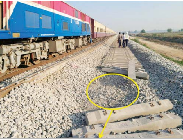
မိုင်းပေါက်ကွဲ၍ ကွန်ကရစ်ဇလီဖားတုံးသစ်များ ထိခိုက်ပျက်စီးမှု။

၂၂-၃-၂၀၂၃ ရက်နေ့က အကြမ်းဖက်သောင်းကျန်းသူများ၏ ရက်စက်ကြမ်းကြုတ်စွာ မိုင်းခွဲတိုက်ခိုက်မှုကြောင့် စီမံကိန်း ဆောင်ရွက်နေသည့် ရထားလမ်းထိခိုက်ပျက်စီးမှုအခြေအနေ