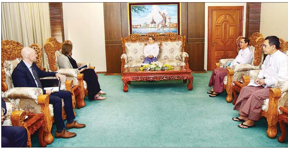
ပြန်လည်လက်ခံရေး အတွက် ICRC တို့အကြား ပူးပေါင်းဆောင် အကူအညီများအတွက် ညှိနှိုင်း ရွက်နေမှု၊ မြန်မာနိုင်ငံအတွင်း ဆောင်ရွက်ပေးနေမှုကို ဆွေးနွေး လူသားချင်း စာနာထောက်ထားမှု ခဲ့ကြသည်။ သတင်းစဉ်

နေပြည်တော် မတ် ၂၂ အပြည်ပြည်ဆိုင်ရာ ပူးပေါင်း ဆောင်ရွက်ရေး ဝန်ကြီးဌာန ပြည်ထောင်စုဝန်ကြီး ဦးကိုကိုလှိုင် သည် အပြည်ပြည်ဆိုင်ရာ ကြက်ခြေနီကော်မတီ (ICRC) ၏ မြန်မာနိုင်ငံဆိုင်ရာ ဌာန ကိုယ်စားလှယ် Ms. Elena Ajmone Sessera ကို ယနေ့နံနက် ၉ နာရီခွဲက နေပြည်တော်ရှိ အပြည်ပြည်ဆိုင်ရာ ပူးပေါင်း ဆောင်ရွက်ရေး ဝန်ကြီးဌာန၌ လက်ခံတွေ့ဆုံသည်။ ထိုသို့တွေ့ဆုံစဉ် ရခိုင် ပြည်နယ်မှ နေရပ်စွန့်ခွာသူများ