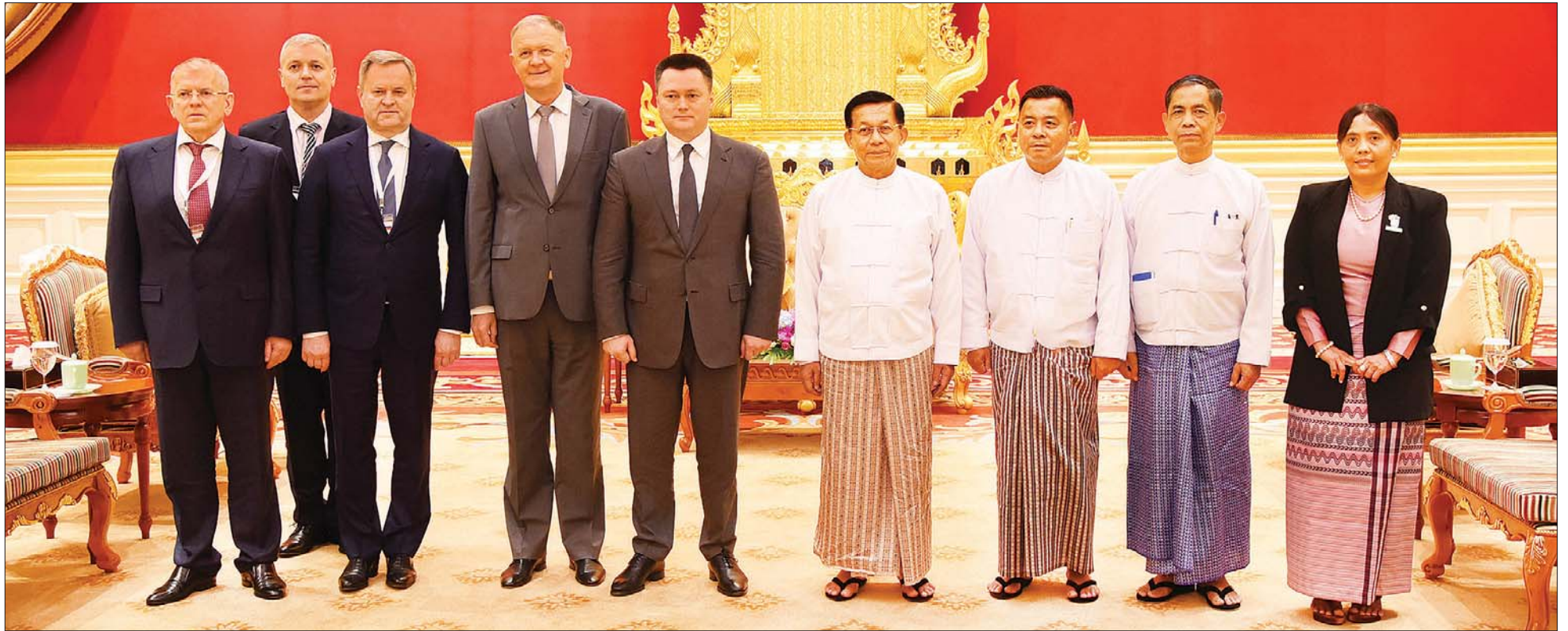
နိုင်ငံတော်စီမံအုပ်ချုပ်ရေးကောင်စီဥက္ကဋ္ဌ နိုင်ငံတော်ဝန်ကြီးချုပ် ဗိုလ်ချုပ်မှူးကြီး မင်းအောင်လှိုင်နှင့်အဖွဲ့ဝင်များ ရုရှားဖက်ဒရေးရှင်းနိုင်ငံ ရှေ့နေချုပ် H.E. Mr. Igor Krasnov ဦးဆောင်သော ကိုယ်စားလှယ်အဖွဲ့နှင့်အတူ စုပေါင်းမှတ်တမ်းတင်ဓာတ်ပုံရိုက်စဉ်။