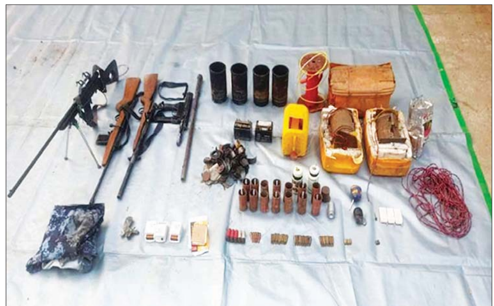
၂၀၂၃ ခုနှစ် မတ် ၁၅ ရက်တွင် မုံရွာမြို့ အေးသာယာရပ်ကွက် ချင်းတွင်းမြစ်ကမ်းအနီး၌ တရားခံများနှင့်အတူ သိမ်းဆည်းရမိခဲ့သည့် လက်နက်/ခဲယမ်း၊ မိုင်းနှင့် ဆက်စပ်ပစ္စည်းများ မှတ်တမ်းဓာတ်ပုံ။

နှစ် စုစုပေါင်း တရားခံ ၁၄ ဦးကို လက်လုပ်သေနတ်မျိုးစုံ ခုနှစ် ငါးလက်၊ လက်လုပ်မိုင်း ၁၉ လုံး၊ ကျည်မျိုးစုံ ၁၇၆ တောင့်၊ အခြား ဖောက်ခွဲရေးဆက်စပ်ပစ္စည်းများ ဖမ်းဆီးရမိခဲ့သည်။ အဆိုပါ Anonymous အမည်ခံ အကြမ်းဖက်အဖွဲ့ဝင် များကို ဖမ်းဆီးရမိစဉ် ဓားစာခံ အဖြစ် ဖမ်းဆီးချုပ်နှောင်ထား သည့် အဖြစ်မဲ့ပြည်သူ ကျား နှစ်ဦး၊ မတစ်ဦးနှင့် ကလေးငယ် တစ်ဦး စုစုပေါင်း အဖြစ်မဲ့ပြည်သူ လေးဦး တို့ကို လုံခြုံရေးတပ်ဖွဲ့ဝင်များက အချိန်မီ ကယ်တင်နိုင်ခဲ့သည်။ ဖမ်းဆီးရမိ တရားခံများ၏ ထွက်ဆိုချက်အရ ဓားစာခံအဖြစ် ဖမ်းဆီးခံရသည့် ကျား တစ်ဦး မိသားစုတစ်စုလုံး ဖမ်းဆီးထား ခြင်းဖြစ်ကြောင်း၊ ထို့အပြင် ကျန် တစ်ဦးမှာ ငွေကြေးတောင်းခံနိုင် ရန်အတွက် ပြန်ပေးဆွဲထားခြင်း ဖြစ်ကြောင်း ဖော်ထုတ်သိရှိရ သည်။ စာမျက်နှာ ၁၉ သို့