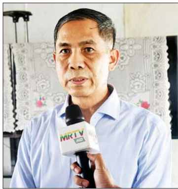
ဦးကိုကိုလှိုင် (ပြည်ထောင်စုဝန်ကြီး)

သူတို့ကို ကြားစခန်းမှာ ခဏထားရှိပြီးရင် နေရာချထားမယ့် ကျေးရွာတွေကို ဆက်လက်ပို့ဆောင်ပေးသွားမှာ ဖြစ်ပါတယ်။ ကျွန်တော်အနေနဲ့ အခုတစ်ကြိမ်နဲ့ဆို ဒီကိုရောက်တာ သုံးကြိမ်ရှိပါပြီ။ တစ်ကြိမ်နဲ့တစ်ကြိမ် အနေအထားလေး