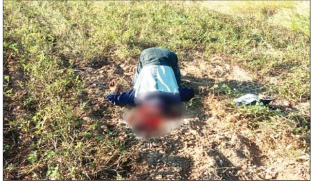
၂၀၂၃ ခုနှစ် ဇန်နဝါရီ ၁၀ ရက်တွင် မုံရွာမြို့နယ် ကတိုးကျေးရွာနေ ဦးကျော်စိုးအား Anonymous အကြမ်းဖက်အဖွဲ့များက ရက်စက်စွာ ခေါင်းဖြတ်သတ်ဖြတ်ခဲ့သည့် မှတ်တမ်းဓာတ်ပုံ။