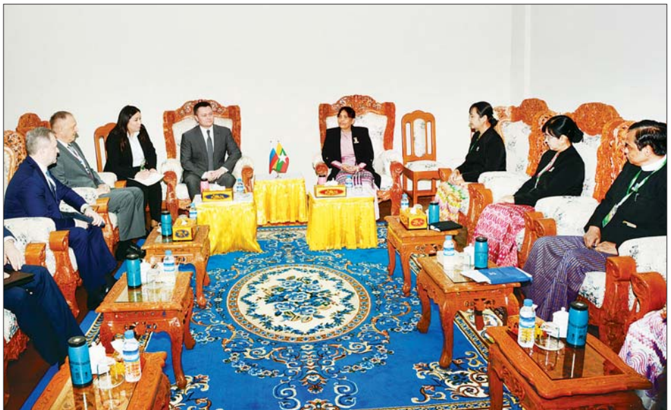
ပြည်ထောင်စုဝန်ကြီးနှင့် ပြည်ထောင်စုရှေ့နေချုပ် ဒေါက်တာသီတာဦးနှင့် ရုရှားဖက်ဒရေးရှင်းနိုင်ငံ ရှေ့နေချုပ် Mr.Igor KRASNOV ဦးဆောင်သော ကိုယ်စားလှယ်အဖွဲ့တို့ တွေ့ဆုံဆွေးနွေးစဉ်။

ထို့နောက် ဥပဒေရေးရာဝန်ကြီးဌာနနှင့် ရုရှား ဖက်ဒရေးရှင်းနိုင်ငံ ရှေ့နေချုပ်ရုံးတို့အကြား ပူးပေါင်း ဆောင်ရွက်ရေး နားလည်မှုစာချုပ်လွှာကို ဥပဒေ ရေးရာဝန်ကြီးဌာန ပြည်ထောင်စုဝန်ကြီးနှင့် ပြည်ထောင်စုရှေ့နေချုပ် ဒေါက်တာသီတာဦးနှင့် ရုရှားဖက်ဒရေးရှင်းနိုင်ငံ ရှေ့နေချုပ် Mr.Igor