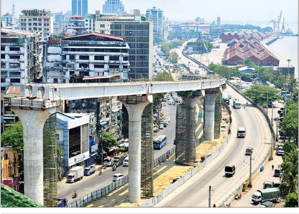
ရန်ကုန်ဘက်ခြမ်း၌ လသာကမ်းနားလမ်းအတိုင်း တစ်လမ်းမောင်းတံတား တည်ဆောက်နေမှုကို တွေ့ရစဉ်။

ရန်ကုန် မတ် ၂၂ မြန်မာနိုင်ငံတွင် အထင်ကရပြယုဂ်တစ်ခုဖြစ်စေမည့် မြန်မာ-ကိုရီးယား နှစ်နိုင်ငံချစ်ကြည်ရေး (ဒလ) တံတားကြီးကို ၂၀၁၉ ခုနှစ် မေလတွင် တည်ဆောက် ရေးလုပ်ငန်းများ စတင်ဆောင်ရွက်ခဲ့ရာ မြစ်ကူး တံတားနှစ်ဖက်မှ ချဉ်းကပ်လမ်းပိုင်းနှင့် ဆင်ခြေ လျှောတံတားလုပ်ငန်းများ ၂၀၂၃ ခုနှစ် နှစ်ကုန်ပိုင်း တွင် ပြီးစီးရန် နေ့ညမပြတ် ဆောင်ရွက်လျက် ရှိကြောင်း သိရသည်။ ယခုအခါ တံတားကြီး၏ ပုံသဏ္ဍာန်မှာ ရုပ်လုံး ပေါ်လာပြီဖြစ်ပြီး ရန်ကုန်ဘက်ခြမ်းတွင် ဘုန်းကြီး လမ်းသို့ နှစ်လမ်းသွားတံတားတစ်စင်း၊ ဆူးလေ ဘုရားဘက်သို့ တစ်လမ်းမောင်းတံတားတစ်စင်း၊ အလုံမြို့နယ်ဘက်သို့ တစ်လမ်းမောင်းတံတား တစ်စင်းဖြင့် စုစုပေါင်းတံတားသုံးစင်း သွယ်ဆင်း သည့်ပမာ တည်ဆောက်လျက်ရှိသည်။ မြန်မာနိုင်ငံရှိ သံမဏိကြီးဆိုင်းတံတားများတွင် ရန်ကုန် - ဒလမြစ်ကူးတံတားသည် အကြီးဆုံးနှင့် စာမျက်နှာ ၁၀ ကော်လံ ၁