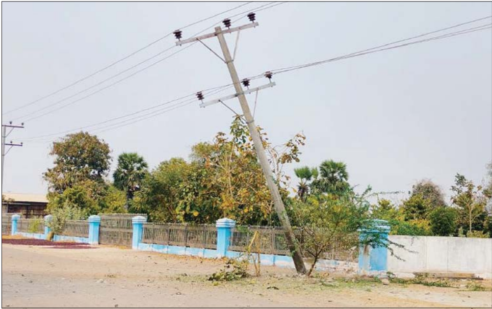
၂၀၂၃ ခုနှစ် မတ် ၁၂ ရက်တွင် မုံရွာမြို့ ရွှေဂုံးရပ်ကွက် အင်းစပ်လမ်းတွင် အကြမ်းဖက်သူများက လက်လုပ်မိုင်းဖြင့် ဖောက်ခွဲခဲ့သည့် မှတ်တမ်းဓာတ်ပုံ။