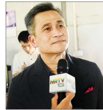
မစ္စတာ မိုခွန်း ဝိစစ်စတန် (မြန်မာနိုင်ငံဆိုင်ရာ ထိုင်းသံအမတ်ကြီး)

တွေ ပိုမိုတိုးတက်လာတာတွေ့ရပါတယ်။ နေထိုင်စရာဆိုရင် အရင်တုန်းက ပြုပျက်နေတဲ့ လိုင်းခန်းတွေနဲ့ တည်းခိုစရာနေရာတွေကို ပြန်လည်ဖွဲ့စည်းပြီး အသစ်ပြန်လည် တည်ဆောက်ထားပါတယ်။ တရုတ်ပြည်သူ့သမ္မတနိုင်ငံက လှူဒါန်းတဲ့ အလွယ်တကူ တပ်ဆင်နိုင်တဲ့ နေအိမ် (ABH) တွေကိုလည်း ပြန်ဆင်ပြီး သူနေရာနဲ့သူ နေလိုထိုင်လိုရအောင် စီစဉ်ပေးထားပါတယ်။ ရေတွေ၊ မီးတွေလည်း အကုန်စီစဉ်ထားပါတယ်။ အခု ကြည့်ရတဲ့ အနေအထားကတော့ အင်မတန် ကျေနပ်စရာကောင်းပါတယ်။ တော်တော်များများကို ပြင်ဆင်ထားတဲ့ အနေအထားမျိုးဖြစ်ပါတယ်။ ဒီနေရာမှာ မိသားစုတွေ ယာယီနေထိုင်ရမှာဆိုပေမယ့်လည်း လူမှုဝန်ထမ်း၊ ကယ်ဆယ်ရေးနှင့် ပြန်လည်နေရာချထားရေးဝန်ကြီးဌာနကနေ ကလေးတွေထားဖို့အတွက် ကလေးပျော်နေရာတွေ၊ အမျိုးသမီးတွေအတွက် သက်မွေးသင်တန်းပေးတာတွေ၊ ချက်ဖိုပြုတ်ဖိုမီးဖိုချောင်သုံးပစ္စည်းတွေ၊ အဝတ်အထည်တွေ ထောက်ပံ့တာတွေကို ဒီမှာ အကုန်လုပ်ပေးသွားမှာဖြစ်ပါတယ်။