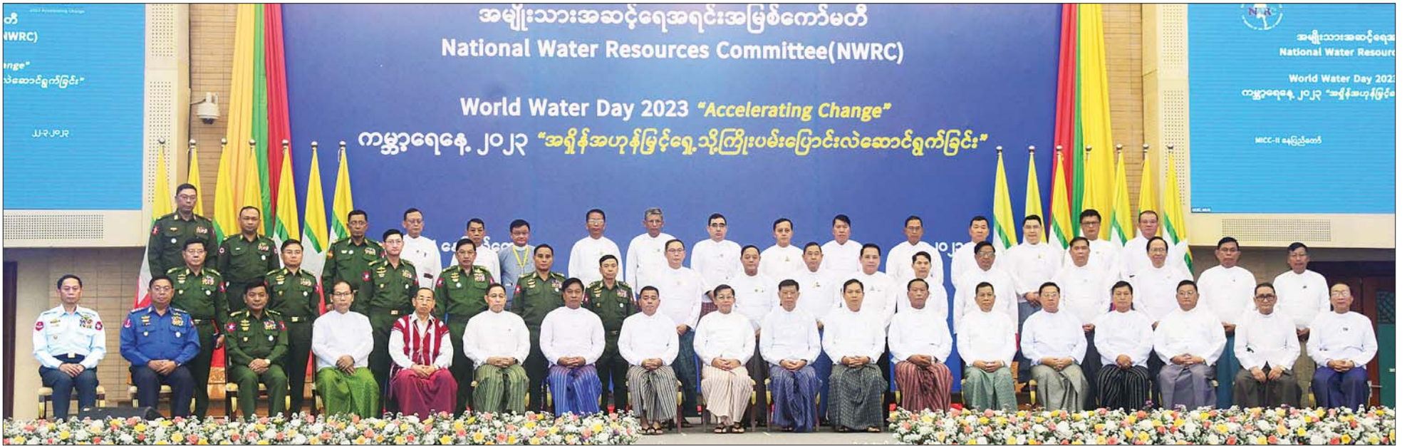
နိုင်ငံတော်စီမံအုပ်ချုပ်ရေးကောင်စီဥက္ကဋ္ဌ နိုင်ငံတော်ဝန်ကြီးချုပ် ဗိုလ်ချုပ်မှူးကြီး မင်းအောင်လှိုင်နှင့် အခမ်းအနားတက်ရောက်လာကြသူများ စုပေါင်းမှတ်တမ်းတင်ဓာတ်ပုံရိုက်စဉ်။