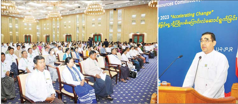
အမြင်များ အပြန်အလှန် ဖလှယ်နိုင်ပြီး ခင်မင်မှုရရှိ၍ လုပ်ငန်းများ ဆောင်ရွက်ရာတွင် ပူးပေါင်းဆောင်ရွက် မှုများ ပိုမိုတိုးတက်ကောင်းမွန်စေနိုင်မည်ဖြစ်ပါ ကြောင်း၊ ဘာသာရပ်ဆိုင်ရာ ဆွေးနွေးပွဲများတွင် ဝန်ကြီးဌာနများ၊ အဖွဲ့အစည်းများအလိုက် ရေကဏ္ဍ နှင့်သက်ဆိုင်သည့် ဆောင်ရွက်ချက်များ၊ ရေဆိုင်ရာ အခက်အခဲပြဿနာများ၊ ဖြေရှင်းရန်နည်းလမ်းများ၊ လေ့လာတွေ့ရှိချက်များကို သက်ဆိုင်ရာ ပညာရှင် များက ဆွေးနွေးတင်ပြကြမည် ဖြစ်ကြောင်း၊ တက်ရောက်လာသူများအနေဖြင့်လည်း သိလိုသည် များကို မေးမြန်းခြင်း၊ မိမိတို့ကိုယ်စီ အတွေ့အကြုံများ အပေါ်မူတည်ပြီး ပိုမိုကောင်းမွန်စေရန် အကြံပြုခြင်း များဖြင့် ပါဝင်ဆွေးနွေး ဆောင်ရွက်ပေးကြရန် တိုက်တွန်းပါကြောင်း။ မိမိတို့နိုင်ငံသည် စိုက်ပျိုးရေးကို အခြေခံသည့် နိုင်ငံတစ်နိုင်ငံဖြစ်သဖြင့် ရေကို စနစ်တကျ အသုံးပြု နိုင်ရန် စီမံဆောင်ရွက်ပြီး ရေကဏ္ဍဖွံ့ဖြိုးတိုးတက် စေခြင်းဖြင့် အခြားကဏ္ဍများ ဖွံ့ဖြိုးတိုးတက်မှုကိုပါ

ဆွေးနွေးပွဲတွင် ဒုတိယဝန်ကြီးက ယခုကဲ့သို့ ဘာသာရပ်ဆိုင်ရာ ဆွေးနွေးပွဲများမှတစ်ဆင့် ဆွေးနွေးပွဲသို့ တက်ရောက်လာသည့် ဝန်ကြီးဌာနများ၊ အဖွဲ့အစည်းများနှင့် ရေနှင့်ဆက်သွယ်သက်ဆိုင်သူ များအကြား လုပ်ငန်းအတွေ့အကြုံများနှင့် အသိ