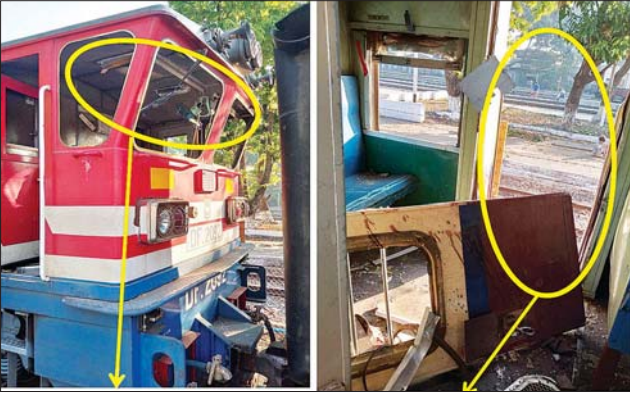
စက်ခေါင်း လေကာမှန်များ ကွဲကျ နေပုံ။ လူစီးတွဲ တက်/ဆင်းပေါက်တံခါး ပြုတ်ကျပျက်စီးမှု အခြေအနေ။

အဆိုပါ ရထားခရီးစဉ်များအနက် ရန်ကုန်မှ မတ် ၂၁ ရက် မွန်းလွဲ