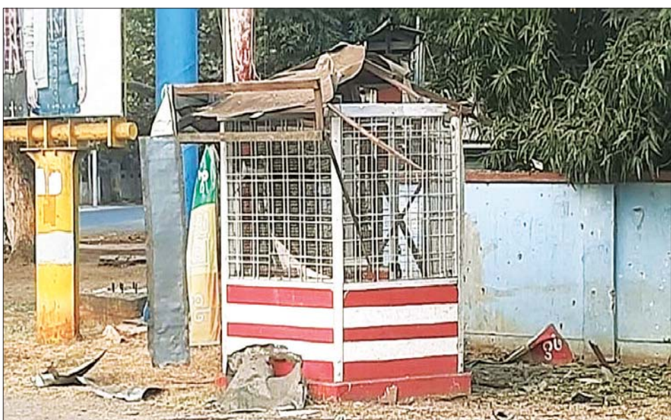
၂၀၂၃ ခုနှစ် ဖေဖော်ဝါရီ ၁ ရက်တွင် မုံရွာမြို့ အလယ်ရပ်ကွက် ပြည်ထောင်စုလမ်းနှင့် ကျောက္ကာလမ်းထောင့်ရှိ ယာဉ်ထိန်းရုံအား လက်လုပ်မိုင်းဖြင့် ဖောက်ခွဲခဲ့သည့် မှတ်တမ်းဓာတ်ပုံ။