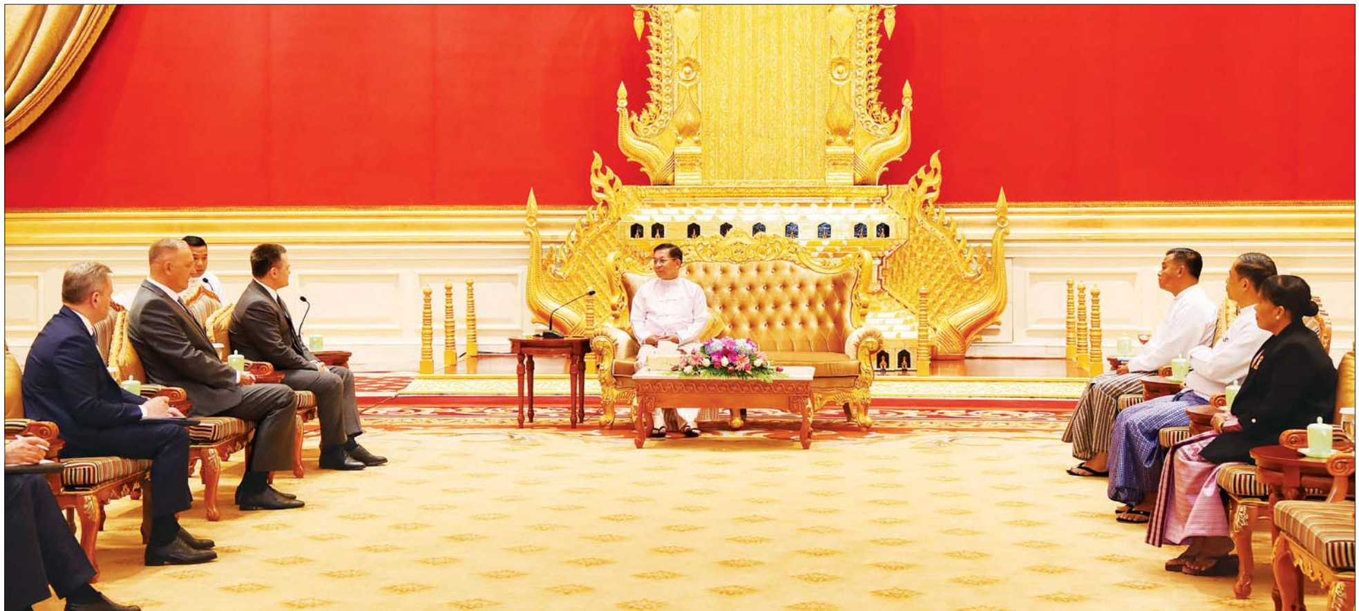
နိုင်ငံတော်စီမံအုပ်ချုပ်ရေးကောင်စီဥက္ကဋ္ဌ နိုင်ငံတော်ဝန်ကြီးချုပ် ဗိုလ်ချုပ်မှူးကြီး မင်းအောင်လှိုင် ရုရှားဖက်ဒရေးရှင်းနိုင်ငံ ရှေ့နေချုပ် H.E. Mr. Igor Krasnov ဦးဆောင်သည့် ကိုယ်စားလှယ်အဖွဲ့အား လက်ခံတွေ့ဆုံစဉ်။