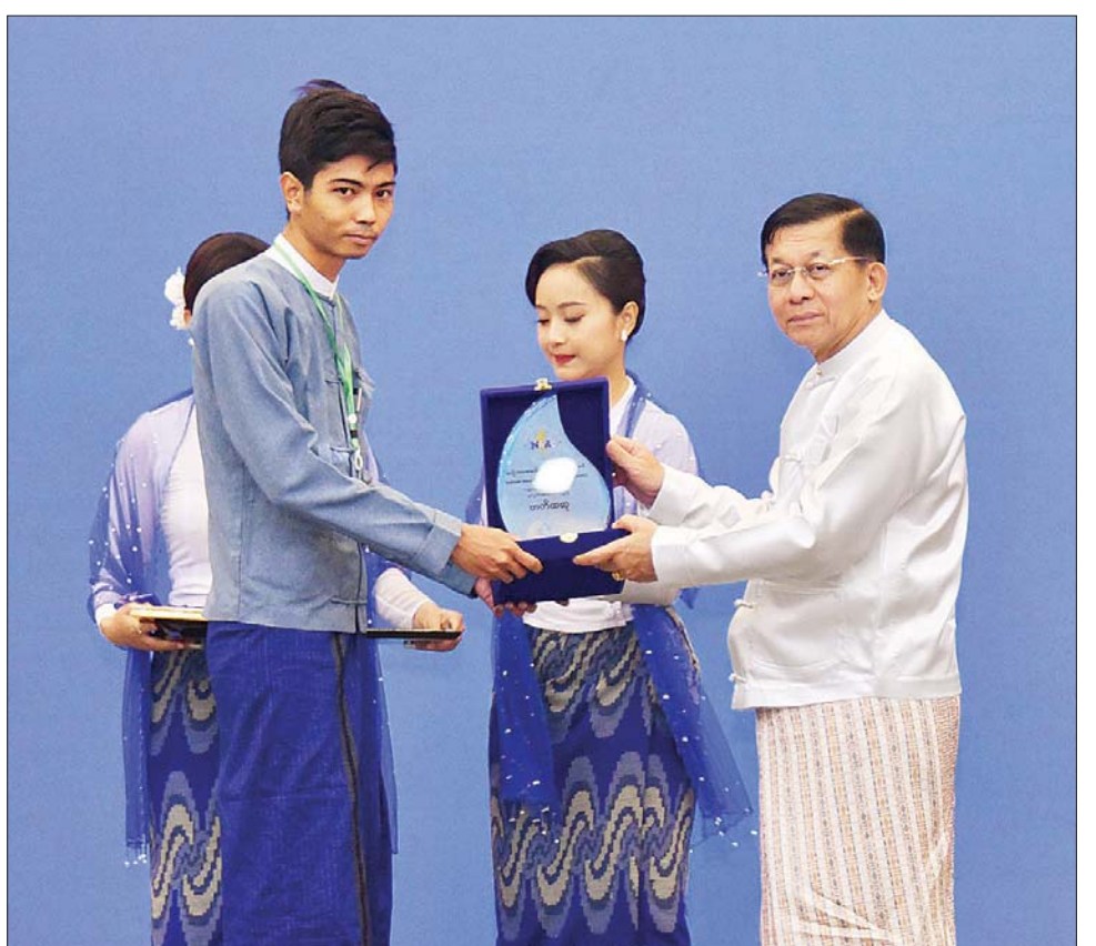
နိုင်ငံတော်စီမံအုပ်ချုပ်ရေးကောင်စီဥက္ကဋ္ဌ နိုင်ငံတော်ဝန်ကြီးချုပ် ဗိုလ်ချုပ်မှူးကြီး မင်းအောင်လှိုင် ကမ္ဘာ့ရေနေ့ ၂၀၂၃ အထိမ်းအမှတ်ဆောင်းပါးပြိုင်ပွဲတွင် ဆုရရှိသူတစ်ဦးအား ဆုပေးအပ်ချီးမြှင့်စဉ်။

“ရေအသက်တစ်မနက်” ဆိုသည့် စကားနှင့်အညီ ရေသည်လူများ၏အသက်တမျှအဓိကကျပါကြောင်း၊ ရေလိုလောက်စွာမရရှိပါက လူသားများ၏ စားဝတ်