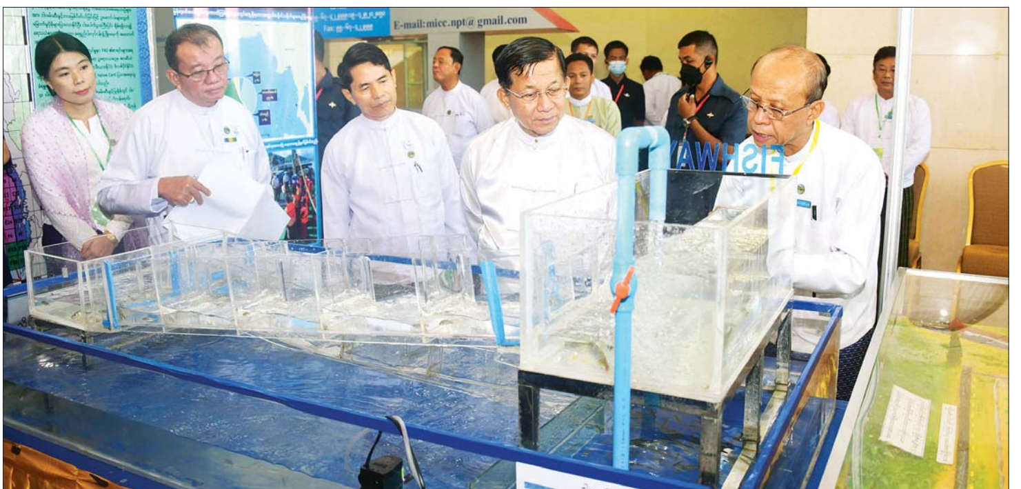
နိုင်ငံတော်စီမံအုပ်ချုပ်ရေးကောင်စီဥက္ကဋ္ဌ နိုင်ငံတော်ဝန်ကြီးချုပ် ဗိုလ်ချုပ်မှူးကြီး မင်းအောင်လှိုင်နှင့်အဖွဲ့ဝင်များ ကမ္ဘာ့ရေနေ့ ၂၀၂၃ အထိမ်းအမှတ်ပြခန်းအား လှည့်လည်ကြည့်ရှုစဉ်။

တာဝန်တစ်ရပ်အဖြစ် ဦးစားပေး ဆောင်ရွက်သွားရ မည် ဖြစ်ပါကြောင်း။