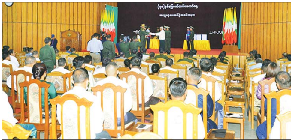
စိုးမင်းဦး က ကျေးဇူးတင်စကား ပြန်လည်ပြောကြားသည်။ ဂုဏ်ပြုအလှူငွေ ပေးအပ်လှူဒါန်းပွဲအပြီးတွင် တပ်မတော်နေ့ ကျင်းပရေးဦးစီးကော်မတီဥက္ကဋ္ဌ ညိုနှိုင်းကွပ်ကဲရေးမှူး (ကြည်း၊ ရေ၊ လေ) ဗိုလ်ချုပ်ကြီး မောင်မောင်အေးနှင့် အဖွဲ့ဝင်များက တက်ရောက်လာကြသူများကို ရင်းရင်းနှီးနှီးလိုက်လံနှုတ်ဆက်ခဲ့ကြကြောင်း သတင်းရရှိသည်။ သတင်းစဉ်

ဦးစွာ (၇၈)နှစ်မြောက် တပ်မတော်နေ့ကို ဂုဏ်ပြုကြိုဆိုသောအားဖြင့် ကုမ္ပဏီ ၁၆၃ ခုနှင့် စေတနာရှင် အလှူရှင်များက ဂုဏ်ပြုအလှူငွေ စုစုပေါင်း ငွေကျပ် ၁၁၃၂၇၈၀၀၀ နှင့် အမေရိကန်ဒေါ်လာ ၂၅၀၀ တို့ကို ပေးအပ်လှူဒါန်းကြရာ စစ်ရေးချုပ် ဒုတိယဗိုလ်ချုပ်ကြီး စိုးမင်းဦး၊ တပ်မတော်နေ့ကျင်းပရေးစီမံခန့်ခွဲမှုကော်မတီဥက္ကဋ္ဌ နေပြည်တော်တိုင်းစစ်ဌာနချုပ် တိုင်းမှူး ဗိုလ်ချုပ် ဇော်ဟိန်း၊ တပ်မတော်နေ့ စစ်ရေးပြလုပ်ငန်းအဖွဲ့ဥက္ကဋ္ဌ ဒုတိယ တပ်မတော်လေ့ကျင့်ရေးအရာရှိချုပ် ဗိုလ်ချုပ် ကိုလေး၊ တပ်မတော်နေ့ စစ်ရေးပြမှူးကြီး ဗိုလ်ချုပ် မြင့်ကျော်ထွန်းတို့က လက်ခံရယူပြီး ဂုဏ်ပြုမှတ်တမ်းလွှာများ ပြန်လည်ပေးအပ်ကြသည်။ ထို့နောက် အလှူရှင်များကိုယ်စား အလှူရှင် တစ်ဦးက လှူဒါန်းရခြင်းနှင့် ပတ်သတ်၍ ရှင်းလင်း ပြောကြားပြီး စစ်ရေးချုပ် ဒုတိယဗိုလ်ချုပ်ကြီး