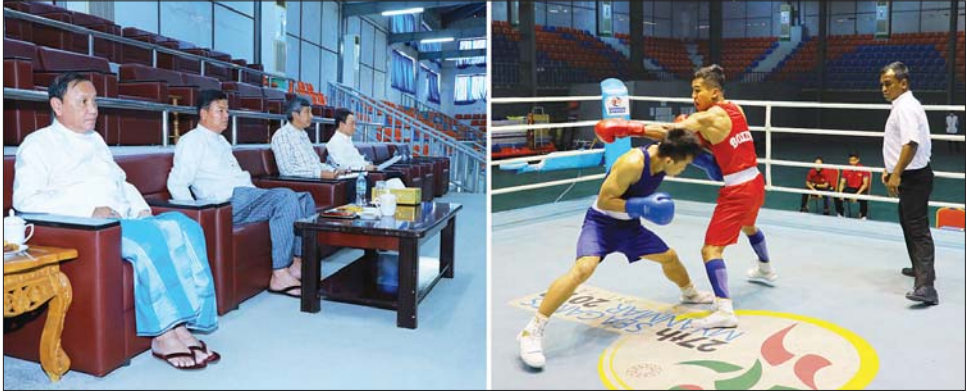
ပြောကြားသည်။ (လက်ရည်စမ်း) လက်ဝှေ့ပြိုင်ပွဲတွင် ဝိတ်တန်း အလိုက် အမျိုးသားပွဲစဉ်များအဖြစ် ၅၁/၅၄ ကီလို တန်း၊ ၅၇/၆၀ ကီလိုတန်း၊ ၆၃ ဒဿမ ၅ ကီလိုတန်း၊ ၆၇/၈၀ ကီလိုတန်း ပွဲစဉ် လေးပွဲနှင့် အမျိုးသမီးပွဲစဉ် ၅၄/၅၇ ကီလိုတန်းတို့တွင် အားကစားသမား ၁၀ ဦး ဝင်ရောက်ယှဉ်ပြိုင်ခဲ့ကြပြီး ယင်းပြိုင်ပွဲမှတစ်ဆင့် အားကစားသမားများ၏ စွမ်းရည်ပေါ်မူတည်၍ လာမည့် ဆီးဂိမ်းပြိုင်ပွဲအတွက် နိုင်ငံ့ကိုယ်စားပြု အားကစားသမားများ ရွေးချယ်သွားမည်ဖြစ်ကြောင်း သိရသည်။

သည် အထူးအရေးကြီးကြောင်း၊ ကျန်းမာရေး ကောင်းမွန်မှု မိမိတို့၏ အရည်အသွေး၊ အစွမ်းအစ များကို ဖော်ထုတ်ပြသနိုင်မည်ဖြစ်ကြောင်း၊ သွားလာ နေထိုင်စားသောက်မှုများကို အထူးဂရုစိုက်ကြရန် လိုကြောင်း၊ လေ့ကျင့်မှုများပြုလုပ်ရာတွင် ထိခိုက် ဒဏ်ရာမရရှိစေရန်နှင့် လေ့ကျင့်မှုလွန်ခြင်းများ မဖြစ်စေရန် နည်းပြများ၏ သင်ကြားပြသလေ့ကျင့် ပေးမှုအတိုင်း စနစ်တကျ လိုက်နာလေ့ကျင့်သွားကြ ရန်လိုကြောင်း၊ နည်းပြများအနေဖြင့်လည်း အားကစား သမားများ၏ လိုအပ်ချက်များကို ဖြည့်ဆည်းဆောင် ရွက်ပေးနိုင်ရေးအတွက် တာဝန်ရှိသူများထံ အချိန် နှင့်တစ်ပြေးညီ တင်ပြဆောင်ရွက်သွားရန်လို ကြောင်း၊ နိုင်ငံတော်မှ အားထားရသည့် နိုင်ငံ့ဂုဏ် ဆောင် အားကစားသမားကောင်းများဖြစ်အောင် မလျော့သော ဇွဲ လုံ့လ၊ စိတ်ဓာတ်တိုးမြှင့် အစွမ်းကုန် ကြိုးစားလေ့ကျင့်သွားကြရန် တိုက်တွန်းပါကြောင်း