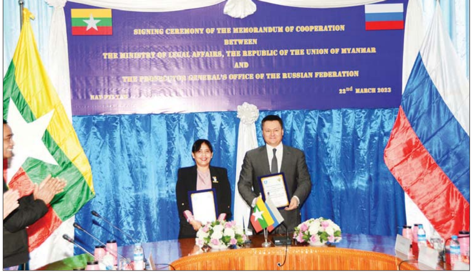
ဥပဒေရေးရာဝန်ကြီးဌာနနှင့် ရုရှားဖက်ဒရေးရှင်းနိုင်ငံ ရှေ့နေချုပ်ရုံးတို့အကြား ပူးပေါင်းဆောင်ရွက်ရေး နားလည်မှုစာချုပ်လွှာကို ပြည်ထောင်စုဝန်ကြီးနှင့် ပြည်ထောင်စုရှေ့နေချုပ် ဒေါက်တာသီတာဦးနှင့် ရုရှား ဖက်ဒရေးရှင်းနိုင်ငံ ရှေ့နေချုပ် Mr.Igor KRASNOV တို့ လက်မှတ်ရေးထိုးစဉ်။

သီတာဦး တက်ရောက်စဉ် H.E.Mr. Konstantin Chuy Chenko နှင့် တွေ့ဆုံ၍ နှစ်နိုင်ငံအကြား ဥပဒေ ရေးရာပူးပေါင်းဆောင်ရွက်ရန် ညှိနှိုင်းဆွေးနွေးခဲ့မှု အရ Memorandum of Cooperation နှစ်စုံကို ရုရှား ဖက်ဒရေးရှင်းနိုင်ငံ တရားရေးဝန်ကြီးဌာနနှင့် သော်လည်းကောင်း၊ ရုရှားဖက်ဒရေးရှင်းနိုင်ငံ ရှေ့နေချုပ်ရုံးနှင့်သော်လည်းကောင်း လက်မှတ် ရေးထိုးနိုင်ရန် ဆောင်ရွက်ခဲ့ခြင်း၏ နောက်ဆက်တွဲ ရလဒ်ဖြစ်သည်။