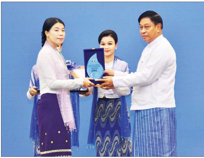
ဒုတိယ ဝန်ကြီးချုပ်နှင့် ပြည်ထောင်စု ဝန်ကြီး ဗိုလ်ချုပ်ကြီး တင်အောင်စန်း ကမ္ဘာ့ရေနေ့ အထိမ်းအမှတ် ဆောင်းပါး ပြိုင်ပွဲတွင် နှစ်သိမ့်ဆု ရရှိသူအား ဆုပေးအပ် ချီးမြှင့်စဉ်။

ထိုနေ့က နိုင်ငံတော်စီမံအုပ်ချုပ်ရေးကောင်စီ ဥက္ကဋ္ဌ နိုင်ငံတော်ဝန်ကြီးချုပ်နှင့် အခမ်းအနားတက် ရောက်လာကြသူများသည် ကမ္ဘာ့ရေနေ့ ၂၀၂၃ အထိမ်းအမှတ်ပြခန်းများအတွင်း လှည့်လည်ကြည့်ရှုကြသည်။ ကမ္ဘာ့ရေနေ့ ၂၀၂၃ အခမ်းအနားကို နိုင်ငံတော်၏ ရေနှင့်ဆက်သွယ်သည့် ဝန်ကြီးဌာနများ၊ အဖွဲ့အစည်းများ၏ ရေကဏ္ဍနှင့်သက်ဆိုင်သည့် ဆောင်ရွက်ချက်များ၊ ရေဆိုင်ရာအခက်အခဲပြဿနာများ၊ ဖြေရှင်းရန် နည်းလမ်းများကို အများသိရှိသတိပြုစေရန်၊ ရေနှင့်ဆက်သွယ်သက်ဆိုင်သူများအား အသိပညာပေးရန်နှင့် ပူးပေါင်းဆောင်ရွက်ရေးအတွက် လှုံ့ဆော်ရန်၊ ရေနှင့်ဆက်သွယ်သည့် နိုင်ငံတကာလှုပ်ရှားဆောင်ရွက်မှုများတွင် မြန်မာနိုင်ငံ၏ အလေးထားပါဝင် ဆောင်ရွက်မှုကို ပေါ်လွင်စေရန် စသည့် ဦးတည်ချက် ၃ ရပ်ဖြင့် ကျင်းပပြုလုပ်ခဲ့ခြင်းဖြစ်ကြောင်း သတင်းရရှိသည်။