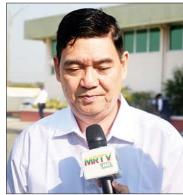
ဦးထိန်လင်း (ရခိုင်ပြည်နယ်ဝန်ကြီးချုပ်)