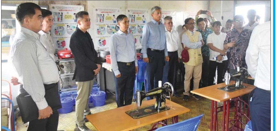
ပြည်ထောင်စုဝန်ကြီး ဦးကိုကိုလှိုင်နှင့် အဖွဲ့ဝင်များ ငါးခုရပြန်လည်လက်ခံရေးစခန်း၌ ပြန်လည်လက်ခံရေး ဆောင်ရွက်ထားရှိမှုအခြေအနေများနှင့် လှဖိုးခေါင်ယာယီလက်ခံရေးစခန်း၌ ပြန်လည်ဝင်ရောက်လာမည့် သူများအတွက် ပြင်ဆင်ဆောင်ရွက်ထားမှုအခြေအနေများကို လှည့်လည်ကြည့်ရှုကြစဉ်။