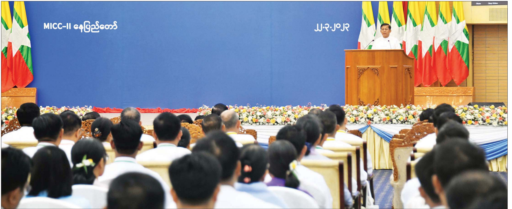
နိုင်ငံတော်စီမံအုပ်ချုပ်ရေးကောင်စီဥက္ကဋ္ဌ နိုင်ငံတော်ဝန်ကြီးချုပ် ဗိုလ်ချုပ်မှူးကြီး မင်းအောင်လှိုင် ကမ္ဘာ့ရေနေ့ ၂၀၂၃ အခမ်းအနားတွင် အမှာစကားပြောကြားစဉ်။