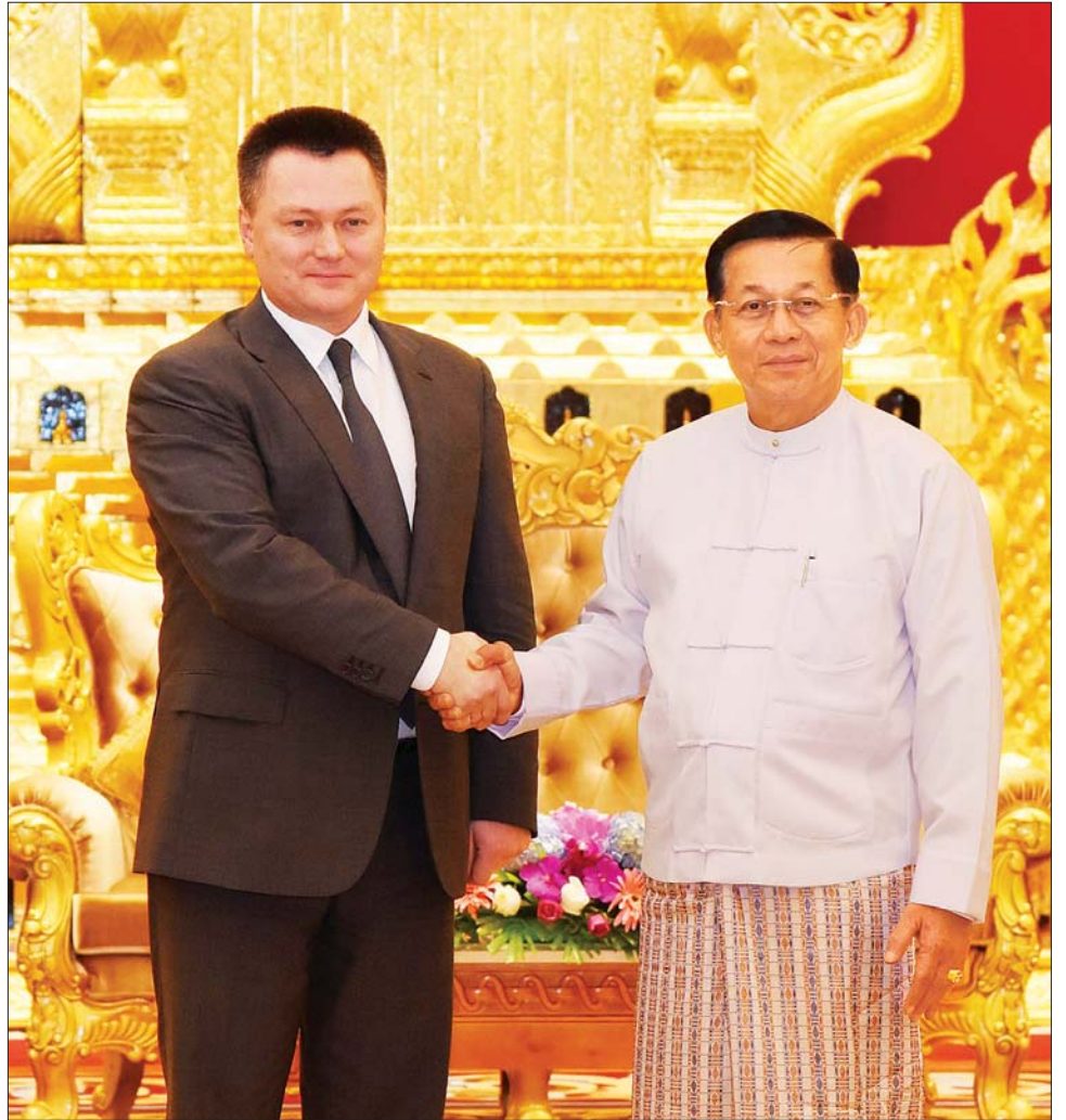
နိုင်ငံတော်စီမံအုပ်ချုပ်ရေးကောင်စီဥက္ကဋ္ဌ နိုင်ငံတော်ဝန်ကြီးချုပ် ဗိုလ်ချုပ်မှူးကြီး မင်းအောင်လှိုင်နှင့် ရုရှားဖက်ဒရေးရှင်းနိုင်ငံ ရှေ့နေချုပ် H.E. Mr. Igor Krasnov အား ရင်းနှီးနှီးနှီးဆက်ဆံစဉ်။