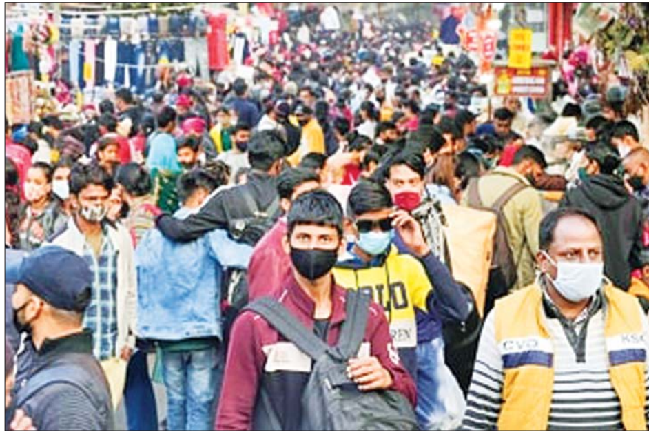
နယူးဒေလီမြို့ ဆာရိုဂျီနီနာဂါဈေး၌ ပါးစပ်နှာခေါင်းစည်း တပ်ဆင်ကာ သွားလာနေကြသူများ။

အိန္ဒိယနိုင်ငံ၏ အချို့နေရာအစိတ်အပိုင်းများတွင် တုပ်ကွေးရောဂါဖြစ်ပွားမှုများလည်း များပြားလျက်ရှိသည်။ အဆိုပါ တုပ်ကွေးရောဂါ၏ ရောဂါလက္ခဏာများမှာ ကိုဗစ် - ၁၉ ရောဂါလက္ခဏာနှင့် ဆင်တူနေသည်။ လူနာများမှာ ကာလရှည်ကြာဖျားနာခြင်း၊ ချောင်းဆိုးခြင်း၊ အဖျားနှင့် အသက်ရှူလမ်းကြောင်းဆိုင်ရာ ပြဿနာများနှင့် ကြုံတွေ့နေရသည်ဟု ညည်းတွားနေကြသည်။ ဆင်ဟွာ