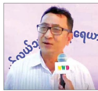
ဒေသခံပြည်သူများ

ကြီးကို လုပ်ပေးတဲ့အတွက် အလွန်ကို ကျေးဇူးတင်မိတယ်။ အဲဒါကြောင့် နှစ်စဉ် နှစ်တိုင်းလာစေချင်တယ်။ သူတို့ကိုလည်း သားသမီးချင်း၊ ညီအစ်ကို မောင်နှမ များကိုယ်ချင်းစာမိတယ်။ သူတို့တွေ လည်း အလွန်ပင်ပန်းရာကြတယ်။ သူတို့ လုပ်ရတာ လူနာတွေကလည်းများတော့ လွယ်တာမဟုတ်ဘူး။ ဒါပေမယ့် သူတို့တွေ မျက်နှာတစ်ချက်မညှိုးဘူး။ ပြုံးပြုံးရွှင်ရွှင် ပဲ။ ဒီလိုစိတ်ထားတွေဖြစ်အောင် ဘယ်လို များ ပြုစုပျိုးထောင်ထားသလဲ မသိဘူး။ ငါ့သား/သမီးသာ ဖြစ်လိုက်ချင်တယ်။ ငါ့တူလေး၊ ငါ့ညီလေးသာ ဖြစ်လိုက်ချင် တယ်လို့ စိတ်ထဲမှာခံစားရမိတယ်။ အဲဒါ ကြောင့် အခုလာရောက် ဆေးကုသပေး တဲ့အဖွဲ့တွေကို လိုက်လှိုက်လှိုက်လှိုက် ကျေးဇူး တင်ကြောင်း မြေပုံမြို့နယ်သူ/ မြို့နယ် သားတွေ ကိုယ်စားကျေးဇူးတင်ကြောင်း ပြောလိုပါတယ်။ စီစဉ်ပေးတဲ့ နိုင်ငံတော် အကြီးအကဲကိုလည်း ကျေးဇူးတင်ပါတယ်။ နောက်နောင်ကိုလည်း အခုလိုစီစဉ် ပေးစေချင်ပါတယ်လို့ ပြောလိုပါတယ်။ ကျွန်တော်တို့မြို့နယ်က အမြဲတမ်း လက်ကမ်းကြိုဆိုလျက်ပါလို့ ပြောလိုပါ တယ်။