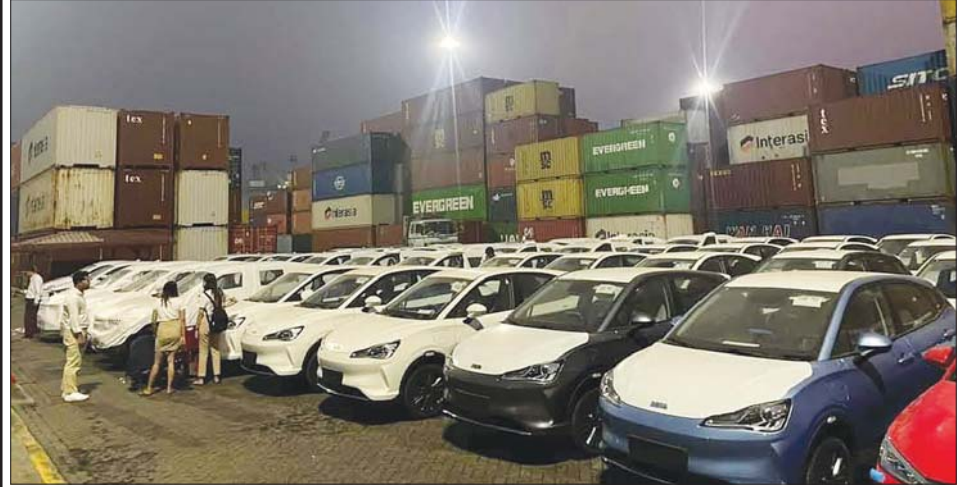
ရန်ကုန်မြို့၊ ထီးတန်းဆိပ်ကမ်းသို့ မတ် ၄ ရက်က ရောက်ရှိလာသော လျှပ်စစ်သုံးမော်တော်ယာဉ်များ။

မကြာသောကာလတွင် မြန်မာနိုင်ငံ၏ လမ်းမများပေါ်တွင် လျှပ်စစ်သုံးမော်တော်ယာဉ်များ ပျားပန်းခပ်မျှ ပြေးလွှားနေကြ၍ ဓာတ်အားဖြည့်သွင်းရုံများလည်း မြို့များ၊ လမ်းများ၊ ဈေးဆိုင်ကြီးများ၊ ဟိုတယ်များ၊ စားသောက်ဆိုင်များတွင် မှီလိုပေါက်၍နေကြမည်ကို မြင်ယောင်ရင်း နိုင်ငံတော်စီမံအုပ်ချုပ်ရေးကောင်စီ အစိုးရ၏ ဂုဏ်ယူဖွယ်ရာ မှတ်တမ်းတင်အောင်ပွဲတစ်ခုဖြစ်ပါကြောင်းနှင့် ၂၀၂၃ ခုနှစ် မတ် ၂၇ ရက်တွင် ကျရောက်မည့် (၇၈)နှစ်မြောက် တပ်မတော်နေ့ကို ဤဆောင်းပါးဖြင့် ဂုဏ်ပြုကြိုဆို တင်ပြလိုက်ပါသည်။ မြန်မာနိုင်ငံ Automotive Industry ကြီး Good Luck ပါခင်ဗျား။ ။