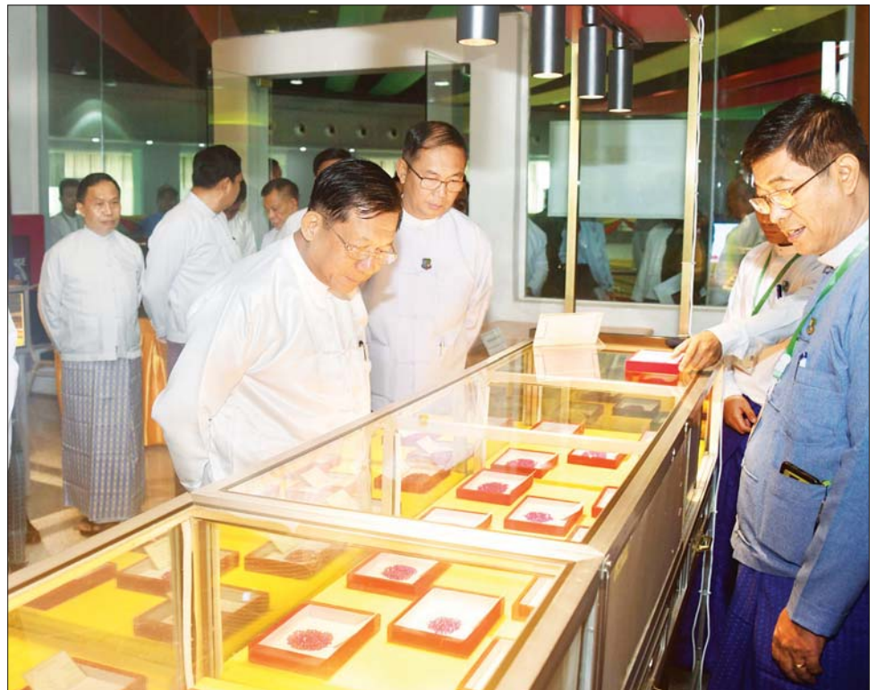
နိုင်ငံတော်စီမံအုပ်ချုပ်ရေးကောင်စီဥက္ကဋ္ဌ နိုင်ငံတော်ဝန်ကြီးချုပ် ဗိုလ်ချုပ်မှူးကြီး မင်းအောင်လှိုင်နှင့်အဖွဲ့ဝင်များ ပုဂ္ဂလိက ကျောက်မျက်ရတနာအချောထည် အရောင်းပြခန်းများ ဖွင့်လှစ်ရောင်းချနေမှုကို လိုက်လံ ကြည့်ရှုအားပေးစဉ်။

၂ ရှေ့ဖုံးမှ ကျောက်မျက် လုပ်ငန်းရှင်များ အသင်းမှ တာဝန်ရှိသူများနှင့် ဖိတ်ကြားထားသူများ၊ ပြည်တွင်း၊ ပြည်ပမှ ကျောက်မျက်လုပ်ငန်းရှင် များ တက်ရောက်ကြသည်။