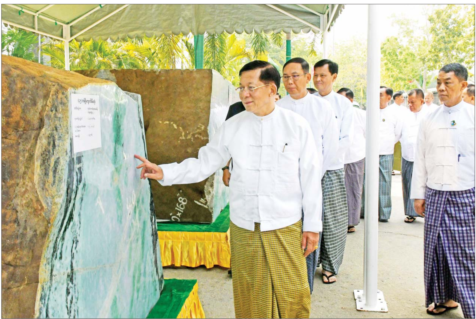
နိုင်ငံတော်စီမံအုပ်ချုပ်ရေးကောင်စီဥက္ကဋ္ဌ နိုင်ငံတော်ဝန်ကြီးချုပ် ဗိုလ်ချုပ်မှူးကြီး မင်းအောင်လှိုင်နှင့်အဖွဲ့ဝင်များ ခန်းမအပြင်ဘက်တွင် ခင်းကျင်းပြသထားသည့် ကျောက်စိမ်းတုံးကြီးများကို ကြည့်ရှုစစ်ဆေးစဉ်။

နေပြည်တော် မတ် ၁၇ ၂၀၂၃ ခုနှစ် (၅၈)ကြိမ်မြောက် မြန်မာ့ကျောက်မျက်ရတနာ ပြပွဲ ဖွင့်ပွဲအခမ်းအနားကို ယနေ့ နံနက်ပိုင်းတွင် နေပြည်တော်ရှိ မဏိရတနာ ကျောက်စိမ်းခန်းမ၌ ကျင်းပရာ နိုင်ငံတော်စီမံအုပ်ချုပ်ရေးကောင်စီဥက္ကဋ္ဌ နိုင်ငံတော်ဝန်ကြီးချုပ် ဗိုလ်ချုပ်မှူးကြီး မင်းအောင်လှိုင် တက်ရောက် ချီးမြှင့်သည်။ အခမ်းအနားသို့ နိုင်ငံတော်စီမံအုပ်ချုပ်ရေးကောင်စီ ဥက္ကဋ္ဌ နိုင်ငံတော် ဝန်ကြီးချုပ်နှင့်အတူ ကောင်စီတွဲဖက် အတွင်းရေးမှူး ဒုတိယဗိုလ်ချုပ်ကြီး ရဲဝင်းဦး၊ ကောင်စီဝင်များ ဖြစ်ကြသည့် ဗိုလ်ချုပ်ကြီး တင်အောင်စန်း၊ ဒုတိယဗိုလ်ချုပ်ကြီး မိုးမြင့်ထွန်း၊ ဒုတိယဗိုလ်ချုပ်ကြီး စိုးထွန်း၊ ဒုတိယဗိုလ်ချုပ်ကြီး ရာပြည့်၊ ဦးမောင်ကို၊ ဦးရွှေကြိမ်း၊ ပြည်ထောင်စုဝန်ကြီးများနှင့် ပြည်ထောင်စုအဆင့် ပုဂ္ဂိုလ်များ၊ နေပြည်တော်ကောင်စီ ဥက္ကဋ္ဌ၊ ကာကွယ်ရေးဦးစီးချုပ်ရုံးမှ တပ်မတော် အရာရှိကြီးများ၊ နေပြည်တော်တိုင်း စစ်ဌာနချုပ် တိုင်းမှူး၊ ဌာနဆိုင်ရာများမှ တာဝန်ရှိသူများ၊ မြန်မာနိုင်ငံ စာမျက်နှာ ၃ ကော်လံ ၁