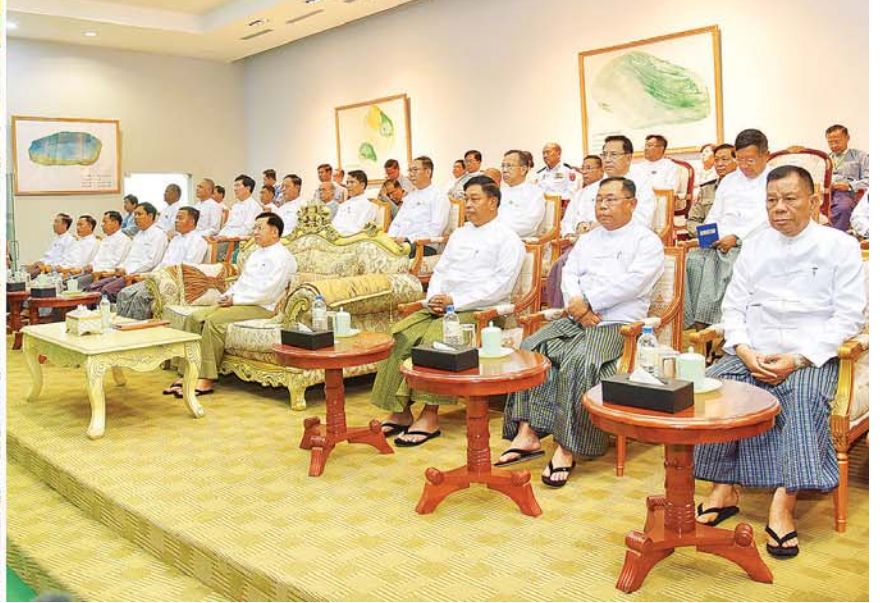
နိုင်ငံတော်စီမံအုပ်ချုပ်ရေးကောင်စီဥက္ကဋ္ဌ နိုင်ငံတော်ဝန်ကြီးချုပ် ဗိုလ်ချုပ်မှူးကြီး မင်းအောင်လှိုင်နှင့်အဖွဲ့ဝင်များ ၂၀၂၃ ခုနှစ် (၅၈) ကြိမ်မြောက် မြန်မာ့ကျောက်မျက်ရတနာပြပွဲအခမ်းအနား ကျင်းပနိုင်ရေး ပြင်ဆင်ဆောင်ရွက်ခဲ့မှု ဗီဒီယိုမှတ်တမ်းကို ကြည့်ရှုစဉ်။