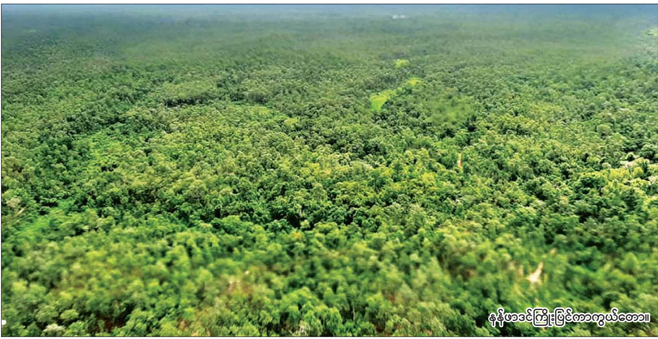
နန်ဖာဒင်ကြိုးဖြင့်ကာကွယ်တော။