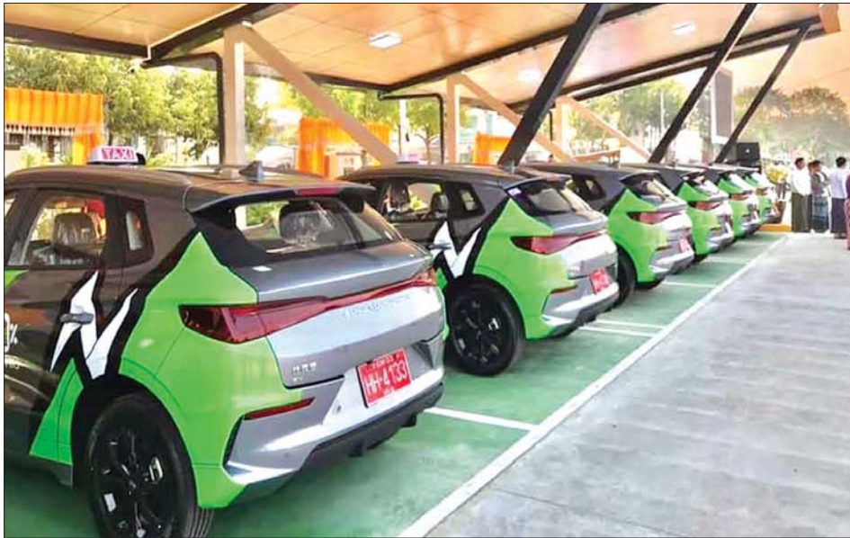
နေပြည်တော်၌ ပထမဆုံးဖွင့်လှစ်သော လျှပ်စစ်သုံးယာဉ်များအတွက် ဓာတ်အားဖြည့်သွင်းရုံ။

မြန်မာနိုင်ငံ၏ ပထမဆုံးသော လျှပ်စစ်ဓာတ်အား ဖြည့်သွင်းရုံ