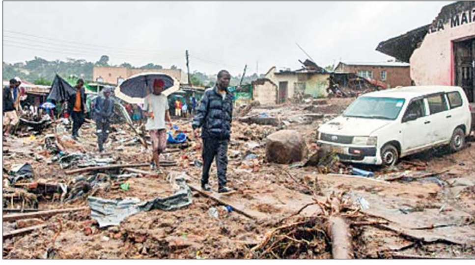
ဆိုင်ကလုန်းမုန်တိုင်း ဖရက်ဒီကြောင့် မိုးသည်းထန်စွာရွာသွန်းပြီး ထိခိုက်ပျက်စီးမှု။

သေဆုံးသူစုစုပေါင်းမှာ ၂၅၅ ဦးမှ ၃၂၆ ဦးအထိ တိုးလာပြီး ထိခိုက်ဒဏ်ရာ ရရှိသူအရေအတွက်မှာ ၂၀၁ ဦးနှင့် ပျောက်ဆုံးနေသူဦးရေမှာ ၇၉၆ ဦးအထိ တိုးမြင့်လာကြောင်း မာလာဝီ သမ္မတ လာဇာရပ်စ် ချောဝီရာက ပြောကြားသည်။ ရွှေ့ပြောင်းအိမ်ထောင်စု ၄၀၇၀၂ စုနှင့် ပြောင်းရွှေ့နေထိုင်သူအရေအတွက်မှာ ၁၈၃၁၅၉ ဦးရှိကြောင်း သမ္မတက ပြောကြားသည်။