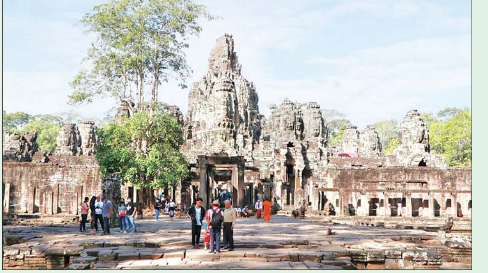
ကမ္ဘောဒီးယားနိုင်ငံ ဆီအန်ရီပြည်နယ်ရှိ ဘောရွန်ဘုရားကျောင်းတွင် ခရီးသွားများ လာရောက်လည်ပတ် နေသည်ကို တွေ့ရစဉ်။