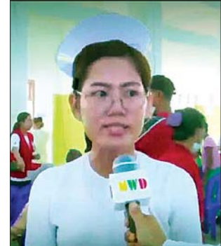
ဒေသခံပြည်သူများ။

ဖြစ်နိုင်ရင် ဒီနေရာကို ခဏခဏ လာစေချင်ပါတယ်။ နိုင်ငံတော် အကြီးအကဲကိုလည်း ခဏခဏ လွှတ်ပေးပါလို့ တောင်းဆိုချင်ပါတယ်။ ဒီလိုမျိုးအဆင်ပြေအောင် လာရောက်ကူညီပေးတဲ့ နိုင်ငံတော် အကြီးအကဲအား ကျန်းမာပါစေ၊ ချမ်းသာပါစေ၊ ဘေးရန်ဝေးကွာပါစေလို့ ဆုတောင်းပေးပါတယ်။ ဒီထက်မကလည်း ပြည်သူတွေကို ကာကွယ် စောင့်ရှောက်နိုင်ပါစေလို့ မေတ္တာပို့ ဆုတောင်းလိုက်ပါတယ်။” “ဒီက ကျန်းမာရေးဌာနမှာ တာဝန်ကျနေတဲ့ သားဖွားဆရာမ ပါ။ ဒီမာန်အောင်မြို့နယ်ရဲ့ ဒေသခံပါပဲ။ ဆရာတွေ လိုအပ်တဲ့ အရာတွေကို ကျွန်မတို့က ကူညီပြီး ပံ့ပိုးပေးပါတယ်။ အခုလို လာရောက်တဲ့အတွက် ကျွန်မတို့ အလွန်ပဲ ဝမ်းမြောက်ဂုဏ်ယူမိပါတယ်။ ဘာလို့လဲဆိုတော့ ကျွန်မတို့ မာန်အောင်မြို့နယ်က တခြားနေရာကသွားပြမယ်ဆိုရင် အလွန်မသွားနိုင်တဲ့သူလည်း အများကြီး ရှိတာပေါ့။ အဲဒီအချိန်မှာ ဒီလိုမျိုး လာပြီး ဆရာတို့က ဆေးကုပေးတော့ ဒေသခံတွေအတွက် အများကြီး အကျိုးထူးတွေ ရပါ