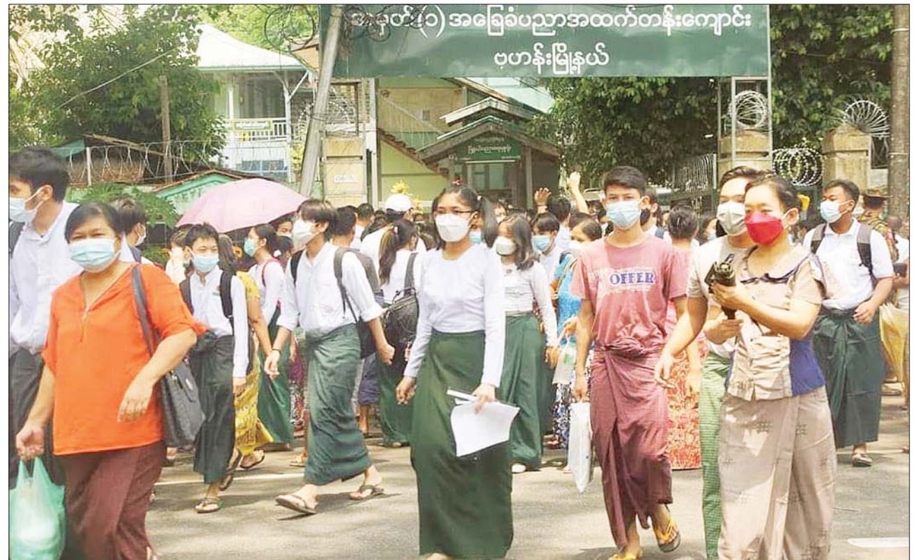
ရန်ကုန်တိုင်းဒေသကြီး ဗဟန်းမြို့နယ် အ.ထ.က(၁) စာစစ်ဌာနတွင် ၂၀၂၃ ခုနှစ် တက္ကသိုလ်ဝင်စာမေးပွဲ သင်္ချာဘာသာရပ်ကို အေးချမ်းစွာ ဖြေဆိုပြီးနောက် ပြန်လည်ထွက်လာသည့် ကျောင်းသား ကျောင်းသူများကို တွေ့ရစဉ်။

ယင်းသို့ ကျောင်းသား ကျောင်းသူများ စိတ်အေးချမ်းသာစွာ ဖြေဆိုနိုင်ရေးအတွက် ကျောင်းဝင်းအတွင်းနှင့် အပြင်များ၌ သက်ဆိုင်ရာ လုံခြုံရေးအဖွဲ့ဝင်များ၊ ကျန်းမာရေးဝန်ထမ်းများ၊ မီးသတ်တပ်ဖွဲ့ဝင်များနှင့် ရပ်ကွက်/ကျေးရွာအုပ်ချုပ်ရေး အဖွဲ့ဝင်များက စာမျက်နှာ ၃ ကော်လံ ၁