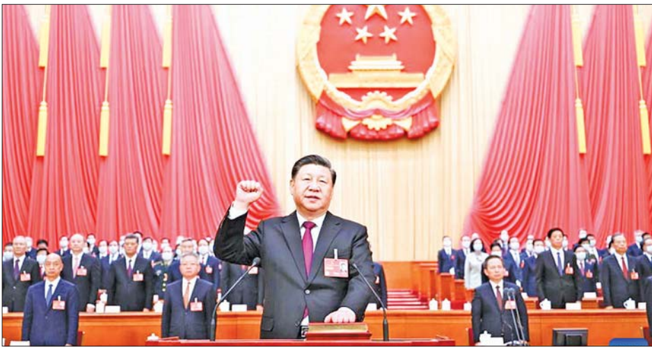
နိုင်ငံ့ခေါင်းဆောင်အဖြစ် တတိယအကြိမ် သမ္မတသက်တမ်းကို ရရှိခဲ့သော တရုတ်သမ္မတ ရှီကျင့်ဖျင်။

တရုတ်ပြည်သူ့သမ္မတ နိုင်ငံ သမ္မတ မစ္စတာရှီကျင့်ဖျင်သည် မတ် ၁၀ ရက်က ကျင်းပသော အမျိုးသားပြည်သူ့ကွန်ဂရက် တွင် နိုင်ငံ့ခေါင်းဆောင်အဖြစ် တတိယအကြိမ် သမ္မတ သက်တမ်းကို ရရှိခဲ့သည်။ ၎င်း၏ ပြန်လည်ရွေးချယ်ခံရမှု က ၎င်းကို ပါတီ၊ နိုင်ငံတော်နှင့် စစ်ဘက်ထိပ်တန်း နေရာများ တွင် ဆက်လက်တည်ရှိနေ စေရန် ခွင့်ပြုပေးလိုက်ပြီ ဖြစ် သည်။