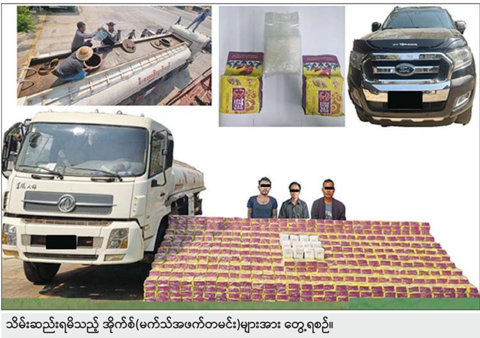
သိမ်းဆည်းရမိသည့် အိုက်စစ်(မက်သ်အဖက်တမင်း)များအား တွေ့ရစဉ်။