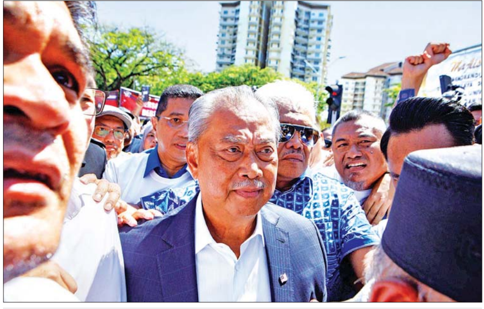
မလေးရှားဝန်ကြီးချုပ်ဟောင်း မူဟီဒင်ယက်ဆင်း။