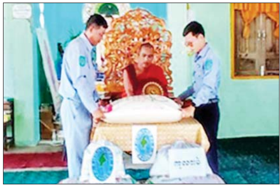
ပိဿာ၊ ဆား ၁၀ ပိဿာ စသည့်တို့က ထောက်ပံ့လှူဒါန်း ကြောင်း သိရသည်။