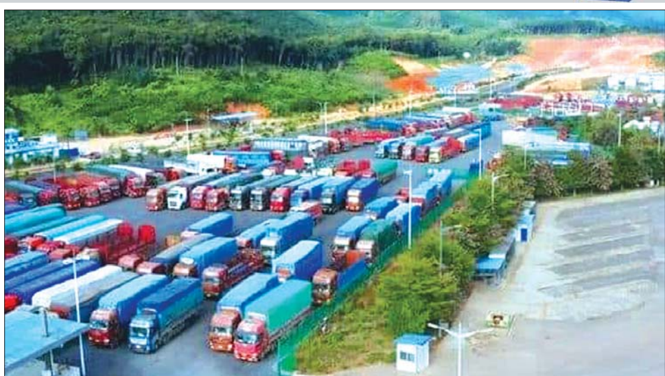
မြန်မာနိုင်ငံမှ တရုတ်နိုင်ငံသို့ ဝင်ရောက်မည့် ကုန်တင်ယာဉ်များကို ရွှေလီနယ်စပ်ဂိတ်၌ တွေ့ရစဉ်။

ယူနန်ပြည်နယ် ဖွံ့ဖြိုးတိုးတက်ရေးနှင့် တံခါးဖွင့်ပြုပြင်ပြောင်းလဲရေး ကော်မရှင်နှင့် ယူနန်ပြည်နယ် ကူးသန်းရောင်းဝယ်ရေး ဦးစီးဌာနတို့သည် ရင်းနှီးမြှုပ်နှံမှု ယွမ် ၃၆၉ သန်း စီစဉ်ကာ မောဟန်းနယ်စပ်ဂိတ်၊ ဟော်ခိုနယ်စပ်ဂိတ်နှင့် ရွှေလီနယ်စပ်