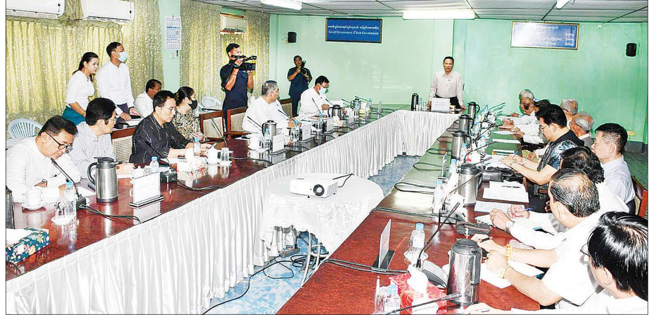
ပြည်ထောင်စုဝန်ကြီး ဦးမောင်မောင်အုန်း၊ မြန်မာ့ရုပ်ရှင်ထူးချွန်ဆုချီးမြှင့်ပွဲ အခမ်းအနားကျင်းပနိုင်ရေးအတွက် မြန်မာနိုင်ငံရုပ်ရှင်အစည်း အရုံးမှ တာဝန်ရှိသူများနှင့် တွေ့ဆုံဆွေးနွေးစဉ်။

ဖွဲ့စည်းနိုင်ရန်နှင့် ဂီတလောက ဖွံ့ဖြိုး တိုးတက်ရေးအတွက် ဆောင်ရွက်ရန် ဆွေးနွေးသည်။ တွေ့ဆုံစဉ် ပြည်ထောင်စု ဝန်ကြီးက မြန်မာနိုင်ငံဂီတအစည်း အရုံး(ဗဟို) ယာယီအမှုဆောင်အဖွဲ့ တာဝန်ယူ ဆောင်ရွက်ခဲ့ပြီးဖြစ် သည့် တစ်နှစ်ခွဲခန့်ကာလအတွင်း ဂီတလောကသားများ အတွက် သက်သာချောင်ချိရေး ကိစ္စရပ် များ စီစဉ်ဆောင်ရွက်ပေးမှုအပြင် အခက်အခဲများမရှိစေရေး ကိစ္စရပ် များ စီစဉ်ဆောင်ရွက်ပေးမှု၊ နိုင်ငံတော်အဆင့် အခမ်းအနား နှင့် ဖျော်ဖြေပွဲများတွင်လည်း တက်ကြွစွာ ပူးပေါင်းပါဝင် ဆောင်ရွက်ခဲ့သည်ကို တွေ့ရှိရပါ ကြောင်း၊ ယခုအခါ ဂီတလောက သားများအားလုံး ပါဝင်လာစေ လိုပြီး လုပ်ငန်းဆောင်တာများကို ပုံမှန်အခြေအနေ ဖြစ်အောင် ရဲရင့်ပုံ ပူးပေါင်းပါဝင်ဆောင်ရွက် ကြစေလိုပါကြောင်း၊ ဂီတလောက ဖွံ့ဖြိုးတိုးတက်ရေးအတွက် စီမံ ဆောင်ရွက်ခြင်းနှင့်အတူ အမှု ဆောင်အသစ်များ ပေါ်ပေါက်လာ စေရေးအတွက်လည်း ကြိုတင် ပြင်ဆင်လျာထား ဆောင်ရွက်ရန် ဖြစ်ပါကြောင်း ပြောကြားသည်။ ထို့နောက် မြန်မာနိုင်ငံဂီတအစည်း အရုံး(ဗဟို) ယာယီအမှုဆောင် အဖွဲ့ဥက္ကဋ္ဌ ဦးလွင်မြင့်နှင့် တာဝန် ရှိသူများက “ဂီတစွမ်းအား ပြည်ထွန်းကား” ဆောင်ပုဒ်နှင့် အညီ ဂီတလောကဖွံ့ဖြိုးတိုးတက် လာစေရေးအတွက် ရှေ့လုပ်ငန်း စဉ်များကို အကြံပြုဆွေးနွေး တင်ပြကြပြီး မြန်မာ့အသံနှင့် ရုပ်မြင်သံကြား ညွှန်ကြားရေးမှူး ချုပ်ဦးရဲနိုင်က လိုအပ်သည်များကို ဖြည့်စွက်ဆွေးနွေးတင်ပြသည်။