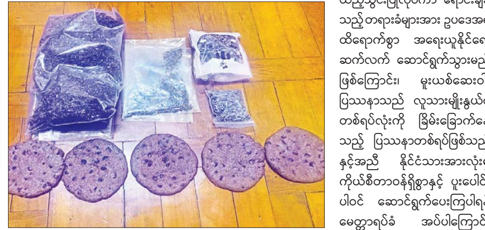
နေပြည်တော် မတ် ၉