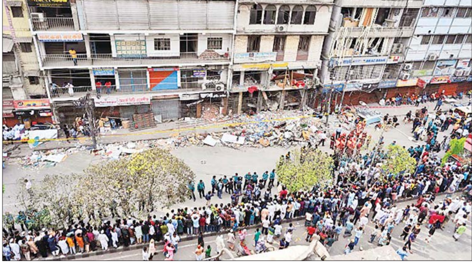
အဆောက်အအုံမီးလောင်ပေါက်ကွဲပြီးနောက် ပြိုကျပျက်စီးမှုများကို တွေ့ရစဉ်။

ဒေသစံတော်ချိန် ညနေ ၄ နာရီ ၄၅ မိနစ်ခန့်က ဖြစ်ပွားခဲ့ကြောင်း မီးသတ်တပ်ဖွဲ့က ထုတ်ပြန်ထားပြီး ဖြစ်စဉ်နှင့် ပတ်သက်၍ အဆောက်အအုံပိုင်ရှင် နှစ်ဦးအပါအဝင် လူသုံးဦးကို ထိန်းသိမ်းထားကြောင်း ဒါကာမြို့တော် ရဲဌာန၏ ဒုတိယကော်မရှင်နာကေအင်န် ရှိုင် နီယိုတီ က သတင်းထောက်များအား ပြောကြားသည်။ ဆင်ဟွာ