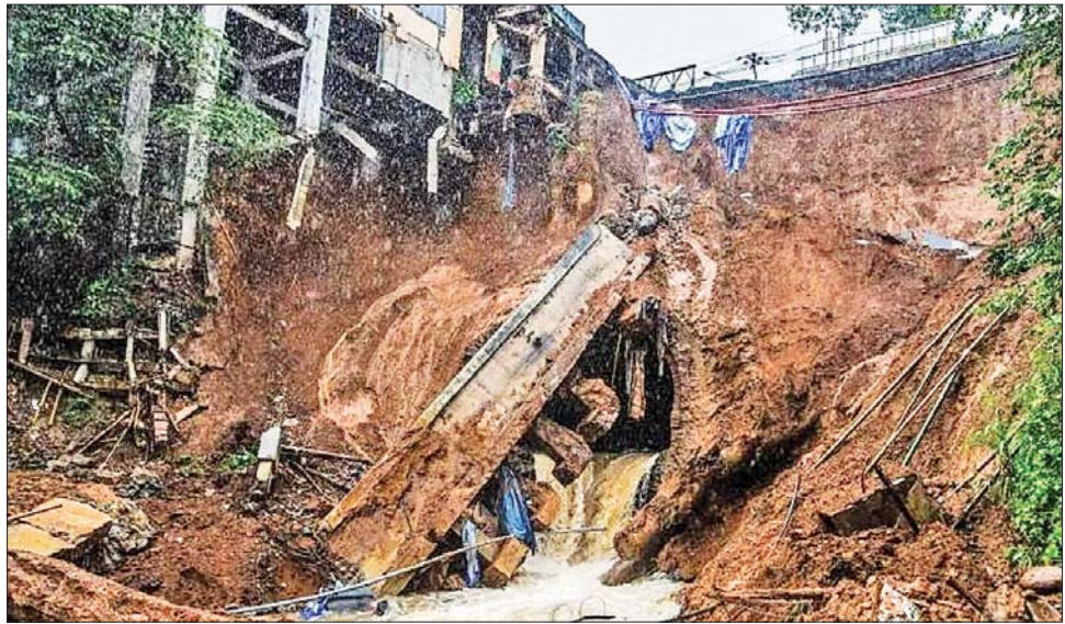
အင်ဒိုနီးရှားနိုင်ငံ အနောက်ပိုင်းပြည်နယ် ရီရယ်ကျွန်း၌ မြေပြိုမှုဖြစ်ပွားပြီးနောက် တွေ့ရစဉ်။