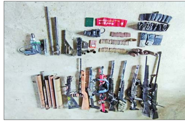
PDF အမည်ခံအကြမ်းဖက်သမားများထံမှ သိမ်းဆည်းရရှိသည့်ပစ္စည်းများ၏ မှတ်တမ်းဓာတ်ပုံ။

နေထိုင်နိုင်ရေးအတွက် လုံခြုံရေး တပ်ဖွဲ့များက နယ်မြေလုံခြုံရေး လုပ်ငန်းများ တိုးမြှင့်ဆောင်ရွက် လျက်ရှိကြောင်းနှင့် သိမ်းဆည်း ရမိခဲ့သည့် လက်နက်/ခဲယမ်းများ အား လုပ်ထုံးလုပ်နည်းများနှင့် အညီ ဆက်လက်ဆောင်ရွက်သွား မည်ဖြစ်ကြောင်း သတင်းရရှိ သည်။ သတင်းစဉ်