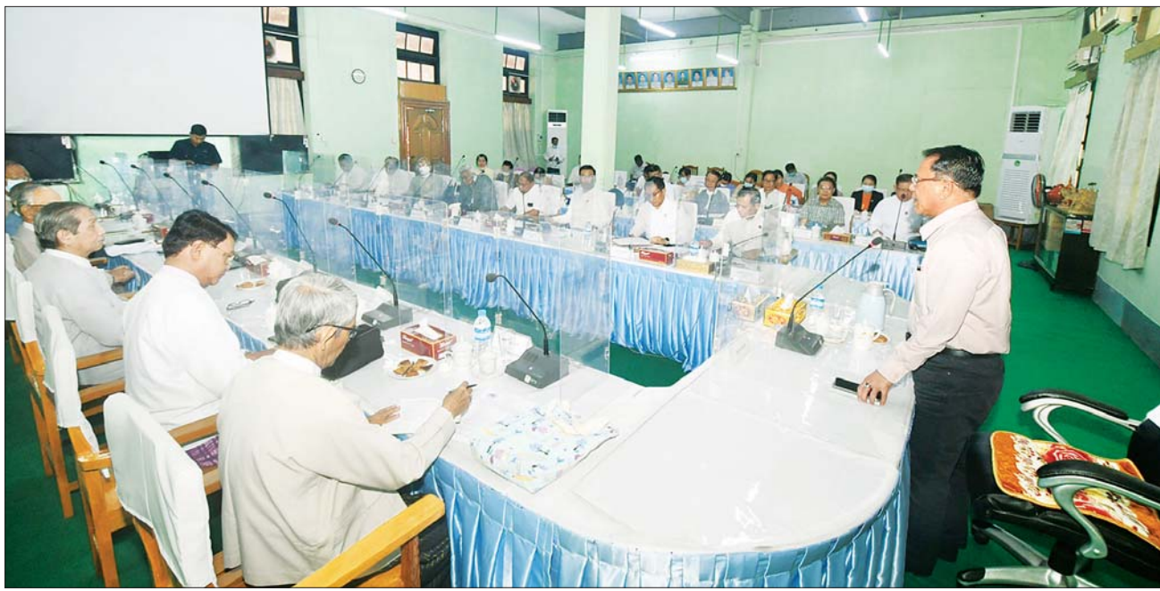
ပြည်ထောင်စုဝန်ကြီး ဦးမောင်မောင်အုန်း အမျိုးသားစာပေဆု စိစစ်ရွေးချယ်ရေးကော်မတီဝင်များ၊ စာပေဗိမာန်စာမူဆု စိစစ်ရွေးချယ်ရေးအဖွဲ့မှ စာပေပညာရှင်များနှင့် တွေ့ဆုံပွဲတွင် အမှာစကားပြောကြားစဉ်။

ရန်ကုန် မတ် ၉ ပြန်ကြားရေး ဝန်ကြီးဌာန ပြည်ထောင်စုဝန်ကြီး ဦးမောင်မောင်အုန်းသည် ယနေ့ မွန်းလွဲ ၁ နာရီတွင် ရန်ကုန်မြို့ သိမ်ဖြူလမ်းရှိ ပုံနှိပ်ရေးနှင့် ထုတ်ဝေရေး ဦးစီးဌာန အစည်းအဝေးခန်းမ၌ အမျိုးသားစာပေဆု စိစစ်ရွေးချယ်ရေးကော်မတီဝင်များ၊ စာပေဗိမာန်စာမူဆု စိစစ်ရွေးချယ်ရေးအဖွဲ့မှ စာပေပညာရှင်များနှင့် တွေ့ဆုံသည်။