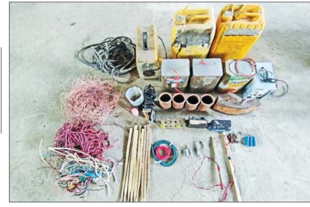
နေပြည်တော် မတ် ၉