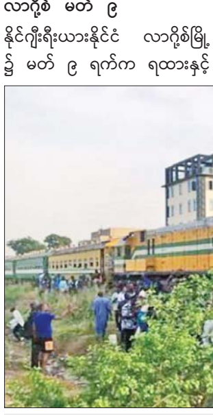
ရထားနှင့် ဘတ်စ်ကားတို့ တိုက်မိပြီးနောက် အပျက်အစီးများကို တွေ့ရစဉ်။

လာဂိုစ်စ် မတ် ၉ နိုင်ဂျီးရီးယားနိုင်ငံ လာဂိုစ်စ်မြို့၌ မတ် ၉ ရက်က ရထားနှင့် ဘတ်စ်ကားတို့ တိုက်မိမှုဖြစ်ပွားပြီး နှစ်ဦး သေဆုံးကာ ၈၄ ဦး ဒဏ်ရာရရှိခဲ့သည်ဟု အမျိုးသား