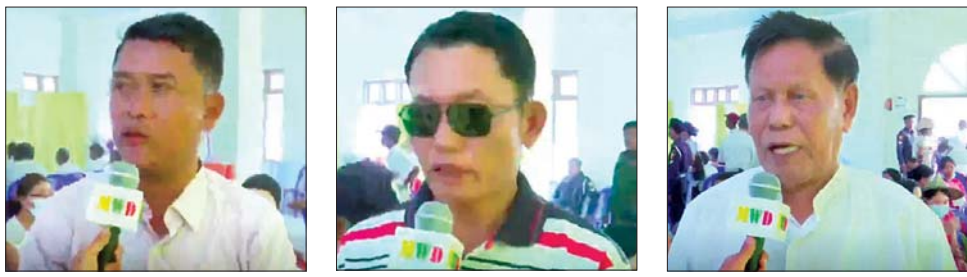
ဒေသခံပြည်သူများ။

နေပြည်တော် မတ် ၉ ရခိုင်ပြည်နယ်အတွင်းရှိ ကမ်းရိုးတန်း ဒေသတစ်လျှောက်မှ ဒေသခံပြည်သူများအား ကျန်းမာရေးစောင့်ရှောက်မှု လုပ်ငန်းများ ဆောင်ရွက်ပေးရန် တပ်မတော်ပင်လယ်သွား ဆေးရုံရေယာဉ်(သံလွင်) ဖြင့် ရောက်ရှိနေသော တပ်မတော်နှင့် ကျန်းမာရေးဝန်ကြီးဌာနတို့မှ အထူးကုဆေးအဖွဲ့များမှပါရဂူများ၊ ဆေးမှူးများ၊ သူနာပြုများနှင့် တာဝန်ရှိသူများက ရမ်းမြို့နယ် ကျောက်နီမော်ကျေးရွာနှင့် ပတ်ဝန်းကျင်ကျေးရွာများမှ ခွဲစိတ်ကုသပြီးသော ဒေသခံပြည်သူများအား ဆေးရုံရေယာဉ်ပေါ်၌ ရင်းရင်းနှီးနှီး လိုက်လံနှုတ်ဆက်အားပေးစကားပြောကြားပြီး အာဟာရဖြည့်စွမ်းသောကုသမှုများနှင့် လက်ဆောင်ပစ္စည်းများ ထောက်ပံ့ပေးအပ်ကြသည်။ ထို့နောက်တပ်မတော်ပင်လယ်သွား ဆေးရုံရေယာဉ် (သံလွင်) သည် ယနေ့တွင် မာန်အောင်မြို့သို့ရောက်ရှိရာ ဌာနဆိုင်ရာမှ တာဝန်ရှိသူများ၊ ရုပ်မိရပ်ဖများနှင့် ဒေသခံပြည်သူများက သောင်းသောင်းဖြဖြ ကြိုဆိုကြသည်။ အဆိုပါ နယ်လှည့်အထူးကုဆေးအဖွဲ့သည် မာန်အောင်မြို့နယ်ခန့်မှန်း အခြေပြု၍ မြို့နယ်အတွင်းရှိ ကျေးရွာနှင့် ပတ်ဝန်းကျင်ကျေးရွာများမှ ဒေသခံပြည်သူ ၈၅၅ ဦးအား ကျန်းမာရေးစောင့်ရှောက်မှုလုပ်ငန်းများ ဆောင်ရွက်ပေးသည်။ ထိုသို့ ဆောင်ရွက်ပေးရာတွင် ယနေ့တွင် ဆေးကုသမှုဆိုင်ရာ