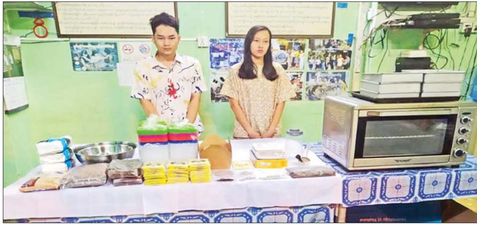
၈-၃-၂၀၂၃ ရက်က ရန်ကုန်တိုင်းဒေသကြီး လမ်းမတော်မြို့နယ်၌ Cookie မုန့်များတွင် ဆေးခြောက်များထည့်၍ ရောင်းချသည့် တရားခံများ ဖမ်းဆီးရမိမှု မှတ်တမ်းဓာတ်ပုံများ။

မှတ်ဉာဏ် ယိုယွင်းလာခြင်း၊ စိတ်တိုဒေါသထွက်ခြင်းများ ဖြစ် ပေါ်လာသည့်အပြင် စားသုံးသည့် ကာလ ကြာလာသည်နှင့်အမျှ နောက်ထပ်မစားရလျှင် မနေနိုင် အောင် စိတ်ရောကိုယ်ပါ စွဲလမ်းမှု ကိုဖြစ်ပေါ်လာပြီး စိတ်ချောက်ချား ခြင်း၊ စိတ်ကနာမငြိမ်ဖြစ်ခြင်း၊ စိတ်ဓာတ်ကျခြင်း၊ ဖျားနာလာ ခြင်း၊ ဦးနှောက်အတွင်း သွေးယို ခြင်း၊ အသက်ရှူကျပ်လာခြင်း၊ နှလုံးခုန်ရပ်ခြင်းများ ဖြစ်လာကာ နောက်ဆုံး ရုတ်တရက်သေဆုံး သည်အထိ ဆိုးကျိုးများကို ခံစား ရသည်။ သို့ဖြစ်၍ မိမိကိုယ်ကျိုးစီးပွား အတွက် လူငယ်လူရွယ်များအား လမ်းမှားသို့ ရောက်ရှိစေရေး ရည်ရွယ်ချက်ဖြင့် Cookie မုန့်များ အတွင်း ဆေးခြောက်များကို ထည့်သွင်းပြုလုပ်ကာ ရောင်းချခဲ့ သည့် တရားခံများအား ဥပဒေအရ ထိရောက်စွာ အရေးယူနိုင်ရေး ဆက်လက် ဆောင်ရွက်သွားမည် ဖြစ်ကြောင်း၊ မူးယစ်ဆေးဝါး ပြဿနာသည် လူသားမျိုးနွယ်စု တစ်ရပ်လုံးကို ခြိမ်းခြောက်နေ သည့် ပြဿနာတစ်ရပ်ဖြစ်သည် နှင့်အညီ နိုင်ငံသားအားလုံးမှ ကိုယ်စိတာဝန်ရှိစွာနှင့် ပူးပေါင်း ပါဝင် ဆောင်ရွက်ပေးကြပါရန် မေတ္တာရပ်ခံ အပ်ပါကြောင်း အသိပေး သတင်းထုတ်ပြန်အပ် ပါသည်။ သတင်းစဉ်