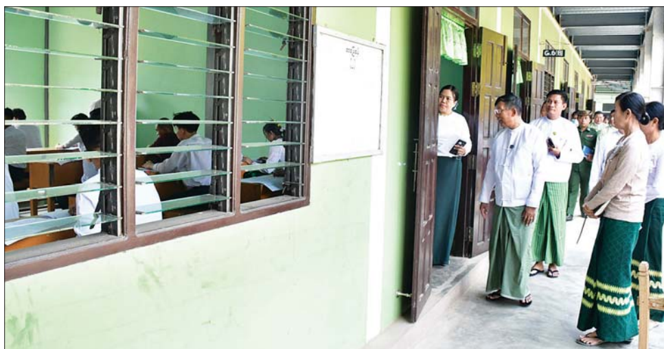
ဌာန စုစုပေါင်း ၃၉ ခုတွင် စာမေးပွဲဖြေဆိုရန် စုစုပေါင်း ၆၄၂၃ ဦး ဝင်ရောက်ဖြေဆိုကြရာ ရာခိုင် စုစုပေါင်း ၇၁၈၈ ဦး စာရင်းပေးသွင်းထားပြီး ယနေ့ နံနက်ပိုင်း ၉၀ ဒသမ ၂၄ ရာခိုင်နှုန်းရှိကြောင်း အင်္ဂလိပ်စာဘာသာရပ်ကို ကျောင်းသား ကျောင်းသူ သိရသည်။ သတင်းစဉ်

အခြေခံပညာ အထက်တန်းကျောင်း စာစစ်ဌာန၊ ပျဉ်းမနားမြို့နယ်အတွင်းရှိ အမှတ်(၁) အခြေခံပညာ အထက်တန်းကျောင်း စာစစ်ဌာနနှင့် အမှတ်(၃) အခြေခံပညာ အထက်တန်းကျောင်း စာစစ်ဌာနများ သို့ သွားရောက်၍ ကျောင်းသား ကျောင်းသူများ တက္ကသိုလ်ဝင်စာမေးပွဲ ဒုတိယနေ့ အင်္ဂလိပ်စာ ဘာသာရပ် ဖြေဆိုနေမှုများကို လှည့်လည်ကြည့်ရှု အားပေးရာ သက်ဆိုင်ရာတာဝန်ရှိသူများက စာစစ် ဌာနများအလိုက် ဆောင်ရွက်ထားရှိမှု အခြေအနေ များကို ရှင်းလင်းတင်ပြကြပြီး နေပြည်တော်ကောင်စီ ဥက္ကဋ္ဌက တက္ကသိုလ်ဝင်စာမေးပွဲကို ဝင်ရောက် ဖြေဆိုသည့် ကျောင်းသား ကျောင်းသူများ စိတ် အေးချမ်းသာစွာ စာမေးပွဲဖြေဆိုနိုင်ရေး၊ တက္ကသိုလ် ဝင်စာမေးပွဲ အောင်မြင်စွာ ကျင်းပပြီးစီးနိုင်ရေးနှင့် လိုအပ်သည်များကို မှာကြားသည်။