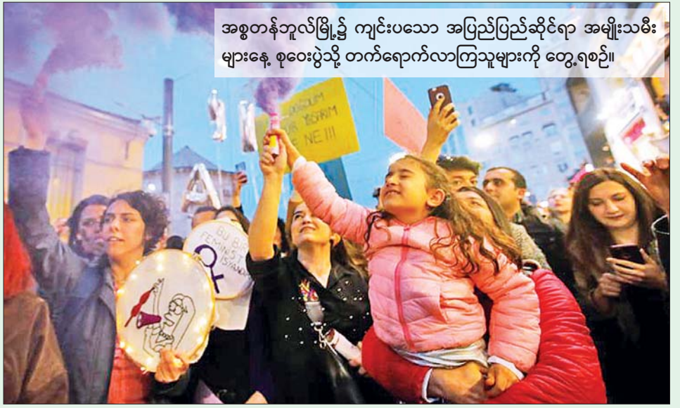
အစွတန်ဘူလ်မြို့၌ ကျင်းပသော အပြည်ပြည်ဆိုင်ရာ အမျိုးသမီးများနေ့ စုဝေးပွဲသို့ တက်ရောက်လာကြသူများကို တွေ့ရစဉ်။

ကြွေးကြော်တောင်းဆိုခဲ့ကြသည်။ ချီတက်သူများနှင့် အဓိကရုဏ်းနှိမ်နင်းရေး ရဲများအကြား ပဋိပက္ခများ ဖြစ်ပွားပြီး မျက်ရည်ယိုဖုံးဖြင့် ပစ်ခတ်ခဲ့ရသည်။ ပီရူးနိုင်ငံ မြို့တော်လီမာ၌လည်း အမျိုးသမီးများအပေါ် ခွဲခြားဆက်ဆံမှုကို အဆုံးသတ်ပေးရန် အမျိုးသမီးများက တောင်းဆိုခဲ့ကြသည်။ ဘရာဇီးနိုင်ငံ၏ အကြီးဆုံးမြို့တော် ရီယိုဒီဂျနေရိုး၌လည်း အမျိုးသမီးများ လမ်းပေါ်ထွက်ကာ ကျားမအခြေပြု အကြမ်းဖက်မှုများ အဆုံးသတ်ရန် တောင်းဆိုခဲ့ကြသည်။ အင်န်အိတ်ချ်ကေ