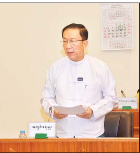
ပြည်ထောင်စုဝန်ကြီး ဦးဝင်းရှိန် ရှင်းလင်းတင်ပြ စဉ်။

စက်သုံးဆီသုံးစွဲမှုနှင့်ပတ်သက်၍ စက်သုံးဆီများ သည် ကမ္ဘာနှင့်တစ်ဝန်း ဈေးနှုန်းမြင့်တက်နေသည့် အခြေအနေဖြစ်ကြောင်း၊ ပြည်ပမှ မှာယူတင်သွင်း ရပြီး ဈေးနှုန်းကြီးမြင့်သည့်အတွက် နိုင်ငံခြားငွေ သုံးစွဲမှုလျော့နည်းစေရန်နှင့် အသုံးစရိတ်များ မြင့်မားမှုကို ရှောင်ရှားသည့်အနေဖြင့် စက်သုံးဆီ သုံးစွဲမှုများကို တက်နိုင်သမျှ လျှော့ချသုံးစွဲသွားကြ ရမည်ဖြစ်ကြောင်း၊ ယခုနှစ်တွင် စက်သုံးဆီသုံးစွဲမှု များကို အုပ်ချုပ်မှုအတွက်ဖြစ်စေ၊ လုပ်ငန်းသုံး အတွက်ဖြစ်စေ စိစစ်စစ်စစ်ခွင့်ပြုပေးသွားမည်ဖြစ်၍ စိစစ်စစ်စစ်သုံးစွဲသွားကြရမည်ဖြစ်ကြောင်း၊ ရုံးသစ် များ၊ ဝန်ထမ်းအိမ်ရာအသစ်များ ဆောက်လုပ်ခြင်း များနှင့် ပတ်သက်၍ သာမန်အားဖြင့် ခွင့်ပြုမည် မဟုတ်ဘဲ လိုအပ်ချက်အပေါ်မူတည်၍ နယ်မြေဒေသ အခြေအနေ၊ လုံခြုံရေးအခြေများအရ ခွင့်ပြုသွားမည်