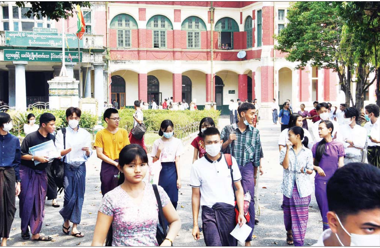
၂၀၂၂-၂၀၂၃ ခုနှစ် ပညာသင်နှစ် တက္ကသိုလ်ဝင် စာမေးပွဲတွင် ရန်ကုန်တိုင်းဒေသကြီး အ.ထ.က (၆) ဗိုလ်တထောင်စာစစ်ဌာန၌ အင်္ဂလိပ်ဘာသာရပ်ကို ဖြေဆိုပြီး ကျောင်းသား ကျောင်းသူများ ပြန်လည်ထွက်ခွာလာစဉ်။