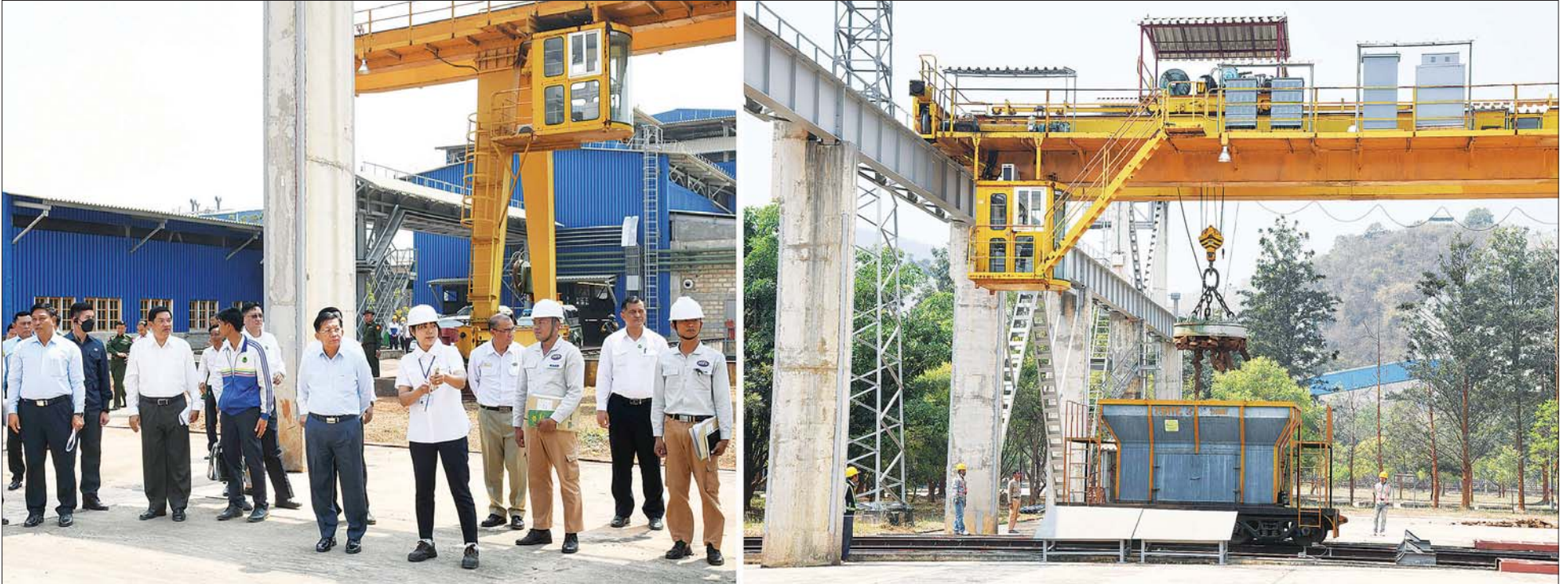
နိုင်ငံတော်စီမံအုပ်ချုပ်ရေးကောင်စီဥက္ကဋ္ဌ နိုင်ငံတော်ဝန်ကြီးချုပ် ဗိုလ်ချုပ်မှူးကြီး မင်းအောင်လှိုင်နှင့် အဖွဲ့ဝင်များ အမှတ် (၂) သံမဏိစက်ရုံ (ပင်းပက်) အတွင်း ကြည့်ရှုစစ်ဆေးစဉ်။