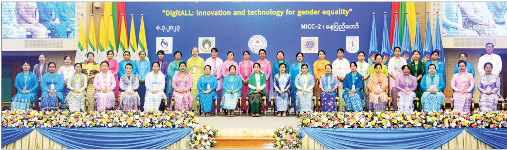
အပြည်ပြည်ဆိုင်ရာ အမျိုးသမီးများနေ့ အခမ်းအနားတွင် မြန်မာနိုင်ငံအမျိုးသမီးရေးရာအဖွဲ့ချုပ်၏ ဂုဏ်ထူးဆောင်နာယက ဒေါ်ခင်သက်ဌေး၊ ဒေါ်သန်းသန်းနွယ်နှင့် တက်ရောက်လာကြသူများ စုပေါင်းမှတ်တမ်းတင်ဓာတ်ပုံရိုက်စဉ်။

အခမ်းအနားသို့ မြန်မာနိုင်ငံ အမျိုးသမီးရေးရာ အဖွဲ့ချုပ်၏ ဂုဏ်ထူးဆောင် နာယကများ ဖြစ်ကြသော ဒေါ်ခင်သက်ဌေးနှင့် ဒေါ်သန်းသန်းနွယ်၊ နိုင်ငံတော် စီမံအုပ်ချုပ်ရေးကောင်စီ အတွင်း ရေးမှူး ဒုတိယဗိုလ်ချုပ်ကြီး အောင်လင်းဌေး၏ ဇနီး ဒေါ်ဥက္ကဋ္ဌ မြင့်၊ နိုင်ငံတော်စီမံအုပ်ချုပ်ရေး ကောင်စီအဖွဲ့ဝင်နှင့် အဖွဲ့ဝင်များ ၏ ဇနီးများ၊ ဥပဒေရေးရာဝန်ကြီး ဌာန ပြည်ထောင်စုဝန်ကြီး ဒေါက်တာသီတာဦး၊ လူမှုဝန်ထမ်း၊ ကယ်ဆယ်ရေးနှင့် ပြန်လည် နေရာချထားရေး ဝန်ကြီးဌာန ပြည်ထောင်စုဝန်ကြီး ဒေါက်တာ