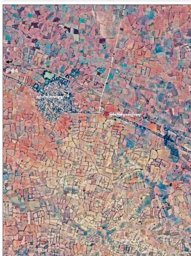
မြင်းခြံမြို့နယ် ညောင်ပင်သာကျေးရွာအနီး ဘုရားဖူးယာဉ်အား PDF အမည်ခံ အကြမ်းဖက်သမားများက မိုင်းထောင်ဖောက်ခွဲပစ်ခတ်တိုက်ခိုက်ခဲ့သည့် နေရာပြပုံ။

ကျူးလွန်ရာရောက်ပြီး အဆိုပါ စစ်ရာဇဝတ်မှုများ အတွက် အကြမ်းဖက်မှု တိုက်ဖျက်ရေး ဥပဒေ၊ ရာဇသတ်ကြီးနှင့်သက်ဆိုင်ရာ တည်ဆဲဥပဒေများဖြင့် ၎င်းတို့အပေါ် ထိရောက်စွာ အရေးယူနိုင်ရေး လုံခြုံရေးတပ်ဖွဲ့ဝင်များက အကြမ်းဖက်ချေမှုန်းရေး ဆောင်ရွက်မှု (Counter-terrorism Action) ဆောင်ရွက်သွားမည်ဖြစ်ကြောင်းနှင့် အများပြည်သူများ အနေဖြင့် အကြမ်းဖက်အဖွဲ့၏ လှုပ်ရှားမှု သတင်းများရရှိပါက ရာ တည်ဆဲဥပဒေများဖြင့် ၎င်းတို့အပေါ် ထိရောက်စွာ အရေးယူနိုင်ရေး လုံခြုံရေးတပ်ဖွဲ့ဝင်များက အကြမ်းဖက်ချေမှုန်းရေး ဆောင်ရွက်မှု (Counter-terrorism Action) ဆောင်ရွက်သွားမည်ဖြစ်ကြောင်းနှင့် အများပြည်သူများ အနေဖြင့် အကြမ်းဖက်အဖွဲ့၏ လှုပ်ရှားမှု သတင်းများရရှိပါက ရာ တည်ဆဲဥပဒေများဖြင့် ၎င်းတို့အပေါ် ထိရောက်စွာ အရေးယူနိုင်ရေး လုံခြုံရေးတပ်ဖွဲ့ဝင်များက အကြမ်းဖက်ချေမှုန်းရေး ဆောင်ရွက်မှု (Counter-terrorism Action) ဆောင်ရွက်သွားမည်ဖြစ်ကြောင်းနှင့် အများပြည်သူများ အနေဖြင့် အကြမ်းဖက်အဖွဲ့၏ လှုပ်ရှားမှု သတင်းများရရှိပါက ရာ တည်ဆဲဥပဒေများဖြင့် ၎င်းတို့အပေါ် ထိရောက်စွာ အရေးယူနိုင်ရေး လုံခြုံရေးတပ်ဖွဲ့ဝင်များက အကြမ်းဖက်ချေမှုန်းရေး ဆောင်ရွက်မှု (Counter-terrorism Action) ဆောင်ရွက်သွားမည်ဖြစ်ကြောင်း သိရသည်။ သတင်းစဉ်