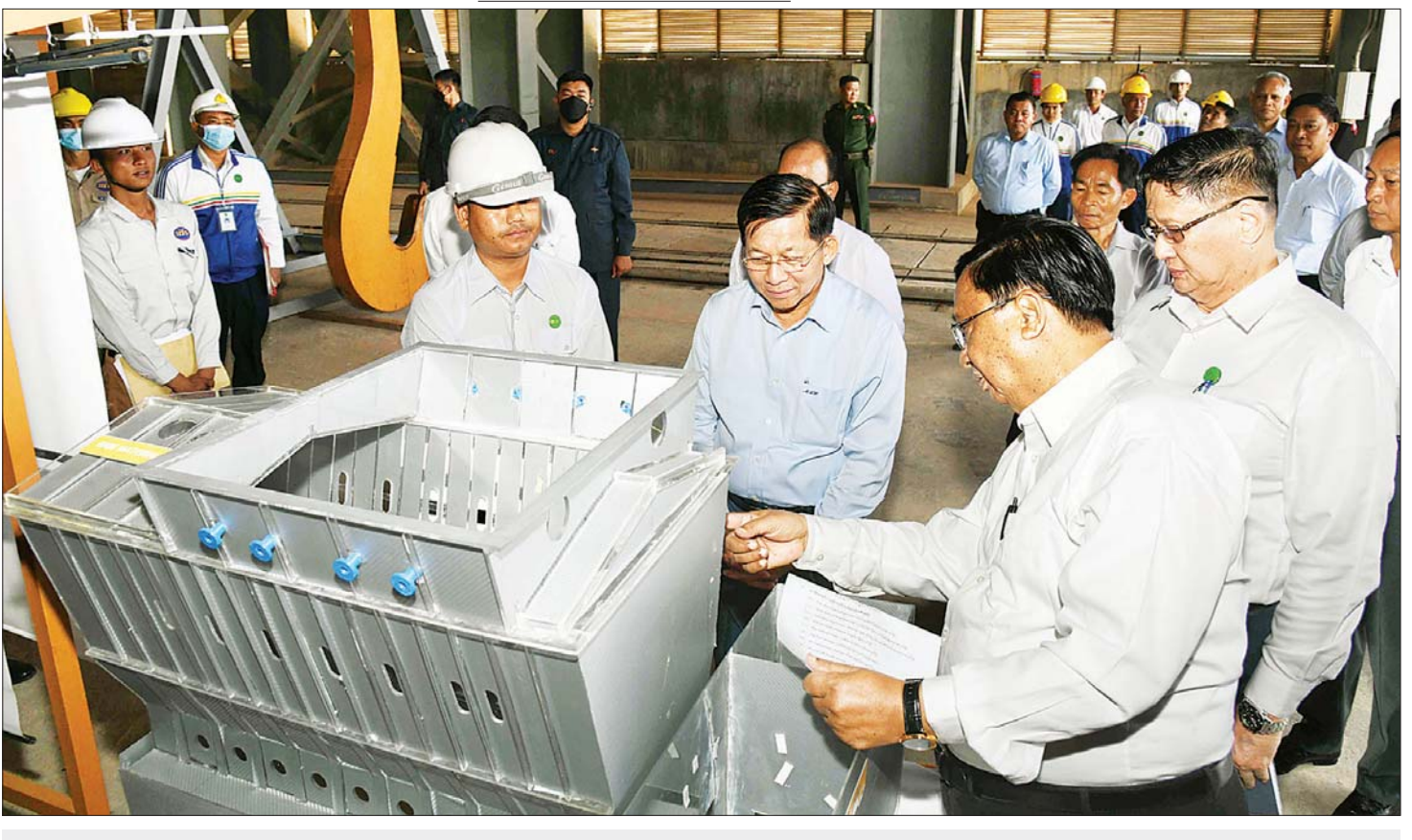
နိုင်ငံတော်စီမံအုပ်ချုပ်ရေးကောင်စီဥက္ကဋ္ဌ နိုင်ငံတော်ဝန်ကြီးချုပ် ဗိုလ်ချုပ်မှူးကြီး မင်းအောင်လှိုင်နှင့် အဖွဲ့ဝင်များ အမှတ် (၂) သံမဏိစက်ရုံ (ပင်းပက်) ရှိ အလုပ်ရုံတစ်ခုအတွင်း ကြည့်ရှုစစ်ဆေးစဉ်။

ဦးစွာ စက်ရုံရှင်းလင်းဆောင်တွင် စက်မှုဝန်ကြီးဌာန ပြည်ထောင်စုဝန်ကြီး ဒေါက်တာ ချာလီသန်းနှင့် ဒုတိယဝန်ကြီး ဦးရင်မောင်ညွန့်တို့က နိုင်ငံတော်စီမံအုပ်ချုပ်ရေးကောင်စီဥက္ကဋ္ဌ နိုင်ငံတော်ဝန်ကြီးချုပ်၏ ၂၀၂၁ ခုနှစ်အတွင်း လာရောက်စစ်ဆေးစဉ် လမ်းညွှန်မှာကြားချက်အရ စီမံကိန်း အကောင်အထည်ဖော်ဆောင်ရွက်မှုများ ရပ်တန့်ထားသည့် အမှတ်(၂) သံမဏိစက်ရုံ (ပင်းပက်) စီမံကိန်းကို ၂၀၂၁ ခုနှစ်အောက်တိုဘာ ၄ ရက်တွင် ပြန်လည်စတင် ဆောင်ရွက်ခဲ့မှုအမှတ် (၂) သံမဏိစက်ရုံ (ပင်းပက်) စီမံကိန်း ဖြစ်ပေါ်လာပုံနှင့် စီမံကိန်းပြန်လည် လည်ပတ်နိုင်ရေးအတွက် ဆက်လက်အကောင်အထည်ဖော်ရမည့် လုပ်ငန်းစဉ်များ၊ စီမံကိန်း အကောင်အထည်ဖော်ဆောင်ရွက်ရာ တိုးတက်မှုများနှင့် ချို့ယွင်းချက်များ ဖြစ်ပေါ်နေသည့် အစိတ်အပိုင်းများကို ပြန်လည်ပြုပြင်ခြင်းများ ဆောင်ရွက်ခဲ့မှု၊ လုပ်ငန်းများ ဆောင်ရွက်ရာတွင် နည်းပညာဆိုင်ရာ စစ်ဆေးရေးအဖွဲ့တို့မှ စနစ်ကျကျမှီဖော်ရေး စစ်ဆေးဆောင်ရွက်ခဲ့မှုနှင့် စီမံကိန်းအကောင်အထည်ဖော်လျက်ရှိသည့် အခြေအနေများကို ရှင်းလင်းတင်ပြကြသည်။