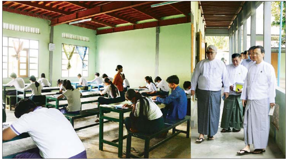
ဒုတိယဝန်ကြီး ဒေါက်တာဇော်မြင့် ၂၀၂၃ ခုနှစ် တက္ကသိုလ်ဝင်စာမေးပွဲဖြေဆိုနေမှုများကို လိုက်လံ ကြည့်ရှုစစ်ဆေး

ဆက်လက်၍ Naypyitaw State Academy သို့ သွားရောက်ကာ ဘာသာရပ်အလိုက် တတိယနှစ်၊ ပထမနှစ်ဝက်နှင့် ဂုဏ်ထူးတန်းပထမနှစ် စာမေးပွဲကျင်းပနိုင်ရန် ပြင်ဆင်ထားရှိမှုကို ကြည့်ရှုစစ်ဆေးသည်။ ထို့နောက် စာကြည့်တိုက်အတွင်း ကြည့်ရှုကာ ဒစ်ဂျစ်တယ် စာကြည့်တိုက်စီမံခန့်ခွဲမှုစနစ်ကို ပီပြင်စွာ အကောင်အထည်ဖော်ရန် မှာကြားခဲ့ကြောင်း သိရသည်။