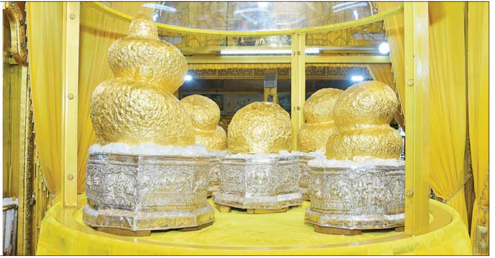
နိုင်ငံတော်စီမံအုပ်ချုပ်ရေးကောင်စီဥက္ကဋ္ဌ နိုင်ငံတော်ဝန်ကြီးချုပ် ဗိုလ်ချုပ်မှူးကြီး မင်းအောင်လှိုင်၊ ဇနီး ဒေါ်ကြူကြူလှနှင့် အဖွဲ့ဝင်များ အင်းလေးဖောင်တော်ဦး စေတီတော်မြတ်ကြီးအတွင်းရှိ ဗုဒ္ဓရုပ်ပွားတော်များအား ဖူးမြော်ကြည့်ညိစဉ်။