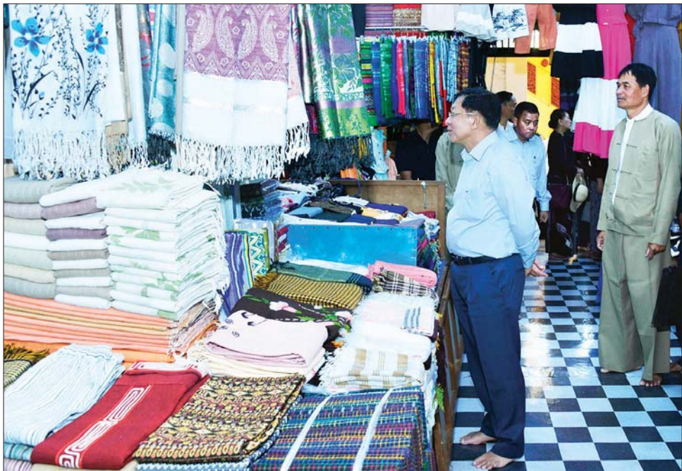
နိုင်ငံတော်စီမံအုပ်ချုပ်ရေးကောင်စီဥက္ကဋ္ဌ နိုင်ငံတော်ဝန်ကြီးချုပ် ဗိုလ်ချုပ်မှူးကြီး မင်းအောင်လှိုင် ဒေသရိုးရာလက်မှုထွက်ကုန်များနှင့် ရိုးရာအဝတ်အထည် အရောင်းဆိုင်များကို လှည့်လည်ကြည့်ရှုအားပေးစဉ်။