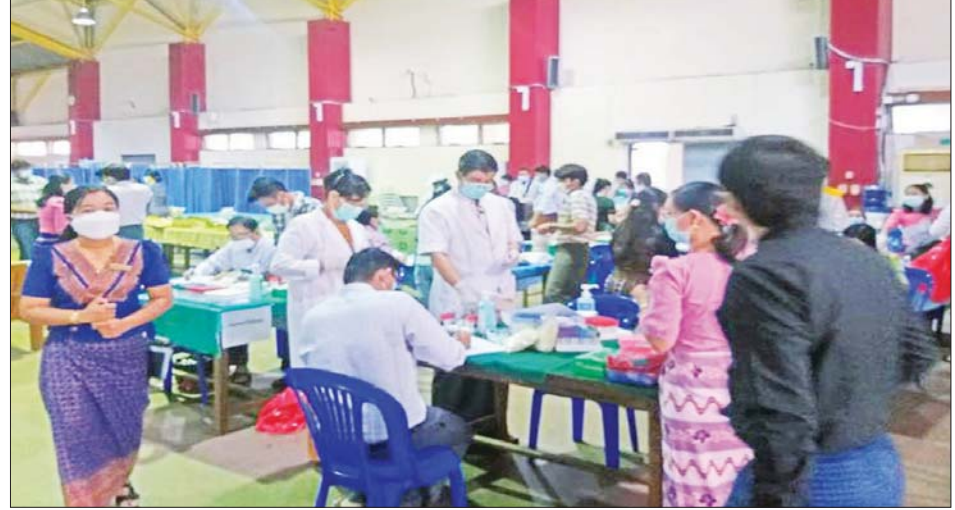
သက်ကြီးဆရာဝန်ကြီးများအား ကျန်းမာရေးစောင့်ရှောက်မှု ဆောင်ရွက်ပေးစဉ်။

ကျန်းမာရေးစောင့်ရှောက်မှု ပိုမိုခိုင်မာရန် သို့ဖြစ်ရာ မတ်လ ၁၁ ရက်နှင့် ၁၂ ရက်နေ့တို့ တွင် ကျင်းပမည့် မြန်မာနိုင်ငံ ကျန်းမာရေးပညာရပ် ဆိုင်ရာ နှီးနှောဖလှယ်ပွဲ (၂၀၂၃) တွင် ဆေးနှင့် ကျန်းမာရေးသိပ္ပံဆိုင်ရာ နယ်ပယ်ပေါင်းစုံမှ တတ်သိ ကျွမ်းကျင်ပညာရှင်များ၏ အသိပညာမျှဝေမှုများနှင့် အပြန်အလှန်ဆွေးနွေးမှုများမှ ရရှိလာမည့်ရလဒ် များသည် နိုင်ငံ၏ အခြေခံကျန်းမာရေးစောင့်ရှောက် မှုကို ပိုမိုခိုင်မာလာစေရန် တည်ဆောက်၍ တစ်မျိုးသားလုံး သက်ရှည်ကျန်းမာသည့် ကျန်းမာ ရေးစနစ်ဖြစ်ပေါ်လာရေးအတွက် အထောက်အကူ ဖြစ်စေမည် ဖြစ်ပါသည်။ ထို့အပြင် နိုင်ငံ၏ ကျန်းမာရေးစောင့်ရှောက်မှု အဆင့်အတန်း တိုးတက်မြှင့်တင်ပေးရေးနှင့် ပြည်သူတစ်ရပ်လုံး သက်တမ်းစေ့ အသက်ရှည်စွာ နေထိုင်နိုင်ရေး၊ ရောဂါဘယကင်းဝေးစေရေးအတွက် ဦးတည်ချက်ထားပြီး ကျန်းမာရေးဝန်ကြီးဌာန၏ နေ့ညမပြတ် ကြိုးပမ်းဆောင်ရွက်မှုများအပေါ် ဤ “မြန်မာနိုင်ငံ ကျန်းမာရေးပညာရပ်ဆိုင်ရာ နှီးနှောဖလှယ်ပွဲ” က ၎င်းရည်ရွယ်ချက်များကို အောင်မြင်စေရန် ကြိုးပမ်းသည့် အထောက်အပံ့ ကောင်းတစ်ခု ဖြစ်စေမည်ဟု လေးလေးနက်နက် ယုံကြည်မိပါကြောင်း ရေးသား တင်ပြအပ်ပါ သည်။