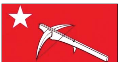
လီဆူအမျိုးသားဖွံ့ဖြိုးတိုးတက်ရေးပါတီ (ဒူးလေးပါတီ) [LISU NATIONAL DEVELOPMENT PARTY (L.N.D.P)] ၏ အလံပုံစံ