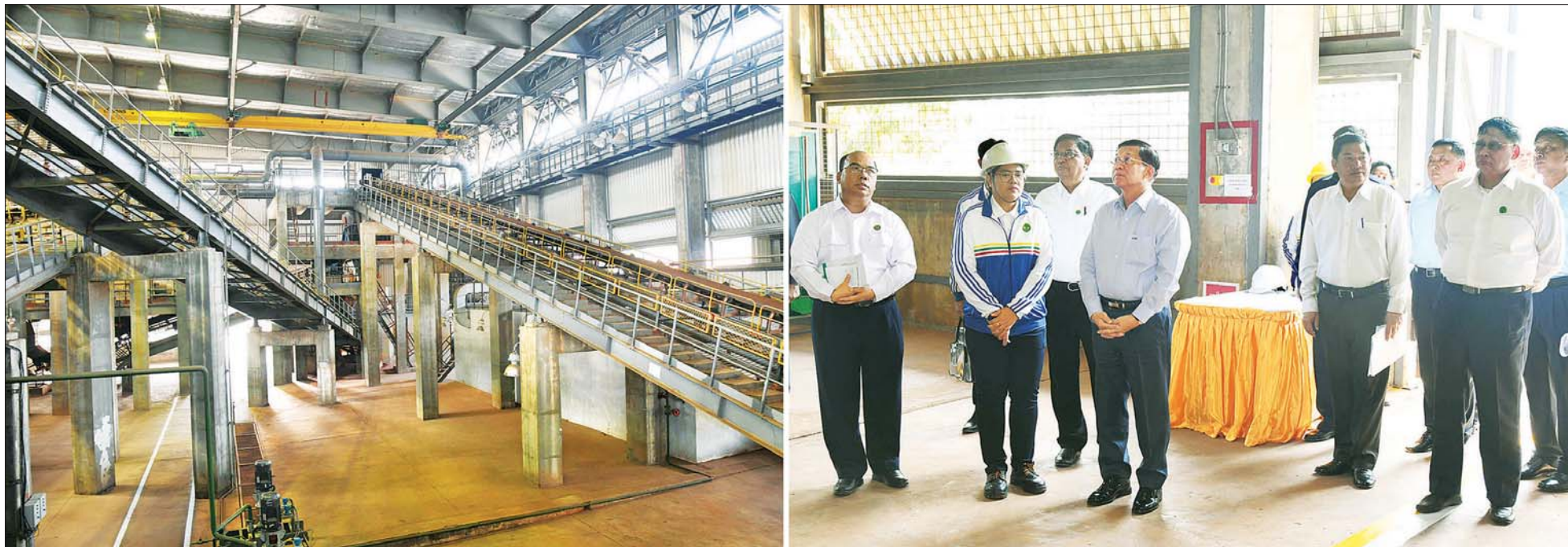
နိုင်ငံတော်စီမံအုပ်ချုပ်ရေးကောင်စီဥက္ကဋ္ဌ နိုင်ငံတော်ဝန်ကြီးချုပ် ဗိုလ်ချုပ်မှူးကြီး မင်းအောင်လှိုင်နှင့် အဖွဲ့ဝင်များ စက်မှုဝန်ကြီးဌာန၊ အမှတ်(၁) အကြီးစား စက်မှုလုပ်ငန်း အမှတ် (၂) သံမဏိစက်ရုံ (ပင်းပက်) အတွင်း ကြည့်ရှုစစ်ဆေးစဉ်။