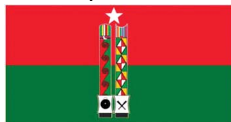
ကချင်ပြည်နယ်ပြည်သူ့ပါတီ [Kachin State People's Party (KSPP)]၏ အလံပုံစံ