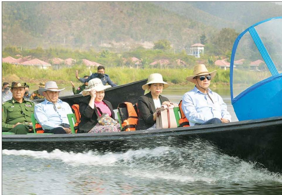
နိုင်ငံတော်စီမံအုပ်ချုပ်ရေးကောင်စီဥက္ကဋ္ဌ နိုင်ငံတော်ဝန်ကြီးချုပ် ဗိုလ်ချုပ်မှူးကြီး မင်းအောင်လှိုင်နှင့် ဇနီး ဒေါ်ကြူကြူလှ အင်းလေးကန်အတွင်း စက်လှေများဖြင့် လှည့်လည်၍ အင်းလေးဒေသ၏ ဖွံ့ဖြိုးတိုးတက်မှုနှင့် သဘာဝပတ်ဝန်းကျင်ထိန်းသိမ်းနိုင်မည့် အခြေအနေများကို ကြည့်ရှုစဉ်။