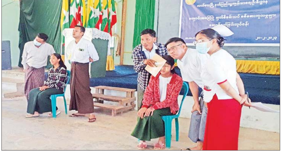
လယ်ဝေးမြို့နယ်၌ ကျောင်းအခြေပြု မျက်စိစစ်ဆေး ဆောင်ရွက်စဉ်။