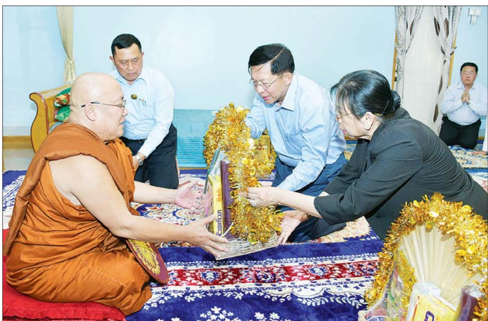
နိုင်ငံတော်စီမံအုပ်ချုပ်ရေးကောင်စီဥက္ကဋ္ဌ နိုင်ငံတော်ဝန်ကြီးချုပ် ဗိုလ်ချုပ်မှူးကြီး မင်းအောင်လှိုင်နှင့် ဇနီး ဒေါ်ကြူကြူလှ စိန်နှင့်မြကျောင်းတိုက် ဖောင်တော်ဦးစေတီတော်မြတ်ကြီး ဆရာတော် ဘဒ္ဒန္တဝိဇယထံ လှူဖွယ်ပစ္စည်းများ ဆက်ကပ်လှူဒါန်းစဉ်။

ပစ္စည်းများနှင့် နဝကမ္မအလှူငွေများ ဆက်ကပ်လှူဒါန်းသည်။ ယင်းနောက် ဆရာတော်ကြီး၏ ကျန်းမာရေး ဆိုင်ရာများနှင့် အင်းလေးဒေသနှင့် စေတီတော်မြတ်ကြီး ရေရှည်တည်တံ့ခိုင်မြဲရေးအတွက် လိုအပ်သည်များကို လျှောက်ထားပြီး ဆရာတော်ကြီးထံမှ ဩဝါဒကို နာယူသည်။