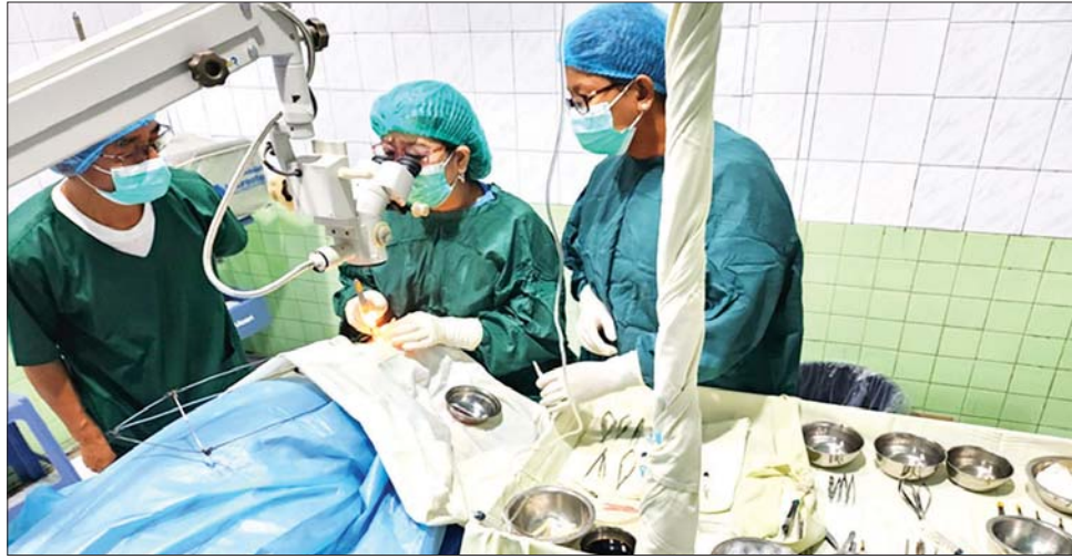
နယ်မြေ နေပြည်တော်တွင် မျက်စိ၊ နား၊ နှာခေါင်း၊ လည်ချောင်း၊ ဦးခေါင်းနှင့်လည်ပင်းခွဲစိတ်အထူးကုဆေးရုံကြီး၊ ပြည်သူ့ဆေးရုံကြီး ပျဉ်းမနားမြို့၊

မြန်မာနိုင်ငံ ကျန်းမာရေးပညာရပ်ဆိုင်ရာ နီးနှောဖလှယ်ပွဲ(၂၀၂၃)ကို ၂၀၂၃ ခုနှစ် မတ် ၁၁ ရက်နှင့် ၁၂ ရက်တို့တွင် နေပြည်တော် မြန်မာအပြည်ပြည်ဆိုင်ရာကွန်ဗင်းရှင်းဗဟိုဌာန(၂) ၌ ကျင်းပပြုလုပ်မည်ဖြစ်ရာ အဆိုပါနီးနှောဖလှယ်ပွဲ၏ အကြိုလှုပ်ရှားမှုအစီအစဉ်အဖြစ် မျက်စိအတွင်းတိမ်လူနာများအား စမ်းသပ်စစ်ဆေးပေးခြင်းနှင့် မျက်စိအတွင်းတိမ်အခဲခွဲစိတ်ကုသမှုပေးခြင်းကို စစ်ကိုင်းတိုင်းဒေသကြီး ပြည်သူ့ဆေးရုံကြီး၊ ရွှေဘိုမြို့၌ ၂၀၂၃ ခုနှစ် မတ် ၆ ရက်နှင့် ၇ ရက်တို့တွင် ဆောင်ရွက်ပေးခဲ့သည်။ (ယာပုံ)