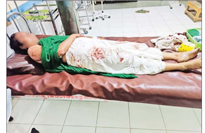
မြင်းခြံမြို့နယ် ညောင်ပင်သာကျေးရွာအနီး PDF အမည်ခံ အကြမ်းဖက်သမားများက မိုင်းထောင်ဖောက်ခွဲပစ်ခတ် တိုက်ခိုက်သည့် ဘုရားဖူးယာဉ်နှင့် ဒဏ်ရာရရှိသူ။