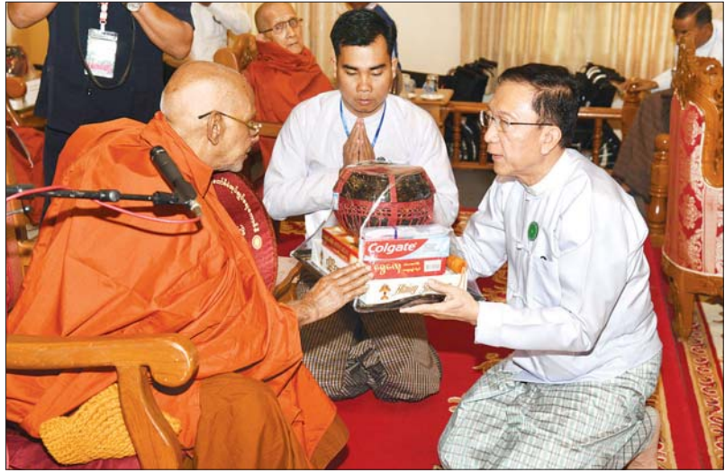
ပြည်ထောင်စုဝန်ကြီး ဦးဝင်းရှိန် ဆရာတော်ကြီးထံ လှူဖွယ် ပစ္စည်းများ ဆက်ကပ်လှူဒါန်း စဉ်။