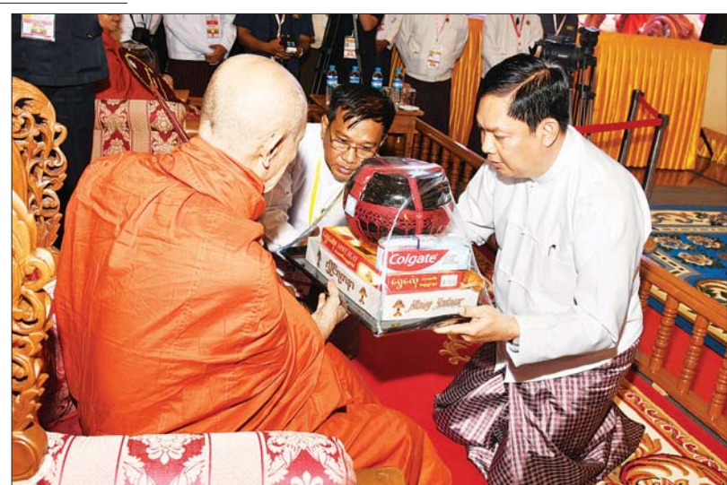
နိုင်ငံတော်စီမံအုပ်ချုပ်ရေးကောင်စီအဖွဲ့ဝင် ဒုတိယဗိုလ်ချုပ်ကြီး မိုးမြင့်ထွန်း ဆရာတော်ကြီးထံ လှူဖွယ်ပစ္စည်းများ ဆက်ကပ်လှူဒါန်းစဉ်။