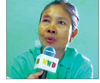
ဒေသခံပြည်သူတစ်ဦး