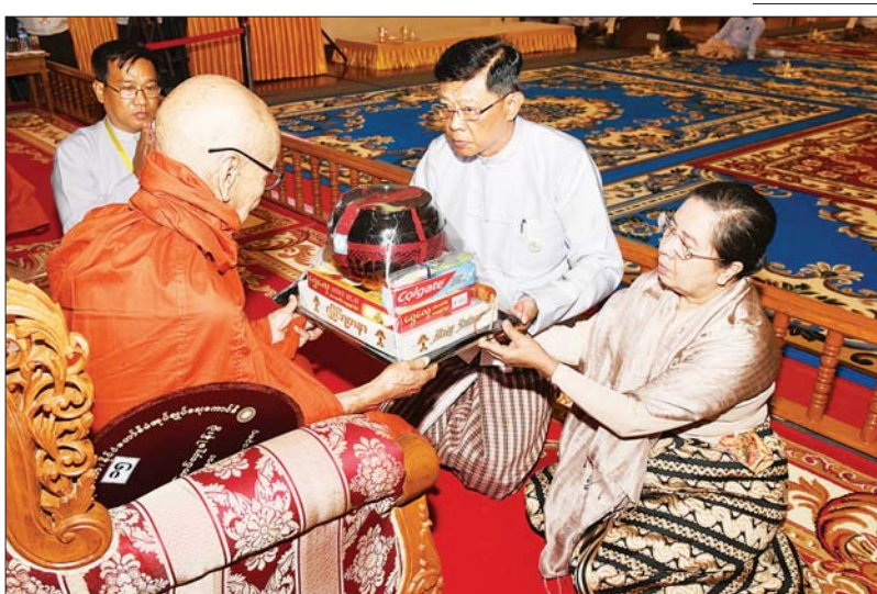
နိုင်ငံတော်စီမံအုပ်ချုပ်ရေးကောင်စီအဖွဲ့ဝင် ဗိုလ်ချုပ်ကြီး မြထွန်းဦးနှင့်ဇနီးတို့ ဆရာတော်ကြီးထံ လှူဖွယ်ပစ္စည်းများ ဆက်ကပ်လှူဒါန်းစဉ်။

နိုင်ငံတော်စီမံအုပ်ချုပ်ရေး ကောင်စီဥက္ကဋ္ဌ နိုင်ငံတော်ဝန်ကြီးချုပ် ဗိုလ်ချုပ်မှူးကြီး မင်းအောင်လှိုင်နှင့်ဇနီး ဒေါ်ကြူကြူလှတို့ ဆရာတော်ကြီးများအား နေ့ဆွမ်း ဆက်ကပ်လှူဒါန်းစဉ်။