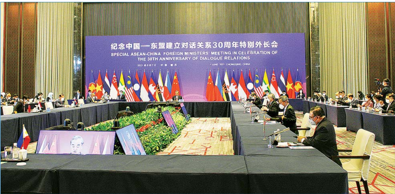
အာဆီယံ - တရုတ် မိတ်ဖက်ဆက်ဆံရေး နှစ်(၃၀)ပြည့် အထိမ်းအမှတ်အဖြစ် ပြုလုပ်သည့် အာဆီယံ - တရုတ် နိုင်ငံခြားရေးဝန်ကြီးများ အထူးအစည်းအဝေး ကျင်းပစဉ်။ (၇-၇-၂၀၂၁ ရက်)

အာဆီယံ-တရုတ် မိတ်ဖက်ဆက်ဆံရေးမှာ အဓိကမဏ္ဍိုင်(၂)ရပ်ကတော့ အာဆီယံ-တရုတ် ဘက်စုံမဟာဗျူဟာကျတဲ့ မိတ်ဖက်ပူးပေါင်းဆောင်ရွက်မှုကို အကောင်အထည်ဖော်ဖို့ လုပ်ငန်းစီမံချက် (၂၀၂၁-၂၀၂၅)နဲ့ တောင်တရုတ်ပင်လယ်တွင်းနိုင်ငံများ လိုက်နာရမယ့် လုပ်ထုံးလုပ်နည်းဆိုင်ရာ ကြေညာချက်(DOC)အကောင်အထည်ဖော်ရေးလုပ်ငန်းစဉ်အစဉ်တို့ဖြစ်ပြီး ၎င်းတို့ဟာ အာဆီယံ-တရုတ် ဆက်ဆံရေးအတွက် လမ်းပြမြေပုံပုံဖြစ်ပါတယ်။ ဦးစွာ လုပ်ငန်းစီမံချက်နဲ့ပတ်သက်ပြီး ရှင်းပြလိုပါတယ်။ DOC Work Plan ကို သီးခြားရှင်းပြပါမယ်။ လုပ်ငန်းစီမံချက်ဟာ အာဆီယံအသိုက်အဝန်း မဏ္ဍိုင်