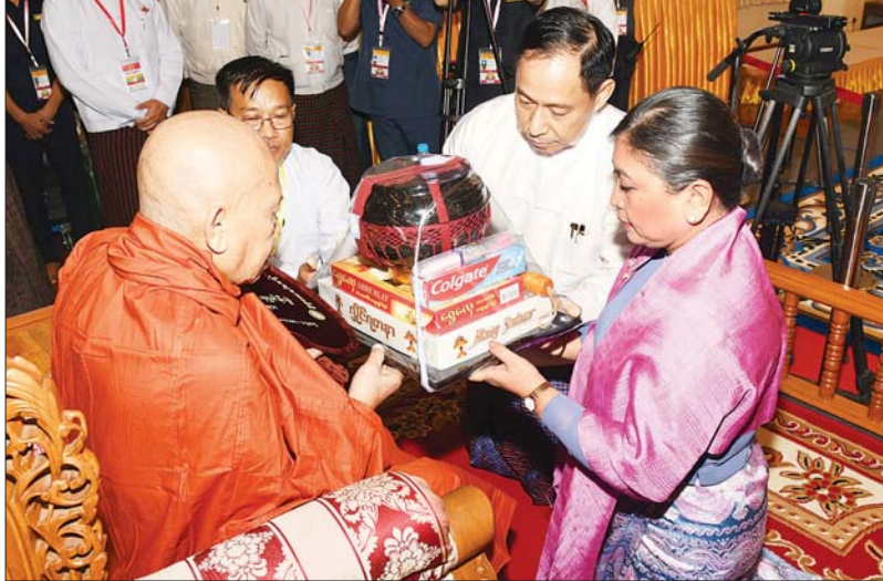
နိုင်ငံတော်စီမံအုပ်ချုပ်ရေးကောင်စီအဖွဲ့ဝင် ဒုတိယဗိုလ်ချုပ်ကြီး ရာပြည့်နှင့်ဇနီးတို့ ဆရာတော်ကြီးထံ လှူဖွယ်ပစ္စည်းများ ဆက်ကပ်လှူဒါန်းစဉ်။