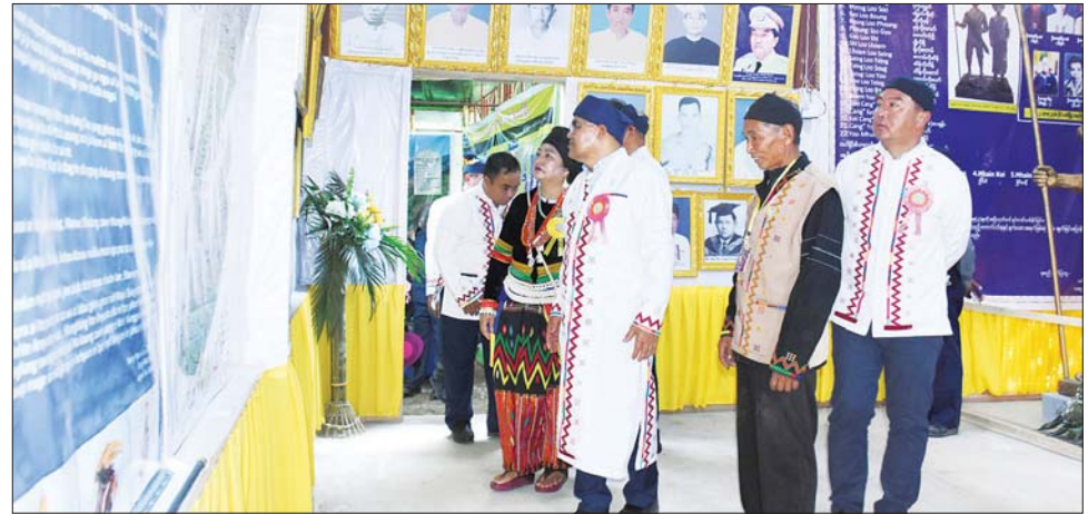
နိုင်ငံတော်စီမံအုပ်ချုပ်ရေးကောင်စီ အဖွဲ့ဝင် ဒေါ်ခွဲဘူနှင့်အဖွဲ့ လာချိတ်တိုင်းရင်းသားတို့၏ သမိုင်းမှတ်တမ်းများနှင့် ရိုးရာအသုံးအဆောင်ပြခန်းအတွင်း လှည့်လည်ကြည့်ရှုကြစဉ်။

လာခွဲကြသည်။ ယင်းနောက် နိုင်ငံတော်စီမံအုပ်ချုပ်ရေး ကောင်စီအဖွဲ့ဝင်၊ ပြည်ထောင်စုဝန်ကြီးနှင့် အဖွဲ့ဝင်များသည် ရိုးရာမနောကွင်းနှင့် လာချိတ်တိုင်းရင်းသားတို့၏ သမိုင်းမှတ်တမ်းများနှင့် ရိုးရာအသုံးအဆောင် ပြခန်းအတွင်း ပြသထားသည့် လာချိတ်တိုင်းရင်းသားတို့ ဆင်းသက်လာမှု၊ ဘဝနေထိုင်မှုဓလေ့ထုံးစံ၊ လာချိတ်စာပေ၊ ရိုးရာအဝတ်အထည် ရက်လုပ်မှုနှင့် ဝတ်စားဆင်ယင်မှုများ၊ အသုံးအဆောင်ပစ္စည်းများ၊ လာချိတ်တိုင်းရင်းသားဦးဆောင်သူဘိုးဘွားများ၏ မှတ်တမ်းများကို လှည့်လည်ကြည့်ရှုကြသည်။ လာချိတ် တစ်မျိုးသားလုံး၏ ရိုးရာမနောပွဲတော်ကို မတ် ၂ ရက်မှ စတင်ကျင်းပပြီး ညပိုင်းတွင် လာချိတ်တိုင်းရင်းသား အဆိုတော်များ၏ တေးသီချင်းသီဆိုမှုများ၊ လနတ်သမီး အလှပြိုင်ပွဲများ၊ ဈေးဆိုင်ခန်းများနှင့် စည်ကားသိုက်မြိုက်စွာ ကျင်းပလျက်ရှိပြီး အပိတ် မနောအကကို မတ် ၄ ရက်တွင် ကျင်းပသွားမည်ဖြစ်ကြောင်း လာချိတ်စာပေနှင့်ယဉ်ကျေးမှု ဗဟိုကော်မတီမှ သိရသည်။ သတင်းစဉ်