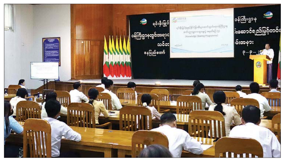
of the Myanmar Companies Law & MyCo: Myanmar Company Online” ဟူသော ခေါင်းစဉ်ဖြင့် ရှင်းလင်းဆွေးနွေးပြောကြားကြသည်။ ထို့နောက် တက်ရောက်လာကြသူများက ပြန်လည်မေးမြန်းဆွေးနွေးကြသည်။ အခမ်းအနားသို့ ရင်းနှီးမြှုပ်နှံမှုနှင့် နိုင်ငံခြားစီးပွားဆက်သွယ်ရေးဝန်ကြီးဌာနမှ အဆင့်မြင့်အရာရှိများ၊ အရာထမ်း / အမှုထမ်းများ Online အပါအဝင် စုစုပေါင်းဝန်ထမ်းအင်အား ၁၀၀ ကျော် တက်ရောက်ကြကြောင်း သိရသည်။ သတင်းစဉ်

တာဝန်များနှင့် ဂရုပြုသိရှိထားရမည့် ကိစ္စရပ်များကို သဘောပေါက်ရန် လိုအပ်ပါကြောင်း၊ အမှုထမ်း၊ အရာထမ်းများအနေဖြင့် ဝန်ကြီးရုံး အပါအဝင် ဦးစီးဌာနများ၏ လုပ်ငန်းများကို ဆက်စပ်သိရှိထားခြင်းဖြင့် လုပ်ငန်းတာဝန်များကို ဆောင်ရွက်ရာတွင် အားစိုက်မှု၊ ခံယူမှုတို့ ပိုမိုတိုးတက်လာမည်ဖြစ်ကြောင်းနှင့် ဘာသာရပ်ဆိုင်ရာများကို သိရှိနားလည်ကျွမ်းကျင်ပြီး နိုင်ငံတကာ အစည်းအဝေးများတွင် ထိထိရောက်ရောက် ဆွေးနွေးနိုင်သူများ ဖြစ်လာမည်ဖြစ်ကြောင်း၊ နိုင်ငံတကာအစည်းအဝေးနှင့် ပြည်ပနိုင်ငံများသို့ ပညာသင်များသွားရောက်ရာတွင် အမြဲတမ်းကိုယ့်နိုင်ငံဆိုင်ရာသိရှိမှုဖြင့် နိုင်ငံကို ကိုယ်စားပြုသွားရောက်ရခြင်းဖြစ်သည်ကို သိရှိနားလည်ရမည်ဖြစ်ကြောင်းလည်း ပြောကြားသည်။ ဆွေးနွေးပွဲတွင် ရင်းနှီးမြှုပ်နှံမှုနှင့် ကုမ္ပဏီများ ညွှန်ကြားမှုဦးစီးဌာနညွှန်ကြားရေးမှူးက မြန်မာနိုင်ငံကုမ္ပဏီများ ဥပဒေ (၂၀၁၇) နှင့် MyCo : Myanmar Company Online ၏ လေးနှစ်တာကာလအတွင်း တုံ့ပြန်မှုများနှင့်စပ်လျဉ်း၍ “ Reflection on 4 years