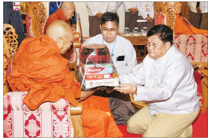
နိုင်ငံတော်စီမံအုပ်ချုပ်ရေးကောင်စီအဖွဲ့ဝင် ဦးရန်ကျော် ဆရာတော်ကြီးထံ လှူဖွယ် ပစ္စည်းများ ဆက်ကပ်လှူဒါန်းစဉ်။