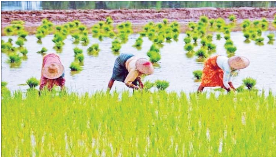
ဝယ်ကျွေးခဲ့ပါတယ်။