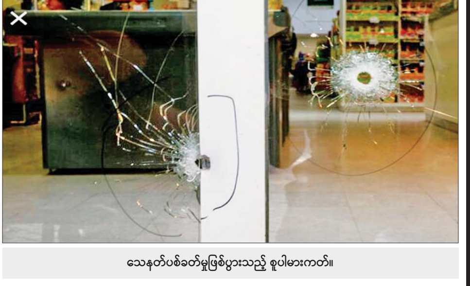
သေနတ်ပစ်ခတ်မှုဖြစ်ပွားသည့် စူပါမားကတ်။

နေထိုင်ခဲ့ဖူးသည်။ ထို့နောက် ၎င်းသည် နိုင်ငံ အမျိုးသားအသင်းကို ဦးဆောင်ကာ အသက် ၃၆ နှစ်တွင် ကာတာနိုင်ငံ၌ ကျင်းပသည့် ကမ္ဘာ့ဖလား ဘောလုံးပြိုင်ပွဲကြီးတွင် ကမ္ဘာ့ဖလားရရှိအောင် စွမ်းဆောင်နိုင်ခဲ့သည်။ ပစ်ခတ်မှုပြုလုပ်ခဲ့သည့် သေနတ်သမားမှာ မူးယစ်ဂိုဏ်းနှင့် ဆက်စပ်မှု ရှိသည်ဟု ယူဆရသည်။ ရိုဆာရီယိုမြို့သည် မူးယစ် ဆေးဝါးနှင့် ဆက်စပ်မှုရှိသည့် ရာဇဝတ်မှုများ အဖြစ်များသည်။ အာဂျင်တီးနားသမ္မတ အယ်လ်ဘတ်တို ဖာနန်ဒက်ကလည်း မူးယစ်မှုနှင့် ပတ်သက်သည့် အကြမ်းဖက်မှုများ များလာသည့်အတွက် အဆိုပါ ကိစ္စကို ကိုင်တွယ်ဖြေရှင်းရန် ရိုဆာရီယိုမြို့တော်ဝန် ကို တိုက်တွန်းထားသည်။ အင်န်အိတ်ချီကေ