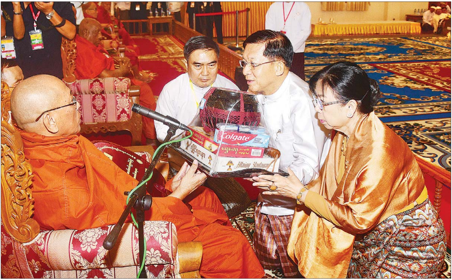
နိုင်ငံတော်စီမံအုပ်ချုပ်ရေးကောင်စီဥက္ကဋ္ဌ နိုင်ငံတော်ဝန်ကြီးချုပ် ဗိုလ်ချုပ်မှူးကြီး မင်းအောင်လှိုင်နှင့် ဇနီး ဒေါ်ကြူကြူလှတို့ နိုင်ငံတော်သံဃမဟာနာယကအဖွဲ့ ဒုတိယဥက္ကဋ္ဌ မြင်းခြံဆရာတော်ကြီးထံ လှူဖွယ်ဝတ္ထုပစ္စည်းများ ဆက်ကပ်လှူဒါန်းစဉ်။

အခမ်းအနားသို့ အထူးပင့်ဖိတ် ထားသည့် နိုင်ငံတော်သံဃမဟာ နာယကအဖွဲ့ ဒုတိယဥက္ကဋ္ဌ မြင်းခြံမြို့ ကိုးဆောင်တိုက်ပဓာနနာယက၊ အဂ္ဂမဟာ ပဏ္ဍိတ ဘဒ္ဒန္တ ဇောတိကပါလနှင့် နိုင်ငံတော် သံဃမဟာနာယကအဖွဲ့ ဒုတိယဥက္ကဋ္ဌ ရှမ်းပြည်နယ် (မြောက်ပိုင်း) ကျောက်မဲမြို့ သီဟိုဠ်ပရိယတ္တိစာသင် တိုက် ပဓာနနာယက၊ အဂ္ဂမဟာပဏ္ဍိတ ဒေါက်တာ ဘဒ္ဒန္တစန္ဒနသာရတို့အမျိုးပြု သည့် ပြည်တွင်း၊ ပြည်ပဘွဲ့ခံ ဆရာတော် ၁၃၁ ပါးနှင့် ဘွဲ့ခံသီလရှင်ဆရာကြီး သုံးပါးတို့ တက်ရောက်ချီးမြှင့်တော်မူကြပြီး စာမျက်နှာ ၃ ကော်လံ ၁ ❖