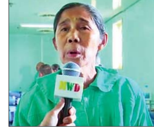
ဒေသခံပြည်သူတစ်ဦး