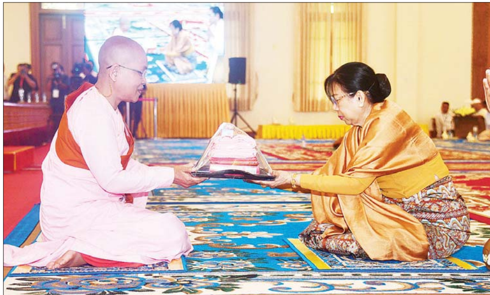
နိုင်ငံတော်စီမံအုပ်ချုပ်ရေးကောင်စီဥက္ကဋ္ဌ နိုင်ငံတော်ဝန်ကြီးချုပ်၏ဇနီး ဒေါ်ကြူကြူလှ တွဲဖက်ဆရာတော် ဆက်ကပ်ခံယူမည့် သီလရှင်ဆရာကြီးတစ်ပါးအား လှူဖွယ်ဝတ္ထုပစ္စည်းများ ဆက်ကပ်လှူဒါန်းစဉ်။

နိုင်ငံတော်စီမံအုပ်ချုပ်ရေး ကောင်စီ ဒုတိယဥက္ကဋ္ဌ ဒုတိယဝန်ကြီးချုပ် ဒုတိယဗိုလ်ချုပ်မှူးကြီး စိုးဝင်းနှင့် ဇနီး ဒေါ်သန်းသန်းနွယ် နိုင်ငံတော် သံဃမဟာနာယကအဖွဲ့ ဒုတိယဥက္ကဋ္ဌ ကျောက်မဲမြို့ သီဟိုဠ်ပရိယတ္တိစာသင်တိုက် ပဓာန နာယက ဆရာတော်ကြီးထံ လှူဖွယ်ဝတ္ထုပစ္စည်းများ ဆက်ကပ်လှူဒါန်းစဉ်။