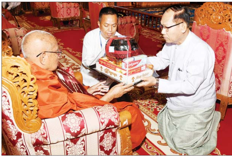
နိုင်ငံတော်စီမံအုပ်ချုပ်ရေးကောင်စီအဖွဲ့ဝင် ဒေါက်တာ အောင်ကျော်မင်း ဆရာတော်ကြီးထံ လှူဖွယ်ပစ္စည်းများ ဆက်ကပ်လှူဒါန်းစဉ်။