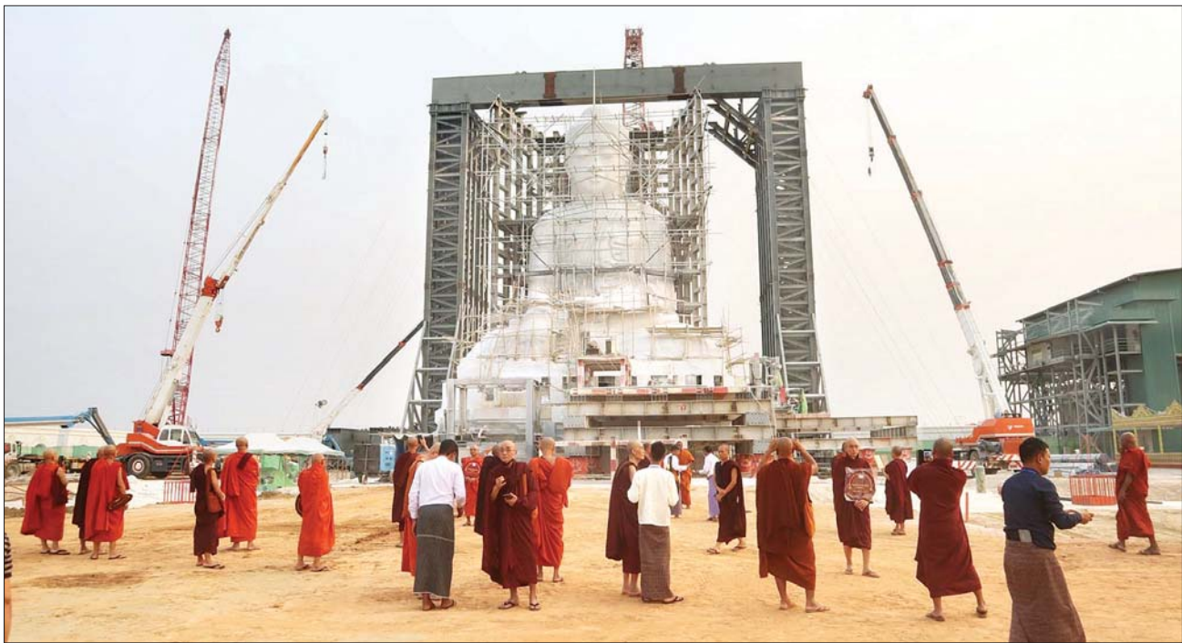
ထို့နောက် ကြွရောက်လာကြသော ဘွဲ့ခံဆရာတော်ကြီးများနှင့် သီလရှင် ဆရာကြီးများ၊ ဘွဲ့ခံလူပုဂ္ဂိုလ်များသည် မာရဝိဇယဗုဒ္ဓရုပ်ပွားတော်မြတ်ကြီးနှင့် ပလ္လင်တော်တည်ဆောက်ပြီးစီးမှု၊ ဗုဒ္ဓဥယျာဉ်တော်ကြီးအတွင်းရှိ သာသနိကအဆောက်အဦများ တည်ဆောက်ပြီးစီးမှုနှင့် ဆက်လက်တည်ဆောက်နေမှု အခြေအနေများကို လှည့်လည်ကြည့်ရှုခဲ့ကြသည်။ ယင်းနောက် မာရဝိဇယဗုဒ္ဓရုပ်ပွားတော်မြတ်ကြီး တည်ဆောက်