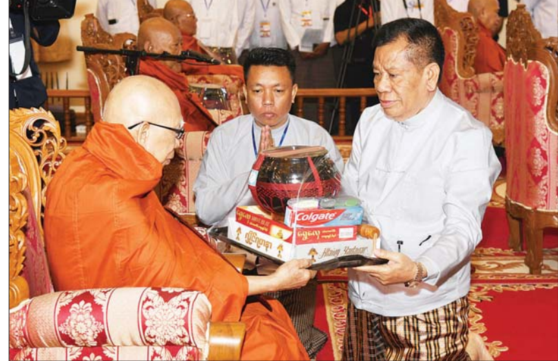
နိုင်ငံတော်စီမံအုပ်ချုပ်ရေးကောင်စီအဖွဲ့ဝင် ဦးမောင်ကို ဆရာတော်ကြီးထံ လှူဖွယ် ပစ္စည်းများ ဆက်ကပ်လှူဒါန်းစဉ်။