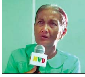
ဒေသခံပြည်သူတစ်ဦး

သင်္ဘောပေါ်ကိုကားနဲ့ ဟိုဘက်ကနေ ခေါ်လာတယ်။ ခေါ်လာပြီးတော့မှ ဇက်ပေါ်ရောက်တယ်။ အဲဒီဇက်ပေါ်ကနေမှ ဒီသင်္ဘောကြီးပေါ်ကိုလာခဲ့ရတယ် အဲဒီလိုမျိုးပါ။ လိုလေသေးမရှိ အဆင်ပြေတယ်။ အားလုံးလို လေသေးမရှိ မနက်စာလည်း ကျေးတယ်။ ညစာလည်းကျေးပေးတယ်ပေါ့နော်။ တာဝန်ကျေပါတယ်။ ကျေးဇူးလည်းတင်တယ်။ နိုင်ငံတော်အကြီးအကဲနဲ့ ယခုလွှတ်လိုက်တဲ့ဆရာတွေ၊ အဖွဲ့သားတွေ အကုန်လုံးကိုလည်း နောက်နှစ်ခါလည်း လာစေချင်တယ်။ လွှတ်ပေးစေချင်တယ်။ လာနိုင်အောင်လည်း ဆုတောင်းပေးပါတယ်လို့။ သတင်းစဉ်