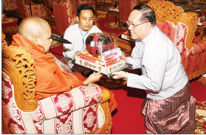
ပြည်ထောင်စုတရားသူကြီးချုပ် ဦးထွန်းထွန်းဦး ဆရာတော်ကြီးထံ လှူဖွယ်ပစ္စည်းများ ဆက်ကပ်လှူဒါန်းစဉ်။