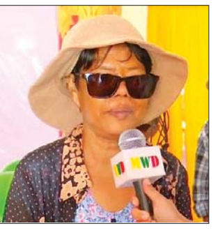
ဒေသခံပြည်သူတစ်ဦး။

“အဆီအကြိတ်လေးဖြစ်နေလို့ လာခဲ့တာပေါ့။ ဒီရောက်လာတော့ သူတို့ နွေးနွေးထွေးထွေးပါပဲ ကြိုဆိုကြတယ်။ ကျွန်တော်တို့ ဒေသလေးက မြို့ပေါ်သာ ပြော တယ်။ မြို့လေးက သေးသေးလေး ဆိုတော့ ဖွံ့ဖြိုးမှုလည်း နည်းနည်း နောက်ကျတယ်လေ။ အဲ့တာ ကြောင့် ကျန်းမာရေးနဲ့ပတ်သက် လို့ ယခုလိုမျိုး အခမဲ့ လာရောက် ကုသပေးတဲ့အတွက် အများကြီး ကျေးဇူးတင်ပါတယ်။ အမြဲတမ်း လည်း မကြာမကြာ လာစေချင်ပါ တယ်။ ဆေးရုံက ခုတင် ၅၀ ပဲ ရှိတယ်လေ။ ခုတင် ၅၀ ပဲ ရှိတဲ့ အခါကြတော့ ဆရာဝန် အလုံ အလောက်မရှိဘူး။ ရောဂါတွေက လည်း မျိုးစုံရှိတယ်။ ဆရာဝန်က အလုံအလောက် မရှိတဲ့အခါကြ တော့ ခုလိုစုံစုံလင်လင်လာပြီး ကုသပေးတဲ့အတွက် အများကြီး ကျေးဇူးတင်ပါတယ်။ ခုလို လာရောက် ကုသပေးတဲ့အတွက် နိုင်ငံတော်အကြီးအကဲ အပါအဝင် သက်ဆိုင်ရာ တာဝန်ရှိတဲ့ ပုဂ္ဂိုလ် တွေအားလုံး ကျေးဇူးအထူးတင် ရှိပါတယ်။”