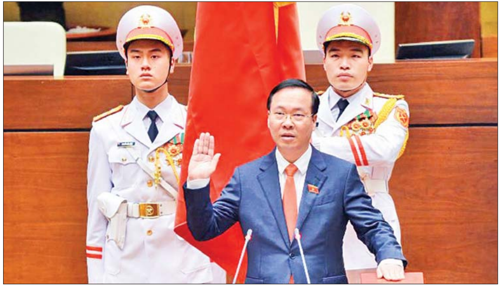
ဗီယက်နမ်နိုင်ငံသမ္မတသစ် ဗိုဘင်သောင် နိုင်ငံတော်သမ္မတအဖြစ် ကျမ်းသစ္စာကျိန်ဆိုစဉ်။