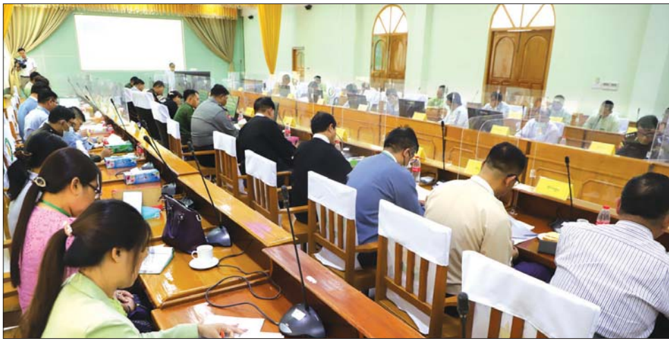
မှာကြားသည်။ ရှင်းလင်းတင်ပြ ဥက္ကဋ္ဌ တိုင်းဒေသကြီး လူမှုရေးရာဝန်ကြီး ဦးအေးလှိုင်က အခမ်းအနားအောင်မြင်စွာ ကျင်းပနိုင်ရေး ကြိုတင် ပြင်ဆင်ဆောင်ရွက်ထားရှိမှုများနှင့် ပတ်သက်၍

မုံရွာ မတ် ၂ စစ်ကိုင်းတိုင်းဒေသကြီး ဝန်ကြီးချုပ် ဦးမြတ်ကျော်သည် မတ် ၁ ရက် မွန်းလွဲပိုင်းတွင် တိုင်းဒေသကြီးအစိုးရအဖွဲ့ရုံး အစည်းအဝေးခန်းမ၌ ကျင်းပသည့် ၂၀၂၃ ခုနှစ် သာသနာတော်ဆိုင်ရာ ဘွဲ့တံဆိပ်တော်များ ဆက်ကပ်အပ်နှင်းချီးမြှင့်ပွဲနှင့် တပေါင်းလပြည့်နေ့တွင် ဘာသာရေး အလှူဒါနကုသိုလ်ကောင်းမှုများ ပြုလုပ်ရေးလုပ်ငန်း ညှိနှိုင်းအစည်းအဝေးသို့ တက်ရောက်သည်။