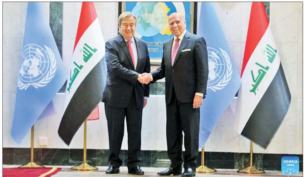
အီရတ်နိုင်ငံခြားရေးဝန်ကြီး ဖူအက်ဒ်ဟူစ်နီနှင့် ကုလသမဂ္ဂအထွေထွေအတွင်းရေးမှူးချုပ် အန်တိုနီယို ဂူတာရက်စ် တို့တွေ့ဆုံစဉ်။