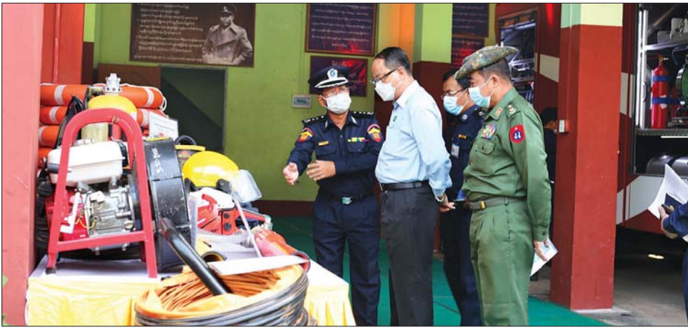
ယင်းနောက် ပြည်နယ်ဝန်ကြီးချုပ်၊ လုံခြုံရေးနှင့် မီးငြိမ်းသတ်ယာဉ်နှင့် ရေသယ်ယာဉ်များကို နယ်စပ်ရေးရာဝန်ကြီး ဗိုလ်မှူးကြီး မျိုးမင်းနောင်နှင့် ကြည့်ရှုစစ်ဆေးခဲ့ပြီး မီးသတ်တပ်ဖွဲ့ဝင်များအတွက် တာဝန်ရှိသူများသည် ပြည်နယ်မီးသတ်ဦးစီးမှူးရုံး တွေ့ဆုံခြင်းသို့မဟုတ် မီးငြိမ်းသတ်ရေး ပစ္စည်းများနှင့် ရှာဖွေကယ်ဆယ်ရေးသုံးပစ္စည်းများကို ငွေကျပ်ငါးသိန်းကို ထောက်ပံ့ပေးအပ်ခဲ့သည်။ စောမျိုးမင်းသိန်း (ပြန်/ဆက်)

ထမ်းဆောင်ကြစေလိုကြောင်း၊ လိုအပ်သည်များ အခက်အခဲများကို ရှင်းနှိုးပွင့်လင်းစွာ တင်ပြဆွေးနွေးပေးကြစေလိုကြောင်း ပြောကြားသည်။ ထို့နောက် ပြည်နယ်မီးသတ်ဦးစီးမှူးရုံး ညွှန်ကြားရေးမှူးရုံး ဦးတင်မောင်နီက နှစ်အလိုက် ပြည်နယ် အတွင်းမီးလောင်မှုဖြစ်ပွားသည့်အကြိမ်အရေအတွက်၊ ရှာဖွေကယ်ဆယ်ရေးဆောင်ရွက်မှု နှိုင်းယှဉ်ချက်၊ မြို့နယ်အလိုက် အရန်မီးသတ် တပ်ဖွဲ့ဝင်အင်အား၊ ရှာဖွေကယ်ဆယ်ရေးအဖွဲ့ ဖွဲ့စည်းထားရှိမှု၊ ပြည်နယ်အတွင်း မီးသတ်ယာဉ်များ အရေအတွက်နှင့် ဖြန့်ခွဲထားရှိမှု၊ ပြည်နယ်အတွင်း မီးသတ်စခန်းများ ဖွင့်လှစ်ထားရှိမှုအခြေအနေများကို ရှင်းလင်းတင်ပြပြီး ခရိုင်၊ မြို့နယ်၊ နယ်မြေ မီးသတ်စခန်းမှူးများက တာဝန်ထမ်းဆောင်ရာတွင် ကြုံတွေ့ရသည့် အခြေအနေများကို ဆွေးနွေးတင်ပြ ကြရာ ပြည်နယ်ဝန်ကြီးချုပ်က ပေါင်းစပ်ညှိနှိုင်းဖြည့်ဆည်းဆောင်ရွက်ပေးသည်။