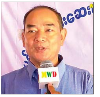
ဒေသခံပြည်သူတစ်ဦး။

ချမ်းချမ်းသာသာနဲ့ လိုရာခရီး တွေ ရောက်ပါစေလို့ ဆုတောင်း ပေးပါတယ်။”