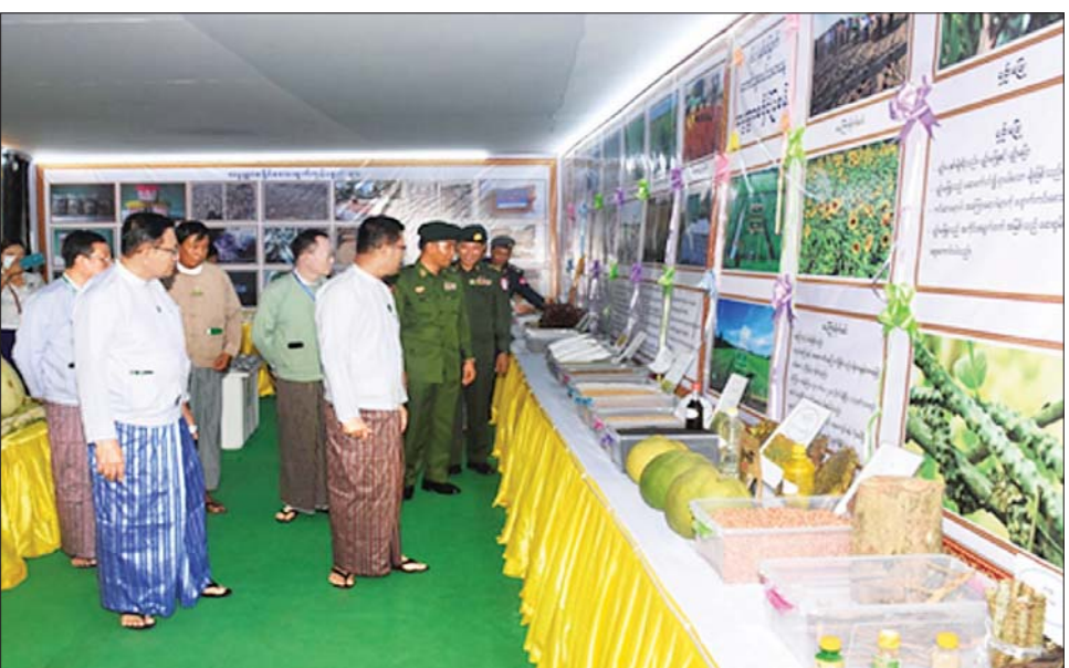
တိုင်းဒေသကြီး ဝန်ကြီးချုပ် ဦးတင်မောင်ဝင်းနှင့် အဖွဲ့ဝင်များ ခင်းကျင်းပြသထားသော ပြခန်းများကို လိုက်လံကြည့်ရှုအားပေးစဉ်။

နေပြည်တော် မတ် ၂ ရော့ဝတီတိုင်းဒေသကြီး ပုသိမ် ခရိုင် ကန်ကြီးထောင့်မြို့နယ် ဝါးဒူးကျေးရွာ၌ ယနေ့တွင် ပြုလုပ်သော (၆၁) နှစ်မြောက် တောင်သူလယ်သမားနေ့ အခမ်းအနားသို့ တိုင်းဒေသကြီး ဝန်ကြီးချုပ် ဦးတင်မောင်ဝင်း၊ စိုက်ပျိုးရေး၊ မွေးမြူရေးနှင့် ဆည်မြောင်းဝန်ကြီးဌာန ဒုတိယ ဝန်ကြီး ဒေါက်တာ အောင်ကြီး၊ အနောက်တောင်တိုင်း စစ်ဌာနချုပ် တိုင်းမှူး ဗိုလ်မှူးချုပ် ကြည်ခိုင်နှင့် တာဝန်ရှိသူများ၊ အစိုးရအဖွဲ့ဝင်ဝန်ကြီးများ၊ ဌာနဆိုင်ရာဝန်ထမ်းများ၊ တောင်သူလယ်သမားများနှင့် ဖိတ်ကြားထားသူများ တက်ရောက်ကြသည်။