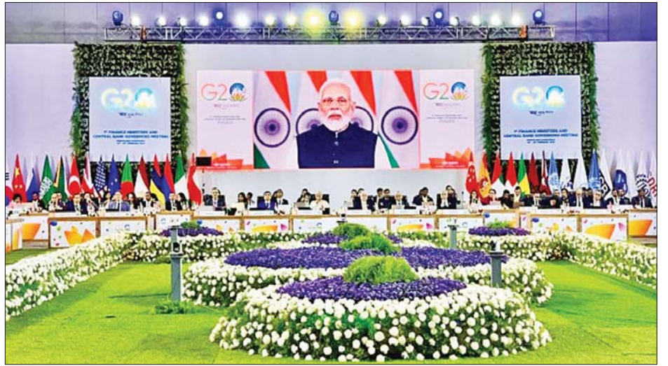
ဂျီ - ၂၀ အစည်းအဝေး၌ ဝန်ကြီးချုပ် မိုဒီ အမှာစကားပြောကြားစဉ်။