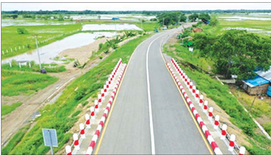
ဘိုကလေး - မော်လမြိုင်ကျွန်း- ကျုံမငေးလမ်း(ဘိုကလေး- ဘိုးဘေး- အညာစုအပိုင်း) အဆင့်မြှင့်တင်ခြင်း လုပ်ငန်းဆောင်ရွက်ပြီးစီးမှုကို တွေ့ရစဉ်။

ထိုသို့ ဒေသတွင်းထွက်ရှိသည့် ထွက်ကုန်များကို စေ့ကွက်သို့အချိန်မီ တင်ပို့ရောင်းချပြီး ဒေသစီးပွား ဖွံ့ဖြိုးစေရန် လမ်းကွန်ရက်များကို တိုင်းဒေသကြီး အတွင်း အဆင့်မြှင့်တင်လျက်ရှိသည်။ တိုင်းဒေသကြီး အတွင်း ကြွယ်ဝစွာတည်ရှိသည့် သဘာဝ မြစ်၊ ချောင်း၊ အင်း၊ အိုင်များသည် ဒေသခံပြည်သူများ သွားလာ ဆက်သွယ်ရေးကို အဟန့်အတားမဖြစ်စေ ဘဲ ဒေသတွင်း လူမှုစီးပွားကို အကျိုးပြုနိုင်စေရန် ဆောက်လုပ်ရေးဝန်ကြီးဌာန လမ်းဦးစီးဌာန အနေ ဖြင့် ကြိုးပမ်းဖော်ဆောင်လျက်ရှိသည်။