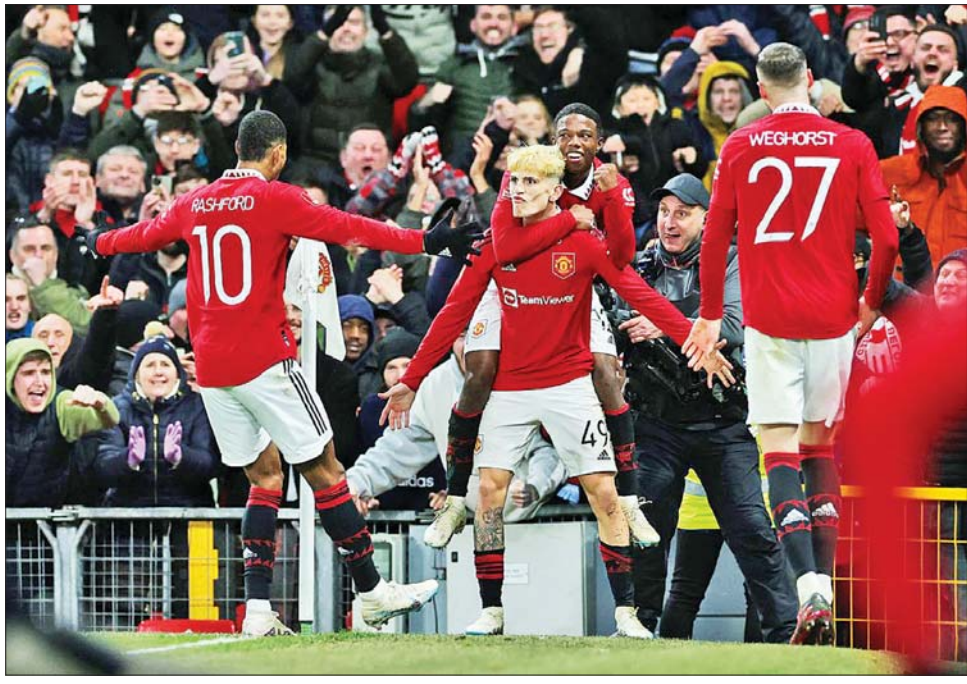
မန်ယူအသင်းမှ ဂါနာချို ဂိုးသွင်းယူပြီးနောက် အသင်းသားများနှင့်အတူ အောင်ပွဲခံနေစဉ်။

အက်ဖ်အေဖလားပြိုင်ပွဲ ပဉ္စမ အဆင့်မှ မတ် ၂ ရက် နံနက် ၂ နာရီ ၁၅ မိနစ်က အိုးထရက်ဖွဲ့ဒီကွင်း၌ ယှဉ်ပြိုင်ကစားခဲ့သည့် မန်ယူနှင့် ဝက်စ်ဟမ်းအသင်းတို့ ပွဲစဉ်တွင် မန်ယူအသင်းက ဂါနာချို၊ ဖရတ် တို့၏ နောက်ကျသွင်းဂိုးများကြောင့် သုံးဂိုး - တစ်ဂိုးဖြင့် အနိုင်ရရှိပြီး နောက်တစ်ဆင့် တက်လှမ်းနိုင်ခဲ့သည်။ အဆိုပါ ပွဲစဉ်ကို ပွဲကြည့် ပရိသတ် ၇၂၀၀၀ ကျော် လာရောက်ကြည့်ရှုခဲ့သည်။ ပွဲထွက် ၁၁ ဦးစာရင်းတွင် အဓိက ကစားသမားအချို့ အနားပေးထား သော ကာရာဘောင် ဖလား ချန်ပီယံ မန်ယူအသင်းသည် စာမျက်နှာ ၉ ကော်လံ ၃