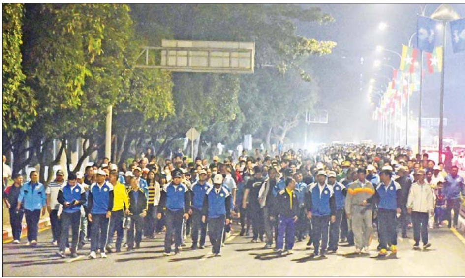
ရန်ကုန်တိုင်းဒေသကြီး ဒီဇင်ဘာအားကစားလ လူထုစုပေါင်းလမ်းလျှောက်ပွဲ ကျင်းပစဉ်။

ကျောင်းသားလူငယ်များသည် ငယ်စဉ်ဘဝ ကပင် အားကစားကို လိုက်စားခြင်းအားဖြင့် အချိန် ကိုအကျိုးရှိစွာ အသုံးပြုတတ်လာပြီး အားလပ်ချိန်တွင် အားကစားပြုလုပ်ခြင်းဖြင့် ဆေးလိပ်သောက်ခြင်း၊ အရက်သေစာသောက်စားခြင်း၊ မူးယစ်ဆေးဝါး