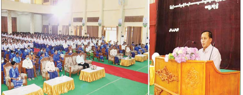
ပိုင်းတွင် လေ့ကျင့်ရေး နယ်စပ် ဒေသ တိုင်းရင်းသားလူငယ်များ စက်မှုလက်မှု ပညာသင်တန်း ကျောင်းနှင့် အမျိုးသမီး အိမ်တွင်း မူသက်မွေးလုပ်ငန်း ပညာ သင်တန်းကျောင်းသို့ ရောက်ရှိပြီး ဝန်ထမ်းများ၊ သင်တန်းသား သင်တန်းသူများနှင့် တွေ့ဆုံကာ ထောက်ပံ့ငွေများ ပေးအပ်ပြီး သင်တန်းအလုပ်ရုံ၊ စာသင်ဆောင် များ၊ အိပ်ဆောင်၊ စားရိပ်သာ၊ မီး၊ ရေ ရရှိမှုအခြေအနေ၊ သင်တန်း သား သင်တန်းသူများ လက်တွေ့ စာတွေ့ သင်ကြားနေမှု၊ အသက် မွေးဝမ်းကျောင်း အလုပ်အကိုင် ဖန်တီးပေးနိုင်မှုကို ကြည့်ရှု စစ်ဆေးသည်။ ဖေဖော်ဝါရီ ၂၃ ရက် နံနက် စက်မှုလက်မှု ပညာသင်တန်း ကျောင်းနှင့် အမျိုးသမီး အိမ်တွင်း မူသက်မွေးလုပ်ငန်း ပညာ သင်တန်းကျောင်းသို့ ရောက်ရှိပြီး ဝန်ထမ်းများ၊ သင်တန်းသား သင်တန်းသူများနှင့် တွေ့ဆုံကာ ထောက်ပံ့ငွေများ ပေးအပ်ပြီး သင်တန်းအလုပ်ရုံ၊ စာသင်ဆောင် များ၊ အိပ်ဆောင်၊ စားရိပ်သာ၊ မီး၊ ရေ ရရှိမှုအခြေအနေ၊ သင်တန်း သား သင်တန်းသူများ လက်တွေ့ စာတွေ့ သင်ကြားနေမှု၊ အသက် မွေးဝမ်းကျောင်း အလုပ်အကိုင် ဖန်တီးပေးနိုင်မှုကို ကြည့်ရှု စစ်ဆေးသည်။ ဖေဖော်ဝါရီ ၂၃ ရက် နံနက် များ၊ ကျောင်းသား ကျောင်းသူများ နှင့် နေ့လယ်စာကို အတူတကွ သုံးဆောင်သည်။ ထို့နောက် ကျောင်းအုပ်ကြီး နှင့် ဌာနမှူးများ၊ ပါမောက္ခများ နှင့် လည်းကောင်း၊ ဆရာ ဆရာမ များ၊ ကျောင်းသား ကျောင်းသူများ နှင့်လည်းကောင်း တွေ့ဆုံ၍ (အပေါ်ပုံ) တင်ပြချက်များအပေါ် ပေါင်းစပ်ညှိနှိုင်း ဖြည့်ဆည်း ဆောင်ရွက်ပေးပြီး နယ်စပ်ရေးရာ ဝန်ကြီးဌာန ညောင်နတ်ပင် စိုက်ပျိုးမွေးမြူရေး အထူးဇုန်(၃) ကို ရောက်ရှိစစ်ဆေးကြောင်း သိရသည်။ သတင်းစဉ်

နေပြည်တော် ဖေဖော်ဝါရီ ၂၄ နယ်စပ်ရေးရာဝန်ကြီးဌာန ဒုတိယ ဝန်ကြီး ဗိုလ်ချုပ် ခွန်သန့်ဇော်ထူး သည် ဖေဖော်ဝါရီ ၂၁ ရက် နံနက် ပိုင်းတွင် နယ်စပ်ဒေသနှင့် တိုင်းရင်းသားလူမျိုးများ ဖွံ့ဖြိုး တိုးတက်ရေးဦးစီးဌာန သံတွဲမြို့ နယ် ဒေသဖွံ့ဖြိုးမှု ကြီးကြပ်ရေးရုံး ၌ တာဝန်ရှိသူများနှင့် တွေ့ဆုံပြီး နယ်စပ်ဒေသ ဖွံ့ဖြိုးရေးလုပ်ငန်း ဆောင်ရွက်ပြီးစီးမှု တင်ပြချက် များအပေါ် လိုအပ်သည်များ ပေါင်းစပ်ညှိနှိုင်းပေးသည်။ ထို့နောက် ဝှံမြို့သို့ ရောက်ရှိ ကာ ပညာရေးနှင့် လေ့ကျင့်ရေး ဦးစီးဌာန အိမ်တွင်းသက်မွေး လုပ်ငန်း သင်တန်းကျောင်း ဆောက်လုပ်မည့် မြေနေရာကို ကြည့်ရှုစစ်ဆေး၍ နယ်စပ်ရေးရာ ဝန်ကြီးဌာနက ထည့်ဝင်လှူဒါန်း ငွေဖြင့် ဆောင်ရွက်ပြီးစီးခဲ့သည့် ဝှံမြို့ သမိုင်းဝင် မင်းတောင်စေတီ တော်မြတ်ကြီး တောင်တက်လမ်း၊ ကွန်ကရစ်လမ်းသစ်ကို တက် ရောက် ဖွင့်လှစ်ပေးသည်။ ဖေဖော်ဝါရီ ၂၂ ရက် နံနက်