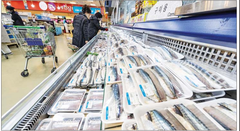
တောင်ကိုရီးယားနိုင်ငံ ဆိုးလ်မြို့ရှိ စုပါမားကတ်တစ်ခုကို တွေ့ရစဉ်။

သို့သော်လည်း ၂၀၂၂ ခုနှစ်အတွင်း ငါးရှဉ့်၊ ခရုနှင့် ထရောက်ငါး ဝယ်လိုအားမြင့်တက်ခဲ့မှုကြောင့် ရေထွက်ကုန် မွေးမြူထုတ်လုပ်မှုကဏ္ဍမှ တန်ချိန် ၂၂၆၈၀၀၀ သာရှိခဲ့ပြီး ငါးပုစွန်ထွက်ရှိမှု ၅ ဒသမ ၆ ရာခိုင်နှုန်းအထိ ကျဆင်းခဲ့သည်။ ကမ်းနီး ငါးဖမ်းလုပ်ငန်းကဏ္ဍတွင် ပြည်ကြီးငါး၊ ငါးပါးနီနှင့် ငါးသင် ဝါငါးရရှိမှု နည်းပါးသဖြင့် ထုတ်လုပ်မှုတန်ချိန် ၈၈၇၀၀၀ သာရရှိခဲ့ပြီး ၅ ဒသမ ၉ ရာခိုင်နှုန်း ကျဆင်းခဲ့သည်။ ထို့အတူ ကမ်းဝေးရေကမ်း ငါးဖမ်း