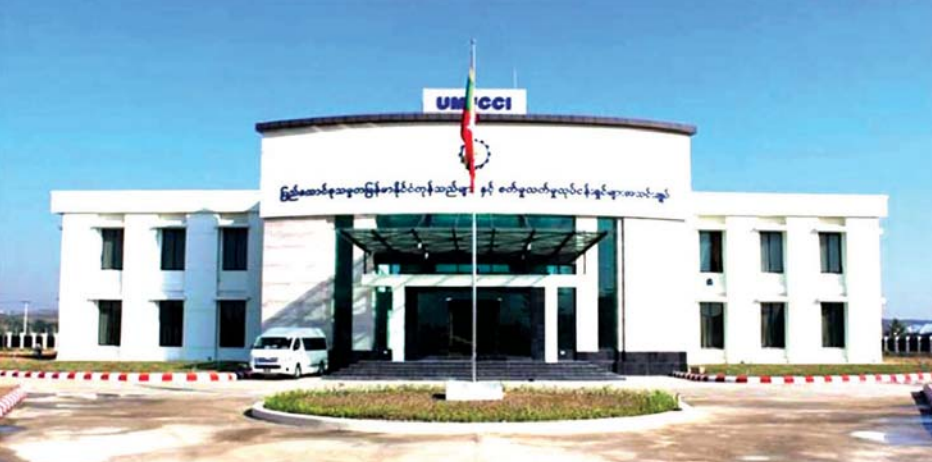
ပြည်ထောင်စုသမ္မတ မြန်မာနိုင်ငံကုန်သည်များနှင့် စက်မှုလက်မှုလုပ်ငန်းရှင်များအသင်းချုပ် (နေပြည်တော်)