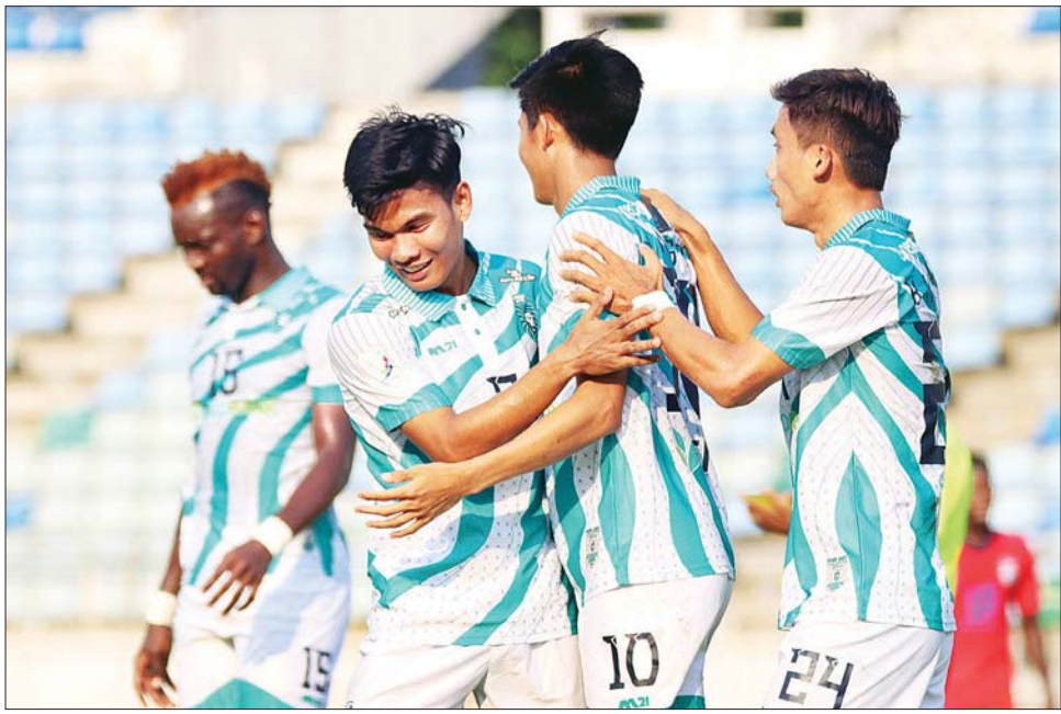
ဇယားထိပ်ဆုံးတွင် ဦးဆောင်နေသည့် ရန်ကုန်အသင်း

ရန်ကုန် ဖေဖော်ဝါရီ ၂၄ ၂၀၂၃ ရာသီ MNL အမှတ်ပေးပြိုင်ပွဲ ပွဲစဉ် (၂) ကို ဖေဖော်ဝါရီ ၂၅ ရက်မှ ၂၈ ရက်အထိ ဆက်လက် ကျင်းပမည်ဖြစ်ပြီး ပွဲစဉ် (၁) တွင် နိုင်ပွဲရထားသည့် ရန်ကုန်အသင်းနှင့် လက်ရှိချန်ပီယံ ရှမ်းယူနိုက်တက် အသင်းသည် ဟံသာဝတီအသင်းနှင့် ပွဲကျပ်ကစား ရမည်ဖြစ်သည်။ ပွဲစဉ် (၂) အဖြစ် ဖေဖော်ဝါရီ ၂၅ ရက်တွင် သုဝဏ္ဏ ကွင်း၌ ဧရာဝတီအသင်းနှင့် အား/ကာသိပွဲ အသင်း၊ ဖေဖော်ဝါရီ ၂၆ ရက်တွင် သုဝဏ္ဏကွင်း၌ ရခိုင်ယူနိုက်တက်အသင်းနှင့် ဒဂုံစတားအသင်း၊ ဖေဖော်ဝါရီ ၂၇ ရက်တွင် သုဝဏ္ဏကွင်း၌ ဟံသာဝတီ အသင်းနှင့် လက်ရှိချန်ပီယံ ရှမ်းယူနိုက်တက်အသင်း၊ YUSC ကွင်း၌ ရန်ကုန်အသင်းနှင့် မြဝတီအသင်း၊ ဖေဖော်ဝါရီ ၂၈ ရက်တွင် YUSC ကွင်း၌ ကချင် ယူနိုက်တက်အသင်းနှင့် မဟာယူနိုက်တက်အသင်း၊ စာမျက်နှာ ၂၀ ကော်လံ ၄ □