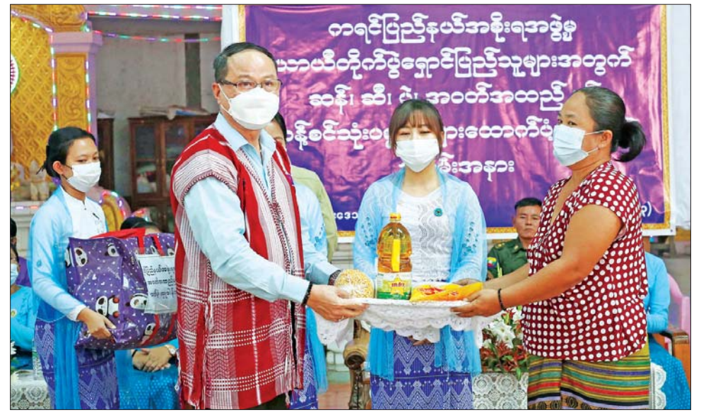
ပြောကြားပြီး လှိုင်းဘွဲ့မြို့နယ်ရှိ အသက်(၈၅)နှစ်နှင့် အထက် အဘိုး ၄၁၆ ဦး၊ အဘွား ၆၃၆ ဦး စုစုပေါင်း ၁၀၅၂ ဦးအတွက် လူမှုရေးပင်စင်ထောက်ပံ့ငွေကျပ် ၃၀၅၆၀၀၀ ကို လှိုင်းဘွဲ့မြို့နယ် အုပ်ချုပ်ရေးမှူးထံ ပေးအပ်ကာ ပြည်နယ်ဝန်ကြီးချုပ်၊ ပြည်နယ် အမျိုး သမီးရေးရာအဖွဲ့နာယက ပြည်နယ်ဝန်ကြီးချုပ်၏ဇနီး ဒေါ်နန်းဘေဘီမြင့်နှင့်အဖွဲ့၊ ပြည်နယ်အစိုးရအဖွဲ့ ဝင်များက အဘိုးအဘွားများအား ထောက်ပံ့ငွေနှင့် အသုံးအဆောင်ပစ္စည်းများ ပေးအပ်ပြီး အခမ်းအနား သို့တက်ရောက်နိုင်ခြင်းမရှိသော အဘိုးအဘွားများ အား တာဝန်ရှိသူများက အိမ်တိုင်ရာရောက် သွားရောက်ထောက်ပံ့ပေးသွားမည်ဖြစ်ကြောင်း သိရ သည်။ စောမျိုးမင်းသိန်း(ပြန်/ဆက်)

လေပြင်းဒဏ်ကြိုတင်ပြင်ဆင်ခြင်းလုပ်ငန်းအတွက် ထောက်ပံ့ငွေကျပ် ၉၇၀၀၀၀၀၊ လူမှုဝန်ထမ်းဦးစီးဌာန က မြိုင်ကြီးငူအထူးဒေသအတွင်းရှိ အသက်(၈၅) နှစ် နှင့် အထက် အဘိုး ၁၆ ဦး၊ အဘွား ၃၄ ဦး စုစုပေါင်း ၅၀ အတွက် လူမှုရေးပင်စင်ထောက်ပံ့ငွေ ကျပ် ၁၅၀၀၀၀ တို့ကို ထောက်ပံ့ပေးအပ်သည်။ ပြည်နယ်ဝန်ကြီးချုပ်နှင့် အဖွဲ့သည် မြိုင်ကြီးငူ အထူးဒေသ နန်းဦးဘေးမဲတောရကျောင်းတိုက်ဦးစီး ပဓာနနာယက ဆရာတော် ဘဒ္ဒန္တဉာဏိကအား သွားရောက်ဖူးမြော်ကြည်ညိုကြပြီး ထီးဖိုးကလုံး- မြိုင်ကြီးငူ-မဲသေဝေါလမ်းပိုင်း ကတ္တရာလမ်းသစ် ခင်းခြင်းနှင့် ပြုပြင်ထိန်းသိမ်းစရိတ် ငွေကျပ် ၈၅၀၀၀၀၀၊ လှူဖွယ်ဝတ္ထုပစ္စည်းများနှင့် နဝကမ္မ အလှူငွေများ ဆက်ကပ်လှူဒါန်းကြသည်။ ထို့ပြင် ကရင်ပြည်နယ် လှိုင်းဘွဲ့မြို့နယ်အတွင်းရှိ အသက် (၈၅)နှစ်နှင့်အထက် သက်ကြီးအဘိုးအဘွား များကို လူမှုရေးပင်စင် တစ်လလျှင် တစ်သောင်းနှုန်း ဖြင့် သုံးလတစ်ကြိမ် ထောက်ပံ့ပေးလျက်ရှိရာ ၂၀၂၂- ၂၀၂၃ ဘဏ္ဍာနှစ် တတိယသုံးလပတ်အတွက် ထောက်ပံ့ငွေပေးအပ်သည့်အခမ်းအနားကို မြို့နယ် အထွေထွေအုပ်ချုပ်ရေးဦးစီးဌာနရုံးခန်းမ၌ ကျင်းပ ရာ ပြည်နယ်ဝန်ကြီးချုပ် တက်ရောက်အမှာစကား