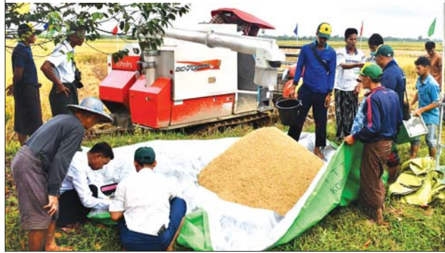
နွေစပါး ၇၉၆၃ ဧက စိုက်ပျိုးနိုင်ခဲ့ပြီး မိုးစပါးအနေဖြင့် တစ်ဧက အထွက်နှုန်း ၇၁ ဒသမ ၇၉ တင်းနှုန်းထွက်ရှိခဲ့၍ လာမည့်နှစ်တွင် စပါးစိုက်ဧကများမှ အထွက်တိုးမျိုးစပါး ပြောင်းလဲစိုက်ပျိုးရန်၊ တစ်တိုင်းလုံးတွင် မိုးစပါး ၅၆၅၄ ဧကနှင့် နွေစပါး ၁၆၃၁ ဧက စိုက်ပျိုးရန် လျာထားကြောင်း သိရသည်။ ခိုင်ထူး (ပြန်/ဆက်)

တောင်သူများနှင့် လယ်ယာဝန်ဆောင်မှုအသင်းမှ တောင်သူများအား လယ်ယာဝန်ဆောင်မှုများ ဆောင်ရွက်ပေးမည်ဖြစ်ကြောင်း သိရသည်။ ဒေသတွင်းဝမ်းစာဖူလုံရန် စပါးစိုက်ဧကတိုးချဲ့ခြင်းထက် တစ်ဧက အထွက်နှုန်းတိုးတက်ရေး ဆောင်ရွက်ကြရန် လိုအပ်ကြောင်း၊ တိုင်းဒေသကြီးတွင် မိုးစပါးကို ဧကနှစ်သိန်းကျော် စိုက်ပျိုးကြပြီး နွေစပါးအနေဖြင့် စိုက်ပျိုးမှုနည်းပါးကြောင်း၊ တိုင်းဒေသကြီး ဒေသ ဝမ်းစာဖူလုံမှုအနေဖြင့် ၇၂ ဒသမ ၈၇ ရာခိုင်နှုန်းသာရှိကြောင်း၊ ဒေသခံ များ စားသုံးရန် ဆန်တန်ချိန်သုံးသိန်းခန့်လိုအပ်ကြောင်း၊ ဆန်စပါး ထွက်ရှိမှုအနေဖြင့် ဆန်တန်ချိန်နှစ်သိန်းနှစ်သောင်းခန့်သာ ထွက်ရှိ သည့်အတွက် ဆန်တန်ချိန်ခုနစ်သောင်းကျော် လိုအပ်ကြောင်း၊ ယခု ထက် ပိုမိုပြီး ဒေသဝမ်းစာဖူလုံမှုရှိအောင် လိုအပ်သည်များကို ဆောင်ရွက်ပေးမည်ဖြစ်ပြီး တောင်သူများအနေဖြင့် စပါးအထွက် တိုးရန်အတွက် စိုက်ပျိုးပေးကြစေလိုကြောင်း တိုင်းဒေသကြီး ဝန်ကြီးချုပ်က တိုက်တွန်းပြောကြားထားသည်။ တိုင်းဒေသကြီးအတွင်း ယခုနှစ်တွင် မိုးစပါး ၂၂၃၇၄၇ ဧကနှင့်