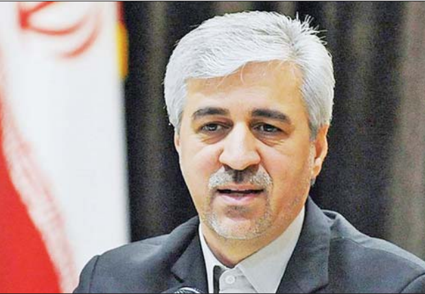
အီရန်အားကစားရေးရာဝန်ကြီး ဟာမစ် ဆာဂျာဒီ။

တီဟီရန် ဖေဖော်ဝါရီ ၂၄ အီရန်အားကစားရေးရာဝန်ကြီး ဟာမစ် ဆာဂျာဒီသည် ဖေဖော်ဝါရီ ၂၃ ရက်က ရဟတ်ယာဉ်ပျက်ကျမှု ဖြစ်ပွားပြီးနောက် ဦးနှောက်သွေးယို စီးမှုဝေဒနာခံစားရပြီး သတိလစ်သွားကြောင်း တရားဝင် သတင်းအေဂျင်စီ အိုင်အာအင်န်အေက ဖေဖော်ဝါရီ ၂၄ ရက်တွင် ဖော်ပြသည်။