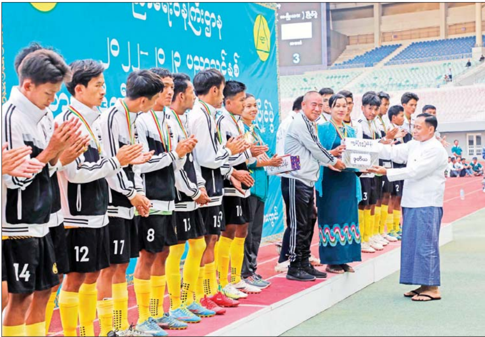
နိုင်ငံတော်စီမံအုပ်ချုပ်ရေးကောင်စီဝင် ဗိုလ်ချုပ်ကြီး တင်အောင်စန်း ပထမဆုရရှိသည့် ဘားအံပညာရေး ဒီဂရီကောလိပ်အသင်းကို တစ်ဦးချင်းဆုတံဆိပ် ပေးအပ်ချီးမြှင့်စဉ်။