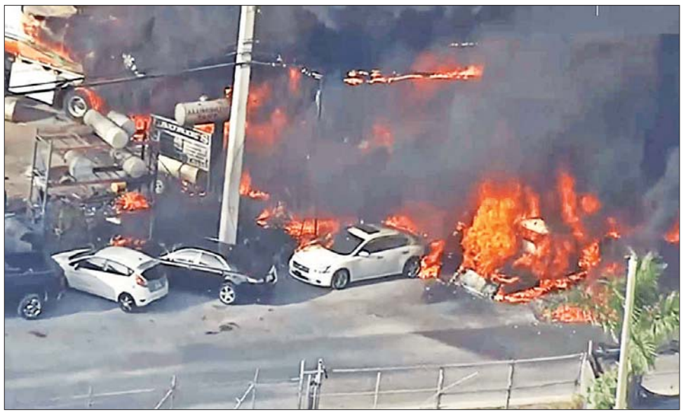
အမေရိကန်ပြည်ထောင်စု ဖလော်ရီဒါပြည်နယ်ရှိ ဂဟေဆက်လုပ်ငန်းကုမ္ပဏီတစ်ခုတွင် မီးလောင်ပေါက်ကွဲမှုတစ်ခုဖြစ်ပွားနေသည်ကို တွေ့ရစဉ်။