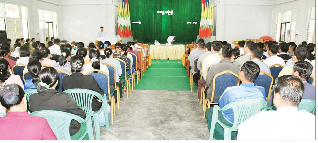
နိုင်ငံတော်စီမံအုပ်ချုပ်ရေးကောင်စီအဖွဲ့ဝင်၊ ဒုတိယဝန်ကြီးချုပ်နှင့် ကာကွယ်ရေးဝန်ကြီးဌာန ပြည်ထောင်စုဝန်ကြီး ဗိုလ်ချုပ်ကြီး မြထွန်းဦး ကလေးမြို့ မြို့နယ်စုပေါင်းရုံးခန်းမ၌ ခရိုင်၊ မြို့နယ်အဆင့်ဌာနဆိုင်ရာများ၊ ကျန်းမာရေးဝန်ထမ်းများ၊ ပညာရေးဝန်ထမ်းများနှင့် တွေ့ဆုံပွဲတွင် အမှာစကားပြောကြားစဉ်။

ချုပ် ဦးမြတ်ကျော်နှင့် တာဝန်ရှိသူများသည် ကလေးမြို့ မြို့နယ်စုပေါင်းရုံးခန်းမ၌ ခရိုင်၊ မြို့နယ်အဆင့် ဌာနဆိုင်ရာများ၊ ကျန်းမာရေး ဝန်ထမ်းများ၊ ပညာရေးဝန်ထမ်းများနှင့် တွေ့ဆုံအမှာစကားပြောကြားပြီး တက်ရောက်လာကြသူများအား ထောက်ပံ့ပစ္စည်းများနှင့် စားသောက်ဖွယ်ရာများ ပေးအပ်သည်။