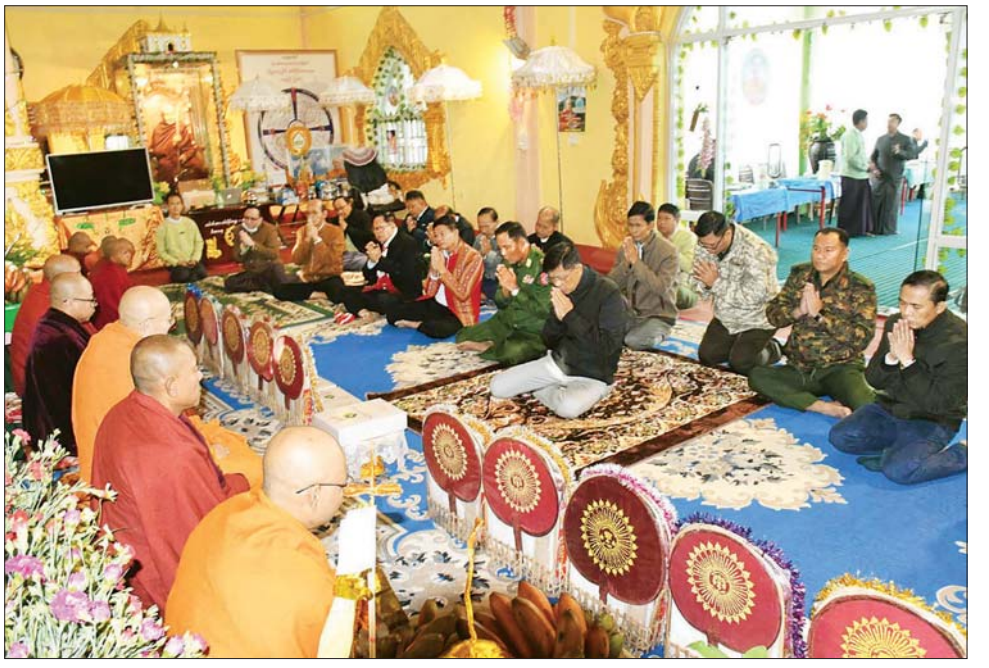
စီမံအုပ်ချုပ်ရေးကောင်စီအဖွဲ့ဝင်၊ ဒုတိယဝန်ကြီးချုပ်နှင့် ကာကွယ်ရေးဝန်ကြီးဌာန ပြည်ထောင်စု

သည် ဟားခါးမြို့ နယ်မြေခံတပ်နယ်ခန်းမ၌ အရာရှိ စစ်သည်မိသားစုဝင်များအား တွေ့ဆုံအမှာစကားပြောကြားပြီး တပ်နယ်မိသားစုများအား ဂုဏ်ပြုချီးမြှင့်ငွေများ၊ ထောက်ပံ့ပစ္စည်းနှင့် စားသောက်ဖွယ်ရာများ ပေးအပ်ကာ တက်ရောက်လာသော အရာရှိ၊ စစ်သည်၊ မိသားစုဝင်များအား ရင်းရင်းနှီးနှီး လိုက်လံနှုတ်ဆက်သည်။ မွန်းလွဲပိုင်းတွင် နိုင်ငံတော်