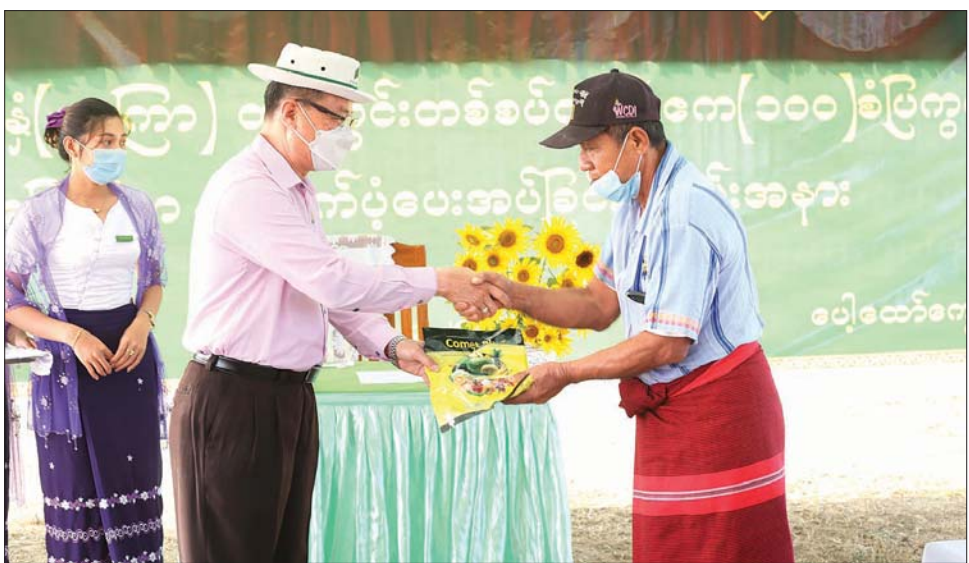
ဦးစောမြင့်ဦးသည် အောင်မြင်မြေဩဇာထောက်ပံ့ပေးအပ်ခြင်းအား အထောက်အကူပြုပေးရန်အတွက် ရွက်ဖျန်းမြေဩဇာထောက်ပံ့ပေးအပ်ခဲ့ခြင်းဖြစ်ကြောင်း ပြောကြားသည်။

ပြည်နယ်အတွင်း စားသုံးဆီဖူလုံမှုတိုးတက်ရေးအတွက် မြေပဲ၊ နှမ်း၊ နေကြာ၊ ပဲပုပ် အစရှိသော ဆီထွက်သီးနှံများကို တိုးချဲ့စိုက်ပျိုးလျက်ရှိရာ ကရင်ပြည်နယ်ဝန်ကြီးချုပ် ဦးစောမြင့်ဦးသည် ဖေဖော်ဝါရီ ၂၂ ရက် နံနက်ပိုင်းက ဘားအံမြို့နယ် ပေါ့ထော်ကျေးရွာအုပ်စု မင်းဇီတောင်သူကွင်းရှိ တစ်ကွင်းတစ်ဆက်တည်းဧက ၁၀၀ ဆောင်းဆီထွက်သီးနှံ(နေကြာ)စိုက်တောင်သူများအား ရွက်ဖျန်းမြေဩဇာထောက်ပံ့ပေးအပ်သည်။