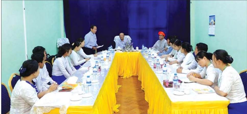
ပြည်ထောင်စုဝန်ကြီး Jeng Phang နော်တောင် ဝန်ထမ်းများအား တွေ့ဆုံအမှာစကားပြောကြားစဉ်။

စစ်ကိုင်းတိုင်းဒေသကြီး မုံရွာမြို့တွင် ရောက်ရှိနေသည့် တိုင်းရင်းသား လူမျိုးရေးရာဝန်ကြီးဌာန ပြည်ထောင်စုဝန်ကြီး Jeng Phang နော်တောင်သည် တိုင်းဒေသကြီး၊ တိုင်းရင်းသားရေးရာဝန်ကြီး ဦးစိုင်းနိုင်နိုင်ကျော်၊ တာဝန်ရှိသူများနှင့် အတူ ဖေဖော်ဝါရီ ၁၉ ရက်က စစ်ကိုင်းတိုင်းဒေသကြီး အစိုးရအဖွဲ့ရုံး အစည်းအဝေးခန်းမ၌ စစ်ကိုင်းတိုင်းဒေသကြီး အတွင်းရှိ တိုင်းရင်းသား စာပေနှင့် ယဉ်ကျေးမှု ဦးစီးဌာနနှင့် တိုင်းရင်းသား အခွင့်အရေးများ ကာကွယ်စောင့်ရှောက်ရေးဦးစီးဌာနတို့မှ ဝန်ထမ်းများနှင့် တွေ့ဆုံ အမှာစကားပြောကြားသည်။