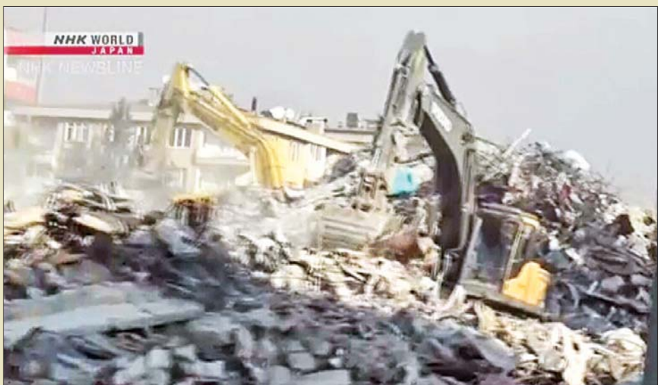
တူကီယိုနိုင်ငံ၌ အလွန်ပြင်းထန်သော ငလျင်လှုပ်ခတ်ပြီးနောက် အပျက်အစီးများကို ဖယ်ရှားရှင်းလင်းစဉ်။

ဟု ကုလသမဂ္ဂဖွံ့ဖြိုးတိုးတက်မှု အစီအစဉ်မှ တူကီယိုဆိုင်ရာ ကိုယ်စားလှယ် လူဝီဆာဗင်တန်က ပြောသည်။ အပျက်အစီးများကို လျင်မြန်စွာ ဖယ်ရှားပစ်ရမည်ဖြစ်ပြီး သို့မှသာ စီးပွားရေးအသိုက်အဝန်းသစ်များ ပြန်လည်တည်ဆောက်နိုင်မည်ဖြစ်သည်ဟု ၎င်းကပြောသည်။ ထိုစဉ် ငလျင်ဘေးဒဏ်ခံဒေသမှ ပြည်သူများမှာ ၎င်းတို့ဘဝ ပြန်လည်တည်ဆောက်ရေးအတွက် ခက်ခဲစွာ ရုန်းကန်နေရသည်။ အများပြည်သူအိမ်ရာပေါင်း ၂၇၀၀၀၀ ကို တည်ဆောက်ရန် စီစဉ်ထားကြောင်း တူကီယိုအစိုးရက ပြောသည်။ အင်နီအိတ်ချီက