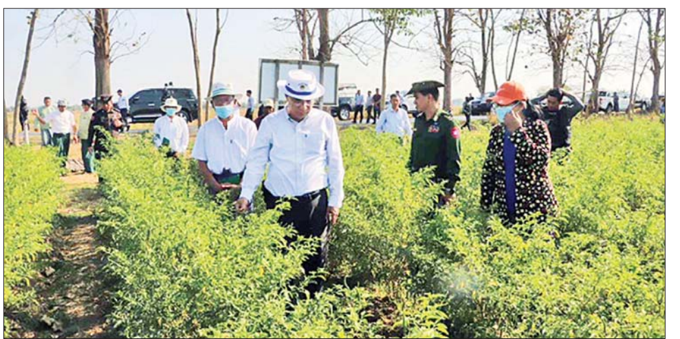
နိုင်ငံရေးနှင့် ပတ်သက်၍ မြို့နယ်အုပ်ချုပ်ရေးမှူးက ရှင်းလင်းတင်ပြရာ တိုင်းဒေသကြီးဝန်ကြီးချုပ်က စိုက်ပျိုးရေးရရှိရေးအတွက် ရေပေးမြောင်းတူးဖော်နိုင်ရေး ဖြည့်ဆည်းဆောင်ရွက်ပေးပြီး နွေစပါးစိုက်ဧကများအားလုံး အစေ့ချစနစ်ဖြင့်သာ စိုက်ပျိုးသွားရန် တာဝန်ရှိသူများအား မှာကြားခဲ့ပြီး နွေစပါးတိုးချဲ့စိုက်ပျိုးရန် ဘော်ဘင်ဆည်ရေသောက် ကျွဲဘီအောင်ပင်သာ တူးမြောင်းတူးဖော်ပြီးစီးမှုကို ကြည့်ရှု

ငါးပြေမ၊ ငါးမြစ်ချင်း၊ ငါးဖန်းမနှင့် ငါးခုံးမကြီး ငါးသားဖောက်ခြင်းလုပ်ငန်းများ ဆောင်ရွက်မှုနေ့မှတို့ကို ကြည့်ရှုစစ်ဆေးပြီး အုတ်ဖိုမြို့နယ် အေးမြသာယာ အခြေခံပညာ အထက်တန်းကျောင်းသို့ သွားရောက်ကာ ပျက်စီးနေသည့် စာသင်ဆောင်နှင့် စာသင်ခုံများ ပြန်လည်ပြင်ဆင်နိုင်ရေး တာဝန်ရှိသူများအား မှာကြားပြီး ထောက်ပံ့ငွေများ ပေးအပ်သည်။ ယင်းနေ့က တိုင်းဒေသကြီးဝန်ကြီးချုပ်နှင့် အဖွဲ့သည် အုတ်ဖိုမြို့နယ် အေးမြသာယာစက်မှုစိုက်ပျိုးရေးနှင့် မွေးမြူရေးအထက်တန်းကျောင်း တည်ဆောက်နေမှုကို ကြည့်ရှုစစ်ဆေးသည်။ ထို့နောက် အေးမြသာယာ ပြည်သူ့ဆေးရုံသို့ သွားရောက်၍ ဆေးရုံတက်လူနာများအား အားပေးစကားပြောကြားပြီး ကျန်းမာရေးဝန်ထမ်းများနှင့် ဆေးရုံတက်လူနာများအား ထောက်ပံ့ငွေများ ပေးအပ်သည်။ ဆက်လက်၍ တိုင်းဒေသကြီးဝန်ကြီးချုပ်နှင့် အဖွဲ့သည် ကြို့ပင်ကောက်မြို့ ဆည်မြောင်းနှင့် ရေအရင်းအမြစ် အသုံးချရေးဦးစီးဌာန၊ တည်ဆောက်ရေး(၂) ရင်းလင်းဆောင်၌ နွေစပါးတို့ချဲ့ စိုက်ပျိုး