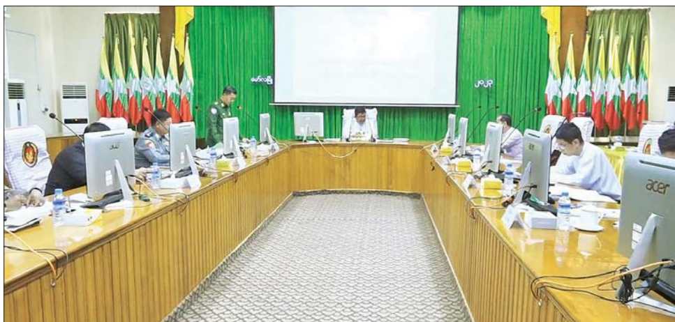
ကျင်းပပြုလုပ်နိုင်ရေး ကော်မတီ အသီးသီးကိုလည်း ဖွဲ့စည်း တာဝန်ပေးအပ်ထားပြီး ဖြစ်ကြောင်း၊ အထိမ်းအမှတ် အခမ်းအနားအပြင် မွန်တိုင်းရင်းသား လူမျိုးတို့၏ ရိုးရာအကအလှများ၊ တိုင်းရင်းသားများ၏ ရိုးရာအကအလှများ ကိုလည်း ပြုစုပေးအပ်ခြင်း ဖြစ်ကြောင်း ပြောကြားသည်။

၂၀၂၃ ခုနှစ် (၄၉) နှစ်မြောက် မွန်ပြည်နယ်နေ့ အခမ်းအနား အောင်မြင်စွာ ကျင်းပနိုင်ရေး အတွက် လုပ်ငန်းညှိနှိုင်းအစည်းအဝေးကို ဖေဖော်ဝါရီ ၂၁ ရက် မွန်းလွဲပိုင်းက ပြည်နယ်အစိုးရအဖွဲ့ရုံး အောင်ဆန်းခန်းမ၌ ကျင်းပသည်။ (ယာပုံ)