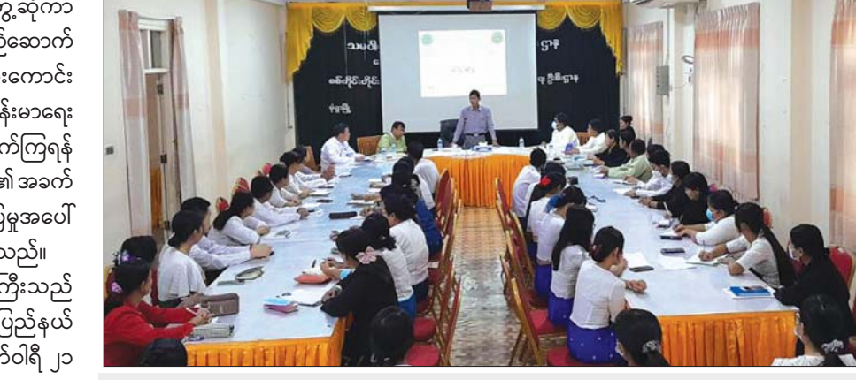
ဒုတိယဝန်ကြီး ဦးမြင့်စိုး မုံရွာမြို့နယ်ရှိ ဝန်ထမ်းများအား တွေ့ဆုံမှာကြားစဉ်။