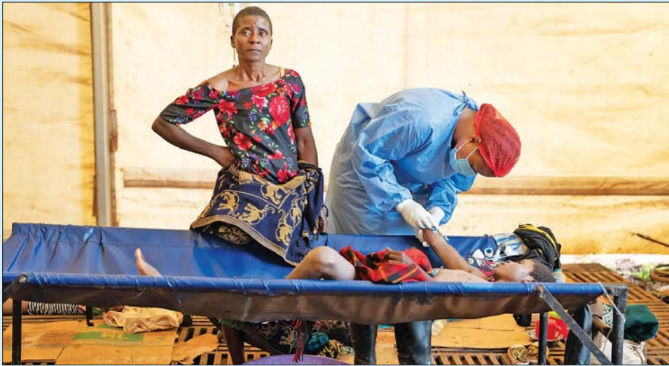
လီလွန်ဂွေးလ်မြို့ရှိ ဆေးရုံတစ်ရုံ၌ ကာလဝမ်းရောဂါဖြစ်ပွားနေသူတစ်ဦးအား ဆေးကုသမှုပေးနေစဉ်။

ကုလသမဂ္ဂ ဖေဖော်ဝါရီ ၁၈ ကုလသမဂ္ဂသည် မာလာဝီနိုင်ငံ အတွင်း အဆိုးရွားဆုံး ကာလ ဝမ်းရောဂါဖြစ်ပွားမှုကို တိုက် ဖျက်ရန်အတွက် မာလာဝီအာဏာ ပိုင်များနှင့်အတူ ပူးပေါင်းလုပ် ဆောင်လျက်ရှိကြောင်း ကုလ သမဂ္ဂပြောရေးဆိုခွင့်ရှိသူ တစ်ဦး က ဖေဖော်ဝါရီ ၁၇ ရက်တွင် ပြောသည်။