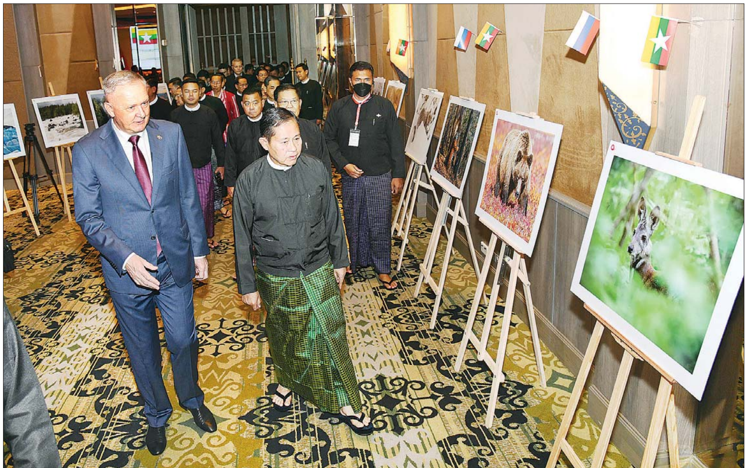
နိုင်ငံတော်စီမံအုပ်ချုပ်ရေးကောင်စီ ဒုတိယဥက္ကဋ္ဌ ဒုတိယဝန်ကြီးချုပ် ဒုတိယဗိုလ်ချုပ်မှူးကြီး စိုးဝင်း၊ မြန်မာနိုင်ငံဆိုင်ရာ ရုရှားဖက်ဒရေးရှင်း သံအမတ်ကြီး ဒေါက်တာ နီကိုလိုင် လစ်စတိုပါဒေါ့ဗ်နှင့် တာဝန်ရှိသူများ မြန်မာ-ရုရှား နှစ်နိုင်ငံ သံတမန်ဆက်ဆံရေး (၇၅) နှစ်မြောက် စိန်ရတုအထိမ်းအမှတ် ဧည့်ခံပွဲအခမ်းအနားသို့ တက်ရောက်လာကြစဉ်။

နှစ်နိုင်ငံ ဆက်ဆံရေး၏ အလယ်ကာလ ၁၉၈၀-၁၉၉၀ ပတ်ဝန်းကျင်မှ ယနေ့အချိန်အထိ မြန်မာနိုင်ငံ၏ အနာဂတ်ကို ပိုင်စိုးကြမည့် မျိုးဆက်သစ် မြန်မာနိုင်ငံသား လူငယ်လူရွယ်များ၏ အသိပညာ၊ အတတ်