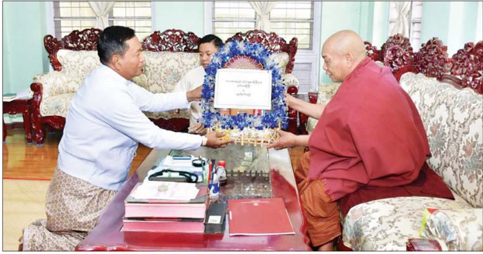
များနှင့်တွေ့ဆုံ၍ ဝန်ထမ်းများအား ပါတီနိုင်ငံရေးကင်းရှင်းရန်၊ သာသနာရေးတာဝန်များကို ကျေပွန်စွာ ထမ်းဆောင်ရန် မှာကြားပြီး ဝန်ထမ်းများ၏ တင်ပြချက်များကို ဖြည့်ဆည်းဆောင်ရွက်ပေးကာ မန္တလေးတိုင်းဒေသကြီး/ခရိုင် သာသနာရေးမှူးရုံးများကို ကြည့်ရှုစစ်ဆေးသည်။ ယနေ့ နံနက်ပိုင်းတွင် ဒုတိယဝန်ကြီးသည် ပါမောက္ခချုပ် ဆရာတော်အဂ္ဂမဟာပဏ္ဍိတ ဒေါက်တာဘဒ္ဒန္တကေသရ အမှူးပြုသော သင်ကြားစီမံဆရာတော်များ၊ စာသင်သား သံဃာတော်

မန္တလေး ဖေဖော်ဝါရီ ၁၈ သာသနာရေးနှင့် ယဉ်ကျေးမှုဝန်ကြီးဌာန ဒုတိယဝန်ကြီး ဦးအေးထွန်းနှင့် တာဝန်ရှိသူများသည် ယမန်နေ့က နိုင်ငံတော်ပရိယတ္တိ သာသနာ့တက္ကသိုလ်(မန္တလေး)သို့ ရောက်ရှိပြီး ပါမောက္ခချုပ် ဆရာတော် အဂ္ဂမဟာပဏ္ဍိတ ဒေါက်တာ ဘဒ္ဒန္တကေသရအား ဖူးမြော်ကြည်ညို၍ ဝတ္ထုငွေနှင့် လှူဖွယ်ပစ္စည်းများ ဆက်ကပ်လှူဒါန်းသည်။ (ယာပုံ) ယင်းနောက် ၂၀၂၃-၂၀၂၄ ဘဏ္ဍာနှစ်အတွင်း ပြုပြင်ထိန်းသိမ်းမည့် စာသင်သား၊ သီတင်းသုံးအဆောင်များ၊ ဝန်ထမ်းအိမ်ရာ လိုင်းခန်းများ၊ တက္ကသိုလ်ပိုင် သာသနာ့မြေနေရာတို့ကို ကြည့်ရှုစစ်ဆေးပြီး သာသနာ့မြေများ ဆုံးရှုံးလျော့နည်းမှု မရှိစေရန် ထိန်းသိမ်းစောင့်ရှောက်ရေး အလေးထား လိုက်နာဆောင်ရွက်သွားရန် မှာကြားသည်။ ထို့နောက် ဒုတိယဝန်ကြီးသည် မန္တလေးတိုင်းဒေသကြီး သာသနာရေးမှူးရုံး၌ တိုင်းဒေသကြီး/ခရိုင်/မြို့နယ် သာသနာရေးမှူးရုံးတို့မှ ဝန်ထမ်း