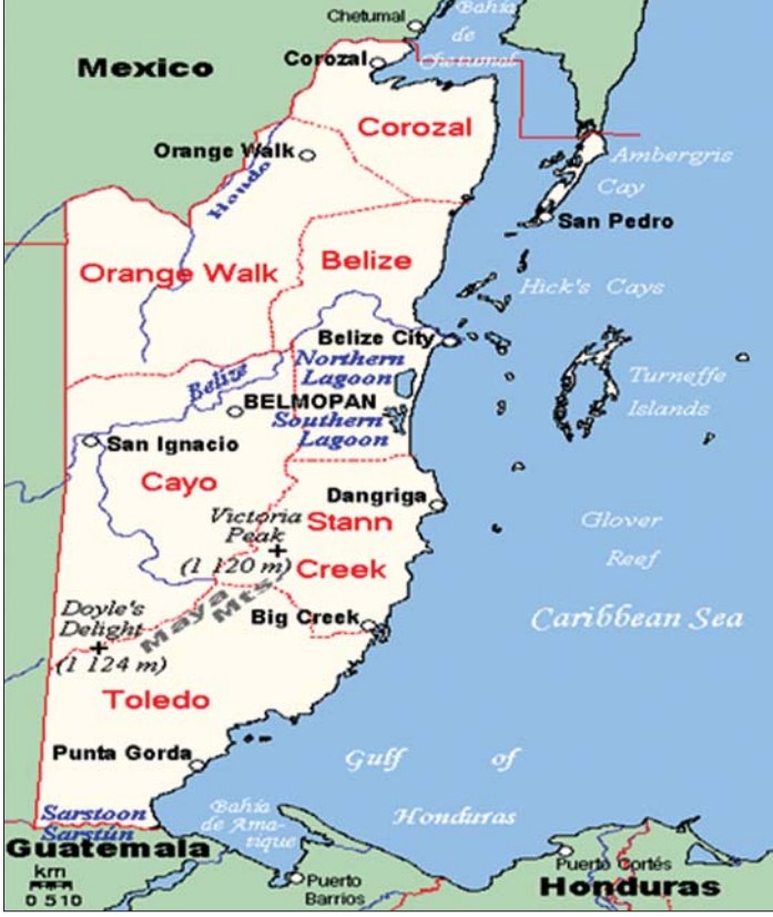
ဘီလီဇီနိုင်ငံ၏ တည်နေရာပြမြေပုံ။

ဘီလီဇီနိုင်ငံ၏ ရွေးကောက်ပွဲနှင့် နယ်နိမိတ်သတ်မှတ်ရေးကော်မရှင်ကို ဥက္ကဋ္ဌတစ်ဦးနှင့် အဖွဲ့ဝင်လေးဦးတို့ဖြင့် ဖွဲ့စည်းထားသည်။ ဥက္ကဋ္ဌနှင့် အဖွဲ့ဝင်နှစ်ဦးကို အတိုက်အခံခေါင်းဆောင်နှင့်