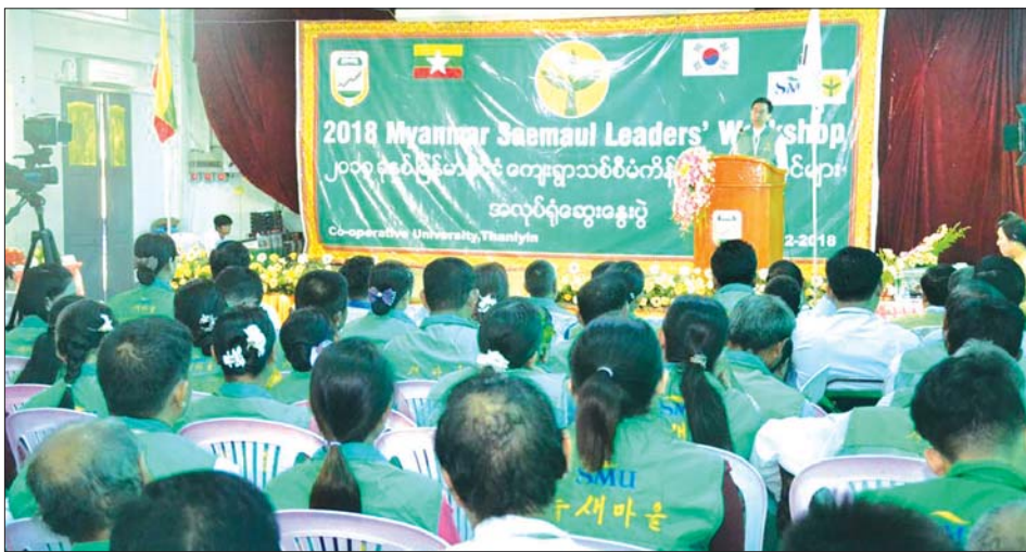
၂၀၁၈ ခုနှစ်အတွင်းက သန်လျင် သမဝါယမတက္ကသိုလ်၌ ကျင်းပသည့် မြန်မာနိုင်ငံ ကျေးရွာသစ်စီမံကိန်း (ဆယ်မာအူးလ်အွန်ဒွန်ဂ်) ခေါင်းဆောင်များ အလုပ်ရုံဆွေးနွေးပွဲတစ်ခု။

“ကျေးလက်ဒေသ ဖွံ့ဖြိုးတိုးတက်မှု အတွေ့ အကြုံကောင်းများ” အဖြစ် ကျေးလက်ဘက်စုံဖွံ့ဖြိုးမှု (Integrated Rural Development-IRD) ဆိုင်ရာ မူဝါဒများကို စတင်မိတ်ဆက်လာခဲ့ပြီး ၂၀၀၀ ပြည့်နှစ်တွင် IRD သည် ကျေးလက်ရပ်ရွာအဆင့်တွင် ပြည့်စုံသော ကျေးလက်ဖွံ့ဖြိုးရေးအစီအစဉ်ဖြင့်