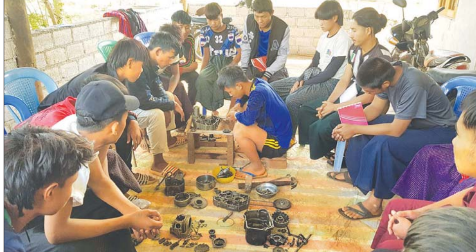
အခြေခံမော်တော်ဆိုင်ကယ်ပြုပြင်ထိန်းသိမ်းနည်းပညာသင်တန်းပို့ချနေပုံ။

ကြော်ငြာပြီး ရောင်းချခွင့်ပေးဦးမှာတဲ့ အဘိုးရေ။ ဦးငွေ ။ ။ အေး... ဒါဆိုရင် MSME လုပ်ငန်းလုပ်လိုတဲ့ တို့ရွာက သူတွေကို ကြိုပြီး အသိပေးဦးမှပေါ့ မောင်တိုးရေ။ မောင်တိုး။ ။ အဲဒါကြောင့် အဘိုးကို ပြေးပြီးလာပြောရတာပေါ့ အဘိုးရ။ ဦးငွေ ။ ။ အေးပါကွာ ငါ့မြေးရာ... မင်းလိုလူငယ်တွေ တို့ရွာမှာ အများကြီးလိုအပ်တယ်ကွာ။ ဒါနဲ့ငါတို့နိုင်ငံမှာကျေးရွာ ပေါင်း ၆၄၀၀၀ ကျော် ရှိတယ်ဆိုတော့ ရွာတိုင်းရမှာလားကွ မောင်တိုး ရ။ မောင်တိုး။ ။ အဲဒါပြောမလို့ အဘိုးရေ... ရွာတိုင်းမရဘူးတဲ့။ တကယ်လုပ်ငန်း ထူထောင်လိုတဲ့ ရွာတွေထဲက ရွာပေါင်း ၁၅၅ ရွာတည်း ရမှာတဲ့။ ရှေ့ပြေးစမ်းသပ်စီမံကိန်းဆိုလား တဲ့ဗျာ။ ဦးငွေ ။ ။ ဪ...အဲဒီလိုလားကွာ၊ ဒါဆိုတို့ရွာမှာ အဲဒီ “ငွေတိုး” (Ngwe Toe) စီမံကိန်း လုပ်လို့ရအောင် ရွာကသူတွေ ကို ညကုစုပြီး ရှင်းပြလိုက်မယ်ကွာ။ သူတို့ တကယ်လုပ်ချင်တယ်ဆိုရင် တော့ ငါလည်းရွာထဲက လူကြီးတချို့ခေါ်ပြီး မင်းနဲ့အတူ မြို့ကိုတက်ရ တော့မှာပဲ။ အသေးစားဌာနက လူကြီးတွေကို အမြန်သွားတွေ့ပြီး မြန်မြန်ကြိုတင်စီစဉ်မှပဲ မောင်တိုးရေ။ တော်ကြာ ငါတို့ရွာ ဖွံ့ဖြိုးဖို့ အဓိကလိုအပ်တဲ့ အသေးစားကုန်ထုတ်လုပ်ငန်းတွေအတွက် အကူ အညီပေးတာ “ပေးကားပေး၏မရ” ဖြစ်နေလိမ့်မယ်။ မောင်တိုး။ ။ ဟုတ်ပါ့ အဘိုးရေ... အမြန်ဆုံး စီစဉ်ကြရအောင်ဗျာ။ မဝေးတော့တဲ့ အနာဂတ်မှာ အသေးစား ကုန်ထုတ် လုပ်ငန်းတွေ ဖွံ့ဖြိုးမှုကနေ နိုင်ငံတော်ရဲ့ စီးပွားရေးဖွံ့ဖြိုးမှုဆီသို့ ဦးတည်နေပါပြီလော။ ။