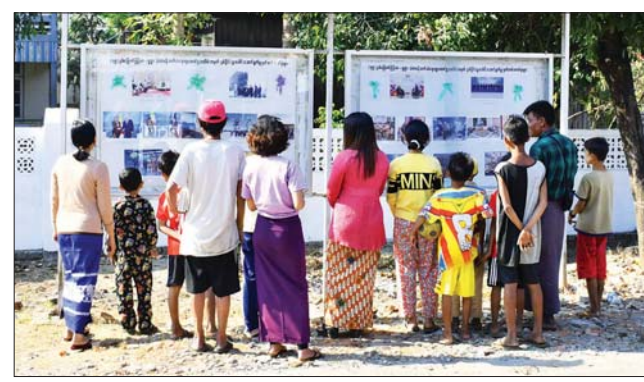
ဖေဖော်ဝါရီ ၁၈ ရက်နေ့တွင် ကျရောက်သည့် (၇၅) နှစ်မြောက် မြန်မာ - ရုရှား သံတမန်ဆက်ဆံရေး ထူထောင်မှုအထိမ်းအမှတ်အဖြစ် ကျောက်ဖြူခရိုင် ပြန်ကြားရေးနှင့် ပြည်သူ့ဆက်ဆံရေးဦးစီးဌာနရုံး မြေစိုက်နံရံကပ်ပြဘုတ်၌ ပြသထားရာ ဖေဖော်ဝါရီ ၁၈ ရက်က ပြည်သူများ စိတ်ဝင်တစား ကြည့်ရှုလေ့လာစဉ်။ တင်ထွန်းဦး(ပြန်/ဆက်)

ပေးသည်။ ထို့ပြင် နယ်လှည့်အထူးဆေးကုသရေးအဖွဲ့က ဒေသခံပြည်သူများကို သွေးတိုးရောဂါနှင့် ဆီးချို သွေးချိုရောဂါများ အကြောင်း ကျန်းမာရေးအသိပညာပေးဟောပြောဆွေးနွေးခြင်းများ ဆောင်ရွက်ပေးပြီး ဆေးကုသမှုခံယူနေသည့် ဒေသခံပြည်သူများအား စားရေးအစာပြေစေရန် အတွက် တာဝန်ရှိသူများနှင့် အလှူရှင်များက နေ့လယ်စာဖြင့် ဧည့်ခံ ကျွေးမွေးခဲ့ကြကြောင်း သတင်းရရှိသည်။ သတင်းစဉ်