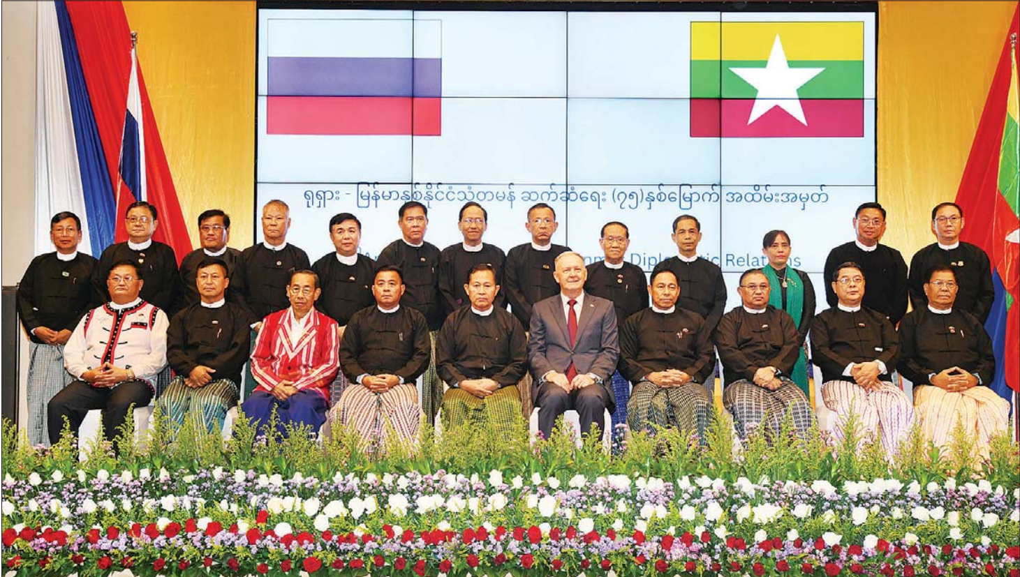
နိုင်ငံတော်စီမံအုပ်ချုပ်ရေးကောင်စီ ဒုတိယဥက္ကဋ္ဌ ဒုတိယဝန်ကြီးချုပ် ဒုတိယဗိုလ်ချုပ်မှူးကြီး စိုးဝင်းနှင့် မြန်မာနိုင်ငံဆိုင်ရာ ရုရှားဖက်ဒရေးရှင်း သံအမတ်ကြီး ဒေါက်တာ နီကိုလိုင် လစ်စတိုပါဒေါ့ဗ်တို့ မြန်မာ-ရုရှား နှစ်နိုင်ငံ သံတမန်ဆက်ဆံရေး (၇၅) နှစ်မြောက် စိန်ရတုအထိမ်းအမှတ် ဧည့်ခံပွဲအခမ်းအနားသို့ တက်ရောက်လာကြသူများနှင့်အတူ စုပေါင်းမှတ်တမ်းတင်ဓာတ်ပုံရိုက်စဉ်။

ထာဝရတည်တံ့ခိုင်မြဲစေရေး မြန်မာနိုင်ငံနှင့် ရုရှားနိုင်ငံ ပြည်သူများ၏ ချစ်ကြည်ရင်းနှီးမှု ထာဝရတည်တံ့ခိုင်မြဲစေရေး အတွက်လည်းကောင်း၊ ရုရှားဖက်ဒရေးရှင်းနိုင်ငံနှင့် ရုရှားပြည်သူများ ဆက်လက်ဖွံ့ဖြိုးတိုးတက် သာယာဝပြောစေရေးအတွက် လည်းကောင်း၊ နှစ်နိုင်ငံခေါင်းဆောင်များနှင့် မိတ်ဆွေများ ကျန်းမာ၊ ချမ်းသာကြစေရေးအတွက်လည်းကောင်း ဆုမွန်ကောင်း တောင်းအပ်ပါကြောင်း ပြောကြားသည်။ စုပေါင်းမှတ်တမ်းတင်ဓာတ်ပုံရိုက် ထို့နောက် နိုင်ငံတော်စီမံအုပ်ချုပ်ရေးကောင်စီ ဒုတိယဥက္ကဋ္ဌ ဒုတိယဝန်ကြီးချုပ်နှင့် မြန်မာနိုင်ငံ ဆိုင်ရာ ရုရှားဖက်ဒရေးရှင်းသံအမတ်ကြီးတို့သည် မြန်မာ-ရုရှား နှစ်နိုင်ငံ သံတမန်ဆက်ဆံရေး (၇၅) နှစ်မြောက် စိန်ရတုအထိမ်းအမှတ်ကို လှီးဖြတ်