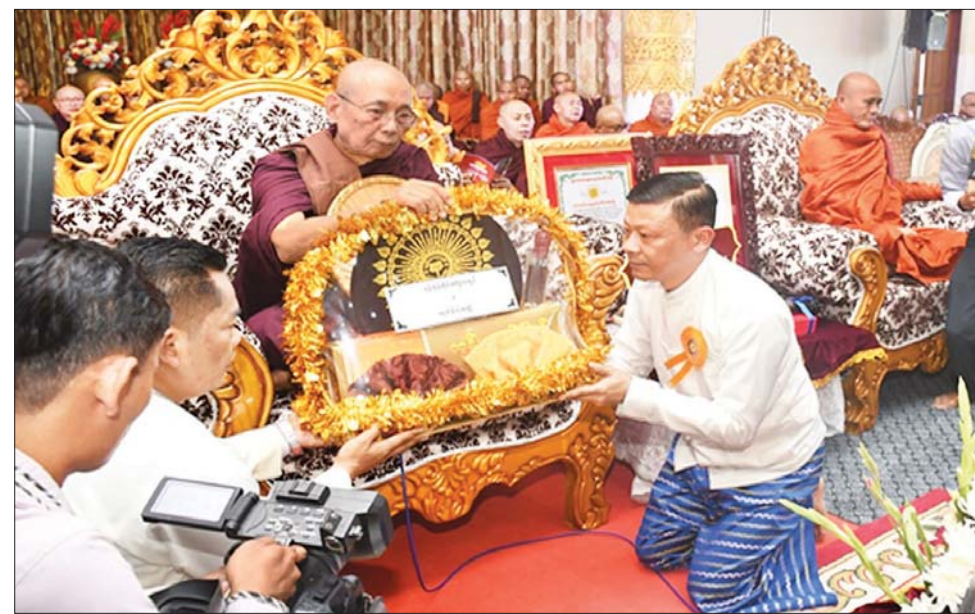
ဦးစီးပဓာန နာယက ဆရာတော် သီလက္ခန္ဓာ ဘိဝံသ တို့ထံမှ ဩဝါဒ ဘုရားကြီး ဘဒ္ဒန္တဝိမလဗုဒ္ဓိ ထံမှ နှင့် တိပိဋကဓဇ တိပိဋက စကားများ နာယူကြသည်။ ရေစက်ချ အနုမောဒနာတရားများ ကောဝိတရွှေရတု တိပိဋကဓဇ ထို့နောက် အဂ္ဂမဟာပဏ္ဍိတ နာယူခဲ့ကြကြောင်း သတင်းရရှိ ဖော်ကျွန်းဆရာတော် ဘဒ္ဒန္တ ပါဠိပါရဂူ မြစေတီဆရာတော် သည်။ သတင်းစဉ်

ထို့နောက် နိုင်ငံတော်စီမံအုပ်ချုပ်ရေးကောင်စီမှ ချီးမြှင့်အပ်နှင်းထားသည့် သီရိပျံချိုဘွဲ့တံဆိပ်တော်များ၊ အဆောင်အယောင်ပစ္စည်းများနှင့် ဗုဒ္ဓဘာသာ ကလျာဏယုဝအသင်း (YMBA)မှ ဆက်ကပ်သည့် အဂ္ဂမဟာမင်္ဂလ ဓမ္မဇောတိကဓဇ ဘွဲ့တံဆိပ်တော်များနှင့် လှူဖွယ်ပစ္စည်းများကို ဘွဲ့ခံဆရာတော်များ ဖြစ်တော်မူကြသော ဇွဲကပင် ဆရာတော်ဘုရားကြီးနှင့် မန္တလေးမြို့ မစိုးရိမ်တိုက်သစ် ဓမ္မသဟာရကျောင်း နာယကဆရာတော်တို့ထံသို့ တိုင်းမှူးက ဆက်ကပ်လှူဒါန်းသည်။ (ယာပုံ)