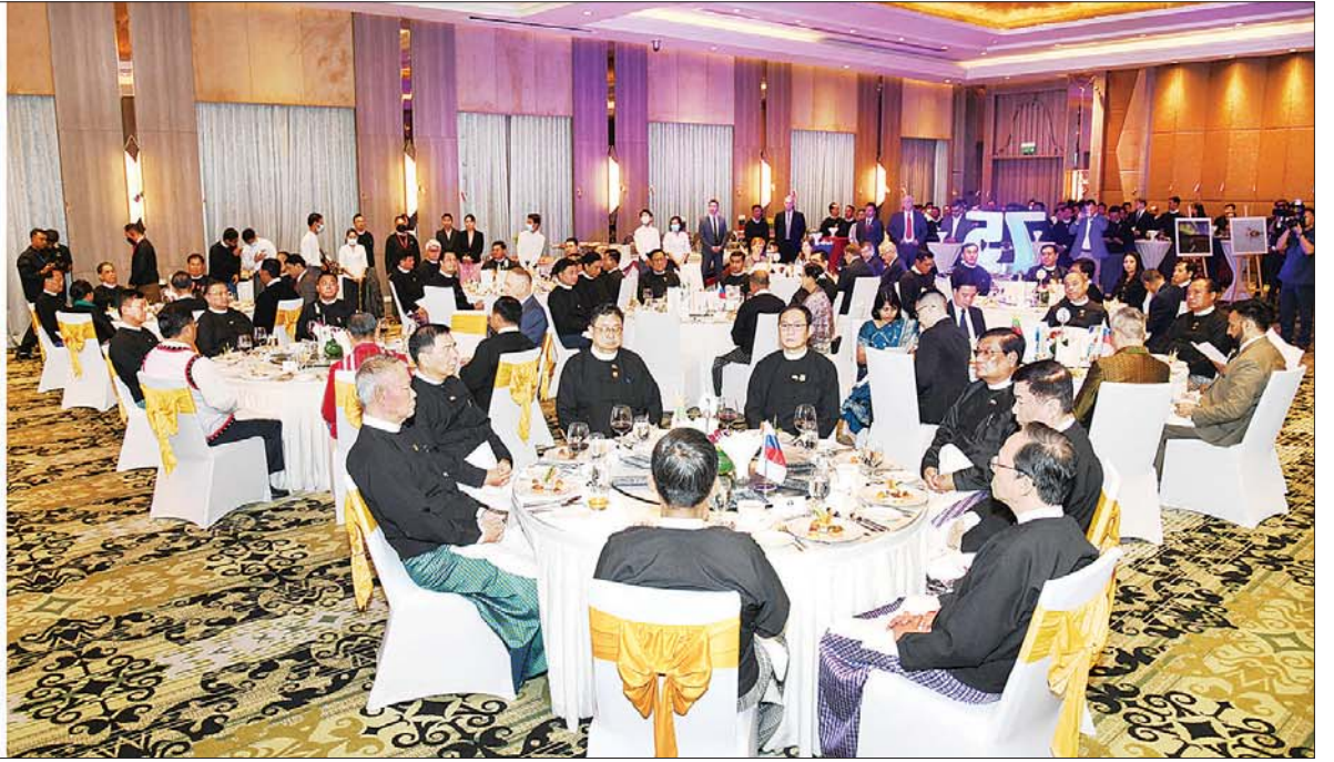
နိုင်ငံတော်စီမံအုပ်ချုပ်ရေးကောင်စီ ဒုတိယဥက္ကဋ္ဌ ဒုတိယဝန်ကြီးချုပ် ဒုတိယဗိုလ်ချုပ်မှူးကြီး စိုးဝင်း မြန်မာ - ရုရှား နှစ်နိုင်ငံ သံတမန်ဆက်ဆံရေး (၇၅) နှစ်မြောက် စိန်ရတုအထိမ်းအမှတ် ဧည့်ခံပွဲအခမ်းအနား တွင် ဂုဏ်ပြုအမှာစကားပြောကြားစဉ်။