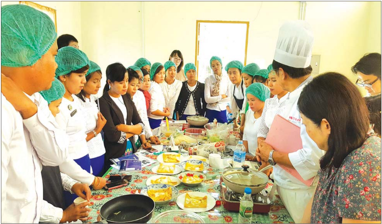
တန်ဖိုးမြင့်စားသောက်ကုန်ထုတ်လုပ်မှုနည်းပညာသင်တန်းပို့ချနေပုံ။

ဦးငွေ ။ ။ ဟေ...ဒါဆို မင်းပြောတော့ တစ်ရွာကို ငွေကျပ် သိန်း ၁၀၀ ဆိုကွာ၊ အခုက ငွေသိန်း ၅၀ တည်းပေးသလို ဖြစ်နေတယ်။ မောင်တိုး။ ။ ဟာ...အဘိုးကလည်း ဒါကို ကျွန်တော် သေချာရှင်းပြ ပါမယ်။ ကျန်တဲ့ငွေကျပ်သိန်း ၅၀ က သင်တန်းပေးရ ဦးမှာလေ။ သင်တန်းကုန်ကျစရိတ်ကို ငွေကျပ်သိန်း ၅၀ လျာထား ပါတယ်တဲ့။ သင်တန်းမှာ ကုန်ကြမ်းဝယ်တာတွေ အပါအဝင် အဲဒီသိန်း ၅၀ လုံးကို ရွာက ဖွဲ့စည်းထားတဲ့ အဖွဲ့ကပဲ ငွေစာရင်း စနစ်တကျ ရေးဆွဲပြီး ထိန်းသိမ်းသုံးစွဲရမှာတဲ့ အဘိုးရ။ ဒါ့အပြင် သင်တန်းက တစ်ကြိမ်တည်းမဟုတ်ဘဲ ကုန်ထုတ်လုပ်တဲ့ နည်းပညာတွေအပြင် ဈေးကွက်နဲ့ ဆိုင်တာတွေ၊ အရည်အသွေး ထိန်းသိမ်းနည်းတွေ၊ စားသုံးတဲ့သူတွေဘေးဥပဒ်အန္တရာယ်ကင်းရှင်းအောင် ဆောင်ရွက်မယ့် နည်းလမ်းတွေကို ဆိုင်ရာဘာသာရပ်အလိုက် ကျွမ်းကျင်ပညာရှင် ဆရာ ဆရာမတွေက လာသင်ပေးဦးမှာတဲ့ အဘိုးရ...။ ဦးငွေ ။ ။ ဟေ...ဒါဆို အသေးစားကုန်ထုတ်လုပ်သူတွေအတွက် ဘာလိုဦးတော့မလဲကွာ၊ အတော်ဟန်ကျတာပဲ။ မောင်တိုး။ ။ ဟုတ်တယ်အဘိုးရေ...နည်းပညာလည်း စနစ်တကျ သင်ခွင့်ရမယ်။ သင်တန်းပြီးရင် ရင်းနှီးပစ္စည်းတွေ လည်း ရမယ်ဆိုတော့ လုပ်ငန်းလုပ်လိုတဲ့သူတွေအတွက် “ရေကန် အသင့် ကြာအသင့်”ပဲပေါ့ အဘိုးရေ။ ဒါတင်မဟုတ်ဘဲနဲ့ ထုတ်လုပ် လိုက်တဲ့ ကုန်ပစ္စည်းတွေ ရောင်းချဖို့အတွက်လည်း ဓာတ်ခွဲစမ်းသပ် ပေးတာတွေ၊ မြို့က Super Market ကြီးတွေမှာ တင်ပြီး ရောင်းချဖို့ အတွက် လုပ်ငန်းမှတ်ပုံတင်လုပ်ပေးတာတွေလည်း ဌာနက ကူညီ ဆောင်ရွက်ပေးဦးမှာတဲ့ဗျာ။ ဒါ့ပြင် အခါအားလျော်စွာလုပ်တဲ့ အသေးစားထုတ်ကုန်ပစ္စည်း ဈေးရောင်းပွဲတော်တွေမှာလည်း အခမဲ့