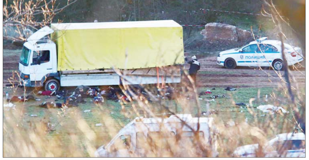
ရွှေပြောင်းလုပ်သားများ တင်ဆောင်လာသော ထရပ်ကားကို မြို့တော်ဆိုဖီယာအနီး စွန့်ပစ်ထားစဉ်။

အဆိုပါဖြစ်ရပ်နှင့် ပတ်သက်ပြီး စုံစမ်းစစ်ဆေးမှုများ လုပ်ဆောင် လျက်ရှိကြောင်း အာဏာပိုင်များ ၏ အဆိုအရ သိရသည်။ ဆင်ယွာ