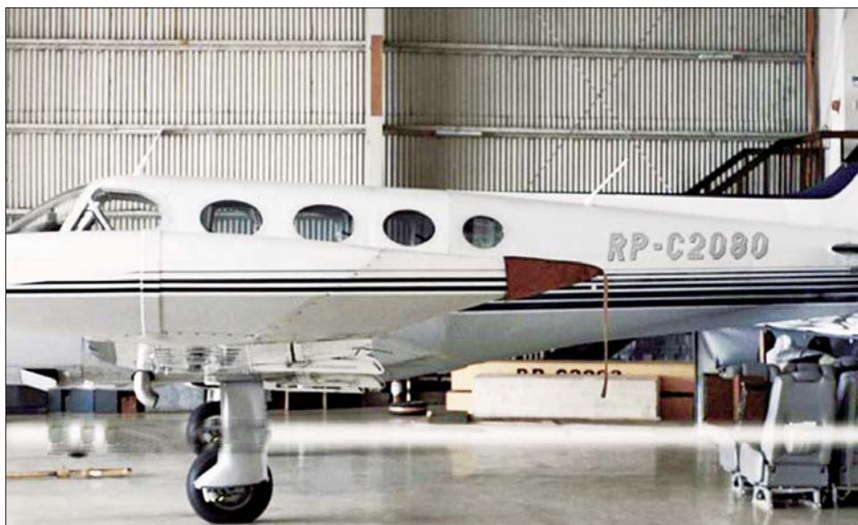
ပျောက်ဆုံးနေသည့် RP C2080 အမျိုးအစားလေယာဉ်တစ်စင်းကို တွေ့ရစဉ်။

အရပ်ဘက် လေကြောင်းအာဏာ ပိုင်(စီအေအေပီ)က ပြောကြား သည်။