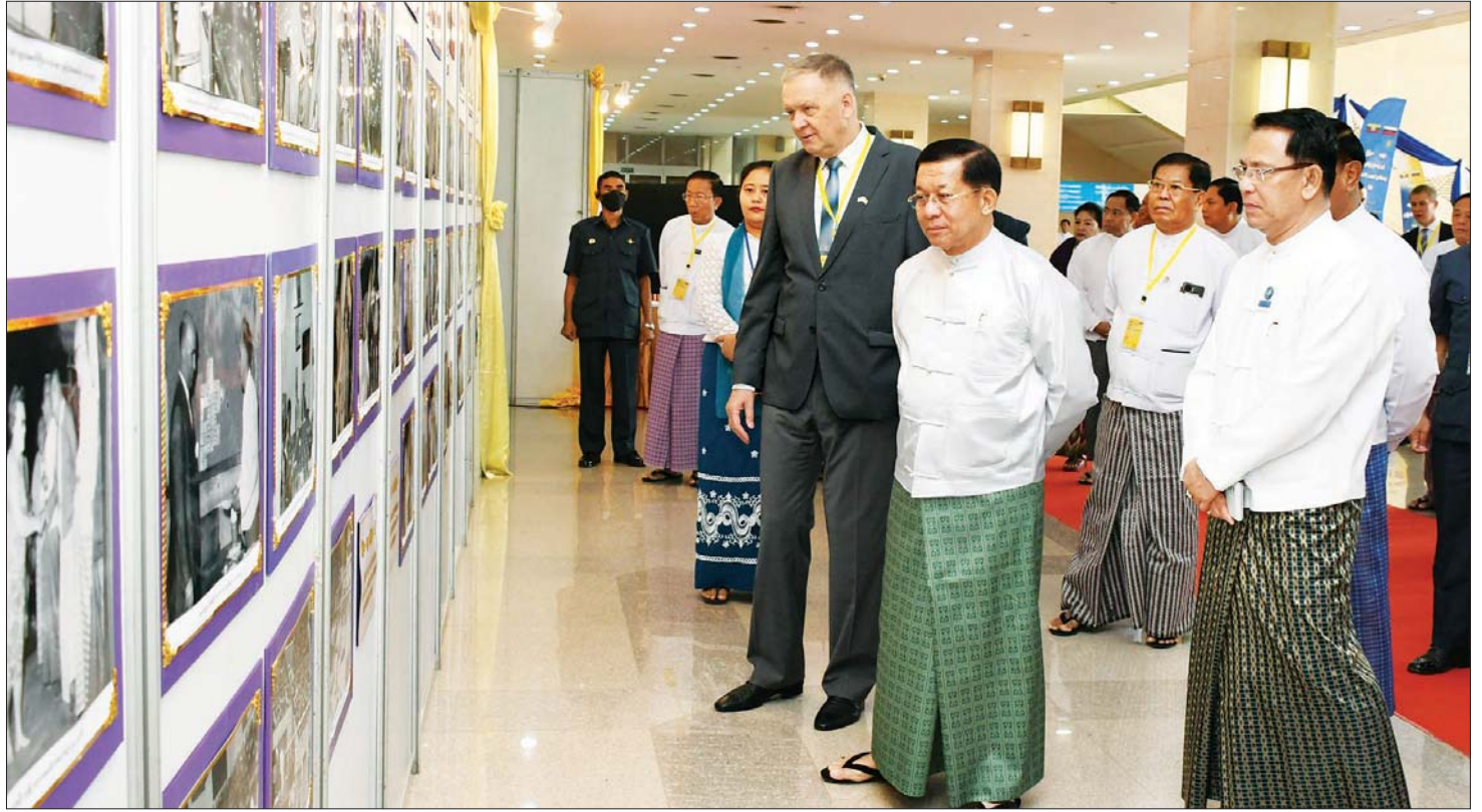
နိုင်ငံတော်စီမံအုပ်ချုပ်ရေးကောင်စီဥက္ကဋ္ဌ နိုင်ငံတော်ဝန်ကြီးချုပ် ဗိုလ်ချုပ်မှူးကြီး မင်းအောင်လှိုင်၊ မြန်မာနိုင်ငံဆိုင်ရာ ရုရှားဖက်ဒရေးရှင်းနိုင်ငံ သံအမတ်ကြီး H.E.Mr. Nikolay LISTOPADOV နှင့် အဖွဲ့ဝင်များ ရုရှား - မြန်မာ ချစ်ကြည်ရေး မှတ်တမ်းဓာတ်ပုံများကို လှည့်လည်ကြည့်ရှုစဉ်။

ထို့နောက် နိုင်ငံတော်စီမံအုပ်ချုပ်ရေးကောင်စီဥက္ကဋ္ဌ နိုင်ငံတော်ဝန်ကြီးချုပ်က (၇၅) နှစ်မြောက် မြန်မာ-ရုရှား သံတမန်ဆက်သွယ်ထူထောင်မှုအထိမ်းအမှတ်အဖြစ် အဖွင့်အမှာစကားပြောကြားရာတွင် ယခုကျင်းပပြုလုပ်သည့် ဖိုရမ်ကြီးကို မြန်မာ - ရုရှားချစ်ကြည်ရေးနှင့် ပူးပေါင်းဆောင်ရွက်ခြင်းအားဖြင့် ပိုမိုခိုင်မာစေရန်နှင့် ကဏ္ဍပေါင်းစုံညီပိုမိုပူးပေါင်းဆောင်ရွက်နိုင်စေရန် ရည်ရွယ်ကျင်းပပြုလုပ်ခြင်းဖြစ်ကြောင်း၊ အားလုံးသိကြသည့်အတိုင်း