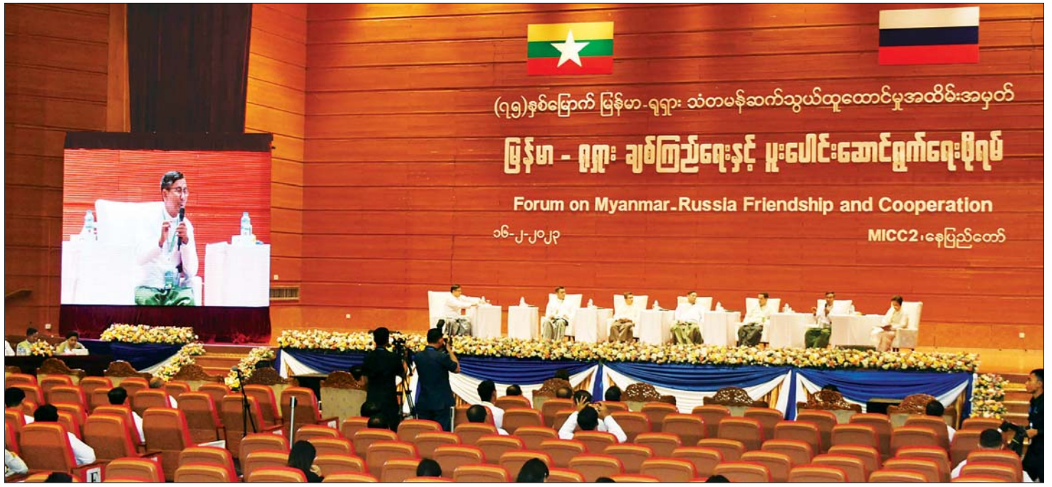
(၇၅)နှစ်မြောက် မြန်မာ - ရုရှား သံတမန်ဆက်သွယ်ထူထောင်မှုအထိမ်းအမှတ် မြန်မာ - ရုရှား ချစ်ကြည်ရေးနှင့် ပူးပေါင်းဆောင်ရွက်ရေးဖိုရမ်ကျင်းပစဉ်။

ထို့နောက် မြန်မာနိုင်ငံဆိုင်ရာ ရုရှားဖက်ဒရေးရှင်းနိုင်ငံ သံအမတ်ကြီးက ပြောကြားရာတွင် ယနေ့ မိမိတို့ ရုရှားဖက်ဒရေးရှင်းနိုင်ငံနှင့် မြန်မာနိုင်ငံ တို့အကြား (၇၅) နှစ်မြောက် သံတမန်ဆက်သွယ် ထူထောင်မှုအထိမ်းအမှတ်အဖြစ် ပြုလုပ်သည့် အခမ်းအနားတွင် အမှာစကားပြောကြားခွင့်ရသည့် အတွက် ကျေးဇူးတင်စွာ မြောက်မိပါကြောင်း၊ ခေတ်အဆက်ဆက် နှစ်နိုင်ငံချစ်ကြည်ရေးနိမိတ်တိုးမြှင့်ဆောင်ရွက်မှု မှတ်တမ်းဓာတ်ပုံများကို တွေ့မြင်ရသည့်အတွက်လည်း ဝမ်းမြောက်ပီတိဖြစ်မိပါကြောင်း၊ လက်ရှိအချိန်တွင် မိမိတို့နှစ်နိုင်ငံ၏ ချစ်ကြည်ရေးနိမိတ်တိုးမြှင့်ဆောင်ရွက်မှုများ ပိုမိုတိုးတက်စေရေး ကြိုးပမ်းဆောင်ရွက်လျက်ရှိပါကြောင်း၊ ပညာရေးနယ်ပယ်နှင့် လူသားအရင်းအမြစ်ဖွံ့ဖြိုးတိုးတက်ရေးကဏ္ဍ၊ အားကစားကဏ္ဍ၊ ကျန်းမာရေးကဏ္ဍတို့တွင်လည်း ပူးပေါင်းဆောင်ရွက်မှုများကို တိုးမြှင့်ဆောင်ရွက်လျက်ရှိပါကြောင်း၊ နျူကလီးယားစွမ်းအင်ကို ငြိမ်းချမ်းစွာ အသုံးပြုခြင်းဆိုင်ရာများ