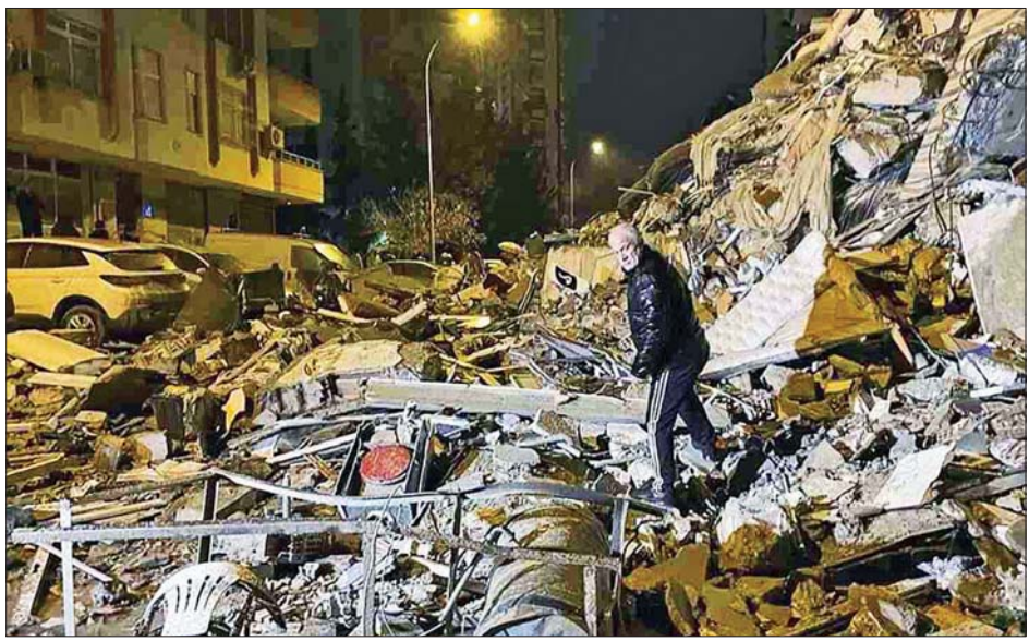
တူကီယံနိုင်ငံတောင်ပိုင်း ဒိုင်ရာဘက်ကီရာ၌ လျင်လှုပ်မှုကြောင့် ပျက်စီးနေသည့် အဆောက်အအုံများကို တွေ့ရစဉ်။

တိုကျို၊ ဖေဖော်ဝါရီ ၁၆ လျင်ဘေးဒဏ် ခံစားခဲ့ရသည့် တူကီယံနှင့် ဆီးရီးယားနိုင်ငံတို့သို့ အရေးပေါ် လူသားချင်းစာနာ ထောက်ထားမှုဆိုင်ရာ အကူအညီအဖြစ် အမေရိကန်ဒေါ်လာ ၂၇ သန်းတန်ဖိုးရှိသည့် အကူအညီများ ထောက်ပံ့ပေးသွားမည်ဟု ဂျပန်အစိုးရက ကတိပြုပြောကြားခဲ့သည်။ ကမ္ဘာ့စားနပ်ရိက္ခာ အစီအစဉ်နှင့် အစိုးရမဟုတ်သော ဂျပန်အဖွဲ့အစည်းများမှတစ်ဆင့် နှစ်နိုင်ငံစလုံးသို့ အကူအညီများ ပေးပို့သွားမည်ဟု နိုင်ငံခြားရေးဝန်ကြီး ဟာယာရှိ ယိုရှိ မက်ဆာက ပြောသည်။ ကူညီမှုအစီအစဉ်နှင့် ပတ်သက်၍ အသေးစိတ် အစီအစဉ်များကို အရာရှိများက ဆက်လက် လုပ်ဆောင်လျက် ရှိကြောင်း ၎င်းကပြောသည်။ လျင်နှင့် အခြားသော သဘာဝဘေးများ တွေ့ကြုံ