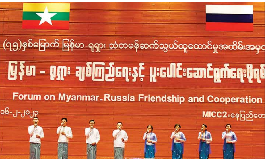
နိုင်ငံတော်စီမံအုပ်ချုပ်ရေးကောင်စီဥက္ကဋ္ဌ နိုင်ငံတော်ဝန်ကြီးချုပ် ဗိုလ်ချုပ်မှူးကြီး မင်းအောင်လှိုင်နှင့် အဖွဲ့ဝင်များ မြန်မာ့အသံနှင့်ရုပ်မြင်သံကြားမှ တေးသံရှင်များ၏ သီဆိုဖျော်ဖြေနေမှုကို ကြည့်ရှုအားပေးစဉ်။