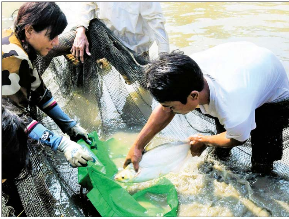
မြန်မာ့မျိုးရင်း ငါးမြင်းငါးများကို ငါးလုပ်ငန်းသိပ္ပံ (တွဲတေး) မွေးမြူရေးကန်တွင် ဖမ်းဆီးနေစဉ်။

ရန်ကုန် ဖေဖော်ဝါရီ ၁၆ အာဆီယံနိုင်ငံများ အကြား မြန်မာတစ်နိုင်ငံတည်းတွင် ဒေသမျိုးရင်းအဖြစ် တည်ရှိနေသည့် ငါးမြင်းငါးကို စီးပွားဖြစ် မွေးမြူ ထုတ်လုပ်၍ National Fish အဖြစ် သတ်မှတ်နိုင်ရန် ကြိုးပမ်း သွားမည်ဖြစ်ကြောင်း ယနေ့နံနက် ပိုင်းတွင် ကျင်းပသည့် ငါးလုပ်ငန်း သိပ္ပံ (တွဲတေး) မှ မြန်မာနိုင်ငံ ငါးလုပ်ငန်းအဖွဲ့ချုပ်သို့ ငါးမြင်း မျိုးစိတ်ကောင်ရေ ၁၀၀ သုတေ သနပြု သားဖောက်မွေးမြူ ထုတ်လုပ်ရန် လွှဲပြောင်းပေးအပ် သည့် အခမ်းအနားမှ သိရသည်။ ပြည်ပဝယ်လိုအား အသင့် ရှိနေသော မြန်မာ့မျိုးရင်းငါးမြင်း ငါးကို မွေးမြူထုတ်လုပ်နိုင်ရန် ကနဦး သားဖောက်လုပ်ငန်း စာမျက်နှာ ၁၀ ကော်လံ ၁ ❖