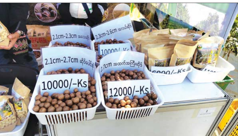
အရောင်းပြပွဲတွင် ပြသထားသော မက်ကဒေးမီးယားအစေ့များ။

တရုတ်နိုင်ငံသည် မြန်မာနိုင်ငံ မက်ကဒေးမီးယားအစေ့၏ အရေးပါ ဈေးကွက်ဖြစ်သောမက မြန်မာနိုင်ငံ အခွဲမာသီးလုပ်ငန်း၏ နက်ရှိုင်းစွာပါဝင်သူ နှင့် ပူးပေါင်းဆောင်ရွက်သူလည်း ဖြစ်နိုင် ကြောင်း၊ တရုတ်သံရုံးက မြန်မာနိုင်ငံ သည် ယူနန်ပြည်နယ်နှင့်အတူ မက်ကဒေးမီးယားအစေ့ လုပ်ငန်းနှင့် စပ်လျဉ်း၍ ဘက်စုံနက်ရှိုင်းစွာ ပူးပေါင်း ဆောင်ရွက်သွားလိုကြောင်း သိရှိရသည်။