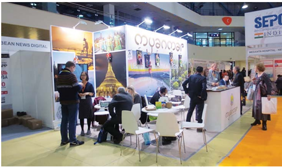
(၂၅) ကြိမ်မြောက် မော်စကိုနိုင်ငံတကာခရီးသွားပြပွဲတွင် မြန်မာနိုင်ငံကိုယ်စားပြု ခရီးသွားပြခန်းမှ မြန်မာနိုင်ငံရှိ ခရီးစဉ်ဒေသများအား ပြသခဲ့စဉ်။

ခရီးသွားလုပ်ငန်း ဈေးကွက်မြှင့်တင်ခြင်း၏ သမားရိုးကျနည်းလမ်းများမှာ ကြော်ငြာခြင်း၊ တိုက်ရိုက်ဆက်သွယ်ခြင်း၊ ရောင်းချခြင်းတို့ဖြစ်ပြီး နိုင်ငံတကာခရီးသွားပြပွဲများတွင် နိုင်ငံကိုယ်စားပြု ခရီးသွားပြခန်းများအား ဝင်ရောက်ပြသခြင်း၊ အဓိကခရီးသွားဈေးကွက် နိုင်ငံများတွင် မိမိတို့နိုင်ငံ ခရီးစဉ်ဒေသနှင့် ယှဉ်ကျေးမှုပြပွဲများ ကျင်းပပြုလုပ် ခြင်း၊ နိုင်ငံတကာမှ ခရီးသွားလုပ်ငန်းဆောင်ရွက် သူများ၊ မီဒီယာများ၊ ခရီးသွားဆောင်းပါးရေးသားသူ များ၊ Travel Blogger များအား ဖိတ်ကြား၍ ချစ်ကြည်ရင်းနှီးမှုခရီးစဉ် (Familiarization Trip) များ ဆောင်ရွက်ခြင်း၊ Social Media များမှတစ်ဆင့် ထိရောက်စွာမြှင့်တင်ကြော်ငြာခြင်း၊ နိုင်ငံတကာ