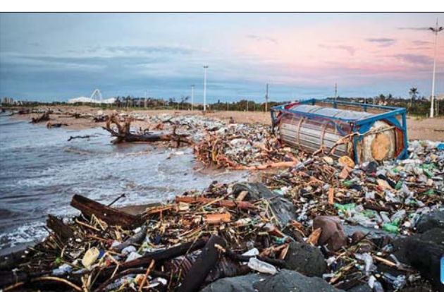
အောင် ဆည်များနှင့် မြစ်များကို ဖြတ်မကူးရန် ပြည်သူများအား တိုက်တွန်းထားကြောင်း၊ ကလေးများကို ဘေးကင်းအောင် ထိန်းသိမ်းစောင့်ရှောက်ရန် မိဘများကို တိုက်တွန်းထားကြောင်း အမ်ပူမလန်ဂါပြည်နယ်မှ တာဝန်ရှိသူတစ်ဦးဖြစ်သူ မန်ဒလာ အမ်စီဘီက ပြောကြားသည်။

ဂျိုဟန်နစွဘတ်၊ ဖေဖော်ဝါရီ ၁၆ တောင်အာဖရိကနိုင်ငံ အမ်ပူမလန်ဂါနှင့် လင်ပိုပိုပြည်နယ်များတွင် မိုးသည်းထန်စွာ ရွာသွန်းမှုကြောင့် စုစုပေါင်း ငါးဦးသေဆုံးပြီး အခြားလေးဦး ပျောက်ဆုံးနေကြောင်း ပြည်နယ်အစိုးရနှစ်ခု၏ ပြောကြားချက်အရ သိရသည်။ ရေနှစ်သေဆုံးမှုများ မဖြစ်