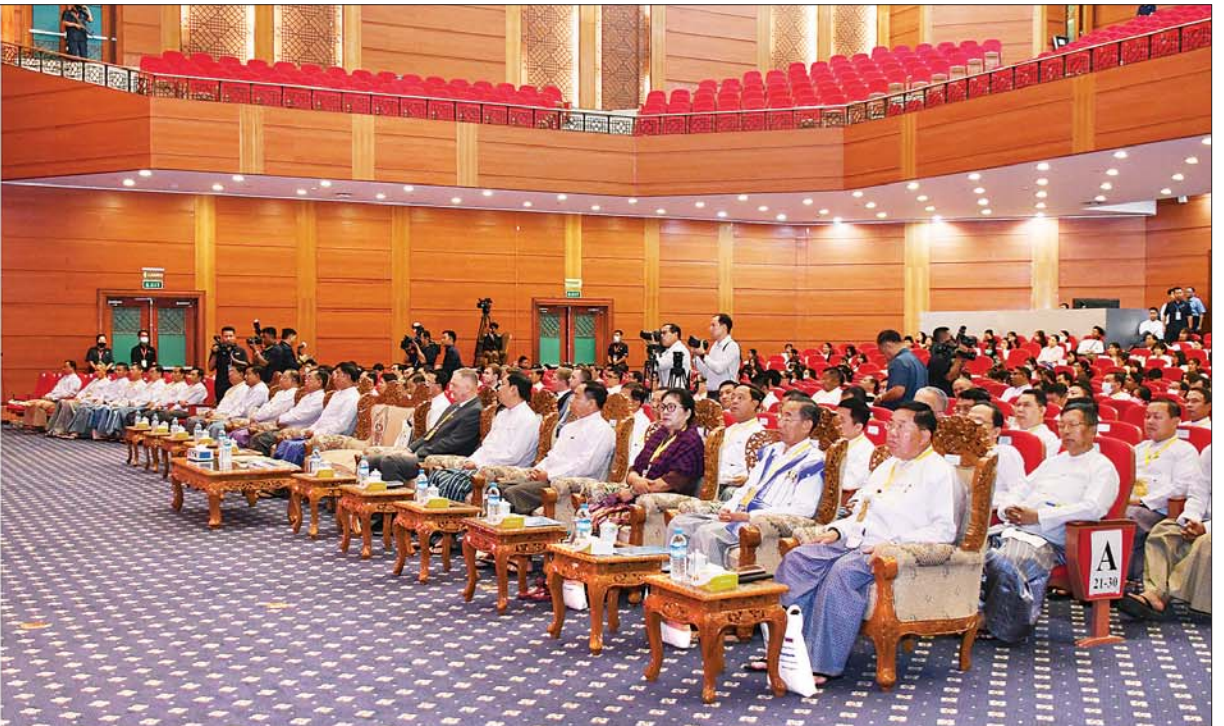
နိုင်ငံတော်စီမံအုပ်ချုပ်ရေးကောင်စီဥက္ကဋ္ဌ နိုင်ငံတော်ဝန်ကြီးချုပ် ဗိုလ်ချုပ်မှူးကြီး မင်းအောင်လှိုင် (၇၅) နှစ်မြောက် ပြည်ထောင်စုသမ္မတမြန်မာနိုင်ငံတော်နှင့် ရုရှားဖက်ဒရေးရှင်းနိုင်ငံတို့အကြား သံတမန်ဆက်သွယ်ထူထောင်မှုအထိမ်းအမှတ်အဖြစ် မြန်မာ-ရုရှား ချစ်ကြည်ရေးနှင့် ပူးပေါင်းဆောင်ရွက်ရေးဖိုရမ်တွင် အဖွင့်အမှာစကား ပြောကြားစဉ်။