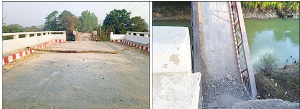
အကြမ်းဖက်သမားများ မိုင်းထောင်ဖောက်ခွဲဖျက်ဆီးခဲ့သည့် ဒါလီချောင်းကူးတံတား။

ဦးခန့်က ထပ်မံရောက်ရှိလာပြီး ကျန်ရှိနေသည့် တံတားတစ်ခုအား ထပ်မံမိုင်းထောင်ဖောက်ခွဲဖျက်ဆီးခဲ့သဖြင့် တံတားတစ်ခုလုံး ထပ်မံပျက်စီးခဲ့ပြီး လူနှင့် မော်တော်ယာဉ်များ ဖြတ်သန်းသွားလာ၍ မရကြောင်း သိရသည်။