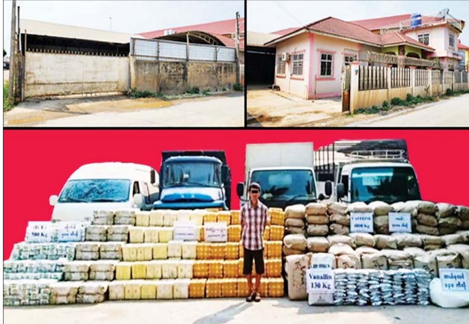
မူးယစ်ဆေးဝါးများ သိမ်းဆည်းရမိသည့် နေအိမ်/တရားခံနှင့် သက်သေခံပစ္စည်းများအား တွေ့ရစဉ်။