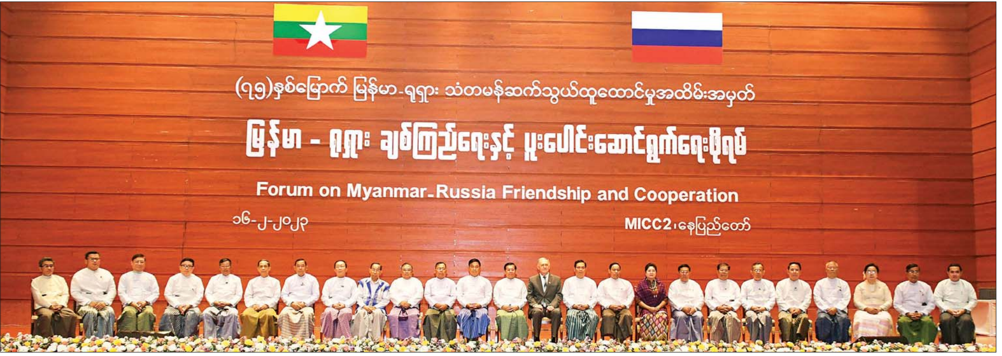
(၇၅)နှစ်မြောက် မြန်မာ-ရုရှား သံတမန်ဆက်သွယ်ထူထောင်မှုအထိမ်းအမှတ်