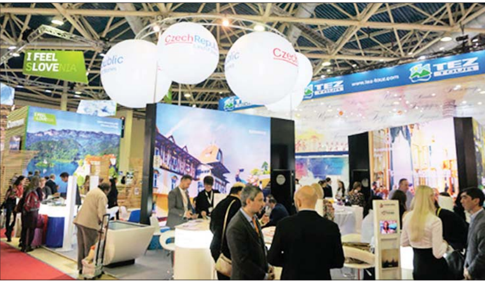
မော်စကို နိုင်ငံတကာခရီးသွားပြပွဲတွင် နိုင်ငံအသီးသီးမှ ခရီးသွားပြခန်းများ ပါဝင်ပြသစဉ်။

(၂၅)ကြိမ်မြောက် မော်စကိုနိုင်ငံတကာ ခရီးသွားပြပွဲ (Moscow International Travel & Tourism Exhibition) သို့ ပါဝင်တက်ရောက်ခြင်းဖြင့် မြန်မာနိုင်ငံ၏ ခရီးသွားလုပ်ငန်းအခြေအနေများကို ရှင်းပြနိုင်ခြင်း၊ ခရီးသွားလုပ်ငန်းမြှင့်တင်ရေးအတွက် online နှင့် offline media များကို အသုံးပြုဆောင်ရွက်နိုင်ရေး၊ နိုင်ငံတကာခရီးသွားမြှင့်တင်ရေးစာစောင်၊ သတင်းစာ၊ မဂ္ဂဇင်းများတွင် မြန်မာနိုင်ငံ၏ သတင်းအချက်အလက်များကို ထည့်သွင်းကြော်ငြာနိုင်ခြင်း၊ နိုင်ငံတကာခရီးသွားလုပ်ငန်းမီဒီယာများနှင့် တိုက်ရိုက်တွေ့ဆုံခွင့်ရခြင်း၊ မြန်မာနိုင်ငံ ခရီးစဉ်ဒေသများနှင့် ပတ်သက်သော သတင်းအချက်အလက်များနှင့် ခရီးသွားမြှင့်တင်ရေးဆိုင်ရာ ဗီဒီယိုများကို ပြသနိုင်ခြင်း၊ ရှင်းလင်းနိုင်ခြင်းဖြင့် မြန်မာနိုင်ငံ၏ ခရီးသွားလုပ်ငန်းကို ပိုမိုသိရှိစေနိုင်ခြင်း၊ ရုရှားနိုင်ငံနှင့် ဥရောပနိုင်ငံများ၏ ခရီးသွားလုပ်ငန်း ဈေးကွက်လိုအပ်ချက်များကို သိရှိခွင့်ရခြင်း၊ မြန်မာနိုင်ငံအနေဖြင့် အာရှဥရောပဈေးကွက်နှင့် ရုရှားဈေးကွက်မြှင့်တင်ရေးအတွက် အခွင့်အလမ်းများရရှိခြင်း စသည့်အကျိုးကျေးဇူးများ