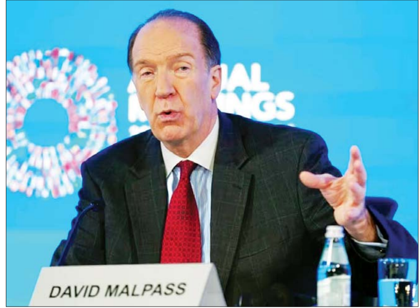
ကမ္ဘာ့ဘဏ်ဥက္ကဋ္ဌ ဒေးဗစ်မယ်လ်ပက်စ်။

နုတ်ထွက်သွားရန် အစီအစဉ်ရှိသည်ဟု ဖေဖော်ဝါရီ ၁၅ ရက်တွင် ၎င်း၏ ရည်ရွယ်ချက်ကို ကြေညာခဲ့သည်။ ၎င်း၏ရာထူးသက်တမ်း