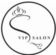
RD(၄၁၂၄/၂၀၁၉)

မန္တလေးမြို့၊ ချမ်းမြသာစည်မြို့နယ်၊ မြို့သစ်(၅)ရပ်ကွက်၊ မနော်ဟရီလမ်း၊ ၆၅၆၆လမ်းကြားနေ ဒေါ်နွယ်နွယ်ဆန်း (ဘ) ဦးလောဝူး ၁/မညန(နိုင်)၁၁၈၃၄၆၆၆ လွှဲအပ်ညွှန်ကြားချက်အရ အောက်ပါအတိုင်း အများသိစေရန် ကြေညာအပ်ပါသည်-