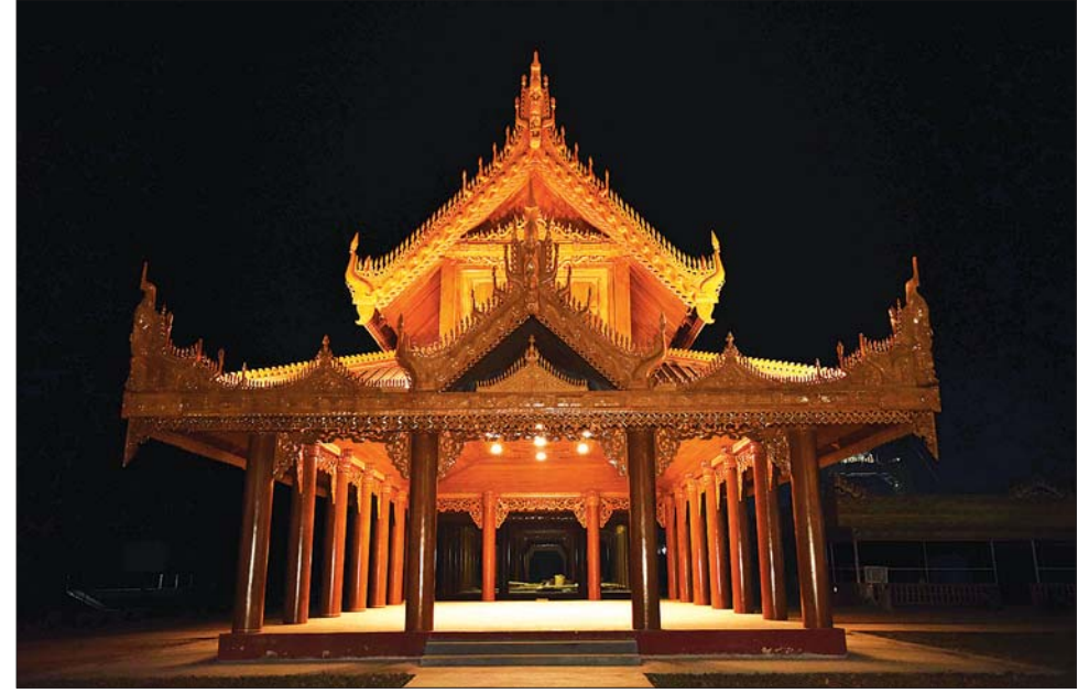
မာရဝိဇယဗုဒ္ဓဗျာဉ်တော်အတွင်းရှိ ကျောက်စာရုံစေတီတော်များနှင့် သုဓမ္မာဇရပ်များ၌ အများပြည်သူ ကြည့်ညှိသပွယ်ဖွယ်ဖြစ်အောင် မီးထွန်းညှိ၍ အလင်းပေးပူဇော်ထားရှိမှုကို တွေ့ရစဉ်။