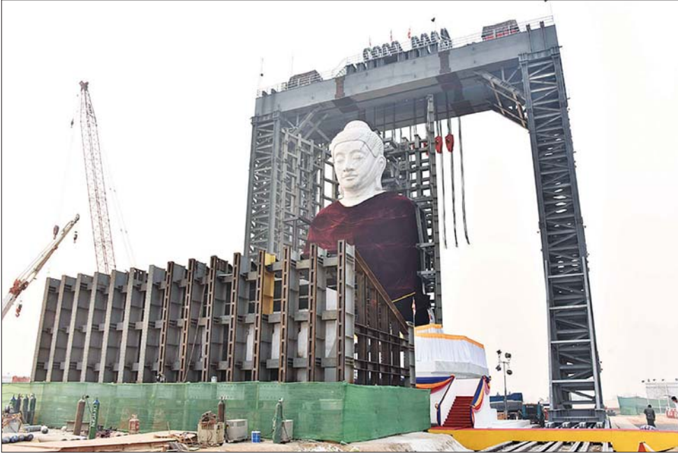
ဦးဆောင်ဘုရားဒါယကာ နိုင်ငံတော်စီမံအုပ်ချုပ်ရေးကောင်စီဥက္ကဋ္ဌ နိုင်ငံတော်ဝန်ကြီးချုပ် ဗိုလ်ချုပ်မှူးကြီး မင်းအောင်လှိုင် မာရဝိဇယဗုဒ္ဓ ရုပ်ပွားတော်မြတ်ကြီး တည်ထားကိုးကွယ်ရေးလုပ်ငန်းဆောင်ရွက်လျက် ရှိမှုအခြေအနေများ ဖူးမြော်ကြည့်ရှုစဉ်။