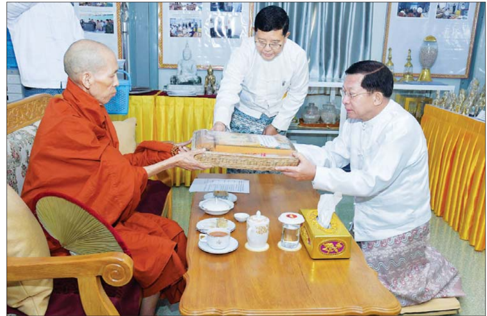
မာရဝိဇယ ဗုဒ္ဓရုပ်ပွားတော်တည် ကမ္မည်းမော်ကွန်း ကျောက်စာတော်။

ဦးဆောင်ဘုရားဒါယကာ နိုင်ငံတော်စီမံအုပ်ချုပ်ရေး ကောင်စီဥက္ကဋ္ဌ နိုင်ငံတော်ဝန်ကြီးချုပ် ဗိုလ်ချုပ်မှူးကြီး မင်းအောင်လှိုင် ပါဠိဆရာတော်ကြီးအား လှူဖွယ်ပစ္စည်းများနှင့် နဝကမ္မ အလှူငွေများ ဆက်ကပ်လှူဒါန်းစဉ်။