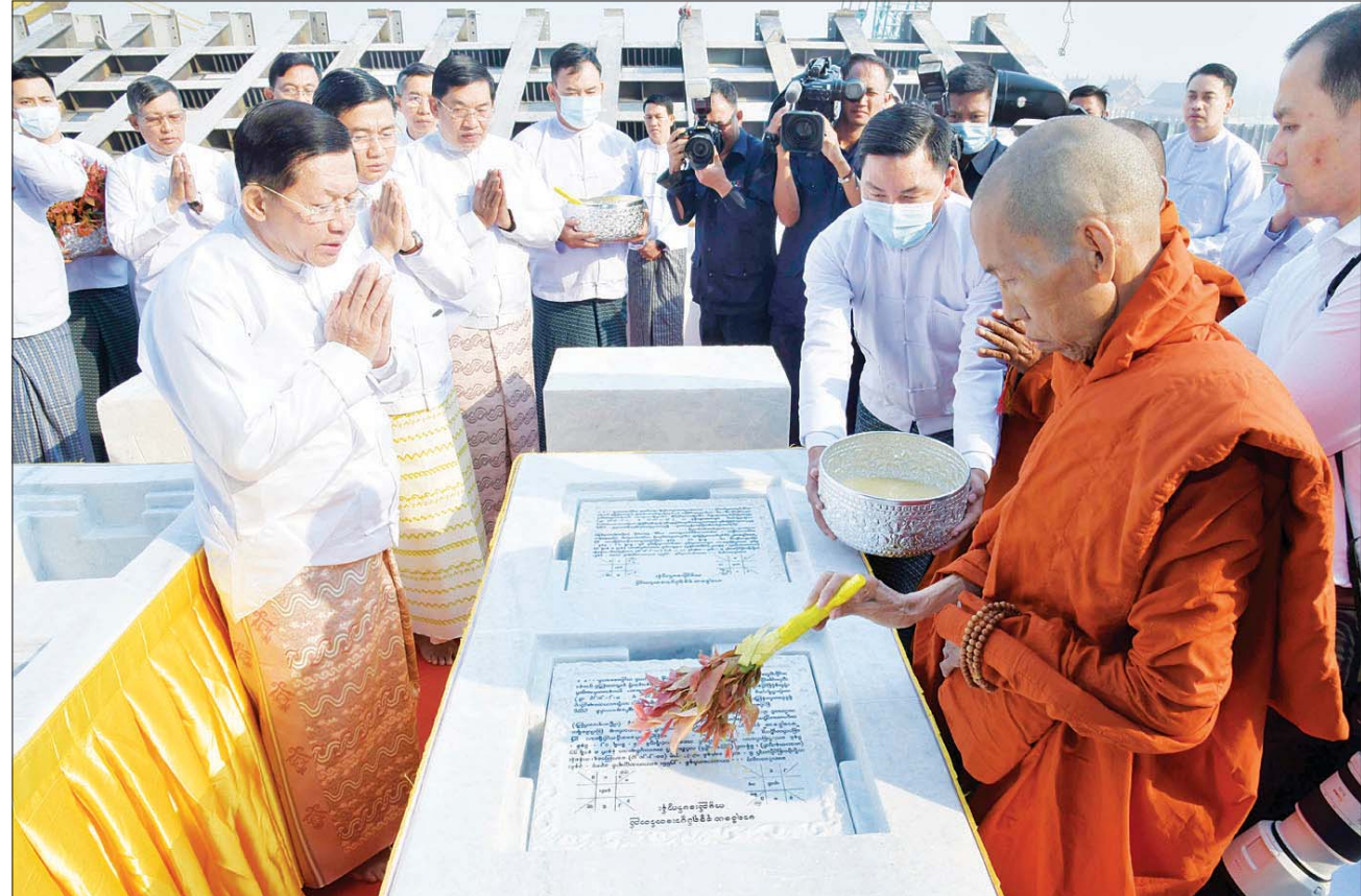
ပါဠိဆရာတော်ကြီး ဌာပနာတော်တိုက်များအား နံ့သာရည်များ ပက်ဖျန်းပူဇော်စဉ်။

□ နိုင်ငံတစ်ဝန်းလုံးရှိ မိဘပြည်သူများ ဝမ်းပန်းတသာ ဆက်သွယ်လှူဒါန်းခဲ့ကြသည့် ရွှေထည် ၁၃၆၀ ကျပ်သား ၅ ဒသမ ၄ ရွေး၊ ကျောက်မျက်ရတနာပါ ရွှေထည်ပစ္စည်း ၁၆၈၄ ကျပ်သား ၁၅ ပဲ ၁ ဒသမ ၆ ရွေး၊ ကျောက်မျက်ရတနာပါ ငွေထည်ပစ္စည်း ၁၂၆ ပဲ ၅ ဒသမ ၁ ရွေး၊ ကျောက်မျိုးစုံ၊ ပုလဲမျိုးစုံအပါအဝင် နိုင်ငံတကာမှ ငွေဒင်္ဂါးပြားများ၊ အဖိုးတန်ရွှေငွေကျောက်သံပတ္တမြားများကို ယနေ့တွင် မာရဝိဇယဗုဒ္ဓရုပ်ပွားတော်မြတ်ကြီး၏ ရတနာပလ္လင်တော်ထက် အလယ်ပဟိုဌာနများတွင် ဌာပနာသွင်းလှူပူဇော်နိုင်ခဲ့ကြောင်းနှင့် ဘုရားကြီးဘက်စုံအလှူငွေအဖြစ် ငွေကျပ် သိန်းပေါင်း ၈၁၀၀ ကျော်ကိုလည်း လက်ခံရရှိခဲ့