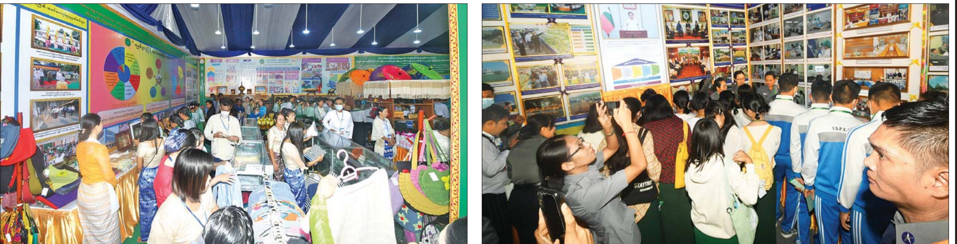
(၇၆) နှစ်မြောက် ပြည်ထောင်စုနေ့အထိမ်းအမှတ် ပြခန်းများကို တိုင်းရင်းသားများ၊ ကျောင်းသား၊ ကျောင်းသူများ လှည့်လည်ကြည့်ရှုစဉ်။