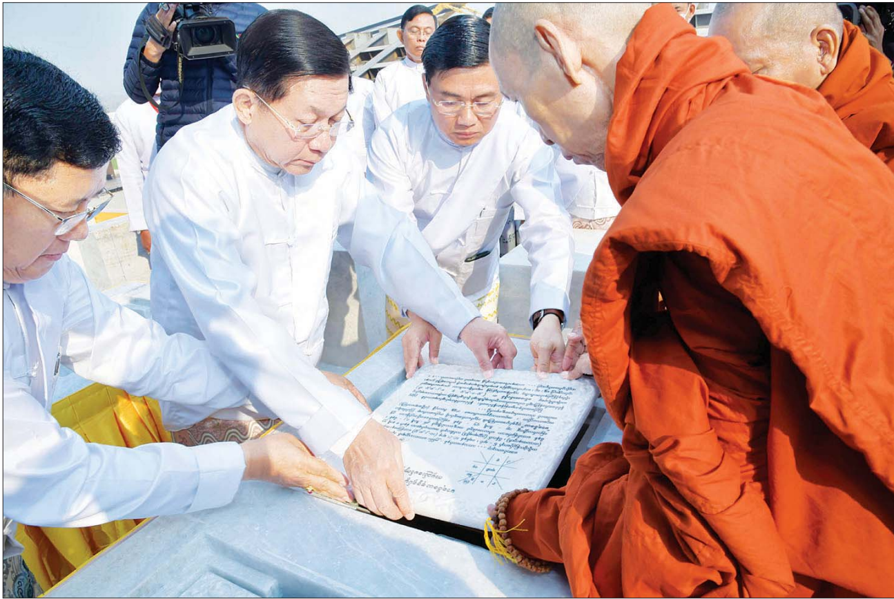
ပါဠိဆရာတော်ကြီးနှင့် ဦးဆောင်ဘုရားဒါယကာ နိုင်ငံတော်စီမံအုပ်ချုပ်ရေးကောင်စီဥက္ကဋ္ဌ နိုင်ငံတော်ဝန်ကြီးချုပ် ဗိုလ်ချုပ်မှူးကြီး မင်းအောင်လှိုင်တို့ မာရဝိဇယ ဗုဒ္ဓရုပ်ပွားတော်မြတ်ကြီး ရတနာပလ္လင်တော်ထက် ဗဟိုဌာနနေရာရှိ ဌာပနာတိုက်တော်များအတွင်းသို့ မာရဝိဇယ ဗုဒ္ဓရုပ်ပွားတော်တည် ကမ္မည်းမော်ကွန်း ကျောက်စာတော်တို့ကို သွင်းလှူပူဇော်ကြစဉ်။

မေတ္တာသုတ်တရားတော်ကို ရွတ်ပွားသရဇ္ဈာယ်၍ မေတ္တာပြုတော်မူကြပြီး ဘုရားဒါယကာများက ရတနာရွှေယူပူဇော်ကာနှင့် သဗ္ဗသင်္ဂါဟက မေတ္တာပို့လက်ာ်နှစ်ပိုဒ်ကို သံပြိုင်ညီညာ သုံးကြိမ်ရွတ်ဆိုပွားများ ပူဇော်ကြသည်။ နာယူကြည်ညို ဆက်လက်၍ ဦးဆောင်ဘုရား ဒါယကာ နိုင်ငံတော်စီမံအုပ်ချုပ်ရေးကောင်စီဥက္ကဋ္ဌ နိုင်ငံတော်ဝန်ကြီးချုပ်နှင့် ဘုရားဒါယကာများက ဆရာတော်ကြီးများရွတ်ပွား သရဇ္ဈာယ်တော်မူကြသည့် ဇယမင်္ဂလာဂါထာတော်ကို နာယူကြည်ညိုကြသည်။ သွင်းလှူပူဇော် ထို့နောက် အခမ်းအနားမှူးက မင်္ဂလာအခါတော်စာတမ်းကို ဖတ်ကြားသည်။ မင်္ဂလာအချိန်တော်တွင် ပါဠိဆရာတော်ကြီးနှင့် ဦးဆောင်ဘုရားဒါယကာ နိုင်ငံတော် စီမံအုပ်ချုပ်ရေးကောင်စီဥက္ကဋ္ဌ နိုင်ငံတော်ဝန်ကြီးချုပ် ဗိုလ်ချုပ်မှူးကြီး မင်းအောင်လှိုင်တို့သည် မာရဝိဇယဗုဒ္ဓ