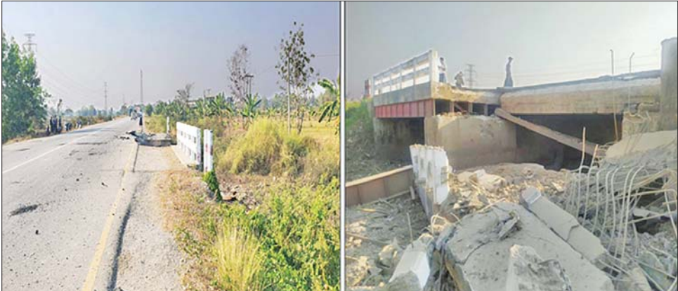
အကြမ်းဖက်သမားများ မိုင်းထောင်ဖောက်ခွဲဖျက်ဆီးခဲ့သည့် ညောင်လေးပင်မြို့နယ် ထော်နွတ်ကျေးရွာ အနီးရှိ သံကူကွန်ကရစ်တံတား။

နေပြည်တော် ဖေဖော်ဝါရီ ၁၀ ဟောင်း မိုင်တိုင်အမှတ် ၉၀ မိုင် အကြမ်းဖက် သမားများ၏ ပဲခူးတိုင်းဒေသကြီး ညောင်လေး ၁ ဖာလုံနှင့် ၂ ဖာလုံကြားရှိ သံကူ မျက်ဆီးမှုကြောင့် ပျက်စီးသွား ပင်မြို့နယ် ထော်နွတ်ကျေးရွာ ကွန်ကရစ် အမျိုးအစား (ဒေသ သည့် တံတားအား အများပြည်သူ အနီးရှိ သံကူကွန်ကရစ် တံတား အခေါ်)တောင်ဘို့ ၃ လုံး တံတား ပြန်လည်အသုံးပြုနိုင်ရေး တာဝန် အား KNU အဖွဲ့မှ အကြမ်းဖက်မှုကို ရှိသူများက ပြင်ဆင်လျက်ရှိကြောင်း ကို လိုလားသောသူများနှင့် PDF နှင့် အကြမ်းဖက်မှုကျူးလွန်သူ အမည်ခံ အကြမ်းဖက်သမားများ အမည်ခံ အကြမ်းဖက်သမားများ က မိုင်းထောင်ဖောက်ခွဲဖျက်ဆီး များအား ဥပဒေနှင့်အညီ ထိရောက် ခဲ့ကြောင်း သိရှိရသည်။ စွာ အရေးယူနိုင်ရေးနှင့်နယ်မြေ ဒေသတည်ငြိမ်အေးချမ်းရေးအတွက် ဖြစ်စဉ်မှာ ဖေဖော်ဝါရီ ၉ ရက် လုံခြုံရေး တပ်ဖွဲ့ဝင်များအနေဖြင့် တွင် အလျား ၂၅ ပေ၊ အနံ ၁၀ ပေ လိုအပ်သည့် လုံခြုံရေးလုပ်ငန်း မှန် ကျိုးကျပျက်စီးခဲ့ကြောင်း များ ဆက်လက် ဆောင်ရွက်လျက် သိရသည်။ သတင်းစဉ်