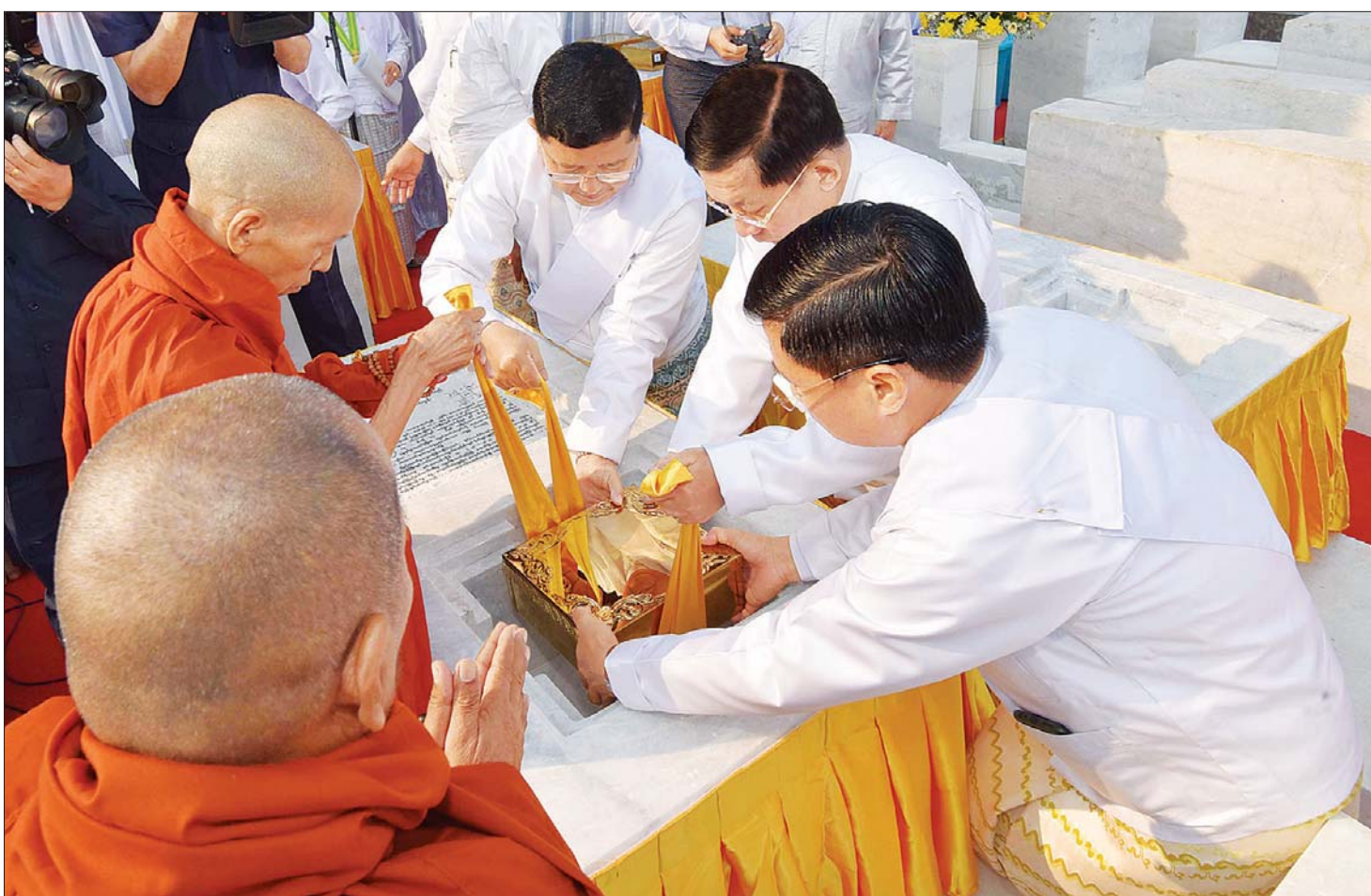
ပါဠိဆရာတော်ကြီးနှင့် ဦးဆောင်ဘုရားဒါယကာ နိုင်ငံတော်စီမံအုပ်ချုပ်ရေးကောင်စီဥက္ကဋ္ဌ နိုင်ငံတော်ဝန်ကြီးချုပ် ဗိုလ်ချုပ်မှူးကြီး မင်းအောင်လှိုင်တို့ မာရဝိဇယဗုဒ္ဓရုပ်ပွားတော်မြတ်ကြီး ရတနာပလ္လင်တော်ထက် ဗဟိုဌာနနေရာရှိ ဌာပနာတော်များအတွင်းသို့ ဌာပနာတော်ပစ္စည်းများ ထည့်သွင်းထားသည့် ရွှေသေတ္တာတော်များ သွင်းလှူပူဇော်ကြစဉ်။

နေပြည်တော် ဖေဖော်ဝါရီ ၁၀ ပြည်ထောင်စုနယ်မြေ နေပြည်တော် ဒက္ခိဏသီရိ မြို့နယ်ရှိ မာရဝိဇယ ဗုဒ္ဓရုပ်ပွားတော်အတွင်း တည်ထားကိုးကွယ်ရန် ဆောင်ရွက်လျက်ရှိသည့် မာရဝိဇယ ဗုဒ္ဓရုပ်ပွားတော်မြတ်ကြီး ရတနာပလ္လင်တော်ထက် အလယ်ဗဟိုဌာနများတွင် ဦးဆောင်ဘုရားဒါယကာ နိုင်ငံတော်စီမံအုပ်ချုပ်ရေးကောင်စီဥက္ကဋ္ဌ နိုင်ငံတော်ဝန်ကြီးချုပ် ဗိုလ်ချုပ်မှူးကြီး မင်းအောင်လှိုင် အမှူးပြုသည့် ပြည်ထောင်စုမြန်မာနိုင်ငံတော် တစ်ဝန်းလုံးမှ ဌာပနာတော်ကုသိုလ်ရှင်များ လှူဒါန်းထားသည့် ဌာပနာတော်များ သွင်းလှူပူဇော်ခြင်း မဟာမင်္ဂလာအခမ်းအနားကို ယနေ့နံနက်ပိုင်းတွင် အဆိုပါဗုဒ္ဓရုပ်ပွားတော်အတွင်း ရှိမာရဝိဇယ ဗုဒ္ဓရုပ်ပွားတော်မြတ်ကြီး တည်ထားကိုးကွယ်သည့် ရတနာပလ္လင်တော်ထက်၌ ကျင်းပပြုလုပ်သည်။ အဆိုပါ ဌာပနာတော်သွင်းလှူပူဇော်ခြင်း မဟာမင်္ဂလာအခမ်းအနားသို့ မာရဝိဇယရုပ်ပွားတော်မြတ်ကြီး တည်ဆောက်ရေးဩဝါဒါစရိယဆရာတော် နေပြည်တော် ပျဉ်းမနားမြို့ ပါဠိတက္ကသိုလ် မင်္ဂလာဇေယျကျောင်းတိုက် ပဓာနနာယက အဂ္ဂမဟာပဏ္ဍိတ အဂ္ဂမဟာ သဒ္ဓမ္မဇောတိကဓဇ ဘဒ္ဒန္တ ဝိမလဗုဒ္ဓိ အမှူးပြုသည့် ဆရာတော် သံဃာတော်များ ကြွရောက် ချီးမြှင့်တော်မူကြပြီး ဦးဆောင်ဘုရားဒါယကာ နိုင်ငံတော်စီမံအုပ်ချုပ်ရေးကောင်စီဥက္ကဋ္ဌ နိုင်ငံတော်ဝန်ကြီးချုပ် ဗိုလ်ချုပ်မှူးကြီး မင်းအောင်လှိုင်နှင့် ဘုရားဒါယကာများ တက်ရောက်ကြည့်ညိုကြသည်။ စာမျက်နှာ ၃ ကော်လံ ၁ *