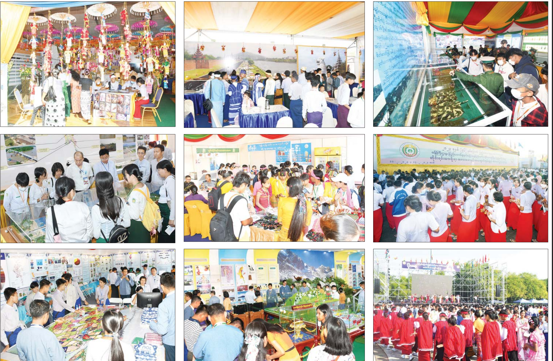
(၇၆) နှစ်မြောက် ပြည်ထောင်စုနေ့အထိမ်းအမှတ် ပြခန်းများကို တိုင်းရင်းသားများ၊ ကျောင်းသား၊ ကျောင်းသူများ လှည့်လည်ကြည့်ရှုစဉ်။