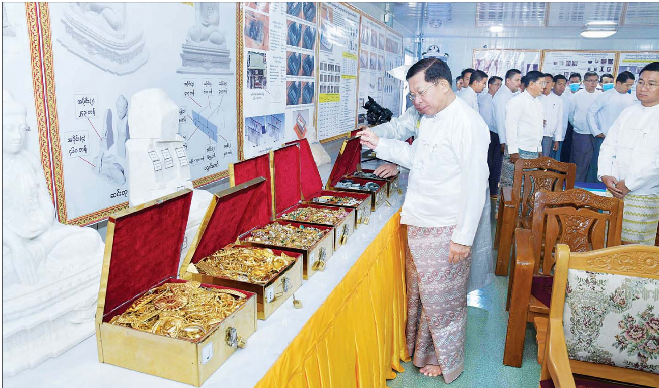
ဦးဆောင်ဘုရားဒါယကာ နိုင်ငံတော်စီမံအုပ်ချုပ်ရေးကောင်စီဥက္ကဋ္ဌ နိုင်ငံတော်ဝန်ကြီးချုပ် ဗိုလ်ချုပ်မှူးကြီး မင်းအောင်လှိုင် စေတနာရှင်၊ အလှူရှင်များ စုပေါင်းလှူဒါန်းထားသည့် ဌာပနာတော်ပစ္စည်းများကို ကြည့်ရှုစဉ်။

ရုပ်ပွားတော်မြတ်ကြီး ရတနာပလ္လင်တော်ထက် ဗဟိုဌာနနေရာရှိ ဌာပနာတိုက်တော်များအတွင်းသို့ နိုင်ငံတစ်ဝန်းလုံးရှိ (၇) ရက်သား၊ သမီး ဘုရားဒါယကာ၊ ဒါယကာမများ၊ စေတနာရှင်၊ အလှူရှင်များ စုပေါင်းလှူဒါန်းထားသည့် အဖိုးတန်ရတနာရွှေငွေ ကျောက် သံပတ္တမြားများ၊ နိုင်ငံတကာမှ ငွေဒင်္ဂါးပြားများ အပါအဝင် ဌာပနာတော်ပစ္စည်းများ ထည့်သွင်းထားသည့် ရွှေသေတ္တာတော်များနှင့် မာရဝိဇယ ဗုဒ္ဓရုပ်ပွားတော်တည် ကမ္မည်းမော်ကွန်း