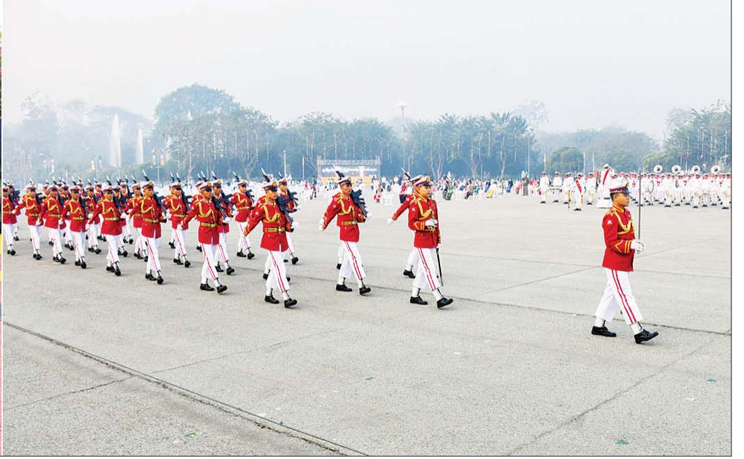
နိုင်ငံတော်စီမံအုပ်ချုပ်ရေးကောင်စီ ဒုတိယဥက္ကဋ္ဌ ဒုတိယဝန်ကြီးချုပ် ဒုတိယဗိုလ်ချုပ်မှူးကြီး စိုးဝင်း (၇၆) နှစ်မြောက်ပြည်ထောင်စုနေ့အခမ်းအနား အောင်မြင်စွာကျင်းပနိုင်ရေး ကြိုတင်ပြင်ဆင်ဆောင်ရွက်ထားရှိမှုများ ကြည့်ရှုစစ်ဆေးစဉ်။