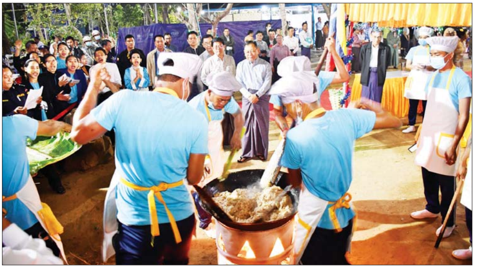
မာန်တက်ယှဉ်ပြိုင်ကာ ဝန်ထမ်း မကျင်းပမီ တပ်ဖွဲ့/ဦးစီးဌာနများမှ ပြိုင်ပွဲနှင့် ဒိုးပတ်ပြိုင်ပွဲတို့မှ များကလည်း ဒိုးပတ်ပိုင်းများဖြင့် ပြိုင်ပွဲဝင်အသင်းများကို တာဝန်ရှိ ဖျော်ရွှင်စွာအားပေးကြသည်။ ဒိုးပတ်ပြိုင်ပွဲကို ဆက်လက်ကျင်းပ သူများက ဆုများပေးအပ်ချီးမြှင့် ခဲ့ပြီး ဆုရရှိကြသည့် ထမနဲထိုး ကြကြောင်း သိရသည်။ သတင်းစဉ်

မှာကြားသည်။ အဆိုပါ မြန်မာ့ရိုးရာထမနဲ ထိုးပြိုင်ပွဲသို့ ပြည်ထဲရေးဝန်ကြီး ဌာန၊ ပြည်ထောင်စုဝန်ကြီးရုံး၊ မြန်မာနိုင်ငံရဲတပ်ဖွဲ့၊ အထွေထွေ အုပ်ချုပ်ရေးဦးစီးဌာန၊ အထူးစုံစမ်း စစ်ဆေးရေးဦးစီးဌာန၊ အကူညီဦးစီး ဌာနနှင့် မီးသတ်ဦးစီးဌာနတို့မှ ပြိုင်ပွဲဝင်အသင်း ခြောက်သင်း ပါဝင်ယှဉ်ပြိုင်ခဲ့ကြကာ ဒုတိယ ဝန်ကြီးချုပ်နှင့် ပြည်ထောင်စု ဝန်ကြီး ဒုတိယဗိုလ်ချုပ်ကြီး စိုးထွဋ်နှင့် ဇနီး ဦးဆောင်သောအဖွဲ့ က ပြိုင်ပွဲဝင်အသင်းများ၏ မြန်မာ့ ရိုးရာ ထမနဲထိုးပြိုင်ပွဲယှဉ်ပြိုင် နေမှုကို လိုက်လံကြည့်ရှုအားပေး ကြပြီး (အပေါ်ယာပုံ) ပြိုင်ပွဲဝင် အသင်းများအနေဖြင့် အားကြီး