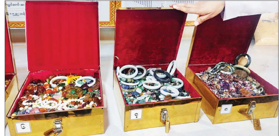
နိုင်ငံတစ်ဝန်းလုံးရှိ (၇) ရက် သား၊ သမီး ဘုရားဒါယကာဒါယိကာမများ၊ စေတနာရှင်၊ အလှူရှင်များ စုပေါင်းလှူဒါန်းထားသည့် အဖိုးတန်ရတနာရွှေငွေကျောက် သံပတ္တမြားများနှင့် ဌာပနာပစ္စည်းများကို တွေ့ရစဉ်။