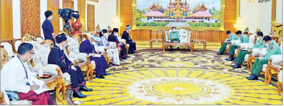
နိုင်ငံတော်စီမံအုပ်ချုပ်ရေးကောင်စီဥက္ကဋ္ဌ တပ်မတော်ကာကွယ်ရေးဦးစီးချုပ် ဗိုလ်ချုပ်မှူးကြီး မင်းအောင်လှိုင် ငြိမ်းချမ်းရေး ကိုယ်စားလှယ်အဖွဲ့များနှင့်တွေ့ဆုံ၍ ငြိမ်းချမ်းရေးဆိုင်ရာ ကိစ္စရပ်များဆွေးနွေးစဉ်။ (၂၀၂၂ ခုနှစ် ဩဂုတ် ၂၃ ရက်)

ပန်းတိုင်ကွယ်ပျောက်လု နီးပါးဖြစ်ခဲ့ ကြိုးပမ်း ဆောင်ရွက်မှုများသည် တရားနည်းလမ်းကျနည်း မှန်ကန် မွန်မြတ်သည့် အမျိုးသားရေးလှုပ်ရှားမှု များဖြစ်ခဲ့လျှင် တိုင်းရင်းသား ပြည်သူများအတွင်း တိုင်းချစ်ပြည်ချစ် စိတ်ဓာတ်များနှင့် အမျိုးသားရေး စိတ်ဓာတ်များ ကျယ်ကျယ်ပြန့်ပြန့် စိမ့်ဝင်ပျံ့နှံ့စေခဲ့သည်။ ပြည်သူများ ကိုယ်တိုင် အမျိုးသားလွတ်မြောက်ရေး လှုပ်ရှားမှုများတွင် တစ်တပ်တစ်အား ပါဝင်ရမည်ဆိုသည့် အသိတရားများ ကိန်းဝပ်လာခဲ့သည်။ မှန်ကန်သည့် အသိ စိတ်ဓာတ်နှင့် နိုင်ငံရေးနိုးကြားမှုများ သည် တိုင်းရင်းသားပြည်သူများအကြား တွင် ကြီးမားသည့် ထုထည်ပမာဏ ဖြစ်ပေါ်လာသည့်အတွက် စည်းလုံး