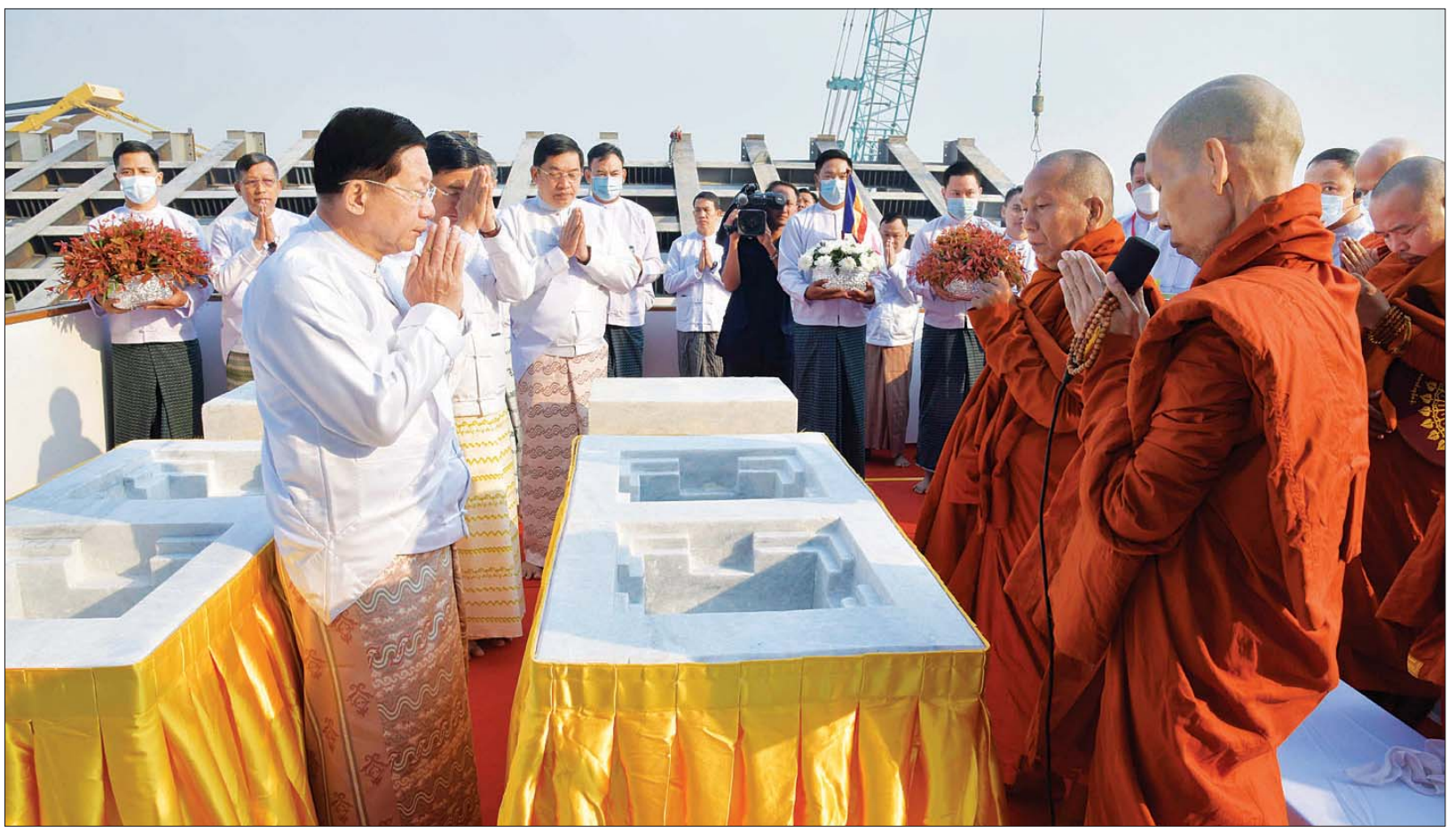
ဌာပနာတော် သွင်းလှူပူဇော်ခြင်း မဟာမင်္ဂလာ အခမ်းအနားတွင် ပါဠိဆရာတော်ကြီးနှင့် ဦးဆောင်ဘုရားဒါယကာ နိုင်ငံတော်စီမံအုပ်ချုပ်ရေးကောင်စီဥက္ကဋ္ဌ နိုင်ငံတော်ဝန်ကြီးချုပ် ဗိုလ်ချုပ်မှူးကြီး မင်းအောင်လှိုင်တို့ အမျှပြုသည့် ဘုရားဒါယကာများက ရတနာရွှေယုဇာဂါထာနှင့် သဗ္ဗသင်္ဂါဟက မေတ္တာပို့လက်ာ နှစ်ပိုဒ်ကို သံပြိုင်ညီညာ သုံးကြိမ်ရွတ်ဆို ပွားများ ပူဇော်ကြစဉ်။