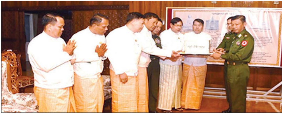
များ တက်ရောက်ကြသည်။ အလှူငွေကျပ်သိန်း ၅၅၅၀ နှင့် ဦးစွာ တိုင်းဒေသကြီးအစိုးရ ဒုတိယဗိုလ်ချုပ်ကြီး ရဲမြင့် အဖွဲ့က အဝင်မုခ်ဦးငယ်တစ်ခုနှင့် (အငြိမ်းစား) မိသားစုက အလှူ သုဓမ္မာဇရပ်တစ်ဆောင်တို့အတွက် ငွေကျပ်သိန်း ၇၀ တို့ကို ပေးအပ် လှူဒါန်းရာ တိုင်းမှူးက လက်ခံ ကျေးဇူးတင်စကား ပြောကြားခဲ့ကြောင်း သတင်းရရှိသည်။ သတင်းစဉ်

နေပြည်တော် ဖေဖော်ဝါရီ ၁၀ မာရဝိဇယ ရုပ်ပွားတော်မြတ်ကြီး တည်ထားကိုးကွယ်ရာတွင် အသုံး ပြုနိုင်ရေးအတွက် စေတနာရှင် အလှူရှင်များက အလှူငွေများ လှူဒါန်းခြင်းကို ယနေ့နံနက်ပိုင်း တွင် ရန်ကုန်တိုင်းဒေသကြီး ဒဂုံမြို့နယ်ရှိ တိုင်းဒေသကြီး အစိုးရအဖွဲ့ရုံး မင်္ဂလာခန်းမ၌ ပြုလုပ်ရာ တိုင်းဒေသကြီး ဝန်ကြီးချုပ် ဦးစိုးသိန်း၊ ရန်ကုန် တိုင်း စစ်ဌာနချုပ် တိုင်းမှူး ဗိုလ်ချုပ် ညွှန်စိုင်းဆွေနှင့် တာဝန် ရှိသူများ၊ စေတနာရှင် အလှူရှင်