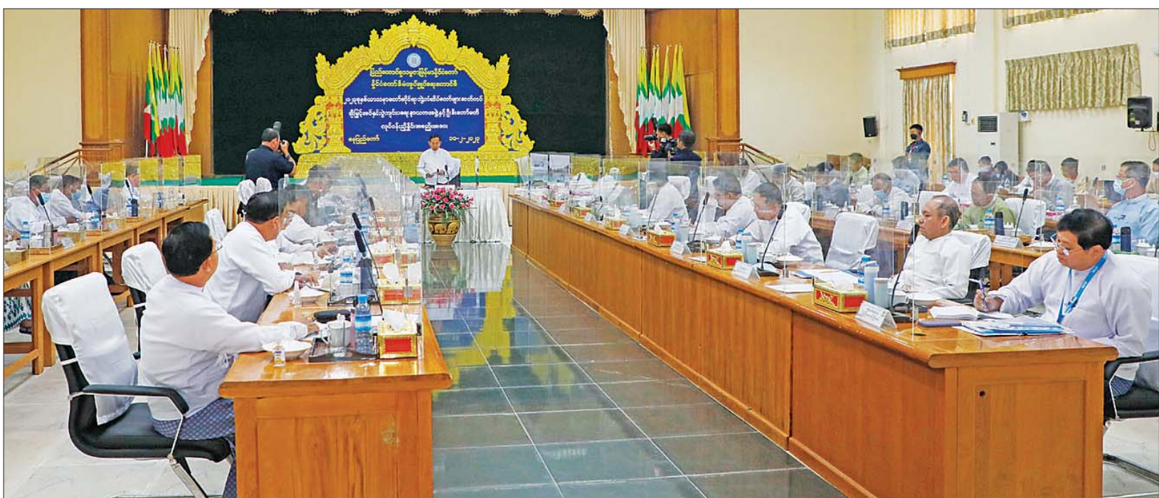
နိုင်ငံတော်စီမံအုပ်ချုပ်ရေးကောင်စီ ဒုတိယဥက္ကဋ္ဌ ဒုတိယဝန်ကြီးချုပ် ဒုတိယဗိုလ်ချုပ်မှူးကြီး စိုးဝင်း ၂၀၂၃ ခုနှစ် သာသနာတော်ဆိုင်ရာ ဘွဲ့တံဆိပ်တော်များ ဆက်ကပ်ချီးမြှင့်အပ်နှင်းပွဲ ကျင်းပရေး နာယကအဖွဲ့နှင့် ဦးစီးကော်မတီ လုပ်ငန်းညှိနှိုင်းအစည်းအဝေးတွင် အမှာစကားပြောကြားစဉ်။

နေပြည်တော် ဖေဖော်ဝါရီ ၁၀ ပြည်ထောင်စုသမ္မတ မြန်မာနိုင်ငံ တော် နိုင်ငံတော်စီမံအုပ်ချုပ်ရေး ကောင်စီ ၂၀၂၃ ခုနှစ် သာသနာ တော်ဆိုင်ရာ ဘွဲ့တံဆိပ်တော်များ ဆက်ကပ်ချီးမြှင့်အပ်နှင်းပွဲကျင်းပ ရေး နာယကအဖွဲ့နှင့် ဦးစီး ကော်မတီ လုပ်ငန်းညှိနှိုင်းအစည်း အဝေးကို ယနေ့မနက် ၁၀ နာရီခွဲ တွင် နေပြည်တော်ရှိ သာသနာရေး နှင့် ယဉ်ကျေးမှုဝန်ကြီးဌာန အစည်းအဝေးခန်းမ၌ ကျင်းပရာ သာသနာတော်ဆိုင်ရာ ဘွဲ့တံဆိပ် တော်များ ဆက်ကပ်ချီးမြှင့် အပ်နှင်းပွဲကျင်းပရေး နာယက အဖွဲ့ဥက္ကဋ္ဌ နိုင်ငံတော်စီမံအုပ်ချုပ် ရေးကောင်စီ ဒုတိယဥက္ကဋ္ဌ ဒုတိယ ဝန်ကြီးချုပ် ဒုတိယဗိုလ်ချုပ်မှူး ကြီး စိုးဝင်း တက်ရောက်အမှာ စကားပြောကြားသည်။ စာမျက်နှာ ၇ ကော်လံ ၁ ❖