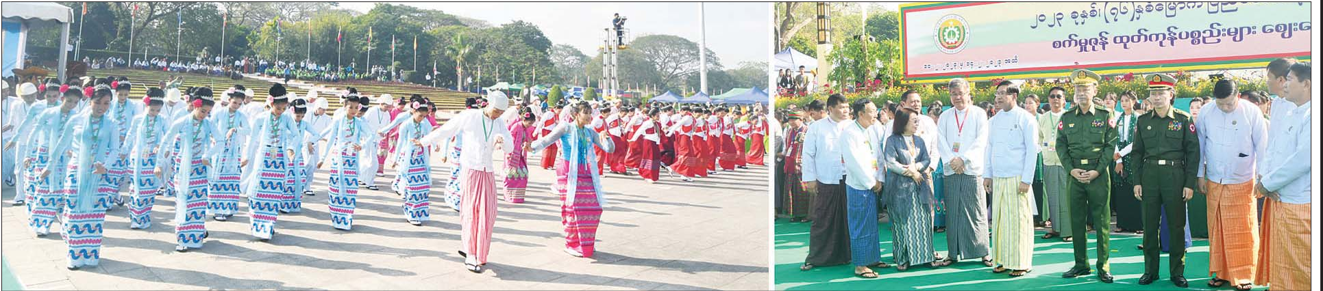
ရန်ကုန်တိုင်းဒေသကြီး ဝန်ကြီးချုပ် ဦးစိုးသိန်း၊ ရန်ကုန်တိုင်းစစ်ဌာနချုပ်တိုင်းမှူး ဗိုလ်ချုပ်ညွှန်ဝင်းဆွေနှင့် တာဝန်ရှိသူများ တိုင်းရင်းသား၊ တိုင်းရင်းသူများနှင့် ကျောင်းသား၊ ကျောင်းသူများ စုပေါင်း ဂုဏ်ပြုဖျော်ဖြေတင်ဆက်မှုကို ကြည့်ရှုအားပေးစဉ်။