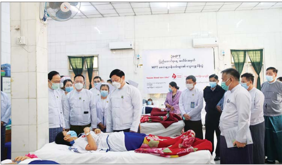
နေပြည်တော် ဖေဖော်ဝါရီ ၁၀ (၇၆)နှစ်မြောက် ပြည်ထောင်စုနေ့ကို ကြိုဆိုဂုဏ်ပြုသောအားဖြင့် ပို့ဆောင်ရေးနှင့် ဆက်သွယ်ရေးဝန်ကြီးဌာန မြန်မာ့ဆက်သွယ်ရေးလုပ်ငန်းမှ ဝန်ထမ်းများသည် ယနေ့တွင် နေပြည်တော်၊ ရန်ကုန်နှင့် မန္တလေးမြို့တို့တွင် စုပေါင်းပြီး သွေးလှူဒါန်းကြရာ နေပြည်တော် ခုတင် (၁၀၀၀) အထွေထွေ ရောဂါကုဆေးရုံကြီးသို့ ဒုတိယဝန်ကြီးချုပ်နှင့် ပြည်ထောင်စုဝန်ကြီး ဗိုလ်ချုပ်ကြီး တင်အောင်စန်း သွားရောက်ကြည့်ရှု

အားပေးသည်။ (ဝဲပုံ) စုပေါင်းသွေးလှူဒါန်းရာတွင် နေပြည်တော်တွင် ၄၃ ဦး၊ ရန်ကုန်မြို့တွင် ၁၅၇ ဦးနှင့် မန္တလေးမြို့တွင် ၂၇ ဦး သွေးလှူရှင် စုစုပေါင်း ၂၂၇ ဦးတို့က ပါဝင်လှူဒါန်းခဲ့ပြီး အဆိုပါ သွေးလှူဒါန်းပွဲသို့ ကျန်းမာရေးဝန်ကြီးဌာန ပြည်ထောင်စုဝန်ကြီး ဒေါက်တာ သက်ခိုင်ဝင်း၊ ဒုတိယဝန်ကြီးများ၊ ဌာနကြီးမှူးများ၊ ဆေးရုံအုပ်ကြီးနှင့် တာဝန်ရှိသူများက သွေးလှူဒါန်းနေမှုများကို လိုက်လံကြည့်ရှုအားပေးကာ စားသောက်ဖွယ်ရာ