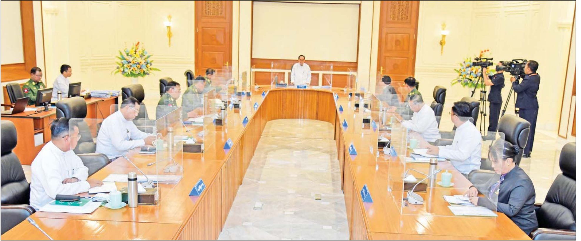
ပြည်ထောင်စုသမ္မတမြန်မာနိုင်ငံတော် အမျိုးသားကာကွယ်ရေးနှင့်လုံခြုံရေးကောင်စီ အစည်းအဝေး(၁/၂၀၂၃) ကျင်းပစဉ်။