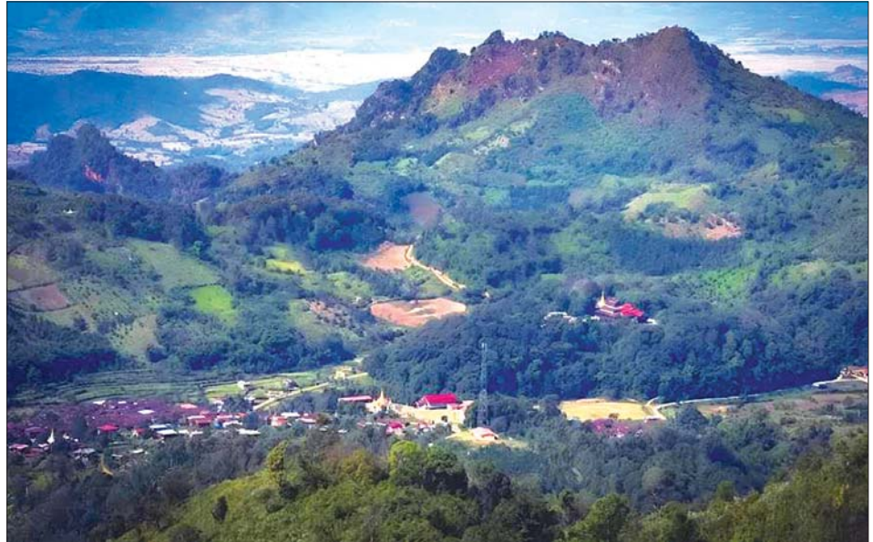
မဲနယ်တောင်တန်းဒေသ ကျောက္ကချားကျေးရွာမှ ပတ်ဝန်းကျင်အလှများ။