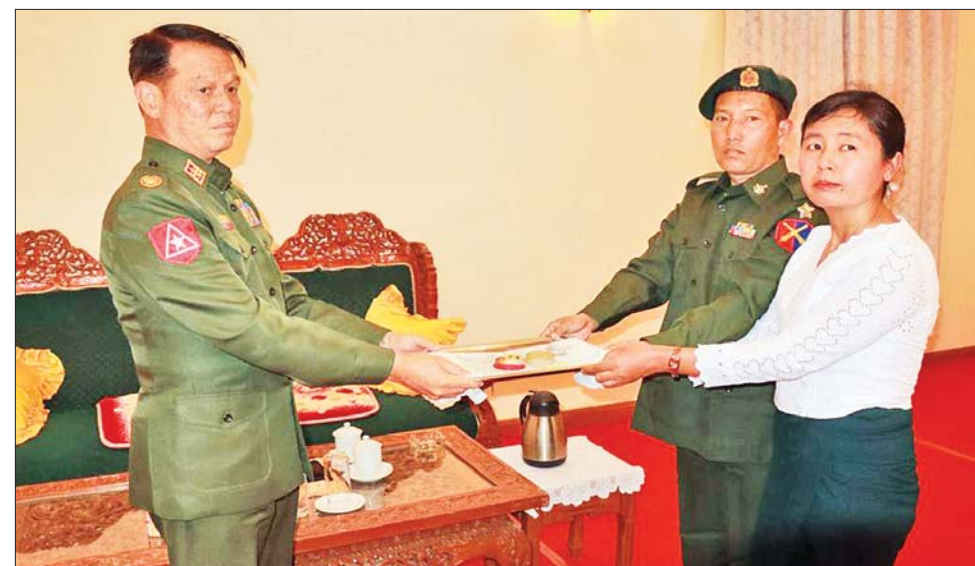
မာရဝိဇယဗုဒ္ဓရုပ်ပွားတော်မြတ်ကြီး ရတနာပလ္လင်တော်ထက် အလယ်ဗဟိုဌာနများတွင် ဌာပနာတော် ထပ်မံထည့်သွင်း သွင်းလှူပူဇော်နိုင်ရေး စေတနာရှင်များက ရှမ်းပြည်နယ်(အရှေ့ပိုင်း)ရှိ သက်ဆိုင်ရာ တာဝန်ရှိသူများထံ လာရောက်လှူဒါန်းစဉ်။

ကျောက်မျက်ရတနာပါ ရွှေထည် ပစ္စည်း ၂၀၀ ကျပ်သား ၁ ပဲ ၁ ရွှေ၊ ကျောက်မျက်ရတနာပါ အဝင် ဗုဒ္ဓမြတ်စွာဘုရား၏ ဇာတာ တော်များ၊ နိုင်ငံတကာမှ ငွေ ဒင်္ဂါးပြားများ၊ အဖိုးတန်ရွှေ ငွေ ကျောက်သံပတ္တမြားများကို ဌာပနာသွင်းလှူပူဇော်နိုင်ခဲ့သည်။ ထို့ပြင် ဗုဒ္ဓရုပ်ပွားတော်မြတ် ကြီး၏ ရတနာပလ္လင်တော်ထက် အလယ်ဗဟိုဌာနများတွင် ထပ်မံ ထည့်သွင်းလှူဒါန်းပူဇော်မည်ဖြစ် ပါသဖြင့် ကုသိုလ်တော် ရေရှည် တည်တံ့ခိုင်မြဲနိုင်မည့် အဖိုးတန် ကျောက်မျက်ရတနာများ ဌာပနာ ကုသိုလ်ပြုနိုင်ရန်အတွက် နိဗ္ဗာန် အကျိုးမျှော်၍ အသိပေးနှိုးဆော် ထားလျက်ရှိရာ (၇) ရက် သား၊ သမီး၊ ဘုရားဒါယကာ၊ ဒါယိကာမ