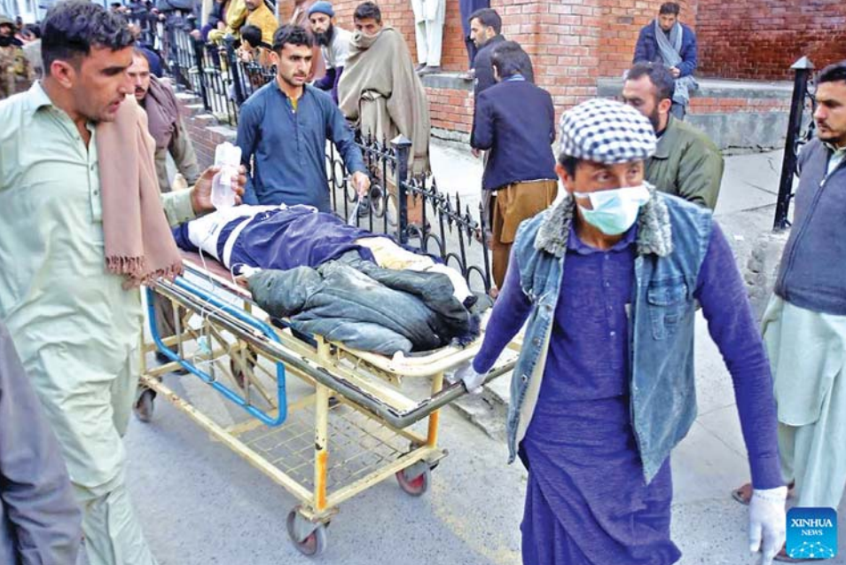
ပက်ရှာဝါမြို့၌ ဘာသာရေးအဆောက်အအုံတစ်လုံးကို အသေခံပုံးခွဲတိုက်ခိုက်ပြီးနောက် ထိခိုက်ဒဏ်ရာ ရရှိသူတစ်ဦးအား ဆေးရုံသို့ ပို့ဆောင်နေမှုကို ဇန်နဝါရီ ၃၀ ရက်က တွေ့ရစဉ်။