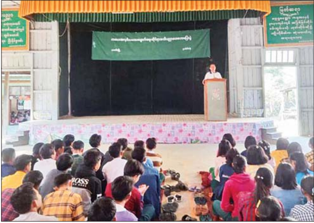
သယ်ပိုးဆောင်ရွက်ရေးကို ထမ်းဆောင်ရမည်ဖြစ်သည့်အတွက် လမ်းမှား မရောက်စေဘဲ ပညာတတ်ကြီးဖြစ်အောင် ကြိုးစားစေလိုကြောင်း ပြောကြားသည်။

ပလက်ဝ ဇန်နဝါရီ ၃၁ ချင်းပြည်နယ် ပလက်ဝမြို့ အ.ထ.က(၁)ကျောင်းတွင် ပြန်ကြားရေးနှင့် ပြည်သူ့ဆက်ဆံရေးဦးစီးဌာနမှ ဦးစီးကျင်းပသည့် ကလေးအလုပ်သမား ပပျောက်ရေးဆိုင်ရာ အသိပညာပေးဟောပြောပွဲကို ယနေ့နံနက်က အ.ထ.က(၁) သင်တန်းခန်းမ၌ ကျင်းပသည်။ (ယာပုံ)