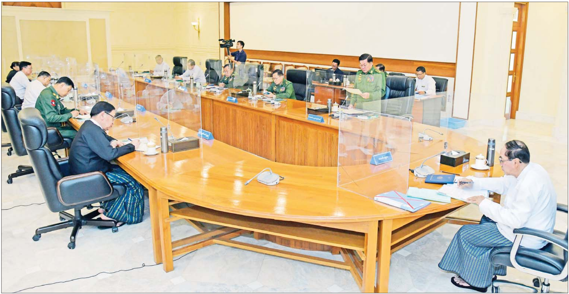
ပြည်ထောင်စုသမ္မတမြန်မာနိုင်ငံတော် အမျိုးသားကာကွယ်ရေးနှင့်လုံခြုံရေးကောင်စီ အစည်းအဝေး(၁/၂၀၂၃) ကျင်းပစဉ်။

၅။ အရေးပေါ်ကာလဆိုင်ရာ ပြဋ္ဌာန်းချက်များနှင့်အညီ ဆောင်ရွက်ပြီးစီးပါက ဖွဲ့စည်းပုံအခြေခံဥပဒေ (၂၀၀၈ ခုနှစ်) နှင့်အညီ လွတ်လပ်ပြီး တရားမျှတသော ပါတီစုံဒီမိုကရေစီအထွေထွေရွေးကောက်ပွဲအား ပြန်လည်ကျင်းပ၍ အနိုင်ရသည့်ပါတီအား ဒီမိုကရေစီစံနှုန်းများနှင့်အညီ နိုင်ငံတော်တာဝန်အား လွှဲအပ်နိုင်ရေး ဆက်လက်ဆောင်ရွက်သွားမည်။