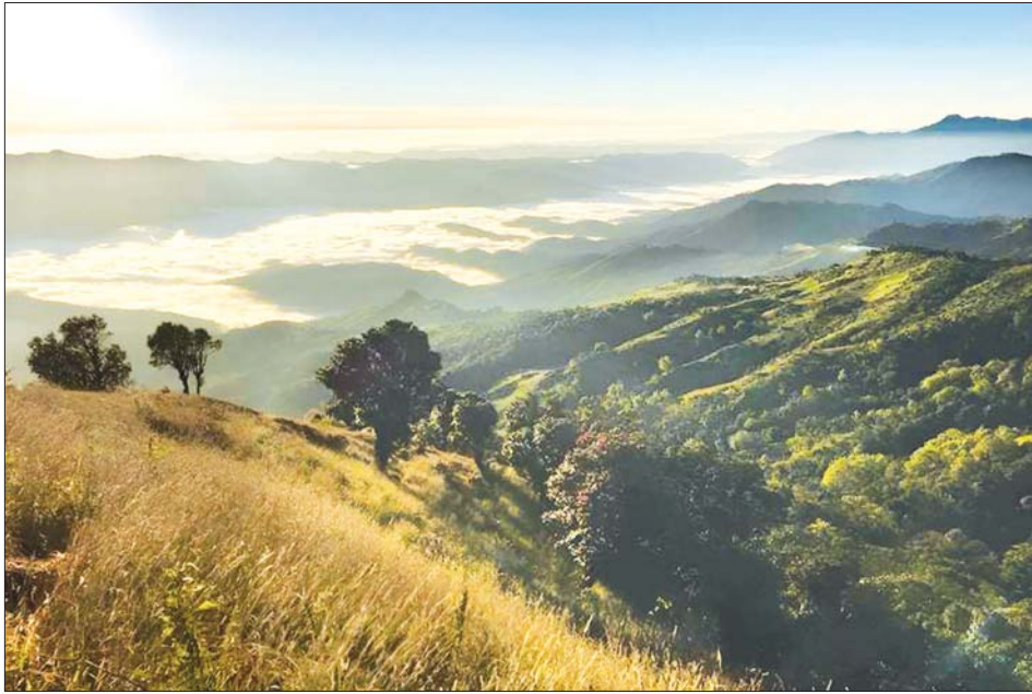
မဲနယ်တောင် (သို့မဟုတ်) လွယ်မိုင်းတောင်တန်း၏အလှ။

ပေ ၇၀၀၀ ကျော်ခန့် မြင့်သောတောင်ကြောသို့ တစ်ခါတစ်ရံ ၄၅ ဒီဂရီ၊ တစ်ခါတစ်ရံ ၆၀ ဒီဂရီ ခန့် အစောင်းရှိသော တောင်စောင်းတစ်လျှောက် တက်ကြရ၏။ အတက်ကြမ်းလေစွ။ တစ်ခါတစ်ရံ ခပ်ပြေပြေ လျှောက်ကြရ၏။ လမ်းတစ်လျှောက် လေတိုက်လိုက်တိုင်း လေနှင့်အတူ ဝေဝေဝေဝေ ပြန်ကြနေသော ရွက်ကြွေတို့ကို နင်းလျှောက်ရ၏။ တဖြည်းဖြည်း မြင့်တက်လာသည်နှင့်အမျှ သံလွင်မြစ်သည် မြင်ကွင်းမှ ပျောက်ကွယ်ခဲ့လေပြီ။ ကျေးရွာမရှိ၊ ရေမရှိ၊ လူသွားလမ်းကြောင်းသာရှိ၏။ ထင်းရှူးတောတို့က မြင့်မားစိမ်းလန်း နေလေ၏။ ထင်းရှူး