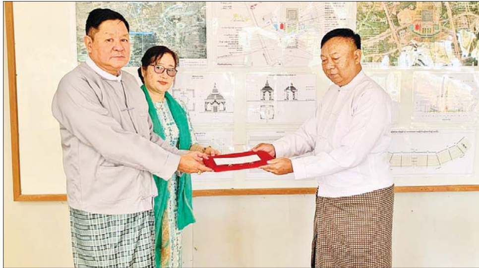
မာရဝိဇယဗုဒ္ဓရုပ်ပွားတော်မြတ်ကြီး ရတနာပလ္လင်တော်ထက် အလယ်ဗဟိုဌာနများတွင် ဌာပနာတော် ထပ်မံထည့်သွင်း သွင်းလှူပူဇော်နိုင်ရေး စေတနာရှင်များက နေပြည်တော်ကောင်စီ ပြည်ထောင်စုနယ်မြေ ရှိ သက်ဆိုင်ရာတာဝန်ရှိသူများထံ လာရောက်လှူဒါန်းစဉ်။

များ၊ စေတနာရှင်၊ အလှူရှင်များက ဝမ်းပန်းတသာ ဆက်သွယ်၍ ဌာပနာကုသိုလ်များကို ထည့်ဝင် လှူဒါန်းလျက်ရှိကြပြီး ယနေ့ တွင် နေပြည်တော်ကောင်စီ ပြည်ထောင်စုနယ်မြေသို့ ရွှေထည် ၁၅ ကျပ်သား ၅ ပဲ ၅ ရွှေ၊ ကျောက် မျက်ရတနာပါ ရွှေထည်ပစ္စည်း ၂၃ ကျပ်သား ၇ ပဲ ၄ ရွှေ၊ ပုလဲ နှင့် ကျောက်မျက်ရတနာမျိုးစုံ၊ ရန်ကုန်တိုင်းဒေသကြီး၌ ရွှေထည် ၁၂ ကျပ်သား ၄ ပဲ ၂ ရွှေ၊ ကျောက် မျက်ရတနာပါ ရွှေထည်ပစ္စည်း ၂၅ ကျပ်သား ၁၀ ပဲ ၂ ရွှေ၊ ပုလဲနှင့် ကျောက်မျိုးစုံ၊ ငွေထည်ပစ္စည်းများ နှင့် နိုင်ငံ့ဂုဏ်ဆောင်ဘွဲ့တံဆိပ် များ၊ အလှူငွေကျပ် ၂၁၅၀၀၀၀ နှင့် မန္တလေးတိုင်းဒေသကြီး၌