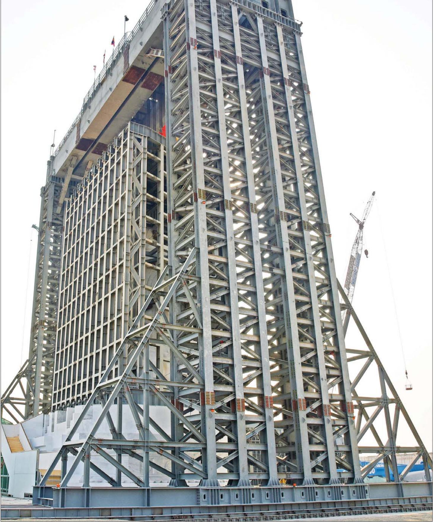
မာရဝိဇယ ဗုဒ္ဓရုပ်ပွားတော်မြတ်ကြီး၏ ဆင်းတုတော်အပိုင်း (၁/၂/၃)တို့ကို တွဲဆက်ထားသည့် ဆင်းတုတော်အစိတ်အပိုင်းကြီးအား ရတနာပလ္လင်တော်ထက်သို့ အောင်မြင်စွာ ပင့်ဆောင်ပြီးစီးမှုကို ဖူးတွေ့ရစဉ်။

အဆိုပါ ရတနာပလ္လင်တော်အနီးနေရာအထိ ပင့်ဆောင်ထားသည့် မာရဝိဇယဗုဒ္ဓရုပ်ပွားတော်မြတ် ကြီး၏ ဆင်းတုတော်အပိုင်း(၁/၂/၃)တို့ကို တွဲဆက် ထားသည့် ဆင်းတုတော်အစိတ်အပိုင်းကြီးအား ယနေ့နံနက် ၁ နာရီ ၃၅ မိနစ်တွင် အမြင့် ၉ လက်မ ပင့်တင်ပြီး ပလ္လင်ပေါ်သို့ ဆက်လက်ပင့်ဆောင်ခဲ့ရာ နံနက် ၁၁ နာရီ ၃၄ မိနစ်တွင် ရတနာပလ္လင်တော်ထက် သို့ အောင်မြင်စွာ ပင့်ဆောင်နေရာချထားနိုင်ခဲ့ ကြောင်းနှင့် အဆိုပါ ပင့်ဆောင်နေရာချထားမှု