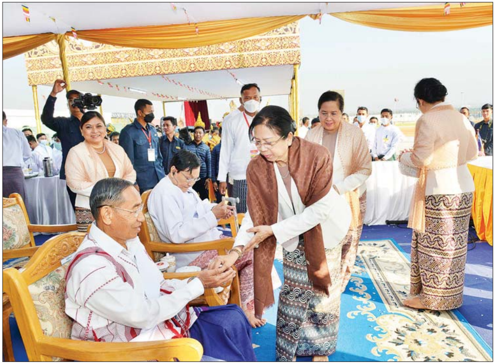
နိုင်ငံတော်စီမံအုပ်ချုပ်ရေးကောင်စီဥက္ကဋ္ဌ နိုင်ငံတော်ဝန်ကြီးချုပ် ဗိုလ်ချုပ်မှူးကြီး မင်းအောင်လှိုင်နှင့် ဇနီး ဒေါ်ကြူကြူလှတို့ မဟာမင်္ဂလာအခမ်းအနား အောင်မြင်ခြင်းအထိမ်းအမှတ်အဖြစ် ရတနာ ရွှေမိုးငွေမိုးများ ရွာသွန်းပြီးစဉ်။