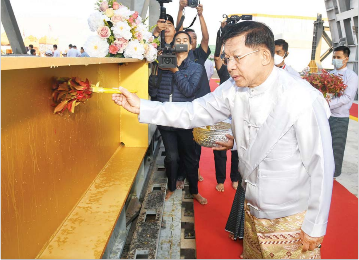
ပက်ဖျန်းပူဇော် နိုင်ငံတော်စီမံအုပ်ချုပ်ရေးကောင်စီ ဥက္ကဋ္ဌ နိုင်ငံတော်ဝန်ကြီးချုပ် ဗိုလ်ချုပ်မှူးကြီး မင်းအောင်လှိုင် ရတနာပလ္လင်တော်ထက်သို့ ပင့်ဆောင်ပူဇော်မည့် သံဃဏီမျှော်စင်ကရိန်းနေရာ လေးခုတို့အား ပရိတ်နံ့သာရည်များ ပက်ဖျန်းပူဇော်၍ သိဒ္ဓိမင်္ဂလာ ဆင်ယင်စဉ်။

၀ ရှေ့ဖုံးမှ အဆိုပါ မင်္ဂလာအခမ်းအနားသို့ နိုင်ငံတော် သံဃမဟာနာယကအဖွဲ့ဥက္ကဋ္ဌ မန္တလေးမြို့ ဗန်းမော်ကျောင်းတိုက်ဆရာတော် အဘိဓဇမဟာရဋ္ဌဂုရု အဘိဓဇအဂ္ဂမဟာ သဒ္ဓမ္မဇောတိက ဒေါက်တာ ဘဒ္ဒန္တကုမာရာဘိဝံသနှင့် သီတဂူကမ္ဘာ့ဗုဒ္ဓတက္ကသိုလ်များ၏ အဓိပတိ အဘိဓဇမဟာရဋ္ဌဂုရု၊ အဘိဓဇအဂ္ဂမဟာသဒ္ဓမ္မဇောတိက၊ မဟာဓမ္မကထိက ဗဟုဇနဟိတဓရ၊ ရွှေကျင်နိကာယ ဥက္ကဋ္ဌ ရွှေကျင် သာသနာပိုင် သီတဂူဆရာတော်ဘုရားကြီး ဒေါက်တာ ဘဒ္ဒန္တဉာဏိဿရ အမှူးပြုသည့် ဆရာတော်၊ သံဃာတော်များ ကြွရောက်ချီးမြှင့်တော်မူကြပြီး နိုင်ငံတော်စီမံအုပ်ချုပ်ရေးကောင်စီဥက္ကဋ္ဌ နိုင်ငံတော်ဝန်ကြီးချုပ် ဗိုလ်ချုပ်မှူးကြီး မင်းအောင်လှိုင်နှင့်ဇနီး ဒေါ်ကြူကြူလှ၊ ကောင်စီဒုတိယဥက္ကဋ္ဌ ဒုတိယဝန်ကြီးချုပ် ဒုတိယဗိုလ်ချုပ်မှူးကြီး စိုးဝင်းနှင့်ဇနီး ဒေါ်သန်းသန်းနွယ်၊ ကောင်စီအတွင်းရေးမှူး၊ ကောင်စီတွဲဖက်အတွင်းရေးမှူး၊ ကောင်စီဝင်များနှင့် ဇနီးများ၊ ပြည်ထောင်စုဝန်ကြီးများ၊ နေပြည်တော်ကောင်စီဥက္ကဋ္ဌ၊ ကာကွယ်ရေးဦးစီးချုပ်ရုံးမှ တပ်မတော်အရာရှိကြီးများနှင့် ဇနီးများ၊ နေပြည်တော်တိုင်းစစ်ဌာနချုပ် တိုင်းမှူးနှင့် ဖိတ်ကြားထားသည့် ဧည့်သည်တော်များ တက်ရောက်ကြည့်ကြည့်ကြသည်။