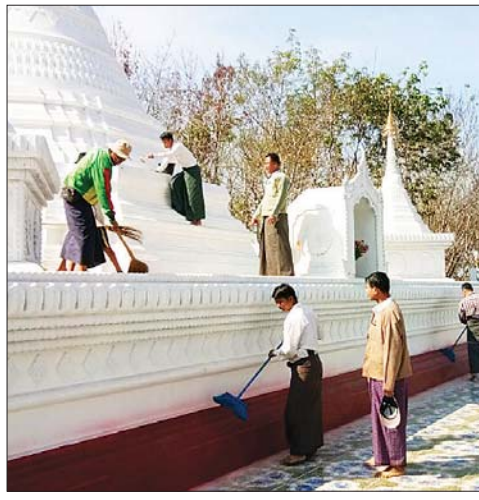
ထိုသို့ စုပေါင်းသန့်ရှင်းရေး ကို ကြာအင်းဆိပ်ကြီး မြို့နယ် အုပ်ချုပ်ရေးမှူးနှင့် ဝန်ထမ်းများ၊ မြန်မာနိုင်ငံ ရတပ်ဖွဲ့ဝင်များ၊ မြို့နယ်စည်ပင်သာယာရေးအဖွဲ့မှ ဝန်ထမ်းများ၊ မီးသတ်တပ်ဖွဲ့ဝင် များ၊ မြို့နယ်ဌာနဆိုင်ရာဝန်ထမ်း များ၊ ရပ်ကွက်/ကျေးရွာအုပ်ချုပ် ရေးမှူးများ ပါဝင်ဆောင်ရွက်ခဲ့ ကြောင်း သိရသည်။ မြို့နယ်(ပြန်/ဆက်)

အတွင်း/အပြင်ရှိ အမှိုက်များ ရှင်းလင်းခြင်းကို ယမန်နေ့နှင့် ယနေ့နံနက်ပိုင်းက ဌာနဆိုင်ရာ ဝန်ထမ်းများ စုပေါင်းဆောင် ရွက်ကြသည်။ (ဝဲပုံ)