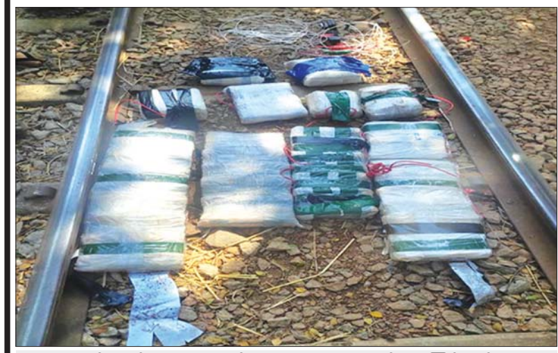
ရတခဲ လွန်ချောင်းတံတားအမှတ်(၄၁) အား PDF အမည်ခံ အကြမ်းဖက်အဖွဲ့က မိုင်းထောင်ထားရှိမှုအား သက်ခံပြုလုပ်ပြီးစီးမှု မှတ်တမ်းဓာတ်ပုံ။

နေပြည်တော် ဇန်နဝါရီ ၂၆ မွန်ပြည်နယ် ကျိုက်ထိုမြို့နယ် စွပုန်းဘူတာနှင့် ကျိုက္ကသာ ဘူတာကြားရှိ ရန်ကုန်- မော်လမြိုင် မီးရထားလမ်းအား PDF အမည်ခံအကြမ်းဖက်သမားများက မိုင်းထောင်ဖောက်ခွဲခဲ့ ကြောင်း သိရှိရသည်။ ဖြစ်စဉ်မှာ ယနေ့မွန်းတည့် ၁၂ နာရီခန့်တွင် ကျိုက်ထို မြို့နယ် စွပုန်းဘူတာနှင့် ကျိုက္ကသာဘူတာကြားရှိ ရန်ကုန်- မော်လမြိုင် မီးရထားလမ်းအား PDF အမည်ခံအကြမ်းဖက် သမားများက မိုင်းထောင်ဖောက်ခွဲခဲ့ကြောင်း သတင်းအရ လုံခြုံရေးတပ်ဖွဲ့ဝင်များက သွားရောက်စစ်ဆေးရာ မိုင်းပေါက် ကွဲမှုကြောင့် ခလွန်ချောင်းတံတားအမှတ်(၄၁)၊ မိုင်တိုင်(၈၈) နေရာ၌ ရထားလမ်းကူး သံပေါင်ဘေလီတံတား အပေါ် မင်းကုန်း(Topcord) တစ်ခုတွင် ၆ လက်မခန့်ပျက်စီးလျက် ရှိသည်ကို တွေ့ရှိရပြီး ရထားဖြတ်သန်းသွားလာနိုင်မှုမရှိ