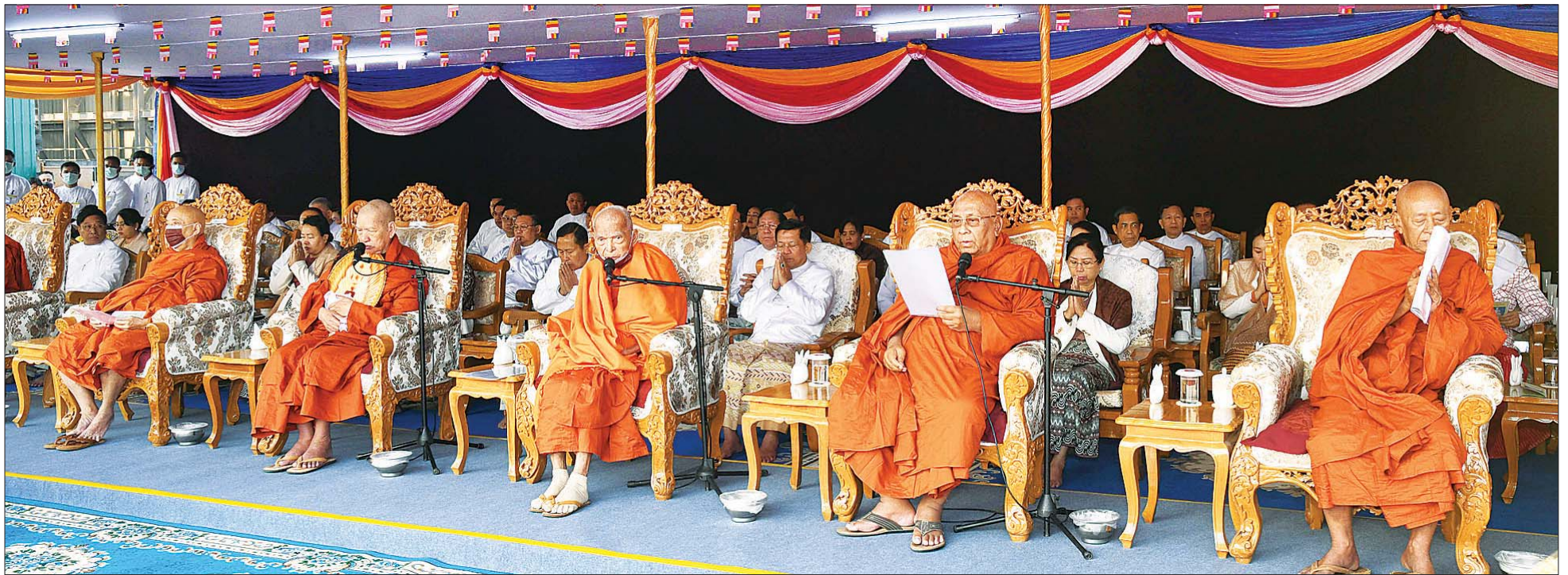
မာရဝိယေ ဗုဒ္ဓရုပ်ပွားတော်မြတ်ကြီးအား ရတနာပလ္လင်တော်ထက်သို့ စတင်ပင့်ဆောင်ပူဇော်ခြင်း မဟာမင်္ဂလာအခမ်းအနားတွင် ဆရာတော်ကြီးများက သမန္တာမှစ၍ မေတ္တာသုတ်၊ အာဇာနည် ယသုတ်၊ ဓဇဂ္ဂသုတ်၊ ပုဗ္ဗဏှသုတ် ပရိတ်တော်များနှင့် ဇယမင်္ဂလာဂါထာတော်များကို ရွတ်ပွားသရဇ္ဈာယ်တော်မူကြစဉ်။