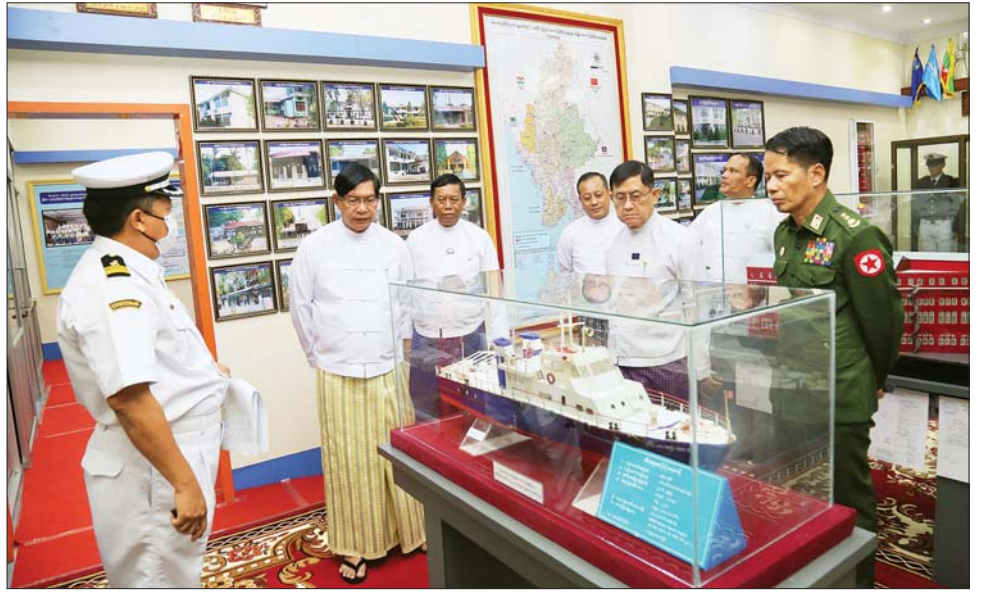
ဌာန ညွှန်ကြားရေးမှူးချုပ်တို့က ဆုများချီးမြှင့် အဖွဲ့သည် အကောက်ခွန် သမိုင်းပြတိုက်သို့ လှည့်လည်ကြည့်ရှုခဲ့ကြောင်း သိရသည်။ (အပေါ်ပုံ) ထို့နောက် ရန်ကုန်တိုင်းဒေသကြီး ဝန်ကြီးချုပ်နှင့် သတင်းစဉ်

ရောင်းချမှုများနှင့် အရာထမ်း၊ အမှုထမ်းများ တက်ရောက်သည်။ အခမ်းအနားတွင် ရန်ကုန်တိုင်းဒေသကြီး ဝန်ကြီးချုပ်၊ ဒုတိယဝန်ကြီးနှင့် အကောက်ခွန်ဦးစီးဌာန ညွှန်ကြားရေးမှူးချုပ်တို့က အဖွင့်အမှာစကား ပြောကြားကြသည်။