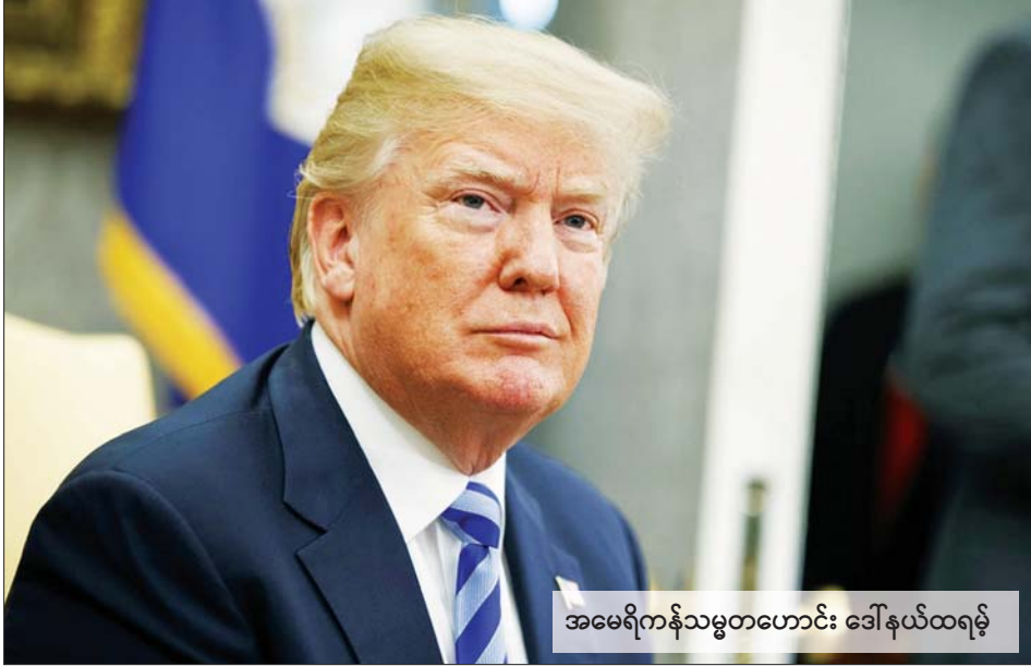
အမေရိကန်သမ္မတဟောင်း ဒေါ်နယ်ထရမ်