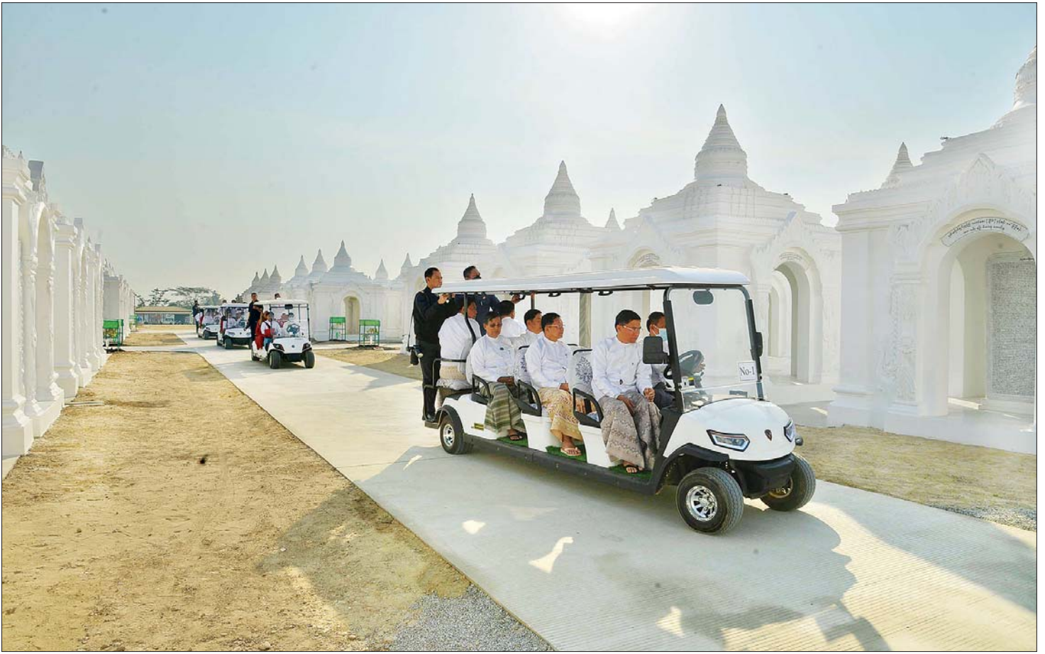
နိုင်ငံတော်စီမံအုပ်ချုပ်ရေးကောင်စီဥက္ကဋ္ဌ နိုင်ငံတော်ဝန်ကြီးချုပ် ဗိုလ်ချုပ်မှူးကြီး မင်းအောင်လှိုင်နှင့် ဆရာတော်ကြီးများ မာရဝိယေဗုဒ္ဓဥယျာဉ်တော်အတွင်း တည်ဆောက်ပြီးစီးမှုအခြေအနေများကို လှည့်လည်ကြည့်ရှုစဉ်။

ထိုကဲ့သို့ ရုပ်ပွားတော်မြတ်ကြီး ထုဆစ်နေသည့် နည်းတူ ဗုဒ္ဓဥယျာဉ်တော်ကြီးအတွင်း သာသနာရေးဆိုင်ရာ အခမ်းအနားကြီးများ ကျင်းပပြုလုပ်နိုင်မည့် သံဃာအပါး ၁၂၀၀ နှင့် လူပရိသတ်များ ဝင်ဆံ့နိုင်သော သာသနာ့ဗိမာန်တော်ကြီး အပါအဝင် အခြားသော သာသနာ့အဆောက်အဦများစွာကိုလည်း ထည့်သွင်းတည်ဆောက်လျက်ရှိကြောင်း၊ ထို့ပြင် ဆရာတော်ကြီးများ၏ စာမျက်နှာ ၅ သို့