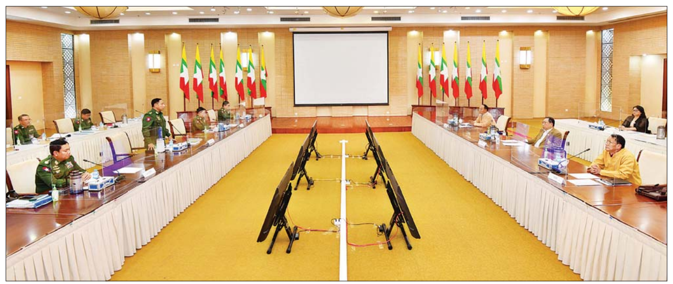
ကြသည်။ တွေ့ဆုံဆွေးနွေးပွဲတွင် သုံးရက် တာ ဆွေးနွေးညှိနှိုင်းချက်များ အရ နှစ်ဖက်သဘောထားတူညီ ပြီး အပြီးသတ်ရရှိလာသည့် သဘောတူညီချက်များကို အတည် ပြု လက်မှတ်ရေးထိုးပြီး အပြန် အလှန် လဲလှယ်ခဲ့ကြသည်။ ယင်းနောက် တက်ရောက် လာကြသည့် သျှမ်းပြည်ပြန်လည် ထူထောင်ရေးကောင်စီ (RCSS) ဥက္ကဋ္ဌ ဗိုလ်ချုပ်ကြီး ယွက်စစ်နှင့် စကားပြောကြားခဲ့ကြပြီး (အပေါ်ပုံ) လက်ဆောင်ပစ္စည်းများ အပြန် အလှန်ပေးအပ်ကာ မှတ်တမ်း တင် ဓာတ်ပုံရိုက်ခဲ့ကြောင်း သိရ ကြီး ရာပြည့်တို့က နိဂုံးချုပ်အမှာ သတင်းစဉ်

တွေ့ဆုံဆွေးနွေးပွဲသို့ နိုင်ငံ တော်စီမံအုပ်ချုပ်ရေး ကောင်စီ အဖွဲ့ဝင်၊ ပြည်ထောင်စုအစိုးရ အဖွဲ့ ရုံးဝန်ကြီးဌာန ပြည်ထောင်စု ဝန်ကြီး၊ အမျိုးသားစည်းလုံး ညီညွတ်ရေးနှင့် ငြိမ်းချမ်းရေး ဖော်ဆောင်မှုညွှန်ကြားရေးကော်မတီ ဥက္ကဋ္ဌ၊ ငြိမ်းချမ်းရေးဆွေးနွေးရေး အဖွဲ့ခေါင်းဆောင် ဒုတိယဗိုလ်ချုပ် ကြီး ရာပြည့်၊ အဖွဲ့ဝင်များဖြစ်ကြ သည့် နိုင်ငံတော်စီမံအုပ်ချုပ်ရေး ကောင်စီအဖွဲ့ဝင် ဒုတိယဗိုလ်ချုပ် ကြီး မိုးမြင့်ထွန်း၊ အမျိုးသား စည်းလုံးညီညွတ်ရေးနှင့် ငြိမ်းချမ်း ရေးဖော်ဆောင်မှု ညွှန်ကြားရေး ကော်မတီ အတွင်းရေးမှူး ဒုတိယ ဗိုလ်ချုပ်ကြီး မင်းနောင်၊ ညွှန်ကြား ရေးကော်မတီ အဖွဲ့ဝင် ဒုတိယ ဗိုလ်ချုပ်ကြီး ဝင်းဗိုလ်ရှိန်နှင့် သျှမ်းပြည်ပြန်လည်ထူထောင်ရေး ကောင်စီ (RCSS) ဥက္ကဋ္ဌ ဗိုလ်ချုပ် ကြီး ယွက်စစ်၊ ဗဟိုအလုပ်အမှု ဆောင် ကော်မတီဝင်များဖြစ်ကြ သည့် စပ်ဆောင်းဟန်၊ စပ်အမ် ခေးနှင့် ငြိမ်းချမ်းရေးဆွေးနွေးရေး ကိုယ်စားလှယ်များ တက်ရောက်