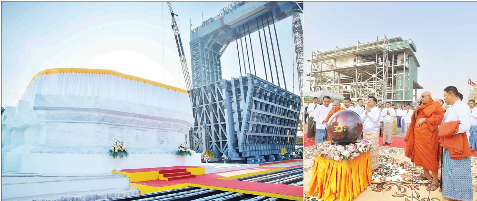
နိုင်ငံတော်စီမံအုပ်ချုပ်ရေးကောင်စီဥက္ကဋ္ဌ နိုင်ငံတော်ဝန်ကြီးချုပ် ဗိုလ်ချုပ်မှူးကြီး မင်းအောင်လှိုင် မာရဝိဇယ ဗုဒ္ဓရုပ်ပွားတော်မြတ်ကြီးအား ရတနာပလ္လင်တော်ထက်သို့ စက်ခလုတ်နှိပ်၍ မင်္ဂလာစက်ယန္တရားများဖြင့် စတင်ပင့်ဆောင်ပူဇော်စဉ်။