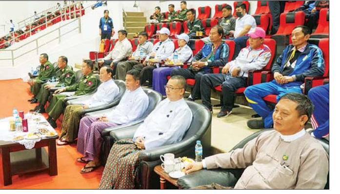
ဗိုလ်ချုပ် နေမျိုးဦး၊ ဗိုလ်မှူးချုပ် လှမိုး၊ တိုင်းဒေသကြီးနှင့် ပြည်နယ် များမှ ကျောင်းသား ကျောင်းသူ အားကစားမောင်မယ်များနှင့် တာဝန်ရှိ သူများ လာရောက်ကြည့်ရှုအားပေးကြသည်။ (အပေါ်ပုံ)