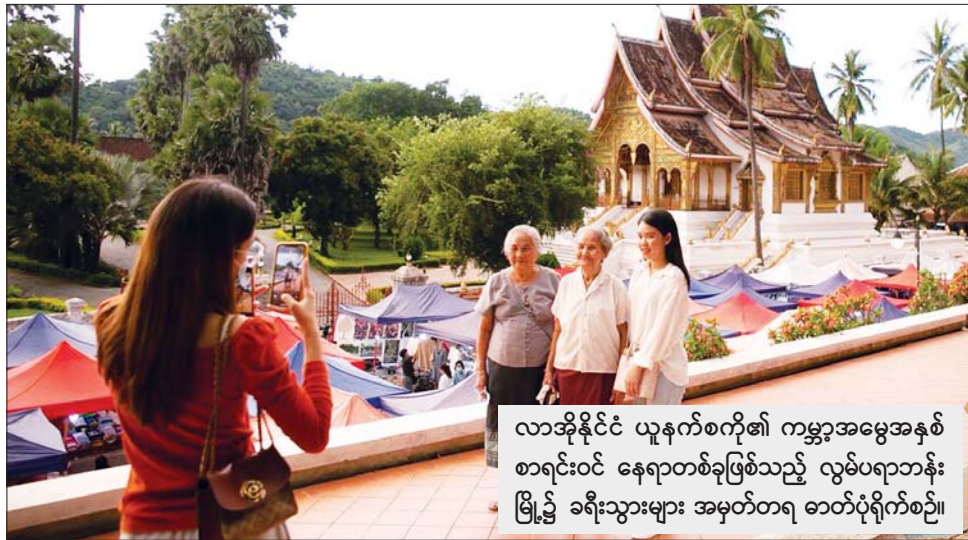
လာအိုနိုင်ငံ ယူနက်စကို၏ ကမ္ဘာ့အမွေအနှစ် စာရင်းဝင် နေရာတစ်ခုဖြစ်သည့် လွမ်ပရာဘာန်း မြို့၌ ခရီးသွားများ အမှတ်တရ ဓာတ်ပုံရိုက်စဉ်။