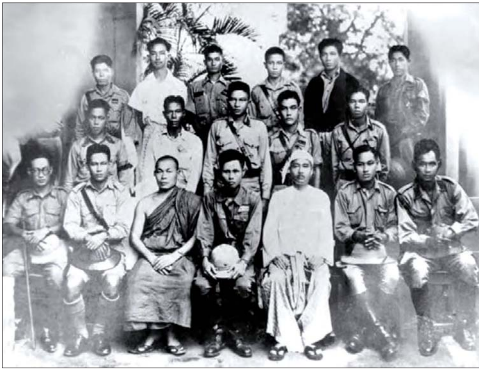
ဗိုလ်ချုပ်အောင်ဆန်းနှင့် ရဲဘော်သုံးကျိပ်ဝင်အချို့ကို တွေ့ရစဉ်။

မြန်မာနိုင်ငံကို တစ်စီတီပြုကြွအောင် သွေးထိုး ပင်လုံမြေတွင် အခြေတည်၍ စုစည်းညီညွတ် ခဲ့သောတိုင်းရင်းသားအချို့သည် လွတ်လပ်ရေး ရသည့်အခါတွင်မူ ဒေသစွဲ၊ လူမျိုးစွဲ၊ ဝါဒစွဲတို့ကြောင့် အချင်းချင်းကြား သံသယဝင်လာခဲ့ကြသည်။ တစ်ဖက်တွင်လည်း နယ်ချဲ့ဗြိတိသျှတို့က မစားရ သည့်အမဲ သဲနှင့်ပက်သည့်အလား အိန္ဒိယနှင့် ပါကစ္စတန်ကို နှစ်ပိုင်းကွဲအောင်လုပ်ခဲ့သည့် နည်းတူ လွတ်လပ်စ မြန်မာနိုင်ငံကိုလည်း