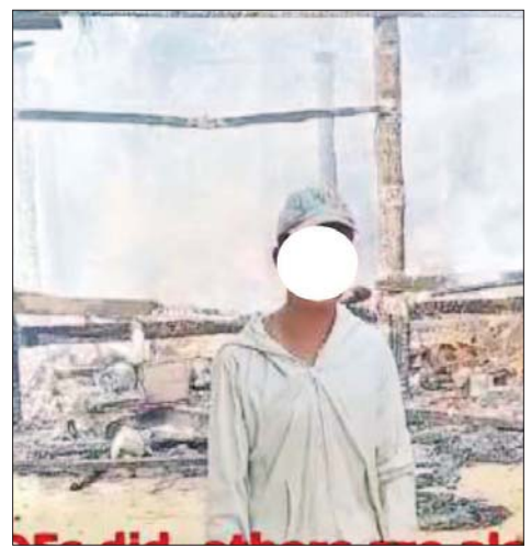
ကချင်စု၊ မိုးတားကြီးကျေးရွာမှ ရွာသားတစ်ဦးက မျက်မြင်ကြုံတွေ့ခဲ့ရသည်များကို ရင်ဖွင့်ပြောကြားစဉ်။