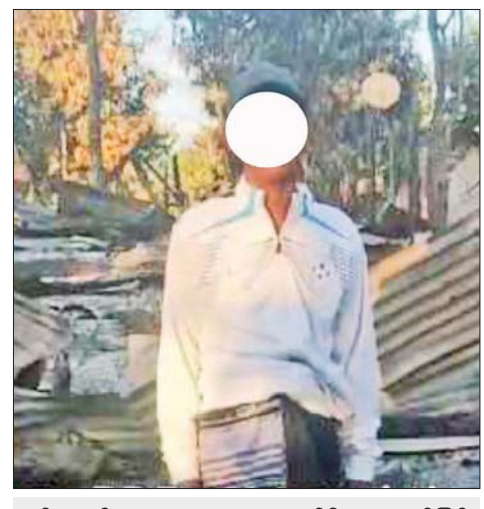
မင်းလယ်ကျေးရွာမှ ရွာသားတစ်ဦးက မျက်မြင်ကြုံတွေ့ခဲ့ရသည်များကို ရင်ဖွင့်ပြောကြားစဉ်။

မီးရှို့သွားတာက PDF တွေရှိသွားတာ။ တခြားအဖွဲ့တွေလည်း ပါပါတယ်။ ဝတ်ထားတာကတော့ ပြောက်ကျားတွေပါတယ်။ တချို့အရပ်ဝတ်တွေလည်း ပါပါတယ်။ ကျွန်တော်ကမိသားစုမရှိပါဘူး။ တစ်ကောင်ကြွက်ပါ။ စာရင်းငှားလာလုပ်တာပါ” ဟု မိုးတားကြီးကျေးရွာမှ ရွာသားတစ်ဦးက ပြောသည်။