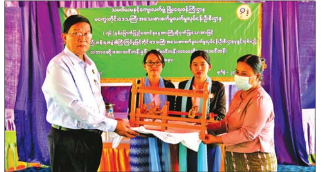
များနှင့် မိမိတို့ကိုယ်ရည်ကိုယ်သွေး အကြံဉာဏ်များအား ပေါင်းစပ်ကာ အလုပ်အကိုင် အခွင့်အလမ်းများ ရှာဖွေဖော်ထုတ်မည်ဖြစ်ကြောင်း သိရသည်။

အဆိုပါ သင်တန်းတွင် ရက်ကန်းပညာရပ်များ ကျွမ်းကျင်သည့် သင်တန်းကျောင်းမှူးမှ ဆရာမများ ကိုယ်တိုင်ဘာသာရပ် ခုနစ်ခုကို စာတွေ့လက်တွေ့ သင်ကြားပြသမည်ဖြစ်ပြီး သင်တန်းဆင်းပြီး ပခုက္ကူ ရက်ကန်းနှင့် သက်မွေးပညာသင်တန်းကျောင်းရှိ စက်ရက်ကန်းများနှင့် လွန်းမဲစက်ရက်ကန်းများကို လေ့လာသင်ကြားမည်ဖြစ်ကြောင်း၊ သင်တန်းသူများအနေဖြင့် သင်တန်းမှ သင်ကြားပို့ချပေးသည့်နည်းပညာ