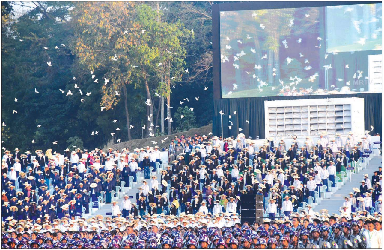
(၇၅) နှစ်မြောက် စိန်ရတုလွတ်လပ်ရေးနေ့ကို ဂုဏ်ပြုသည့်အနေဖြင့် ငြိမ်းချမ်းရေးချိုးဖြူငှက် ၇၅၀ ကို လွှတ်ကြစဉ်။

နိုင်ငံတော်တွင် အရေးကြီးတိုင်း နိုင်ငံ့အန္တရာယ် ရန်စွယ်မှန်သမျှ မဆိုင်းမတွ ကာကွယ်ရသည်မှာ တပ်မတော်ပင်ဖြစ်လေသည်။ ၁၉၅၈ ခုနှစ်တွင် ထိုစဉ်က အုပ်ချုပ်ခဲ့သော အစိုးရအတွင်း စိတ်သဘောထား ကွဲလွဲမှုများ၊ မညီညွတ်မှုများကြောင့် တပ်မတော်သည် တာဝန်အရ အိမ်စောင့်အစိုးရအဖြစ် ဆောင်ရွက်ပေးခဲ့ရသည်။ ၁၉၆၂ ခုနှစ်တွင် လည်း နိုင်ငံတော်၏ အခြေအနေအရပ်ရပ် ယိုယွင်းလာသည့်အပြင် တိုင်းပြည်ပြိုကွဲမည့် အရိပ်အငွေ့များဖြစ်ပေါ်လာသဖြင့် တပ်မတော်က အချိန်မီ နိုင်ငံတော် အာဏာသိမ်းကာ တိုင်းပြည်ကို ကယ်တင်ခဲ့ရသည်။ ၁၉၈၈ ခုနှစ်တွင် မြေပေါ်မြေအောက် အဖျက်သမားများနှင့် ပြည်တွင်း ပြည်ပမှ တိုင်းပြည်ပြိုကွဲပျက်စီးစေလိုသူများ၏ သွေးထိုးလှုံ့ဆော်မှု၊ လုပ်ကြံဝါဒဖြန့်မှုများကြောင့် မင်းမဲ့စရိုက်များလွှမ်းမိုးလာကာ ပြည်သူ လူထု၏ အသက်အိုးအိမ်စည်းစိမ်ကို ထိခိုက်လာစေသဖြင့် တပ်မတော်ကပင် နိုင်ငံတော်အာဏာကို သိမ်းယူကာ တိုင်းပြည်ကို ကယ်တင်ခဲ့