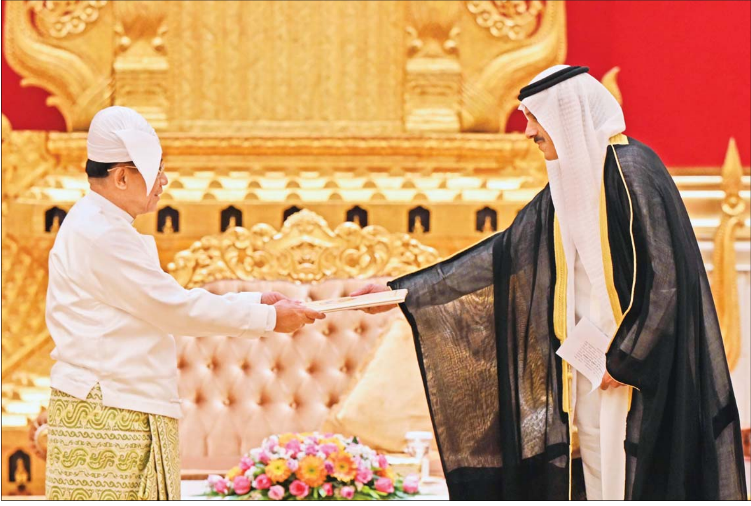
နိုင်ငံတော်စီမံအုပ်ချုပ်ရေးကောင်စီဥက္ကဋ္ဌ နိုင်ငံတော်ဝန်ကြီးချုပ် ဗိုလ်ချုပ်မှူးကြီး မင်းအောင်လှိုင် ထံ မြန်မာနိုင်ငံဆိုင်ရာ ကူဝိတ်နိုင်ငံ သံအမတ်ကြီးအဖြစ် ခန့်အပ်ရန် သဘောတူညီပြီးဖြစ်သော သံအမတ်ကြီး H.E. Mr. Mubarak M A Aladwani က ၎င်း၏ သံအမတ်ခန့်အပ်လွှာကို ပေးအပ်စဉ်။

နေပြည်တော် ဇန်နဝါရီ ၂၄ နိုင်ငံတော်စီမံအုပ်ချုပ်ရေးကောင်စီ ဥက္ကဋ္ဌ နိုင်ငံတော်ဝန်ကြီးချုပ် ဗိုလ်ချုပ်မှူးကြီး မင်းအောင်လှိုင် ထံ မြန်မာနိုင်ငံဆိုင်ရာ ကူဝိတ်နိုင်ငံ သံအမတ်ကြီးအဖြစ် ခန့်အပ်ရန် သဘောတူညီပြီး ဖြစ်သော သံအမတ်ကြီး H.E. Mr. Mubarak M A Aladwani သည် ယနေ့နံနက် ၁၀ နာရီတွင် နေပြည်တော်ရှိ နိုင်ငံတော်စီမံအုပ်ချုပ်ရေးကောင်စီ ဥက္ကဋ္ဌရုံး သံတမန်ဆောင်ဧည့်ခန်းမ၌ ၎င်း၏ သံအမတ်ခန့်အပ်လွှာကို ပေးအပ်သည်။ ရင်းရင်းနှီးနှီး ဆွေးနွေး ထို့နောက် နှစ်နိုင်ငံ သံတမန်ဆက်ဆံရေးတိုးမြှင့်ရေးနှင့် ချစ်ကြည်ရင်းနှီးမှုဆိုင်ရာ ကိစ္စရပ်များ၊ ချစ်ကြည်ရေးခရီးစဉ်များ အပြန်အလှန်လည်ပတ်ရေးဆိုင်ရာ ကိစ္စရပ်များ၊ ကုန်သွယ်မှုမြှင့်တင်ဆောင်ရွက်ရေးဆိုင်ရာ စာမျက်နှာ ၃ ကော်လံ ၁