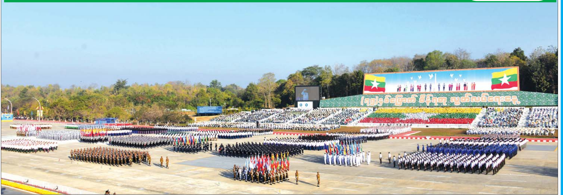
(၇၅) နှစ်မြောက် စိန်ရတုလွတ်လပ်ရေးနေ့ အခမ်းအနား၌ ချီတက်အလေးပြုကြသည့် ဂုဏ်ပြုစစ်ကြောင်းများကို တွေ့ရစဉ်။

“ငါတို့သည် တမျိုးတဘာသာ တစိတ်တဒေသ၏ ကောင်းကျိုးချမ်းသာကို မလိုလား၊ ကျောသား ရင်သား သူကား ငါကား ခွဲခြားခြင်းကို အလိုမရှိ မြစ်ချောင်းသီတာ သမုဒ္ဒရာတောင်တန်းတို့ဖြင့် ကမ္ဘာ့ဓမ္မတာ သဘာဝ အပိုင်းအခြား ထင်ရှားစွာ သတ်မှတ်အပ်သော ရာဇဝင်ရှည်ဝေး ရှေးပဝေဏီမှစ၍ ယခုထက်တိုင် မြန်မာနိုင်ငံသားဟု သမုတ်အပ်သူ တိုင်းရင်းသား အပေါင်းတို့ ဇာတိချက်ကြွေနေထိုင်ကြရာ မြန်မာနိုင်ငံတော်တစ်ဝှမ်းကို တသွေးတသားတည်းဟူသော ကြိုးထူး တစ်စိတ်တစ်ဝမ်းတည်းဟူသော ကြိုးထူး အလိုအလျောက် သဘာဝ အထောက်အပံ့ဖြင့်သာလျှင် ဖြစ်ပေါ်အပ်သော၊ စေတနာတည်းဟူသော ကြိုးထူး ဤကြိုး သုံးပါးဖြင့် ကမ္ဘာဆုံးတိုင် မြေခိုင်တည်တံ့အောင် ရစ်ပတ်ဖွဲ့စည်းအပ်သော ပြည်ထောင်စုအဖြစ်ကို လက်ဆုပ်လက်ကိုင် ငါတို့အပိုင်ရလေပြီ” (လွတ်လပ်ရေး ကြေညာစာတမ်းမှ ကောက်နုတ်ဖော်ပြချက်။) အထက်ပါကြွေးကြော်သံမှာ မြန်မာပြည်ဖွား တိုင်းရင်းသားအားလုံး ၏ ကြွေးကြော်သံအမှန်ပင် ဖြစ်ပေသည်။ ကောက်ကျစ် နယ်ချဲ့ ကျူးကျော်ခဲ့၍ တကယ့်မှန်ကင်း လောင်စာထင်းပမာ ပျက်ယွင်းကြေမှု ကျွန်ဘဝ ဝယ် နိမ့်ကျညှိုးငယ်ခဲ့ရသော မြန်မာပြည်ဖွား တိုင်းရင်းသား အားလုံး၏ အထွတ်အမြတ်သွေးတို့ဖြင့် လွတ်လပ်ရေးကို အရယူနိုင်ခဲ့ သည် မဟုတ်ပါလော။