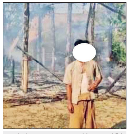
နောင်ပင်ကျေးရွာမှ ရွာသားတစ်ဦးက မျက်မြင်ကြုံတွေ့ခဲ့ရသည်များကို ရင်ဖွင့်ပြောကြားစဉ်။