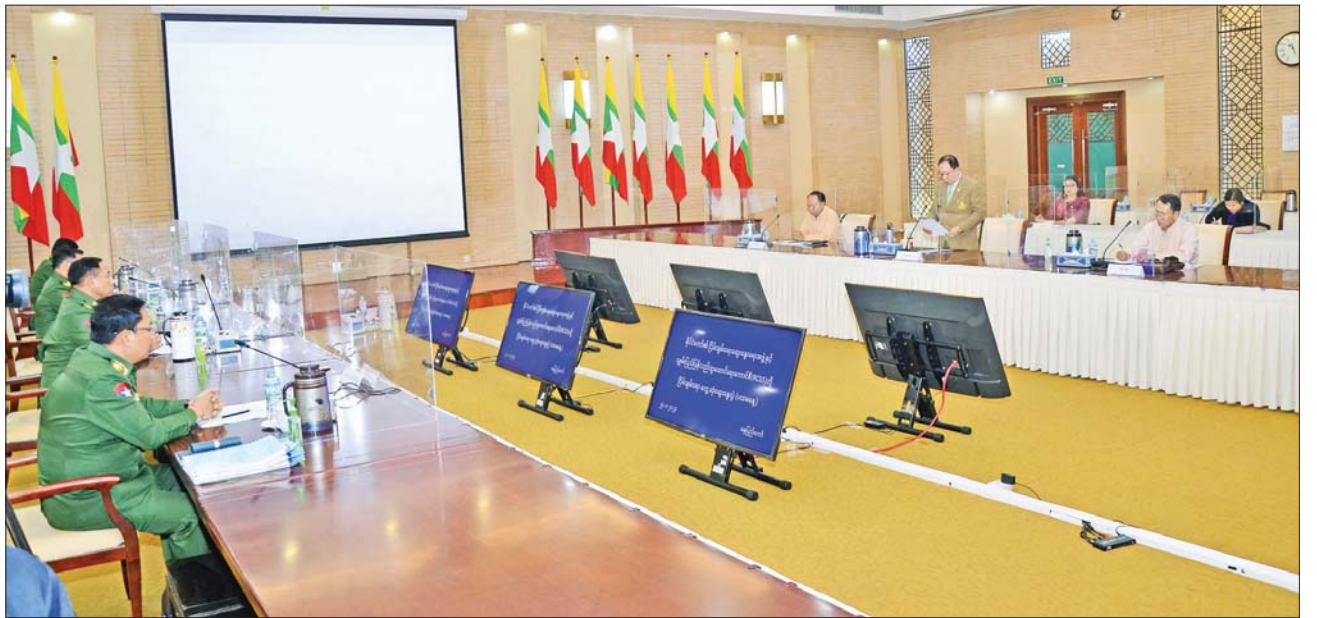
နိုင်ငံတော်၏ ငြိမ်းချမ်းရေးဆွေးနွေးရေးအဖွဲ့နှင့် သျှမ်းပြည်ပြန်လည်ထူထောင်ရေးကောင်စီ (RCSS) မှ ငြိမ်းချမ်းရေးကိုယ်စားလှယ်အဖွဲ့တို့ တွေ့ဆုံဆွေးနွေးပွဲ

တွေ့ဆုံဆွေးနွေးပွဲသို့ နိုင်ငံတော်စီမံအုပ်ချုပ်ရေးကောင်စီအဖွဲ့ဝင်၊ ပြည်ထောင်စုအစိုးရအဖွဲ့ရုံးဝန်ကြီးဌာန ပြည်ထောင်စုဝန်ကြီး၊ အမျိုးသားစည်းလုံးညီညွတ်ရေးနှင့် ငြိမ်းချမ်းရေးဖော်ဆောင်မှုဦးစီးဌာနမှ ဦးစီးဦးဆောင်သော အဖွဲ့ဝင်များနှင့် ဦးစီးဌာနမှ အဖွဲ့ဝင်များ တက်ရောက်လာသည့် သျှမ်းပြည်ပြန်လည်ထူထောင်ရေးကောင်စီ (RCSS) ဥက္ကဋ္ဌ ဗိုလ်ချုပ်ကြီး ယွက်စစ်နှင့် အဖွဲ့အား ရင်းနှီးနှီးနှီး ကြိုဆိုနှုတ်ဆက်သည်။ ထို့နောက် တွေ့ဆုံဆွေးနွေးပွဲတွင် ဆွေးနွေးမည့် အစီအစဉ်၊ အကြောင်းအရာများကို နှစ်ဖက် ရင်းနှီးပွင့်လင်းစွာ ဆွေးနွေးညှိနှိုင်းကြပြီး နှစ်ဖက်ညှိနှိုင်းရရှိသည့် ဆွေးနွေးပွဲအစီအစဉ်များအတိုင်း တွေ့ဆုံဆွေးနွေးပွဲကို ဆက်လက်ကျင်းပပြုလုပ်သည်။