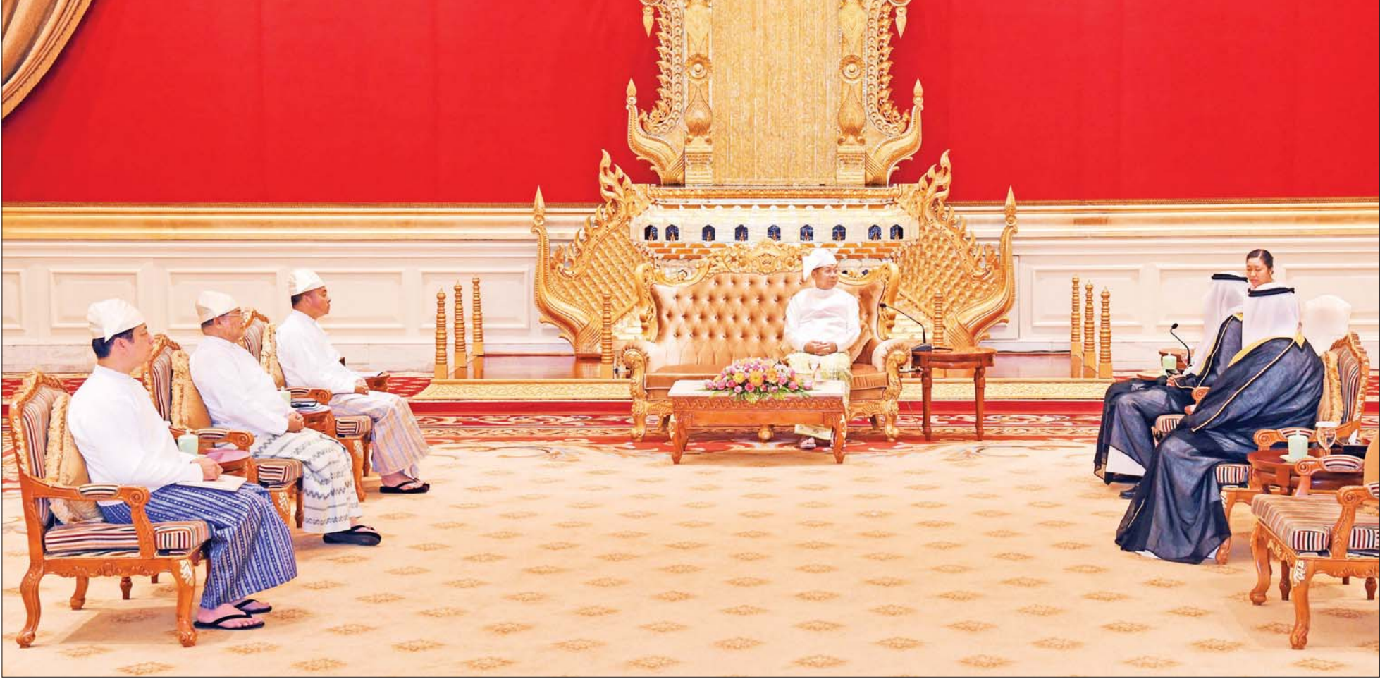
နိုင်ငံတော်စီမံအုပ်ချုပ်ရေးကောင်စီဥက္ကဋ္ဌ နိုင်ငံတော်ဝန်ကြီးချုပ် ဗိုလ်ချုပ်မှူးကြီး မင်းအောင်လှိုင် မြန်မာနိုင်ငံဆိုင်ရာ ကူဝိတ်နိုင်ငံ သံအမတ်ကြီး H.E. Mr. Mubarak M A Aladwani အား လက်ခံတွေ့ဆုံစဉ်။