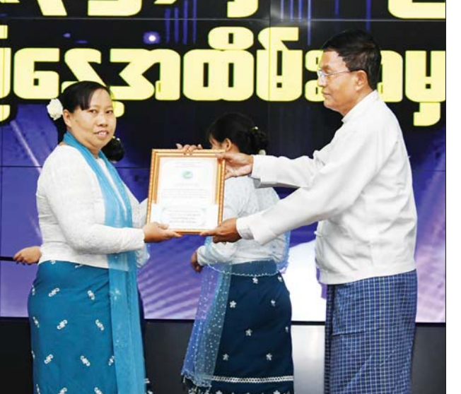
ဒုတိယဝန်ကြီး ဦးရဲတင့် ခရိုင်အဆင့် သတင်းလွှင့်တင်ဖော်ပြခံရမှု ပထမဆုရရှိသည့် ခရိုင်ရုံးအား ဆုပေးအပ်ချီးမြှင့်စဉ်။

ပြန်ကြားရေးဝန်ကြီးဌာန၏ လုပ်ငန်းတာဝန်များသည် စည်းလုံးညီညွတ်မှုဖြင့် ဆောင်ရွက်ရပါကြောင်း၊ ဆက်လက်၍လည်း ဝန်ထမ်းများက စည်းလုံးညီညွတ်မှုရှိရှိဖြင့် လုပ်ကိုင်ဆောင်ရွက်သွားရမည်ဖြစ်ကြောင်း၊ လုပ်ငန်းတာဝန်များ ထမ်းဆောင်ရာတွင် အခက်အခဲ တွေ့ကြုံနိုင်ကြောင်း၊ ထိုအခက်အခဲများကို စည်းလုံးညီညွတ်မှု၊ စွမ်းဆောင်ရည်ရှိမှု တို့ဖြင့် ကျော်လွှားကာ မိမိတို့ဆောင်ရွက်နေသည့် မီဒီယာအခန်းကဏ္ဍကို ပြည်သူ့အတွက် အကျိုးရှိစွာ အသုံးပြုတတ်စေရန် ကြိုးပမ်းဆောင်ရွက်သွားရမည် ဖြစ်