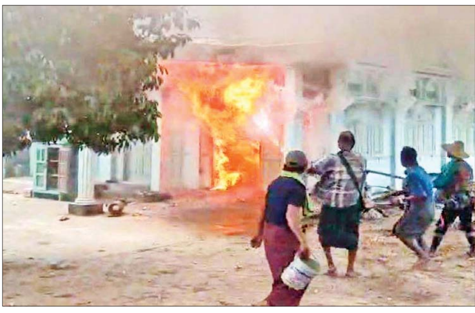
စစ်ကိုင်းတိုင်းဒေသကြီးရှိ မီးရှို့ခံရသည့်နေအိမ်များအား လုံခြုံရေးတပ်ဖွဲ့ဝင်များ၊ မီးသတ်တပ်ဖွဲ့ဝင်များနှင့် ကျေးရွာပြည်သူလူထုများ ပူးပေါင်း၍ မီးငြိမ်းသတ်နေစဉ်။