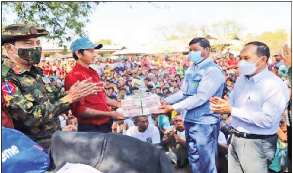
စစ်ကိုင်းတိုင်းဒေသကြီးတွင် နေအိမ်မီးရှို့ခံရသည့်ပြည်သူများအား အစိုးရတာဝန်ရှိသူများနှင့် လုံခြုံရေး တပ်ဖွဲ့ဝင်များက စားသောက်ဖွယ်ရာများ ထောက်ပံ့ပေးအပ်စဉ်။

နိုင်ငံတော်စီမံအုပ်ချုပ်ရေးကောင်စီ သတင်းထုတ်ပြန်ရေးအဖွဲ့