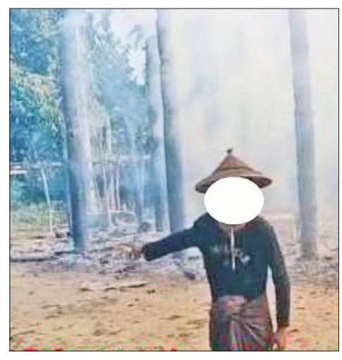
ဆူးပုတ်ကုန်းကျေးရွာမှ ရွာသားတစ်ဦးက မျက်မြင်ကြုံတွေ့ခဲ့ရသည်များကို ရင်ဖွင့်ပြောကြားစဉ်။