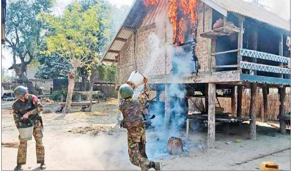
စစ်ကိုင်းတိုင်းဒေသကြီးရှိ မီးရှို့ခံရသည့်နေအိမ်များအား လုံခြုံရေးတပ်ဖွဲ့ဝင်များ၊ မီးသတ်တပ်ဖွဲ့ဝင်များနှင့် ကျေးရွာပြည်သူလူထုများပူးပေါင်း၍ မီးငြိမ်းသတ်ပေးစဉ်။