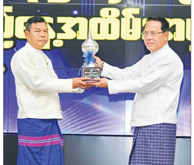
ပြည်ထောင်စုဝန်ကြီး ဦးမောင်မောင်အုန်း ခရိုင်အဆင့် လုပ်ငန်းစွမ်းဆောင်ရည် ဒုတိယဆုရရှိသည့် ဘားအံခရိုင်ရုံးအား ဆုပေးအပ်ချီးမြှင့်စဉ်။

ကြောင်း ပြောကြားသည်။ ထို့နောက် အမြဲတမ်းအတွင်းဝန်နှင့် ဌာနဆိုင်ရာအကြီးအကဲများက သတင်းပိုင်းဆိုင်ရာ၊ ဓာတ်ပုံပိုင်းဆိုင်ရာ၊ စီမံခန့်ခွဲမှုပိုင်းဆိုင်ရာနှင့် ကဏ္ဍအလိုက် ထူးချွန်ဆုရရှိကြသည့် မြို့နယ်များနှင့် ဝန်ထမ်းများအား ဆုများပေးအပ်ချီးမြှင့်သည်။ ယင်းနောက် ဒုတိယဝန်ကြီးဦးရဲတင့်က ခရိုင်အဆင့် သတင်းလွှင့်တင်ဖော်ပြခံရမှု ပထမ၊ ဒုတိယ၊ တတိယနှင့် အထူးဆုရရှိကြသည့် ခရိုင်ရုံးများကို ဆုများ ပေးအပ်ချီးမြှင့်သည်။ ဆက်လက်၍ ပြည်ထောင်စုဝန်ကြီး ဦးမောင်မောင်အုန်းက မြို့နယ်အဆင့် လုပ်ငန်းစွမ်းဆောင်ရည်ပထမဆုရရှိသည့် နတ်မောက်မြို့နယ်ရုံး၊ ဒုတိယဆုရရှိသည့် တောင်ငူဥက္ကလာပမြို့နယ် ရုံး၊ တတိယဆုရရှိသည့် တောင်သာမြို့နယ်ရုံး၊ အထူးဆုများ ရရှိသည့် ကျိုက်တုံမြို့နယ်ရုံး၊ သီပေါမြို့နယ်ရုံး၊ လှိုင်ဘွဲ့မြို့နယ်ရုံး၊ ဒေးဒရ်မြို့နယ် ရုံးနှင့် ကျွန်းလှမြို့နယ်ရုံးတို့ကို လည်းကောင်း၊ ခရိုင်အဆင့် လုပ်ငန်းစွမ်းဆောင်ရည် ပထမဆုရရှိသည့် လားရှိုးခရိုင်ရုံး၊ ဒုတိယဆု ရရှိသည့် ဘားအံခရိုင်ရုံးနှင့် တတိယဆုရရှိသည့် ကျောက်ဆည်ခရိုင်ရုံးတို့ကို လည်းကောင်း၊ တိုင်းဒေသကြီး/ပြည်နယ်အဆင့် လုပ်ငန်းစွမ်းဆောင်ရည် ထူးချွန်ဆု ရရှိသည့် ရန်ကုန်တိုင်းဒေသကြီး ရုံးကို လည်းကောင်း ဆုများ ပေးအပ်ချီးမြှင့်သည်။ ထို့နောက် ဆုရရှိသူများကိုယ်စား အရာထမ်း တစ်ဦးက ကျေးဇူးတင်စကား ပြောကြားသည်။ ယင်းနောက် ပြန်ကြားရေးနှင့် ပြည်သူ့ဆက်ဆံရေးဦးစီးဌာန၏ လုပ်ငန်းဆောင်ရွက်မှု မှတ်တမ်းဗီဒီယိုကိုပြသပြီး အခမ်းအနားကို ရုပ်သိမ်းလိုက်သည်။ သတင်းစဉ်