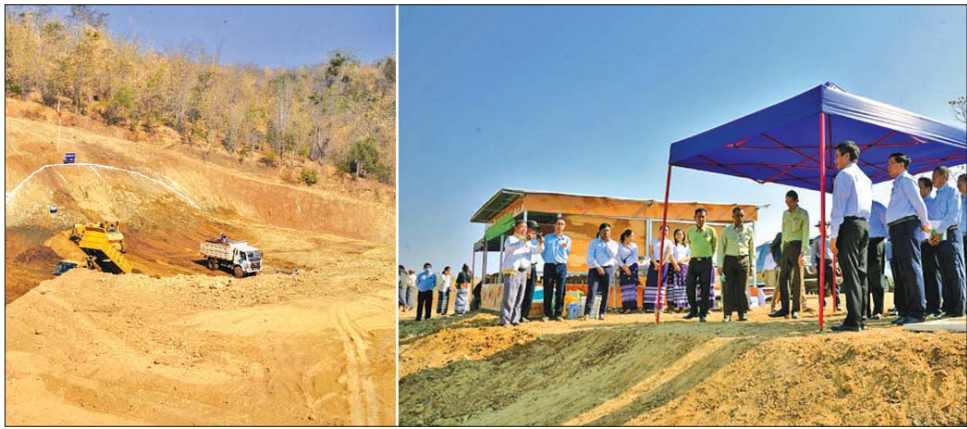
တိုင်းဒေသကြီးဝန်ကြီးချုပ် မင်းလှမြို့နယ် ရေနံမကျေးရွာ လျှို့ဝှက်တံတံ တည်ဆောက်ခြင်းလုပ်ငန်းခွင် ကြည့်ရှုစစ်ဆေးစဉ်။

ကို ဆောင်ရွက်လျက်ရှိကြောင်းနှင့် လျှို့ဝှက်တံတံ တည်ဆောက်ခြင်းလုပ်ငန်းဆိုင်ရာများအား ရှင်းလင်း တင်ပြခဲ့ပြီး၊ လျှို့ဝှက်တံတံ တည်ဆောက်ခြင်းလုပ်ငန်း ဆောင်ရွက်နေမှုကိုကြည့်ရှုစစ်ဆေးကာ တိုင်းဒေသကြီး ဝန်ကြီးချုပ်က လုပ်ငန်းဆောင်ရွက်မှုများနှင့် ပတ်သက်၍ လိုအပ်သည်များ မှာကြားသည်။ အဆိုပါ လျှို့ဝှက်တံတံတည်ဆောက်ခြင်းလုပ်ငန်း ကို ၂၀၂၂-၂၀၂၃ ဘဏ္ဍာနှစ်တွင် တိုင်းဒေသကြီး ခွင့်ပြုရန်ပုံငွေ ၂၆၂ သန်းဖြင့် တံဆံအလျားပေ ၂၀၀၊ အမြင့် ၄၅ ပေနှင့် ကန်ရေပြည့် ရေလှောင်ပမာဏ ၁၃ ဒသမ ၅၀ ဂါလန်သန်းဖြင့် တည်ဆောက်ခြင်း လုပ်ငန်းကို ၄-၂၂-၂၀၂၂ ရက်တွင် စတင်ဆောင်ရွက် ခဲ့ခြင်းဖြစ်ပြီး၊ ယခုအခါ လုပ်ငန်းတစ်ခုလုံးအနေဖြင့် ၅၀ ရာခိုင်နှုန်း ဆောင်ရွက်ပြီးစီးပြီဖြစ်ကြောင်းနှင့်