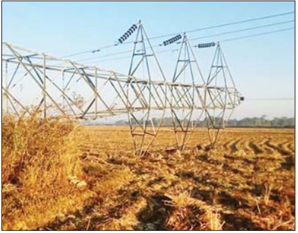
ပြည်တွင်းသတင်း ၈၁

NUG လက်ဝေခံ PDF အမည်ခံ အကြမ်းဖက်သမားများက ၁၃၂ ကေဗီ ဘီလူးချောင်း (၂) - တီကျစ် နှစ်ထပ်ဓာတ်အားလိုင်း တာဝါတိုင် (၁) တိုင်အား ဖောက်ခွဲဖျက်ဆီးမှု အခြေအနေအား သတင်းထုတ်ပြန်ခြင်း