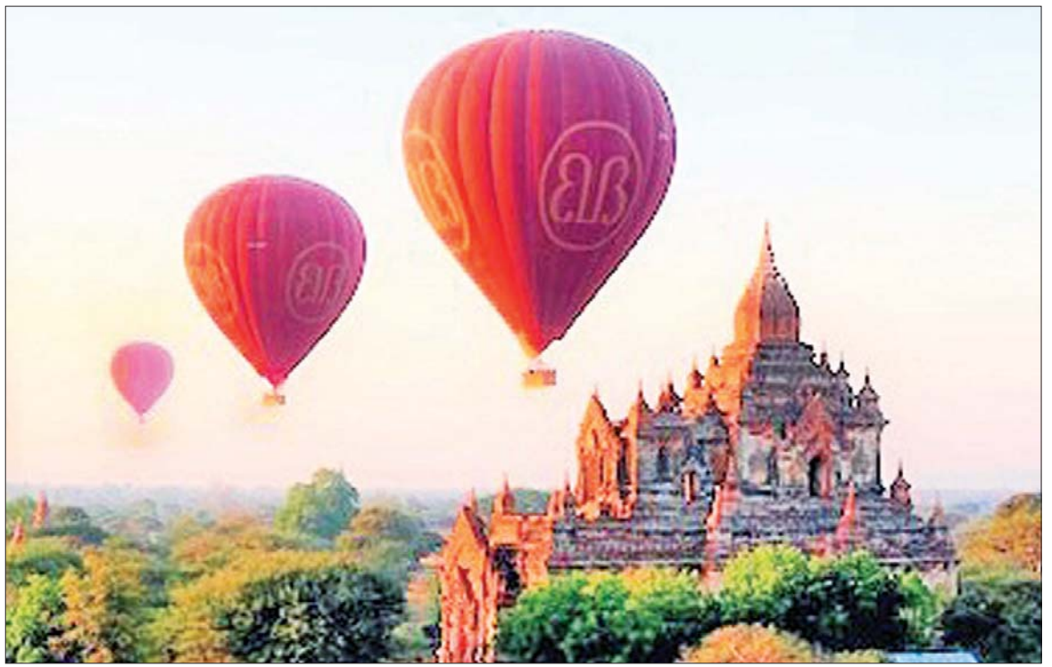
ပုဂံဒေသ၏အလှကို မိုးပျံဘောလုံးစီးနင်း၍ ပြည်တွင်း ပြည်ပ ခရီးသွားများ ကြည့်ရှုခံစားကြစဉ်။

“ဒီနှစ်ဟာအခြားနှစ်တွေနဲ့ မတူတာ က ပုဂံမှာဆောင်းတွင်းအလှဟာ ထူးထူး ခြားခြားကို လှပနေတဲ့အတွက် ခရီးသွား ဝင်ရောက်မှုများတာလည်း ပါပါတယ်။ နံနက်ခင်းအလှနဲ့ ဆည်းဆာအလှကို ကြည့်ဖို့ဆိုရင် တောင်ကုန်းနှစ်ခုကပ် ကြည့်လို့ရတဲ့အတွက် ဒီနှစ်မှာ ခရီးသွား များတာကြောင့် ကြိုတင်နေရာယူပြီးမှသာ ကြည့်ရတဲ့အထိ လူများပါတယ်။ ပုဂံရဲ့ အလှကို အလုံးစုံကြည့်ရင်း သဘာဝ အေးမြမှုကို ခံစားလိုကြတဲ့ ခရီးသွားတွေ ကတော့ မိုးပျံဘောလုံးစီးတာများတယ်။ မိုးပျံဘောလုံးစီးလုံးကို လူ ၁၆ ဦးစီးလို့ ရတဲ့ ဘောလုံးနှစ်လုံး နေ့စဉ်နံနက်ပိုင်းမှာ