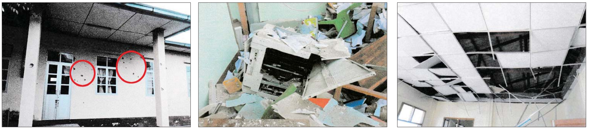
အကြမ်းဖက်အဖွဲ့အစည်းများ၏ မိုင်းထောင်ဖောက်ခွဲ၊ မီးရှို့ဖျက်ဆီးခြင်းများကြောင့် တိုင်းဒေသကြီးနှင့် ပြည်နယ်အသီးသီးရှိ ရွေးကောက်ပွဲကော်မရှင်အဖွဲ့ခွဲရုံးများ၏ ပျက်စီးဆုံးရှုံးမှုမှတ်တမ်းဓာတ်ပုံ။

အကြမ်းဖက်အဖွဲ့များအနေဖြင့် ဌာနဆိုင်ရာရုံးများအား ယခုကဲ့သို့ မိုင်းထောင်ဖောက်ခွဲခြင်း၊ လက်နက်ကြီး၊ လက်နက်ငယ်များဖြင့် ပစ်ခတ်ဖျက်ဆီးခြင်းနှင့် မီးရှို့ဖျက်ဆီးခြင်းများလုပ်ဆောင်နေမှုအပေါ် ပြည်သူလူထု တစ်ရပ်လုံးအနေဖြင့် နိုင်ငံတော်ဖွံ့ဖြိုးတိုးတက်ရေးနှင့် တည်ငြိမ်အေးချမ်းရေးအတွက် ပူးပေါင်းကာကွယ်သွားကြပါရန်နှင့် အကြမ်းဖက်သမားများ၏ လှုပ်ရှားမှုသတင်းများကို ရရှိပါက နီးစပ်ရာလုံခြုံရေးတပ်ဖွဲ့ဝင်များထံသို့ လျှို့ဝှက်စွာ ဆက်သွယ်သတင်းပေးပို့၍ အကြမ်းဖက်သမားများ ရပ်တည်မှုမရှိနိုင်သည့်အထိ ဝိုင်းဝန်းပူးပေါင်းဆောင်ရွက်သွားကြပါရန် မေတ္တာရပ်ခံ သတင်းထုတ်ပြန်အပ်ပါသည်။ သတင်းစဉ်