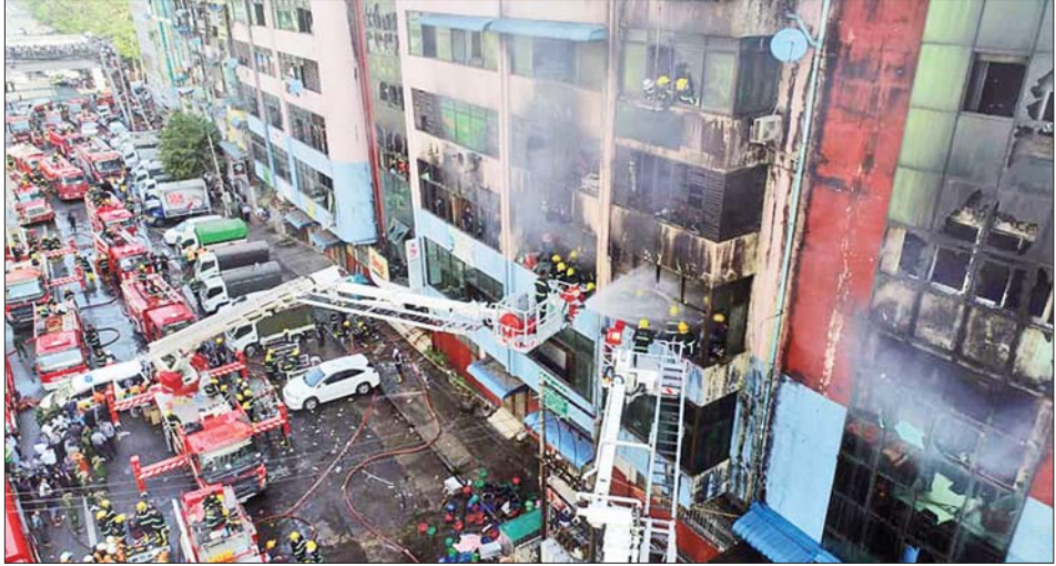
၂၀၂၀ ပြည့်နှစ်က သီချေးမီးလောင်မှုတွင် မီးငြိမ်းသတ်ရေးနှင့် ရှာဖွေကယ်ဆယ်ရေးလုပ်ငန်းများကို တစ်ပြိုင်တည်းဆောင်ရွက်စဉ်။

ပြည်သူ့လူထုအား မီးဘေးအပါအဝင် သဘာဝ ဘေးအန္တရာယ်များ ကျရောက်သည့်အခါ အရေးပေါ် ရှာဖွေကယ်ဆယ်ရေးလုပ်ငန်းများကို တာဝန်ယူ ဆောင်ရွက်ရန် ရည်ရွယ်ကာ မြန်မာနိုင်ငံ မီးသတ် တပ်ဖွဲ့ကို ဖွဲ့စည်းထားရာ မီးသတ်တပ်ဖွဲ့ဝင်များ အနေဖြင့် စွမ်းရည်မြှင့်တင်ရေး ရှာဖွေကယ်ဆယ်ရေး လုပ်ငန်းသုံး ယာဉ်များနှင့် စက်ပစ္စည်းများမှာလည်း ခေတ်နှင့်အညီ ကောင်းမွန်ပြည့်စုံရန် အထူးလိုအပ်