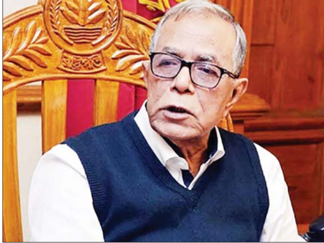
ဘင်္ဂလားဒေ့ရှ်နိုင်ငံသမ္မတ အက်ဒယ် ဟာမစ်။