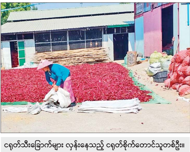
ငရုတ်သီးခြောက်များ လှန်းနေသည့် ငရုတ်စိုက်တောင်သူတစ်ဦး။

ငရုတ်စုံများ တင်ပို့ကြကြောင်း၊ ယခင်နှစ်များက တရုတ်သို့ ငရုတ်သီး ခြောက် ပိသောချိန် တစ်သိန်းမှ ၁၅ သိန်းကြား တင်ပို့နိုင်ကြောင်း၊ ထိုင်းသို့ ငရုတ်စုံ ပိသောချိန် ခုနစ်သိန်းခန့် တင်ပို့နိုင်ခဲ့ကြောင်း၊ ယခု နှစ်တွင်မူ တရုတ်သို့ ငရုတ်စုံ ပိသောချိန်တစ်သိန်းနှင့် ထိုင်းသို့ ငရုတ်စုံ ပိသောချိန် သုံးသိန်းခန့်သာ တင်ပို့နိုင်ခဲ့ကြောင်း၊ လက်ရှိ ဈေးနှုန်း အနေဖြင့် ငရုတ်သီးခြောက် မိုးထောင်တစ်ပိသောလျှင် ကျပ် ၁၁၅၀၊ သာစည်ပွ တစ်ပိသောလျှင် ကျပ် ၁၂၀၀၊ ကုလားအော်တစ်ပိသောလျှင် ကျပ် ၁၂၀၀ ဖြင့် အရောင်းအဝယ်ဖြစ်လျက်ရှိကြောင်း၊ ယခင်နှစ်နှင့် နှိုင်းယှဉ်လျှင် ပြည်ပသို့ ငရုတ်တင်ပို့နိုင်မှုလျော့နည်းကြောင်း ငရုတ် စိုက်ပျိုးထုတ်လုပ်ရောင်းချသည့် လုပ်ငန်းရှင်တစ်ဦးထံမှ သိရသည်။ မြို့ရီ(DOCA)