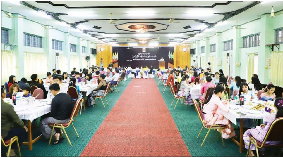
ဝန်ကြီးဦးအေးလှိုင်က မုံရွာစီးပွားတက္ကသိုလ်ကျောင်းအတွက် ငွေကျပ် ၁၀ သိန်း ထောက်ပံ့ပေးအပ်သည်။ ဆက်လက်၍ စီးပွားရေးလုပ်ငန်း စီမံခန့်ခွဲမှု ပညာမဟာဘွဲ့ (MBA)ဘွဲ့ရ ကျောင်းသားတစ်ဦးက ကျေးဇူးတင်စကား ပြန်လည်ပြောကြားသည်။ ထို့နောက် တိုင်းဒေသကြီး ဝန်ကြီးချုပ်သည် တာဝန်ရှိသူများနှင့်အတူ ညစာအတူတကွ သုံးဆောင်ခဲ့ပြီး ဆရာ ဆရာမများနှင့် ကျောင်းသား ကျောင်းသူများက တေးသီချင်းများဖြင့် ဧည့်ခံဖျော်ဖြေခဲ့ကြောင်း သိရသည်။ တိုင်းဒေသကြီး(ပြန်/ဆက်)

စီးပွားရေးပညာရှင်၊ အသိပညာရှင် အတတ်ပညာရှင်များဖြစ်အောင် ကြိုးစားသွားကြရန် လိုပါကြောင်း၊ မောင်တို့မယ်တို့အနေဖြင့် နိုင်ငံ့ဝန်ထမ်းအဖြစ် တာဝန်ထမ်းဆောင်သည်ဖြစ်စေ၊ ကိုယ်ပိုင်စီးပွားရေး လုပ်ငန်းများ လုပ်ဆောင်ကြသည်ဖြစ်စေ နိုင်ငံတော်၏ကျေးဇူးသစ္စာကို စောင့်သိရှိသော အများနှင့် အတူ ပူးပေါင်းညှိနှိုင်းပြီး အတ္တဟိတ ပရဟိတမျှတအောင် ဆောင်ရွက်သွားကြရန် လိုအပ်ပါကြောင်း ပြောကြားသည်။ ယင်းနောက် မုံရွာစီးပွားရေးတက္ကသိုလ် ပါမောက္ခချုပ် ဒေါက်တာသီတာကြူက (၂၁) ကြိမ်မြောက် ဘွဲ့နှင်းသဘင်အခမ်းအနား အထိမ်းအမှတ် ဂုဏ်ပြုညစာစားပွဲ အခမ်းအနား ကျင်းပရခြင်းနှင့် ပတ်သက်၍ ရှင်းလင်းပြောကြားသည်။ ယင်းနောက် တိုင်းဒေသကြီး ဝန်ကြီးချုပ်က ပါမောက္ခချုပ်ထံ မုံရွာစီးပွားရေးတက္ကသိုလ် ကျောင်းအတွင်း ပြန်လည်ပြုပြင်နေသည့် ဆုတောင်းပြည့်စေတီတော်မြတ်ကြီးအတွက် ငွေကျပ် ၁၀ သိန်း ပေးအပ်လှူဒါန်းပြီး တိုင်းဒေသကြီး လူမှုရေးရာ