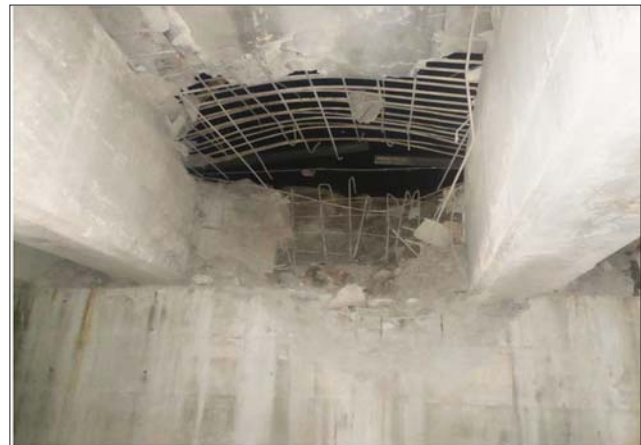
PDF အမည်ခံ အကြမ်းဖက်သမားများ မိုင်းထောင်ဖောက်ခွဲဖျက်ဆီးခဲ့သည့် သပြေချောင်းသံကူကွန်ကရစ်တံတား ပျက်စီးမှု မှတ်တမ်းဓာတ်ပုံ။

ထူးခြားသည့် ည အပူချိန်များ နေပြည်တော် ဇန်နဝါရီ ၂၂ ထူးခြားသည့် ညအပူချိန် များမှာ နမ့်စန်မြို့တွင် -၂ ဒီဂရီစင်တီဂရိတ်၊ ဟဲဟိုး မြို့နှင့် မိုင်းယမ်းမြို့တို့တွင် ၁ ဒီဂရီစင်တီဂရိတ်စီ၊ ကျောက်မဲမြို့နှင့် လွိုင်လင် မြို့တို့တွင် ၂ ဒီဂရီစင်တီဂရိတ်စီနှင့် ပူတာအိုမြို့တွင် ၃ ဒီဂရီစင်တီဂရိတ်တို့ ဖြစ်ကြသည်။ မြန်မာ့ ပင်လယ်ပြင် အခြေအနေမှာ လှိုင်းအနည်း ငယ်မှ လှိုင်းအသင့်တင့်ရှိ မည်။ လှိုင်းအမြင့်မှာ မြန်မာ့ ကမ်းရိုးတန်း တစ်လျှောက် နှင့် ကမ်းလွန်ပင်လယ်ပြင် တို့တွင် လေးပေမှ ခြောက်ပေ ခန့် ရှိနိုင်သည်။ မိုး/လေ