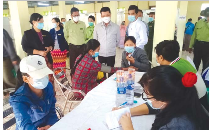
အရေပြား၊ အရိုး၊ အထွေထွေရောဂါ၊ သားဖွား ကုသမှုများကို လိုက်လံကြည့်ရှုအားပေးခဲ့မီးယပ်၊ ECGနှင့် မျက်စိရောဂါများ စစ်ဆေးသည့် မြို့နယ်(ပြန်/ဆက်)

လေးမျက်နှာ ဇန်နဝါရီ ၂၂ ဧရာဝတီတိုင်းဒေသကြီး အစိုးရအဖွဲ့၏ ညွှန်ကြားမှုဖြင့် ဟင်္သာတခရိုင် ပြည်သူ့ဆေးရုံကြီးမှ အထူးကုဆရာဝန်ကြီးများက လေးမျက်နှာမြို့နယ် ပြည်ငြိမ်းအေးကျောင်းတိုက် မြို့ဦးဓမ္မာရုံ၌ ဇန်နဝါရီ ၂၀ ရက်တွင် ကွင်းဆင်း ဆေးကုသပေးနေမှုများကို တိုင်းဒေသကြီးဝန်ကြီးချုပ် ဦးတင်မောင်ဝင်း လာရောက်ကြည့်ရှုအားပေးသည်။