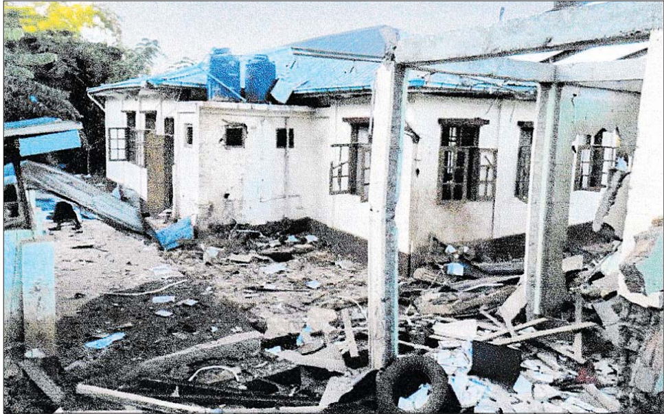
အကြမ်းဖက်အဖွဲ့အစည်းများ၏ မိုင်းထောင်ဖောက်ခွဲ၊ မီးရှို့ဖျက်ဆီးခြင်းများကြောင့် ရွေးကောက်ပွဲကော်မရှင်အဖွဲ့ခွဲရုံးများ၏ ပျက်စီးဆုံးရှုံးမှုမှတ်တမ်းဓာတ်ပုံ။