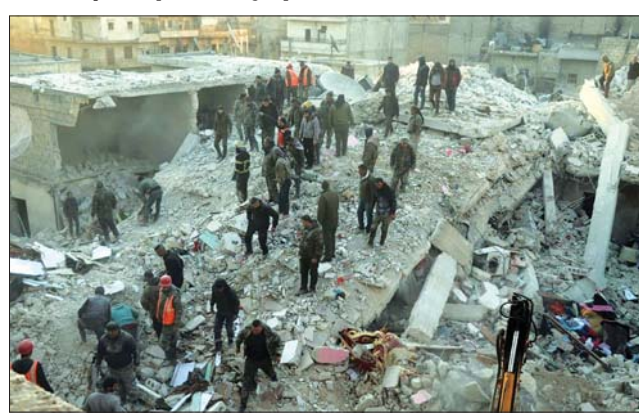
အလက်ပို၌ အဆောက်အအုံ ပြိုကျပြီးနောက် ရှာဖွေကယ်ဆယ်ရေး လုပ်ငန်းဆောင်ရွက်နေသည်ကို တွေ့ရစဉ်။

အလက်ပို ဇန်နဝါရီ ၂၂ - ဆီးရီးယားနိုင်ငံ၏ ဒုတိယမြို့တော်ဖြစ်သည့် အလက်ပို၌ ဇန်နဝါရီ ၂၂ ရက်က လူနေအဆောက်အအုံတစ်လုံး ပြိုကျမှုကြောင့် ကလေးငယ်များ အပါအဝင် ၁၃ ဦးထက် မနည်းသေဆုံးကြောင်း အာဏာပိုင်များနှင့် မီဒီယာများ၏ ဖော်ပြချက်အရ သိရသည်။ နိုင်ငံပိုင်သတင်းဌာန SANA က ကနဦးတွင် သေဆုံးသူ ၁၀ ဦးရှိခဲ့သည်ဟု ဖော်ပြထားသော်လည်း ပြည်ထဲရေး ဝန်ကြီးဌာန၏ ထုတ်ပြန်ချက်ကို ကိုးကား၍ ၁၃ ဦး သေဆုံးကြောင်း ပြန်လည်ပြင်ဆင်ခဲ့သည်။ မိသားစု ခုနစ်စု နေထိုင်သော အဆိုပါ အဆောက်အအုံမှာ ဇန်နဝါရီ ၂၂ ရက် အစောပိုင်းက ပြိုကျခဲ့ခြင်းဖြစ်ပြီး သေဆုံးမှုနှုန်း မြင့်တက်နိုင်ခြေ ရှိကြောင်း ပြည်ထဲရေးဝန်ကြီးဌာနက ပြောသည်။ ထို့အပြင် ထိုအဆောက်အအုံတွင် လူပေါင်း ၃၅ ဦးခန့် နေထိုင် ကြောင့် ဒေသခံများက အဆောက်အအုံ ပြိုကျသွားခြင်းကို အလက်ပိုရှိ အဆောက်အအုံများအပြား ပျက်စီးခဲ့ပြီး ကျန်ရှိနေသော အဆောက်အအုံများမှာ လည်း အိုမင်းဟောင်းနွမ်းနေပြီဟု ဆိုသည်။ ပြီးခဲ့သည့် စက်တင်ဘာလကလည်း အလက်ပိုမြို့တွင် အဆောက်အအုံ တစ်လုံးပြိုကျမှု ဖြစ်ပွားခဲ့ရာ ကလေးငယ် သုံးဦး အပါအဝင် ၁၀ ဦး သေဆုံးခဲ့ကြောင်း သိရသည်။ ဆီးရီးယားနိုင်ငံ၏ ၁၂ နှစ် အအက်ပီ