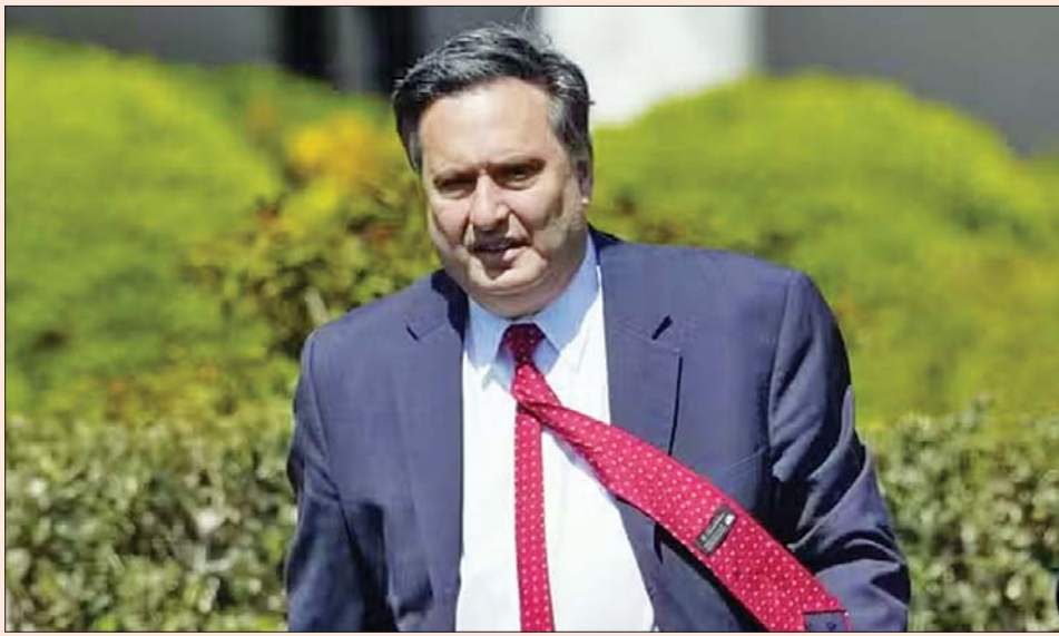
အိမ်ဖြူတော်အကြီးအကဲဖြစ်သူ ရွန်ကလိန်း။