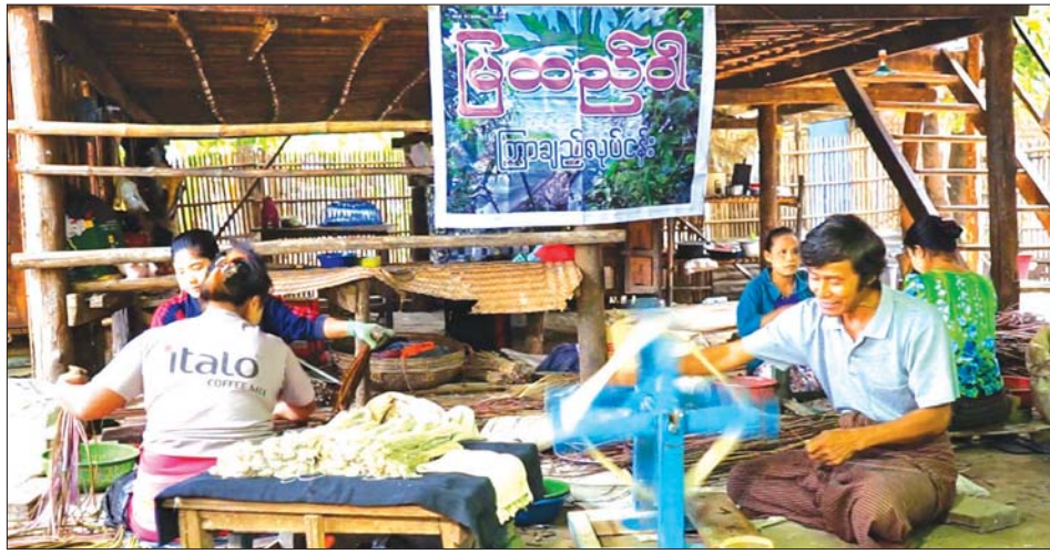
မြထည်ဝါကြာချည်လုပ်ငန်း၌ ကြာရိုးများမှ ကြာချည်ထုတ်နေစဉ်။

ယခင်က စလင်းမြို့၌ ကြာချည်ထုတ်လုပ်ငန်း လုပ်ကိုင်သူ မရှိသလောက်နည်းပါးပြီး ကန်အတွင်း ပေါက်ရောက်နေသောကြာများကို ပန်းအဖြစ်ရောင်း ခြင်း၊ ကြာရွက်ကို ဖက်(ကြာဖက်)အဖြစ် အသုံးပြုရန် ခူးရောင်းခြင်းများသာ အများစုလုပ်ကိုင်ကြသည်။ တိုးတက်လာသော ခေတ်စနစ်များနှင့်အညီ လေ့လာ အားကောင်းသော ဒေသခံပြည်သူများက အင်းလေး ဒေသတွင် ကြာရိုးမှတစ်ဆင့် ကြာချည်အဖြစ် ထုတ်လုပ်၍ ရသည်ကို သိရှိလာကြပြီးနောက် ကြာချည်ထုတ်လုပ်ငန်းကို စတင်လုပ်ကိုင်ရန် ၂၀၀၉ ခုနှစ်က အင်းလေးဒေသသို့ သွားရောက်ပြီး ကြာချည် ထုတ်လုပ်ပညာရပ်ကို လေ့လာသင်ယူခဲ့ကာ ယနေ့ ထိတိုင် ကြာချည်ထုတ်လုပ်ငန်းကို မြန်မာရိုးရာ လက်မှုပညာအဖြစ် လုပ်ကိုင်ဆောင်ရွက်လာကြသည်။ ထို့ပြင် ၂၀၁၉ ခုနှစ်က မကွေးတိုင်းဒေသကြီးအစိုးရ အဖွဲ့၏ပံ့ပိုးကူညီမှုဖြင့် ပခုက္ကူမြို့ရှိ စက်ရက်ကန်း