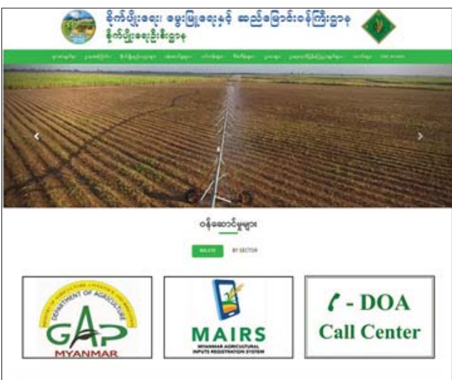
ဆောင်ရွက်ရန် ကြိုးပမ်းလျက်ရှိကြောင်း၊ အလားတူ နိုင်ငံတကာ ဝက်ဘ်ဆိုက်များနှင့် ချိတ်ဆက်နိုင်ရေးသာမက ပြည်ပမှ မြန်မာနိုင်ငံ၏ လယ်ယာစိုက်ပျိုးရေး စိတ်ဝင်စားသူများ အလွယ်တကူ ရှာဖွေလေ့လာ နိုင်ရေးကိုလည်း စီစဉ်ဆောင်ရွက်လျက်ရှိကြောင်း သိရသည်။ သတင်းစဉ်

ဖြစ်ကြောင်း ပြောကြားသည်။ လယ်ယာစိုက်ပျိုးရေးကဏ္ဍဆိုင်ရာ စီမံခန့်ခွဲခြင်းလုပ်ငန်းများ ဆောင်ရွက်ရန် ၁၈၈၈ ခုနှစ်တွင် မြေစာရင်းနှင့် စိုက်ပျိုးရေးဌာနအဖြစ် စတင်သင်္နေတည်ခဲ့ပြီး ၁၉၀၁ ခုနှစ်တွင် လယ်ယာစိုက်ပျိုးရေးဌာနခွဲ အဖြစ်လည်းကောင်း၊ ၁၉၅၂ ခုနှစ်တွင် မြေယာကျေးလက် ကြီးပွားတိုးတက်ရေး ကော်ပိုရေးရှင်း (မြေ-ကျေး-ရှင်း) အဖြစ် လည်းကောင်း၊ ၁၉၇၂ ခုနှစ်တွင် လယ်ယာစိုက်ပျိုးရေး ကော်ပိုရေးရှင်းအဖြစ် လည်းကောင်း၊ ၁၉၈၉ ခုနှစ်တွင် မြန်မာ့စိုက်ပျိုးရေးလုပ်ငန်းအဖြစ် လည်းကောင်း ခေတ်စနစ်များနှင့်အညီ အဆင့်မြှင့်တင်ပေးလဲ ဖွဲ့စည်းခဲ့ပြီး လယ်ယာကဏ္ဍ ခေတ်မီဖွံ့ဖြိုးတိုးတက်ရေး လုပ်ငန်းများနှင့် စိုက်ပျိုးရေးနည်းပညာ ပြန့်ပွားရေးလုပ်ငန်းများကို အလေးထား ဆောင်ရွက်နိုင်ရန် ၂၀၁၂ ခုနှစ်တွင် စိုက်ပျိုးရေးဦးစီးဌာနအဖြစ် ပြင်ဆင် ဖွဲ့စည်းခဲ့ရာ ယခု (၁၁) နှစ် ပြည့်မြောက်ခြင်းဖြစ်ကြောင်း၊ ခေတ်မီ ဆက်သွယ်ရေးနည်းပညာများကို အကျိုးရှိစွာ အသုံးပြုပြီး တောင်သူ လိုအပ်ချက်ကို ထိထိရောက်ရောက် ဝန်ဆောင်ဖြည့်ဆည်းပေးနိုင်ရေး ကြိုးပမ်းမှုအဖြစ် www.doa.gov.mm လိပ်စာဖြင့် လွှင့်တင်ထားသော DOA Website ကို အဆင့်မြှင့်တင်ခြင်းဖြစ်ကြောင်း၊ ဆက်လက်၍ မျိုးစေ့ထုတ်လုပ်သူများနှင့် မျိုးစေ့သုံးစွဲလိုသူများအကြား အလွယ်တကူ ချိတ်ဆက်နိုင်မည့် ကြားခံကွန်ရက်အဖြစ် အသုံးချနိုင်ရေး တိုးချဲ့