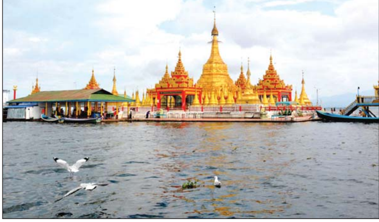
ရိုးရာ ပွဲတော်တွင် ပျော်ပွဲရွှင်ပွဲများ၊ ရိုးရာ ကျင်းပလေ့ရှိကြောင်း၊ ဘာသာမရွေး၊ အကပဒေသာများ၊ ဇာတ်သဘင်ပွဲများ၊ လူမျိုးမရွေး ပါဝင်ဆင်နွှဲကြသော ဘုရားပွဲတော်ကြီးဖြစ်ကြောင်း သိရသည်။

ဆွမ်းတော်ကြီး ကပ်လှူပွဲတွင် ဆရာတော်ကြီးများအပါအဝင် ပင့်ဖိတ်သံဃာတော်အပါး ၁၈၀ နှင့် သီလရှင်အပါး ၉၀ စုစုပေါင်း အပါး ၂၇၀ အား ဌာနဆိုင်ရာများ၊ ဂေါပကအဖွဲ့ဝင်များ၊ တိုင်းရင်းသား ရိုးရာယဉ်ကျေးမှုအဖွဲ့များ၊ အင်းပတ်လည်ရှိ ကျေးရွာများမှ ရွာသူရွာသားများနှင့် အနယ်နယ်အရပ်ရပ်မှ ဘုရားဖူးပြည်သူများက ဆွမ်းဆန်တော်ကပ်လှူကြမည်ဖြစ်ကြောင်း သိရသည်။