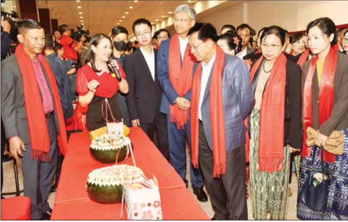
နိုင်ငံတော်စီမံအုပ်ချုပ်ရေးကောင်စီဥက္ကဋ္ဌ နိုင်ငံတော်ဝန်ကြီးချုပ် ဗိုလ်ချုပ်မှူးကြီး မင်းအောင်လှိုင်နှင့် ဇနီး ဒေါ်ကြူကြူလှ တရုတ်ရိုးရာယဉ်ကျေးမှုပြခန်းများနှင့် ဆိုင်ခန်းများကို လှည့်လည်ကြည့်ရှုစဉ်။