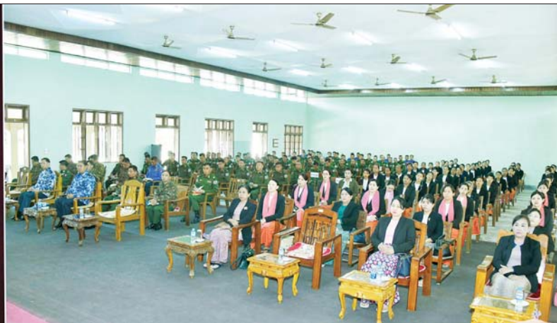
နိုင်ငံတော်စီမံအုပ်ချုပ်ရေးကောင်စီဥက္ကဋ္ဌ တပ်မတော်ကာကွယ်ရေးဦးစီးချုပ် ဗိုလ်ချုပ်မှူးကြီး မင်းအောင်လှိုင် ရခိုင်ပြည်နယ် သံတွဲတပ်နယ်ရှိ အရာရှိ၊ စစ်သည်၊ မိသားစုများအား တွေ့ဆုံအမှာစကားပြောကြားစဉ်။

နေပြည်တော် ဇန်နဝါရီ ၂၁ နိုင်ငံတော်စီမံအုပ်ချုပ်ရေးကောင်စီ ဥက္ကဋ္ဌ တပ်မတော်ကာကွယ်ရေးဦးစီးချုပ် ဗိုလ်ချုပ်မှူးကြီး မင်းအောင်လှိုင်သည် ယနေ့နံနက်ပိုင်းတွင် ရခိုင်ပြည်နယ် သံတွဲတပ်နယ်ရှိ အရာရှိ၊ စစ်သည်၊ မိသားစုများအား နယ်မြေခံတပ်ရှိ ငပလီခန်းမ၌ သွားရောက် တွေ့ဆုံ အမှာစကားပြောကြားသည်။ အဆိုပါ တွေ့ဆုံအခမ်းအနားသို့ နိုင်ငံတော်စီမံအုပ်ချုပ်ရေးကောင်စီဥက္ကဋ္ဌ တပ်မတော်ကာကွယ်ရေးဦးစီးချုပ်နှင့်အတူ ဇနီး ဒေါ်ကြူကြူလှ၊ ကာကွယ်ရေးဦးစီးချုပ် (ရေ) ဗိုလ်ချုပ်ကြီး မိုးအောင်နှင့် ဇနီး၊ ကာကွယ်ရေးဦးစီးချုပ် (လေ) ဗိုလ်ချုပ်ကြီး ထွန်းအောင်နှင့် ဇနီး၊ ကာကွယ်ရေးဦးစီးချုပ်ရုံးမှ တပ်မတော်အရာရှိကြီးများနှင့် ဇနီးများ၊ အနောက်ပိုင်းတိုင်းစစ်ဌာနချုပ်တိုင်းမှူး ဗိုလ်ချုပ် ထင်လတ်ဦးနှင့် တာဝန်ရှိသူများ၊ သံတွဲတပ်နယ်မှ အရာရှိ၊ စစ်သည်၊ မိသားစုများ တက်ရောက်ကြသည်။