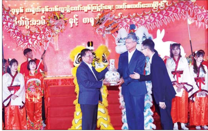
နိုင်ငံတော်စီမံအုပ်ချုပ်ရေးကောင်စီဥက္ကဋ္ဌ နိုင်ငံတော်ဝန်ကြီးချုပ် ဗိုလ်ချုပ်မှူးကြီး မင်းအောင်လှိုင်အား မြန်မာနိုင်ငံဆိုင်ရာ တရုတ်နိုင်ငံသံအမတ်ကြီးက နှစ်သစ်ကူးလက်ဆောင်မွန် ဂါရဝပြပေးအပ်စဉ်။