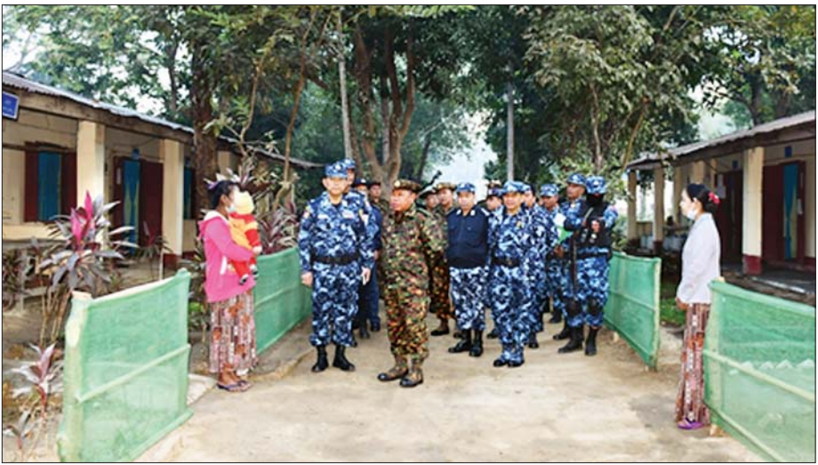
များ ပေးအပ်ချီးမြှင့်သည်။

ဆက်လက်၍ ပြည်ထောင်စုဝန်ကြီးသည် ခရီးစဉ်အတွင်း တပ်မိသားစုများကို တပ်ဖွဲ့တစ်ခုချင်းအလိုက် သီးခြားတွေ့ဆုံပြီး လက်ရှိလုံခြုံရေးဆောင်ရွက်နေမှု၊ နိုင်ငံတော်စီမံအုပ်ချုပ်ရေးကောင်စီ ပေါ်ပေါက်လာသည့် အခြေအနေ၊ ၂၀၀၈ ခုနှစ် ဖွဲ့စည်းပုံအခြေခံဥပဒေ နှင့်အညီ ဆောင်ရွက်ခဲ့ရမှု၊ နိုင်ငံတော်စီမံအုပ်ချုပ်ရေးကောင်စီ၏ ရှေ့လုပ်ငန်းစဉ် (၅) ရပ် ချမှတ်ဆောင်ရွက်နေမှုမှ တရားမျှတသော ရွေးကောက်ပွဲဆိုင်ရာ အကြံပြုဆိုင်ရာလုပ်ငန်းများ ဆောင်ရွက်လျက် ရှိရာ လုံခြုံရေးဆိုင်ရာများ ဆောင်ရွက်ရာတွင် ဆောင်ရန်ရောင်းရန် များ၊ နိုင်ငံတော်အကြီးအကဲ၏ မှာကြားမှုများနှင့်အညီ အမျိုးသားရေး ရည်မှန်းချက်ချမှတ်ထားရှိမှုနှင့်အညီ တပ်ဖွဲ့ဝင်နှင့် မိသားစုများအနေဖြင့် နိုင်ငံတော်အပေါ် သစ္စာစောင့်သိရှိသောစွာ လိုက်နာတာဝန်ထမ်းဆောင် ကြရေး၊ ရဲတပ်ဖွဲ့အနေဖြင့် တိုင်းပြည်သာယာဝပြောရေးနှင့် စားရေ ရိက္ခာဖူလုံရေး ရည်မှန်းချက်တွင် အထောက်အကူပြုသည့် မိမိတို့နှင့် သက်ဆိုင်သည့် လုပ်ဆောင်ရမည့် လိုက်နာဆောင်ရွက်ရမည့် တပ်တည်ဆောက်ရေး လုပ်ငန်းတာဝန်ကြီး(၄)ရပ် တိုးတက်အောင်မြင် အောင် ဆောင်ရွက်ရေး၊ တပ်တွင်းတစ်ပိုင်စီ စိုက်ပျိုးမွေးမြူရေး လုပ်ငန်းများကို ယခုထက် ပိုမိုတိုးတက်အောင်မြင်အောင် ဆောင်ရွက် ရေး၊ မိသားစုဝင်များ၏ သားသမီးများကို ပညာရေးအဆင့်မြင့်မားရေး အတွက် ကြိုးပမ်းဆောင်ရွက်ကြရေးနှင့် တပ်တွင်းစည်းလုံးညီညွတ်မှု ပိုမိုခိုင်မာရေးတို့ကို မှာကြားပြီး မိသားစုဝင်များအတွက် ထောက်ပံ့ငွေ