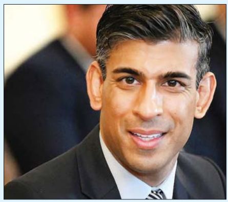
ဗြိတိန်ဝန်ကြီးချုပ် ရစ်ရှီဆူနက်

လန်ဒန် ဇန်နဝါရီ ၂၁ ကားနောက်ခန်းတွင် ထိုင်နေသည့် ဗီဒီယိုဖိုင်ထဲ၌ ဗြိတိန်ဝန်ကြီးချုပ် ရစ်ရှီဆူနက် ထိုင်ခုံခါးပတ် ပတ်ထားသည်ကိုတွေ့ရသဖြင့် ဒဏ်ရိုက်ခံရကြောင်း သိရသည်။