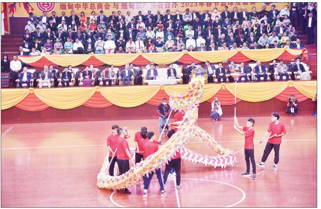
နိုင်ငံတော်စီမံအုပ်ချုပ်ရေးကောင်စီဥက္ကဋ္ဌ နိုင်ငံတော်ဝန်ကြီးချုပ် ဗိုလ်ချုပ်မှူးကြီး မင်းအောင်လှိုင်၊ ဇနီး ဒေါ်ကြူကြူလှနှင့် အခမ်းအနား တက်ရောက်ကြသူများ တရုတ်ရိုးရာနဂါးအကအဖွဲ့များ ဂါရဝပြု ကပြဖျော်ဖြေမှုကို ကြည့်ရှုအားပေးစဉ်။

မြန်မာနိုင်ငံနှင့် တရုတ်နိုင်ငံသည် ဆွေမျိုး ပေါက်ဖော်ချစ်ကြည်ရင်းနှီးသည့် ဆက်ဆံရေးဖြစ်ပြီး