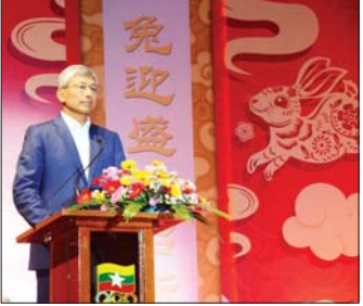
မြန်မာနိုင်ငံဆိုင်ရာ တရုတ်နိုင်ငံသံအမတ်ကြီး H.E. Mr. Chen Hai နှစ်သစ်ဆုတောင်းစကား ပြောကြားစဉ်။

ထို့နောက် နိုင်ငံတော်စီမံအုပ်ချုပ်ရေးကောင်စီ ဥက္ကဋ္ဌ နိုင်ငံတော်ဝန်ကြီးချုပ်နှင့် ဇနီးတို့သည် တရုတ် ရိုးရာအကအဖွဲ့များနှင့် သီဆိုဖျော်ဖြေခဲ့ကြသည့် အနုပညာရှင်များကို အမှတ်တရပန်းခြင်းများ ပေးအပ်ခဲ့ပြီး ရင်းရင်းနှီးနှီး နှုတ်ဆက်ခဲ့ကြောင်း သတင်းရရှိသည်။ သတင်းစဉ်