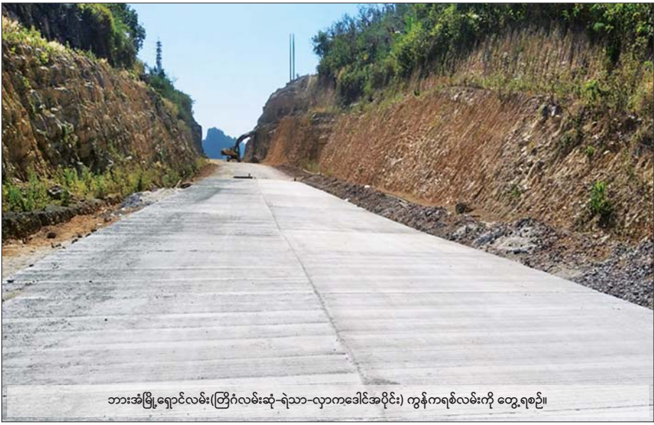
ဘားအံမြို့ရှောင်လမ်း(ကြိတ်လမ်းဆုံ-ရဲသာ-လှာကဒေါင်အပိုင်း) ကွန်ကရစ်လမ်းကို တွေ့ရစဉ်။

နေပြည်တော် ဇန်နဝါရီ ၂၁ ကရင်ပြည်နယ် ဘားအံမြို့ရှိ ဒေသခံပြည်သူများနှင့် ခရီးသွားပြည်သူများ ယာဉ်ကြောပိတ်ဆို့မှုနှင့် ယာဉ်အန္တရာယ်ကင်းရှင်းရေး၊ ယာဉ်မတော်တဆမှု လျော့ချရေး၊ အချိန်ကုန်သက်သာ၍ အဆင်ပြေချောမွေ့စွာသွားလာနိုင်ရေးနှင့် ကုန်စည်စီးဆင်းမှု မြန်ဆန်ကောင်းမွန်စေရေးအတွက် ဘားအံမြို့ရှောင်လမ်းကို တည်ဆောက်လျက်ရှိရာ ယခုအခါ ရာခိုင်နှုန်းပြည့် ပြီးစီးတော့မည်ဖြစ်ကြောင်း လမ်းဦးစီးဌာနမှ သိရသည်။ “လာမယ့် မတ်လဆိုင်ရင် ရာခိုင်နှုန်းပြည့် ပြီးစီးတော့မှာဖြစ်ပါတယ်။ အဓိကကတော့ ကျွန်တော်တို့အနေနဲ့ လမ်းအသုံးပြုသူ ပြည်သူတွေ မြန်မြန်ဆန်ဆန် အဆင်ပြေပြေ အသုံးပြုနိုင်အောင် ကြိုးပမ်းဆောင်ရွက်ရတာဖြစ်ပါတယ်။ မြို့ရှောင်လမ်းကို စတင်ဆောင်ရွက်ခဲ့တာက ၂၀၂၀-၂၀၂၁ ဘဏ္ဍာနှစ်မှာဖြစ်ပါတယ်” ဟု လမ်းဦးစီးဌာနမှ ညွှန်ကြားရေးမှူး ဦးအောင်ညိုက ပြောသည်။ စာမျက်နှာ ၁၈ ကော်လံ ၁ ◆