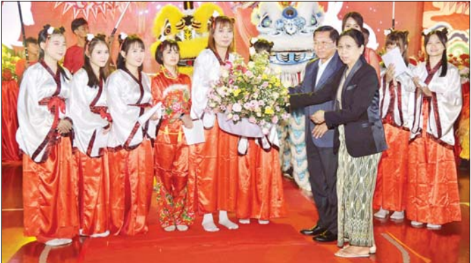
နိုင်ငံတော်စီမံအုပ်ချုပ်ရေးကောင်စီဥက္ကဋ္ဌ နိုင်ငံတော်ဝန်ကြီးချုပ် ဗိုလ်ချုပ်မှူးကြီး မင်းအောင်လှိုင်နှင့် ဇနီး ဒေါ်ကြူကြူလှ တရုတ်ရိုးရာအကအဖွဲ့များကို အမှတ်တရပန်းခြင်း ပေးအပ်စဉ်။

နိုင်ငံကောင်းများဖြစ်ပါကြောင်း၊ မြန်မာနိုင်ငံသည် လွတ်လပ်၍ တက်ကြွပြီး ဘက်မလိုက်သော နိုင်ငံခြားရေးမူဝါဒကို လက်ခံကျင့်သုံးနေသည့် နိုင်ငံ ဖြစ်ပြီး ငြိမ်းချမ်းစွာအတူယှဉ်တွဲနေထိုင်ရေးမူကြီး ၅ ရပ်ကို လက်ခံကျင့်သုံးနေသည့် နိုင်ငံဖြစ်ပါကြောင်း၊ မိမိကိုယ်တိုင်လည်း ၂၀၂၁ ခုနှစ် မေ ၂၀ ရက်တွင် တရုတ်နိုင်ငံ Phoenix ရုပ်သံမီဒီယာနှင့် အင်တာဗျူး ဌာန နှစ်နိုင်ငံ ဆက်ဆံရေးနှင့် ပတ်သက်၍ ယုံကြည်မှု နှင့် ချစ်ခင်ရင်းနှီးစွာနေခြင်းသည် အကောင်းဆုံးဖြစ် ကြောင်း၊ အိမ်နီးချင်းဟူသည်မှာ အရင်းနှီးဆုံး အိမ်နီးချင်းကောင်းများ ဖြစ်ရမည်အကြောင်း၊ မြန်မာ နိုင်ငံသည် နယ်နိမိတ်ချင်းထိစပ်နေသည့် အိမ်နီးချင်း ၅ နိုင်ငံနှင့် ရင်းနှီးချစ်ကြည်စွာ နေထိုင်သွားမည်ဖြစ် သည့်အကြောင်း၊ တရုတ်နိုင်ငံနှင့် မြန်မာနိုင်ငံသည် ငြိမ်းချမ်းစွာအတူယှဉ်တွဲရေးမူ ၅ ချက်ကို ကမ္ဘာတွင် စပြီး လက်မှတ်ထိုးသည့် နိုင်ငံဖြစ်ကြောင်းကို ဖြေကြားခဲ့ပါကြောင်း၊ မိမိဖြေဆိုခြင်းဖြစ်သည် ဆိုသော်လည်း မြန်မာနိုင်ငံ၏ အိမ်နီးချင်းနိုင်ငံများ အပေါ်ထားသည့် ရပ်တည်ချက်ဆိုင်ရာလည်း မမှား ပါကြောင်း။