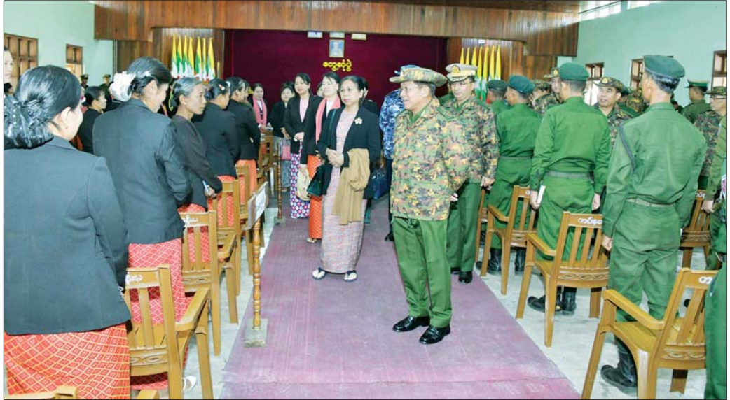
နိုင်ငံတော်စီမံအုပ်ချုပ်ရေးကောင်စီဥက္ကဋ္ဌ တပ်မတော်ကာကွယ်ရေးဦးစီးချုပ် ဗိုလ်ချုပ်မှူးကြီး မင်းအောင်လှိုင် တွေ့ဆုံပွဲသို့ တက်ရောက်လာကြသည့် အရာရှိ၊ စစ်သည်၊ မိသားစုများအား ရင်းရင်းနှီးနှီး လိုက်လံနှုတ်ဆက်စဉ်။

စီးပွားရေးသည် အတိုင်းအတာတစ်ခုအထိ ပြန်လည် တိုးတက်လာသည်ကို တွေ့ရှိရမည်ဖြစ်ကြောင်း၊ ပြည်ပရေးရာများကိုလည်း ပြန်လည်ပေးဆပ်လျက် ရှိကြောင်း၊ ပြည်တွင်းစီးပွားရေးလုပ်ငန်းများကို ယခုထက် ပိုမိုတိုးတက်အောင် ဆောင်ရွက်သွားရမည် ဖြစ်ကြောင်း၊ မိမိတို့နိုင်ငံတွင် အဖိုးတန် မြေပေါ် မြေအောက်၊ ရေပေါ်ရေအောက် သယ်စာတရား များစွာရှိပြီးဖြစ်သဖြင့် အဆိုပါသယ်စာတရားဖြင့် ရှိပြီးသားလူသားအရင်းအမြစ်များကို စနစ်တကျ အသုံးချမည်ဆိုပါက စီးပွားရေးလုပ်ငန်းများတိုးတက် လာမည်ဖြစ်ကြောင်း၊ ယခုကဲ့သို့ နိုင်ငံစီးပွားရေး အားကောင်းလာစေရန် အရှိန်အဟုန်ဖြင့် ဆက်လက်ကြိုးပမ်း ဆောင်ရွက်သွားမည်ဆိုပါက မကြာမီအချိန်တွင် အာဆီယံနိုင်ငံများ၌ အလယ် အလတ်အဆင့်သို့ ရောက်ရှိနိုင်မည်ဖြစ်ကြောင်း၊ စိုက်ပျိုးမွေးမြူရေးလုပ်ငန်းများကို အခြေခံသည့် စီးပွားရေးလုပ်ငန်းများကို ယခုထက်ပိုမိုတိုးတက် အောင် ဆောင်ရွက်မည်ဆိုပါက နိုင်ငံ့ဝင်ငွေများ ပိုမိုရရှိမည်ဖြစ်ကြောင်း၊ စိုက်ပျိုးရေးနှင့် မွေးမြူ ရေးလုပ်ငန်းများကို အားပေးဆောင်ရွက်ပြီး ကုန်ထုတ်လုပ်မှုများကို အားပေးဆောင်ရွက်ရမည် ဖြစ်ကြောင်း။