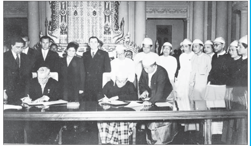
၁၉၅၅ ခုနှစ်တွင် မြန်မာနိုင်ငံဝန်ကြီးချုပ်နှင့် ရုရှားနိုင်ငံ (ယခင် ဆိုဗီယက်) ခေါင်းဆောင်တို့ နိုင်ငံတည်ဆောက်ရေးလုပ်ငန်း များအတွက် လက်မှတ်ရေးထိုးခဲ့ပုံ။