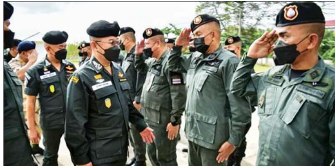
နရသီဝပ်ပြည်နယ်၌ ထိုင်းအမျိုးသား ရဲချုပ်နှင့် တာဝန်ရှိသူများကို တွေ့ရစဉ်။

တောတွင်း ပစ်ခတ်မှုအတွင်း မွတ်စလင် အများစုနေထိုင်ရာဒေသရှိ လက်နက်ကိုင်များ သည် ပြည်နယ်၏ ကိုယ်ပိုင် အုပ်ချုပ်ခွင့်အတွက် တိုက်ပွဲဝင်