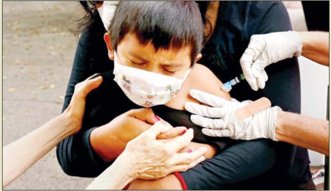
လော့ဒ်အိန်ဂျလစ်စ်၌ ကလေးငယ်တစ်ဦးအား တုပ်ကွေးကာကွယ်ဆေး ထိုးနှံပေးစဉ်။

ကုသမှုခံယူနေရသူ ၆၃၀၀ ကျော်ရှိကြောင်း အဆိုပါ ထုတ်ပြန်ချက်အရ သိရသည်။ ထို့အပြင် ယခု သီတင်းပတ်အတွင်း တုပ်ကွေးနှင့်ဆက်စပ်သော ဖြစ်စဉ်ကြောင့် ကလေးငယ် ခြောက်ဦး ထပ်မံသေ ဆုံးသည့်အတွက် လက်ရှိအချိန်အထိ ကလေးငယ် သေဆုံးသူ စုစုပေါင်း ၈၅ ဦး ရှိလာပြီ ဖြစ်သည်။ တုပ်ကွေးရောဂါကူးစက်ခြင်းနှင့် ပြင်းထန်သော ရောဂါလက္ခဏာများဖြစ်ပွားခြင်းမှ ကာကွယ်နိုင်ရန် အတွက် နှစ်စဉ်တုပ်ကွေးရောဂါကာကွယ်ဆေး ထိုးနှံမှုခံယူကြရန် ပြည်သူများကို စီဒီစီက တိုက်တွန်းထားသည်။ ဆင်ဟွာ