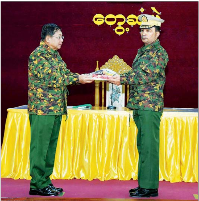
နိုင်ငံတော်စီမံအုပ်ချုပ်ရေးကောင်စီဥက္ကဋ္ဌ တပ်မတော်ကာကွယ်ရေးဦးစီးချုပ် ဗိုလ်ချုပ်မှူးကြီး မင်းအောင်လှိုင် သံတွဲတပ်နယ်မှ အရာရှိ၊ စစ်သည်၊ မိသားစုများအတွက် စားသောက်ဖွယ်ရာပစ္စည်းများကို တိုင်းမှူးထံ ပေးအပ်စဉ်။

ထိုသို့ တွေ့ဆုံအမှာစကားပြောကြားရာ၌ သံတွဲတပ်နယ်ရှိ အရာရှိ၊ စစ်သည်၊ မိသားစုများအားလုံးကို တွေ့ဆုံရသည့်အတွက် ဝမ်းမြောက်မိပါကြောင်း၊ တပ်မတော်အနေဖြင့် နိုင်ငံတော်၏ လုံခြုံရေး၊ ကာကွယ်ရေးနှင့် တရားဥပဒေစိုးမိုးရေးတာဝန်များကို ထမ်းဆောင်လျက်ရှိပြီး ပါတီစုံဒီမိုကရေစီစနစ် ခိုင်မာစေရေးနှင့် အကြမ်းဖက်မှုများ မရှိစေရေးအတွက်လည်း ဥပဒေနှင့်အညီ ထိန်းသိမ်းဆောင်ရွက်လျက်ရှိကြောင်း၊ ဦးစွာပြောကြားပြီး ကမ္ဘာ့နိုင်ငံများတွင် ပါတီစုံဒီမိုကရေစီစနစ်ကို ကျင့်သုံးဆောင်ရွက်လျက်ရှိသည့် အခြေအနေများနှင့် မြန်မာနိုင်ငံ၏ ၂၀၂၀ ပြည့်နှစ် ပါတီစုံဒီမိုကရေစီအထွေထွေရွေးကောက်ပွဲတွင် မဲမသမာမှုများ ဖြစ်ပေါ်ခဲ့သည့် အခြေအနေများ၊ ထိုကဲ့သို့သော မဲမသမာမှုများကို ဖြေရှင်းဆောင်ရွက်ပေးခြင်းမရှိခဲ့ဘဲ နိုင်ငံတော်တွင် ဖြစ်ပေါ်လာခဲ့သည့် အခြေအနေများအရ နိုင်ငံတော်ကို နိုင်ငံရေးအရ အရေးပေါ်အခြေအနေ ကြေညာခဲ့ပြီး တပ်မတော်မှ နိုင်ငံတာဝန်များကို ထမ်းဆောင်ခဲ့ရမှု အခြေအနေများ၊ ကိုဗစ်-၁၉ ရောဂါကြောင့် ဖြစ်ပေါ်ခဲ့ရသည့် အကျပ်အတည်းများနှင့် နိုင်ငံရေးအမြတ်ထုတ်လိုသူများ၏ သွေးထိုးလှုံ့ဆော်မှုများကြောင့် ဖြစ်ပေါ်ခဲ့သည့် အကြမ်းဖက်မှု ဖြစ်စဉ်ဖြစ်ရပ်များကို