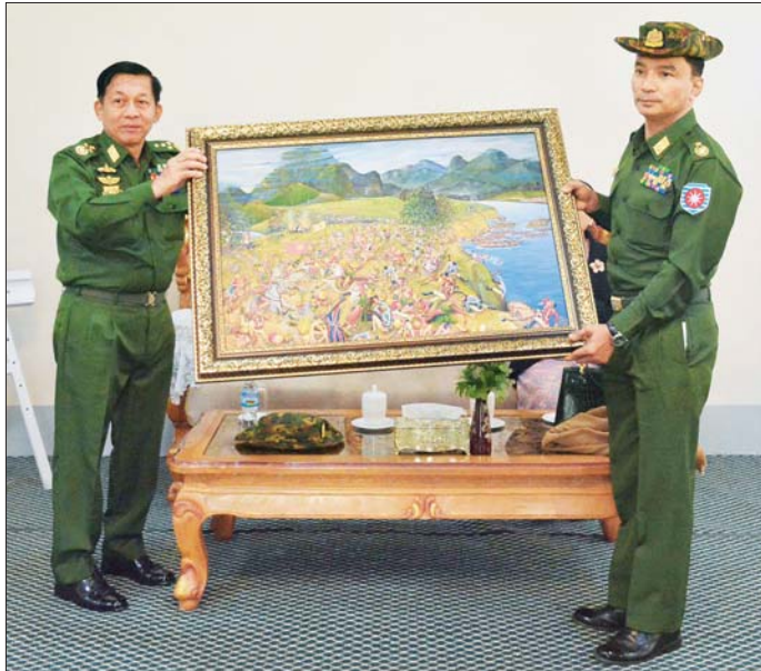
နိုင်ငံတော်စီမံအုပ်ချုပ်ရေးကောင်စီဥက္ကဋ္ဌ တပ်မတော်ကာကွယ်ရေးဦးစီးချုပ် ဗိုလ်ချုပ်မှူးကြီး မင်းအောင်လှိုင် အနောက်ပိုင်းတိုင်းစစ်ဌာနချုပ်တိုင်းမှူးအား ဆီဆေးပန်းချီကား ပေးအပ်စဉ်။

တပ်မတော်သားများ၏ သက်သာချောင်ချိရေး၊ ပညာရည်မြှင့်တင်ရေးအတွက် ဖြည့်ဆည်းဆောင်ရွက် တပ်မတော်အတွင်း၌လည်း တပ်မတော်သားများ ၏ သက်သာချောင်ချိရေးကို အထောက်အကူပြုစေ သည့် တပ်ပိုင်နှင့် တစ်ပိုင်တစ်နိုင်စိုက်ပျိုးမွေးမြူရေး လုပ်ငန်းများကို အောင်မြင်ဖြစ်ထွန်းအောင် ဆောင်ရွက်ရန်လိုကြောင်း၊ စိုက်ပျိုးမွေးမြူရေး လုပ်ငန်းသည် သမားအာဇီဝကျသည့် လုပ်ငန်းတစ်ခု ဖြစ်ပြီး အောင်မြင်ဖြစ်ထွန်းအောင် ဆောင်ရွက်မည် ဆိုပါကများစွာအကျိုးရှိမည်ဖြစ်ကြောင်း၊ တပ်မတော် အနေဖြင့် အရာရှိ၊ စစ်သည်၊ မိသားစုများနှင့် မိမိတို့ များ၏ စားရေး၊ ဝတ်ရေးနှင့် နေရေးတို့ကို တတ်နိုင် သမျှ ပြည့်စုံအောင် စီမံဆောင်ရွက်ပေးထားပြီးဖြစ် ကြောင်း။ ထို့ပြင် မိမိတို့နိုင်ငံ၌ ပညာရေးအားနည်းမှု များရှိသဖြင့် ပညာရည်မြှင့်တင်မှုလုပ်ငန်းများကို အလေးထားဆောင်ရွက်လျက်ရှိကြောင်း၊ တပ်မတော် သားများ၏ ပညာရည်မြှင့်တင်ရေးအတွက်လည်း ဆောင်ရွက်ခဲ့ကြောင်း၊ အတန်းပညာများရှိရန် လိုအပ် သကဲ့သို့ စာဖတ်ရာ စာတတ်မည်၊ စာတတ်မှ အသိ