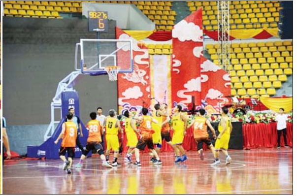
နိုင်ငံတော်စီမံအုပ်ချုပ်ရေးကောင်စီဥက္ကဋ္ဌ နိုင်ငံတော်ဝန်ကြီးချုပ် ဗိုလ်ချုပ်မှူးကြီး မင်းအောင်လှိုင်၊ ဇနီး ဒေါ်ကြူကြူလှနှင့် အခမ်းအနားတက်ရောက်ကြသူများ ချစ်ကြည်ရေးဘတ်စကက်ဘောပြိုင်ပွဲကို ကြည့်ရှုအားပေးစဉ်။