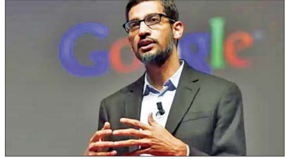
အယ်လ်ဖာဘာက စီအီးအို ဆန်းဒါး ပီချိုင်း

ဆန်ဖရန်စစ္စကို ဇန်နဝါရီ ၂၁ ဂူဂဲလ်၏ မိခင်ကုမ္ပဏီဖြစ်သည့် အယ်လ်ဖာဘာက သည် ကမ္ဘာတစ်ဝန်းရှိ ၎င်း၏ လုပ်သားအင်အား ၆ ရာခိုင်နှုန်းခန့် (ရာထူးနေရာပေါင်း ၁၂၀၀၀)ကို အစုလိုက်အပြုံလိုက် ရာထူးမှ ရပ်စဲကြောင်း ဇန်နဝါရီ ၂၀ ရက်တွင် ကြေညာခဲ့သည်။