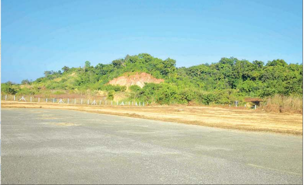
နိုင်ငံတော်စီမံအုပ်ချုပ်ရေးကောင်စီဥက္ကဋ္ဌ နိုင်ငံတော်ဝန်ကြီးချုပ် ဗိုလ်ချုပ်မှူးကြီး မင်းအောင်လှိုင် သံတွဲလေဆိပ် လေယာဉ်ပြေးလမ်းကို ကြည့်ရှုစဉ်။