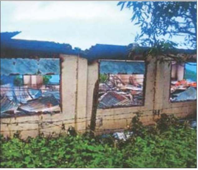
မီးရှို့ဖျက်ဆီးခြင်းခံထားရသည့် တီးတိန်မြို့နယ် ဦးစီးမှူးရုံး အဆောက်အဦ မှတ်တမ်းဓာတ်ပုံ။