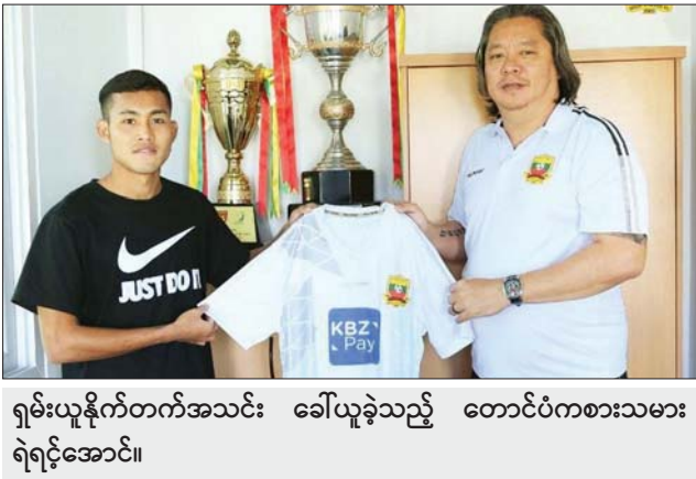
ရှမ်းယူနိုက်တက်အသင်း ခေါ်ယူခဲ့သည့် တောင်ပံကစားသမား ရဲရင့်အောင်။

ရှမ်းယူနိုက်တက်နှင့် ရန်ကုန်အသင်း ကစားသမားသစ်များ ဆက်လက်ခေါ်ယူ ရန်ကုန် ဇန်နဝါရီ ၂၀ ၂၀၂၃ MNL အမှတ်ပေးပြိုင်ပွဲအတွက် လေ့ကျင့်ပြင်ဆင်နေသည့် မြန်မာနေရှင်နယ်လိဂ်ကလပ်အသင်းများဖြစ်သော ရှမ်းယူနိုက်တက် အသင်းနှင့် ရန်ကုန်အသင်းတို့သည် ကစားသမားသစ်များ ဆက်လက် ခေါ်ယူအားဖြည့်ခဲ့သည်။ စာမျက်နှာ ၁၈ ကော်လံ ၂ *