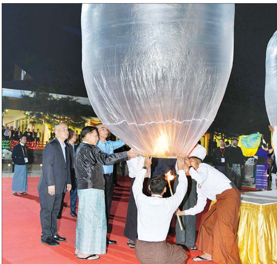
နိုင်ငံတော်စီမံအုပ်ချုပ်ရေးကောင်စီဥက္ကဋ္ဌ တပ်မတော်ကာကွယ်ရေးဦးစီးချုပ် ဗိုလ်ချုပ်မှူးကြီး မင်းအောင်လှိုင်နှင့် ထိုင်းဘုရင့်တပ်မတော်ကာကွယ်ရေးဦးစီးချုပ် General Chalermphon Srisawasdi တို့ (၈) ကြိမ်မြောက် မြန်မာ - ထိုင်း တပ်မတော်နှစ်ရပ်အကြား အဆင့်မြင့်အရာရှိကြီးများ အစည်းအဝေး အောင်မြင်ခြင်း အထိမ်းအမှတ်အဖြစ် မီးပုံးပျံများလွှတ်တင်ကြစဉ်။

အခမ်းအနားသို့ နိုင်ငံတော် စီမံအုပ်ချုပ်ရေးကောင်စီ ဥက္ကဋ္ဌ တပ်မတော်ကာကွယ်ရေးဦးစီးချုပ်နှင့် ဇနီး၊ ထိုင်းဘုရင့်တပ်မတော် ကာကွယ်ရေးဦးစီးချုပ်နှင့် ဇနီးတို့နှင့်အတူ ညှိနှိုင်းကွပ်ကဲရေးမှူး (ကြည်း၊ ရေ၊ လေ) ဗိုလ်ချုပ်ကြီး မောင်မောင်အေးနှင့် ဇနီး၊ ကာကွယ်ရေးဦးစီးချုပ် (ရေ) ဗိုလ်ချုပ်ကြီး မိုးအောင်နှင့် ဇနီး၊ ကာကွယ်ရေးဦးစီးချုပ် (လေ) ဗိုလ်ချုပ်ကြီး ထွန်းအောင်နှင့် ဇနီး၊ ကာကွယ်ရေးဦးစီးချုပ်ရုံးမှ တပ်မတော် အရာရှိကြီးများနှင့် ဇနီးများ၊ ထိုင်းဘုရင့်တပ်မတော်မှ အရာရှိကြီးများနှင့် ဇနီးများ၊ နှစ်နိုင်ငံ စစ်သံမှူးများနှင့် ဇနီးများ၊ တာဝန်ရှိသူများ တက်ရောက်ကြသည်။ ညစာ မသုံးဆောင်မီနှင့် သုံးဆောင်နေစဉ်အတွင်း ပြည်သူ့ဆက်ဆံရေးနှင့် စိတ်ဓာတ်စစ်ဆင်ရေးညွှန်ကြားရေးမှူးရုံး ကွပ်ကဲမှုအောက် မြဝတီတေးဂီတအဖွဲ့မှ တေးသံရှင်များ၊ အနုပညာဦးစီးဌာနနှင့် မြန်မာ့အသံနှင့် ရုပ်မြင်သံကြားတို့မှ အနုပညာရှင်များ၊ ပြင်ပ အနုပညာရှင်များနှင့်