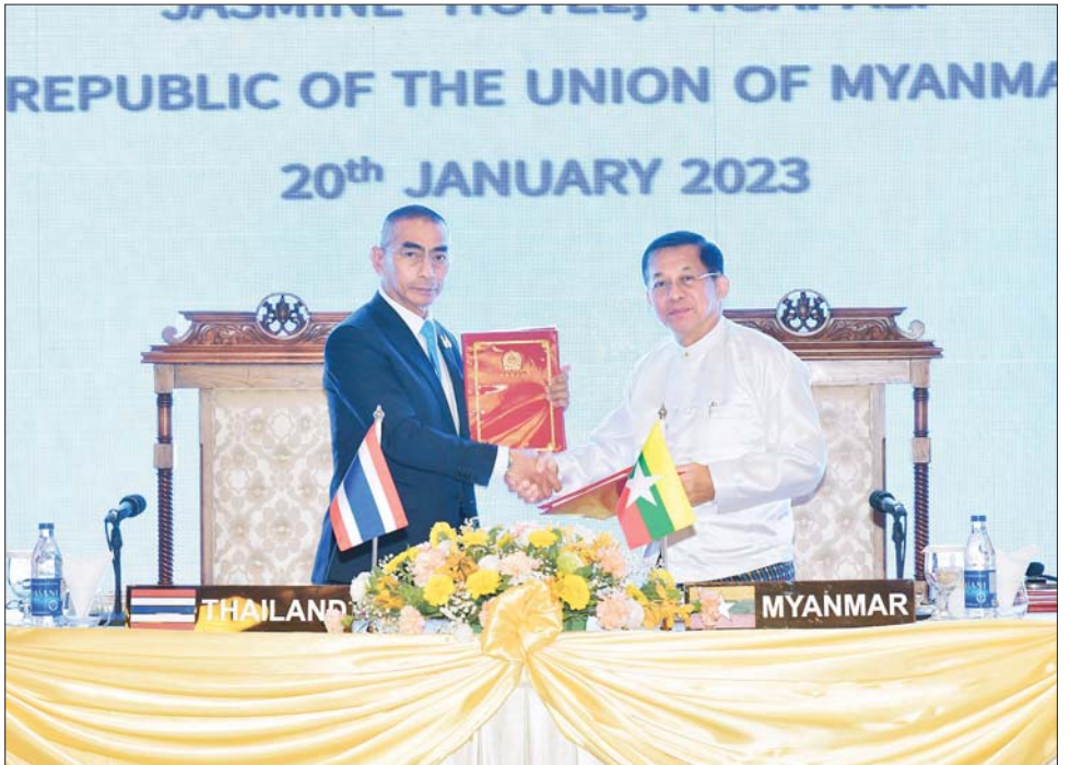
နိုင်ငံတော်စီမံအုပ်ချုပ်ရေးကောင်စီဥက္ကဋ္ဌ တပ်မတော်ကာကွယ်ရေးဦးစီးချုပ် ဗိုလ်ချုပ်မှူးကြီး မင်းအောင်လှိုင်နှင့် ထိုင်းဘုရင့်တပ်မတော်ကာကွယ်ရေးဦးစီးချုပ် General Chalermphon Srisawasdi တို့ အစည်းအဝေးသဘောတူညီချက်များ အတည်ပြုလက်မှတ်ရေးထိုးပြီး လဲလှယ်ကြစဉ်။