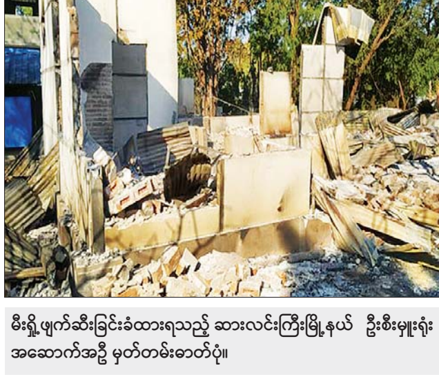
မီးရှို့ဖျက်ဆီးခြင်းခံထားရသည့် ဆားလင်းကြီးမြို့နယ် ဦးစီးမှူးရုံး အဆောက်အဦ မှတ်တမ်းဓာတ်ပုံ။