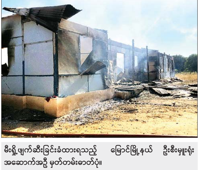
မီးရှို့ဖျက်ဆီးခြင်းခံထားရသည့် မြောင်မြို့နယ် ဦးစီးမှူးရုံး အဆောက်အဦ မှတ်တမ်းဓာတ်ပုံ။