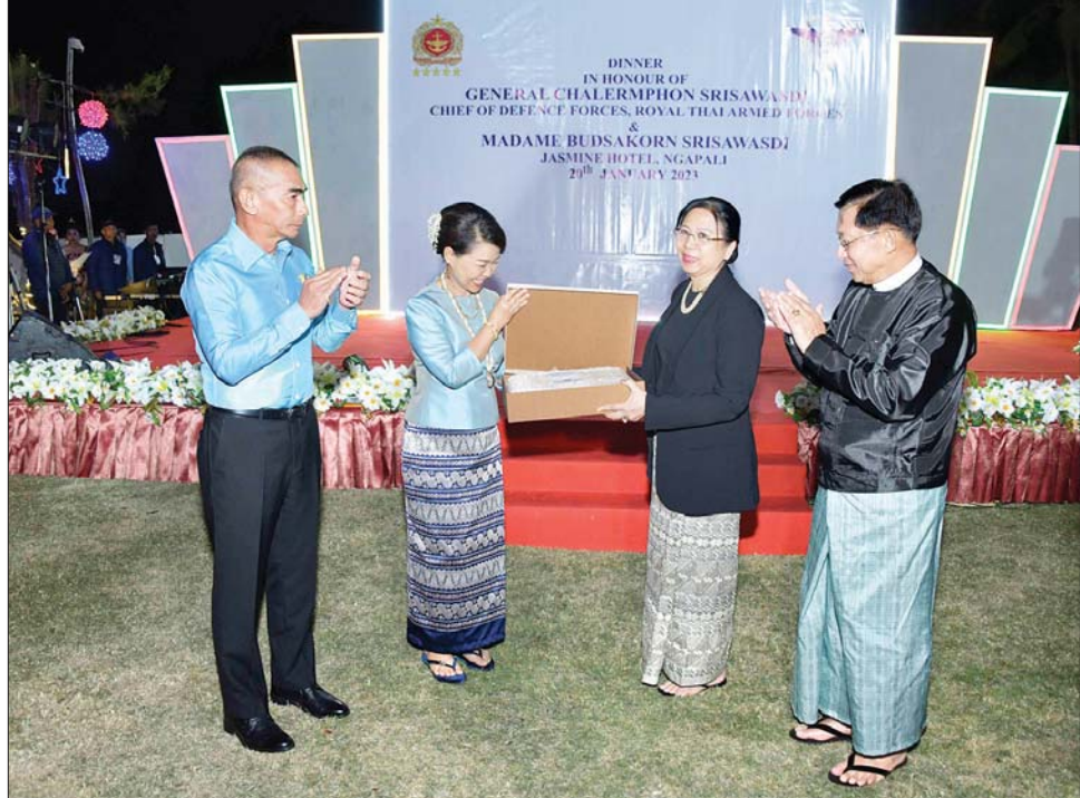
နိုင်ငံတော်စီမံအုပ်ချုပ်ရေးကောင်စီဥက္ကဋ္ဌ တပ်မတော်ကာကွယ်ရေးဦးစီးချုပ်၏ ဇနီး ဒေါ်ကြူကြူလှနှင့် ထိုင်းဘုရင့်တပ်မတော်ကာကွယ်ရေးဦးစီးချုပ်၏ ဇနီး Madame Budsakorn Srisawasdi တို့ အမှတ်တရလက်ဆောင်ပစ္စည်းများ အပြန်အလှန် ပေးအပ်စဉ်။