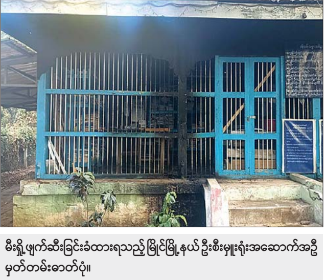
မီးရှို့ဖျက်ဆီးခြင်းခံထားရသည့် မြိုင်မြို့နယ် ဦးစီးမှူးရုံးအဆောက်အဦ မှတ်တမ်းဓာတ်ပုံ။