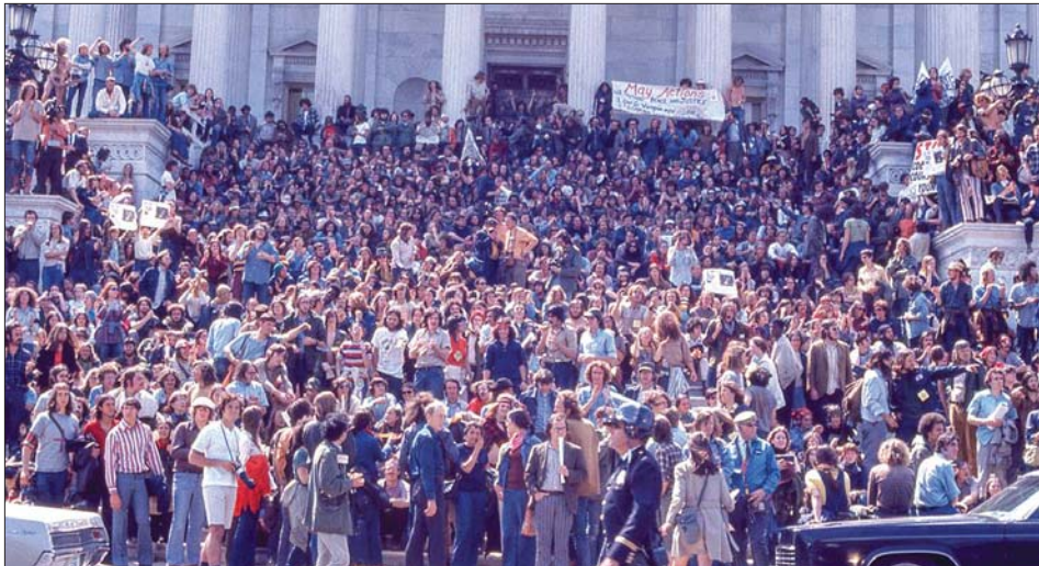
၁၉၇၁ ခုနှစ် မေ ၁ ရက်က ဝါရှင်တန်ဒီစီ၌ ထောင်နှင့်ချီသော စစ်ဆန့်ကျင်ရေး ဆန္ဒပြသူများ ဗီယက်နမ် စစ်ပွဲကို ဆန့်ကျင်ဆန္ဒပြရန် စုဝေးစဉ်။

ဟာ ကူဝိတ်ကို ထပ်မံကျူးကျော် ဝင်ရောက် တိုက်ခိုက်ချိန်မှာတော့ ကမ္ဘာ့အခင်းအကျင်းဟာ ပြောင်းပြန်ဖြစ်သွားခဲ့ပါတယ်။ ရေနံသယ်ဇာတ ပေါ်ကြွယ်ဝတဲ့ ကူဝိတ်နဲ့ ဆော်ဒီအပေါ်အဝင် အရှေ့ အလယ်ပိုင်းက မဟာမိတ်တွေကို ကာကွယ်ပေးဖို့ အမေရိကန်နဲ့ အနောက်အုပ်စုနိုင်ငံတွေဟာ အီရတ်နဲ့ ဆက်ဒမ်ဟူစ်နီကို ရန်သူတော်ကြီးအဖြစ် စာရင်းသွင်းပြီး ပင်လယ်ကွေ့စစ်ပွဲကို ဆင်နွှဲခဲ့ပြန်ပါတယ်။ ၂၀၀၃ ခုနှစ်မှာတော့ တားမြစ်ထားတဲ့ အစုလိုက်အပြုံလိုက် သေကျေပျက်စီးစေမယ့် WMD လက်နက်တွေ ထုတ်လုပ်အသုံးပြုနေတယ်ဆိုတဲ့ စွပ်စွဲချက်နဲ့ အမေရိကန်နဲ့ အပေါင်းပါနိုင်ငံအချို့ဟာ အီရတ်နိုင်ငံကို ကျူးကျော်ဝင်ရောက် တိုက်ခိုက်ပြီး ဆက်ဒမ်ဟူစ်နီ အစိုးရကို ဖြုတ်ချခဲ့ပါတယ်။