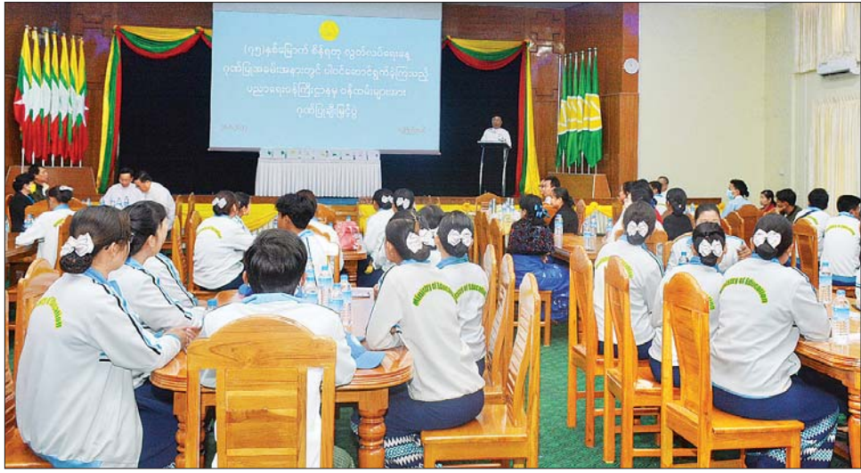
ဆက်လက်၍ ပြည်ထောင်စု ဝန်ကြီးက တက်ရောက်လာကြ သည့်ဝန်ထမ်းများကို ဂုဏ်ပြုဆု ငွေများပေးအပ်ချီးမြှင့်သည်။ ယင်းနောက် ပြည်ထောင်စု ဝန်ကြီး ဒေါက်တာညွန့်ဖေသည် ဒုတိယဝန်ကြီးများ၊ အမြဲတမ်း အတွင်းဝန်၊ ညွှန်ကြားရေးမှူး ချုပ်များ၊ ဒုတိယညွှန်ကြားရေးမှူး ချုပ်များ၊ ညွှန်ကြားရေးမှူးများ (၇၅) နှစ်မြောက် စိန်ရတု လွတ်လပ်ရေးနေ့ အခမ်းအနား တွင် ပညာရေးဝန်ကြီးဌာန ကိုယ်စားပြု ပါဝင်ဆောင်ရွက် ခဲ့ကြသည့် အရာထမ်း၊ အမှုထမ်း များနှင့်အတူ ဂုဏ်ပြုနေ့လယ်စာ အတူတကွ သုံးဆောင်ခဲ့ကြ ကြောင်း သိရသည်။ သတင်းစဉ်

မြောက် စိန်ရတုလွတ်လပ်ရေးနေ့ အခမ်းအနားသည် ကမ္ဘာက အသိအမှတ်ပြုရသည့် သမိုင်းတွင် မည့် ဂုဏ်ယူဖွယ် အခမ်းအနား ကြီး ဖြစ်ပြီး အောင်မြင်စွာကျင်းပ နိုင်ခဲ့ခြင်းသည် ဝန်ထမ်းများ၏ စည်းလုံးညီညွတ်မှု စွမ်းပကား ကြောင့် ဖြစ်ပါကြောင်း၊ သို့ဖြစ်၍ အဘက်ဘက်မှ ဝိုင်းဝန်းပံ့ပိုးပေး ခဲ့ကြသည့် ဝန်ထမ်းများကို မှတ် တမ်းတင် ဂုဏ်ပြုအပ်ပါကြောင်း ပြောကြားသည်။(ယာပုံ) ယင်းနောက် ပြည်ထောင်စု ဝန်ကြီးက စစ်ရေးပြတပ်ခွဲတွင် ပါဝင်ခဲ့သည့် ဝန်ထမ်း ၁၈၃ ဦး အတွက် ဂုဏ်ပြုမှတ်တမ်းလွှာများ ပေးအပ်ရာ ဝန်ထမ်းများကိုယ်စား ဦးစီးဌာနများမှ ကိုယ်စားလှယ် များက လက်ခံရယူကြသည်။