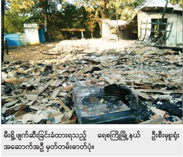
မီးရှို့ဖျက်ဆီးခြင်းခံထားရသည့် ရေစကြိုမြို့နယ် ဦးစီးမှူးရုံး အဆောက်အဦ မှတ်တမ်းဓာတ်ပုံ။