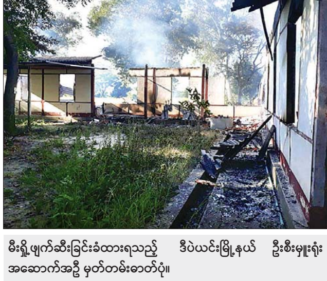
မီးရှို့ဖျက်ဆီးခြင်းခံထားရသည့် ဒီပဲယင်းမြို့နယ် ဦးစီးမှူးရုံး အဆောက်အဦ မှတ်တမ်းဓာတ်ပုံ။