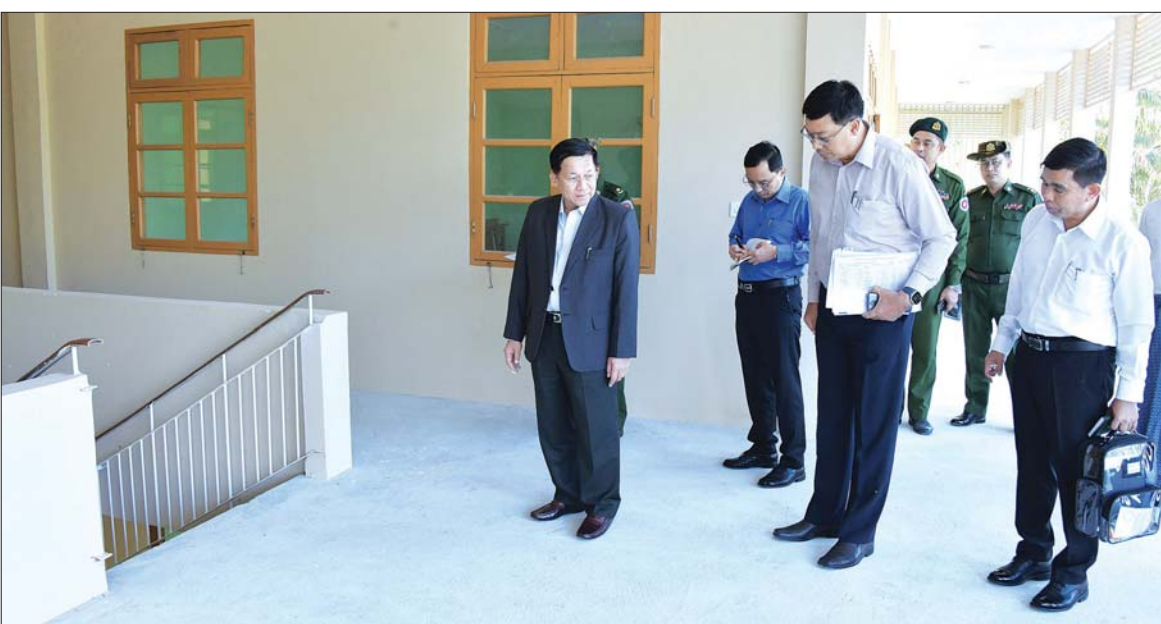
နိုင်ငံတော်စီမံအုပ်ချုပ်ရေးကောင်စီဥက္ကဋ္ဌ နိုင်ငံတော်ဝန်ကြီးချုပ် ဗိုလ်ချုပ်မှူးကြီး မင်းအောင်လှိုင် သံတွဲမြို့ရှိ အောင်စစ်သည် အပန်းဖြေစခန်း(လင်းသာ) တည်ဆောက်ထားရှိမှုအခြေအနေများကို ကြည့်ရှုစစ်ဆေးစဉ်။

နိုင်ငံတော်ဝန်ကြီးချုပ်က ခရီးသွားလုပ်ငန်း ဖွံ့ဖြိုးတိုးတက်ရေးအတွက် ဆွေးနွေး ပြောကြားရာတွင် ခရီးသွားလုပ်ငန်းသည် အသေးစား၊ အငယ်စားနှင့် အလတ်စား စီးပွားရေး MSME လုပ်ငန်းများတွင် ပါဝင်ပြီး နိုင်ငံတော်အနေဖြင့် MSME လုပ်ငန်းများကို အားပေးဆောင်ရွက် လျက်ရှိကြောင်း၊ MSME လုပ်ငန်းများတွင် ထုတ်လုပ်မှု၊ ရောင်းဝယ်မှုနှင့် ဝန်ဆောင်မှု ဟူ၍ရှိကြောင်း၊ ခရီးသွားလုပ်ငန်းတွင် ခရီးသွားသူများနှင့် ခရီးသွားဝန်ဆောင်မှု လုပ်ငန်းရှင်များအချင်းချင်း နှစ်ဦးနှစ်ဖက် နားလည်မှုဖြင့် ပူးပေါင်းဆောင်ရွက်ရန် လိုအပ်ပြီး စနစ်တကျရှိရန်လိုကြောင်း၊ သယ်ယူပို့ဆောင်ရေး၊ ချက်ပြုတ်ကျွေးမွေး ရေးနှင့် တစ်ဦးချင်းဝန်ဆောင်မှုပေးရသည့် လုပ်ငန်းများ၊ အသုံးအဆောင်ပစ္စည်းများ နှင့် လက်ဆောင်ပစ္စည်းများ ထုတ်လုပ် သည့် လုပ်ငန်းများလည်း ပါဝင်ကြောင်း၊ အလားတူပတ်ဝန်းကျင်သန့်ရှင်းသာယာ လှပရေးသည်လည်း အရေးကြီးသည့် အချက်တစ်ခုဖြစ်ပြီး ငပလီကမ်းခြေသည် သာယာလှပသည့် ကမ်းခြေတစ်ခုဖြစ် ကာ ပြည်ပခရီးသွားဧည့်သည်များကပင် ချီးကျူးနှစ်သက်ရသည့် ကမ်းခြေတစ်ခု ဖြစ်ကြောင်း၊ ထို့ကြောင့် မိမိတို့၏ရှိပြီးသား ဖြစ်သည့် အားသာချက်များကို အသုံးပြုပြီး ခရီးသွားဧည့်သည်တို့၏ သဘောသဘာဝ ကို သိရှိအောင်ဆောင်ရွက်ကာ ဒေသတွင်း သို့ ခရီးသွားများ ပိုမိုဝင်ရောက်စေရေး လုပ်ဆောင်ကြရန်လိုကြောင်း။