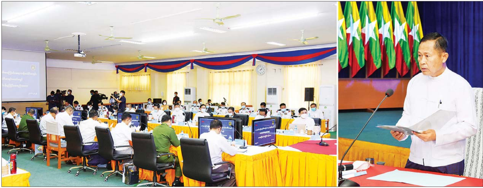
နိုင်ငံတော်စီမံအုပ်ချုပ်ရေးကောင်စီ ဒုတိယဥက္ကဋ္ဌ ဒုတိယဝန်ကြီးချုပ် ဒုတိယဗိုလ်ချုပ်မှူးကြီး စိုးဝင်း ဗဟိုသန်းခေါင်စာရင်းကော်မရှင် ပထမအကြိမ်လုပ်ငန်းညှိနှိုင်းအစည်း အဝေးတွင် အမှာစကားပြောကြားစဉ်။

နေပြည်တော် ဇန်နဝါရီ ၂၀ ၂၀၂၄ ခုနှစ် လူဦးရေနှင့် အိမ် အကြောင်းအရာ သန်းခေါင် စာရင်း၊ ဗဟိုသန်းခေါင်စာရင်း ကော်မရှင်၏ ပထမအကြိမ် လုပ်ငန်းညှိနှိုင်း အစည်းအဝေး ကို ယနေ့ မွန်းလွဲ ၂ နာရီတွင် နေပြည်တော်ရှိ လူဝင်မှုကြီးကြပ် ရေးနှင့် ပြည်သူ့အင်အား ဝန်ကြီး ဌာန အစည်းအဝေးခန်းမ၌ ကျင်းပရာ ဗဟိုသန်းခေါင်စာရင်း ကော်မရှင်နာယက နိုင်ငံတော် စီမံအုပ်ချုပ်ရေးကောင်စီ ဒုတိယ ဥက္ကဋ္ဌ ဒုတိယဝန်ကြီးချုပ် ဒုတိယဗိုလ်ချုပ်မှူးကြီး စိုးဝင်း တက်ရောက် အမှာစကားပြော ကြားသည်။ စာမျက်နှာ ၉ ကော်လံ ၁ □