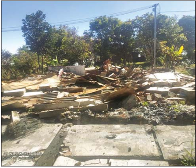
မီးရှို့ဖျက်ဆီးခြင်းခံထားရသည့် ကန်ပက်လက်မြို့နယ်ဦးစီးမှူးရုံး မှတ်တမ်းဓာတ်ပုံ။