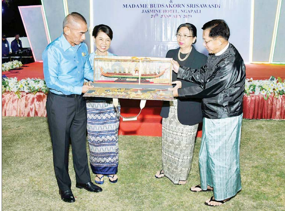
နိုင်ငံတော်စီမံအုပ်ချုပ်ရေးကောင်စီဥက္ကဋ္ဌ တပ်မတော်ကာကွယ်ရေးဦးစီးချုပ် ဗိုလ်ချုပ်မှူးကြီး မင်းအောင်လှိုင်နှင့် ထိုင်းဘုရင့်တပ်မတော်ကာကွယ်ရေးဦးစီးချုပ် General Chalermphon Srisawasdi တို့ အမှတ်တရလက်ဆောင်ပစ္စည်းများ အပြန်အလှန် ပေးအပ်စဉ်။