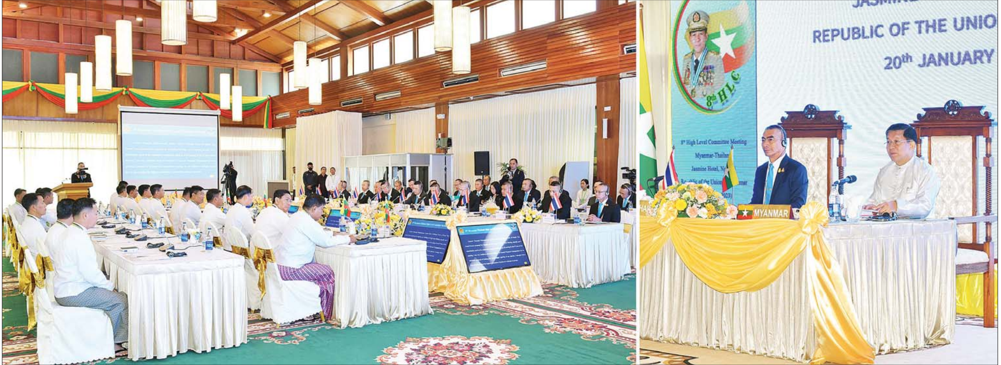
(၈) ကြိမ်မြောက် မြန်မာ - ထိုင်း တပ်မတော်နှစ်ရပ်အကြား အဆင့်မြင့်အရာရှိကြီးများ အစည်းအဝေးကျင်းပစဉ်။

နေပြည်တော် ဇန်နဝါရီ ၂၀ နံနက်ပိုင်းတွင် ရခိုင်ပြည်နယ် သံတွဲမြို့ရှိ Jasmine Ngapali Resort မင်းအောင်လှိုင်နှင့် ထိုင်းဘုရင့်တပ်မတော် ကာကွယ်ရေးဦးစီးချုပ် မြန်မာနိုင်ငံက အိမ်ရှင်အဖြစ် လက်ခံကျင်းပသည့် (၈) ကြိမ်မြောက် ဌ် ကျင်းပပြုလုပ်သည်။ General Chalermphon Srisawasdi တို့သည် သီးခြားတွေ့ဆုံ၍ မြန်မာ - ထိုင်း တပ်မတော်နှစ်ရပ်အကြား အဆင့်မြင့်အရာရှိကြီးများ အစည်းအဝေးမတင်မီ နိုင်ငံတော်စီမံအုပ်ချုပ်ရေးကောင်စီ တပ်မတော်နှစ်ရပ်အကြား ရှေ့ဆက်ဆောင်ရွက်မည့် ကိစ္စရပ်များကို အစည်းအဝေး 8 th High Level Committee Meeting ကို ယနေ့ ဥက္ကဋ္ဌ တပ်မတော်ကာကွယ်ရေးဦးစီးချုပ် ဖိုလ်ချုပ်မှူးကြီး ဆွေးနွေးကြသည်။ စာမျက်နှာ ၃ ကော်လံ ၁ ❖