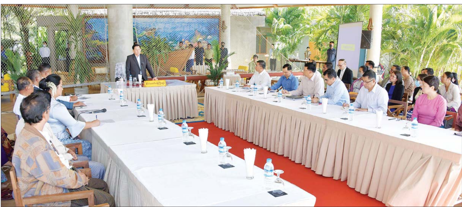
နိုင်ငံတော်စီမံအုပ်ချုပ်ရေးကောင်စီဥက္ကဋ္ဌ နိုင်ငံတော်ဝန်ကြီးချုပ် ဗိုလ်ချုပ်မှူးကြီး မင်းအောင်လှိုင် သံတွဲမြို့နယ်အတွင်းရှိ ဟိုတယ်နှင့်ခရီးသွားလုပ်ငန်းရှင်များအား တွေ့ဆုံပွဲတွင် ဆွေးနွေးပြောကြားစဉ်။

နေပြည်တော် ဇန်နဝါရီ ၂၀ နိုင်ငံတော်စီမံအုပ်ချုပ်ရေးကောင်စီ ဥက္ကဋ္ဌ နိုင်ငံတော်ဝန်ကြီးချုပ် ဗိုလ်ချုပ်မှူးကြီး မင်းအောင်လှိုင်သည် ရခိုင်ပြည်နယ် သံတွဲမြို့နယ်အတွင်းရှိ ဟိုတယ်နှင့်ခရီးသွား လုပ်ငန်းရှင်များအား ယနေ့ မွန်းလွဲပိုင်းတွင် သံတွဲမြို့ရှိ Pristine Mermaid Resort ဧည့်ခန်းမဆောင်၌ တွေ့ဆုံ၍ ခရီးသွားလုပ်ငန်းဖွံ့ဖြိုးတိုးတက်ရေးနှင့် ဒေသဖွံ့ဖြိုးတိုးတက်ရေးဆိုင်ရာများကို ဆွေးနွေးသည်။