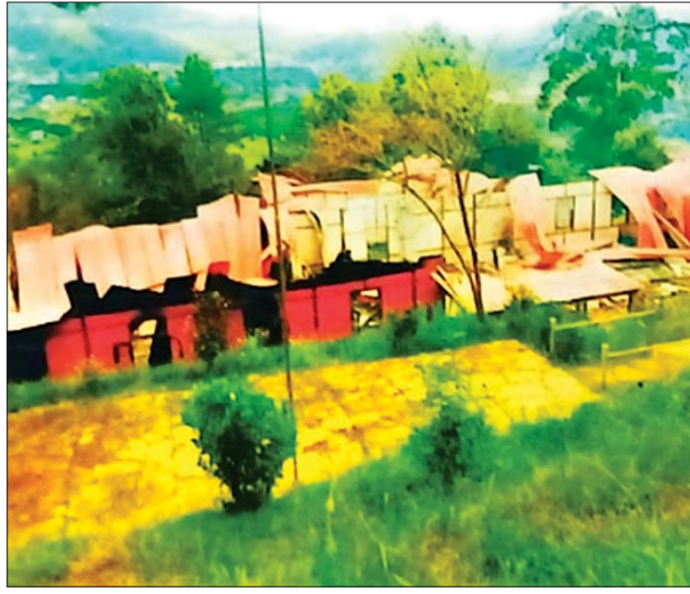
မီးလောင်ခုံးဖြင့် ပစ်ခတ်မီးရှို့ဖျက်ဆီးခြင်းခံရသည့် ချင်းပြည်နယ် ဦးစီးမှူးရုံးအဆောက်အဦ မှတ်တမ်းဓာတ်ပုံ။

အကြမ်းဖက်အဖွဲ့များအနေဖြင့် ဌာနဆိုင်ရာရုံးများအား ယခုကဲ့သို့ မိုင်းထောင်ဖောက်ခွဲ၊ မီးရှို့ဖျက်ဆီးခြင်းများလုပ်ဆောင်နေမှုအပေါ် ပြည်သူလူထုတစ်ရပ်လုံးအနေဖြင့် နိုင်ငံတော်ဖွံ့ဖြိုးတိုးတက်ရေးနှင့် တည်ငြိမ်အေးချမ်းရေးအတွက် ပူးပေါင်းကာကွယ်သွားကြပါရန်နှင့် အကြမ်းဖက်သမားများ၏ လှုပ်ရှားမှုသတင်းများကို ရရှိပါက နီးစပ်ရာလိုခြံရေးတပ်ဖွဲ့ဝင်များထံသို့ လျှို့ဝှက်စွာ ဆက်သွယ်သတင်းပေးပို့၍ အကြမ်းဖက်သမားများ ရပ်တည်မှုမရှိနိုင်သည်အထိ ဝိုင်းဝန်းပူးပေါင်း ဆောင်ရွက်သွားကြပါရန် မေတ္တာရပ်ခံထားကြောင်း သိရသည်။ သတင်းစဉ်