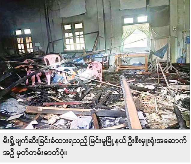
မီးရှို့ဖျက်ဆီးခြင်းခံထားရသည့် မြင်းမူမြို့နယ် ဦးစီးမှူးရုံးအဆောက်အဦ မှတ်တမ်းဓာတ်ပုံ။