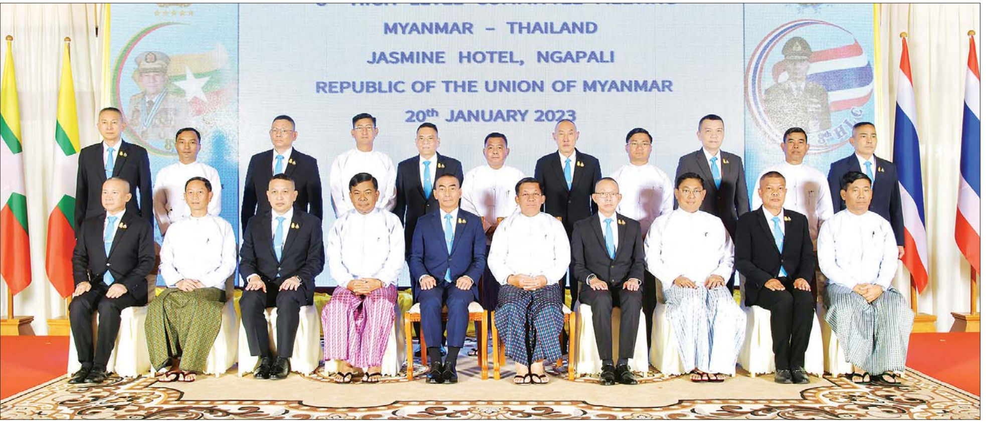
နိုင်ငံတော်စီမံအုပ်ချုပ်ရေးကောင်စီဥက္ကဋ္ဌ တပ်မတော်ကာကွယ်ရေးဦးစီးချုပ် ဗိုလ်ချုပ်မှူးကြီး မင်းအောင်လှိုင်နှင့် ထိုင်းဘုရင့်တပ်မတော်ကာကွယ်ရေးဦးစီးချုပ် General Chalermpphon Srisawasdi တို့ အစည်းအဝေး တက်ရောက်လာကြသူများနှင့်အတူ စုပေါင်းမှတ်တမ်းတင်ဓာတ်ပုံရိုက်စဉ်။