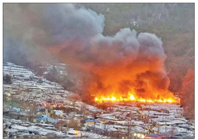
တောင်ကိုရီးယားနိုင်ငံ ဆိုးလ်မြို့တော်ရှိ ဂေါ်ယောင်းမြို့ပြင်ရပ်ကွက်၌ မီးလောင်နေမှုကို တွေ့ရစဉ်။

ဂျပန်ဝန်ကြီးချုပ် ဖူမိယို ကိုရိုဒါသည် လာမည့်သီတင်းပတ် ပုံမှန်လွှတ်တော် အစည်းအဝေး၏ ဖွင့်ပွဲတွင် ၎င်း၏ မိန့်ခွန်းအတွင်း ဂျပန်နိုင်ငံ၏ ကလေးမွေးဖွားမှုနှုန်း လျော့နည်းလာခြင်းကို တိုက်ဖျက်ရန်အတွက် မူဝါဒများ ဖော်ဆောင်ရန် ရန်ပုံငွေရရှိရေး ကတိပြုခဲ့ကြောင်း သိရသည်။