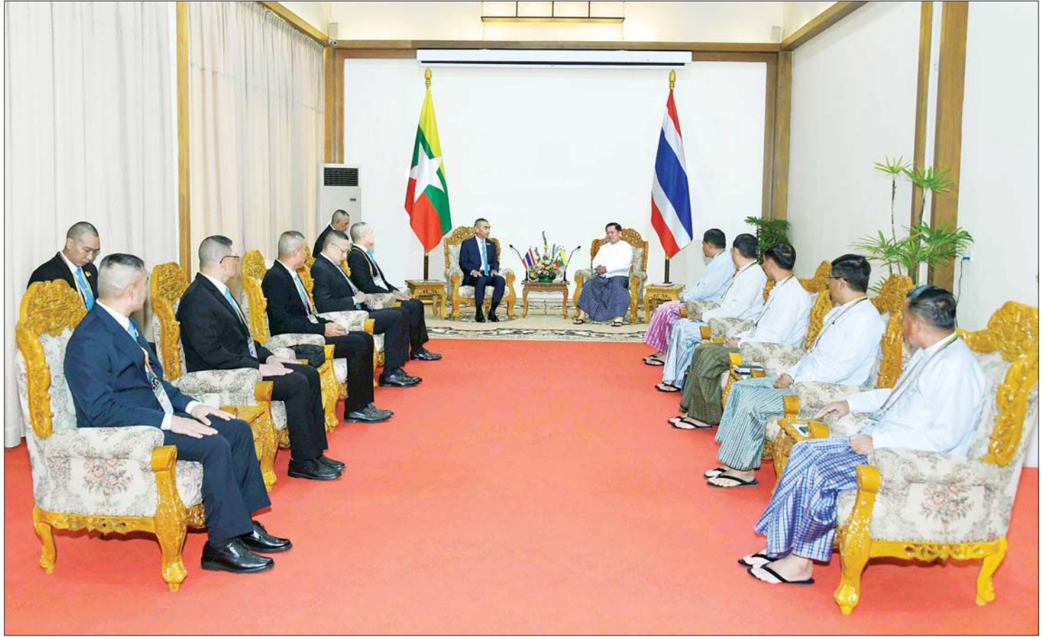
နိုင်ငံတော်စီမံအုပ်ချုပ်ရေးကောင်စီဥက္ကဋ္ဌ တပ်မတော်ကာကွယ်ရေးဦးစီးချုပ် ဗိုလ်ချုပ်မှူးကြီး မင်းအောင်လှိုင်နှင့် ထိုင်းဘုရင့်တပ်မတော်ကာကွယ်ရေး ဦးစီးချုပ် General Chalermphon Srisawasdi တို့ သီးခြားတွေ့ဆုံဆွေးနွေးစဉ်။

ယခုကျင်းပပြုလုပ်သည့် (၈) ကြိမ်မြောက် မြန်မာ - ထိုင်း တပ်မတော်နှစ်ရပ်အကြား အဆင့်မြင့်