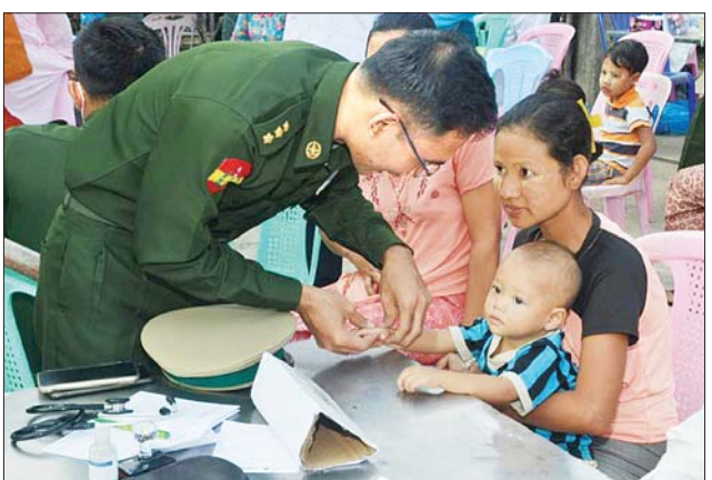
နှင့် ပတ်ဝန်းကျင်ကျေးရွာများမှ ရောဂါမှ လုပ်ငန်းများ စတင် ဒေသခံပြည်သူ ၂၃၁ ဦးကို ယင်း ဆောင်ရွက်ပေးသည်။ ကျေးရွာ၌ ကျန်းမာရေး စောင့် ထိုသို့ ဆောင်ရွက်ပေးရာတွင်

နေပြည်တော် ဇန်နဝါရီ ၁၈ ဧရာဝတီတိုင်းဒေသကြီး ဧရာဝတီမြစ်ကြောင်း တစ်လျှောက်ရှိ မြစ်ဝကျွန်းပေါ် ကျေးရွာများမှ ဒေသခံပြည်သူများကို ကျန်းမာရေး စောင့်ရှောက်မှု လုပ်ငန်းများ ဆောင်ရွက်ပေးရန် တပ်မတော် နယ်လှည့် အထူးကုဆေးအဖွဲ့မှ ပါရဂူများ၊ ဆေးမှူးများနှင့် သူနာပြုများ ပါဝင်သော တပ်မတော် မြစ်တွင်းသွား ဆေးရုံရေယာဉ် (ရွှေပုဇွန်) နှင့် မြစ်ရေယာဉ် (စကု) တို့သည် ယနေ့တွင် ညောင်တုန်းမြို့နယ် ဆားမလောက်ကျေးရွာ