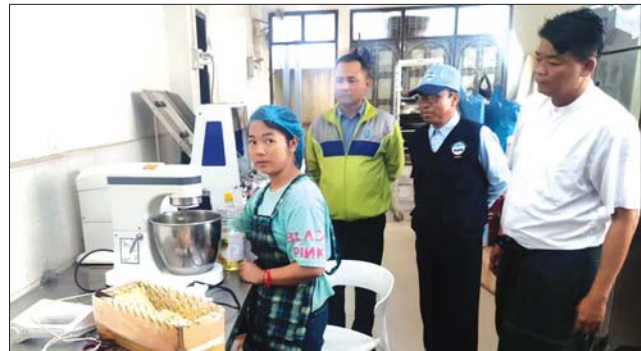
တာချီလိတ်မြို့၌ ထုတ်လုပ်ဖြန့်ဖြူးနေသော မုန့်လုပ်ငန်းများ ကွင်းဆင်းစစ်ဆေး

ထို့နောက် “ဝ” ကိုယ်ပိုင်အုပ်ချုပ်ခွင့်ရ တိုင်းစီမံအုပ်ချုပ်ရေးအဖွဲ့ ဥက္ကဋ္ဌ ပြည်နယ် ဦးစီးမှူးနှင့် တာဝန်ရှိသူများက အဆောက် အအုံကို ဖဲကြိုးဖြတ်ဖွင့်လှစ်ပေးပြီး ကမ္ဘည်း ကြေးပြားကို အမွှေးနံ့သာရည်တို့ဖြင့် ပက်ဖျန်း ပေးသည်။ အဆိုပါ အဆောက်အအုံသည် အာစီနစ်ထပ်အဆောက်အအုံဖြစ်ပြီး ခဲခေါင်- လန်ချန်းဒေသ ပူးပေါင်းဆောင်ရွက်မှု ၂၀၂၁ ခုနှစ် အထူးရန်ပုံငွေဖြင့် ဆောက်လုပ်ခဲ့ခြင်း ဖြစ်ကြောင်း သိရသည်။ ခရိုင်(ပြန်/ဆက်)