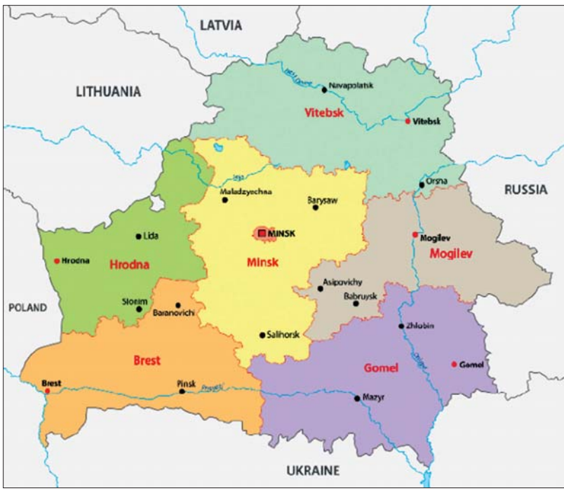
ဘီလာရုစ်နိုင်ငံ၏ အုပ်ချုပ်ရေးဒေသများ မြေပုံ။

တရားစီရင်ရေးကဏ္ဍတွင် ဖွဲ့စည်းပုံအခြေခံဥပဒေဆိုင်ရာ တရားရုံးနှင့် အထွေထွေတရားစီရင်