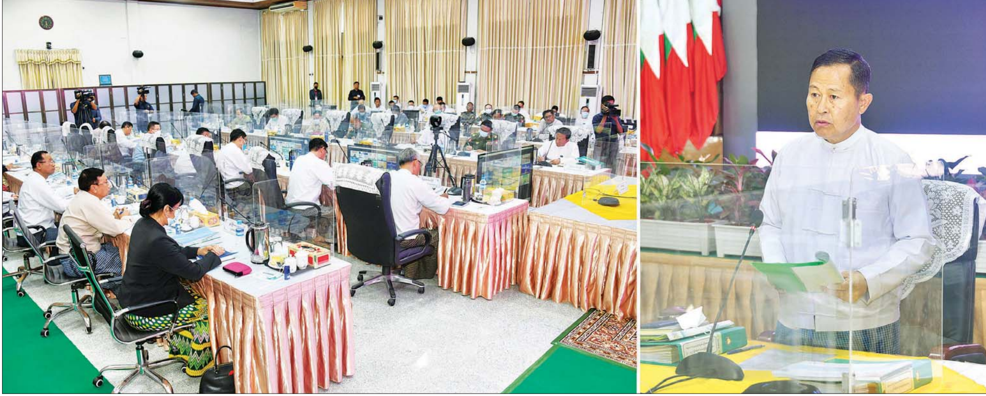
တရားမဝင်ကုန်သွယ်မှု တိုက်ဖျက်ရေးဦးဆောင်ကော်မတီဥက္ကဋ္ဌ နိုင်ငံတော်စီမံအုပ်ချုပ်ရေးကောင်စီဒုတိယဥက္ကဋ္ဌ ဒုတိယဝန်ကြီးချုပ် ဒုတိယဗိုလ်ချုပ်မှူးကြီး စိုးဝင်း တရားမဝင် ကုန်သွယ်မှုတိုက်ဖျက်ရေး ဦးဆောင်ကော်မတီ လုပ်ငန်းညှိနှိုင်းအစည်းအဝေး (၁/၂၀၂၃)တွင် အမှာစကားပြောကြားစဉ်။

နေပြည်တော် ဇန်နဝါရီ ၁၈ တရားမဝင် ကုန်သွယ်မှုတိုက်ဖျက်ရေးဦးဆောင်ကော်မတီ လုပ်ငန်းညှိနှိုင်းအစည်းအဝေး (၁/၂၀၂၃) ကို ယနေ့ မွန်းလွဲ ၂ နာရီတွင် နေပြည်တော်ရှိ စီးပွားရေးနှင့် ကူးသန်းရောင်းဝယ်ရေးဝန်ကြီးဌာန အစည်းအဝေးခန်းမ၌ ကျင်းပရာ တရားမဝင်ကုန်သွယ်မှု တိုက်ဖျက်ရေးဦးဆောင်ကော်မတီဥက္ကဋ္ဌ နိုင်ငံတော်စီမံအုပ်ချုပ်ရေးကောင်စီဒုတိယဥက္ကဋ္ဌ ဒုတိယဝန်ကြီးချုပ် ဒုတိယဗိုလ်ချုပ်မှူးကြီး စိုးဝင်း တက်ရောက်အမှာစကားပြောကြားသည်။