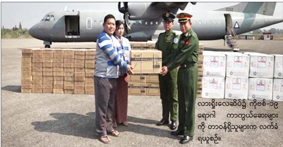
လားရှိုးလေဆိပ်၌ ကိုဗစ်-၁၉ ရောဂါ ကာကွယ်ဆေးများကို တာဝန်ရှိသူများက လက်ခံရယူစဉ်။

နေပြည်တော် ဇန်နဝါရီ ၁၈ ကိုဗစ်-၁၉ ရောဂါ ကာကွယ်ဆေးများကို သတ်မှတ်အစားအလမ်းကြောင်း စံချိန်စံညွှန်းများအတိုင်း တိုင်းဒေသကြီးနှင့် ပြည်နယ်အသီးသီးသို့ တပ်မတော်လေယာဉ်များ၊ ရဟတ်ယာဉ်များ၊ Cold Chain Delivery Logistics မော်တော်ယာဉ် ကြီးများဖြင့် ပို့ဆောင်ဖြန့်ဖြူးပေးလျက်ရှိသည်။ ထိုသို့ ပို့ဆောင်ဖြန့်ဖြူးပေးလျက်ရှိရာ ရန်ကုန်တိုင်းဒေသကြီး မရမ်းကုန်းမြို့နယ် မင်းဓမ္မလမ်းရှိ ပြည်သူ့ ကျန်းမာရေးဦးစီးဌာန ဗဟိုကာကွယ်ဆေး သိုလှောင်အခန်းတွင်ထားရှိသည့် ဆေးတစ်လုံးလျှင် လူငါးဦး ထိုးနှံနိုင်သော Myancopharm နှင့် Sinopharm ကိုဗစ်-၁၉ ရောဂါ ကာကွယ်ဆေးနှင့် ဆေးထိုးအပ်များကို ရခိုင်ပြည်နယ် စစ်တွေ