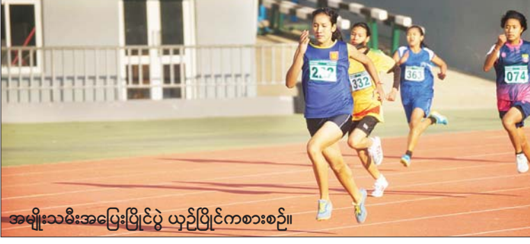
အမျိုးသမီးအပြေးပြိုင်ပွဲ ယှဉ်ပြိုင်ကစားစဉ်။

၂၀၂၂-၂၀၂၃ ပညာသင်နှစ် အခြေခံပညာကျောင်းသား အားကစားပွဲတော် အားကစားပြိုင်ပွဲများ စတင်ကျင်းပ နေပြည်တော် ဇန်နဝါရီ ၁၈ ၂၀၂၂-၂၀၂၃ ပညာသင်နှစ် အခြေခံပညာကျောင်းသားအားကစားပွဲတော်အား ဇန်နဝါရီ ၁၈ ရက်မှ ဇန်နဝါရီ ၂၇ ရက်အထိ နေပြည်တော်ရှိ ဝဏ္ဏသိဒ္ဓိအားကစားကွင်း၊ အားကစားရုံများတွင် ကျင်းပလျက်ရှိရာ ယနေ့နံနက်ပိုင်းမှစတင်ပြီး အားကစားနည်း များအလိုက် ယှဉ်ပြိုင်ကစားကြသည်။ စာမျက်နှာ ၁၂ ကော်လံ ၁၀