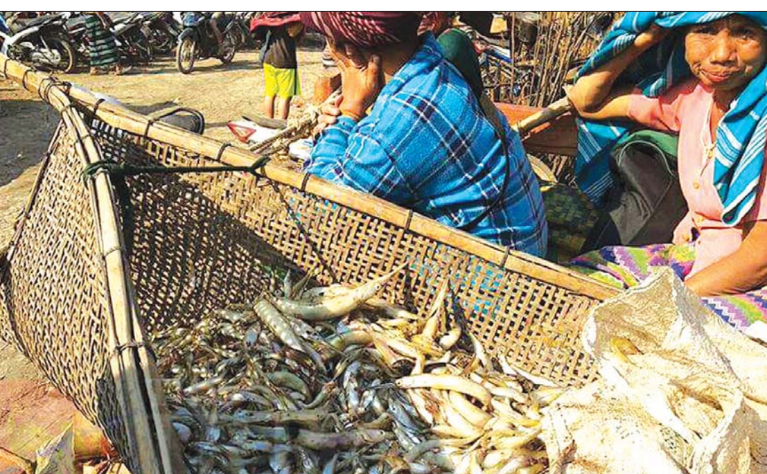
ဒေါင်ဒင်အင်းငါးဖမ်းပွဲတွင် ဖမ်းဆီးရမိသောငါးများ။

စာမျက်နှာ ၁၆ မှ စေတနာကြေး ပေးသွင်းရမည်ဖြစ်သည်။ ဖမ်းဆီးရမိသော ငါးများမှာ ငါးပတ်၊ ငါးမြွေထိုး၊ ငါးဖျင်းသလက်၊ ငါးစင်စပ်၊ ငါးဖောင်ရိုး၊ ငါးသံချိတ်၊ ငါးဖယ်၊ ငါးဖမ်းမ၊ ငါးရုံ၊ ငါးစင်ရိုင်း၊ ငါးမြစ်ချင်း၊ ငါးနုသန်း၊ ငါးမော့တော့၊ ငါးသိုင်းခေါင်းပွ၊ ရေချိုပုစွန်တုပ်ကြီးတို့ဖြစ်သည်။ မြစ်ကြီးမြစ်ငယ်အသွယ်သွယ်တို့၏ ပြုပြင်ဖန်တီးမှုများကြောင့် အင်းများ၊ အိုင်များ၊ ထုံးများ၊ ဂယက်များ ဝေါထွန်း လာခဲ့သည်။ အင်းအိုင် အမျိုးအစားများ တွင်လည်း မြစ်ကြောင်းအင်း၊ မြစ်စွတ် အင်း၊ မြစ်ကျိုးအင်း၊ ကုန်းအင်း၊ နွေအင်းများဟူ၍လည်း ဖြစ်လာသည်။ မြန်မာနိုင်ငံအနှံ့အပြားတွင်ရှိသော အင်း အမျိုးအစား မြောက်မြားစွာတို့တွင် တည်ရှိရာနေရာဒေသအလိုက် ငါးဖမ်း နည်းစနစ်များ၊ ငါးဖမ်းကိရိယာများ၊ ကွဲပြားခြားနားနိုင်သကဲ့သို့ အင်းအလိုက် ဒေသအလိုက် ကိုးကွယ်ယုံကြည်မှုများ မှာလည်း ဒေသတစ်ခုနှင့်တစ်ခု မတူညီ ဘဲ ကွဲပြားခြားနားကြောင်း တွေ့ရသည်။ ရိုးရာနတ်များကို နယ်မြေလေ့ ထုံးတမ်းများနှင့်အညီ ပူဇော်ပသလေ့ ရှိကြောင်း ပူဇော်ပသရန် ပျက်ကွက်ပါက ငါးမရသည့်အပြင် ဘေးဒုက္ခများရောက် ရှိမည်ဖြစ်ကြောင်း ရိုးရာအစွဲအလမ်းများ ယုံကြည်မှုများ ရှိနေကြသည်။ နယ်မြေဒေသအလိုက် အင်းအိုင်များနှင့် ပတ်သက်သည့် ရှေးအစဉ်အလာ ဒဏ္ဍာရီ ပုံပြင်များ၊ ရှေးစကားများကို ဒေသခံများ