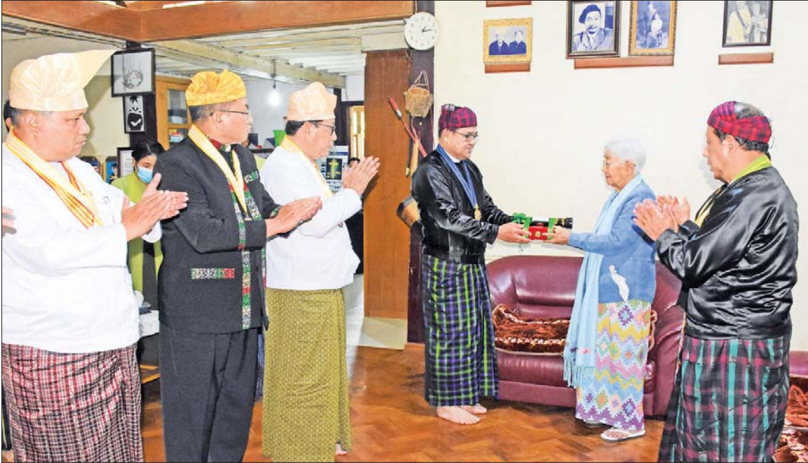
ကချင်ပြည်နယ် ဝန်ကြီးချုပ် ဦးခက်ထိန်နန် စည်သူဘွဲ့ရရှိသူ ဗိုလ်မှူးကြီး(ငြိမ်း) လဖိုင်ခွန်နော် (ကိုယ်စား) သမီးဖြစ်သူ ဒေါ်လဖိုင်နန်ခွဲ အား ဂုဏ်ထူးဆောင်တံဆိပ်နှင့် ဘွဲ့လက်မှတ် ချီးမြှင့်အပ်နှင်းစဉ်။