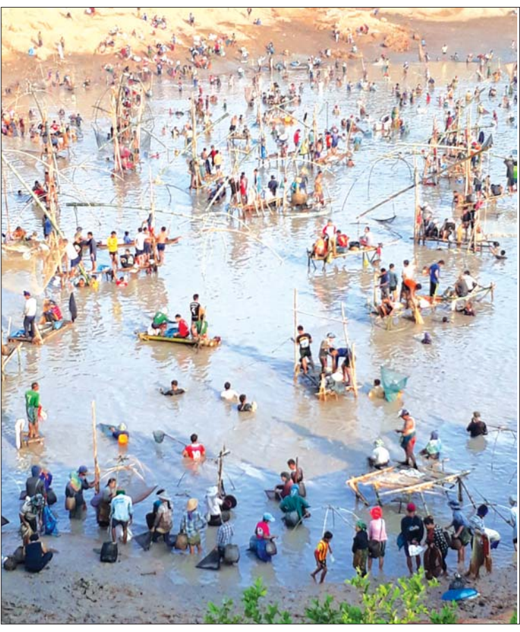
ခေါင်ဒင်အင်းငါးဖမ်းပွဲတော်။

မွန်ပြည်နယ်အတွင်း ဂရန်အင်းပေါင်း ၂၄ အင်းရှိရာ လေလံအင်း ၁၅ အင်း၊ ကြေးတိုင်အင်း ရှစ်အင်း၊ သုတေသနအင်း တစ်အင်းတို့ဖြစ်သည်။ ခေါင်ဒင်အင်း တည်နေရာမှာ မွန်ပြည်နယ် မော်လမြိုင် ခရိုင် ကျိုက်မရောမြို့နယ် ငပုအင်း ကျေးရွာအုပ်စု နယ်မြေအတွင်းရှိပြီး ငပု အင်းကျေးရွာအုပ်စု၊ ကျိုက္ခလှိုင်ကျေးရွာ အုပ်စု၊ ရေပူကော့စပ်ကျေးရွာအုပ်စုတို့ အကြားတွင် တည်ရှိသည်။ အင်းအကျယ် အဝန်းမှာ ၇၄ ဧကဖြစ်ပြီး အထွေထွေရေ ဝင်ရောက်ရာ ရေပေါ်ရေလျှံကွင်း ဧရိယာ အတွင်း ကျရောက်ပြီး ကုန်းတွင်းပိတ် အင်းဖြစ်သည်။ “ခေါင်ဒင်” ဟူသော မြည်သံကိုစွဲ၍ အမည်မှည့်ခေါ်ခြင်း ဖြစ်ကြောင်း ဒေသခံသက်ကြီးရွယ်အို များ၏ ပြောပြချက်အရ သိရသည်။ ကိုလိုနီခေတ် ကျေးရွာသူကြီးများခေတ် တွင် ကျိုက်မရောအာဏာပိုင်များထံမှ အင်းလေလံရယူခြင်းကို ကျေးရွာအလိုက် အလှည့်ကျရယူခဲ့ကြပြီး ငါးဖမ်းပွဲတော်