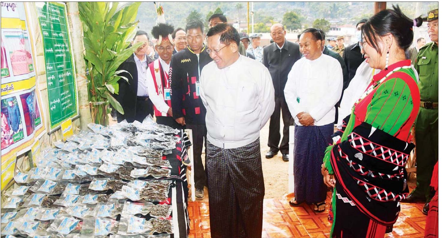
နိုင်ငံတော်စီမံအုပ်ချုပ်ရေးကောင်စီဥက္ကဋ္ဌ နိုင်ငံတော်ဝန်ကြီးချုပ် ဗိုလ်ချုပ်မှူးကြီး မင်းအောင်လှိုင်နှင့် အဖွဲ့ဝင်များ နာဂရိုးရာ ပြခန်းများအတွင်း လှည့်လည် ကြည့်ရှုစဉ်။

နာဂရိုးရာ နှစ်သစ်ကူးပွဲတော်အခမ်းအနားကို စတင်ကျင်းပပြုလုပ်ရာ အစီအစဉ်အရ နိုင်ငံတော် စီမံအုပ်ချုပ်ရေးကောင်စီဥက္ကဋ္ဌ နိုင်ငံတော်ဝန်ကြီးချုပ် က ဂုဏ်ပြုအမှာစကားပြောကြားရာတွင် ၂၀၂၃ ခုနှစ်