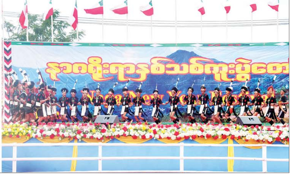
နိုင်ငံတော်စီမံအုပ်ချုပ်ရေးကောင်စီဥက္ကဋ္ဌ နိုင်ငံတော်ဝန်ကြီးချုပ် ဗိုလ်ချုပ်မှူးကြီး မင်းအောင်လှိုင်နှင့် အဖွဲ့ဝင်များ နာဂတိုင်းရင်းသူ၊ တိုင်းရင်းသားများ၏ သီဆိုကပြ ဖျော်ဖြေမှုများကို ကြည့်ရှုအားပေးစဉ်။