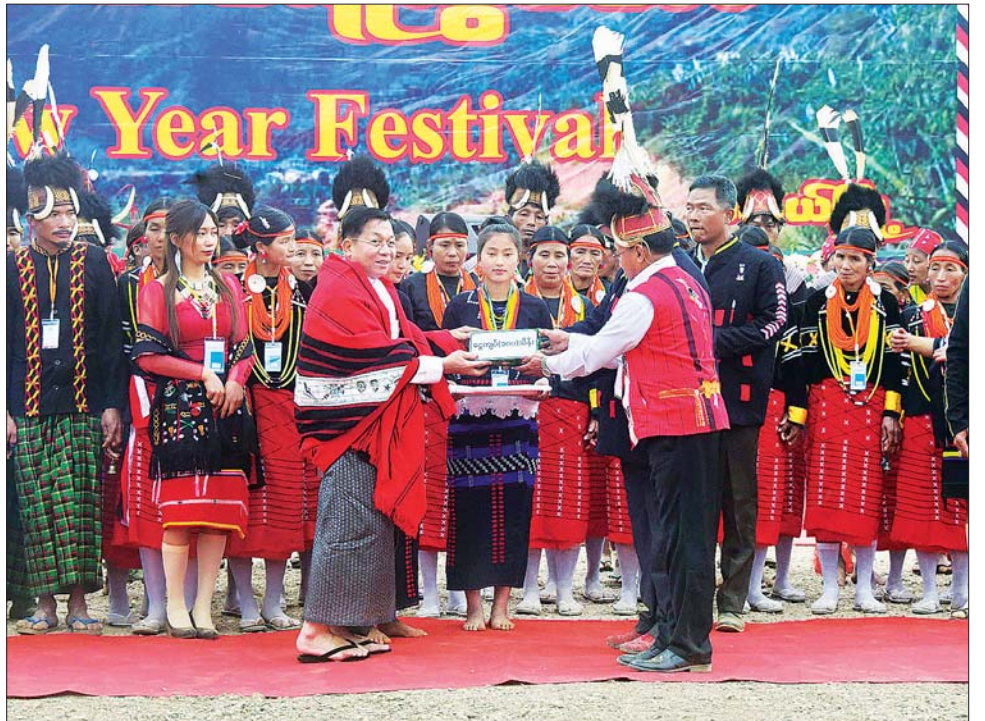
နိုင်ငံတော်စီမံအုပ်ချုပ်ရေးကောင်စီဥက္ကဋ္ဌ နိုင်ငံတော်ဝန်ကြီးချုပ် ဗိုလ်ချုပ်မှူးကြီး မင်းအောင်လှိုင် အား နာဂရိုးရာ စာပေနှင့် ယဉ်ကျေးမှုဗဟိုကော်မတီဥက္ကဋ္ဌ ဦးပေါင်ခဲ က နှစ်သစ်ကူးအမှတ်တရလက်ဆောင်ကို ဂါရဝပြုပေးအပ်စဉ်။