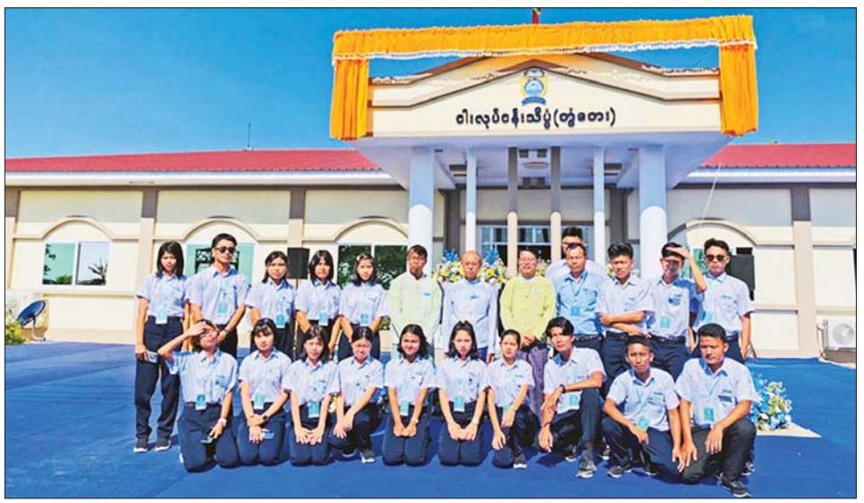
ရန်ကုန်တိုင်းဒေသကြီးဝန်ကြီးချုပ်နှင့် စိုက်ပျိုးရေး၊ မွေးမြူရေးနှင့် ဆည်မြောင်းဝန်ကြီးဌာန ဒုတိယဝန်ကြီးတို့က ငါးလုပ်ငန်းသိပ္ပံ (တွံတေး) ကျောင်းကို စက်ခလုတ်နှိပ်ဖွင့်လှစ်ပေးပြီး ကျောင်းသား ကျောင်းသူများနှင့် မှတ်တမ်းဓာတ်ပုံရိုက်ကူးစဉ်။