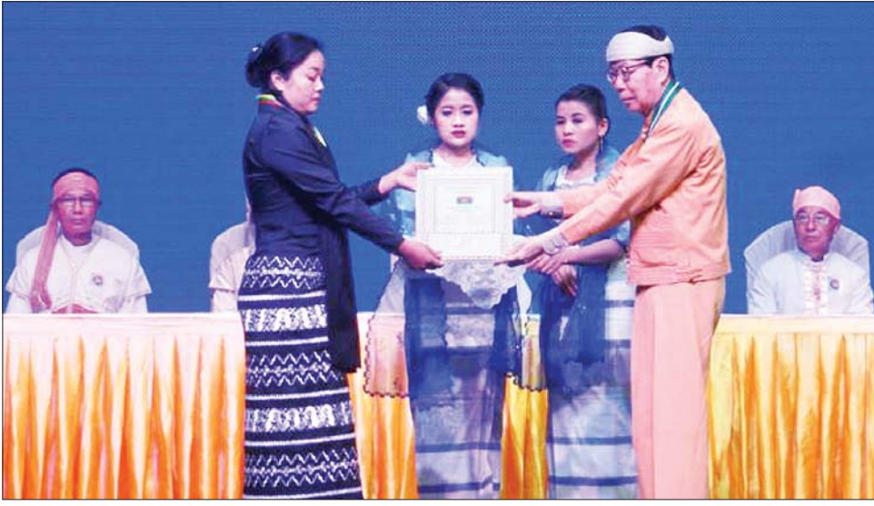
နိုင်ငံတော်စီမံအုပ်ချုပ်ရေးကောင်စီအဖွဲ့ဝင် ဦးစိုင်းလုံးဆိုင် ဂုဏ်ထူးဆောင်လက်မှတ် ရရှိသူတစ်ဦးအား ဂုဏ်ထူးဆောင်လက်မှတ် ချီးမြှင့်စဉ်။