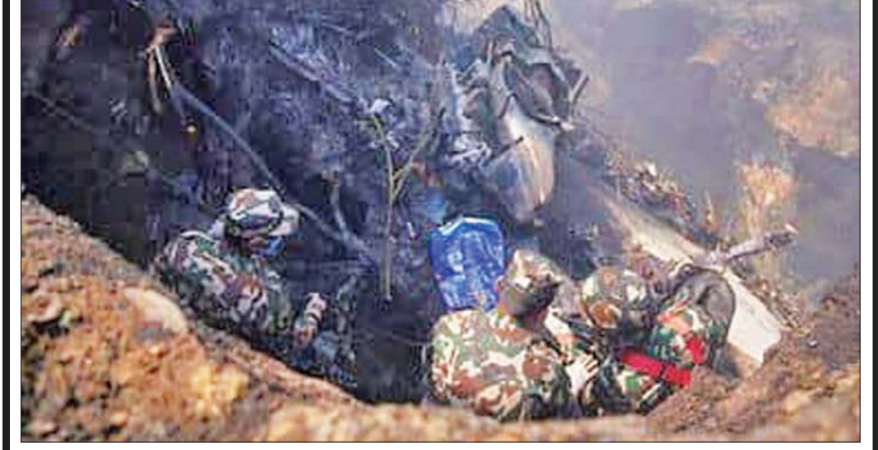
ကယ်ဆယ်ရေးလုပ်သားများက လေယာဉ်ပျက်ကျရာ နေရာတွင် ရှာဖွေကြစဉ်။

လေကြောင်းလိုင်းမှ လေယာဉ်ဖြစ်ကြောင်း သိရသည်။ ပျော်ဟာရာလေဆိပ်မှ ၃ ကီလိုမီတာ အကွာရှိ တောင်ကြားတွင် လေယာဉ်ပျက်ကျခဲ့ခြင်းဖြစ်သည်။ လေယာဉ် အပျက်အစီးများကြား အလုပ်လုပ်ကိုင်နေကြသည့် မီးသတ်တပ်ဖွဲ့ဝင်များနှင့် ပျက်ကျလေယာဉ်မှ လွင့်စဉ်လာသည့် မီးခိုးငွေ့ကြီးများကို ဗီဒီယိုဖိုင်တွင် တွေ့ရှိရသည်။ တောင်တန်းထူထပ်သည့် နီပေါနိုင်ငံ၌ လေယာဉ်မတော်တဆ ဖြစ်ရပ်များနှင့် ကြုံတွေ့ဖူးသည်။ ကိုဗစ်-၁၉ ရောဂါကြောင့် နီပေါနိုင်ငံ၏ ခရီးသွားလုပ်ငန်းကို ထိခိုက်ခဲ့ပြီးနောက် နိုင်ငံအတွင်းသို့ နိုင်ငံခြားခရီးသွားများနှင့် တောင်တက်သမားများ ပြန်လည်ဝင်ရောက်လာချိန် ယခုလို လေယာဉ်ပျက်ကျမှုဖြစ်စဉ် ဖြစ်ပွားခဲ့ခြင်းဖြစ်သည်။ အင်န်အီတီချီကေ