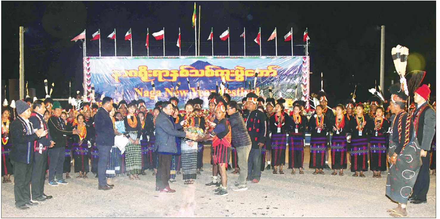
နိုင်ငံတော်စီမံအုပ်ချုပ်ရေးကောင်စီဥက္ကဋ္ဌ နိုင်ငံတော်ဝန်ကြီးချုပ် ဗိုလ်ချုပ်မှူးကြီး မင်းအောင်လှိုင် နာဂရီးရာနှစ်သစ်ကူးပွဲအတွက် အဖွဲ့များအား ဂုဏ်ပြုပန်းခြင်းနှင့် ဂုဏ်ပြုချီးမြှင့်ငွေများ ပေးအပ်စဉ်။

ထို့နောက် နိုင်ငံတော်စီမံအုပ်ချုပ်ရေးကောင်စီဥက္ကဋ္ဌ နိုင်ငံတော်ဝန်ကြီးချုပ်နှင့် အဖွဲ့ဝင်များသည် နာဂရီးရာပြခန်းများအတွင်း လှည့်လည်ကြည့်ရှု