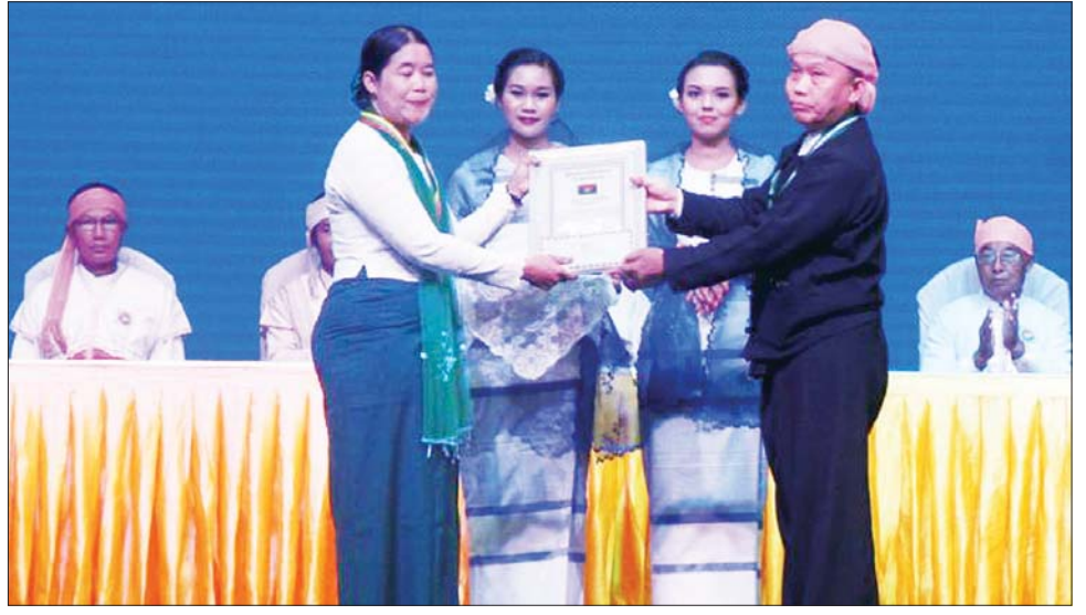
နိုင်ငံတော်စီမံအုပ်ချုပ်ရေးကောင်စီအဖွဲ့ဝင် ဦးရွှေကြိမ်း ဂုဏ်ထူးဆောင်လက်မှတ် ရရှိသူတစ်ဦးအား ဂုဏ်ထူးဆောင်လက်မှတ် ချီးမြှင့်စဉ်။