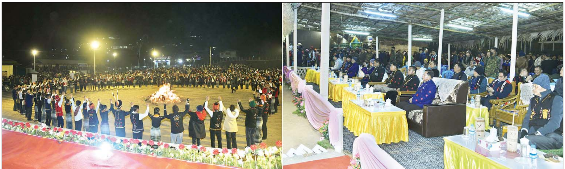
နိုင်ငံတော်စီမံအုပ်ချုပ်ရေးကောင်စီဥက္ကဋ္ဌ နိုင်ငံတော်ဝန်ကြီးချုပ် ဗိုလ်ချုပ်မှူးကြီး မင်းအောင်လှိုင်နှင့် အဖွဲ့ဝင်များ နာဂရိုးရာယဉ်ကျေးမှုမီးပွဲပွဲတွင် နာဂရိုးရာအကအလှများဖြင့် ဖျော်ဖြေမှုများကို ကြည့်ရှုအားပေးစဉ်။

◆ တောင်ပေါ်ဒေသတစ်ခုဖြစ်သည့် နာဂကိုယ်ပိုင် အုပ်ချုပ်ခွင့်ရဒေသ၏ ဖွံ့ဖြိုးတိုးတက်မှုကို အရှိန်အဟုန်မြှင့် ဆောင်ရွက်ရာတွင်လည်း မိမိတို့ ပြည်ထောင်စုအစိုးရ၊ စစ်ကိုင်းတိုင်းဒေသကြီးအစိုးရအဖွဲ့နှင့် နာဂကိုယ်ပိုင်အုပ်ချုပ်ခွင့်ရဒေသ စီမံအုပ်ချုပ်ရေးအဖွဲ့တို့နှင့်အတူ တိုင်းရင်းသားပြည်သူလူထုများက တက်ညီလက်ညီ ဝိုင်းဝန်းဆောင်ရွက်ကြရမည်