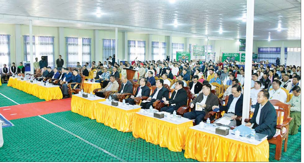
နိုင်ငံတော်စီမံအုပ်ချုပ်ရေးကောင်စီဥက္ကဋ္ဌ နိုင်ငံတော်ဝန်ကြီးချုပ် ဗိုလ်ချုပ်မှူးကြီး မင်းအောင်လှိုင် ဟုမ္မလင်းခရိုင်အတွင်းရှိ ခရိုင်၊ မြို့နယ်အဆင့်ဌာနဆိုင်ရာ တာဝန်ရှိသူများ၊ မြို့မိမြို့ဖများ၊ အသေးစား၊ အငယ်စားနှင့် အလတ်စား စီးပွားရေး (MSME) လုပ်ငန်းရှင်များအားတွေ့ဆုံ၍ ဒေသဖွံ့ဖြိုးတိုးတက်ရေးဆိုင်ရာများ ဆွေးနွေးပြောကြားစဉ်။