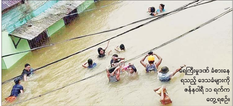
ရေကြီးမှုဒဏ် ခံစားနေရသည့် ဒေသများကို ဇန်နဝါရီ ၁၁ ရက်က တွေ့ရစဉ်။