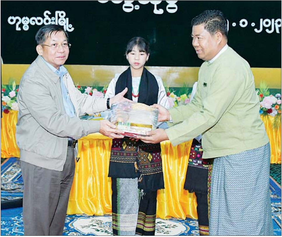
နိုင်ငံတော်စီမံအုပ်ချုပ်ရေးကောင်စီဥက္ကဋ္ဌ နိုင်ငံတော်ဝန်ကြီးချုပ် ဗိုလ်ချုပ်မှူးကြီး မင်းအောင်လှိုင် ခရိုင်၊ မြို့နယ်အဆင့် ဌာနဆိုင်ရာတာဝန်ထမ်းများအတွက် လက်ဆောင်ပစ္စည်းများပေးအပ်စဉ်။

နေပြည်တော် ဇန်နဝါရီ ၁၅ နိုင်ငံတော်စီမံအုပ်ချုပ်ရေးကောင်စီဥက္ကဋ္ဌ နိုင်ငံတော်ဝန်ကြီးချုပ် ဗိုလ်ချုပ်မှူးကြီး မင်းအောင်လှိုင်သည် ယနေ့နံနက်ပိုင်းတွင် စစ်ကိုင်းတိုင်းဒေသကြီး ဟုမ္မလင်းခရိုင်အတွင်းရှိ ခရိုင် မြို့နယ်အဆင့် ဌာနဆိုင်ရာတာဝန်ရှိသူများ၊ မြို့မိမြို့ဖများ၊ အသေးစား၊ အငယ်စားနှင့် အလတ်စား စီးပွားရေး (MSME) လုပ်ငန်းရှင်များအား ဟုမ္မလင်းမြို့ မြို့တော်ခန်းမ၌ တွေ့ဆုံ၍ ဒေသဖွံ့ဖြိုးတိုးတက်ရေးဆိုင်ရာများကို ဆွေးနွေး ပြောကြားသည်။