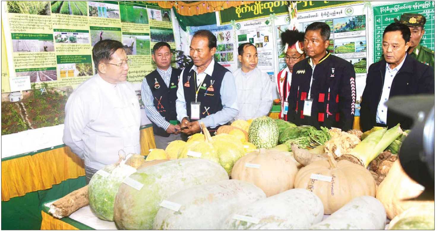
နိုင်ငံတော်စီမံအုပ်ချုပ်ရေးကောင်စီဥက္ကဋ္ဌ နိုင်ငံတော်ဝန်ကြီးချုပ် ဗိုလ်ချုပ်မှူးကြီး မင်းအောင်လှိုင်နှင့် အဖွဲ့ဝင်များ နာဂရိုးရာ ပြခန်းများအတွင်း လှည့်လည်ကြည့်ရှုစဉ်။

ပြည်ထောင်စုကြီးတစ်ခုလုံး ဟန်ချက်ညီညီ ဖွံ့ဖြိုးတိုးတက်ရန်အတွက်ဆိုပါက နိုင်ငံတော်တစ်ဝန်းလုံး တည်ငြိမ်အေးချမ်းမှုရှိရန် လိုအပ်မည်