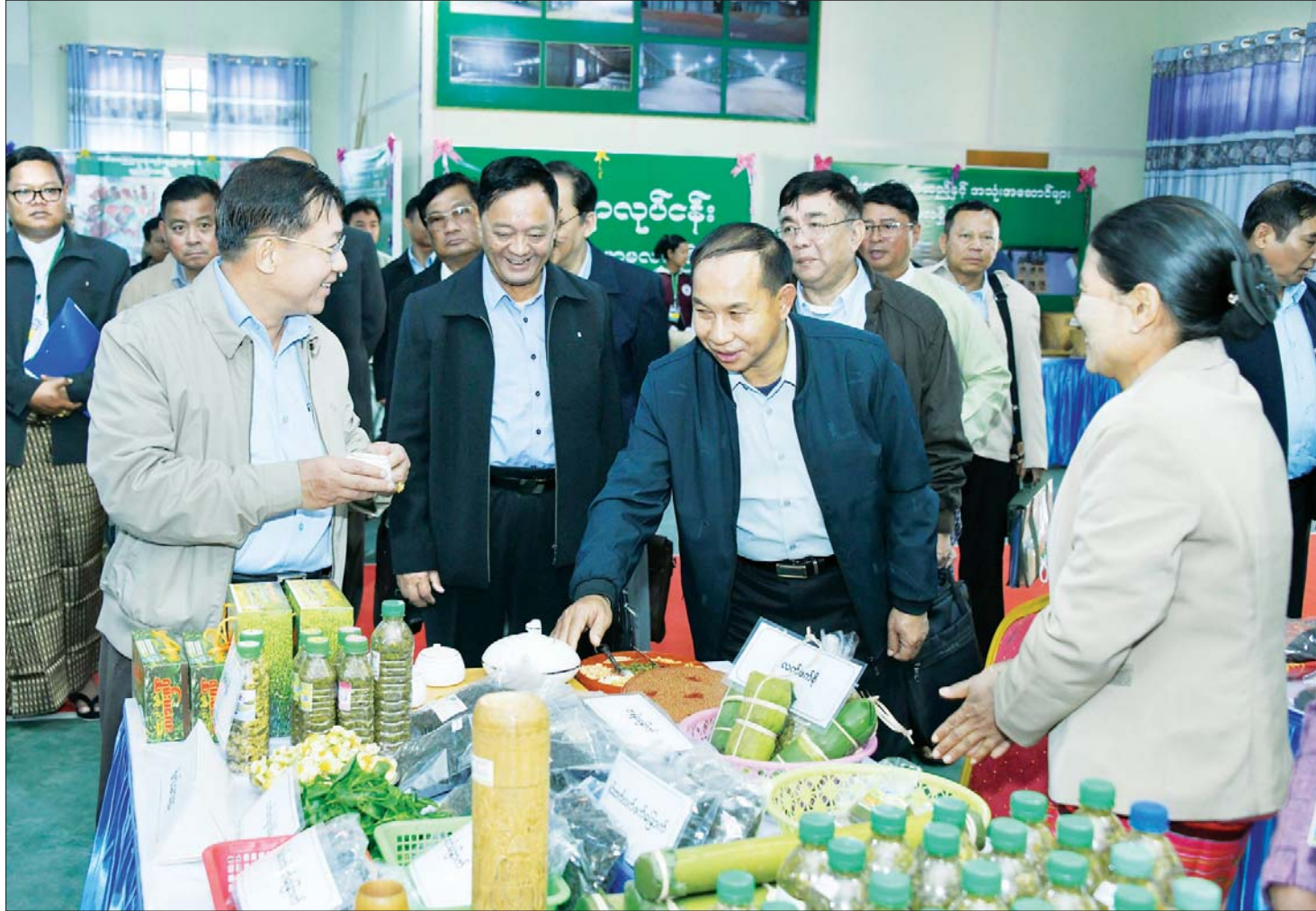
နိုင်ငံတော်စီမံအုပ်ချုပ်ရေးကောင်စီဥက္ကဋ္ဌ နိုင်ငံတော်ဝန်ကြီးချုပ် ဗိုလ်ချုပ်မှူးကြီး မင်းအောင်လှိုင် ခင်းကျင်းပြသထားသည့်ဒေသထွက်ကုန်ပစ္စည်းများကို လေ့လာစဉ်။