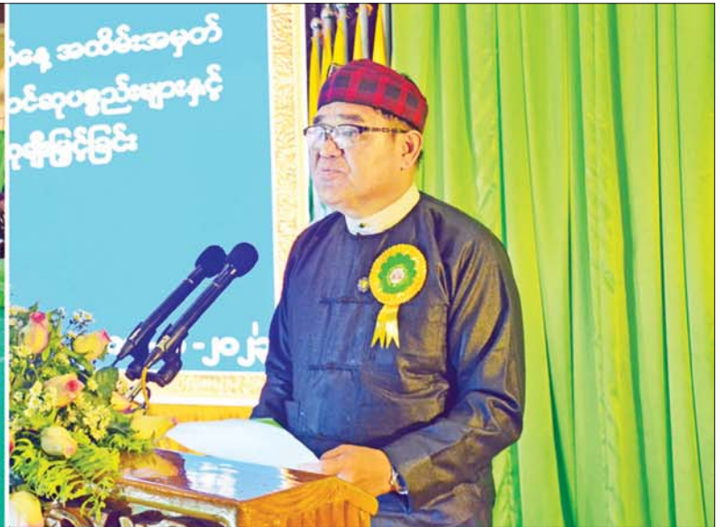
ကချင်ပြည်နယ်ဝန်ကြီးချုပ် ဦးခက်ထိန်နန် (၇၅)နှစ်မြောက် စိန်ရတုကချင်ပြည်နယ်နေ့ အထိမ်းအမှတ် ပြည်နယ်ဖွံ့ဖြိုးတိုးတက်ရေးနှင့် အေးချမ်းတည်ငြိမ်ရေးအတွက် ဘက်စုံ၊ ထောင့်စုံ၊ ကဏ္ဍစုံမှ စွမ်းစွမ်းတမ်းဆောင်ရွက်ခဲ့ကြသည့် လူပုဂ္ဂိုလ်၊ အဖွဲ့အစည်းများကို ဂုဏ်ထူးဆောင်ဆုများနှင့် မှတ်တမ်းတင် ဂုဏ်ပြုလွှာများ ချီးမြှင့်ပေးအပ်ပွဲ အခမ်းအနားတွင် အမှာစကားပြောကြားစဉ်။