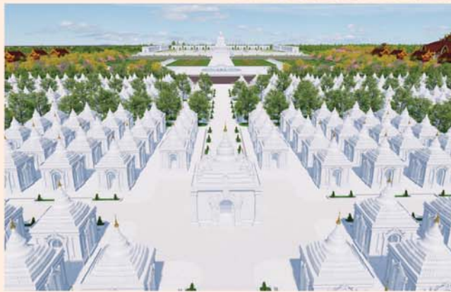
ကျောက်စာရုံစေတီ(၁၂ x ၁၂x ၁၈)ပေ ၁ ဆူ တန်ဖိုး-၂၇၉ သိန်း