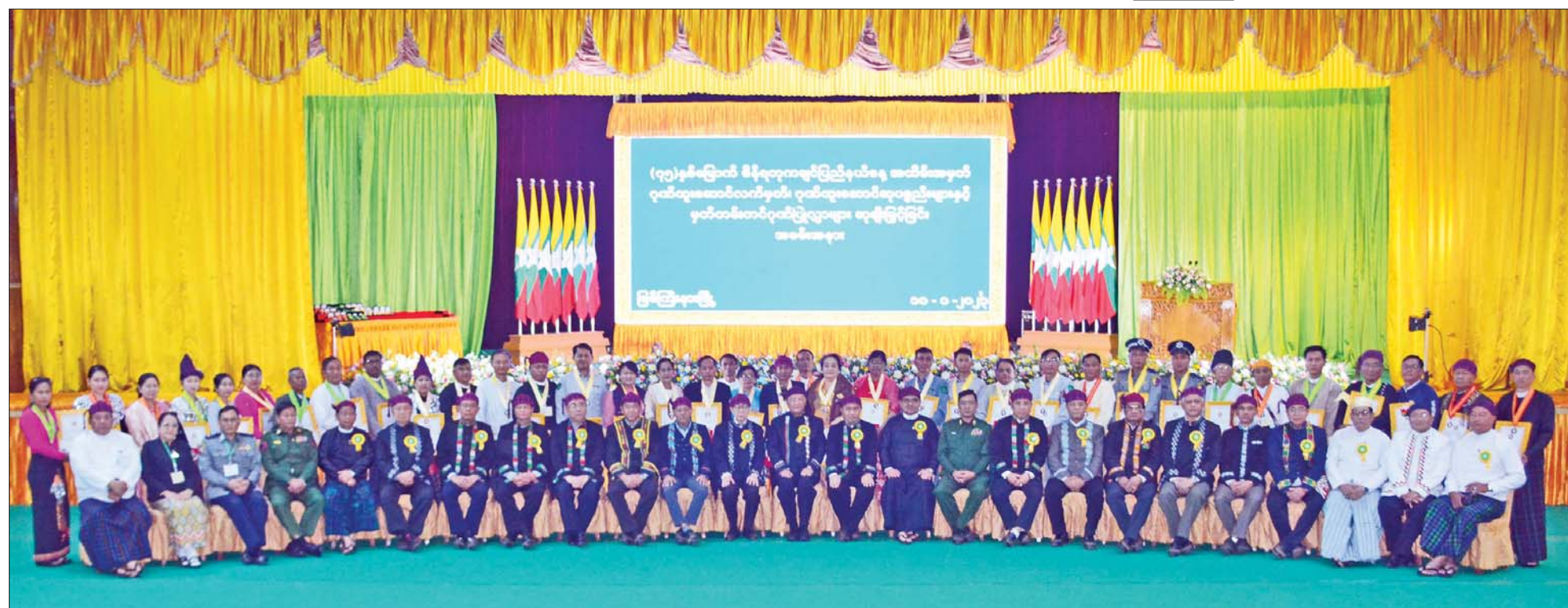
နိုင်ငံတော်စီမံအုပ်ချုပ်ရေးကောင်စီအဖွဲ့ဝင်များ၊ ပြည်ထောင်စုဝန်ကြီးများနှင့် တာဝန်ရှိသူများ ဆုရရှိသူများနှင့်အတူ မှတ်တမ်းတင်ဓာတ်ပုံရိုက်စဉ်။