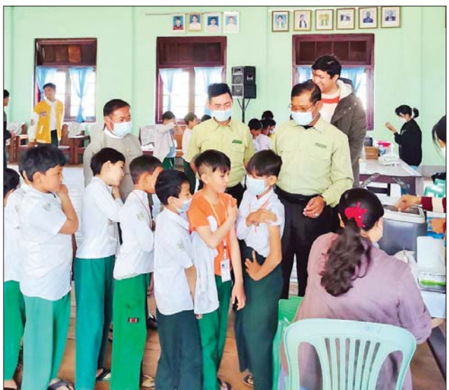
ခြင်း၊ ကိုယ်အပူချိန်တိုင်းတာခြင်း၊ နေမှုများအား ခရိုင်ကိုဗစ်-၁၉ သွေးပေါင်ချိန်ပေးခြင်း၊ ဆေးထိုး ထိန်းချုပ်ရေးနှင့် အရေးပေါ်တုံ့ပြန် ပြီးနောက် ခေတ္တစောင့်ကြည့်ပြီးမှ ပြန်လည် ထွက်ခွာစေခြင်းတို့ကို ဖော်ဦးနှင့် ခရိုင်စီမံအုပ်ချုပ်ရေး အဖွဲ့ဝင်များ၊ မြို့နယ် ကိုဗစ်-၁၉ ဖြူးလူသစ် ခရိုင်(ပြန်/ဆက်)

မန္တလေးတိုင်းဒေသကြီး ပြင်ဦးလွင်မြို့နယ်၌ ပညာသင်ကြား နေကြသော အခြေခံပညာ ကျောင်းများမှ အသက် (၅) နှစ်မှ (၁၂) နှစ်အထိ ကျောင်းသား ကျောင်းသူများအား ကိုဗစ် - ၁၉ ရောဂါထပ်ဆောင်းကာကွယ်ဆေး (Booster Dose)များ ထိုးနှံပေးခြင်း ကို ယမန်နေ့နံနက်ပိုင်းက ပြင်ဦးလွင်မြို့နယ် အထက(၁)နှင့် အထက(၂) ကျောင်းတို့တွင် ပြင်ဦးလွင်ခရိုင် ပြည်သူ့ကျန်းမာ ရေးဦးစီးဌာနမှ တာဝန်ရှိသူများက သွားရောက်ထိုးနှံ ဆောင်ရွက်ပေး ကြကြောင်း သိရသည်။