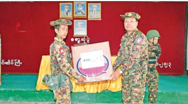
များနှင့် ချီးမြှင့်ငွေများ ပေးအပ်ကာ(အပေါ်ပုံ) ရင်းရင်းနှီးနှီး လိုက်လံ နှုတ်ဆက်ခဲ့ကြကြောင်း သတင်းရရှိသည်။ သတင်းစဉ်

နေပြည်တော် ဇန်နဝါရီ ၁၀ - ကရင်ပြည်နယ် ကြာအင်းဆိပ်ကြီးမြို့နယ်အတွင်းရှိ နယ်မြေလုံခြုံရေးနှင့် နယ်မြေစိုးမိုးရေးတာဝန်များ ထမ်းဆောင်လျက်ရှိသည့် အရာရှိ၊ စစ်သည်များနှင့် မိသားစုဝင်များကို စားသောက်ဖွယ်ရာများနှင့် ချီးမြှင့်ငွေများ ပေးအပ်ခြင်းကို ယနေ့ မွန်းလွဲပိုင်းတွင် နယ်မြေခံတပ်ရင်းခန်းမ အသီးသီး၌ ပြုလုပ်ရာ အရှေ့တောင်တိုင်း စစ်ဌာနချုပ် တိုင်းမှူး ဗိုလ်ချုပ် မြတ်သက်ဦးနှင့် အဖွဲ့ဝင်များ၊ ကရင်ပြည်နယ်အစိုးရအဖွဲ့မှ လုံခြုံရေးနှင့် နယ်စပ်ရေးရာဝန်ကြီး ဗိုလ်မှူးကြီး မျိုးမင်းနောင်နှင့် အရာရှိ၊ စစ်သည်၊ မိသားစုဝင်များ တက်ရောက်ကြသည်။