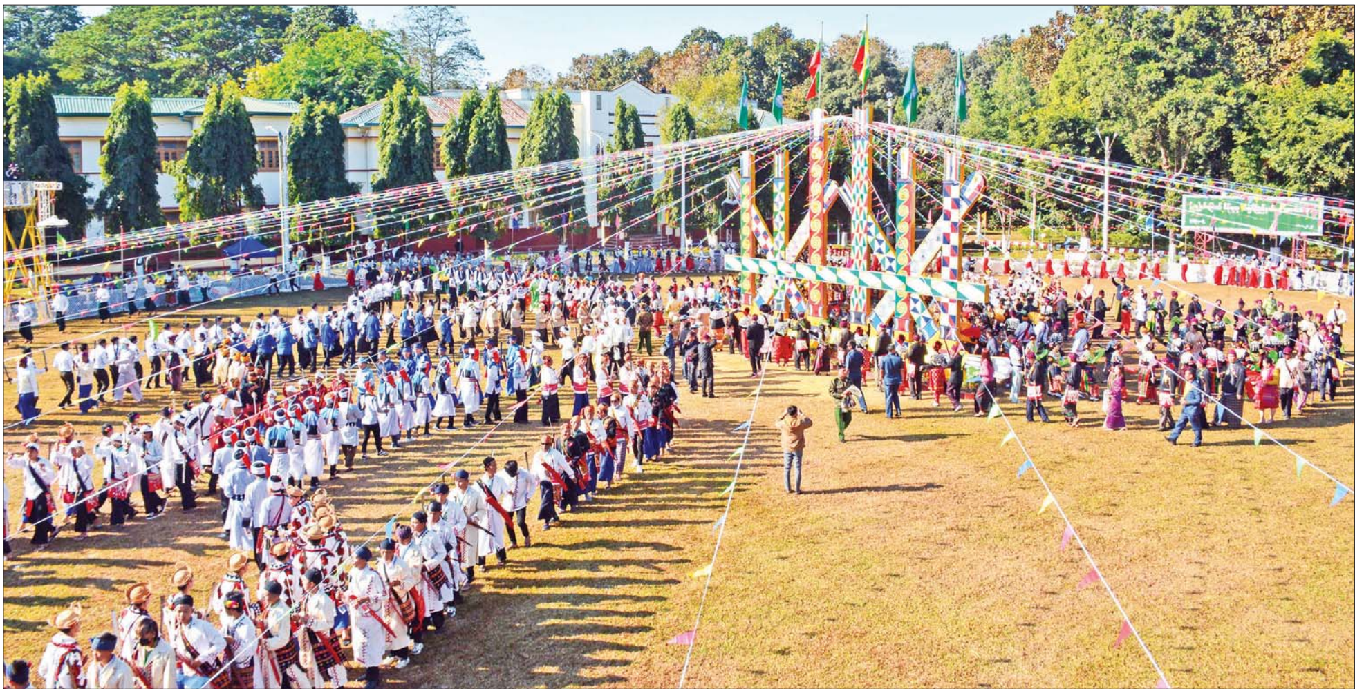
(၇၅)နှစ်မြောက် စိန်ရတုကချင်ပြည်နယ်နေ့ အထိမ်းအမှတ်အပိတ် မနောအကကို ရိုးရာအစဉ်အလာနှင့်အညီ တပျော်တပါး စုပေါင်းကြစဉ်။

၅။ အရေးပေါ်ကာလဆိုင်ရာ ပြဋ္ဌာန်းချက်များနှင့်အညီ ဆောင်ရွက်ပြီးစီးပါက ဖွဲ့စည်းပုံအခြေခံဥပဒေ (၂၀၀၈ ခုနှစ်) နှင့်အညီ လွတ်လပ်ပြီး တရားမျှတသော ပါတီစုံဒီမိုကရေစီ အထွေထွေရွေးကောက်ပွဲအား ပြန်လည်ကျင်းပ၍ အနိုင်ရသည့်ပါတီအား ဒီမိုကရေစီစံနှုန်းများနှင့်အညီ နိုင်ငံတော်တာဝန်အား လွှဲအပ်နိုင်ရေး ဆက်လက်ဆောင်ရွက်သွားမည်။