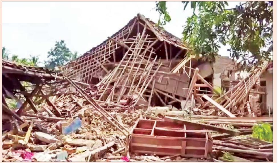
အင်ဒိုနီးရှားနိုင်ငံအရှေ့ပိုင်း မာလူကူပြည်နယ်၌ လှုပ်ခဲ့သော ငလျင်ကြောင့် အပျက်အစီးများကို တွေ့ရစဉ်။