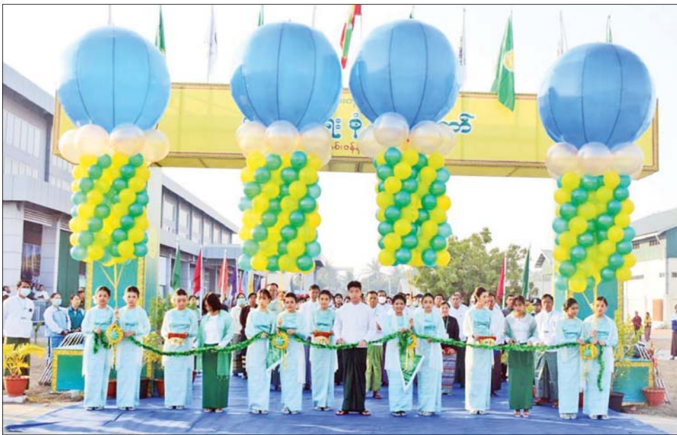
ခေတ်နှင့်အညီ ပြုပြင်ပြောင်းလဲရေး၊ ပညာရေး သုတေသနဖွံ့ဖြိုးရေးလုပ်ငန်းများ တိုးချဲ့ဆောင်ရွက် ရေး စသည့်ပညာရေးလုပ်ငန်းစဉ် (၁၀) ရပ်ကို တစ်ပြိုင်နက်တည်း အကောင်အထည်ဖော် ဆောင်ရွက်လျက်ရှိကြောင်း၊ ကျောင်းသား ကျောင်းသူတိုင်း KG+9 ကို ပြီးမြောက်စေရန် သင်ယူ ကြရမည်ဖြစ်ကြောင်း၊ ယခုကျင်းပသည့် ပညာရေး စုံညီပွဲတော်တွင် ပညာသင်နှစ် တစ်နှစ်တာကာလ အတွင်း ကျောင်းသား ကျောင်းသူများနှင့် ဆရာ ဆရာမများ၏ ဘက်စုံကဏ္ဍ၌ ထူးချွန်မှုများကို ပြသ

၂၀၂၂-၂၀၂၃ ပညာသင်နှစ် မန္တလေးတိုင်းဒေသကြီး ပညာရေးစုံညီပွဲတော်အခမ်းအနားကို Multipurpose Stadium၌ ယနေ့နံနက်ပိုင်းက ကျင်းပရာ မန္တလေး တိုင်းဒေသကြီး ဝန်ကြီးချုပ် ဦးမောင်ကျော် တိုင်းဒေသကြီး တရားလွှတ်တော် တရားသူကြီးချုပ် ဒေါ်ခင်သင်းဝေ၊ အစိုးရအဖွဲ့ဝင် ဝန်ကြီးများ၊ တက္ကသိုလ်၊ ဒီဂရီ ကောလိပ်တို့မှ ပါမောက္ခချုပ်များ၊ ပါမောက္ခ (ဌာနမှူး) များ၊ တိုင်း/ခရိုင်/ မြို့နယ်တို့မှ ပညာရေးမှူး၊ ဆရာ ဆရာမများ၊ ကျောင်းသား ကျောင်းသူများနှင့် တာဝန် ရှိသူများ တက်ရောက်ကြပြီး ပညာရေးစုံညီပွဲတော်ကို ထူးချွန်ကျောင်းသား ကျောင်းသူများက ဖဲကြိုးဖြတ် ဖွင့်လှစ်ပေးကြသည်။ (ယာပုံ)