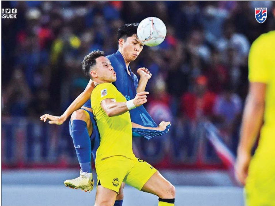
ထိုင်းအသင်းနှင့် မလေးရှားအသင်း ယှဉ်ပြိုင်နေစဉ်။ ဓာတ်ပုံ-FAT

ရန်ကုန် ဇန်နဝါရီ ၁၀ ၂၀၂၂ AFF Cup ပြိုင်ပွဲ ဆီမီးဖိုင်နယ် ဒုတိယအကျော့ (ဒုတိယနေ့)ကို ဇန်နဝါရီ ၁၀ ရက်က ထိုင်းနိုင်ငံ၌ ကျင်းပရာ ထိုင်းအသင်းက မလေးရှားအသင်းကို သုံးဂိုးပြတ် အနိုင်ရပြီး ဗိုလ်လုပွဲ တက်ရောက်သွားသည်။ ထိုင်းအသင်းသည် ပထမအကျော့တွင် တစ်ဂိုး-ဂိုးမရှိဖြင့် အရေးနိမ့်ထားသော်လည်း နှစ်ကျော့ပေါင်းရလဒ် သုံးဂိုး-တစ်ဂိုးဖြင့် အနိုင်ရခဲ့ခြင်း ဖြစ်သည်။ ပထမအကျော့ အဝေးကွင်းပွဲတွင် အရေးနိမ့်ထားသည့် လက်ရှိချန်ပီယံ ထိုင်းအသင်းသည် ဒုတိယအကျော့ အိမ်ကွင်းပွဲတွင် ဂိုးပြတ်အနိုင်ယူကာ ဗိုလ်လုပွဲ တက်ရောက်ခဲ့ခြင်းဖြစ်သည်။ စာမျက်နှာ ၁၂ ကော်လံ ၅ ❖