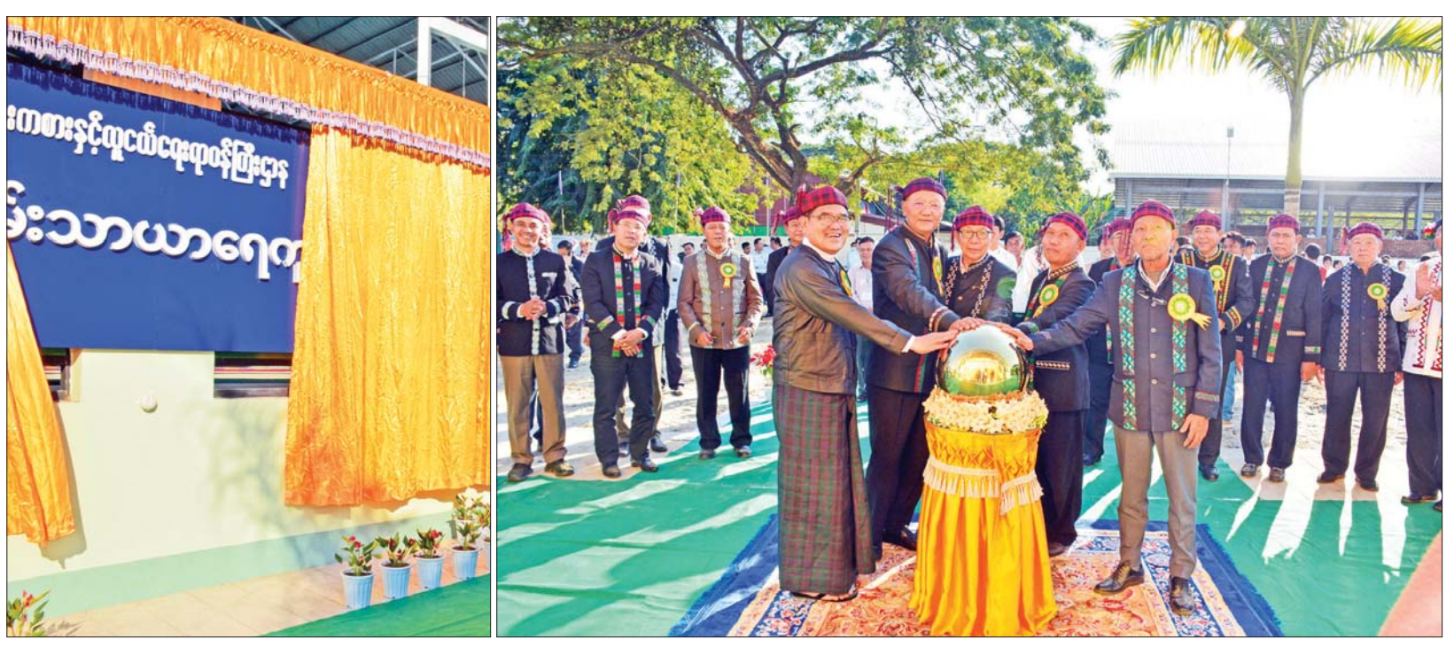
နိုင်ငံတော်စီမံအုပ်ချုပ်ရေးကောင်စီအဖွဲ့ဝင်များနှင့် ပြည်နယ်ဝန်ကြီးချုပ်တို့က ငြိမ်းချမ်းသာယာရေကူးကန်ကို စက်ခလုတ်နှိပ်ဖွင့်လှစ်ပေးစဉ်။

မြစ်ကြီးနား ဇန်နဝါရီ ၁၀ နိုင်ငံတော်စီမံအုပ်ချုပ်ရေးကောင်စီ အဖွဲ့ဝင်များနှင့် ပြည်ထောင်စုဝန်ကြီးများသည် ယနေ့မွန်းလွဲပိုင်းတွင် (၇၅)နှစ်မြောက် စိန်ရတုကချင်ပြည်နယ်နေ့အထိမ်းအမှတ်အဖြစ် မြစ်ကြီးနားမြို့ သီတာရပ်ကွက်ရှိ ငြိမ်းချမ်းသာယာ အားကစားကွင်းအတွင်း တည်ဆောက်ပြီးစီးခဲ့သည့် ငြိမ်းချမ်းသာယာ ရေကူးကန်ဖွင့်ပွဲသို့ တက်ရောက် ဖွင့်လှစ်ပေးကြသည်။ အဆိုပါ ငြိမ်းချမ်းသာယာ ရေကူးကန်ဖွင့်ပွဲသို့ နိုင်ငံတော်စီမံအုပ်ချုပ်ရေးကောင်စီ အဖွဲ့ဝင် Jeng Phang နော်တောင်၊ ဦးမောင်ဟာ၊ ဦးစိုင်းလုံးဆိုင်၊ ဦးရွှေကြိမ်း တို့နှင့်အတူ ပြည်ထောင်စုဝန်ကြီး ဒုတိယဗိုလ်ချုပ်ကြီး