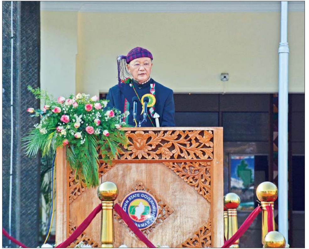
နိုင်ငံတော်စီမံအုပ်ချုပ်ရေးကောင်စီဥက္ကဋ္ဌ နိုင်ငံတော်ဝန်ကြီးချုပ်ဗိုလ်ချုပ်မှူးကြီး သတိုးမဟာသရေစည်သူ သတိုးသီရိသုဓမ္မ မင်းအောင်လှိုင်ထံမှ ၂၀၂၃ ခုနှစ်၊ (၇၅)နှစ်မြောက် စိန်ရတုကချင်ပြည်နယ်နေ့ အခမ်းအနားသို့ ပေးပို့သည့် သဝဏ်လွှာကို နိုင်ငံတော်စီမံအုပ်ချုပ်ရေးကောင်စီအဖွဲ့ဝင် Jeng Phang နော်တောင်က ဖတ်ကြားစဉ်။

ကချင်ပြည်နယ်နေ့သည် ၁၉၄၈ ခုနှစ် ဇန်နဝါရီ ၄ ရက် မြန်မာနိုင်ငံလွတ်လပ်ရေးရရှိခဲ့ပြီးနောက် ဇန်နဝါရီ ၁၀ ရက်တွင် ကချင်ပြည်နယ်ကောင်စီဥက္ကဋ္ဌ၊ ပထမဆုံးသော အစည်းအဝေးကို