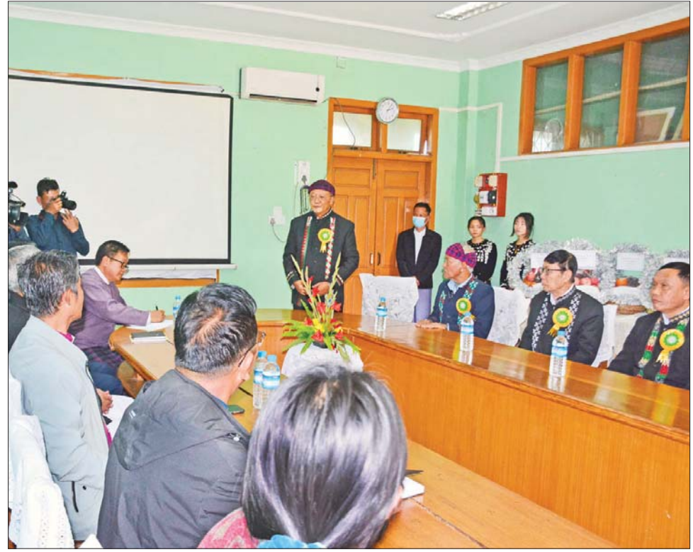
နိုင်ငံတော်စီမံအုပ်ချုပ်ရေးကောင်စီအဖွဲ့ဝင်များ မြစ်ကြီးနားမြို့နယ်အတွင်းရှိ ခရစ်ယာန်အသင်းတော်များမှ ဖာသာများ၊ သိက္ခာတော်ရဆရာများနှင့် ရင်းရင်းနှီးနှီးတွေ့ဆုံစဉ်။