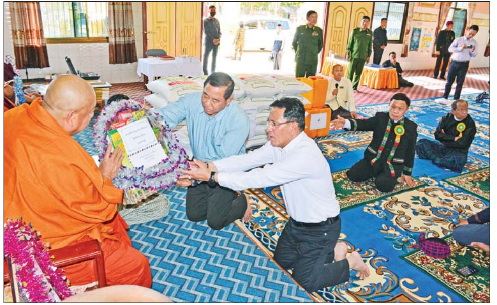
နိုင်ငံတော်စီမံအုပ်ချုပ်ရေးကောင်စီအဖွဲ့ဝင်များ၊ ပြည်ထောင်စုဝန်ကြီးများနှင့် တာဝန်ရှိသူများက ဆရာတော်၊ သံဃာတော်များထံ ဆန်အိတ် ၂၀၊ ဆီ ငါးပုံးနှင့် လှူဖွယ်ပစ္စည်းများ ဆက်ကပ်လှူဒါန်းစဉ်။