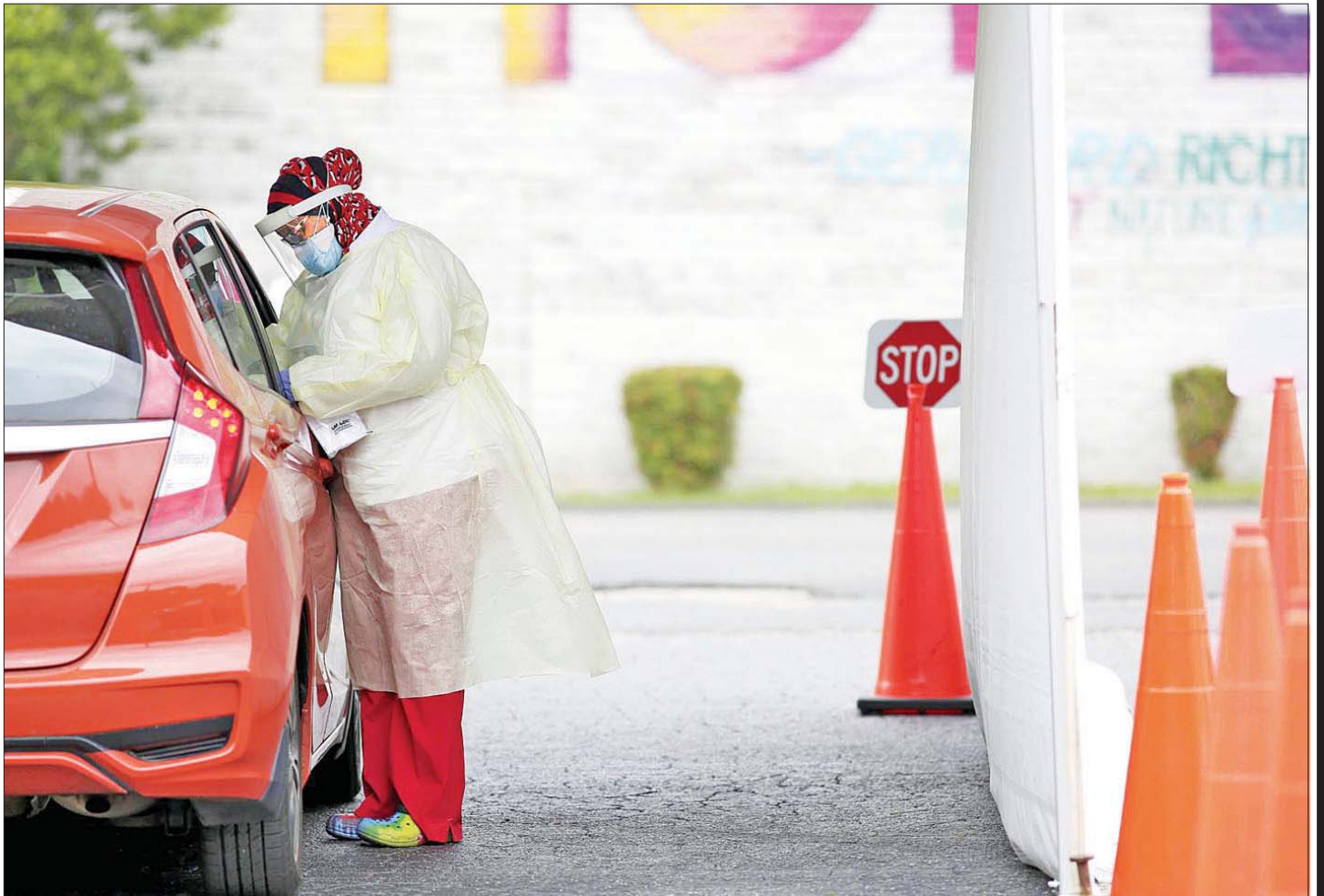
ပြီးခဲ့သည့်နှစ် မေလက မြောက်ကာရိုလိုင်းနား၌ ကိုဗစ်-၁၉ ဆေးစစ်နေသည့် ကျန်းမာရေးဝန်ထမ်းတစ်ဦးကို တွေ့ရစဉ်။

သို့သော်လည်း XBB.1.5 ကူးစက်မှုမှာ ဆိုးရွား နိုင်ကြောင်း ၎င်းက သတိပေးထားသည်။ လူများ သည် အဆောက်အအုံအတွင်းပိုင်းတွင် လူစုလူဝေး များပြုလုပ်ကြခြင်းနှင့် ထပ်ဆောင်းကာကွယ်ဆေး ထိုးနှံမှုမခံယူကြခြင်းတို့ကြောင့် ကူးစက်မှုပို၍