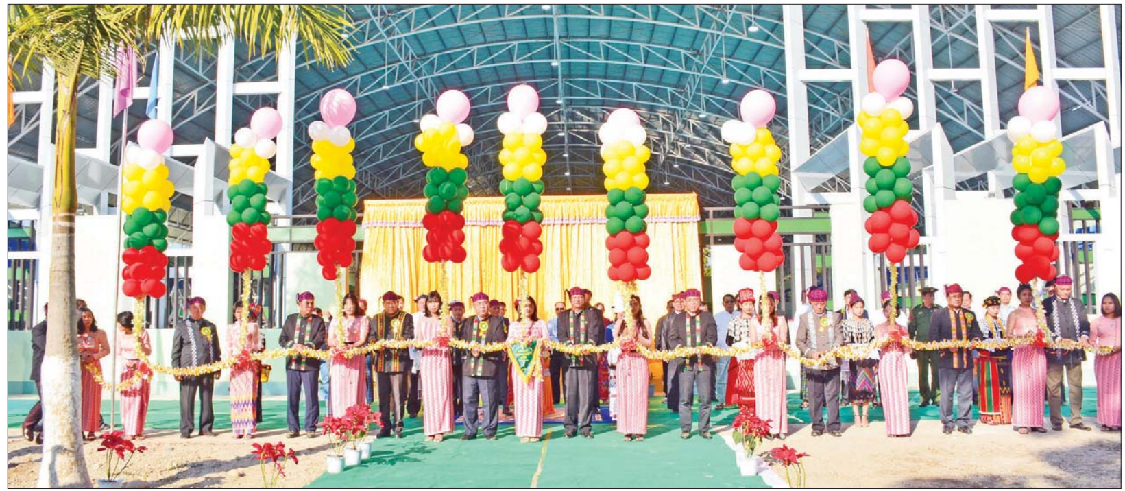
ပြည်ထောင်စုဝန်ကြီးများက ငြိမ်းချမ်းသာယာရေကူးကန်ကို ဖဲကြိုးဖြတ်ဖွင့်လှစ်ပေးစဉ်။

ထွန်းထွန်းနောင်၊ ဦးမောင်မောင်အုန်း၊ ဦးလှမိုး၊ ဦးသောင်းဟန်၊ ဦးအောင်နိုင်ဦး၊ ဒေါက်တာညွန့်မေ၊ ဦးမင်းသိန်း၊ ဦးမျိုးသန်း၊ ဦးစောထွန်းအောင်မြင့်၊ ပြည်နယ်ဝန်ကြီးချုပ် ဦးခက်ထိန်နန်၊ ဒုတိယဝန်ကြီး ဗိုလ်ချုပ်ဖြိုးသန်းနှင့် ဦးဇော်အေးမောင်၊ တပ်မတော်အရာရှိကြီးများ၊ ပြည်နယ်တရားလွှတ်တော် တရားသူကြီးချုပ်၊ ပြည်နယ် အစိုးရအဖွဲ့ဝင်ဝန်ကြီးများ တက်ရောက်ကြသည်။ တန်ဖိုးအကြီးဆုံး ရေကူးကန်အခမ်းအနားတွင် အားကစားနှင့် လူငယ်ရေးရာဝန်ကြီးဌာန၊ ပြည်ထောင်စုဝန်ကြီး ဦးမင်းသိန်းဇံက ကချင်ပြည်နယ်အနေဖြင့် တိုင်းဒေသကြီးနှင့်ပြည်နယ်အားလုံးတွင် တန်ဖိုးအကြီးဆုံး အမိုးအကာပါ ရေကူးကန်အသစ်ကို ပထမဦးဆုံး တည်ဆောက်ဖွင့်လှစ်နိုင်ခဲ့သည့် ပြည်နယ်တစ်ခု