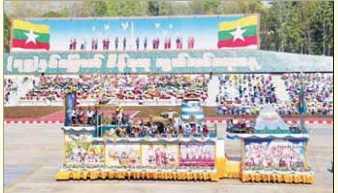
တိုင်းရင်းသားလူမျိုးများရေးရာဝန်ကြီးဌာန ဂုဏ်ပြုယာဉ်။