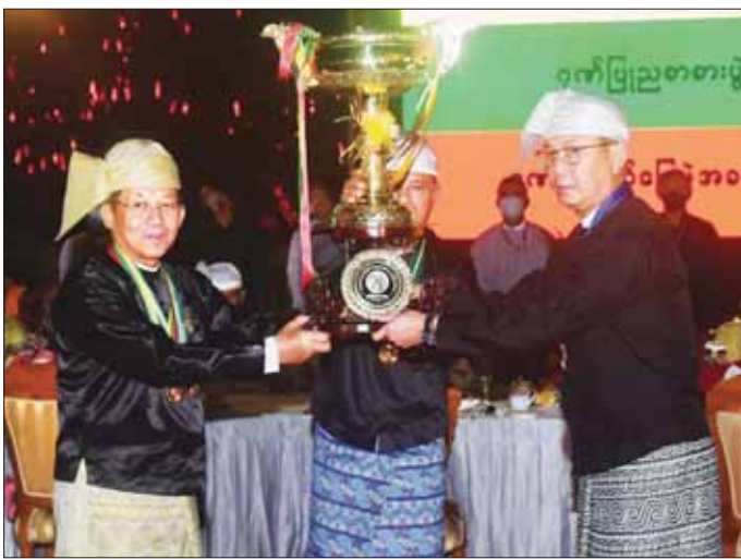
နိုင်ငံတော်စီမံအုပ်ချုပ်ရေးကောင်စီဥက္ကဋ္ဌ နိုင်ငံတော်ဝန်ကြီးချုပ် ဗိုလ်ချုပ်မှူးကြီး သတိုးမဟာသရေစည်သူ သတိုးသိရိသုဓမ္မ မင်းအောင်လှိုင် ပြည်ထောင်စုဝန်ကြီးဌာန ဂုဏ်ပြုယာဉ်ပထမဆုရရှိသည့် သယံဇာတနှင့် သဘာဝပတ်ဝန်းကျင် ထိန်းသိမ်းရေးဝန်ကြီးဌာနအတွက် ပြည်ထောင်စုဝန်ကြီး ဦးခင်မောင်ရီအား ဂုဏ်ပြုဆုနှင့် ဂုဏ်ပြုချီးမြှင့်ငွေများ ပေးအပ်ချီးမြှင့်စဉ်။

စာမျက်နှာ ၁၂ မှ နိုင်ငံတော်ဝန်ကြီးချုပ်နှင့် ဇနီး တို့သည် ဂုဏ်ပြုညစာစားပွဲအခမ်းအနားသို့ တက်ရောက်လာကြသူများနှင့်အတူ စိန်ရတုလွတ်လပ်ရေးနေ့ အထိမ်းအမှတ် (၇၅)နှစ်မြောက် စိန်ရတုလွတ်လပ်ရေးနေ့ စာတန်း၊ ဗုဒ္ဓဘာသာကလျာဏယုဝအသင်းတံဆိပ်၊ တို့ဗမာအစည်းအရုံးတံဆိပ်၊ BIA တံဆိပ်၊ BDA တံဆိပ်၊ လွတ်လပ်ရေးနေ့ အလံတင် အခမ်းအနား သရုပ်ဖော်ပုံ၊ လွတ်လပ်ရေး ကျောက်တိုင်ပုံ၊ တပ်မတော်မှ ယာဉ်ယန္တရားများ ရေငုပ်သင်္ဘောနှင့် လေယာဉ်ပုံ၊ နိုင်ငံတော် စီမံအုပ်ချုပ်ရေးကောင်စီဥက္ကဋ္ဌ နိုင်ငံတော်ဝန်ကြီးချုပ်၏ပုံ၊ မြန်မာနိုင်ငံမြေပုံတို့ကို Drone ယာဉ်ငယ်များဖြင့် သရုပ်ပြလွှတ်တင်မှုနှင့် မီးရှူးမီးပန်းများ ပစ်ဖောက်ခြင်းကို ကြည့်ရှုအားပေးကြသည်။