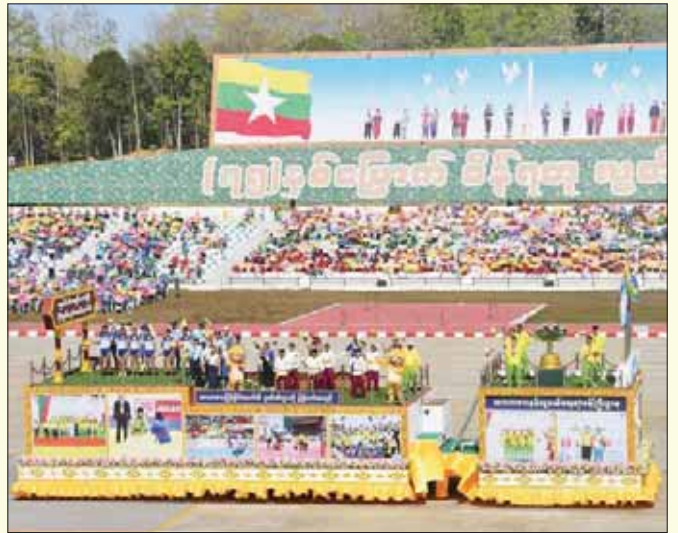
အားကစားနှင့် လူငယ်ရေးရာဝန်ကြီးဌာန ဂုဏ်ပြုဖွဲ့စည်းမှု။