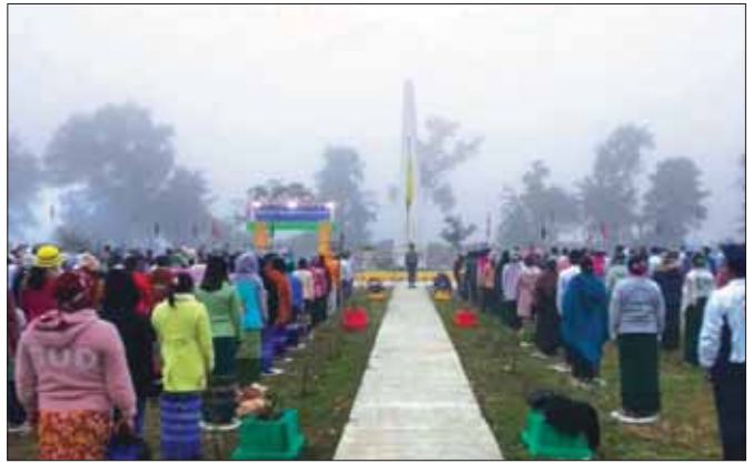
ဖောင်းပြင်မြို့နယ် ချင်းတွင်းဗိုလ်လယ်ပန်းခြံ၌ လွတ်လပ်ရေးနေ့ အလံတင်အခမ်းအနား ကျင်းပစဉ်။