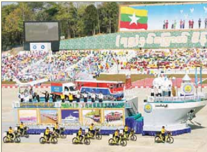
ပို့ဆောင်ရေးနှင့် ဆက်သွယ်ရေးဝန်ကြီးဌာန ဂုဏ်ပြုယာဉ်။