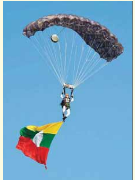
အလွတ်ခုန်လေထီးအဖွဲ့ ဝေဟင်ထက်မှ မြေပြင်သို့ ဆင်းသက်စဉ်။