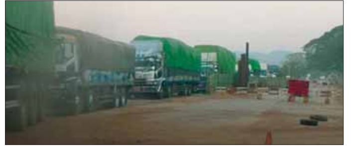
ကော့ကရိတ်-မြဝတီသွား အာရှလမ်းမကြီးတစ်လျှောက် မော်တော်ယာဉ်များ ပုံမှန်အတိုင်း သွားလာနေသည်ကို တွေ့ရစဉ်။