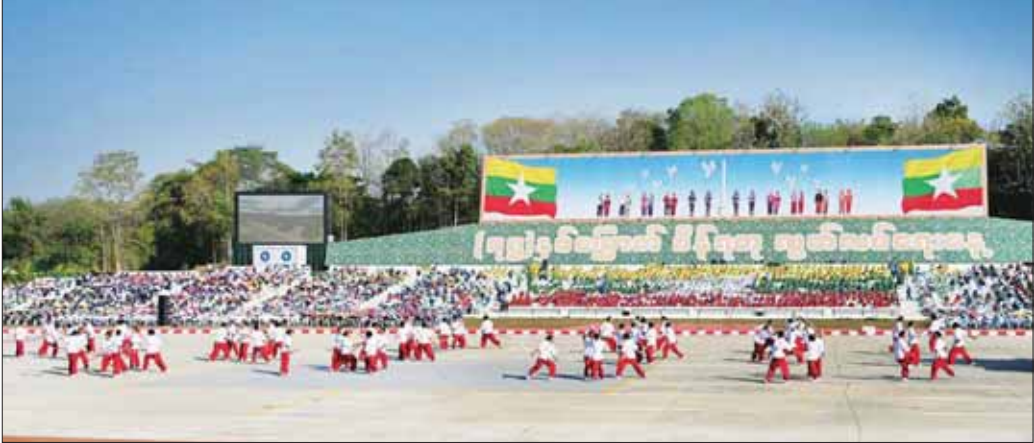
မြန်မာ့တပ်မတော်မှ စစ်သမားများက မြန်မာ့သိုင်းစွမ်းရည် သရုပ်ပြသစဉ်။

မှ စစ်သည်များနှင့် ရဲမေများက စွမ်းရည်ပြကွက်များ ပြသ၍လည်းကောင်း ချိတ်ကပ်အလေးပြုကြသည်။ သရုပ်ပြဖော်ပြေတင်ဆက် ဆက်လက်၍ မြန်မာနိုင်ငံအတွင်းရှိ တိုင်းဒေသကြီးနှင့် ပြည်နယ်တို့ရှိ ထင်ရှားသည့်အထိမ်းအမှတ်များ၊ စာမျက်နှာ ၇ သို့