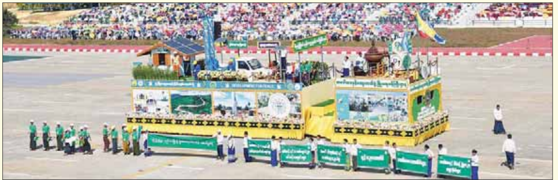
သမဝါယမနှင့် ကျေးလက်ဖွံ့ဖြိုးရေး ဝန်ကြီးဌာန ဂုဏ်ပြုယာဉ်။