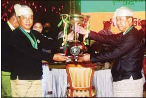
နိုင်ငံတော်စီမံအုပ်ချုပ်ရေးကောင်စီအဖွဲ့ဝင် ဗိုလ်ချုပ်ကြီး တင်အောင်စန်း အထူးဆုရရှိ သည့် ဂုဏ်ပြုယာဉ်မှ တာဝန်ရှိသူတစ်ဦးထံ ဂုဏ်ပြုဆုနှင့် ချီးမြှင့်ငွေများ ပေးအပ်စဉ်။