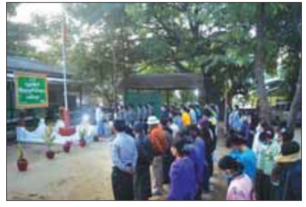
ဆိပ်ဖြူမြို့နယ်