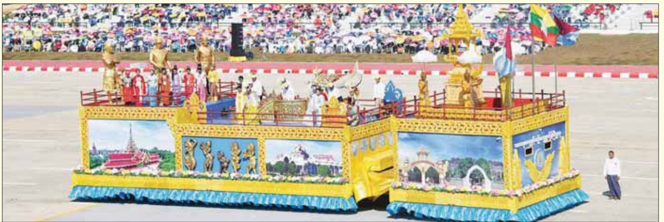
သာသနာရေးနှင့် ယဉ်ကျေးမှု ဝန်ကြီးဌာန ဂုဏ်ပြုယာဉ်။