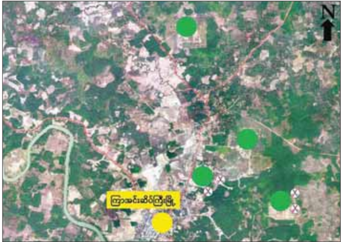
KNLA တပ်မဟာ (၆) နှင့် PDF အမည်ခံအကြမ်းဖက်ပူးပေါင်းအဖွဲ့၏ ကြာအင်းဆိပ်ကြီးမြို့ရှိ နယ်မြေခံတပ်ဌာနချုပ်များသို့ အင်အားအလုံးအရင်းဖြင့် ဝင်ရောက်တိုက်ခိုက်မှုဖြစ်စဉ်ပြပုံ

တိုက်ခိုက်ခဲ့မှုကြောင့် အကြမ်းဖက် ပူးပေါင်းအဖွဲ့များ သိမ်းဆည်းရမိခဲ့သည်။ သိမ်းဆည်းရမိခဲ့သည့် တပ်မတော်အနေဖြင့် နိုင်ငံတော်အတွင်း ဖရိုဖရဲ ဆုတ်ခွာထွက်ပြေးသွားခဲ့သည်။ လုံခြုံရေး၊ တရားဥပဒေစိုးမိုးရေးနှင့် နယ်မြေဒေသ တည်ငြိမ်အေးချမ်းရေးအတွက် လိုအပ်သည့် လုံခြုံ ရေး လုပ်ငန်းများကို ဆက်လက်ဆောင်ရွက်သွား မည်ဖြစ်ကြောင်း သတင်းရရှိသည်။ သတင်းစဉ်