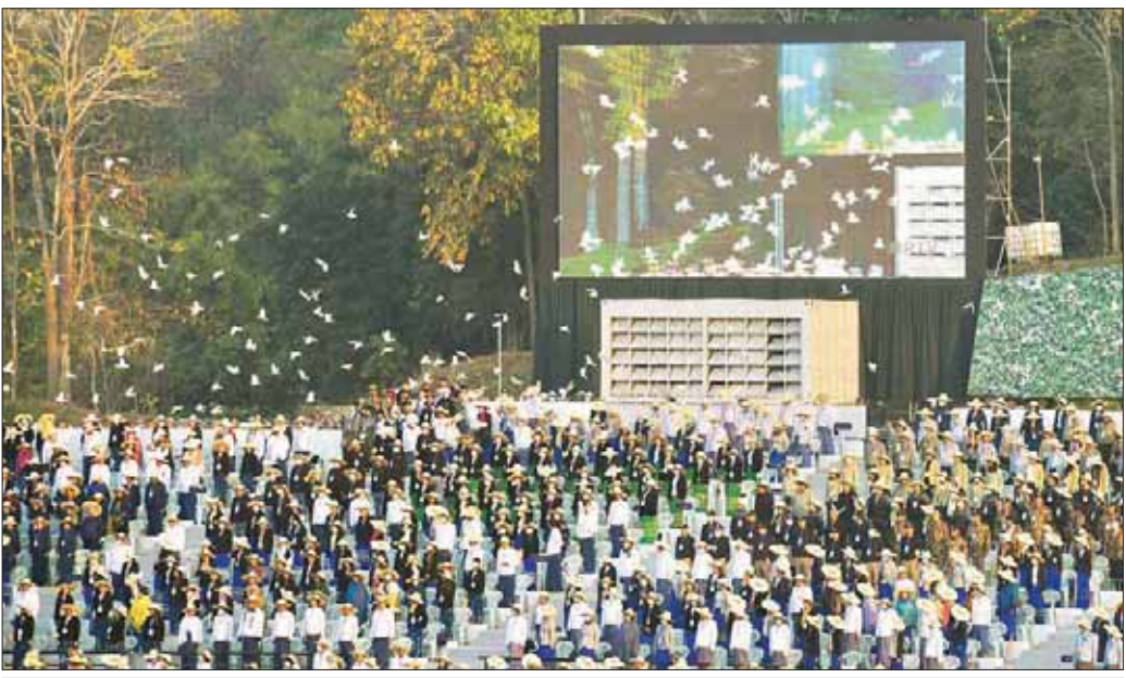
(၇၅)နှစ်မြောက် စိန်ရတုလွတ်လပ်ရေးနေ့ကို ဂုဏ်ပြုသည့်အနေဖြင့် ငြိမ်းချမ်းရေးချိုးဖြူငှက် အကောင် ၇၅၀ ကို လွှတ်တင်စဉ်။

အသက်ခန္ဓာပေးဆပ်ခဲ့သူများကို ဂုဏ်ပြုအောက်မေ့သတိရသောအားဖြင့် ၂ မိနစ် ငြိမ်သက်ကြပြီး ဆက်လက်၍ (၇၅) နှစ်မြောက် စိန်ရတုလွတ်လပ်ရေးနေ့ သစ္စာအဓိဋ္ဌာန်ကို ရွတ်ဆိုကြသည်။ မော်တော်ယာဉ်ဖြင့် ကြည့်ရှုစစ်ဆေး ထို့နောက် နိုင်ငံတော်စီမံအုပ်ချုပ်ရေးကောင်စီဥက္ကဋ္ဌ နိုင်ငံတော်ဝန်ကြီးချုပ် ဗိုလ်ချုပ်မှူးကြီး သတိုးမဟာသရေစည်သူ သတိုးသိရီသုဓမ္မ မင်းအောင်လှိုင်သည် စစ်ရေးပြတပ်ရင်း၊ ဂုဏ်ပြုယာဉ်များ၊ တပ်မတော်နှင့် ပြည်ထဲရေးမှ ယန္တရားတပ်ခွဲများကို မော်တော်ယာဉ်ဖြင့် ကြည့်ရှုစစ်ဆေးသည်။ ယင်းနောက် နိုင်ငံတော်စီမံအုပ်ချုပ်ရေးကောင်စီဥက္ကဋ္ဌ နိုင်ငံတော်ဝန်ကြီးချုပ် ဗိုလ်ချုပ်မှူးကြီး သတိုးမဟာသရေစည်သူ သတိုးသိရီသုဓမ္မ မင်းအောင်လှိုင်က (၇၅)နှစ်မြောက် စိန်ရတုလွတ်လပ်ရေးနေ့ မိန့်ခွန်းပြောကြားသည်။ (နိုင်ငံတော်စီမံအုပ်ချုပ်ရေးကောင်စီဥက္ကဋ္ဌ နိုင်ငံတော်ဝန်ကြီးချုပ်၏ (၇၅) နှစ်မြောက် စိန်ရတုလွတ်လပ်ရေးနေ့ မိန့်ခွန်းအပြည့်အစုံကို စာမျက်နှာ - ၈ တွင် သီးခြားဖော်ပြထားပါသည်။) အလေးပြုကြ ထို့နောက် တပ်မတော်(လေ)မှ စမ်းသပ်ထုတ်လုပ်သည့် MTX-1A အပါအဝင် PT-6 လေယာဉ် ၁၅ စင်းဖြင့် အင်္ဂလိပ်အက္ခရာ 75 ပုံစံအုပ်ဖွဲ့၍ ဗိုလ်ရှုခံအဆောက်အဦ၏ ရှေ့တူရုံမှ ပျံသန်းဝင်ရောက်ကာ နိုင်ငံတော်စီမံအုပ်ချုပ်ရေးကောင်စီဥက္ကဋ္ဌ နိုင်ငံတော်ဝန်ကြီးချုပ် ဗိုလ်ချုပ်မှူးကြီး သတိုးမဟာသရေစည်သူ သတိုးသိရီသုဓမ္မ မင်းအောင်လှိုင်ကို အလေးပြုကြသည်။