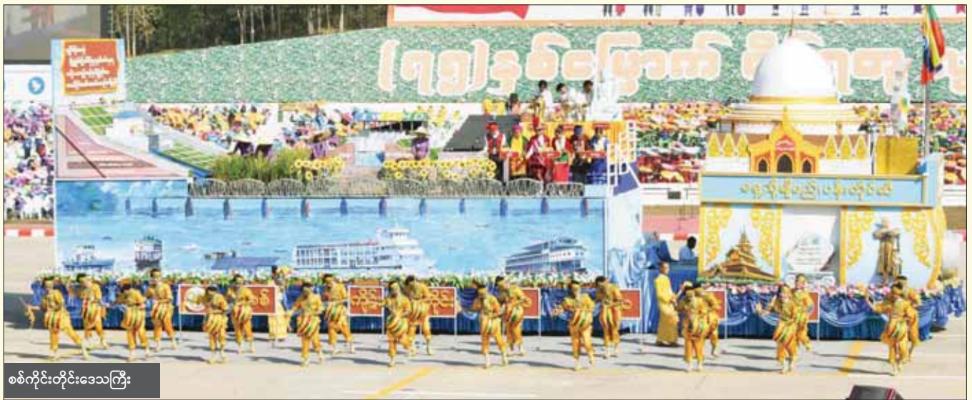
စစ်ကိုင်းတိုင်းဒေသကြီး