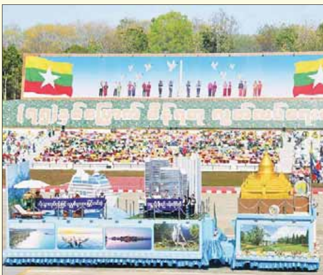
ဟိုတယ်နှင့် ခရီးသွားလာရေးဝန်ကြီးဌာန ဂုဏ်ပြုဖွဲ့စည်းမှု။