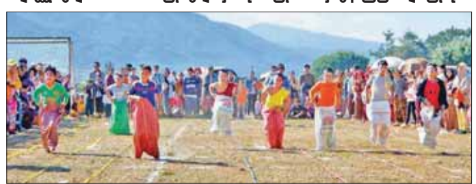
မိုင်းယုမြို့၌ စိန်ရတုလွတ်လပ်ရေးနေ့အထိမ်းအမှတ် အားကစားပြိုင်ပွဲများ ကျင်းပနေမှုကို တွေ့ရစဉ်။

ကောင်စီနယ်မြေ၊ ရန်ကုန်၊ များဆောင်ရွက်ကြရာ လာရောက် မန္တလေးမြို့ကြီးများ အပါအဝင် ကြည့်ရှုသူ မိဘပြည်သူများဖြင့် အပန်းဖြေသူများဖြင့် စည်ကား အခြားမြို့ကြီးများ၌ စိန်ရတု လွတ်လပ်ရေးနေ့ အထိမ်းအမှတ် လက်ရှိသည်။ ထို့အပြင် နေပြည်တော် ဂုဏ်ပြုမီးအလှထွန်း ထွန်းညှိခြင်း သတင်းစဉ်