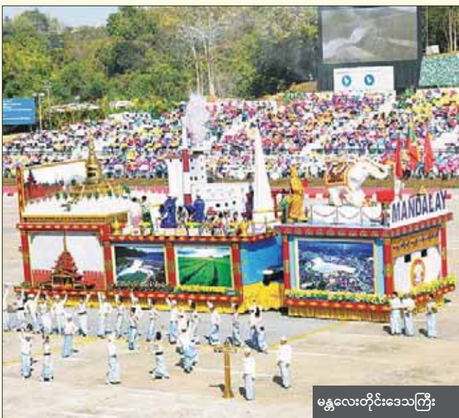
မန္တလေးတိုင်းဒေသကြီး