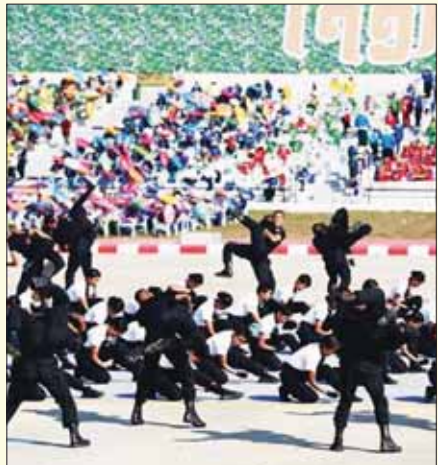
မြန်မာနိုင်ငံရဲတပ်ဖွဲ့မှ စစ်သည်များနှင့် ရဲမေများ စွမ်းရည်ပြသစဉ်။