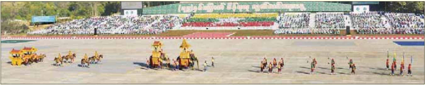
ရာဇဝင်းခင်း၍ ချီတက်အလေးပြုစဉ်။