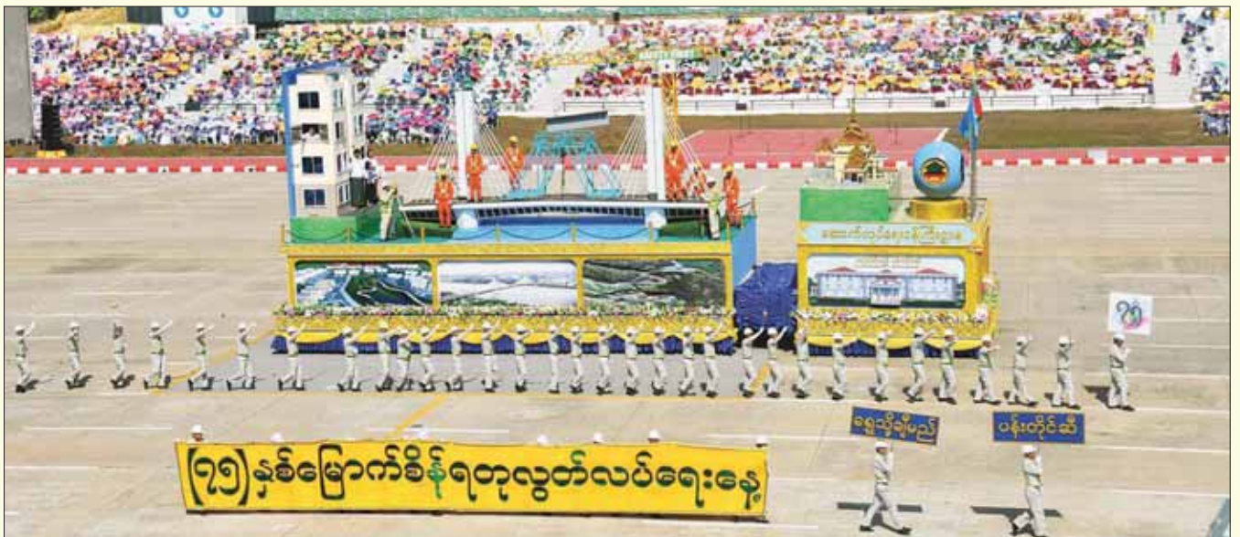
ဆောက်လုပ်ရေးဝန်ကြီးဌာန ဂုဏ်ပြုဖွဲ့စည်းမှု။