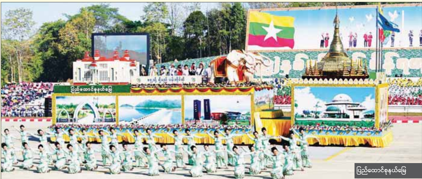
ပြည်ထောင်စုနယ်မြေ