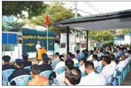
တာမွေမြို့နယ်