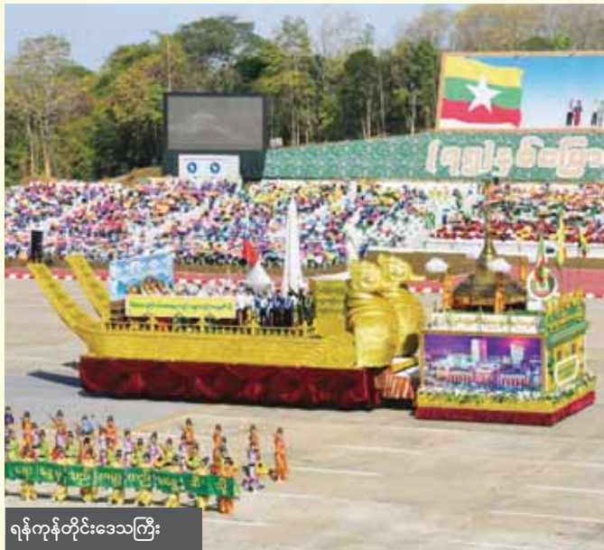
ရန်ကုန်တိုင်းဒေသကြီး