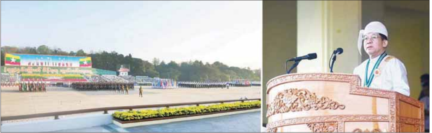
နိုင်ငံတော်စီမံအုပ်ချုပ်ရေးကောင်စီဥက္ကဋ္ဌ နိုင်ငံတော်ဝန်ကြီးချုပ် ဗိုလ်ချုပ်မှူးကြီး သတိုးမဟာသရေစည်သူ သတိုးသိရီသုဓမ္မ မင်းအောင်လှိုင် ၂၀၂၃ ခုနှစ် (၇၅) နှစ်မြောက် စိန်ရတုလွတ်လပ်ရေးနေ့ အခမ်းအနားတွင် မိန့်ခွန်းပြောကြားစဉ်။

စာမျက်နှာ ၄ မှ တပ်ရင်း(၂)အဖြစ်လည်းကောင်း၊ တပ်မတော်(လေ) အလံတော်အဖွဲ့၊ တပ်မတော်(လေ) ကိုယ်စားပြုတပ်ခွဲ၊ စီမံကိန်းနှင့် ဘဏ္ဍာရေးဝန်ကြီးဌာန ကိုယ်စားပြုတပ်ခွဲ၊ ဥပဒေရေးရာဝန်ကြီးဌာန ကိုယ်စားပြုတပ်ခွဲနှင့် ပြန်ကြားရေးဝန်ကြီးဌာန ကိုယ်စားပြုတပ်ခွဲတို့က တပ်ရင်း (၃) အဖြစ်လည်းကောင်း၊ မြန်မာနိုင်ငံရဲတပ်ဖွဲ့အလံတော်အဖွဲ့၊ မြန်မာနိုင်ငံရဲတပ်ဖွဲ့ ကိုယ်စားပြုတပ်ခွဲ၊ သာသနာရေးနှင့် ယဉ်ကျေးမှုဝန်ကြီးဌာန ကိုယ်စားပြုတပ်ခွဲ၊ စိုက်ပျိုးရေး၊ မွေးမြူရေးနှင့် ဆည်မြောင်းဝန်ကြီးဌာန ကိုယ်စားပြုတပ်ခွဲနှင့် မြန်မာနိုင်ငံရဲတပ်ဖွဲ့တိုးတိုးတပ်ခွဲတို့က တပ်ရင်း (၄) အဖြစ်လည်းကောင်း ချီတက်အလေးပြုကြသည်။ ဆက်လက်၍ မြန်မာနိုင်ငံ မီးသတ်တပ်ဖွဲ့အလံတော်အဖွဲ့၊ မြန်မာနိုင်ငံ မီးသတ်တပ်ဖွဲ့ ကိုယ်စားပြုတပ်ခွဲ၊ သမဝါယမနှင့် ကျေးလက်ဖွံ့ဖြိုးရေးဝန်ကြီးဌာန ကိုယ်စားပြုတပ်ခွဲ၊ ပို့ဆောင်ရေးနှင့် ဆက်သွယ်ရေးဝန်ကြီးဌာန ကိုယ်စားပြုတပ်ခွဲနှင့် သယံဇာတနှင့် သဘာဝပတ်ဝန်းကျင်ထိန်းသိမ်းရေးဝန်ကြီးဌာန ကိုယ်စားပြုတပ်ခွဲတို့က တပ်ရင်း (၅) အဖြစ်လည်းကောင်း၊ စီမံကိန်းနှင့် ဘဏ္ဍာရေးဝန်ကြီးဌာန အလံတော်အဖွဲ့၊ လူဝင်မှုကြီးကြပ်ရေးနှင့် ပြည်သူ့အင်အားဝန်ကြီးဌာန ကိုယ်စားပြုတပ်ခွဲ၊ လျှပ်စစ်ဓွမ်းအားဝန်ကြီးဌာန ကိုယ်စားပြုတပ်ခွဲ။