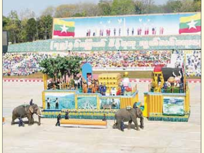
သယံဇာတနှင့် သဘာဝပတ်ဝန်းကျင်ထိန်းသိမ်းရေးဝန်ကြီးဌာန ဂုဏ်ပြုယာဉ်။