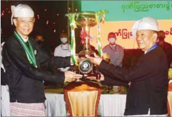
နိုင်ငံတော်စီမံအုပ်ချုပ်ရေးကောင်စီအဖွဲ့ဝင် ဗိုလ်ချုပ်ကြီး မြထွန်းဦး တိုင်းဒေသကြီး နှင့် ပြည်နယ်ဂုဏ်ပြုယာဉ် တတိယဆုရရှိသည့် မန္တလေးတိုင်းဒေသကြီးအတွက် ဂုဏ်ပြုဆုနှင့် ချီးမြှင့်ငွေများ တာဝန်ရှိသူတစ်ဦးထံ ပေးအပ်စဉ်။

ယင်းနောက် နိုင်ငံတော် စီမံအုပ်ချုပ်ရေးကောင်စီ ဥက္ကဋ္ဌ နိုင်ငံတော်ဝန်ကြီးချုပ်နှင့် ဇနီး တို့သည် ဂုဏ်ပြုဥပဒေစာပွဲသို့ တက်ရောက် လာကြသူများနှင့် အတူ ညစာကို အတူတကွ သုံးဆောင်ကြသည်။ ညစာ မသုံး ဆောင်မီနှင့် သုံးဆောင်နေစဉ် အတွင်း ပြန်ကြားရေးဝန်ကြီးဌာန မြန်မာ့အသံနှင့် ရုပ်မြင်သံကြားမှ အနုပညာရှင်များနှင့် သာသနာ ရေးနှင့် ယဉ်ကျေးမှုဝန်ကြီးဌာန အနုပညာဦးစီးဌာနမှ အနုပညာ ရှင်များက တေးသံသာများဖြင့် သီဆိုတီးမှုတ်ဖျော်ဖြေကြသည်။ ယင်းနောက် နိုင်ငံတော် စီမံအုပ်ချုပ်ရေးကောင်စီ ဥက္ကဋ္ဌ စာမျက်နှာ ၁၃ သို့