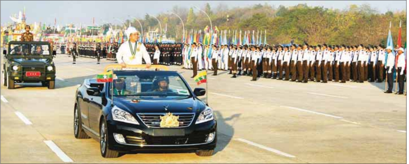
နိုင်ငံတော်စီမံအုပ်ချုပ်ရေးကောင်စီဥက္ကဋ္ဌ နိုင်ငံတော်ဝန်ကြီးချုပ် ဗိုလ်ချုပ်မှူးကြီး သတိုးမဟာသရေစည်သူ သတိုးသိရီသုဓမ္မ မင်းအောင်လှိုင် စစ်ရေးပြတပ်ရင်း၊ ဂုဏ်ပြုယာဉ်များ၊ တပ်မတော်နှင့် ပြည်ထဲရေးမှ ယန္တရားတပ်ခွဲများကို မော်တော်ယာဉ်ဖြင့် ကြည့်ရှုစစ်ဆေးစဉ်။

၇ ရှေ့ဖွံ့ဖြိုးမှု ဒေါ်ကြူကြူလှ၊ နိုင်ငံတော်စီမံအုပ်ချုပ်ရေးကောင်စီ ဒုတိယဥက္ကဋ္ဌ ဒုတိယဝန်ကြီးချုပ် ဒုတိယဗိုလ်ချုပ်မှူးကြီး သိရီပျံချီမဟာသရေစည်သူ စိုးဝင်းနှင့်ဇနီး ဒေါ်သန်းသန်းနွယ်၊ နိုင်ငံတော်စီမံအုပ်ချုပ်ရေးကောင်စီ အတွင်းရေးမှူး၊ ကောင်စီတွဲဖက်အတွင်းရေးမှူး၊ ကောင်စီဝင်များနှင့် ဇနီးများ၊ ဒုတိယသမ္မတ(ငြိမ်း) သရေစည်သူ ဒေါက်တာစိုင်းမောက်ခမ်းနှင့် ဇနီး၊ ဒုတိယသမ္မတ(ငြိမ်း) သရေစည်သူ ဦးဉာဏ်ထွန်းနှင့် ဇနီး၊ ခေတ်အဆက်ဆက် နိုင်ငံတော်တာဝန်များကို ထမ်းဆောင်ခဲ့ကြသည့် နိုင်ငံတော်အကြီးအကဲများ၏ မိသားစုဝင်များ၊ ပြည်ထောင်စုအဆင့်ပုဂ္ဂိုလ်များ၊ နိုင်ငံတော်စီမံအုပ်ချုပ်ရေးကောင်စီဥက္ကဋ္ဌ၏ အကြံပေးပုဂ္ဂိုလ်များ၊ တပ်မတော်မှ အငြိမ်းစားဗိုလ်ချုပ်ကြီးနှင့် ဒုတိယဗိုလ်ချုပ်ကြီးများ၊ ပြည်ထောင်စုဝန်ကြီးများနှင့် ဇနီးများ၊ ပြည်ထောင်စုအဆင့်အဖွဲ့အစည်းဝင်များ၊ နေပြည်တော်ကောင်စီဥက္ကဋ္ဌ၊ တိုင်းဒေသကြီးနှင့် ပြည်နယ်ဝန်ကြီးချုပ်များ၊ ကာကွယ်ရေးဦးစီးချုပ်ရုံးမှ တပ်မတော်အရာရှိကြီးများ၊ တိုင်းစစ်ဌာနချုပ် အသီးသီးမှ တိုင်းမှူးများ၊ ဒုတိယဝန်ကြီးများ၊ နိုင်ငံခြားသံရုံးများမှ သံအမတ်ကြီးများနှင့် သံရုံး