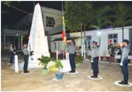
တနင်္သာရီမြို့နယ်