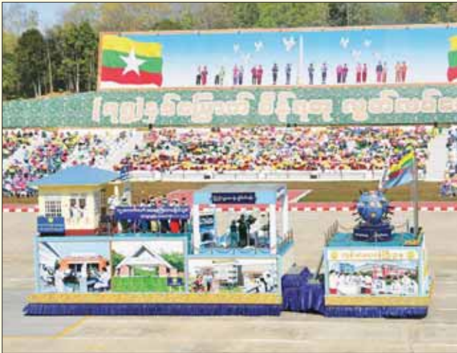
ကျန်းမာရေးဝန်ကြီးဌာန ဂုဏ်ပြုယာဉ်။