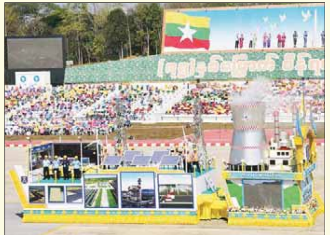
လျှပ်စစ်စွမ်းအားဝန်ကြီးဌာန ဂုဏ်ပြုယာဉ်။