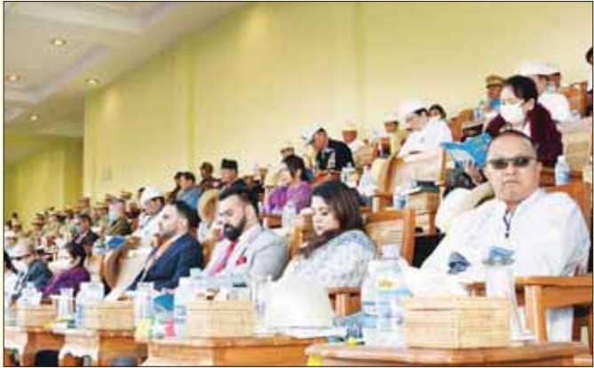
(၇၅) နှစ်မြောက် စိန်ရတုလွတ်လပ်ရေးနေ့အခမ်းအနားသို့ တက်ရောက်ကြသူများကို တွေ့ရစဉ်။