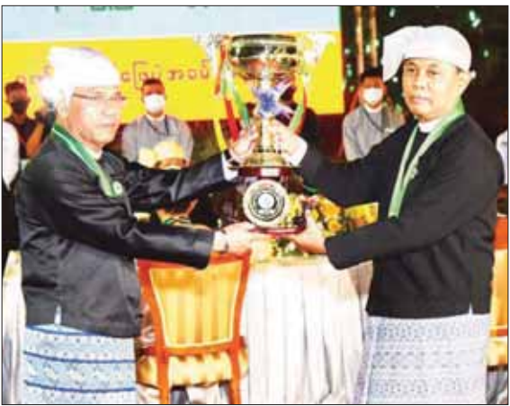
ပြည်ထောင်စုဝန်ကြီး ဦးမောင်မောင်အုန်း အထူးဆုရရှိသည့် ဂုဏ်ပြုယာဉ်မှ သူတစ်ဦးထံ ဂုဏ်ပြုဆုနှင့် ချီးမြှင့်ငွေများ ပေးအပ်ချီးမြှင့်စဉ်။

တက်ရောက် အဆိုပါ (၇၅) နှစ်မြောက် စိန်ရတုလွတ်လပ်ရေးနေ့ အထိမ်းအမှတ် ဂုဏ်ပြုညစာ စားပွဲ အခမ်းအနားသို့ နိုင်ငံတော် စီမံအုပ်ချုပ်ရေးကောင်စီ ဥက္ကဋ္ဌ နိုင်ငံတော်ဝန်ကြီးချုပ် ဗိုလ်ချုပ်မှူးကြီး သတိုးမဟာသရေစည်သူ သတိုးသိရိ သုဓမ္မ မင်းအောင်လှိုင် နှင့် ဇနီး ဒေါ်ကြူကြူလှ၊ နိုင်ငံတော် စီမံအုပ်ချုပ်ရေးကောင်စီ ဒုတိယဥက္ကဋ္ဌ ဒုတိယဝန်ကြီးချုပ် ဒုတိယဗိုလ်ချုပ်မှူးကြီး သိရိ ပျံချီ မဟာသရေစည်သူ စိုးဝင်း နှင့် ဇနီး ဒေါ်သန်းသန်းနွယ်၊ နိုင်ငံတော် စီမံအုပ်ချုပ်ရေးကောင်စီ အတွင်းရေးမှူး၊ ကောင်စီ တွဲဖက်အတွင်းရေးမှူး၊ ကောင်စီ