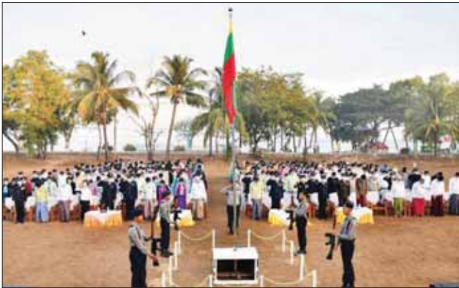
ရခိုင်ပြည်နယ် ကျောက်ဖြူမြို့နယ်၌ လွတ်လပ်ရေးနေ့ အလံတင်အခမ်းအနား ကျင်းပစဉ်။