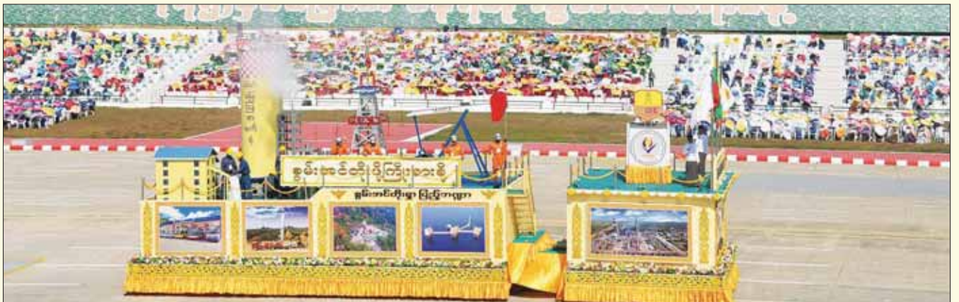
စွမ်းအင်ဝန်ကြီးဌာန ဂုဏ်ပြုယာဉ်။