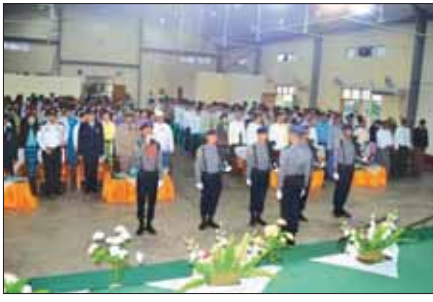
ရန်ကင်းမြို့နယ်