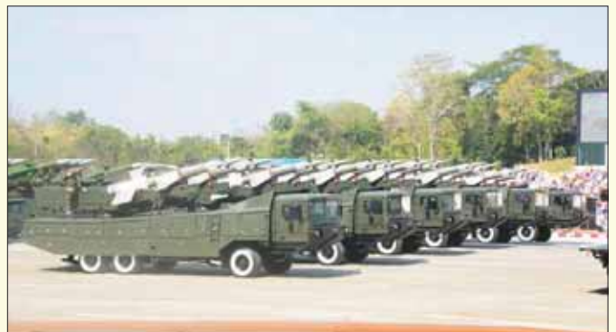
ယန္တရားစစ်ကြောင်း ချီတက်အလေးပြုစဉ်။