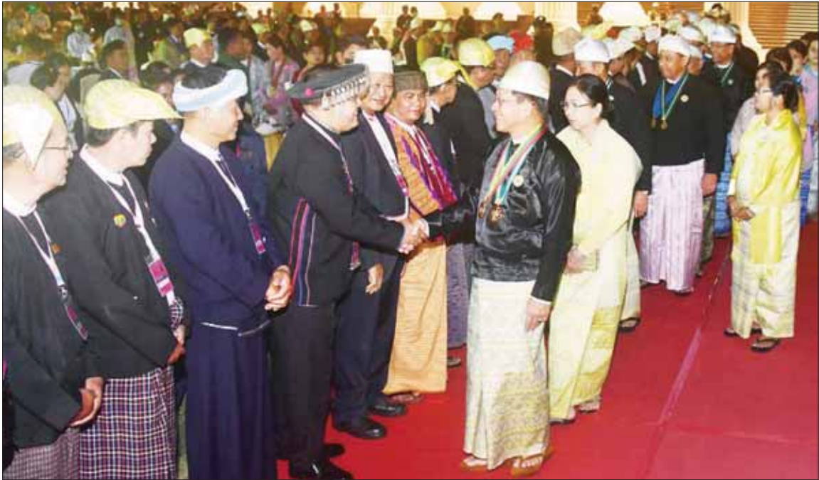
နိုင်ငံတော်စီမံအုပ်ချုပ်ရေးကောင်စီဥက္ကဋ္ဌ နိုင်ငံတော်ဝန်ကြီးချုပ် ဗိုလ်ချုပ်မှူးကြီး သတိုးမဟာသရေစည်သူ သတိုးသီရိသုဓမ္မ မင်းအောင်လှိုင်နှင့် ဇနီး ဒေါ်ကြူကြူလှတို့ (၇၅) နှစ်မြောက် စိန်ရတုလွတ်လပ်ရေးနေ့ အထိမ်းအမှတ်ဂုဏ်ပြုဥပဒေစာပွဲနှင့် ဂုဏ်ပြုချီးမြှင့်ပွဲအခမ်းအနားသို့ တက်ရောက်လာကြသည့် တိုင်းရင်းသားလက်နက်ကိုင် အဖွဲ့အစည်းများမှ ကိုယ်စားလှယ်များအား ရင်းရင်းနှီးနှီး နှုတ်ဆက်စဉ်။

ဆက်လက်၍ နိုင်ငံတော် စီမံအုပ်ချုပ်ရေးကောင်စီ ဥက္ကဋ္ဌ နိုင်ငံတော်ဝန်ကြီးချုပ်က (၇၅)နှစ် မြောက် စိန်ရတုလွတ်လပ်ရေး နေ့ကို ဂုဏ်ပြုသောအားဖြင့် ဗိုလ်ရှစ်ရင်ပြင်သို့ လေထီးအလွတ် ခုန့်ဆင်းသက်ပြီး နိုင်ငံတော် အကြီးအကဲအား ဂါရဝပြုခဲ့ကြ သည့် လေထီး အရာရှိ စစ်သည်၊ စစ်သမီးနှင့် အခြားအဆင့် လေထီးစစ်သည်၊ စစ်သမီး များအားဂုဏ်ပြုဆုများကိုပေးအပ် ချီးမြှင့်ပြီး တိုင်းဒေသကြီးနှင့် ပြည်နယ် ဂုဏ်ပြုယာဉ် ပထမ ဆုရရှိသည့် ဧရာဝတီတိုင်း ဒေသကြီးအတွက် ဂုဏ်ပြုဆုနှင့် ဂုဏ်ပြုချီးမြှင့်ငွေများကို ဝန်ကြီး ချုပ် ဦးတင်မောင်ဝင်း ကို လည်းကောင်း၊ ပြည်ထောင်စု ဝန်ကြီးဌာန ဂုဏ်ပြုယာဉ် ပထမ ဆုရရှိသည့် သယံဇာတနှင့် သဘာဝပတ်ဝန်းကျင် ထိန်းသိမ်း ရေး ဝန်ကြီးဌာနအတွက် ပြည် ထောင်စုဝန်ကြီး ဦးခင်မောင်ရီ ကို လည်းကောင်း ဂုဏ်ပြုဆုနှင့် ဂုဏ်ပြုချီးမြှင့်ငွေများ ပေးအပ် ချီးမြှင့်သည်။