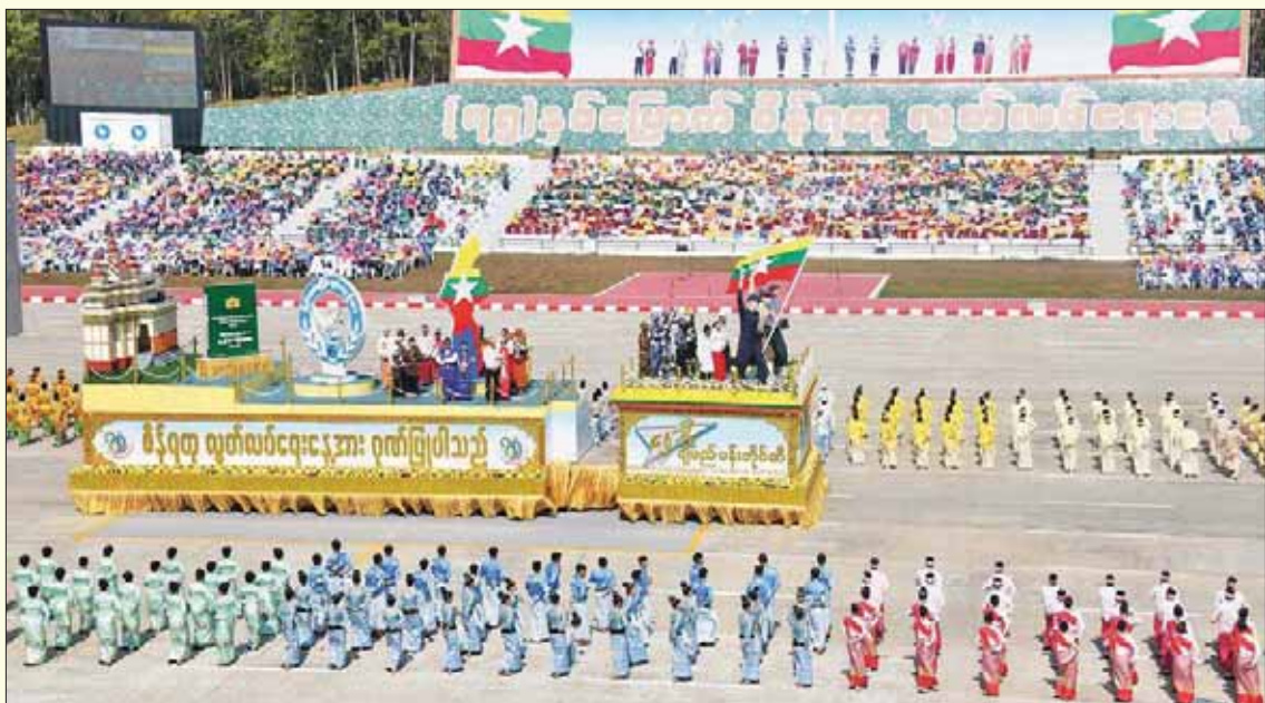
စိန်ရတနာသီချင်း ဂုဏ်ပြုယာဉ်နှင့်အတူ ယဉ်ကျေးမှုအကအဖွဲ့များက "ပြည့်ရတနာသီချင်း" ဖြင့် ကပြဖျော်ဖြေတင်ဆက်မှုကို တွေ့ရစဉ်။

မြန်မာနိုင်ငံ အတွင်းရှိ တိုင်းဒေသကြီးနှင့် ပြည်နယ်တို့ရှိ ထင်ရှားသည့် အထိမ်း အမှတ်များ၊ လူနေမှု စရိုက်လက္ခဏာများ၊ ဓလေ့ထုံးတမ်းအစဉ် အလာများနှင့် ထုတ်ကုန်များကို သရုပ်ဖော် ပြသထားသည့် ဂုဏ်ပြု ယာဉ်များနှင့် ဖျော်ဖြေရေး အဖွဲ့များက တေးသီချင်း အကအလှများဖြင့် ချီတက်သရုပ်ပြ ဖျော်ဖြေ တင်ဆက်မှု ဓာတ်ပုံမြင်ကွင်းများ။