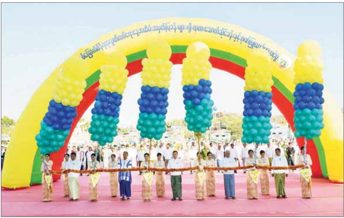
နိုင်ငံတော်စီမံအုပ်ချုပ်ရေးကောင်စီ ဒုတိယဥက္ကဋ္ဌ ဒုတိယဝန်ကြီးချုပ် ဒုတိယဗိုလ်ချုပ်မှူးကြီး စိုးဝင်း၊ နိုင်ငံတော်စီမံအုပ်ချုပ်ရေးကောင်စီဝင် မန်းငြိမ်းမောင်နှင့် စောဒန်နီယယ်၊ ပြည်ထောင်စုဝန်ကြီးဦးမောင်မောင်အုန်းနှင့် နေပြည်တော်ကောင်စီဥက္ကဋ္ဌ ဦးတင်ဦးလွင်တို့က (၇၅) နှစ်မြောက် စိန်ရတုလွတ်လပ်ရေးနေ့ အထိမ်းအမှတ်ပြခန်းများ၊ တိုင်းရင်းသားရိုးရာ အစားအစာပြခန်းများနှင့် ဂုဏ်ပြုယာဉ်များ ဖွင့်ပွဲအခမ်းအနားကို ဖဲကြိုးဖြတ် ဖွင့်လှစ်ပေးကြစဉ်။

နိုင်ငံတော် စီမံအုပ်ချုပ်ရေးကောင်စီ ဒုတိယဥက္ကဋ္ဌ ဒုတိယဝန်ကြီးချုပ် ဒုတိယဗိုလ်ချုပ်မှူးကြီး စိုးဝင်းနှင့်အဖွဲ့ဝင်များ နေပြည်တော်ကောင်စီ၊ တိုင်းဒေသကြီးနှင့် ပြည်နယ် တိုင်းရင်းသားရိုးရာ ယ်မ်းအဖွဲ့များ၏ ကပြဖျော်ဖြေတင်ဆက်မှုကို ကြည့်ရှုအားပေးစဉ်။