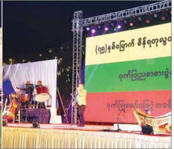
နိုင်ငံတော်စီမံအုပ်ချုပ်ရေးကောင်စီဥက္ကဋ္ဌ နိုင်ငံတော်ဝန်ကြီးချုပ် ဗိုလ်ချုပ်မှူးကြီး မင်းအောင်လှိုင်၊ ဇနီး ဒေါ်ကြူကြူလှနှင့် အခမ်းအနားတက်ရောက်လာကြသူများ အနုပညာရှင်များ၏ တေးသံသာများဖြင့် သီဆိုဖျော်ဖြေမှုများကို ကြည့်ရှုအားပေးကြစဉ်။

စာမျက်နှာ ၁၂ မှ နိုင်ငံတော်ဝန်ကြီးချုပ်နှင့် ဇနီး တို့သည် ဂုဏ်ပြုညစာစားပွဲအခမ်းအနားသို့ တက်ရောက်လာကြသူများနှင့်အတူ စိန်ရတုလွတ်လပ်ရေးနေ့ အထိမ်းအမှတ် (၇၅)နှစ်မြောက် စိန်ရတုလွတ်လပ်ရေးနေ့ စာတန်း၊ ဗုဒ္ဓဘာသာကလျာဏယုဝအသင်းတံဆိပ်၊ တို့ဗမာအစည်းအရုံးတံဆိပ်၊ BIA တံဆိပ်၊ BDA တံဆိပ်၊ လွတ်လပ်ရေးနေ့ အလံတင် အခမ်းအနား သရုပ်ဖော်ပုံ၊ လွတ်လပ်ရေး ကျောက်တိုင်ပုံ၊ တပ်မတော်မှ ယာဉ်ယန္တရားများ ရေငုပ်သင်္ဘောနှင့် လေယာဉ်ပုံ၊ နိုင်ငံတော် စီမံအုပ်ချုပ်ရေးကောင်စီဥက္ကဋ္ဌ နိုင်ငံတော်ဝန်ကြီးချုပ်၏ပုံ၊ မြန်မာနိုင်ငံမြေပုံတို့ကို Drone ယာဉ်ငယ်များဖြင့် သရုပ်ပြလွှတ်တင်မှုနှင့် မီးရှူးမီးပန်းများ ပစ်ဖောက်ခြင်းကို ကြည့်ရှုအားပေးကြသည်။