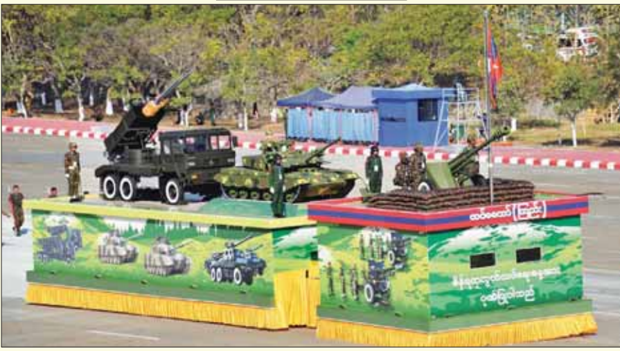
တပ်မတော် (ကြည်း) ဂုဏ်ပြုယာဉ် ချီတက်အလေးပြုစဉ်။