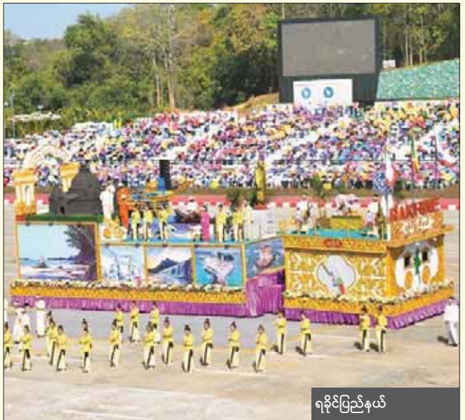
ရခိုင်ပြည်နယ်