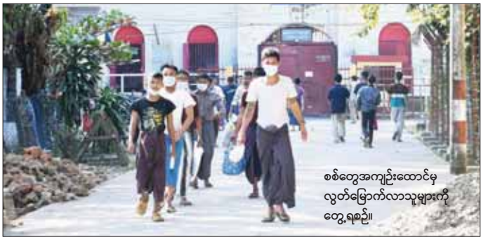
စစ်တွေအကျဉ်းထောင်မှ လွတ်မြောက်လာသူများကို တွေ့ရစဉ်။

(၇၅)နှစ်မြောက် စိန်ရတုလွတ်လပ်ရေးနေ့ ဂုဏ်ပြုသောအားဖြင့် နိုင်ငံတစ်ဝန်းရှိ အကျဉ်းထောင်၊ အချုပ်ထောင်၊ စခန်းအသီးသီးမှ ပြစ်ဒဏ်ကျခံနေရသည့် အကျဉ်းသား၊ အကျဉ်းသူ ၇၀၁၂ ဦး လွတ်ငြိမ်းခွင့်ပြု နေပြည်တော် ဇန်နဝါရီ ၄ ပြည်ထောင်စုသမ္မတမြန်မာနိုင်ငံတော်၊ နိုင်ငံတော်စီမံအုပ်ချုပ်ရေး ကောင်စီသည် ယနေ့တွင် ကျရောက်သည့် (၇၅)နှစ်မြောက် စိန်ရတုလွတ်လပ်ရေးနေ့ အထိမ်းအမှတ်နေ့ကို ဂုဏ်ပြုသောအားဖြင့် ပြည်သူ့လူထုနှလုံးစိတ်ဝမ်းအေးချမ်းစေရန်နှင့် လူမှုရေးအရ ငဲ့ညှာထောက်ထားပြီး နိုင်ငံတော်၏ မေတ္တာနှင့်စေတနာကို စာမျက်နှာ ၂၀ ကော်လံ ၁ ❖