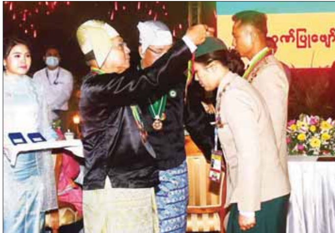
နိုင်ငံတော်စီမံအုပ်ချုပ်ရေးကောင်စီဥက္ကဋ္ဌ နိုင်ငံတော်ဝန်ကြီးချုပ် ဗိုလ်ချုပ်မှူးကြီး သတိုးမဟာသရေစည်သူ သတိုးသီရိသုဓမ္မ မင်းအောင်လှိုင် (၇၅) နှစ်မြောက် စိန်ရတုလွတ်လပ်ရေးနေ့ကို ဂုဏ်ပြုသောအားဖြင့် ဗိုလ်ရှစ်ရင်ပြင်သို့ လေထီးအလွတ်ခုန့်ဆင်းသက်ပြီး နိုင်ငံတော်အကြီးအကဲအား ဂါရဝပြုခဲ့ကြသည့် လေထီးအရာရှိ၊ စစ်သည်၊ စစ်သမီးများအား ဂုဏ်ပြုဆုများ ပေးအပ်ချီးမြှင့်စဉ်။