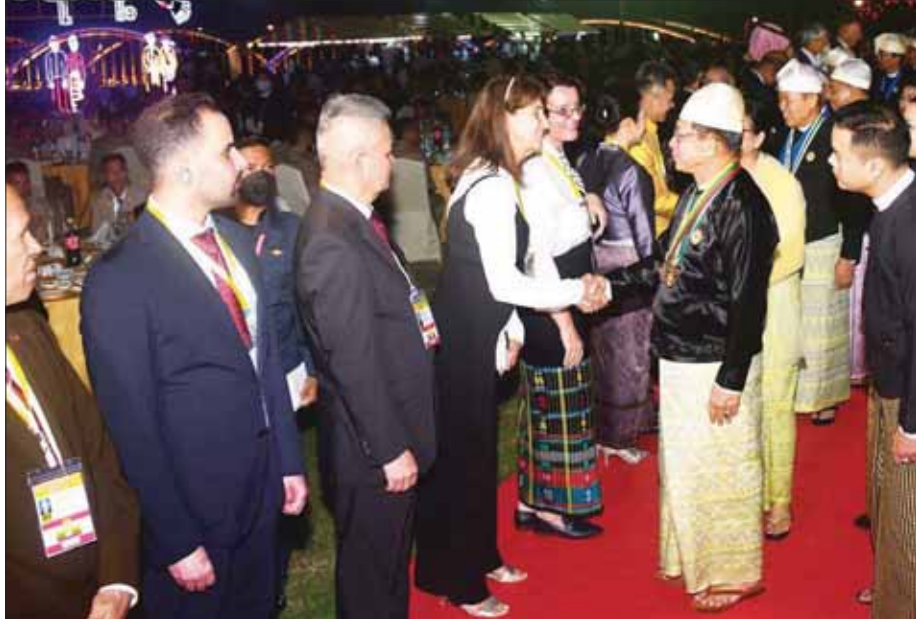
နိုင်ငံတော်စီမံအုပ်ချုပ်ရေးကောင်စီဥက္ကဋ္ဌ နိုင်ငံတော်ဝန်ကြီးချုပ် ဗိုလ်ချုပ်မှူးကြီး သတိုးမဟာသရေစည်သူ သတိုးသီရိသုဓမ္မ မင်းအောင်လှိုင်နှင့် ဇနီး ဒေါ်ကြူကြူလှတို့ (၇၅) နှစ်မြောက် စိန်ရတုလွတ်လပ်ရေးနေ့ အထိမ်းအမှတ် ဂုဏ်ပြုညစာစားပွဲ နှင့် ဂုဏ်ပြုဖျော်ဖြေပွဲအခမ်းအနားသို့ တက်ရောက်လာကြသည့် နိုင်ငံခြားသံရုံးများမှ သံအမတ်ကြီးများနှင့် သံရုံးတာဝန်ခံများအား ရင်းရင်းနှီးနှီး နှုတ်ဆက်စဉ်။

ယာဉ် တတိယဆုရရှိသည့် ဂုဏ်ပြုယာဉ် ဒုတိယဆုရရှိ မန္တလေးတိုင်းဒေသကြီးနှင့် ပြည် သည့် ပဲခူးတိုင်းဒေသကြီးအတွက် ထောင်စုဝန်ကြီးဌာန ဂုဏ်ပြု ဂုဏ်ပြုဆုနှင့် ဂုဏ်ပြုချီးမြှင့်ငွေ ယာဉ် တတိယဆု ရရှိသည့် များကို ဝန်ကြီးချုပ် ဦးမျိုးဆွေဝင်း ဆောက်လုပ်ရေး ဝန်ကြီးဌာန ကို လည်းကောင်း၊ ပြည်ထောင်စု တို့အတွက် ဂုဏ်ပြုဆုနှင့် ချီးမြှင့် ဝန်ကြီးဌာန ဂုဏ်ပြုယာဉ် ဒုတိယ ငွေများကို တာဝန်ရှိသူများထံ ပေးအပ်ချီးမြှင့်သည်။ ပေးအပ်ချီးမြှင့် ဂုဏ်ပြုဆုနှင့် ဂုဏ်ပြုချီးမြှင့်ငွေ ယင်းနောက် နိုင်ငံတော် များကို ပြည်ထောင်စုဝန်ကြီး စီမံအုပ်ချုပ်ရေးကောင်စီ ဒုတိယ ဗိုလ်ချုပ်ကြီး တင်အောင်စန်းကို ဥက္ကဋ္ဌ ဒုတိယဝန်ကြီးချုပ်က လည်းကောင်း ပေးအပ်ချီးမြှင့် တိုင်းဒေသကြီးနှင့် ပြည်နယ် သည်။ စာမျက်နှာ ၁၂ သို့