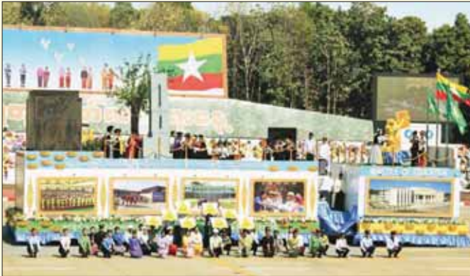
ပညာရေးဝန်ကြီးဌာန ဂုဏ်ပြုယာဉ်။