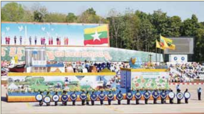
စီးပွားရေးနှင့် ကူးသန်းရောင်းဝယ်ရေးဝန်ကြီးဌာန ဂုဏ်ပြုယာဉ်။