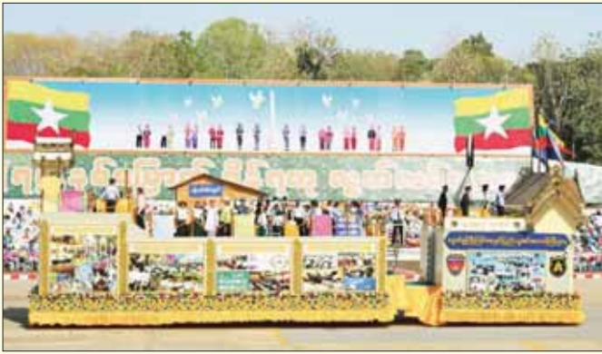
လူဝင်မှုကြီးကြပ်ရေးနှင့် ပြည်သူ့အင်အားဝန်ကြီးဌာန ဂုဏ်ပြုယာဉ်။