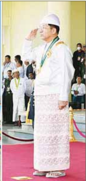
နိုင်ငံတော်စီမံအုပ်ချုပ်ရေးကောင်စီဥက္ကဋ္ဌ နိုင်ငံတော်ဝန်ကြီးချုပ် ဗိုလ်ချုပ်မှူးကြီး သတိုးမဟာသရေစည်သူ သတိုးသီရိသုဓမ္မ မင်းအောင်လှိုင် အား ဂုဏ်ပြုစစ်ကြောင်းများက ချီတက်အလေးပြုကြစဉ်။