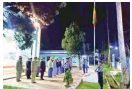
မိုင်းယောင်းမြို့နယ်