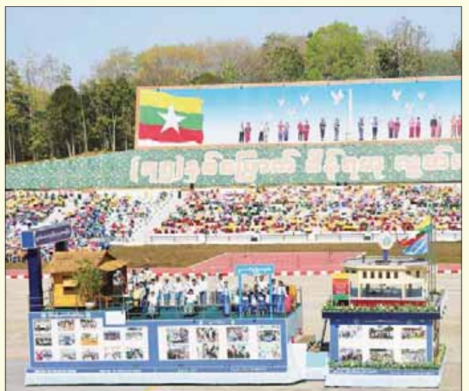
လူမှုဝန်ထမ်း၊ ကယ်ဆယ်ရေးနှင့် ပြန်လည်နေရာချထားရေးဝန်ကြီးဌာန ဂုဏ်ပြုဖွဲ့စည်းမှု။