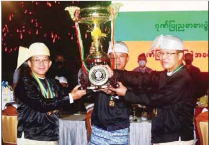
နိုင်ငံတော်စီမံအုပ်ချုပ်ရေးကောင်စီဥက္ကဋ္ဌ နိုင်ငံတော်ဝန်ကြီးချုပ် ဗိုလ်ချုပ်မှူးကြီး သတိုးမဟာသရေစည်သူ သတိုးသီရိသုဓမ္မ မင်းအောင်လှိုင် တိုင်းဒေသကြီးနှင့် ပြည်နယ် ဂုဏ်ပြုယာဉ် ပထမဆုရရှိသည့် ဧရာဝတီ တိုင်းဒေသကြီးအတွက် ဂုဏ်ပြုဆုနှင့် ဂုဏ်ပြုချီးမြှင့်ငွေများ ဝန်ကြီးချုပ် ဦးတင်မောင်ဝင်းအား ပေးအပ် ချီးမြှင့်စဉ်။

ယင်းနောက် နိုင်ငံတော် စီမံအုပ်ချုပ်ရေးကောင်စီ ဥက္ကဋ္ဌ နိုင်ငံတော်ဝန်ကြီးချုပ်နှင့် ဇနီး တို့သည် ဂုဏ်ပြုဥပဒေစာပွဲသို့ တက်ရောက် လာကြသူများနှင့် အတူ ညစာကို အတူတကွ သုံးဆောင်ကြသည်။ ညစာ မသုံး ဆောင်မီနှင့် သုံးဆောင်နေစဉ် အတွင်း ပြန်ကြားရေးဝန်ကြီးဌာန မြန်မာ့အသံနှင့် ရုပ်မြင်သံကြားမှ အနုပညာရှင်များနှင့် သာသနာ ရေးနှင့် ယဉ်ကျေးမှုဝန်ကြီးဌာန အနုပညာဦးစီးဌာနမှ အနုပညာ ရှင်များက တေးသံသာများဖြင့် သီဆိုတီးမှုတ်ဖျော်ဖြေကြသည်။ ယင်းနောက် နိုင်ငံတော် စီမံအုပ်ချုပ်ရေးကောင်စီ ဥက္ကဋ္ဌ စာမျက်နှာ ၁၃ သို့