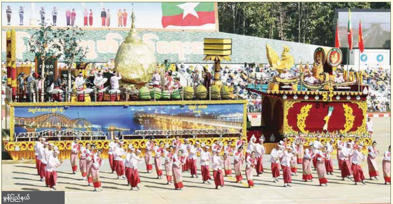
ဧရာဝတီပြည်နယ်