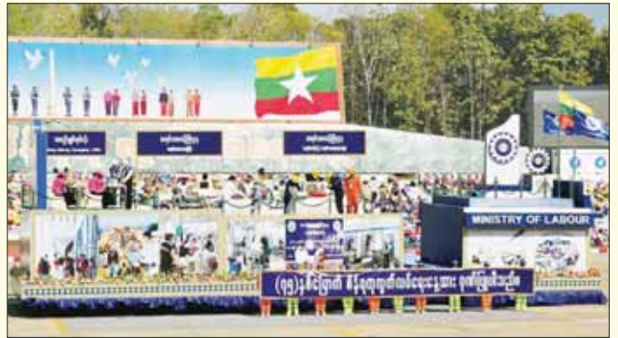
အလုပ်သမားဝန်ကြီးဌာန ဂုဏ်ပြုယာဉ်။