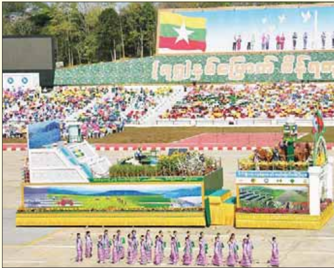
စိုက်ပျိုးရေး၊ မွေးမြူရေးနှင့် ဆည်မြောင်းဝန်ကြီးဌာန ဂုဏ်ပြုဖွဲ့စည်းမှု။