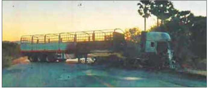
KKO (ခွဲထွက်)အဖွဲ့နှင့် PDF အမည်ခံအကြမ်းဖက်သမားများက ကော့ကရိတ်-မြဝတီသွား အာရှလမ်းမကြီး၌ မော်တော်ယာဉ်ဖြင့် နှောင့်ယှက်ပိတ်ဆို့ထားမှုကို တွေ့ရစဉ်။

အကြောင်းမဲ့ မိုင်းထောင်ဖောက်ခွဲ တိုက်ခိုက်ခြင်း၊ မော်တော်ယာဉ်များအား မီးရှို့ဖျက်ဆီး၍ အဆိုပါလမ်းမကြောင်းအား နှောင့်ယှက်ပိတ်ဆို့ ခဲ့သဖြင့် ဒေသခံပြည်သူများအနေဖြင့် ဘေးလွတ်ရာသို့ ထွက်ပြေး တိမ်းရှောင်ခဲ့ရပြီး မော်တော်ယာဉ် ဖြတ်သန်းသွားလာမှုများ ခေတ္တ ရပ်ဆိုင်းခဲ့ကာ ကုန်စည်စီးဆင်းမှု ရပ်တန့်သွားခဲ့သည်။ ထိုသို့ KKO (ခွဲထွက်)အဖွဲ့နှင့် PDF အမည်ခံအကြမ်းဖက်သမားများ နှောင့်ယှက်ပိတ်ဆို့ထားသည့် အဆိုပါဒေသတစ်ဝိုက်အား တပ်မတော် စစ်ကြောင်းများက အဆင့်ဆင့် ပြန်လည်ထိန်းချုပ်တိုက်ခိုက်ခဲ့ပြီး ကော့ကရိတ်-မြဝတီသွား အာရှလမ်းမကြီးတစ်လျှောက် မော်တော်ယာဉ်များ ပုံမှန်အတိုင်း ပြန်လည်ပြေးဆွဲသွားလာနိုင်ရေး ဆောင်ရွက်ခဲ့ရာ ဇန်နဝါရီ ၄ ရက်နှင့် ယနေ့တို့တွင်လည်း KKO (ခွဲထွက်)အဖွဲ့နှင့် PDF အမည်ခံအကြမ်းဖက်သမားများအနေဖြင့် တတန်ကူးကျေးရွာ၏ အရှေ့မြောက်ဘက် မီတာ ၂၀၀ ခန့်အကွာတွင် ၂ ဘီးယာဉ်တစ်စီးနှင့် ယာဉ်ငယ်တစ်စီးတို့ဖြင့် လည်းကောင်း၊ ယင်းကျေးရွာ၏ အရှေ့ မြောက်ဘက် မီတာ ၂၅၀ ခန့်အကွာတွင် ၂ ဘီးယာဉ် ၃ စီးဖြင့် လည်းကောင်း ကန်လန်ဖြတ်ပိတ်ဆို့၍ လမ်းကြောင်းပိတ်ဆို့မှုများ ဖြစ်ပေါ်စေရေး နှောင့်ယှက်မှုများကို ပြုလုပ်လာခဲ့သဖြင့် နယ်မြေ လုံခြုံရေးဆောင်ရွက်လျက်ရှိသည့် လုံခြုံရေးတပ်ဖွဲ့ဝင်များက လိုအပ်သည့် နယ်မြေလုံခြုံရေးလုပ်ငန်းများ ဆောင်ရွက်ခဲ့ပြီး လမ်းမကြီး တစ်လျှောက်အား ပြန်လည်ထိန်းချုပ်ခဲ့သည်။ ထိုကဲ့သို့ လုံခြုံရေးတပ်ဖွဲ့ဝင်များ၏ နယ်မြေလုံခြုံရေးလုပ်ငန်းများ ဆောင်ရွက်ပေးခဲ့မှုကြောင့် အဆိုပါလမ်းမကြီးတစ်လျှောက်တွင် ယနေ့ မွန်းလွဲပိုင်းမှစ၍ မော်တော်ယာဉ်များ ဘေးကင်းစွာဖြင့် ပုံမှန်အတိုင်း ပြန်လည် သွားလာလျက်ရှိကြောင်း သတင်းရရှိသည်။ သတင်းစဉ်