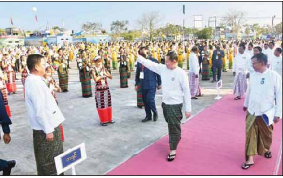
နိုင်ငံတော်စီမံအုပ်ချုပ်ရေးကောင်စီ ဒုတိယဥက္ကဋ္ဌ ဒုတိယဝန်ကြီးချုပ် ဒုတိယဗိုလ်ချုပ်မှူးကြီး စိုးဝင်း တိုင်းဒေသကြီးနှင့် ပြည်နယ် တိုင်းရင်းသားရိုးရာ ယ်မ်းအဖွဲ့ဝင်များအား ရင်းရင်းနှီးနှီး လိုက်လံနှုတ်ဆက်စဉ်။

၅၅ ခန်းနှင့် ဝန်ကြီးဌာနများ အလိုက်ကိုယ်စားပြု ဂုဏ်ပြုယာဉ် ၂၆ စီး၊ နေပြည်တော်ကောင်စီ၊ တိုင်းဒေသကြီးနှင့် ပြည်နယ် ကိုယ်စားပြု ဂုဏ်ပြုယာဉ် ၁၅ စီး၊ (၇၅)နှစ်မြောက် စိန်ရတုလွတ်လပ်ရေးနေ့ ဂုဏ်ပြုယာဉ်တစ်စီး၊ ပြည်ထောင်စုနောက်ပိတ် ဂုဏ်ပြုယာဉ်တစ်စီးနှင့် တပ်မတော် ကိုယ်စားပြု ဂုဏ်ပြုယာဉ်ငါးစီး စုစုပေါင်းဂုဏ်ပြုယာဉ် ၄၈ စီး တို့ကို ပြသသွားမည်ဖြစ်ပြီး ပြည်သူများအားလုံး အခမဲ့ လာရောက်လည်ပတ် လေ့လာနိုင် ပါကြောင်းနှင့် လုံခြုံရေးတင်းကျပ်မှုအရ ဖြိုဝင်/ထွက် နေရာများ၊ ပြခန်း ဝင်/ထွက် နေရာများ ၌ လုံခြုံရေးတပ်ဖွဲ့ဝင်များ၏ စနစ်တကျ စစ်ဆေးရှာဖွေမှုများကို ကြည့်ရှုစွာ နားလည်လက်ခံပေးနိုင်ရေး သက်ဆိုင်ရာမှ မေတ္တာရပ်ခံထားကြောင်း သတင်းရရှိသည်။ သတင်းစဉ်