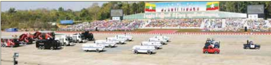
ပြည်ထဲရေးဝန်ကြီးဌာန ယန္တရားတပ်ခွဲ ချီတက်အလေးပြုစဉ်။