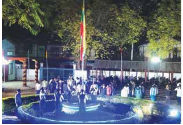
မိုးနဲမြို့နယ်၌ ကျင်းပသည့် လွတ်လပ်ရေးနေ့ အလံတင်အခမ်းအနားတွင် နိုင်ငံတော်အလံကို ဌာနဆိုင်ရာများနှင့် ပြည်သူများ အလေးပြုနေစဉ်။