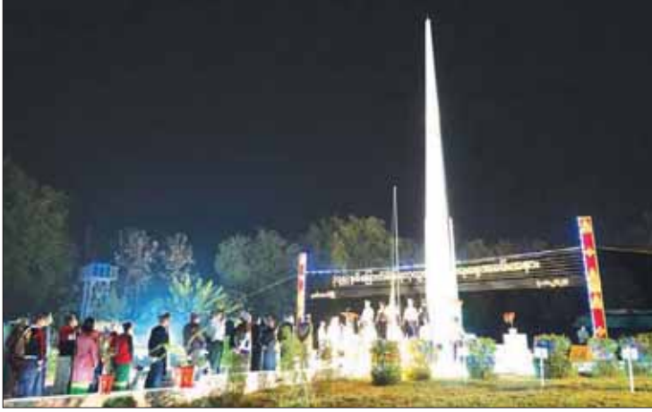
နတ်မောက်မြို့နယ်၌ နိုင်ငံတော်အလံကို ပြည်သူများ အလေးပြုနေစဉ်။