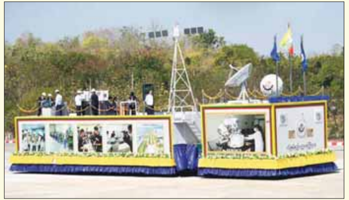
သိပ္ပံနှင့် နည်းပညာဝန်ကြီးဌာန ဂုဏ်ပြုယာဉ်။