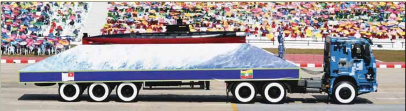
တပ်မတော် (ရေ) ယန္တရားတပ်ခွဲ ချီတက်အလေးပြုစဉ်။