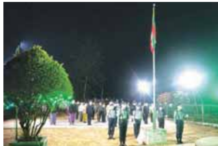
လဲချားမြို့နယ်