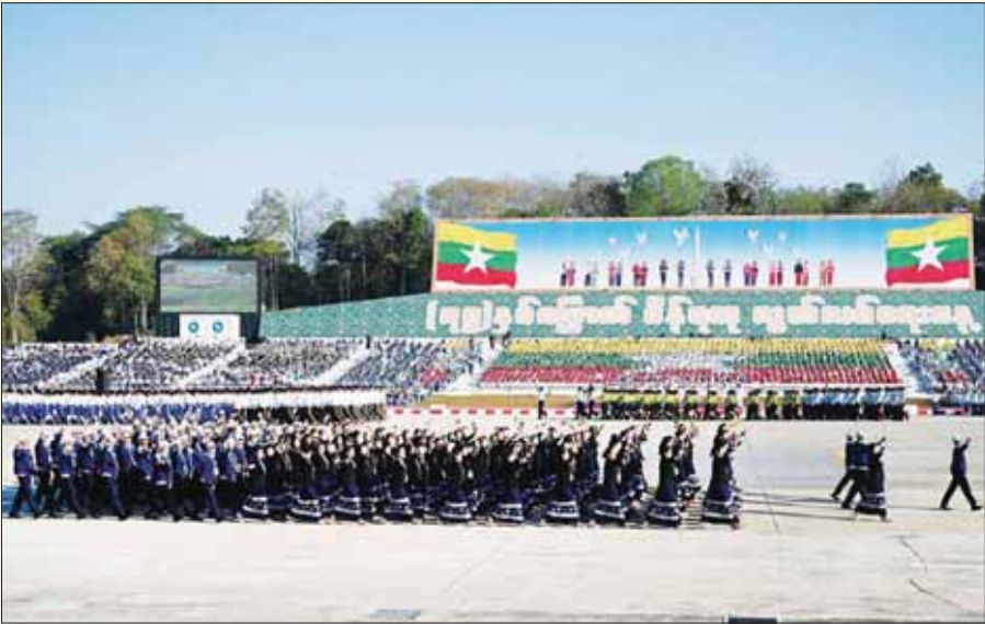
ပို့ဆောင်ရေးနှင့် ဆက်သွယ်ရေးဝန်ကြီးဌာနကိုယ်စားပြုတပ်ခွဲ ချီတက်အလေးပြုစဉ်။