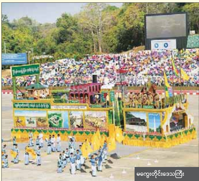
မကွေးတိုင်းဒေသကြီး