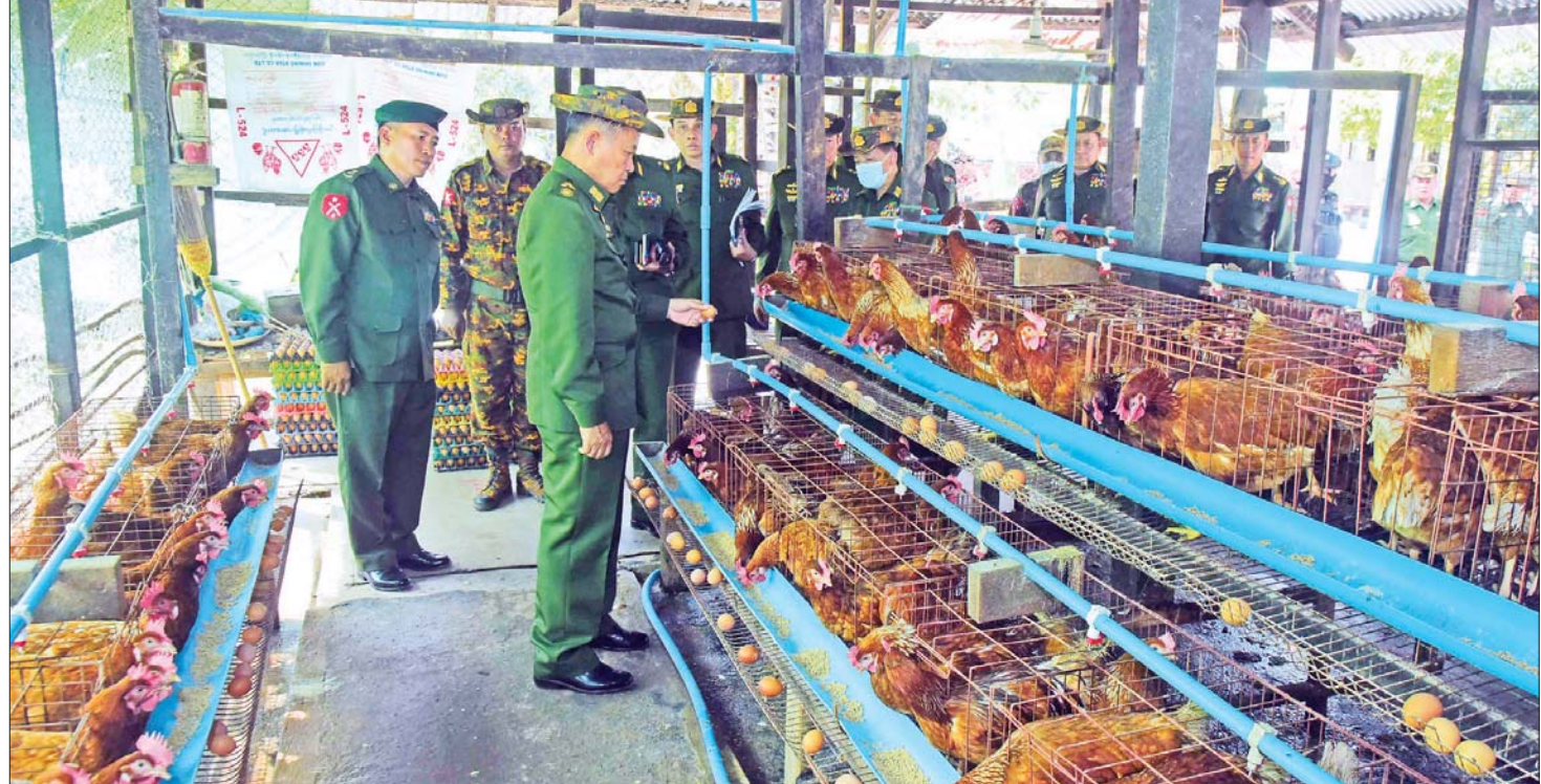
နိုင်ငံတော်စီမံအုပ်ချုပ်ရေးကောင်စီ ဒုတိယဥက္ကဋ္ဌ ဒုတိယတပ်မတော်ကာကွယ်ရေးဦးစီးချုပ် ကာကွယ်ရေးဦးစီးချုပ်(ကြည်း) ဒုတိယဗိုလ်ချုပ်မှူးကြီး စိုးဝင်း တပ်မတော် (ကြည်း) အရာခံနှင့် အကြပ်ကြီးသင်ကျောင်း မွေးမြူရေးခြံတွင် ဥစားကြက်မွေးမြူထားရှိမှုကို ကြည့်ရှုစစ်ဆေးစဉ်။

ယင်းနောက် နိုင်ငံတော်စီမံအုပ်ချုပ်ရေးကောင်စီ ဒုတိယဥက္ကဋ္ဌ ဒုတိယတပ်မတော် ကာကွယ်ရေးဦးစီးချုပ် ကာကွယ်ရေးဦးစီးချုပ်(ကြည်း)နှင့် အဖွဲ့ဝင်များသည် တပ်မတော် ဘီစကစ်နှင့် ခေါက်ဆွဲစက်ရုံ(မှော်ဘီ) သို့ရောက်ရှိရာ စက်ရုံအစည်းအဝေးခန်းမတွင် စက်ရုံမှူး ဗိုလ်မှူး ကျော်ဖြိုးဝေ (အငြိမ်းစား) က စက်ရုံ၏ သမိုင်းအကျဉ်း၊ ဘီစကစ်နှင့် ခေါက်ဆွဲများ ထုတ်လုပ်မှုအဆင့်ဆင့်တို့ကို ရှင်းလင်းတင်ပြရာ နိုင်ငံတော်စီမံအုပ်ချုပ်ရေးကောင်စီ ဒုတိယဥက္ကဋ္ဌ ဒုတိယတပ်မတော် ကာကွယ်ရေးဦးစီးချုပ် ကာကွယ်ရေးဦးစီးချုပ် (ကြည်း)က စက်ရုံထုတ် စားသောက်ကုန်ပစ္စည်းများ ထုတ်လုပ်ရာတွင် အနံ့အရသာ၊ ဆွဲဆောင်မှု စသည့် ပစ္စည်းအရည်အသွေးကောင်းမွန်ရေး၊ ဈေးကွက်ရရှိရေး၊ ထုပ်ပိုးကုန်များ စနစ်တကျနှင့် စားသုံးသူဆွဲဆောင်မှု ရှိရေး၊ စက်စွမ်းအားပြည့်ထုတ်လုပ်နိုင်ရေးနှင့် စက်များ ရေရှည်အသုံးပြုနိုင်ရေး စနစ်တကျစစ်ဆေး ပြုပြင်ထိန်းသိမ်း ကိုင်တွယ်ဆောင်ရွက်ရေး၊ တပ်မတော်သား မိသားစုများသာမက ပြင်ပဈေးကွက်ကိုပါ သက်သာသော ဈေးနှုန်းများဖြင့် ရောင်းချနိုင်ရေး ကြိုးပမ်းဆောင်ရွက်ရန် ဆွေးနွေးမှာကြားပြီး လိုအပ်သည်များ ပေါင်းစပ်ညှိနှိုင်းဆောင်ရွက်ပေးသည်။