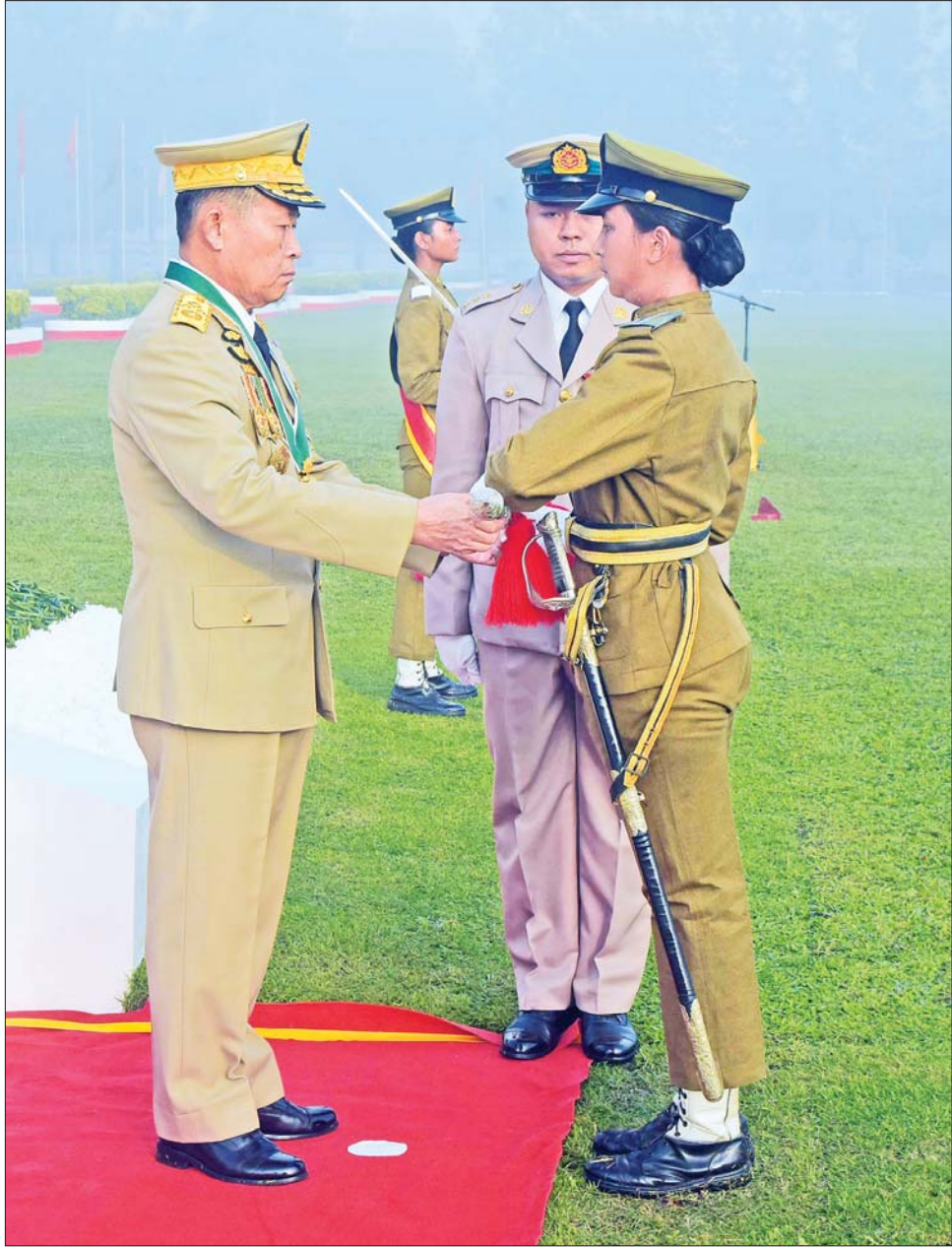
နိုင်ငံတော်စီမံအုပ်ချုပ်ရေးကောင်စီ ဒုတိယဥက္ကဋ္ဌ ဒုတိယတပ်မတော်ကာကွယ်ရေးဦးစီးချုပ် ကာကွယ်ရေးဦးစီးချုပ် (ကြည်း) ဒုတိယဗိုလ်ချုပ်မှူးကြီး သရေစည်သူ စိုးဝင်း အကောင်းဆုံး ဗိုလ်လောင်းဆုရရှိသူ ဗိုလ်လောင်းအမှတ် (၅၆) ဗိုလ်လောင်း သိမ့်နန္ဒာအောင်အား ဆုပေးအပ်ချီးမြှင့်စဉ်။

ဂုဏ်ယူစွာတွေ့မြင်ရမည် ယနေ့ မြန်မာ့တပ်မတော်တွင် အမျိုးသမီးစစ်မှုထမ်းအရာရှိ၊ စစ်သည်များသည် (ကြည်း၊ ရေ၊ လေ) ရုံး၊ ဌာနများအပါအဝင် လက်ရုံးဝန်ထမ်းတပ်ဖွဲ့