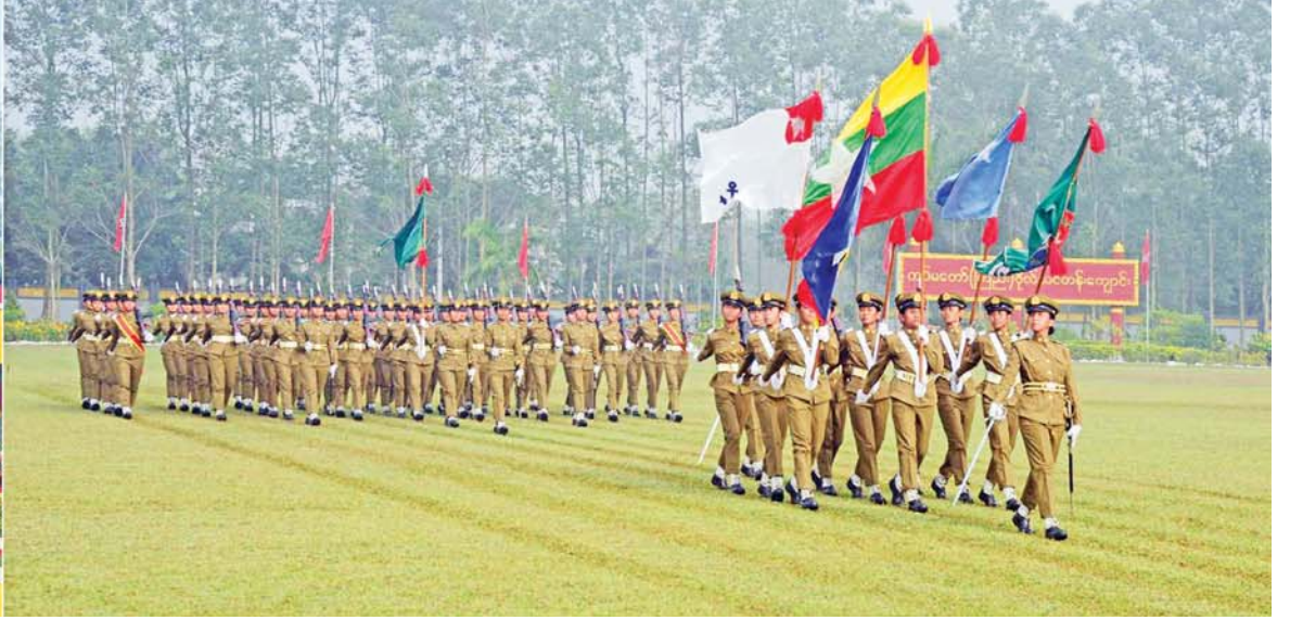
နိုင်ငံတော်စီမံအုပ်ချုပ်ရေးကောင်စီ ဒုတိယဥက္ကဋ္ဌ ဒုတိယတပ်မတော်ကာကွယ်ရေးဦးစီးချုပ် ကာကွယ်ရေးဦးစီးချုပ် (ကြည်း) ဒုတိယဗိုလ်ချုပ်မှူးကြီး သရေစည်သူ စိုးဝင်း အား ဗိုလ်လောင်းတပ်ခွဲများက အနေးလျှောက်၊ အမြန်လျှောက်ဖြင့် ချီတက်အလေးပြုစဉ်။