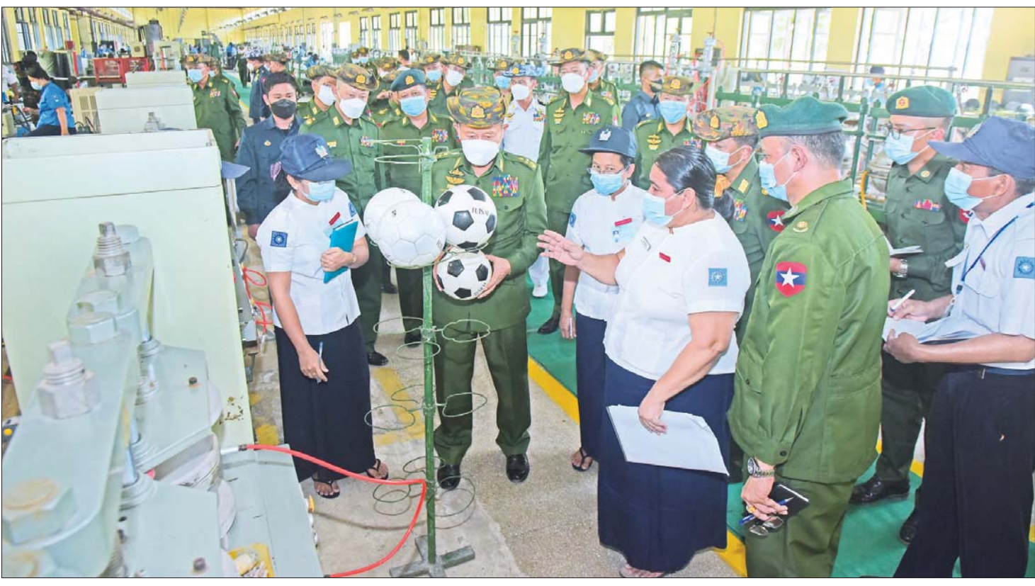
နိုင်ငံတော်စီမံအုပ်ချုပ်ရေးကောင်စီ ဒုတိယဥက္ကဋ္ဌ ဒုတိယတပ်မတော်ကာကွယ်ရေးဦးစီးချုပ် ကာကွယ်ရေးဦးစီးချုပ်(ကြည်း) ဒုတိယဗိုလ်ချုပ်မှူးကြီးစိုးဝင်း တပ်မတော်ဘောလုံးစက်ရုံအတွင်း ဘောလုံးများ ထုတ်လုပ်နေမှုအဆင့်ဆင့်ကို လိုက်လံကြည့်ရှုရာ တာဝန်ရှိသူများက ရှင်းလင်းတင်ပြကြစဉ်။

စာမျက်နှာ ၇ မှ ထို့နောက် နိုင်ငံတော်စီမံအုပ်ချုပ်ရေးကောင်စီ ဒုတိယဥက္ကဋ္ဌ ဒုတိယတပ်မတော် ကာကွယ်ရေးဦးစီးချုပ် ကာကွယ်ရေးဦးစီးချုပ်(ကြည်း) နှင့် အဖွဲ့ဝင်များသည် စက်ရုံအတွင်း ဘီစကစ်များနှင့် ခေါက်ဆွဲများ ထုတ်လုပ်နေမှု အဆင့်ဆင့်တို့ကို လိုက်လံကြည့်ရှုကြရာ တာဝန်ရှိသူများက လိုက်လံရှင်းလင်းပြသကြသည်။ ဆက်လက်၍ နိုင်ငံတော်စီမံအုပ်ချုပ်ရေးကောင်စီဒုတိယဥက္ကဋ္ဌ ဒုတိယတပ်မတော် ကာကွယ်ရေးဦးစီးချုပ် ကာကွယ်ရေးဦးစီးချုပ်(ကြည်း)က စက်ရုံဝန်ထမ်းများအတွက် ထောက်ပံ့ငွေများ ပေးအပ်ချီးမြှင့်ရာ စက်ရုံမှူးက လက်ခံရယူသည်။ တွေ့ဆုံနှုတ်ဆက် ထို့ပြင် နိုင်ငံတော်စီမံအုပ်ချုပ်ရေးကောင်စီ ဒုတိယဥက္ကဋ္ဌ ဒုတိယတပ်မတော် ကာကွယ်ရေးဦးစီးချုပ် ကာကွယ်ရေးဦးစီးချုပ်(ကြည်း) ဒုတိယဗိုလ်ချုပ်မှူးကြီး စိုးဝင်းနှင့် အဖွဲ့ဝင်များသည် မှော်ဘီတပ်နယ်ရှိ နယ်မြေခံ တပ်ရင်း/ တပ်ဖွဲ့များအား လိုက်လံကြည့်ရှုစစ်ဆေးပြီး အိမ်ထောင်သည် ရဲမေလှိုင်ခန်းများသို့သွားရောက်၍ ရဲမေ၊ မိသားစုများအား ရင်းရင်းနှီးနှီး တွေ့ဆုံနှုတ်ဆက်ကာ လိုအပ်သည်များအား တာဝန်ရှိသူများနှင့် ပေါင်းစပ်ညှိနှိုင်းဆောင်ရွက်ပေးပြီး ချီးမြှင့်ငွေများ ပေးအပ်ခဲ့ကြောင်း သတင်းရရှိသည်။ သတင်းစဉ်