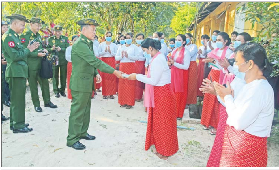
နိုင်ငံတော်စီမံအုပ်ချုပ်ရေးကောင်စီ ဒုတိယဥက္ကဋ္ဌ ဒုတိယတပ်မတော်ကာကွယ်ရေးဦးစီးချုပ် ကာကွယ်ရေးဦးစီးချုပ်(ကြည်း) ဒုတိယဗိုလ်ချုပ်မှူးကြီး စိုးဝင်း မှော်ဘီတပ်နယ်ရှိ နယ်မြေခံ တပ်ရင်း/ တပ်ဖွဲ့များမှ အိမ်ထောင်သည် ရဲမေ၊ မိသားစုများအား ချီးမြှင့်ငွေများ ပေးအပ်စဉ်။