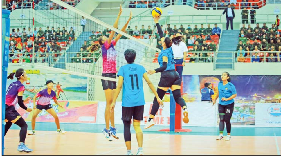
အမျိုးသမီးဘော်လီဘောပြိုင်ပွဲ ဗိုလ်လုပွဲ ပွဲစဉ်တွင် ကာကွယ်ရေးဝန်ကြီးဌာနအသင်းနှင့် အားကစားနှင့် လူငယ်ရေးရာဝန်ကြီးဌာနအသင်းတို့ ယှဉ်ပြိုင်စဉ်။