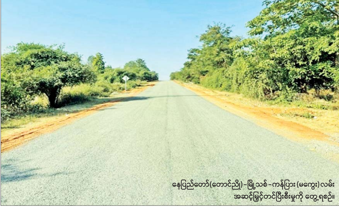
နေပြည်တော်(တောင်ညို)-မြို့သစ်-ကန်ပြား(မကွေး)လမ်း အဆင့်မြှင့်တင်ပြီးစီးမှုကို တွေ့ရစဉ်။

နေပြည်တော် ဒီဇင်ဘာ ၂၇ နေပြည်တော် (တောင်ညို)-မြို့သစ်-ကန်ပြား (မကွေး) လမ်းကို ၂၄ ပေ အကျယ် ကတ္တရာလမ်းအဖြစ် အဆင့်မြှင့်တင်လျက်ရှိကြောင်း မကွေးတိုင်းဒေသကြီးလမ်းဦးစီးဌာနမှ သိရသည်။ နေပြည်တော် (တောင်ညို)-မြို့သစ်-ကန်ပြား (မကွေး) လမ်းသည် နေပြည်တော်ကောင်စီနယ်မြေနှင့် မကွေးတိုင်းဒေသကြီးကို ချိတ်ဆက် ဆက်သွယ်ပေးထားသော လမ်းပိုင်း တစ်ခုဖြစ်ပြီး စုစုပေါင်း လမ်းမိုင်အရှည် ၇၉/၄ မိုင် အရှည်ရှိကာ မကွေးတိုင်းဒေသကြီးအတွင်း ပါဝင်သည့် စာမျက်နှာ ၁၀ ကော်လံ ၅၂