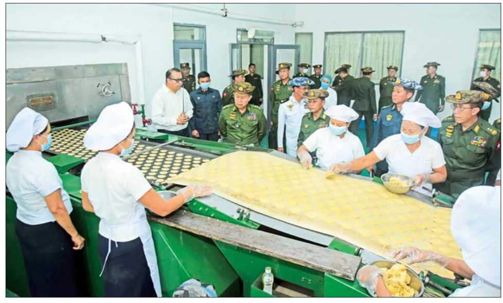
နိုင်ငံတော်စီမံအုပ်ချုပ်ရေးကောင်စီ ဒုတိယဥက္ကဋ္ဌ ဒုတိယတပ်မတော်ကာကွယ်ရေးဦးစီးချုပ် ကာကွယ်ရေးဦးစီးချုပ်(ကြည်း) ဒုတိယဗိုလ်ချုပ်မှူးကြီးစိုးဝင်း တပ်မတော် ဘီစကစ်နှင့် ခေါက်ဆွဲစက်ရုံ(မှော်ဘီ) အတွင်း ဘီစကစ်ထုတ်လုပ်မှု အဆင့်ဆင့်ကို လိုက်လံကြည့်ရှုစဉ်။