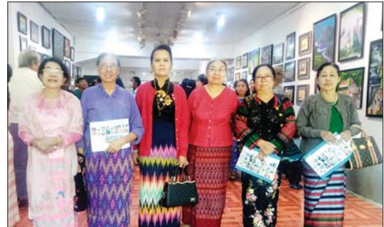
အမျိုးသမီးပန်းချီဆရာမများ ပန်းချီပြပွဲအတွက် အောင်မြေသာစံမြို့နယ်ရှိ မန္တလေးတောင်ပန်းချီပြခန်းသို့ ရောက်ရှိလာကြသည်။

မန္တလေး ဒီဇင်ဘာ ၂၇ သတ္တမအကြိမ်မြောက် အမျိုးသမီးပန်းချီဆရာမ ၅၄ ဦး၏ COLOURFUL FLOWERS အမည်ရ ပန်းချီပြပွဲဖွင့်ပွဲကို ဒီဇင်ဘာ ၂၇ ရက်က မန္တလေးမြို့ အောင်မြေသာစံမြို့နယ်ရှိ မန္တလေးတောင်ပန်းချီပြခန်း၌ ဖွင့်ပွဲကျင်းပသည်။