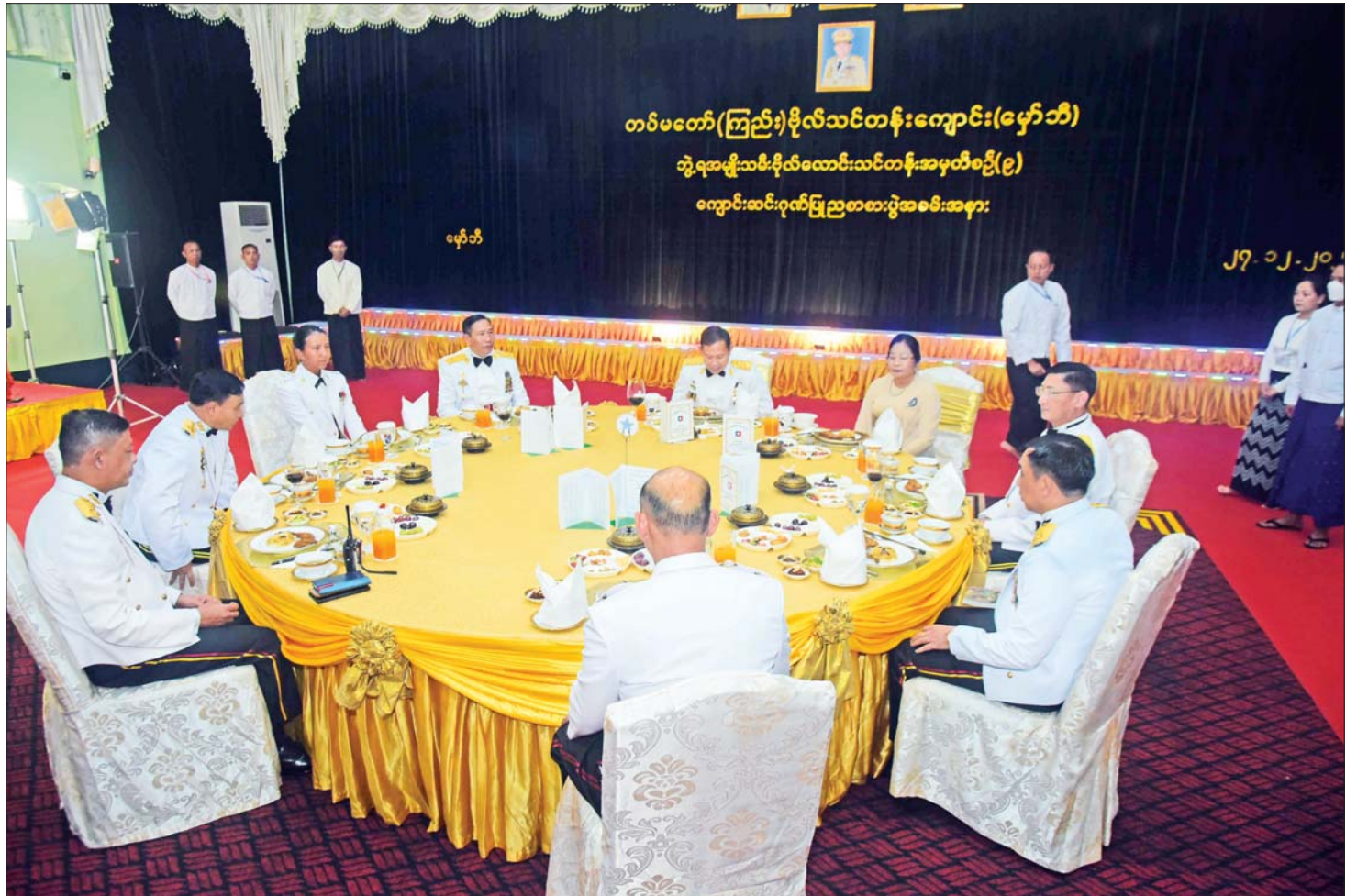
နိုင်ငံတော်စီမံအုပ်ချုပ်ရေးကောင်စီ ဒုတိယဥက္ကဋ္ဌ ဒုတိယတပ်မတော်ကာကွယ်ရေးဦးစီးချုပ် ကာကွယ်ရေးဦးစီးချုပ် (ကြည်း) ဒုတိယဗိုလ်ချုပ်မှူးကြီး စိုးဝင်း ဂုဏ်ပြုညစာစားပွဲအခမ်းအနားသို့ တက်ရောက်လာကြသူများနှင့်အတူ ဂုဏ်ပြုညစာကို အတူတကွ သုံးဆောင်စဉ်။

တပ်မတော်သားဖြစ်သည်နှင့်အညီ အမိန့်နာခံ တတ်မှုနှင့် စစ်စည်းကမ်းအတိုင်း နေထိုင်လုပ်ကိုင် ဆောင်ရွက်တတ်သည့် အလေ့အကျင့်ကောင်းများကို တပ်မတော်တွင် တာဝန်ထမ်းဆောင်သည့် ကာလ တစ်လျှောက်လုံး လိုက်နာနေထိုင်သွားကြရမည်ဖြစ် ကြောင်း၊ စစ်စည်းကမ်းသည် တပ်မတော်၏အဓိက ကျောရိုးမဏ္ဍိုင်ဖြစ်ပြီး စစ်စည်းကမ်းကောင်းမွန်မှုနှင့် အမိန့်နာခံမှုရှိသည့် တပ်မတော်သားများဖြစ်အောင် နေထိုင်ကြရန် လိုကြောင်း၊ တပ်မတော်သားများသည် တပ်မတော်၏ စည်းမျဉ်း၊ စည်းကမ်း၊ ဥပဒေများကို တိတိကျကျ လိုက်နာဆောင်ရွက်ကြရသည့်အပြင် အရပ်ဘက်ဥပဒေနှင့် စည်းမျဉ်းစည်းကမ်းများကို