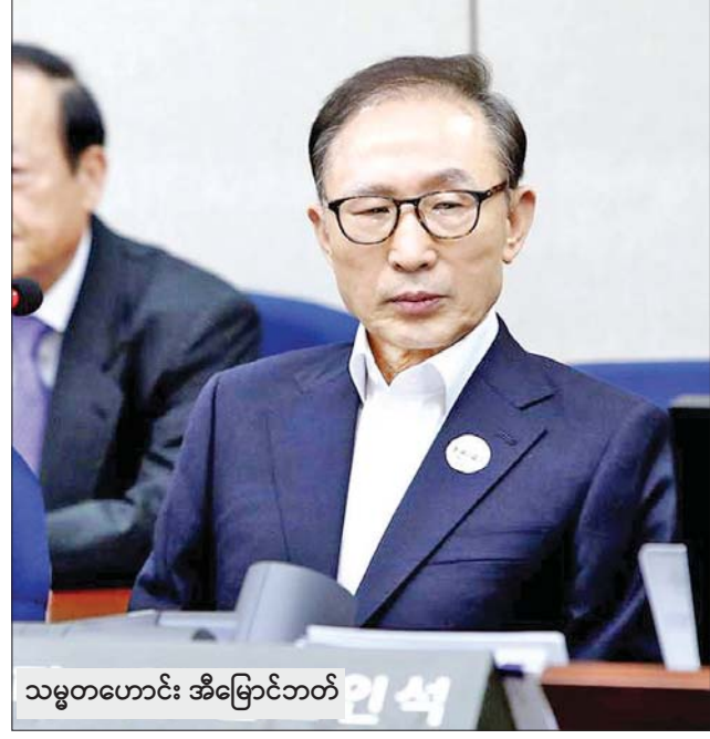
သမ္မတဟောင်း အီမြောင်ဘတ်

ဆေးရုံများတွင် ဆေးကုသမှုခံယူလျက်ရှိသူ ၂၀ ဦးရှိပြီး ၎င်းတို့ ထဲမှ ရှစ်ဦးမှာ စိုးရိမ်ရအခြေအနေရှိသောကြောင့် သေဆုံးမှုနှုန်း ဆက်လက်မြင့်တက်လာနိုင်ကြောင်း သိရသည်။ လွန်ခဲ့သော ခြောက်နှစ်အတွင်း အဆိပ်သင့်အရက်သောက်သုံးမှုကြောင့် ဘီဟာ ပြည်နယ်တွင် သေဆုံးသူပေါင်း ၁၀၀၀ ကျော်ရှိကြောင်းနှင့် ဆက်စပ် ဖြစ်စဉ်များကြောင့် လူပေါင်း ၆၀၀၀၀ မှာ ထောင်ကျနေကြောင်း ဘီဟာပြည်နယ်မှ အတိုက်အခံပါတီခေါင်းဆောင်နှင့် လွှတ်တော် ကိုယ်စားလှယ်တစ်ဦးဖြစ်သည့် ဆူရီးလ် ကူမာမိုဒီ၏ ပြောကြား ချက်ကို ကိုးကား၍ ဒေသမီဒီယာများ၏ ဖော်ပြချက်အရ သိရသည်။ ထို့အပြင် ယခုနှစ် ဇူလိုင်လ၌ ဂူဂျာရတ်ပြည်နယ်တွင်လည်း အဆိပ်သင့်အရက်သောက်သုံးမှုကြောင့် ၄၂ ဦး သေဆုံးကြောင်း သိရသည်။ ပြီးခဲ့သည့်နှစ်တွင် အဆိပ်သင့် အရက်သောက်သုံးမှု ကြောင့် လူပေါင်း ၇၈၂ ဦးအထိရှိကြောင်း အိန္ဒိယအမျိုးသား မှုခင်းမှတ်တမ်းဗျူရို၏ ထုတ်ပြန်ချက်အရ သိရသည်။ ဆင်ဟွာ