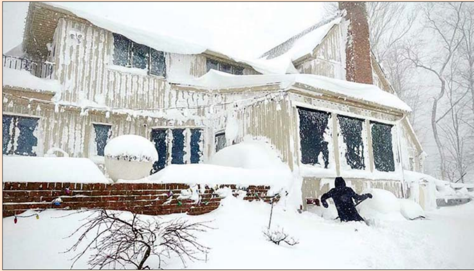
နယူးယောက်ပြည်နယ် အီရီဒေသရှိ အဆောက်အအုံတစ်လုံး၌ ဖုံးလွှမ်းနေသော အေးခဲနှင်းထုကို ဒေသခံ တစ်ဦး ဖယ်ရှားနေစဉ်။

ခရစ္စမတ်အားလပ်ရက်မတိုင်မီက နှင်းမုန်တိုင်း ကြောင့် နယူးယောက်ပြည်နယ် အနောက်ပိုင်း အီရီဒေသတွင် ၂၇ ဦး ထက်မနည်း သေဆုံး ကြောင်း ဒီဇင်ဘာ ၂၆ ရက်က သတင်းစာ ရှင်းလင်းပွဲတွင် ဒေသအမှုဆောင် မာ့ခ် ပိုလွန်ကားစ်