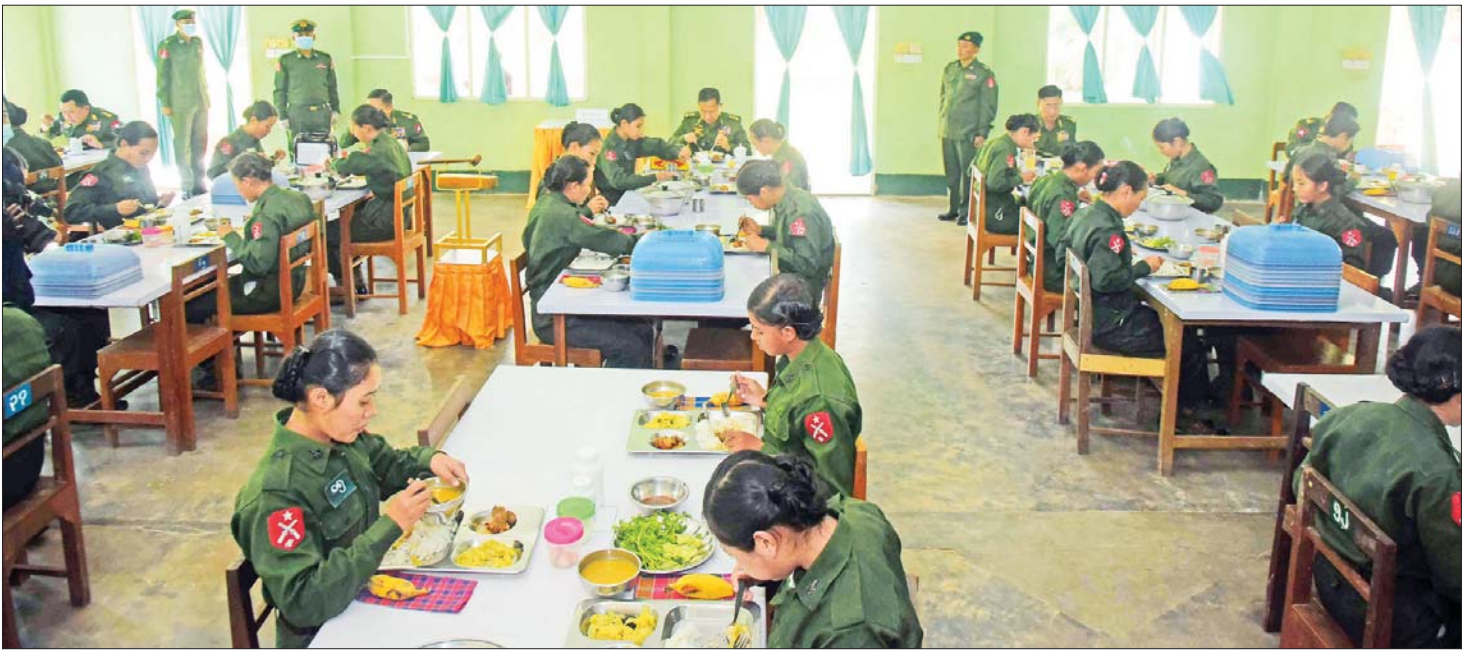
နိုင်ငံတော်စီမံအုပ်ချုပ်ရေးကောင်စီ ဒုတိယဥက္ကဋ္ဌ ဒုတိယတပ်မတော်ကာကွယ်ရေးဦးစီးချုပ် ကာကွယ်ရေးဦးစီးချုပ်(ကြည်း) ဒုတိယဗိုလ်ချုပ်မှူးကြီး စိုးဝင်းနှင့် အဖွဲ့ဝင်များ တပ်မတော်(ကြည်း) အရာခံနှင့် အကြပ်ကြီးသင်ကျောင်း၊ ကွန်ပျူတာဒီပလိုမာ တပ်ကြပ်ကြီး/စာရေး (အမျိုးသမီး)သင်တန်းသူများနှင့် နေ့လယ်စာအတူတကွ သုံးဆောင်ကြစဉ်။

နေပြည်တော် ဒီဇင်ဘာ ၂၇ နိုင်ငံတော်စီမံအုပ်ချုပ်ရေးကောင်စီ ဒုတိယဥက္ကဋ္ဌ ဒုတိယတပ်မတော်ကာကွယ်ရေးဦးစီးချုပ် ကာကွယ်ရေးဦးစီးချုပ်(ကြည်း) ဒုတိယဗိုလ်ချုပ်မှူးကြီး စိုးဝင်းသည် ကာကွယ်ရေးဦးစီးချုပ်မှ တပ်မတော်အရာရှိကြီးများ၊ ရန်ကုန်တိုင်းစစ်ဌာနချုပ် တိုင်းမှူးနှင့် တာဝန်ရှိသူများ လိုက်ပါ၍ ယနေ့နံနက်ပိုင်းတွင် မှော်ဘီတပ်နယ်ရှိ တပ်မတော်(ကြည်း) အရာခံနှင့် အကြပ်ကြီးသင်ကျောင်းသို့ သွားရောက်ကြည့်ရှုစစ်ဆေးသည်။