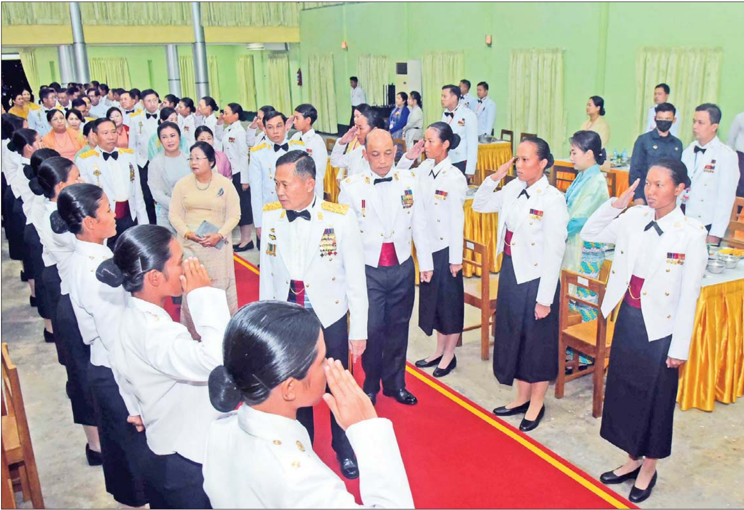
နိုင်ငံတော်စီမံအုပ်ချုပ်ရေးကောင်စီ ဒုတိယဥက္ကဋ္ဌ ဒုတိယတပ်မတော်ကာကွယ်ရေးဦးစီးချုပ် ကာကွယ်ရေးဦးစီးချုပ် (ကြည်း) ဒုတိယဗိုလ်ချုပ်မှူးကြီး စိုးဝင်း ဘွဲ့ရအမျိုးသမီးဗိုလ်လောင်းသင်တန်း အမှတ်စဉ် (၉)သင်တန်းဆင်း ဂုဏ်ပြုညစာစားပွဲအခမ်းအနားတွင် သင်တန်းဆင်းအရာရှိများအား ရင်းရင်းနှီးနှီး နှုတ်ဆက်စဉ်။

ကိုင်အဖွဲ့အစည်းများကိုပါ ဖိတ်ခေါ်၍ ဆွေးနွေး လျက်ရှိရာ ယခုဆိုလျှင် တိုင်းရင်းသားလက်နက်ကိုင် အဖွဲ့အစည်း ၁၀ ဖွဲ့နှင့် အပြန်အလှန် ဆွေးနွေးညှိနှိုင်း နေဆဲဖြစ်ကြောင်း၊ ထာဝရငြိမ်းချမ်းရေးလုပ်ငန်းစဉ် များတွင် ကျရာအခန်းကဏ္ဍကနေ တာဝန်ကျေပွန်စွာ ထမ်းဆောင်ကြရန်နှင့် ထိုသို့ဆောင်ရွက်နိုင်ရန်ကို လည်း ထာဝရငြိမ်းချမ်းရေးသမိုင်းကြောင်းများကို သိရှိနားလည်အောင် အစဉ်အမြဲ ကြိုးစားလေ့လာ နေကြရန်လိုကြောင်း။