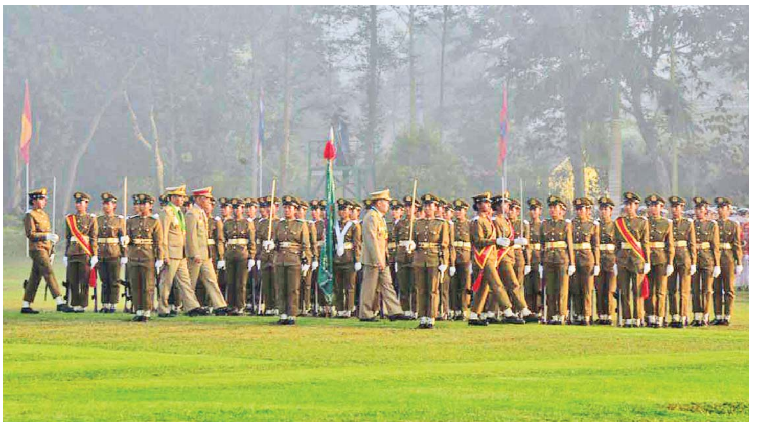
နိုင်ငံတော်စီမံအုပ်ချုပ်ရေးကောင်စီ ဒုတိယဥက္ကဋ္ဌ ဒုတိယတပ်မတော်ကာကွယ်ရေးဦးစီးချုပ် ကာကွယ်ရေးဦးစီးချုပ် (ကြည်း) ဒုတိယဗိုလ်ချုပ်မှူးကြီး သရေစည်သူ စိုးဝင်း ကျောင်းဆင်းဗိုလ်လောင်းတပ်ခွဲအား စစ်ဆေးစဉ်။

ဆက်လက်၍ နိုင်ငံတော်စီမံအုပ်ချုပ်ရေးကောင်စီဥက္ကဋ္ဌ တပ်မတော်ကာကွယ်ရေးဦးစီးချုပ် ဗိုလ်ချုပ်မှူးကြီး မဟာသရေစည်သူ မင်းအောင်လှိုင် ကိုယ်စား နိုင်ငံတော်စီမံအုပ်ချုပ်ရေးကောင်စီ ဒုတိယဥက္ကဋ္ဌ ဒုတိယတပ်မတော် ကာကွယ်ရေးဦးစီးချုပ် ကာကွယ်