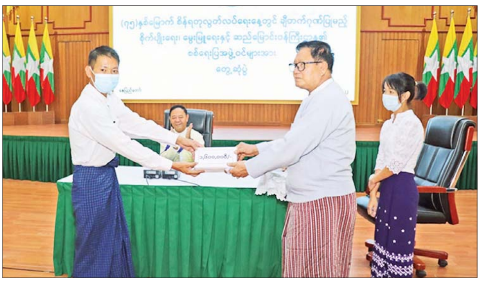
မွေးမြူရေးနှင့်ဆည်မြောင်းဝန်ကြီး ဖွံ့ဖြိုးရေးအတွက်ကြိုးပမ်းဆောင်ရွက်ပြုသွားမည် ဖြစ်ကြောင်း ဌာနက နိုင်ငံတော်၏ စားနပ်ရိက္ခာ ရွက်နေမှု သရုပ်ဖော်ဂုဏ်ပြုယာဉ် သိရသည်။ ဖူလုံပိုလျှံရေးနှင့် လယ်ယာကဏ္ဍ များဖြင့် တစ်ခမ်းတနား ချီတက် သတင်းစဉ်

လိုအပ်ချက်များကို ဆွေးနွေးပြောကြားသည်။ ထို့နောက် (၇၅) နှစ်မြောက် စိန်ရတုလွတ်လပ်ရေးနေ့ အခမ်းအနားတွင် ချီတက်ဂုဏ်ပြုမည့် စိုက်ပျိုးရေး၊ မွေးမြူရေးနှင့် ဆည်မြောင်းဝန်ကြီးဌာန စစ်ရေးပြအဖွဲ့ကို ပြည်ထောင်စုဝန်ကြီးနှင့် ဒုတိယဝန်ကြီးတို့က ဂုဏ်ပြုငွေများ ထောက်ပံ့ပေးအပ်ရာ စစ်ရေးပြအဖွဲ့ ကိုယ်စားလှယ်တစ်ဦးက လက်ခံရယူသည်။ (ယာပုံ) (၇၅) နှစ်မြောက် စိန်ရတုလွတ်လပ်ရေးနေ့ အခမ်းအနားတွင် ဝန်ကြီးဌာန ကိုယ်စားပြု စစ်ရေးပြအဖွဲ့က ချီတက်ဂုဏ်ပြုသွားမည်ဖြစ်သကဲ့သို့ စိုက်ပျိုးရေး၊