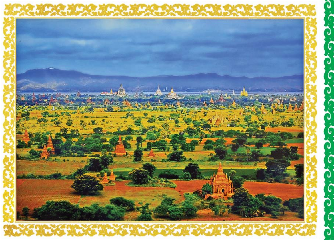
ပုဂံရှုခင်းအလှ

(နိုင်ငံတော်စီမံအုပ်ချုပ်ရေးကောင်စီဥက္ကဋ္ဌ နိုင်ငံတော်ဝန်ကြီးချုပ် ဗိုလ်ချုပ်မှူးကြီးမင်းအောင်လှိုင်၏ ၁၂-၂-၂၀၂၁ ရက်နေ့တွင် (၇၄) နှစ်မြောက် ပြည်ထောင်စုနေ့အခမ်းအနားသို့ ပေးပို့သည့် သဝဏ်လွှာမှ ကောက်နုတ်ချက်)