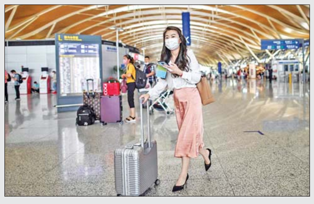
ရွှေဆိုင်ထားရန် အကြံပြုထားသည်။ ခရီးသွားများမှာ တရုတ်သံတမန် နှင့် ကောင်စစ်ဝန်ရုံးမှ ကျန်းမာရေးကုတ်တောင်းခံရန် မလိုအပ်ကြောင်း သိရသည်။ ဆင်ဟွာ

ဆိုးလ် ဒီဇင်ဘာ ၂၇ သမ္မတဟောင်း အီမြောင်ဘတ်အား တောင်ကိုရီးယားအစိုးရက အထူးလွတ်ငြိမ်းချမ်းသာခွင့် ပြုလိုက်ပြီး ဒီဇင်ဘာ ၂၈ ရက်တွင် အကျိုးသက်ရောက်မည်ဖြစ်ကြောင်း သိရသည်။ ၎င်းသည် အကျင့်ပျက်ခြစားမှုဖြင့် ထောင်ဒဏ် ၁၇ နှစ် ချမှတ်ခံထား ရခြင်းဖြစ်သည်။ ကွန်ဆာဗေးတစ် အစိုးရကို ၂၀၁၃ ခုနှစ်အထိ ငါးနှစ် ကြာ ဦးဆောင်ခဲ့သော အီမြောင်ဘတ်အပါအဝင် တောင်ကိုရီးယား အစိုးရက ဒီဇင်ဘာ ၂၇ ရက်တွင် လူပေါင်း ၁၃၀၀ ကျော်ကို လွတ်ငြိမ်း ချမ်းသာခွင့်ပြုခဲ့ကြောင်း သိရသည်။ ၁၉၉၇ ခုနှစ်က ချန်ဒုဝမ်နှင့် နိုတေဂူး၊ ၂၀၂၁ ခုနှစ်က ပတ်ဂွမ်ဟီးတို့ လွတ်ငြိမ်းချမ်းသာခွင့်ရရှိခဲ့ပြီးနောက် အီမြောင်ဘတ်သည် လွတ်ငြိမ်း ချမ်းသာခွင့်ရသည့် စတုတ္ထမြောက် သမ္မတဟောင်းဖြစ်လာမည်ဖြစ်သည်။ အီမြောင်ဘတ်သည် လက်ရှိတွင် အသက် ၈၁ နှစ်ရှိပြီဖြစ်သည်။ အင်န်အိတ်ချ်ကေ