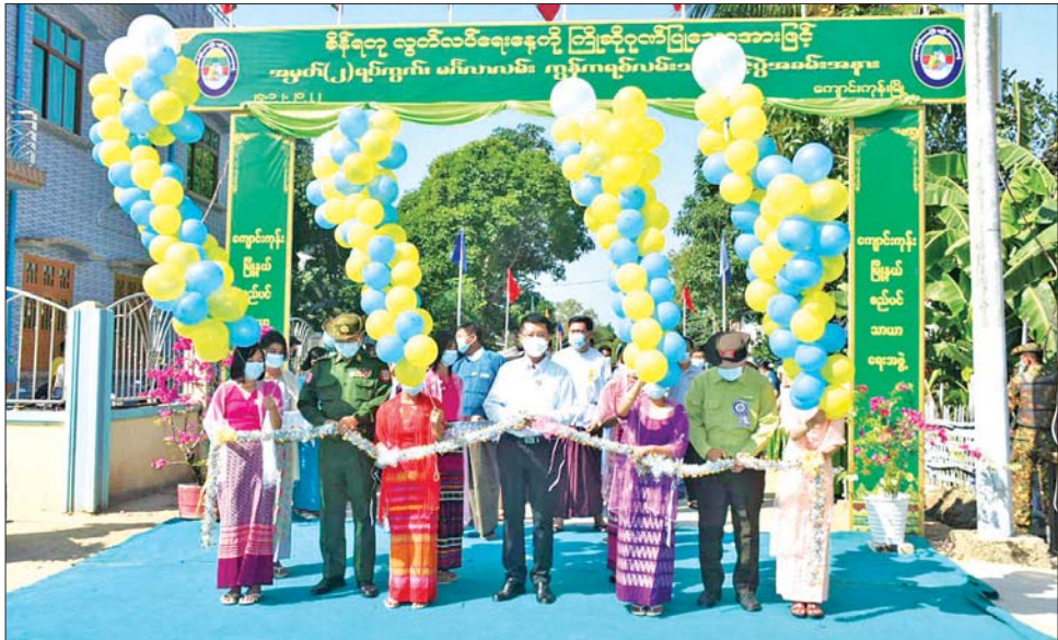
ရေးနှစ် မြို့နယ်စည်ပင်သာယာရေးအဖွဲ့ ရန်ပုံငွေ (အပေါ်ပုံ) ကွန်ကရစ်လမ်းသစ်ကို ကြည့်ရှုစစ်ဆေးဖြင့် လမ်းအရှည် ၅၁၆ ပေ၊ အကျယ် ၁၆ ပေ၊ ထုခြောက်လက်မရှိ မင်္ဂလာလမ်းကွန်ကရစ်လမ်းသစ် ဖွင့်ပွဲတက်ရောက်၍ ဖဲကြိုးဖြတ် ဖွင့်လှစ်ပေးပြီး တိုင်းဒေသကြီး(ပြန်/ဆက်)

ဆက်လက်၍ တိုင်းဒေသကြီး ဝန်ကြီးချုပ်နှင့် အဖွဲ့သည် ကျိုပျော်ခရိုင် ကျောင်းကုန်းမြို့နယ်၊ ကျောင်းကုန်းမြို့ အမှတ် (၂) ရပ်ကွက်တွင် (၇၅) နှစ်မြောက် စိန်ရတုလွတ်လပ်ရေးနေ့ကို ကြိုဆိုဂုဏ်ပြုသောအားဖြင့် ဖွင့်လှစ်သည့် ၂၀၂၂-၂၀၂၃ ဘဏ္ဍာ