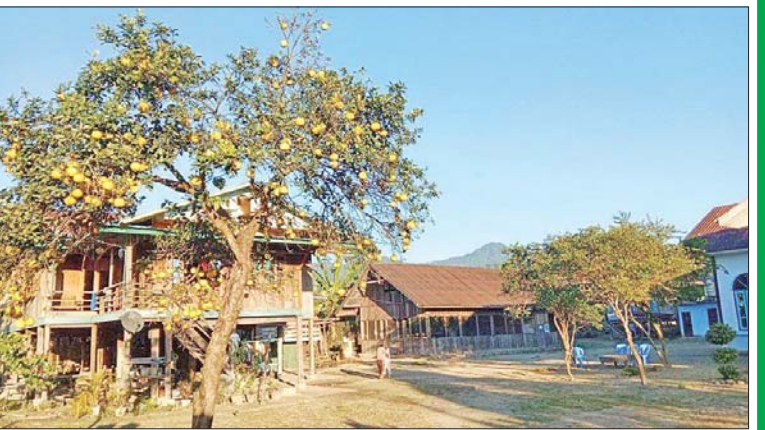
ပူတာအိုဒေသခံတစ်ဦး၏ နေအိမ်ဝင်းအတွင်းမှ ဂရိတ်ဖရူအပင်များ။

“အနာအဆာမရှိဘဲ သက်တမ်းပြည့်တဲ့အချိန်ခူးတဲ့ သီးနှံဆိုရင် သုံးလကနေ ခြောက်လလောက် ထားလို့ရတယ်။ ဒီသီးနှံတွေက အထားခံတဲ့သီးနှံတွေဖြစ်တဲ့အတွက်ကြောင့် တောင်သူတွေလည်း များများစိုက်သင့်တယ်။ နောက်တစ်ခုက သုတေသနလုပ်ငန်း ပြုလုပ်ပြီးတော့ တွေ့ရှိချက်အရ တန်ဖိုးမြင့်ထုတ်ကုန်အမယ်တွေ အများကြီးထုတ်မယ်ဆိုရင်