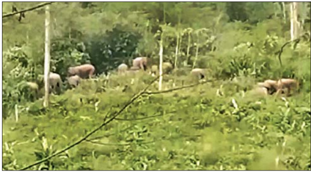
တောဆင်ရိုင်းများ ဖျက်ဆီးသွားသည့် တဲများနှင့် တောဆင်ရိုင်းအုပ်စုကို တွေ့ရစဉ်။

လူမနေကြပါဘူး။ နေ့ခင်းပိုင်းတွေ မှာတော့ သီးနှံစိုက်၊ ရေလောင်း ခဏတဖြုတ်နားပြီး ရွာကိုပြန်ကြ တယ်။ လူတချို့ရှိနေပေမယ့် လူတွေကိုတော့ ဘာမှမလုပ်ဘူး။ လူထိခိုက်မှုတော့ မရှိပါဘူး။” ဟု ဒေသခံတစ်ဦးက ပြောသည်။