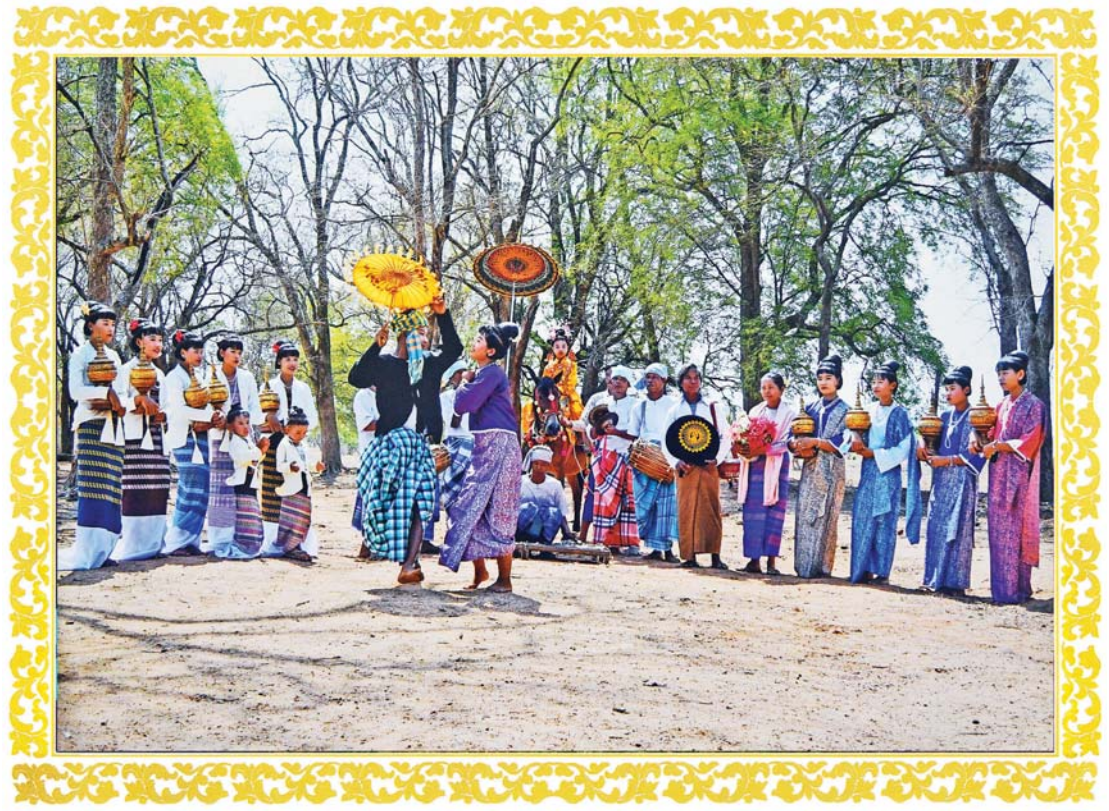
မြန်မာ့ရိုးရာရင်ပြုအလှူပွဲ

(ဗိုလ်ချုပ်အောင်ဆန်း ၁၉၄၇ ခုနှစ် ဇွန်လဆန်း၌ ပမာနိုင်ငံလုံးဆိုင်ရာ မီးသတ်အစည်းအရုံးကြီးတွင် ပြောကြားသော မိန့်ခွန်းမှ ကောက်နုတ်ချက်)