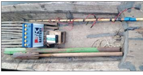
ဘက်ထရီရောင်းတိုက်ရာတွင်အသုံးပြုသည့် ပစ္စည်းများ။

ငါးဖိန်းငါးမျိုးစိတ် ရှားပါးလာခြင်းသည် ငါးအလွန်အကျွံဖမ်းဆီးခြင်း၊ ငါးဖိန်းငါးနေထိုင်ရာ ပတ်ဝန်းကျင်တွင် ငါးမြစ်ချင်း၊ မြစ်စားငါးကြင်း ကဲ့သို့သောငါးများ နေရာယူလာခြင်း၊ ငါးကြင်း အုပ်စုဝင်ငါးများနှင့် မျိုးစပ်သွားခြင်းတို့သည် အဓိက အချက်ဖြစ်ကြောင်း သုတေသနပြုလေ့လာချက်များ အရ တွေ့ရှိရပါသည်။