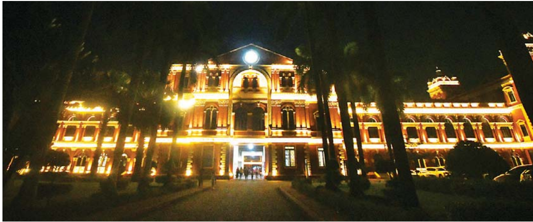
ဒီဇင်ဘာ ၂၅ ရက် (ခရစ္စမတ်နေ့) ညတွင် ရန်ကုန်မြို့၊ ဗိုလ်တထောင်မြို့နယ် သိမ်ဖြူလမ်းရှိ ဝန်ကြီးများရုံး၌ လျှပ်စစ်မီးများဖြင့် အလှဆင်ထားသည့်ကို တွေ့ရစဉ်။