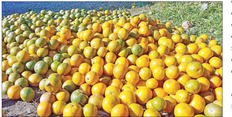
ခူးဆွတ်ထားသော ဂရိတ်ဖရူသီးများ။

သည့် ဂရိတ်ဖရူသီးများကို မြစ်ကြီးနား၊ မန္တလေး၊ ရန်ကုန်ဈေးကွက်များသို့ ရောင်းဝယ်ဖောက်ကားသည်ကို တွေ့ရှိရပြီး ပူတာအိုဒေသထွက် ဂရိတ်ဖရူသီး