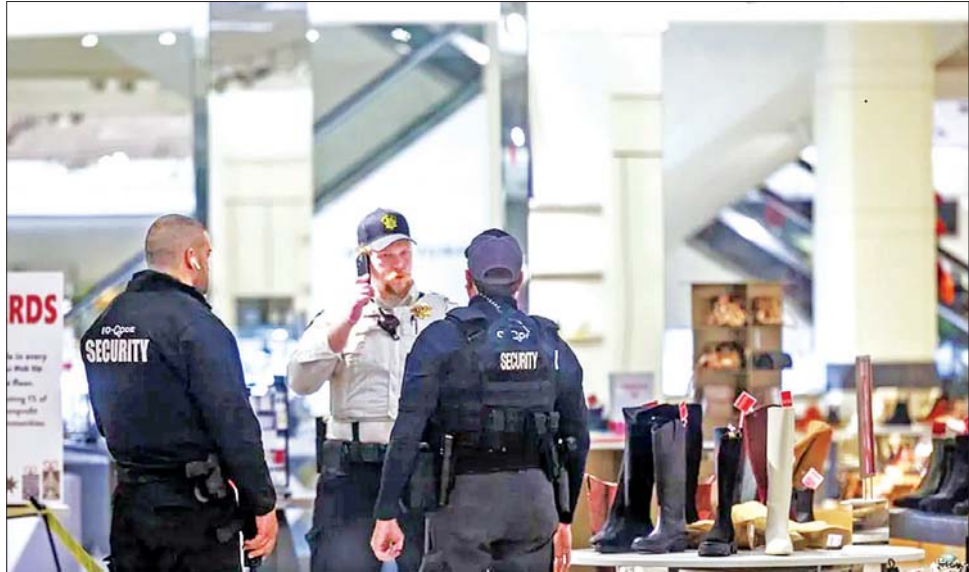
ဈေးဝယ်စင်တာကြီးအတွင်း လုံခြုံရေးဝန်ထမ်းများကို တွေ့ရစဉ်။

အမေရိကန်နိုင်ငံ မင်နီဆိုးတား ပြည်နယ်ရှိ Mall of America ဈေးဝယ်စင်တာကြီး အတွင်း ကြောက်မက်ဖွယ် သေနတ် ပစ်ခတ်မှုဖြစ်ပွားခဲ့ပြီး ယင်းဖြစ်စဉ် နှင့် ဆက်စပ်သည့် လူငါးဦးကို ဒီဇင်ဘာ ၂၄ ရက်က ဖမ်းဆီးခဲ့ သည်ဟု သိရသည်။