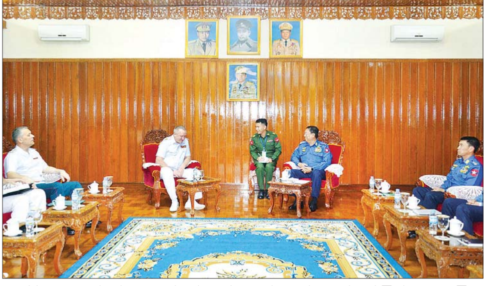
ရေဆိုင်ရာ ဆောင်ရွက်ပေးနေမှုကိစ္စရပ်များကို လည်းကောင်း လှည့်လည်ကြည့်ရှုလေ့လာကြရာ ရှင်းလင်းတင်ပြခဲ့ကြပြီး Ship Handling Simulator သိရှိလိုသည်များအား တာဝန်ရှိသူများက ရှင်းလင်း တင်ပြခဲ့ကြကြောင်း သတင်းရရှိသည်။

ကာကွယ်ရေးဦးစီးချုပ်(ရေ) ဗိုလ်ချုပ်ကြီး မိုးအောင် သည် မြန်မာနိုင်ငံ၌ ရောက်ရှိနေသော ရုရှားဒုတိယ ရေတပ်ဦးစီးချုပ် Vice Admiral Igor MUKHAMETSHIN ဦးဆောင်သည့် ကိုယ်စားလှယ်အဖွဲ့ကို ယနေ့ နံနက်ပိုင်းတွင် ဧရာဝတီရေတပ်စခန်းဌာနချုပ် အရာရှိရုံးသို့ လက်ခံတွေ့ဆုံသည်။ (ယာပုံ)