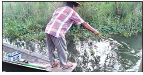
စကားအင်းဝန်းကျင်၌ ဘက်ထရီရောင်းတိုက် ငါးဖမ်းဆီးသည့် ရေလုပ်သားတစ်ဦး

ငါးဖိန်းမျိုးစိတ်များသည် ရေအရည်အသွေး ကောင်းမွန်သည့် စံကားအင်းရေပြင်သို့ ပြောင်းရွှေ့