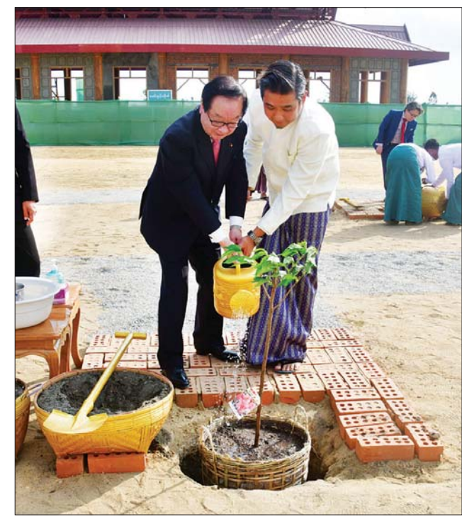
ဂျပန်နိုင်ငံ အောက်လွှတ်တော်အမတ် Mr. Hiromichi Watanabe ဂျပန်ချယ်ရီပန်း ပျိုးပင်ကို စိုက်ပျိုးပေးစဉ်။

ထို့နောက် ပြည်ထောင်စုဝန်ကြီး ဦးကိုကိုက ဂျပန် - မြန်မာယဉ်ကျေးမှု မြှင့်တင်ရေးအသင်းက လှူဒါန်းသည့် ဂျပန်ချယ်ရီပန်းပျိုးပင်များကို နေပြည်တော်၏ အထင်ကရနေရာ တစ်နေရာဖြစ်လာမည့် မာရဝိဇယ ဗုဒ္ဓရုပ်ပွားတော်မြတ်ကြီး၏ ပရိသတ်အတွင်းတွင် စိုက်ပျိုးသွားမည်ဖြစ်ပါကြောင်း။ ကမ္ဘာ့အကြီးဆုံးနှင့် ဉာဏ်တော်အမြင့်ဆုံး စကျင်ကျောက်ဆစ် ရုပ်ပွားတော် တစ်ဆူဖြစ်လာမည့် မာရဝိဇယဗုဒ္ဓရုပ်ပွားတော်မြတ်ကြီး ပရိသတ်အတွင်းတွင် လှူဒါန်းစိုက်ပျိုးခဲ့သည့် ချယ်ရီပန်းပင်များ ရှင်သန်ကြီးထွားလာပြီး ရုပ်ပွားတော်မြတ်ကြီး တည်ဆောက်ပြီးစီးသည့်အခါ လာရောက်ဖူးမြော်ကြမည့် ခရီးသွားဧည့်သည်များအတွက် အရိပ်အာဝါသနှင့် စိတ်နှလုံးအေးချမ်းမှုတို့ကို ပေးနိုင်မည်ဟု မျှော်လင့်ကြောင်း၊ ဂျပန်ချယ်ရီပန်းပင်များသည် မာရဝိဇယဗုဒ္ဓရုပ်ပွားတော်မြတ်ကြီးသို့ လာရောက်ဖူးမြော်ကြမည့် မြန်မာလူမျိုးများကိုသာမက ဂျပန် နိုင်ငံသားများနှင့် ကမ္ဘာ့အနှံ့မှ ခရီးသွားဧည့်သည်များ လေ့လာမြင်တွေ့ခြင်းဖြင့် မြန်မာနိုင်ငံနှင့် ဂျပန်နိုင်ငံတို့အကြား အထိမ်းအမှတ်တစ်ခုအဖြစ်တည်ရှိနေမည်ဟု ယုံကြည်ပါကြောင်း၊ မြန်မာနိုင်ငံအစိုးရ