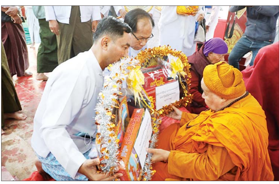
ဆက်လက်၍ တိုင်းမှူးနှင့် တက်ရောက်လာကြသူများက ဓမ္မသုခဘုန်းတော်ကြီးကျောင်းတိုက် ဆရာတော်ထံမှ အနုမောဒနာတရား နာယူကြပြီး လှူဒါန်းမှုအစုစုတို့အတွက် ရေစက်သွန်းချအမျှ ပေးဝေခဲ့ကြကြောင်း သတင်းရရှိသည်။ သတင်းစဉ်

အလှူငွေများ ဆက်ကပ်လှူဒါန်းကြသည်။ ထို့နောက် ရခိုင်မင်္ဂလာစည်တော်ဝိုင်းမှ စည်တော်ယွန်း၍ တီးခတ်ပူဇော်ကာ ရခိုင်တေးသံရုပ်များက ဗုဒ္ဓပူဇော်၊ ဓမ္မပူဇော်၊ သံဃာပူဇော်အလင်္ကာများနှင့် ရတုတို့ဖြင့် သီဆိုပူဇော်ကြသည်။ ယင်းနောက် တိုင်းမှူးနှင့် တက်ရောက်လာကြသူများက ဓမ္မသုခဘုန်းတော်ကြီး ကျောင်းတိုက်ဆရာတော်ထံမှ ငါးပါးသီလခံယူ ဆောက်တည်ကြပြီး သံဃာတော်အရှင်သူမြတ်များက ရန်ပြေမာန်ပြေထိုင်တော်မူဘုရားကြီးအား ပုဒွါဘိသေကအနေကဇာတင်ပူဇော်ကြကာ ကမ္ဘာ့ဗုဒ္ဓသာသနာပြု ကျေးဇူးတော်ရှင် မဟာဇေယျသိဒ္ဓိ အဓိဋ္ဌာန်ဆရာတော် ဘဒ္ဒန္တကုလရက္ခိတက သံဃာတော်အရှင်သူမြတ်များသို့ ဩဝါဒကထာ ချီးမြှင့်ပေးတော်မူပါရန် လျှောက်ထားသည်။ ဆက်လက်၍ ယင်းနောက် သံဃာတော်များကိုယ်စား ဓမ္မသုခဘုန်းတော်ကြီး ကျောင်းတိုက်ဆရာတော်က ဩဝါဒကထာ ချီးမြှင့်တော်မူပြီး တိုင်းမှူးနှင့် တက်ရောက်လာကြသူများက ဆွမ်းနှင့် လှူဖွယ်ပစ္စည်းများ ဆက်ကပ်လှူဒါန်းကြသည်။