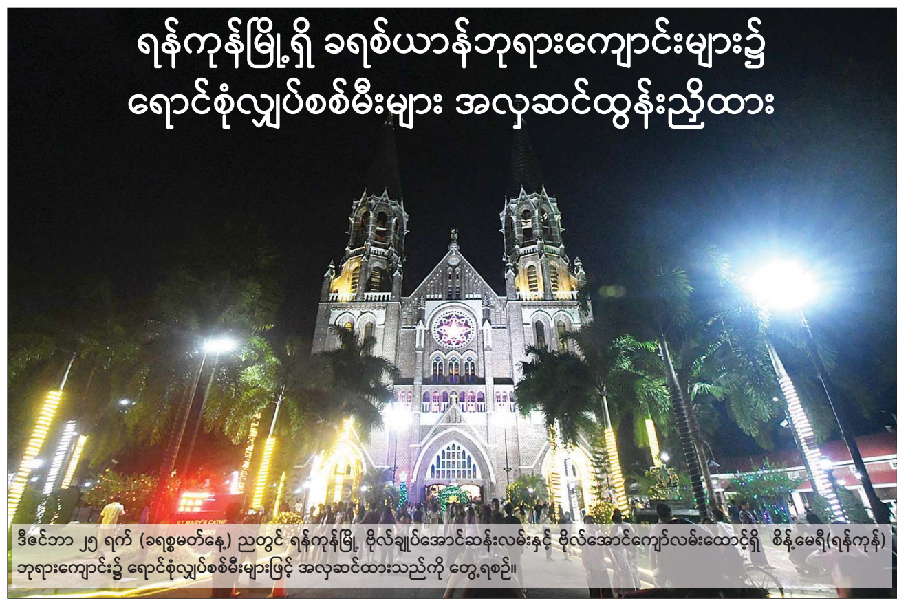
ဒီဇင်ဘာ ၂၅ ရက် (ခရစ္စမတ်နေ့) ညတွင် ရန်ကုန်မြို့၊ ဗိုလ်ချုပ်အောင်ဆန်းလမ်းနှင့် ဗိုလ်အောင်ကျော်လမ်းထောင့်ရှိ စိန့်မေရီ(ရန်ကုန်) ဘုရားကျောင်း၌ ရောင်စုံလျှပ်စစ်မီးများဖြင့် အလှဆင်ထားသည်ကို တွေ့ရစဉ်။ ရန်ကုန် ဒီဇင်ဘာ ၂၅ ယနေ့သည် ဒီဇင်ဘာ ၂၅ ရက် ခရစ္စမတ်နေ့ဖြစ်သည်အညီ တိုင်းရင်းသားပေါင်းစုံ ခရစ်ယာန်ဘာသာဝင်များ၏ ခရစ်တော်ဘုရားသခင်မွေးနေ့တော်မြတ်ဖြစ်သောကြောင့် အထိမ်းအမှတ်အနေဖြင့် မြန်မာနိုင်ငံတစ်ဝန်းလုံးရှိ ခရစ်ယာန်ဘုရားကျောင်းများ၌ ဘုရားဝတ်ပြုဆုတောင်းခြင်းတို့ကို စိတ်အေးချမ်းသာယာစွာဖြင့် ဆောင်ရွက်ကြသည်။ စာမျက်နှာ ၉ ကော်လံ ၁ ○

ရန်ကုန် ဒီဇင်ဘာ ၂၅ မြန်မာအသင်း ဝင်ရောက်ယှဉ်ပြိုင်မည့် ၂၀၂၄ အာရှဖလား ယူ-၂၀ အမျိုးသမီးခြေစစ်ပွဲ ပထမအဆင့် အုပ်စုပွဲစဉ်များ ထွက်ပေါ်လာပြီ ဖြစ်သည်။ ခြေစစ်ပွဲကို အဆင့်နှစ်ဆင့်ခွဲ၍ ကျင်းပမည်ဖြစ်ပြီး ခြေစစ်ပွဲများကို ၂၀၂၃ ခုနှစ်အတွင်း အပြီးကျင်းပမည်ဖြစ်သည်။ စာမျက်နှာ ၉ ကော်လံ ၂ ●