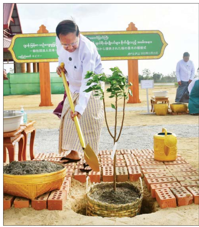
ပြည်ထောင်စုဝန်ကြီး ဦးကိုကို ဂျပန်ချယ်ရီပန်း ပျိုးပင်ကို စိုက်ပျိုးပေးစဉ်။

ဂျပန် - မြန်မာယဉ်ကျေးမှုမြှင့်တင်ရေးအသင်းမှ လှူဒါန်းသည့် ဂျပန်ချယ်ရီပန်းပျိုးပင်များ စိုက်ပျိုးသည့် အခမ်းအနားကို ယနေ့နံနက်ပိုင်းတွင် ပြည်ထောင်စုနယ်မြေ နေပြည်တော် ဒဂုံဇာတိရိယာဇာတိ မာရဝိဇယ ဗုဒ္ဓရုပ်ပွားတော်မြတ်ကြီး ပရိသတ်တော်အတွင်း၌ ကျင်းပသည်။ အခမ်းအနားသို့ သာသနာရေးနှင့် ယဉ်ကျေးမှုဝန်ကြီးဌာန ပြည်ထောင်စုဝန်ကြီး ဦးကိုကို၊ ဒုတိယဝန်ကြီးများဖြစ်ကြသည့် ဦးကျော်မျိုးထွဋ်၊ ဦးအေးထွန်းနှင့် ဒေါက်တာ မိုးဇော်ထွန်း၊ တပ်မတော်မှ အရာရှိကြီးများ၊ ညွှန်ကြားရေးမှူးချုပ်များနှင့် တာဝန်ရှိသူများ တက်ရောက်ကြပြီး ဂျပန်နိုင်ငံအောက် လွှတ်တော်အမတ် Mr. Hiromichi Watanabe၊ ဂျပန် - မြန်မာယဉ်ကျေးမှု မြှင့်တင်ရေးအသင်း ဥက္ကဋ္ဌ Mr. Fumio Usui နှင့် တာဝန်ရှိသူများ တက်ရောက်ကြသည်။ ဦးစွာ ပြည်ထောင်စုဝန်ကြီးနှင့် တက်ရောက်လာကြသူများသည် အခမ်းအနားကို နမောတသ သုံးကြိမ်ရွတ်ဆို ဘုရားကန်တော့ ဖွင့်လှစ်ပြီး မေတ္တာပို့လက်နှစ်ပိုဒ်ကို သံပြိုင်ညီညာသုံးကြိမ်ရွတ်ဆို၍ မေတ္တာပွားများပူဇော်ကြသည်။