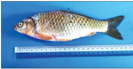
ငါးဖိန်းငါးမျိုးစိတ်

မြန်မာနိုင်ငံနှင့် ငါးမျိုးပြုန်းတီးမှု မြန်မာနိုင်ငံသည် မြေပေါ်မြေအောက် သဘာဝ သယံဇာတပေါများကြွယ်ဝသည့် နိုင်ငံတစ်နိုင်ငံ ဖြစ်သည့် အားလျော်စွာ စိုက်ပျိုးမွေးမြူရေးလုပ်ငန်း များကို အဓိကထားလုပ်ကိုင်လျက်ရှိပြီး မြန်မာ နိုင်ငံ နေရာအနှံ့အပြား နေရာဒေသအသီးသီးရှိ စိုက်ပျိုး မြေများ၌ သီးနှံစိုက်ပျိုး၍ မြစ်ချောင်းအင်းအိုင် များအနီး နေထိုင်သူများက ရေလုပ်ငန်းဖြင့် အသက် မွေးဝမ်းကျောင်းပြု နေထိုင်လျက်ရှိကြပါသည်။ သဘာဝသယံဇာတများ မည်မျှပင်ပေါကြွယ်ဝစေ ကာမူ ရေရှည်တည်တံ့ခိုင်မြဲစေရန် ထိန်းသိမ်း စောင့်ရှောက်နိုင်မှသာလျှင် ရေရှည်ထုတ်ယူသုံးစွဲ နိုင်မည်ဖြစ်ပါသည်။