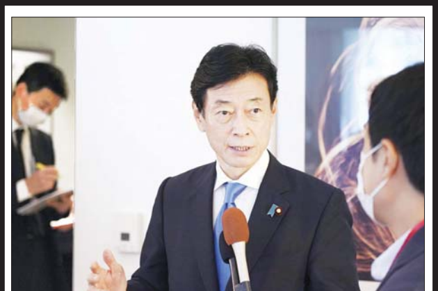
စီးပွားရေး၊ ကုန်သွယ်ရေးနှင့် စက်မှုဝန်ကြီး နီရီမူရာယာဆုတိုရှိ။