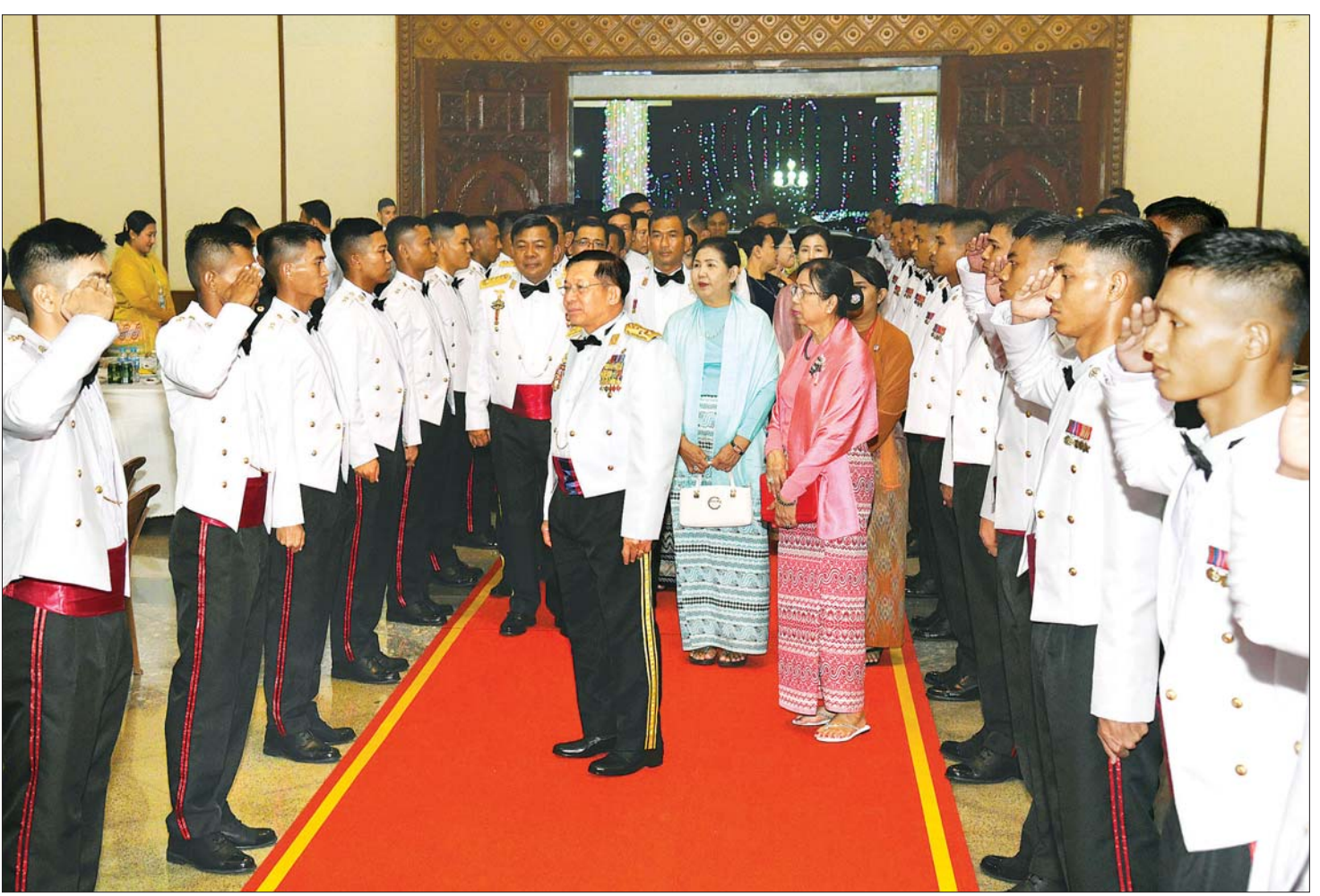
နိုင်ငံတော်စီမံအုပ်ချုပ်ရေးကောင်စီဥက္ကဋ္ဌ တပ်မတော်ကာကွယ်ရေးဦးစီးချုပ် ဗိုလ်ချုပ်မှူးကြီး မင်းအောင်လှိုင် သင်တန်းဆင်းအရာရှိများအား တစ်ဦးချင်း ရင်းရင်းနှီးနှီး လိုက်လံနှုတ်ဆက်စဉ်။

ဦးစွာ နိုင်ငံတော်စီမံအုပ်ချုပ်ရေးကောင်စီဥက္ကဋ္ဌ တပ်မတော်ကာကွယ်ရေးဦးစီးချုပ်က သင်တန်းဆင်း အရာရှိများအား တစ်ဦးချင်း ရင်းရင်းနှီးနှီး လိုက်လံ နှုတ်ဆက်သည်။ ထို့နောက် နိုင်ငံတော်စီမံအုပ်ချုပ် ရေးကောင်စီဥက္ကဋ္ဌ တပ်မတော်ကာကွယ်ရေးဦးစီး ချုပ်နှင့် အဖွဲ့ဝင်များသည် သင်တန်းဆင်းအရာရှိများ၊