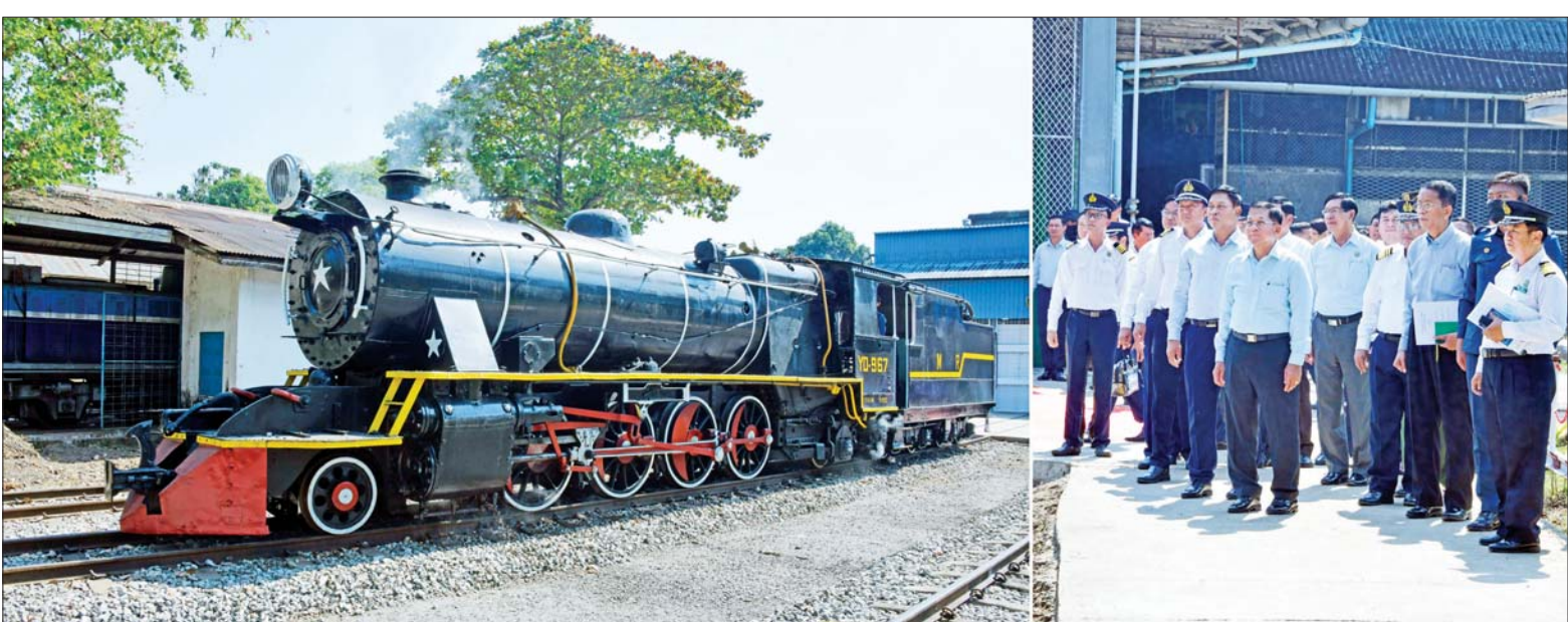
နိုင်ငံတော်စီမံအုပ်ချုပ်ရေးကောင်စီဥက္ကဋ္ဌ နိုင်ငံတော်ဝန်ကြီးချုပ် ဗိုလ်ချုပ်မှူးကြီး မင်းအောင်လှိုင်နှင့် အဖွဲ့ဝင်များ ရေနေ့ငွေစက်ခေါင်းအား ကျောက်မီးသွေးသုံးစက်ခေါင်းအဖြစ် ပြုပြင်ထားရှိသည့် မီးရထားစက်ခေါင်းစမ်းသပ်မောင်းနှင်မှုကို ကြည့်ရှုစဉ်။

နိုင်ငံ၏ စီးပွားရေး မောင်းနှင်အားတွင် ရထားပို့ဆောင်ရေးသည် အရေးကြီးသည့် အခန်းကဏ္ဍမှ ပါဝင်နေ ကမ္ဘာပေါ်ရှိ နိုင်ငံတိုင်းသည် နိုင်ငံအလိုက် စီးပွားရေးဖွံ့ဖြိုးတိုးတက်ရေးအတွက် အမြဲမပြတ် ကြိုးပမ်းဆောင်ရွက်နေကြကြောင်း၊ မိမိတို့နိုင်ငံအနေဖြင့်လည်း ရပ်နေချိန်မှလျာ ကြိုးစားအားထုတ်နေမှသာလျှင် ဖွံ့ဖြိုးတိုးတက်မည်ဖြစ်ကြောင်း၊ နိုင်ငံစီးပွားရေးကောင်းမွန်မှ