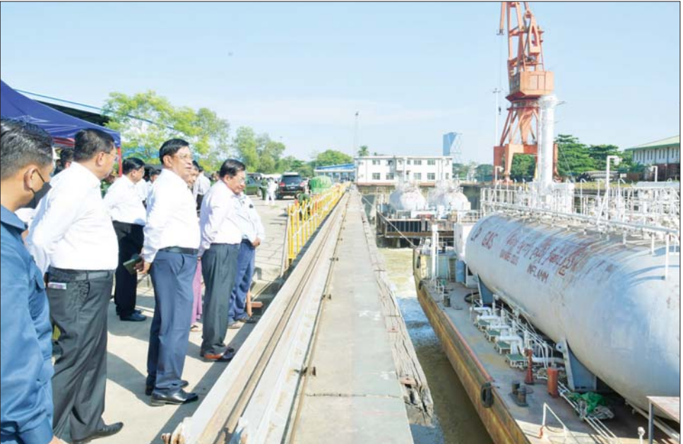
နိုင်ငံတော်စီမံအုပ်ချုပ်ရေးကောင်စီဥက္ကဋ္ဌ နိုင်ငံတော်ဝန်ကြီးချုပ် ဗိုလ်ချုပ်မှူးကြီး မင်းအောင်လှိုင် မြန်မာ့သင်္ဘောကျင်းလုပ်ငန်းအတွင်း လှည့်လည်ကြည့်ရှုစဉ်။