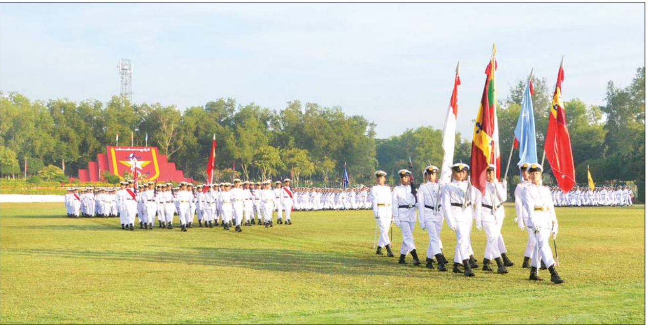
နိုင်ငံတော်စီမံအုပ်ချုပ်ရေးကောင်စီဥက္ကဋ္ဌ တပ်မတော်ကာကွယ်ရေးဦးစီးချုပ် ဗိုလ်ချုပ်မှူးကြီး မဟာသရေစည်သူ မင်းအောင်လှိုင် အား ဗိုလ်လောင်းသင်တန်းများက အနှေးလျှောက်၊ အမြန်လျှောက်ဖြင့် ချီတက်အလေးပြုကြစဉ်။