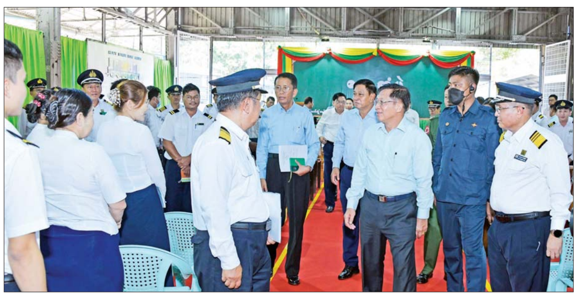
နိုင်ငံတော်စီမံအုပ်ချုပ်ရေးကောင်စီဥက္ကဋ္ဌ နိုင်ငံတော်ဝန်ကြီးချုပ် ဗိုလ်ချုပ်မှူးကြီး မင်းအောင်လှိုင် တက်ရောက်လာကြသည့် မီးရထားဝန်ထမ်းများအား ရင်းရင်းနှီးနှီးနှုတ်ဆက်စဉ်။

ကောင်စီဥက္ကဋ္ဌ နိုင်ငံတော်ဝန်ကြီးချုပ်က အမှာစကားပြောကြားရာတွင် နိုင်ငံတော် တွင် ဖြစ်ပေါ်ခဲ့သည့် အခြေအနေများအရ နိုင်ငံတော်၏တာဝန်များကို ထမ်းဆောင် နေရသည့်အချိန်တွင် နိုင်ငံတော်ဖွံ့ဖြိုး တိုးတက်ရေးအတွက် စီးပွားရေးကို အထောက်အကူပြုနိုင်သည့် လုပ်ငန်းများ ကို အားပေးဆောင်ရွက်လျက်ရှိကြောင်း၊ ထို့ကြောင့် လုပ်ငန်းများလည်ပတ်နိုင် ရေး လိုက်လံကြည့်ရှုစစ်ဆေးပြီး တွေ့ဆုံ ဆွေးနွေးမှုများနှင့် အကြံပေးခြင်းများ ဆောင်ရွက်ခဲ့ကြောင်း။ နိုင်ငံဖွံ့ဖြိုးတိုးတက်ရန်အတွက် အဓိကလိုအပ်ချက်သည် နိုင်ငံရေးအရ တည်ငြိမ်အေးချမ်းရန်နှင့် စီးပွားရေးအရ ဖွံ့ဖြိုးတိုးတက်ရန်ဖြစ် နိုင်တစ်ခု ဖွံ့ဖြိုးတိုးတက်ရေး အတွက် နိုင်ငံရေးမောင်းနှင်အား၊ စီးပွား ရေး မောင်းနှင်အားနှင့် ကာကွယ်ရေး စွမ်းပကားများ ကောင်းမွန်ရန်လိုအပ် ကြောင်း၊ နိုင်ငံရေး မောင်းနှင်အားတွင်