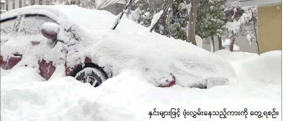
နှင်းများဖြင့် ဖုံးလွှမ်းနေသည့်ကားကို တွေ့ရစဉ်။