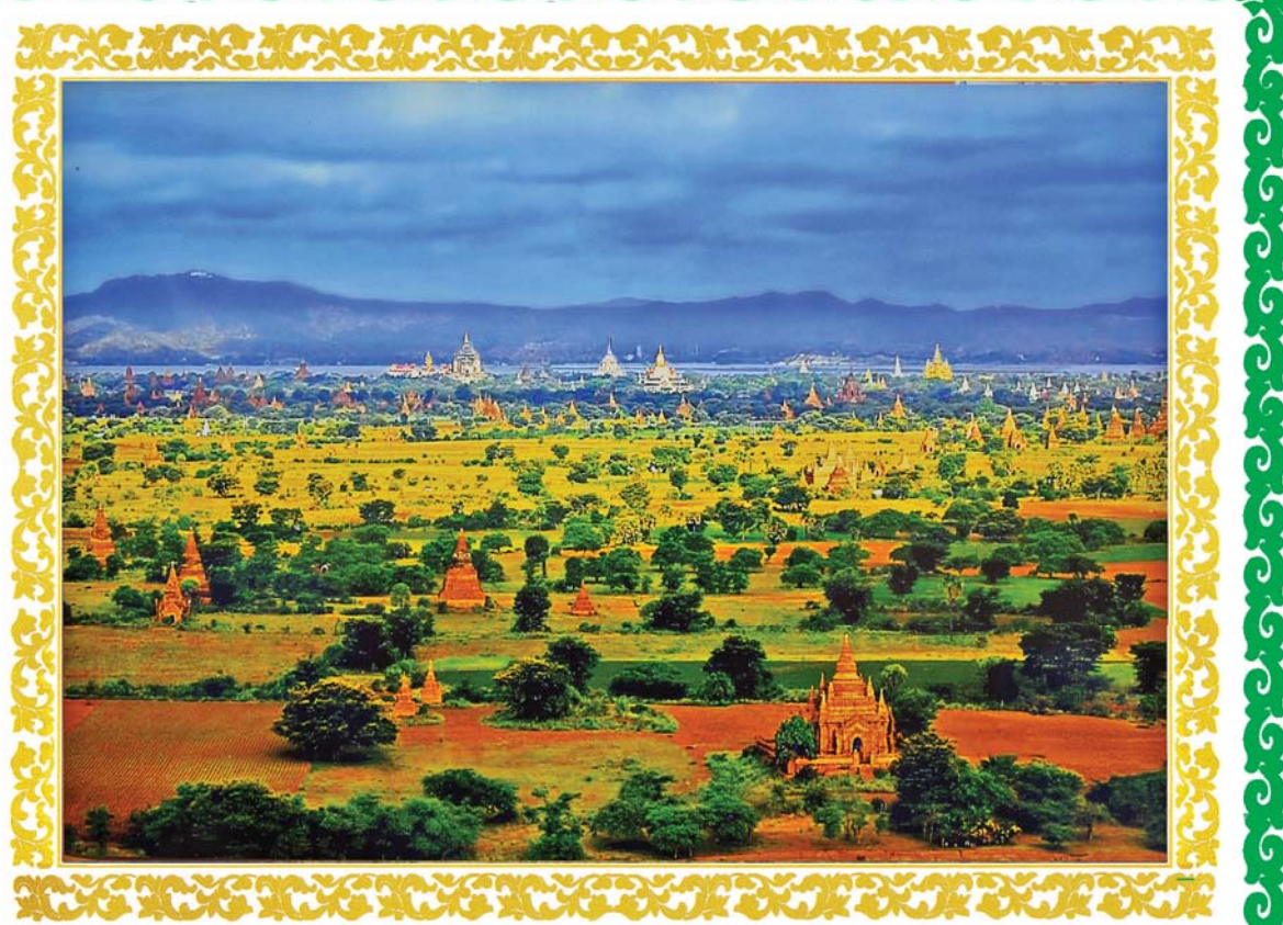
ပုဂံရှုခင်းအလှ

(နိုင်ငံတော်စီမံအုပ်ချုပ်ရေးကောင်စီဥက္ကဋ္ဌ နိုင်ငံတော်ဝန်ကြီးချုပ် ဗိုလ်ချုပ်မှူးကြီး မင်းအောင်လှိုင်၏ ၁၂-၂၀၂၁ ရက်နေ့တွင် (၇၄) နှစ်မြောက် ပြည်ထောင်စုနေ့အခမ်းအနားသို့ ပေးပို့သည့် သဝဏ်လွှာမှ ကောက်နုတ်ချက်)