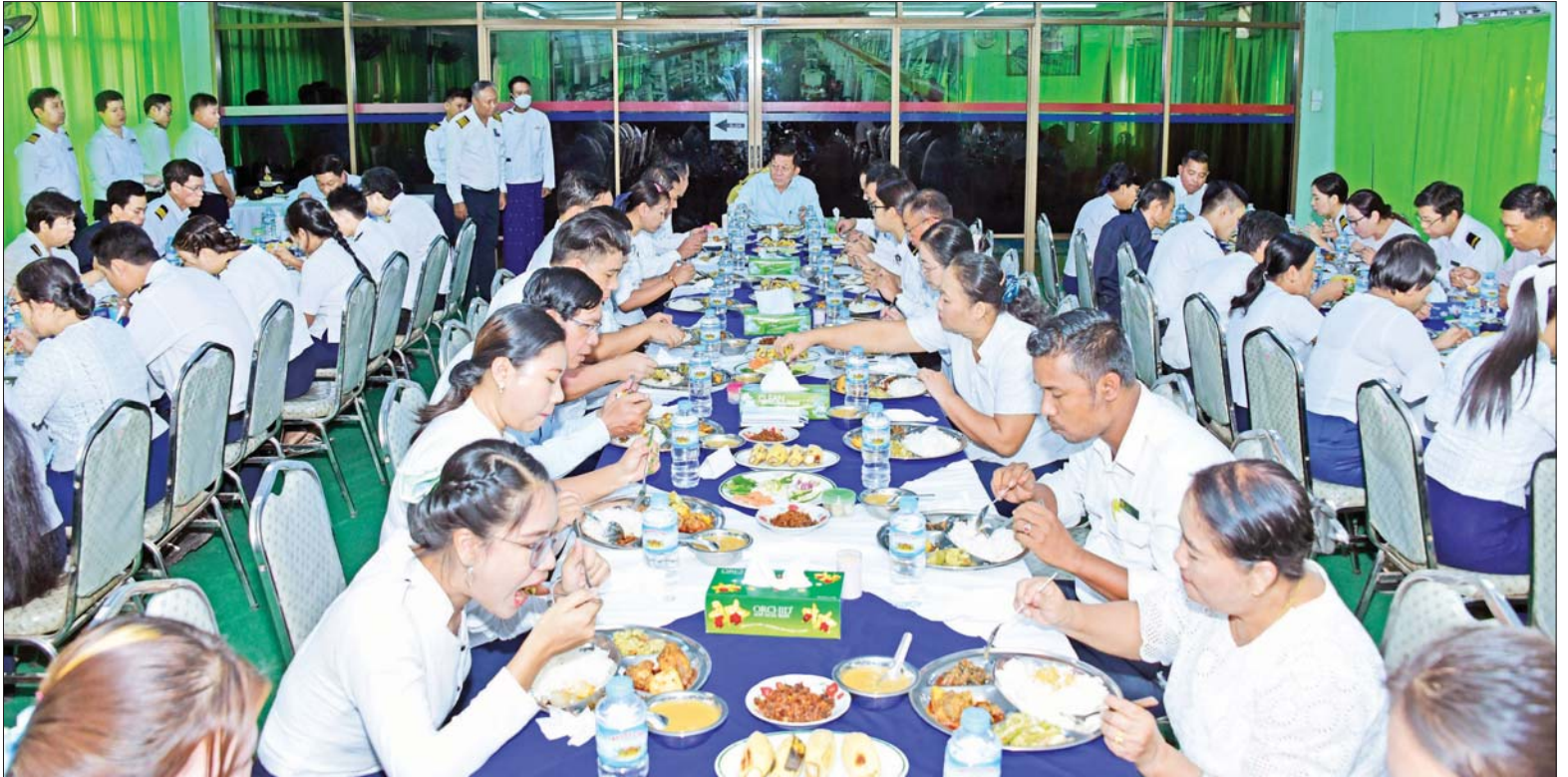
နိုင်ငံတော်စီမံအုပ်ချုပ်ရေးကောင်စီဥက္ကဋ္ဌ နိုင်ငံတော်ဝန်ကြီးချုပ် ဗိုလ်ချုပ်မှူးကြီး မင်းအောင်လှိုင်နှင့်အဖွဲ့ဝင်များ မြန်မာ့မီးရထားစက်ခေါင်းစက်ရုံ(အင်းစိန်)မှ ဝန်ထမ်း များနှင့်အတူ နေ့လယ်စာ အတူတကွ သုံးဆောင်စဉ်။

စက်ခေါင်းစက်ရုံ (အင်းစိန်) သည် လွန်ခဲ့သည့် နှစ်ပေါင်း ၁၀၀ ကျော်ခန့်