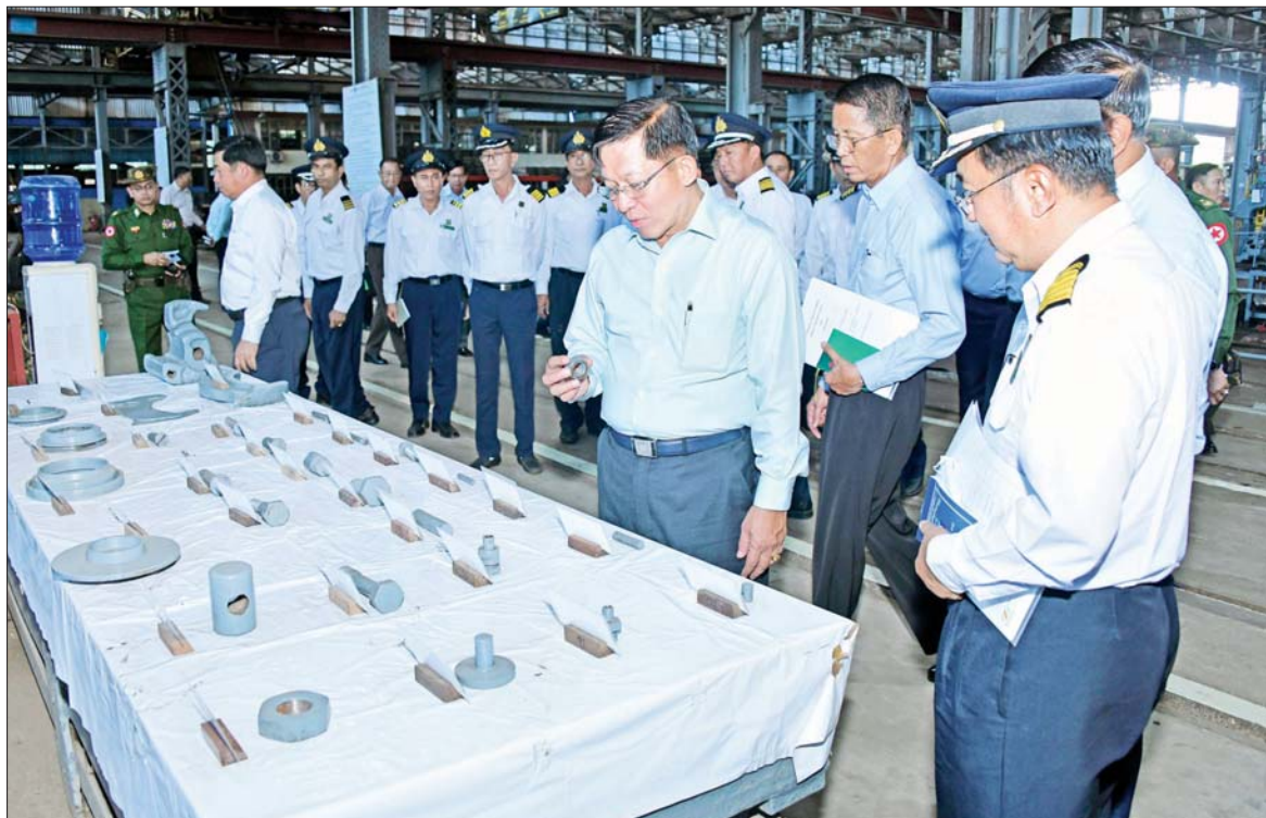
နိုင်ငံတော်စီမံအုပ်ချုပ်ရေးကောင်စီဥက္ကဋ္ဌ နိုင်ငံတော်ဝန်ကြီးချုပ် ဗိုလ်ချုပ်မှူးကြီး မင်းအောင်လှိုင် မီးရထားစက်ခေါင်း စက်ရုံစည်းစဉ်များ ထုတ်လုပ်ထားရှိမှု အခြေအနေများကို ကြည့်ရှုစစ်ဆေးစဉ်။

မည်သည့်နိုင်ငံရေးစနစ်ကိုကျင့်သုံးသည် ဖြစ်စေ နိုင်ငံအတွင်းရှိ နိုင်ငံရေးအရ စည်းလုံးညီညွတ်မှုများ ရှိမည်ဆိုပါက နိုင်ငံတိုးတက်မည်ဖြစ်ကြောင်း၊ စီးပွား ရေး မောင်းနှင်အား ကောင်းမွန်မှုသာလျှင် လည်း ချမ်းသာကြွယ်ဝမှုရှိမည်ဖြစ် ကြောင်း၊ ကမ္ဘာ့နိုင်ငံအသီးသီးတွင် စီးပွား ရေးမောင်းနှင်အား ကောင်းမွန်သည့် နိုင်ငံများသည် ဩဇာရှိသည်ကို တွေ့ရ မည်ဖြစ်ကြောင်း၊ ကာကွယ်ရေးစွမ်းပကား ထက်မြက်သည့် နိုင်ငံများသည်လည်း ကမ္ဘာတွင် ဩဇာရှိသည့်နိုင်ငံများ ဖြစ်ကြ ကြောင်း၊ နိုင်ငံတစ်နိုင်ငံအနေဖြင့် မိမိတို့ ၏ အချုပ်အခြာအာဏာကို လွတ်လပ်စွာ ဆောင်ရွက်နိုင်ခွင့်ရှိကြောင်း။ မိမိတို့နိုင်ငံသည် စီးပွားရေးတိုးတက် ကောင်းမွန်အောင် ဆောင်ရွက်နိုင်မည့် ကောင်းမွန်သည့် ရေမြေသာတာဝန်များရှိပြီး ဖြစ်ကြောင်း၊ သို့သော်လည်း လွတ်လပ် ရေး ရရှိပြီးချိန်မှစ၍ ခေတ်အဆက်ဆက် တွင် နိုင်ငံရေးစနစ်အမျိုးမျိုးကို ပြောင်းလဲ ကျင့်သုံးခဲ့ပြီး အကြောင်းအမျိုးမျိုးကြောင့် စီးပွားရေး ဖွံ့ဖြိုးတိုးတက်အောင် ဆောင်ရွက်နိုင်မှုမရှိခဲ့ကြောင်း၊ ခေတ် အဆက်ဆက်တွင် စီးပွားရေးအရ ပိတ်ဆို့ ခံရမှုများကြောင့် ကုန်သွယ်မှု လိုငွေများ ဖြစ်ပေါ်ခဲ့ခြင်း၊ ကုန်သွယ်မှုကျဆင်းခြင်း တို့ကြောင့် စီးပွားရေးကျဆင်းမှုများ