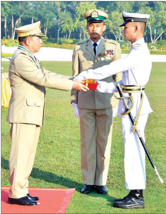
နိုင်ငံတော်စီမံအုပ်ချုပ်ရေးကောင်စီဥက္ကဋ္ဌ တပ်မတော်ကာကွယ်ရေး ဦးစီးချုပ် ဗိုလ်ချုပ်မှူးကြီး မဟာသရေစည်သူ မင်းအောင်လှိုင် လေ့ကျင့်ရေးထူးချွန်ဆုရရှိသူ ဗိုလ်လောင်း မင်းခန့်ကျော် အား ဆုပေးအပ်ချီးမြှင့်စဉ်။