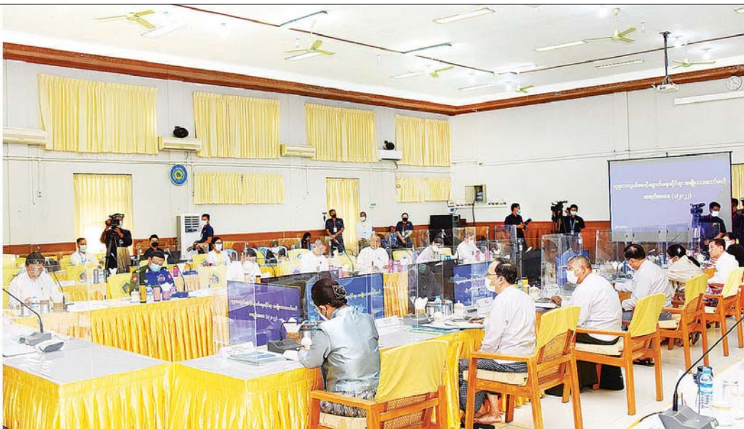
နိုင်ငံတော်စီမံအုပ်ချုပ်ရေးကောင်စီ ဒုတိယဥက္ကဋ္ဌ ဒုတိယဝန်ကြီးချုပ် ဒုတိယဗိုလ်ချုပ်မှူးကြီး စိုးဝင်း လူမှုကာကွယ်စောင့်ရှောက်ရေးဆိုင်ရာ အမျိုးသားကော်မတီအစည်းအဝေး (၁/၂၀၂၂) တွင် အမှာစကားပြောကြားစဉ်။

နေပြည်တော် ဒီဇင်ဘာ ၂၁ လူမှုကာကွယ် စောင့်ရှောက်ရေးဆိုင်ရာ အမျိုးသားကော်မတီအစည်းအဝေး (၁/၂၀၂၂) ကို ယနေ့ မွန်းလွဲ ၁ နာရီခွဲတွင် နေပြည်တော်ရှိ လူမှုဝန်ထမ်း၊ ကယ်ဆယ်ရေးနှင့် ပြန်လည်နေရာချထားရေးဝန်ကြီးဌာန အစည်းအဝေးခန်းမ၌ကျင်းပရာ လူမှုကာကွယ်စောင့်ရှောက်ရေးဆိုင်ရာ အမျိုးသားကော်မတီ ဥက္ကဋ္ဌ နိုင်ငံတော်စီမံအုပ်ချုပ်ရေးကောင်စီ ဒုတိယဥက္ကဋ္ဌ ဒုတိယဝန်ကြီးချုပ် ဒုတိယဗိုလ်ချုပ်မှူးကြီး စိုးဝင်း တက်ရောက်အမှာစကား ပြောကြားသည်။