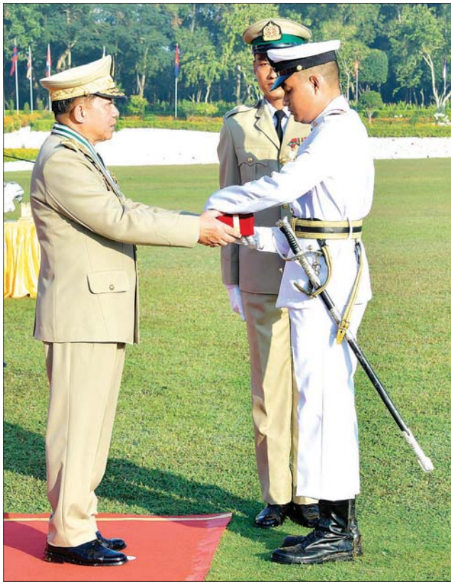
နိုင်ငံတော်စီမံအုပ်ချုပ်ရေးကောင်စီဥက္ကဋ္ဌ တပ်မတော်ကာကွယ်ရေး ဦးစီးချုပ် ဗိုလ်ချုပ်မှူးကြီး မဟာသရေစည်သူ မင်းအောင်လှိုင် စာပေထူးချွန်ဆုရရှိသူ ဗိုလ်လောင်း ကျော်သူရ အား ဆုပေးအပ် ချီးမြှင့်စဉ်။

ရှေ့မှ ဦးစီးချုပ်နှင့်အတူ ဇနီး ဒေါ်ကြူကြူလှ၊ ညှိနှိုင်းကွပ်ကဲ ရေးမှူး (ကြည်း၊ ရေ၊ လေ) ဗိုလ်ချုပ်ကြီး သီရိပျံချို မောင်မောင်အေးနှင့်ဇနီး၊ ကာကွယ်ရေးဦးစီးချုပ်(ရေ) ဗိုလ်ချုပ်ကြီး ဇေယျကျော်ထင် မိုးအောင်နှင့်ဇနီး၊ ကာကွယ်ရေးဦးစီးချုပ်(လေ) ဗိုလ်ချုပ်ကြီး ဇေယျ ကျော်ထင် ထွန်းအောင်နှင့်ဇနီး၊ ကာကွယ်ရေးဦးစီး ချုပ်ရုံးမှ တပ်မတော်အရာရှိကြီးများနှင့် ဇနီးများ၊ ပြည်ထောင်စုဝန်ကြီးများ၊ ရန်ကုန်တိုင်းဒေသကြီး ဝန်ကြီးချုပ်၊ ရန်ကုန်တိုင်းစစ်ဌာနချုပ် တိုင်းမှူး၊ ရန်ကုန်မြို့တော်ဝန်၊ တပ်မတော်ဆေးတက္ကသိုလ် ကျောင်းအုပ်ကြီးနှင့် မင်္ဂလာဒုံတပ်နယ်မှ တာဝန်ရှိသူ များ၊ ကျောင်းဆင်းဗိုလ်လောင်းများ၏ မိဘအုပ်ထိန်း သူများဖြစ်သည့် တပ်မတော်ဆေးတက္ကသိုလ်၊ စာပေ ဌာနနှင့် လေ့ကျင့်ရေးဌာနတို့မှ နည်းပြအရာရှိများနှင့် ဆရာ၊ ဆရာမများ၊ ဖိတ်ကြားထားသည့် ဧည့်သည် တော်များ တက်ရောက်ကြသည်။