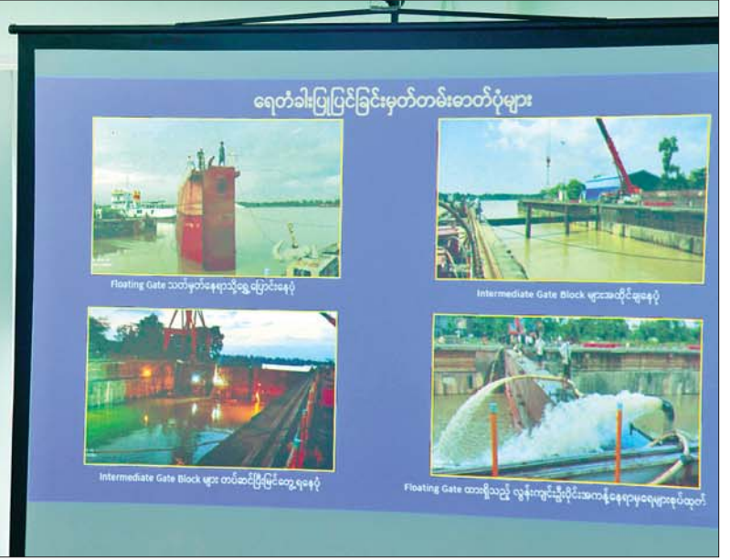
နိုင်ငံတော်စီမံအုပ်ချုပ်ရေးကောင်စီဥက္ကဋ္ဌ နိုင်ငံတော်ဝန်ကြီးချုပ် ဗိုလ်ချုပ်မှူးကြီး မင်းအောင်လှိုင်နှင့်အဖွဲ့ဝင်များအား မြန်မာ့သင်္ဘောကျင်းလုပ်ငန်းမှ တာဝန်ရှိသူတစ်ဦးက လုပ်ငန်းဆောင်ရွက်မှု အခြေအနေများ ရှင်းလင်းတင်ပြစဉ်။