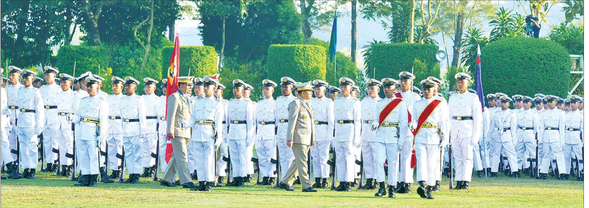
နိုင်ငံတော်စီမံအုပ်ချုပ်ရေးကောင်စီဥက္ကဋ္ဌ တပ်မတော်ကာကွယ်ရေးဦးစီးချုပ် ဗိုလ်ချုပ်မှူးကြီး မဟာသရေစည်သူ မင်းအောင်လှိုင် ကျောင်းဆင်းဗိုလ်လောင်းတပ်ခွဲအား စစ်ဆေးစဉ်။