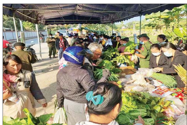
တာချီလိတ်မြို့၌ ဟင်းသီးဟင်းရွက်နှင့် စားသောက်ကုန်ပစ္စည်းများ ရောင်းချပေးစဉ်။