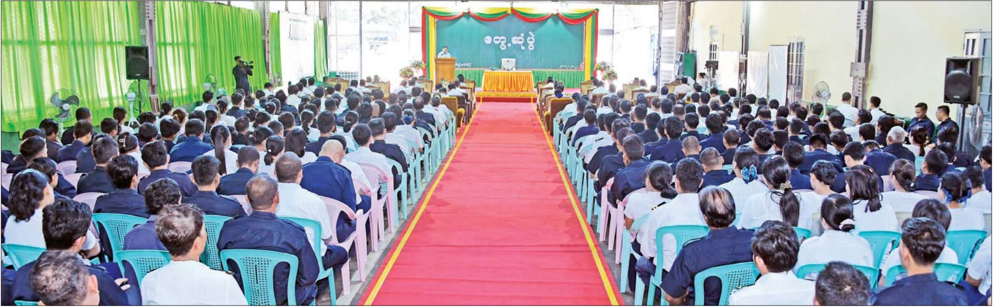
နိုင်ငံတော်စီမံအုပ်ချုပ်ရေးကောင်စီဥက္ကဋ္ဌ နိုင်ငံတော်ဝန်ကြီးချုပ် ဗိုလ်ချုပ်မှူးကြီး မင်းအောင်လှိုင် မြန်မာ့မီးရထားစက်ခေါင်းစက်ရုံ(အင်းစိန်)မှ ဝန်ထမ်းများအား တွေ့ဆုံအမှာစကားပြောကြားစဉ်။