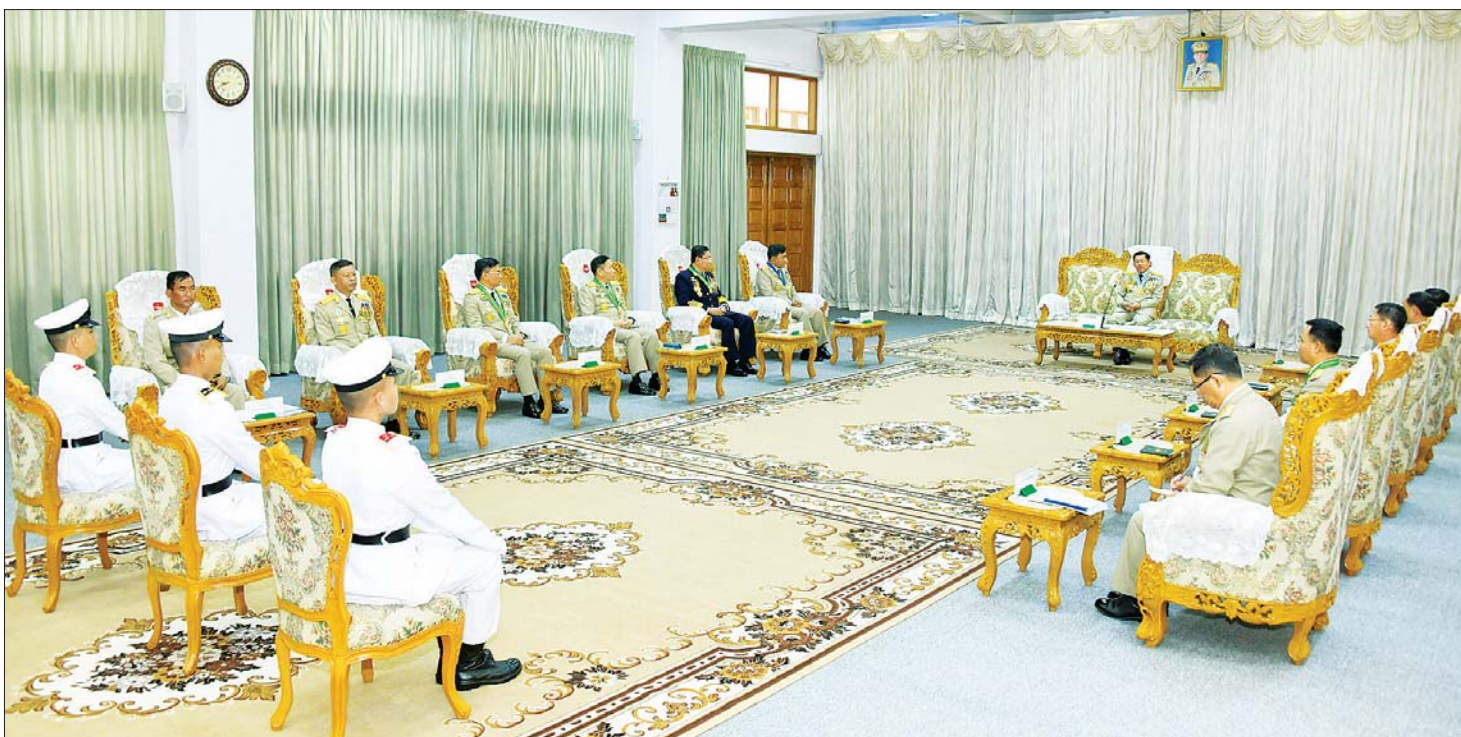
နိုင်ငံတော်စီမံအုပ်ချုပ်ရေးကောင်စီဥက္ကဋ္ဌ တပ်မတော်ကာကွယ်ရေးဦးစီးချုပ် ဗိုလ်ချုပ်မှူးကြီး မဟာသရေစည်သူ မင်းအောင်လှိုင် တပ်မတော် ဆေးတက္ကသိုလ် ကျောင်းဌာနချုပ် ဧည့်ခန်းမ၌ ထူးချွန်ဆုရရှိကြသည့် ဗိုလ်လောင်းများကို တွေ့ဆုံ၍ ဂုဏ်ပြုအမှာစကားပြောကြားစဉ်။

တပ်ရင်းများတွင်သာမက နိုင်ငံတစ်ဝန်းရှိ ပြည်သူလူထုများအတွက် ပြည့်စုံလုံလောက်သော ကျန်းမာရေးစောင့်ရှောက်မှုပေးနိုင်ရန် ရည်ရွယ်ချက်ဖြင့် နယ်လှည့်ဆေးကုသမှုလုပ်ငန်းများ ဆောင်ရွက်နိုင်ရန် တပ်မတော်အနေဖြင့် လိုအပ်သော ဆေးကုသရေးဆိုင်ရာ ယန္တရား/ပစ္စည်းများဖြည့်တင်းပြီး နိုင်ငံအနှံ့ပြည်သူ့အကျိုးပြု ကျန်းမာရေးစောင့်ရှောက်မှုလုပ်ငန်းများတွင် ခွဲစိတ်ကုသခြင်းများ၊ မီးဖွားခြင်းများနှင့် ပြင်ပလူနာကြည့်ရှုကုသမှုများ ဆောင်ရွက်ပေးနိုင်ခဲ့သည်ကို တွေ့ရမည်ဖြစ်ကြောင်း။