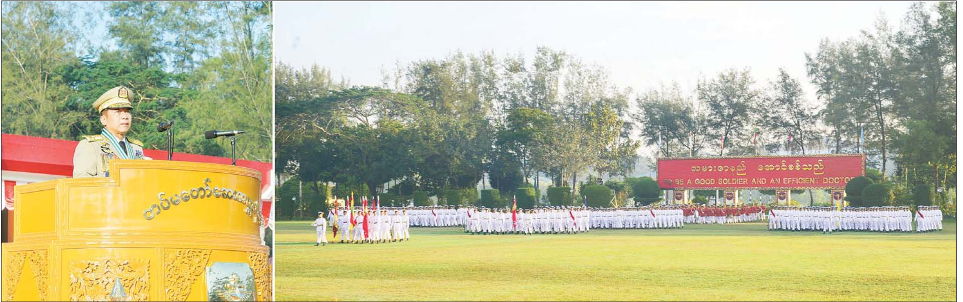
နိုင်ငံတော်စီမံအုပ်ချုပ်ရေးကောင်စီဥက္ကဋ္ဌ တပ်မတော်ကာကွယ်ရေးဦးစီးချုပ် ဗိုလ်ချုပ်မှူးကြီး မဟာသရေစည်သူ မင်းအောင်လှိုင် တပ်မတော်ဆေးတက္ကသိုလ် ဗိုလ်လောင်းသင်တန်း အမှတ်စဉ် (၂၃) သင်တန်းဆင်း ဂုဏ်ပြုစစ်ရေးပြအခမ်းအနားတွင် မိန့်ခွန်းပြောကြားစဉ်။