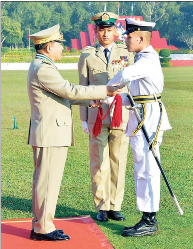
နိုင်ငံတော်စီမံအုပ်ချုပ်ရေးကောင်စီဥက္ကဋ္ဌ တပ်မတော်ကာကွယ်ရေး ဦးစီးချုပ် ဗိုလ်ချုပ်မှူးကြီး မဟာသရေစည်သူ မင်းအောင်လှိုင် အောင်စစ်သည်ဆုရရှိသူ ဗိုလ်လောင်း ဟိန်းထွန်းဇော် အား ဆုပေးအပ်ချီးမြှင့်စဉ်။