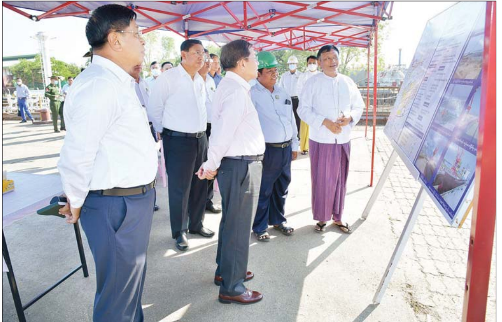
နိုင်ငံတော်စီမံအုပ်ချုပ်ရေးကောင်စီဥက္ကဋ္ဌ နိုင်ငံတော်ဝန်ကြီးချုပ် ဗိုလ်ချုပ်မှူးကြီး မင်းအောင်လှိုင် အား မြန်မာ့သင်္ဘောကျင်းလုပ်ငန်း၌ လုပ်ငန်းဆောင်ရွက်နေမှုများကို တာဝန်ရှိသူတစ်ဦးက ရှင်းလင်းတင်ပြစဉ်။