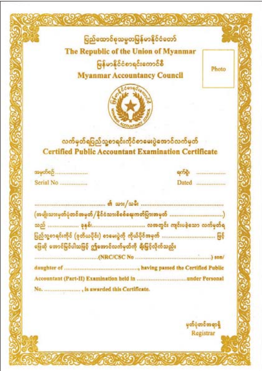
CPA အောင်လက်မှတ်ပုံစံ

ထိုသို့ လက်မှတ်ရပြည်သူ့စာရင်း ကိုင်(အောင်)/(ပြည့်မီ)များ၊ ဒီပလိုမာ စာရင်းကိုင်များ မွေးထုတ်ပေးနိုင်ခဲ့ခြင်း သည် နိုင်ငံအတွက် လိုအပ်လျက်ရှိသည့် စာရင်းပညာရှင် လုပ်သားကောင်းများ တိုးပွား များပြားလာစေရန်အတွက် ကောင်စီ၏ ဆောင်ရွက်ပေးနိုင်ခဲ့မှုပင် ဖြစ်ပါသည်။