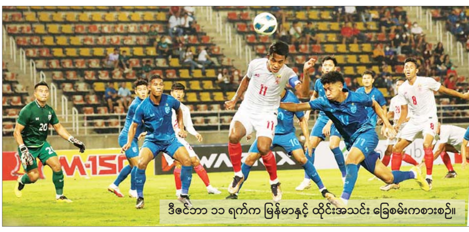
ဒီဇင်ဘာ ၁၁ ရက်က မြန်မာနှင့် ထိုင်းအသင်း ခြေစမ်းကစားစဉ်။

ရန်ကုန် ဒီဇင်ဘာ ၁၆ မြန်မာ့လက်ရွေးစင်အသင်း ဝင်ရောက်ယှဉ်ပြိုင်မည့် ၂၀၂၂ AFF Cup ပြိုင်ပွဲကို ဒီဇင်ဘာ ၂၀ ရက်တွင် စတင်ကျင်းပမည်ဖြစ်သည်။ ပြိုင်ပွဲကို ၂၀၂၂ ခုနှစ် ဒီဇင်ဘာ ၂၀ ရက်မှ ၂၀၂၃ ခုနှစ် ဇန်နဝါရီ ၁၆ ရက်အထိ ကျင်းပမည်ဖြစ်ပြီး အိမ်ရှင်နိုင်ငံ မရွေးချယ်ဘဲ အိမ်ကွင်း၊ အဝေးကွင်း ပုံစံဖြင့် ကျင်းပသွားမည်ဖြစ်သည်။ အုပ်စုပွဲများကို ၂၀၂၂ ခုနှစ် ဒီဇင်ဘာ ၂၀ ရက်မှ ၂၀၂၃ ခုနှစ် ဇန်နဝါရီ ၃ ရက်အထိ ကျင်းပမည် စာမျက်နှာ ၂၂ ကော်လံ ၁