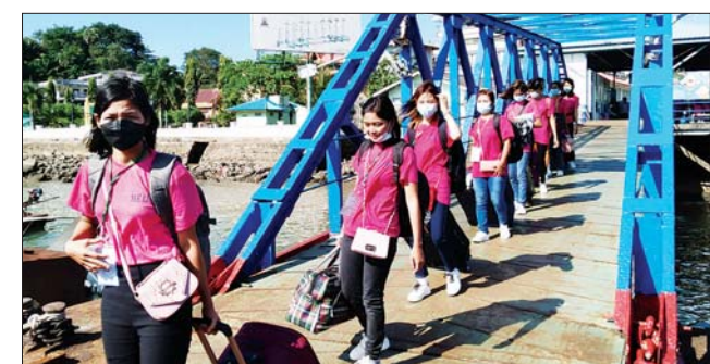
ခွဲကြပြီး အလုပ်အကိုင်ကုမ္ပဏီတာဝန်ရှိသူများက ထိုင်းနိုင်ငံရှိ အလုပ်လုပ်ကိုင်မည့်ကုမ္ပဏီသို့ စနစ်တကျ ပို့ဆောင်ပေးခဲ့ကြကြောင်း သိရသည်။ ကျော်စိုး(ကော့သောင်း)

အမျိုးသားအလုပ်သမား ၅၉ ဦးနှင့် အမျိုးသမီးအလုပ်သမား ၂၀ စုစုပေါင်း အလုပ်သမား ၇၉ ဦးကို နှစ်နှစ်စာချုပ်ဖြင့် အလုပ်လုပ်ကိုင်နိုင် ရန် တာဝန်ယူဆောင်ရွက်ပေးခြင်းဖြစ်ကာ ရန်ကုန်မြို့မှတစ်ဆင့် ကော့သောင်းမြို့သို့ လေကြောင်းခရီးစဉ်ဖြင့် ခေါ်ယူခဲ့ပြီး ကော့သောင်း အပြည်ပြည်ဆိုင်ရာနယ်စပ်ဂိတ်မှတစ်ဆင့် ရေလမ်းခရီးဖြင့် ထိုင်းနိုင်ငံ သို့ ပို့ဆောင်ပေးမည်ဖြစ်ရာ သွားရောက်အလုပ်လုပ်ကိုင်မည့် မြန်မာ အလုပ်သမားများအား ကော့သောင်းခရိုင် အလုပ်သမားညွှန်ကြားမှု ဦးစီးဌာန၊ လူဝင်မှုကြီးကြပ်ရေးနှင့် ပြည်သူ့အင်အားဦးစီးဌာန ကော့သောင်းခရိုင်ရုံး၊ လူကုန်ကူးမှုတားဆီးနှိမ်နင်းရေးရဲတပ်ဖွဲ့နှင့် တာဝန်ရှိအဖွဲ့အစည်းများက လိုအပ်သည့်စစ်ဆေးမှုများ ဆောင်ရွက်ပေး