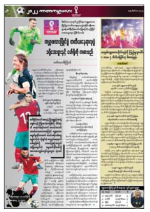
အားကစားသတင်း စာ ၂၀