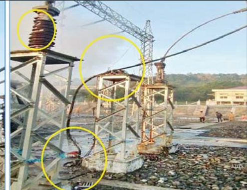
၂၃၀ ကေဗီ မြဝတီပင်မဓာတ်အားခွဲရုံ၏ Main - 2 GCB | LA နှင့် BUS PT တို့၏ ပျက်စီးမှုအခြေအနေ မှတ်တမ်းဓာတ်ပုံ။