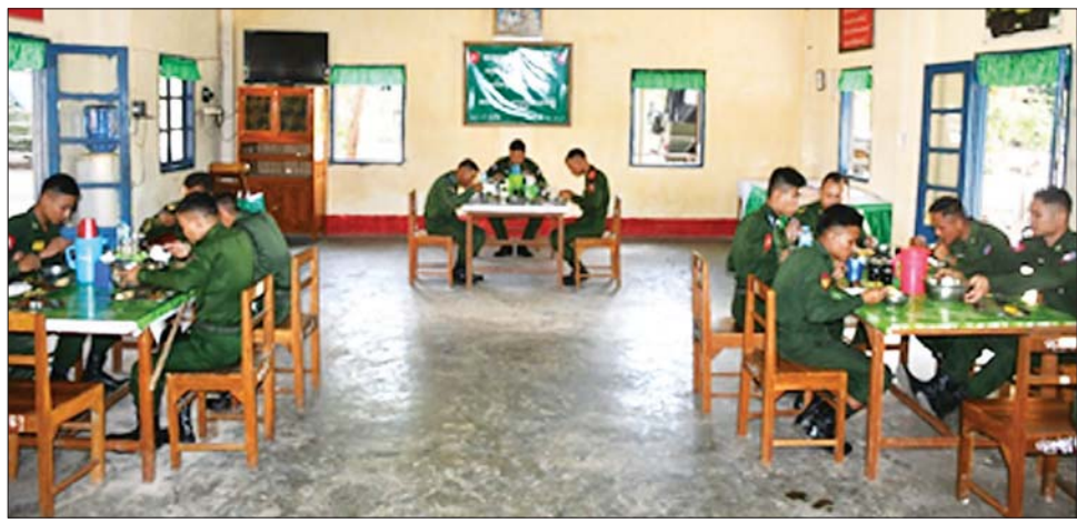
အလယ်ပိုင်းတိုင်းစစ်ဌာနချုပ်၊ ကြိမ်ဒေသတိုင်းစစ်ဌာနချုပ်နှင့် အရှေ့တောင်တိုင်းစစ်ဌာနချုပ်တို့မှ တိုင်းမှူးများနှင့် တာဝန်ရှိသူများက သက်ဆိုင်ရာ ကွပ်ကဲမှုအောက်ရှိ တပ်ရင်း/တပ်ဖွဲ့များနှင့် နယ်မြေခံသင်တန်းကျောင်းများသို့ သွားရောက်၍ အရာရှိ၊ စစ်သည်၊ မိသားစုများအား ရင်းရင်းနှီးနှီး တွေ့ဆုံသတင်းစဉ်

နေပြည်တော် ဒီဇင်ဘာ ၁၆ ရဲဘော်စိတ်ဟူသည် ရဲဘော်အချင်းချင်းအပေါ် ထားရှိသော မေတ္တာတရား၊ သံယောဇဉ်တရား၊ သစ္စာစောင့်သိမှုတရားပင် ဖြစ်သည်နှင့်အညီ တပ်မတော်တွင် တာဝန်ထမ်းဆောင်လျက်ရှိသည့် အရာရှိ၊ စစ်သည်အဆင့်အတန်းအားလုံး ရဲဘော်စိတ် အပြည့်ထားရှိပြီး အထက်အောက်ညီညွတ်မျှတသည့် အုပ်ချုပ်မှုစနစ် ရှိရန် လိုအပ်ကြောင်း တပ်မတော်အကြီးအကဲမှ လမ်းညွှန်မှတ်ကြားထားသည်ဖြစ်ရာ အုပ်ချုပ်မှု ညီညွတ်မျှတစေရန်အတွက် ကွပ်ကဲအုပ်ချုပ်ရာ၌ တပ်မှူးကောင်းစိတ်ဓာတ် (Commander Spirit)၊ ဖခင်သဖွယ်စိတ်ဓာတ် (Fatherly Spirit) တို့ဖြင့် ကွပ်ကဲအုပ်ချုပ်ဆောင်ရွက်လျက်ရှိသည်။