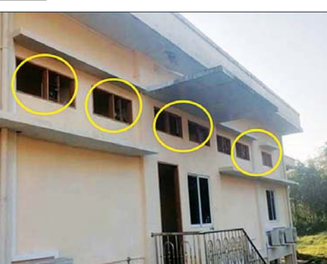
၂၃၀ ကေဗီ မြဝတီပင်မဓာတ်အားခွဲရုံ၏ Control Room ပျက်စီးမှုအခြေအနေ မှတ်တမ်းဓာတ်ပုံ။