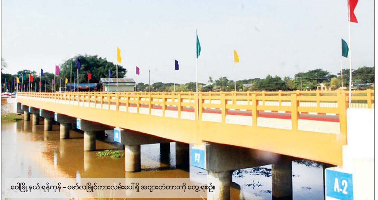
ဝေါမြို့နယ် ရန်ကုန် - မော်လမြိုင်ကားလမ်းပေါ်ရှိ အများတံတားကို တွေ့ရစဉ်။