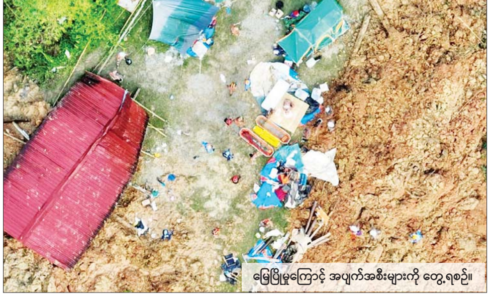
မြေပြိုမှုကြောင့် အပျက်အစီးများကို တွေ့ရစဉ်။

ခြံ နံနက် ၃ နာရီက မြေပြိုမှု ဖြစ်ပွားခဲ့ခြင်းဖြစ်သည်။ တစ်ကေခန့်ရှိသည့် မြေပေါ် သို့ မြေများနှင့် အပျက်အစီးများ လှိုင်းသဖွယ် ကျဆင်းလာခြင်း ဖြစ်သည်။ ရှာဖွေကယ်ဆယ်ရေး သမားများသည် အပျက်အစီးများ အောက်မှ အသက်ရှင်ကျန်ရစ် သူများကို ရှာဖွေနေကြသည်။ ဒဏ်ရာရရှိသူ ခုနစ်ဦးရှိသည်ဟု သိရသည်။