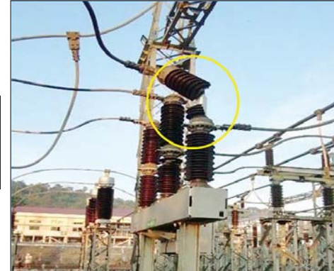
၂၃၀ ကေဗီ မြဝတီပင်မဓာတ်အားခွဲရုံ၏ Main - 2 GCB | LA နှင့် BUS PT တို့၏ ပျက်စီးမှုအခြေအနေ မှတ်တမ်းဓာတ်ပုံ။