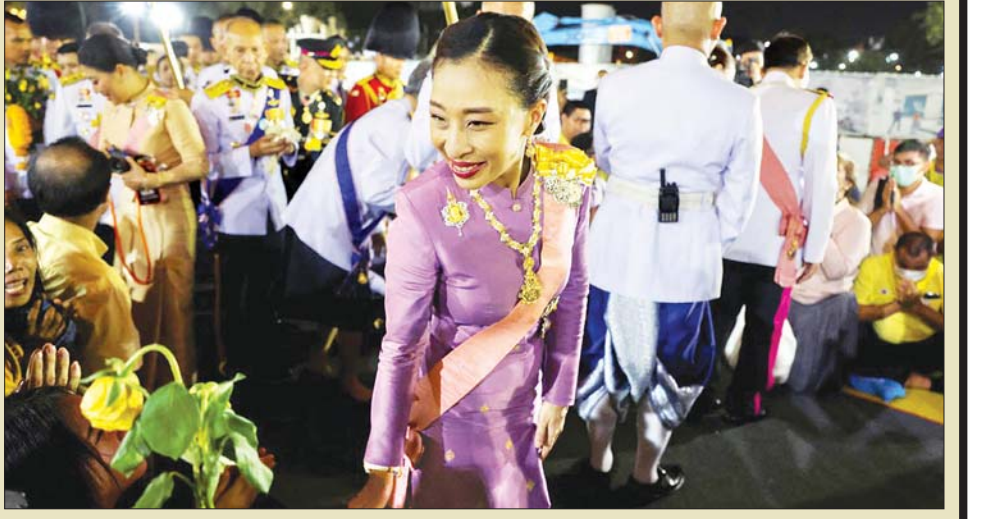
ထိုင်းဘုရင်၏ အကြီးဆုံးသမီးတော်။

၎င်းသည် တရားစီရင်ရေးစနစ်တွင် အမျိုးသမီးများ၏ အခွင့်အရေးအတွက် ထောက်ခံခဲ့သူဖြစ်ကြောင်း လည်း သိရသည်။ အင်န်အိတ်ချ်ကေ