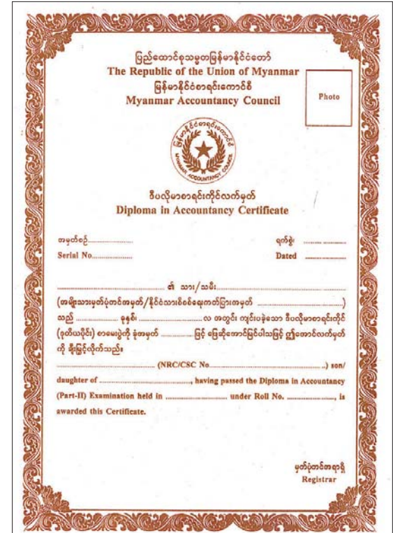
DA အောင်လက်မှတ်ပုံစံ