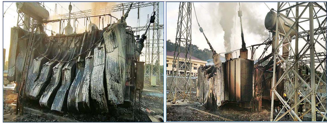
၂၃၀ ကေဗီ မြဝတီပင်မဓာတ်အားခွဲရုံ၏ 230/66/11 kV, 50 MVA Transformer Bank (2) ပျက်စီးမှု အခြေအနေ မှတ်တမ်းဓာတ်ပုံ။

၁၆-၁၂-၂၀၂၂ ရက်နေ့ နံနက် ၁ နာရီခွဲတွင် NUG လက်ဝေခံ PDF အကြမ်းဖက် သောင်းကျန်းသူ များမှ ပစ်ခတ်တိုက်ခိုက်ဖျက်ဆီး ခဲ့သဖြင့် အများပြည်သူသို့ ဓာတ်အားဖြန့်ဖြူးပေး လျက်ရှိ သည့် ၅၀ အမ်ပီအေ ထရန်စဖော်မာ နှစ်လုံး၊ ၂၀ အမ်ပီအေ Shut Reactor တစ်လုံး၊ Gas Circuit Breaker နှစ်လုံး၊ Lightning Arrester နှစ်လုံး၊ Potential Transformer နှစ်လုံး၊ ဓာတ်အား ကြိုးများ၊ ဓာတ်အားထိန်းချုပ် အဆောက်အအုံနှင့် မီးစက် အဆောက်အအုံတို့ ထိခိုက်ပျက်စီး ခဲ့ပြီးဓာတ်အားပြတ်တောက်မှုများ ဖြစ်ပေါ်ခဲ့သည်။ ထိုသို့ ဓာတ်အားပြတ်တောက် မှုကြောင့် မြဝတီမြို့၊ ကော့ကရိတ် မြို့၊ ကြာအင်းဆိပ်ကြီးမြို့၊ ကျိုဒီး မြို့နှင့် အနီးဝန်းကျင်ဒေသများရှိ မီးသုံးစွဲသူ ၅၆၃၆၃ ဦးတို့မှာ လျှပ်စစ်ဓာတ်အား ပြတ်တောက်