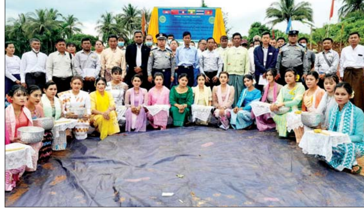
စီမံကိန်းဆိုင်ဘုတ် ဖွင့်လှစ်ပေးပြီး ကံမော်ကြီးရွာသူရွာသားများနှင့် အမှတ်တရ