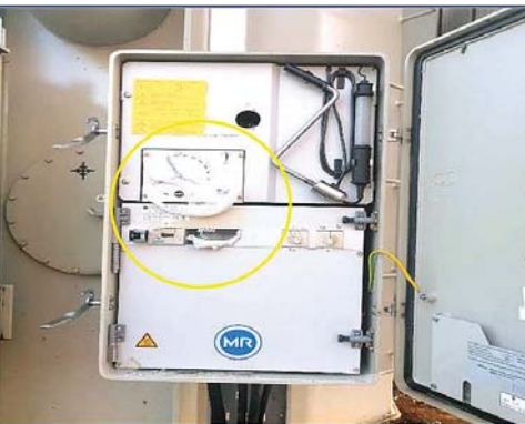
၂၃၀ ကေဗီ မြဝတီပင်မဓာတ်အားခွဲရုံ၏ Main - 2 GCB | LA နှင့် BUS PT တို့၏ ပျက်စီးမှုအခြေအနေ မှတ်တမ်းဓာတ်ပုံ။