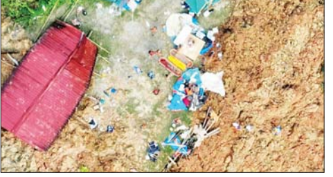
နိုင်ငံတကာသတင်း စာ ၁၃

ယနေ့ သတင်းအညွှန်း မလေးရှားနိုင်ငံ၌ မြေပြိုမှုဖြစ်ပွားပြီး ၁၆ ဦးထက်မနည်း သေဆုံး