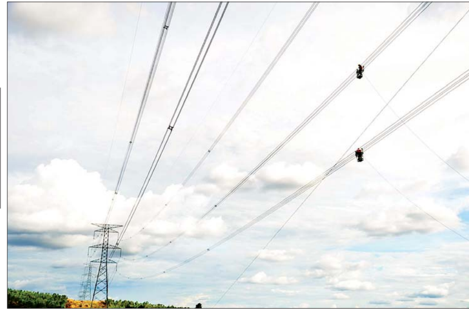
မြန်မာနိုင်ငံ၏ ပထမဆုံးသော ၅၀၀ ကေစီ ကံကောင်း (မိတ္ထီလာ) - စပါးကြွယ် (တောင်ငူ) ဓာတ်အားလှိုင်း အပြီးသတ်ချိတ်ဆက်လုပ်ငန်းများ ဆောင်ရွက်နေမှုကို တွေ့ရစဉ်။