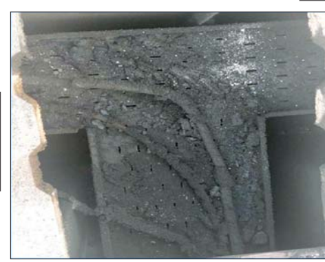
၂၃၀ ကေဗီ မြဝတီပင်မဓာတ်အားခွဲရုံ၏ Control Cable နှင့် Generator House ပျက်စီးမှုအခြေအနေ မှတ်တမ်းဓာတ်ပုံ။