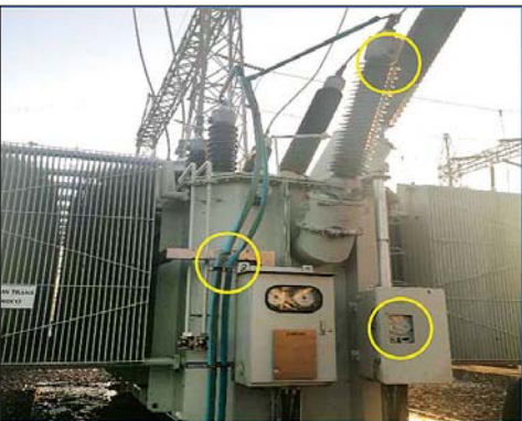
၂၃၀ ကေဗီ မြဝတီပင်မဓာတ်အားခွဲရုံ၏ 230/66/11 kV, 50 MVA Transformer Bank (2) ပျက်စီးမှု အခြေအနေ မှတ်တမ်းဓာတ်ပုံ။

လျက်ရှိသည့် လျှပ်စစ်ဓာတ်အား ကို အမြန်ဆုံးပြန်လည်ရရှိနိုင်ရေး အတွက် သက်ဆိုင်ရာ နယ်မြေ များရှိ လုံခြုံရေးတပ်ဖွဲ့ဝင်များနှင့် ပူးပေါင်းကာ ပြုပြင်ဆောင်ရွက် မှုများကို ဆောင်ရွက်လျက်ရှိ သည်။ သတင်းစဉ်