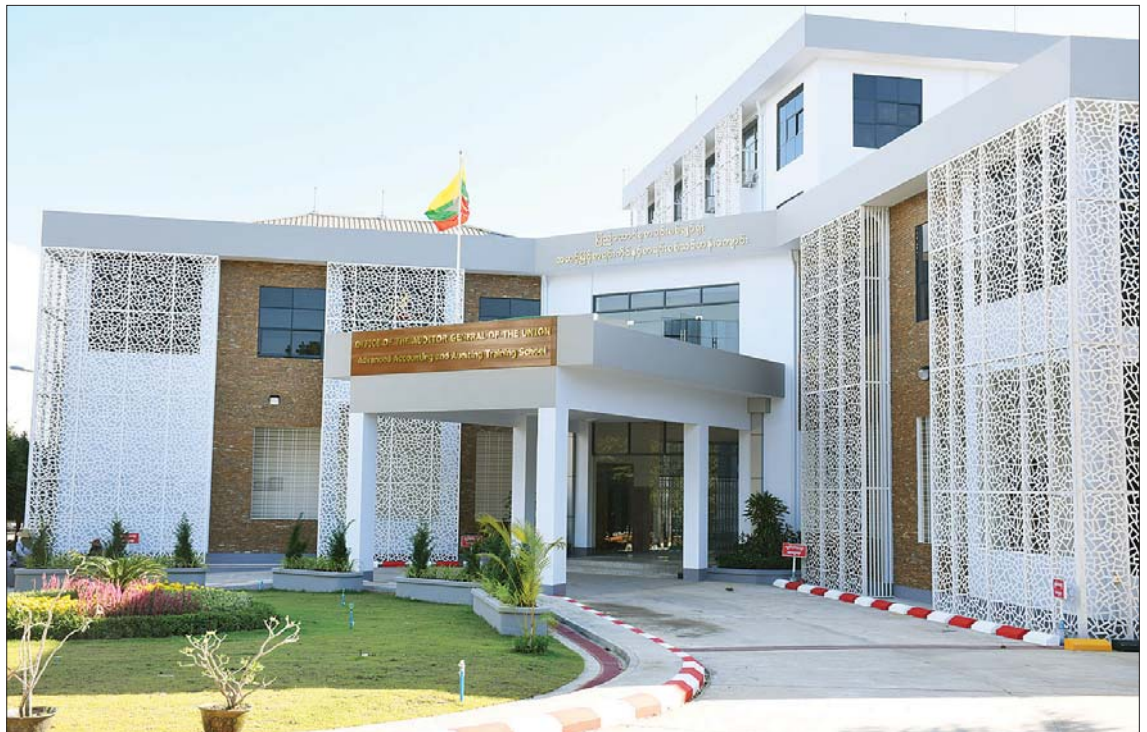
အဆင့်မြင့်စာရင်းကိုင်နှင့် စာရင်းစစ်သင်တန်းကျောင်း၊ နေပြည်တော်ကို တွေ့ရစဉ်။

ယခုအချိန်အခါတွင် နိုင်ငံတော် ဖွံ့ဖြိုးတိုးတက်ရေးအတွက် ကဏ္ဍ ပေါင်းစုံမှ ဝိုင်းဝန်းကြိုးပမ်းဆောင်ရွက် လျက်ရှိရာ နိုင်ငံတော်၏ လိုအပ်ချက် တစ်ရပ်ဖြစ်သည့် အရည်အသွေးပြည့်ဝ သော စာရင်းပညာရှင်များနှင့် စာရင်း ကျွမ်းကျင်သူများကို နှစ်စဉ်ဆက်လက် မွေးထုတ်ပေးနိုင်ရေး ကြိုးပမ်းသွားမည် ဖြစ်သည်။ ထို့ပြင် မြန်မာနိုင်ငံ စာရင်း ကောင်စီ၊ မြန်မာနိုင်ငံ လက်မှတ်ရ ပြည်သူ့စာရင်းကိုင်များ အသင်းနှင့် စာရင်းပညာရှင်များ ပူးပေါင်းကာ အာဆီယံဒေသတွင်း နိုင်ငံတကာစံများ နှင့်အညီ လိုက်နာကျင့်သုံးပြီး စာရင်း ပညာကဏ္ဍ ဖွံ့ဖြိုးတိုးတက်ရေးအတွက် “စာရင်းပညာပြည့်ဝစွာဖြင့် ပျံ့သင်း ဂုဏ်ရည်စာရင်းကောင်စီ” ဆောင်ပုဒ်နှင့် အညီ တက်ညီလက်ညီ ဝိုင်းဝန်းကြိုးပမ်း ဆောင်ရွက်သွားရန် တိုက်တွန်းရင်း မြန်မာနိုင်ငံ စာရင်းကောင်စီ၏ နှစ် ၅၀ ပြည့်ရွှေရတုကို ဂုဏ်ပြုလိုက် ပါသည်။ ။