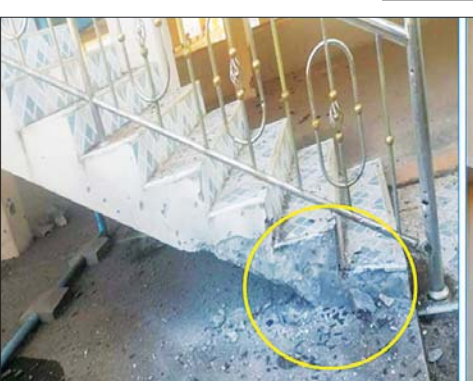
၂၃၀ ကေဗီ မြဝတီပင်မဓာတ်အားခွဲရုံ၏ Control Room ပျက်စီးမှုအခြေအနေ မှတ်တမ်းဓာတ်ပုံ။