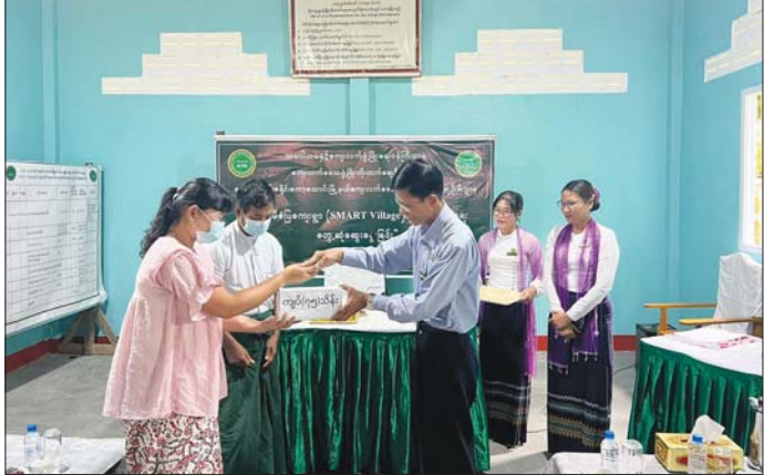
ကော့သောင်းမြို့နယ် စိုင်းဒင်းစံပြကျေးရွာ SMART Village မှ စိုက်/မွေးလုပ်ငန်း အစုအဖွဲ့များအတွက် ရန်ပုံငွေလွှဲပြောင်းပေးအပ်။

သို့သော် အကြောင်းအားလျော်စွာပင် ၂၀၀၃ ခုနှစ် ဖိတ်ကြားခေါ်ယူခဲ့သော တိုင်းရင်းသား ရိုးရာယဉ်ကျေးမှု ၁၉ ဖွဲ့ထဲ၌ ဘုတ်ပြင်းမြို့နယ်ထဲမှ ဆလုံတိုင်းရင်းသား တိုင်းရင်းသူများ ထပ်မံပါဝင် လာခဲ့သည်။ သည်တစ်ခါတော့ဖြင့် တို့ဆလုံများ မျက်နှာမငယ်ရတော့ပြီ။ ဘုတ်ပြင်း/ ကော့သောင်းမှ တာဝန်ရှိသူများ၏ စီစဉ်ပေးမှုအရ တူညီဝတ်စုံများ လည်း ချုပ်လာကြသည်။ ပြီးတော့ “ပင်လယ်ပျော် မော်ကင်းများ” ဆိုသည့် တေးသီချင်းလည်း ပါလာ ခဲ့သည်။ ထိုသီချင်းထဲတွင် ပင်လယ်အပေါ် သစ္စာရှိ သော ဆလုံလေ့များ၊ ပင်လယ်မှာ ကြုံတွေ့ရသည့် အခက်အခဲများကို အားမာန်အပြည့်ဖြင့် ကျော်လွှား ကြပုံများပါဝင်ပြီး ပြည်ထောင်စုကြီး အေးချမ်း သာယာအောင် အခြားသောတိုင်းရင်းသားညီအစ်ကို မောင်နှမများနှင့်အတူ ပိုင်းဝန်းကာကွယ် စောင့်ရှောက် ကြမည်ဟူ၍ စပ်ဆိုရေးသားထားပါသည်။ ထိုသီချင်း နှင့် MRTV၊ MWD ရုပ်သံများတွင် ရိုက်ကူးထုတ်လွှင့် ပေးသောအခါ သူတို့ အလွန်ဝမ်းသာပျော်ရွှင်ခဲ့ကြ သည်။ ဟိုးအဝေးဆီက မကြုံလက်နှင့် လန်ပိကျွန်း များကို ကျွန်တော် ငေးကြည့်နေရင်း ၂၀၀၂/ ၂၀၀၃ က ရန်ကုန်ကို ရောက်လာသော ဆလုံတိုင်းရင်းသား တိုင်းရင်းသူလေးများသည် ခုနေခါ အသက် ၄၀၊ ၄၅ နှစ်အရွယ်တွေ ရှိနေလောက်ပြီဟု တွေးလိုက်မိ သည်။