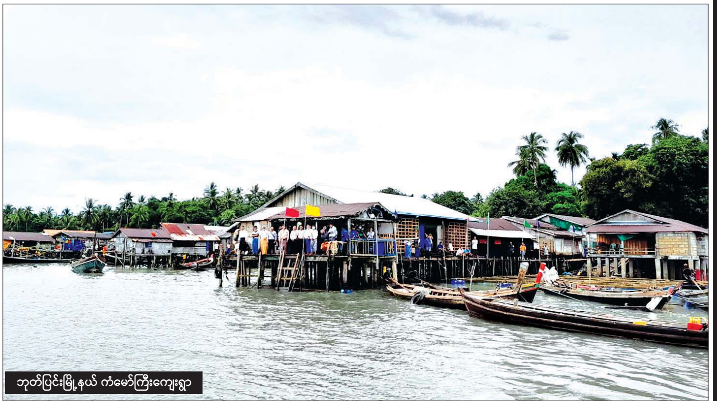
ဘုတ်ပြင်းမြို့နယ် ကံမော်ကြီးကျေးရွာ

ကော့သောင်းကို ရောက်တုန်းရောက်ခိုက် ပုလုံး တုံတုံးရွာလေးဘက်သို့ သွား၍ အနီးရည်သောက်ခွဲ သေး၏။ တံတားပေါ်မှာလည်း အမှတ်တရဓာတ်ပုံ ရိုက်ခဲ့ကြသေးသည်။ ကော့သောင်းမှ လေဆိပ်ဘက် သို့ အထွက်လမ်းဘေးတွင် တည်ရှိနေသည်။ သည်နားပတ်ဝန်းကျင်မှာ တစ်ခုထူးခြားသည်က ကော့သောင်း - ဘုတ်ပြင်း ကားလမ်းမကြီးပေါ်က ရွာတော်တော်များများသည် မူလရွာအမည်ကို မခေါ်ကြတော့ဘဲ သုံးမိုင်ရွာ၊ ခုနစ်မိုင်ရွာဟူ၍သာ တွင်နေကြခြင်းပါပေ။ လွန်ခဲ့သည့် နှစ် ၂၀ ခန့်က နတ်လမှာ ကြားခဲ့ဖူးသော ၁၀ မိုင်-ချင်ဖန်းလမ်း ဆိုတာကလည်း ထိုကဲ့သို့ပင် ကားလမ်းပေါ်က မိုင် ကို အစွဲပြုခေါ်ဝေါ်ကြခြင်းဖြစ်မည်ဟု တွေးလိုက် မိသေး၏။ ဒါက ကုန်းပေါ်မှာ သွားလာနေစဉ်အတွေး။ ယခုကဲ့သို့ Speedboat လေးစီးရင်း ကျွန်းလေးတွေ ကို ငေးမောရင်း ရေလမ်းခရီးဖြင့် သွားလာနေခိုက်မှာ တော့ ကျွန်တော့်စိတ်အလျှင်က လွန်ခဲ့သည့်ဆယ်စု