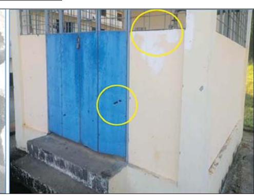
၂၃၀ ကေဗီ မြဝတီပင်မဓာတ်အားခွဲရုံ၏ Control Cable နှင့် Generator House ပျက်စီးမှုအခြေအနေ မှတ်တမ်းဓာတ်ပုံ။