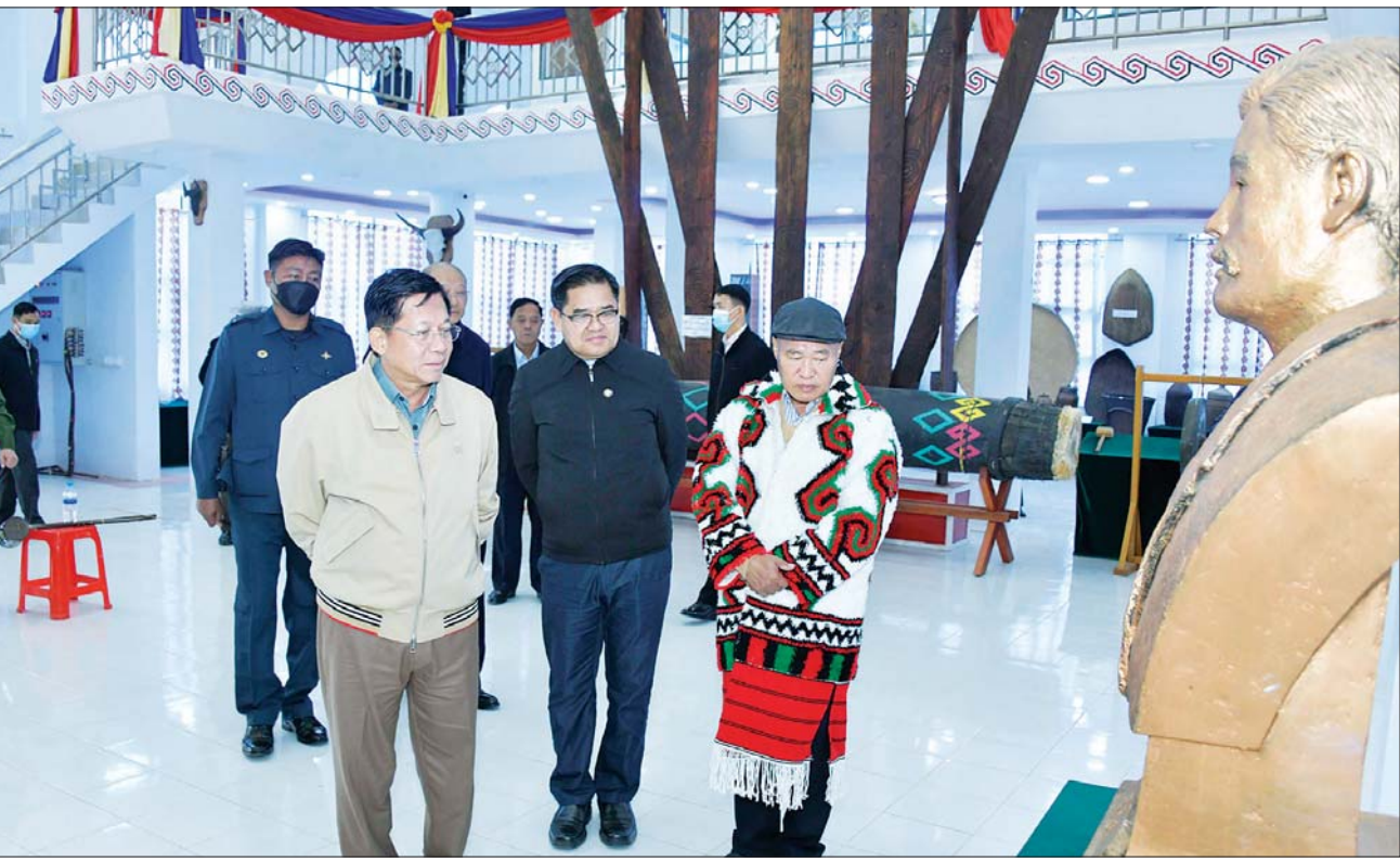
နိုင်ငံတော်စီမံအုပ်ချုပ်ရေးကောင်စီဥက္ကဋ္ဌ နိုင်ငံတော်ဝန်ကြီးချုပ် ဗိုလ်ချုပ်မှူးကြီး မင်းအောင်လှိုင် ပူတာအိုမြို့ ရဝမ်ယဉ်ကျေးမှုပြတိုက်၌ နိုင်ငံတော်ခေါင်းဆောင်များနှင့် ပြည်နယ်ယဉ်ကျေးမှု ခေါင်းဆောင်များပြကွက်ကို ကြည့်ရှုစဉ်။

စိတ်အေးချမ်းသာစွာ ဖူးမြော်နိုင်ရေး၊ သန့်ရှင်းသပ်ရပ်ပြီး ကြည်ညိုဖွယ်ဖြစ်စေရေးတို့နှင့် ပတ်သက်၍ လိုအပ်သည်များ မှာကြားသည်။ ထို့နောက် နိုင်ငံတော်စီမံအုပ်ချုပ်ရေးကောင်စီ ဥက္ကဋ္ဌ နိုင်ငံတော်ဝန်ကြီးချုပ်က စေတီတော်မြတ်ကြီး ဧည့်သည်တော်မှတ်တမ်းစာအုပ်တွင် လက်မှတ်ရေးထိုးပြီး စေတီတော်မြတ်ကြီးဘက်စုံ ပြုပြင်ထိန်းသိမ်းရန်အတွက် အလှူငွေများပေးအပ်လှူဒါန်းရာ ဂေါပကအဖွဲ့ ဥက္ကဋ္ဌနှင့် အဖွဲ့ဝင်များက လက်ခံရယူကြပြီး ဂုဏ်ပြုမှတ်တမ်းလွှာ ပြန်လည်ပေးအပ်သည်။ ပြုပြင်မွမ်းမံတည်ဆောက်အဆိုပါ ရှေးဟောင်းသမိုင်းဝင် ကောင်းမှုလုံစေတီတော်မြတ်ကြီးကို သာသနာ့သက္ကရာဇ် ၂၄၄ ခုနှစ် သီရိဓမ္မာသောကမင်းကြီးလက်ထက်တွင် မြတ်စွာဘုရား၏