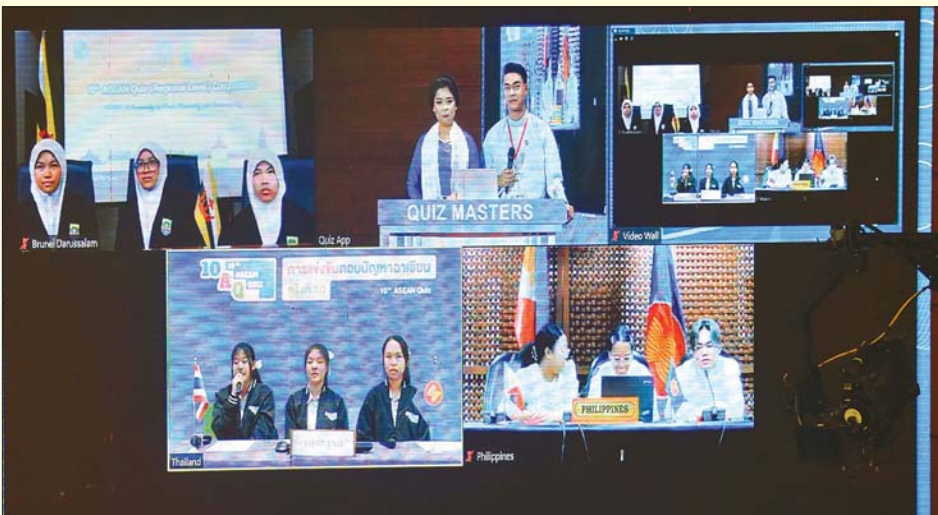
ဒသမအကြိမ်မြောက် အာဆီယံဉာဏ်စမ်းပဟေဠိပြိုင်ပွဲ (ဒေသတွင်းအဆင့်)တွင် ဘရူနိုင်း၊ ဖိလစ်ပိုင်နှင့် ထိုင်းနိုင်ငံတို့မှ ကိုယ်စားပြုယှဉ်ပြိုင်ကြသည့် ကျောင်းသား ကျောင်းသူများက online ဖြင့်ပါဝင်ယှဉ်ပြိုင်စဉ်။