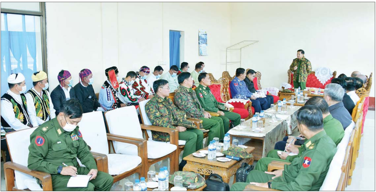
နိုင်ငံတော်စီမံအုပ်ချုပ်ရေးကောင်စီဥက္ကဋ္ဌ နိုင်ငံတော်ဝန်ကြီးချုပ် ဗိုလ်ချုပ်မှူးကြီး မင်းအောင်လှိုင် ပူတာအိုမြို့ရှိ ဌာနဆိုင်ရာတာဝန်ရှိသူများနှင့် မြို့မိမြို့ဖများအား တွေ့ဆုံအမှာစကားပြောကြားစဉ်။

နိုင်ငံတော်စီမံအုပ်ချုပ်ရေးကောင်စီဥက္ကဋ္ဌ နိုင်ငံတော်ဝန်ကြီးချုပ်က ဒေသဖွံ့ဖြိုးတိုးတက်ရေးဆိုင်ရာများနှင့်ပတ်သက်၍ ဆွေးနွေးပြောကြားရာတွင် ပူတာအိုဒေသသည် ဝေးလံခေါင်းပါးသည့် ဒေသတစ်ခုဖြစ်ကြောင်း၊ သွားလာမှုများ အဆင်ပြေချောမွေ့စေရေးအတွက် နိုင်ငံတော်မှ ဦးစားပေးဆောင်ရွက်ပေးသွားမည်ဖြစ်ပြီး ဒေသဖွံ့ဖြိုးတိုးတက်ရေးအတွက်လည်း တတ်နိုင်သမျှ ကြိုးပမ်းဆောင်ရွက်ပေးသွားမည်ဖြစ်ကြောင်း၊ ဒေသခံများအနေဖြင့်လည်း မိမိတို့ဒေသ ဖွံ့ဖြိုးတိုးတက်ရေးအတွက် တတ်နိုင်သည့်ဘက်မှ ဆောင်ရွက်ကြရန်လိုကြောင်း၊ ပူတာအိုဒေသသည် ထူးခြားသည့် ဝိသေသရှိသည့် ဒေသတစ်ခုဖြစ်ပြီး အေးမြသည့် ရာသီဥတုရှိကာ သဘာဝအလှတရားများဖြင့် ပြည့်စုံနေသည့် ဒေသတစ်ခုဖြစ်ကြောင်း၊ ထို့ကြောင့် ပူတာအိုဒေသကို ခရီးသွားဒေသအဖြစ် ဆောင်ရွက်၍ ဒေသဖွံ့ဖြိုးတိုးတက်ရေးကိုဆောင်ရွက်နိုင်ကြောင်း၊ ဒေသ၏ ထူးခြားမှုအဖြစ် ခရီးသွားများကို ဆွဲဆောင်နိုင်သည့် ကျောက်လုံးများကို စီရင်ကာရံထားသည့် ကျောက်စီခြံစည်းရိုးများလည်းရှိကြောင်း၊ အဆိုပါ ကျောက်လုံးစီခြံစည်းရိုးများကို လမ်းအလိုက်၊ ရပ်ကွက်အလိုက် စည်းကမ်းသတ်မှတ်ချက်များ ချမှတ်ကာ စနစ်တကျ လုပ်သပ်ရပ်စွာဖြင့် ထူးခြားသည့် မြင်ကွင်းတစ်ခုအဖြစ် ဆောင်ရွက်ပြီး ဒေသ၏ Land Mark တစ်ခုအဖြစ် ပြည်တွင်း၊ ပြည်ပ ခရီးသွားများကို ဆွဲဆောင်နိုင်ကြောင်း၊ အလားတူ ဒေသ၏ လူမှုပတ်ဝန်းကျင် သန့်ရှင်းသပ်ရပ်လှပစေရေး ဆောင်ရွက်ရန် လိုအပ်သကဲ့သို့ မျက်စိပသာဒဖြစ်စေရေးအတွက်လည်း ပန်းအလုပ်များကို စနစ်တကျ စိုက်ပျိုးရန်လိုကြောင်း။