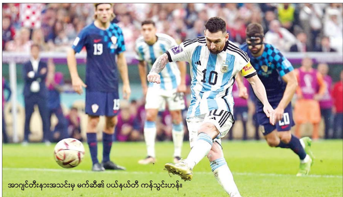
အာဂျင်တီးနားအသင်းမှ မက်ဆီ၏ ပယ်နယ်တီ ကန်သွင်းဟန်။