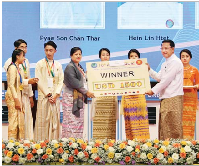
ပြည်ထောင်စုဝန်ကြီး ဦးမောင်မောင်အုန်း ပထမဆုရရှိသည့် မြန်မာနိုင်ငံမှ ကြီးကြပ်သူနှင့် ကျောင်းသား ကျောင်းသူများအား ဆုပေးအပ်ချီးမြှင့်စဉ်။