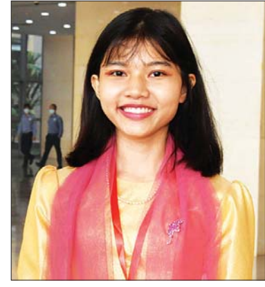
မမေသံဖြူအုန်း အောင်မြေသာဇံမြို့နယ် မန္တလေးတိုင်းဒေသကြီး

ကို ပါဝင်ယှဉ်ပြိုင်ခွင့်ရတဲ့ ကလေးတွေအတွက်ရော၊ အထက(၁) ဒဂုံကျောင်းအနေနဲ့ရော များစွာဂုဏ်ယူပါတယ်။ နောင်လာနောက်သား ကျောင်းသားလေးတွေလည်း အားကျအတူယူစိတ်ဖြစ်ပြီး နောက်နှစ်နှစ်အကြာမှာ ကျင်းပမယ့် အာဆီယံဉာဏ်စမ်းပဟေဠိပြိုင်ပွဲအတွက် ကြိုတင်