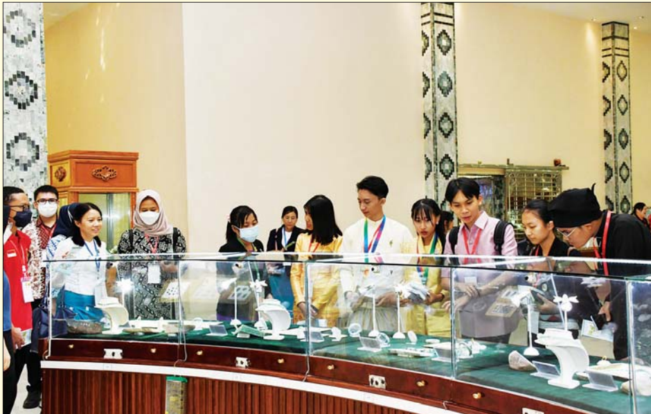
အာဆီယံနိုင်ငံများမှ ကိုယ်စားပြုတက်ရောက်လာကြသည့် ကျောင်းသား ကျောင်းသူများနှင့် ကြီးကြပ်သူများ နေပြည်တော်ရှိ ကျောက်မျက်ပြတိုက်အတွင်း လေ့လာကြည့်ရှုကြစဉ်။