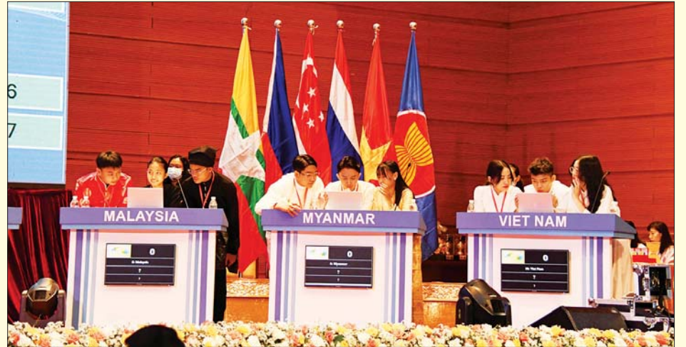
ဒသမအကြိမ်မြောက် အာဆီယံဉာဏ်စမ်းပဟေဠိပြိုင်ပွဲ (ဒေသတွင်းအဆင့်)တွင် အာဆီယံအဖွဲ့ဝင်နိုင်ငံများမှ နိုင်ငံကိုယ်စားပြု ကျောင်းသား ကျောင်းသူများ ယှဉ်ပြိုင်နေမှုကို တွေ့ရစဉ်။