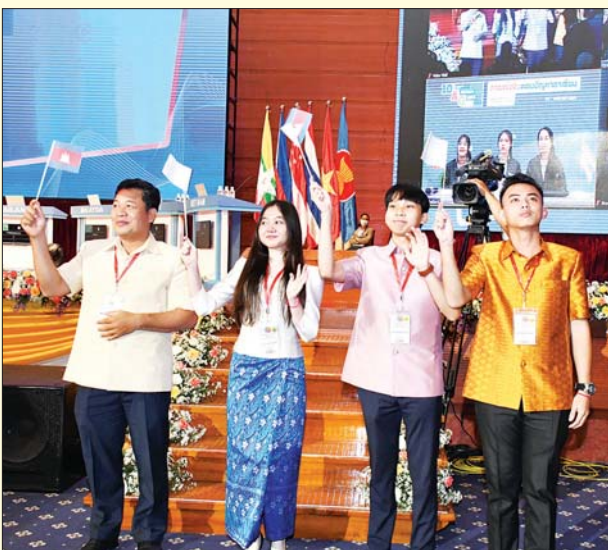
ကမ္ဘောဒီးယားနိုင်ငံကိုယ်စားပြု ပါဝင်ယှဉ်ပြိုင်မည့် ကျောင်းသား ကျောင်းသူများနှင့် ကြီးကြပ်သူတို့ နှုတ်ဆက်စဉ်။