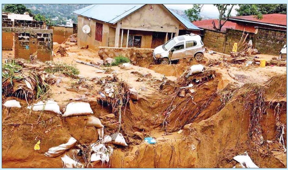
ရေကြီးမြေပြိုမှုကြောင့် နေအိမ်နှင့်လမ်းများ ပျက်စီးမှုဖြစ်ပွားစဉ်။