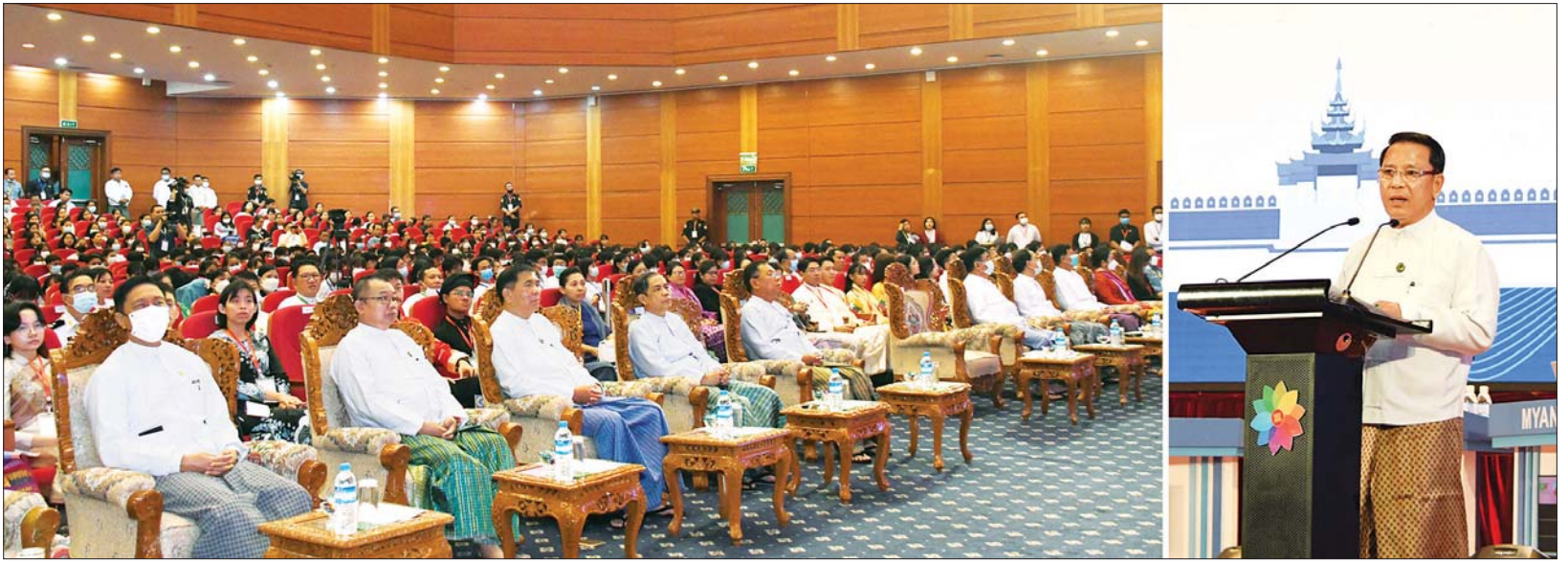
ပြည်ထောင်စုဝန်ကြီး ဦးမောင်မောင်အုန်း ဒေသအကြိမ်မြောက် အာဆီယံဥက္ကဋ္ဌပဟေဠိပြိုင်ပွဲ (ဒေသတွင်းအဆင့်) ဖွင့်ပွဲတွင် အမှာစကားပြောကြားစဉ်။