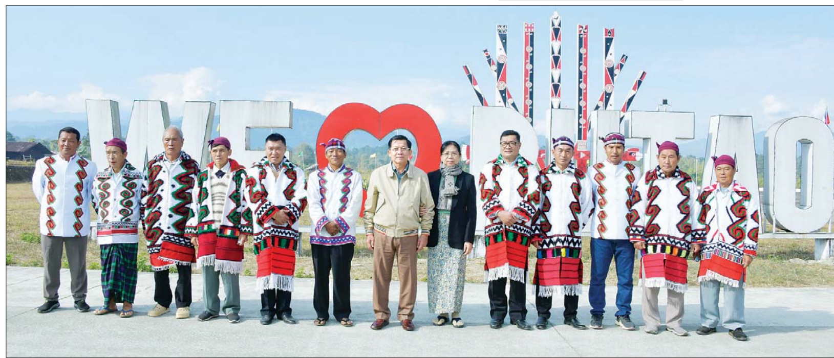
နိုင်ငံတော်စီမံအုပ်ချုပ်ရေးကောင်စီဥက္ကဋ္ဌ နိုင်ငံတော်ဝန်ကြီးချုပ် ဗိုလ်ချုပ်မှူးကြီး မင်းအောင်လှိုင်နှင့် ဇနီး ဒေါ်ကြူကြူလှ တို့ ရဝမ်ရိုးရာ ရိန်ဒန် (ခေါ်) မနောတိုင်ရှေ့တွင် ရဝမ်တိုင်းရင်းသားများနှင့်အတူ စုပေါင်းမှတ်တမ်းဓာတ်ပုံရိုက်စဉ်။

ဓာတ်တော်သုံးဆူကို ဌာပနာသွင်း၍ တည်ထားကိုးကွယ်ခဲ့ခြင်းဖြစ်ကြောင်း၊ ခေတ်အဆက်ဆက်၊ မင်းအဆက်ဆက်တို့က စေတီတော်မြတ်ကြီးကို ပြုပြင်မွမ်းမံတည်ဆောက် ထိန်းသိမ်းခဲ့ကြပြီး မြန်မာနိုင်ငံရှိ ဗုဒ္ဓဘာသာဝင်အပေါင်းတို့၏ နှုတ်ဖျားတွင်လည်း “အထက်တွင် ကောင်းမှုလုံ၊ အောက်တွင် ရွှေတိဂုံ၊ အလယ်တွင် ရွှေစည်းခုံ” ဟူ၍ ကျော်ဇောထင်ရှားသပွယ်စွာဖြင့် တည်ရှိလျက်ရှိကြောင်း၊ ကောင်းမှုလုံစေတီတော်မြတ်ကြီးသည် အလွန်ရှေးကျသော စေတီတော်ကြီးဖြစ်ပြီး တိုင်းခမ်းတီး ရှမ်းတိုင်းရင်းသားဘာသာစကားဖြင့် “ကောင်မူးစပ်ကန်ခမ်း” ရွှေဆတ်မင်းစေတီတော်ဟူ၍လည်းကောင်း၊ ခမ်းတီးလုံဒေသရှိ စာမျက်နှာ ၇ သို့