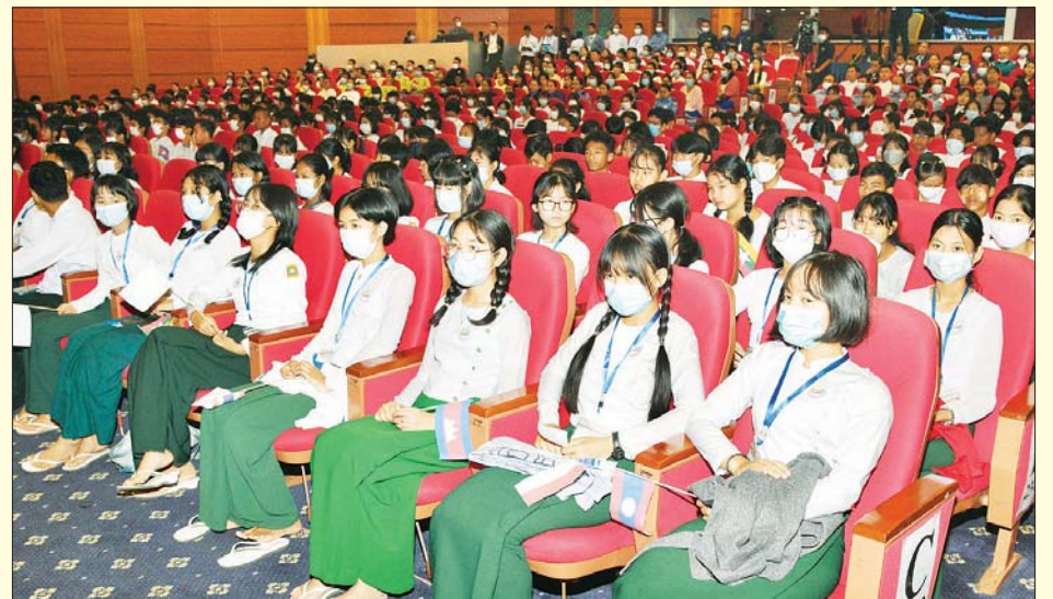
ဒသမအကြိမ်မြောက် အာဆီယံဉာဏ်စမ်းပဟေဠိပြိုင်ပွဲ (ဒေသတွင်းအဆင့်)ကို တက်ရောက်ကြည့်ရှုကြသည့် ကျောင်းသား ကျောင်းသူများကို တွေ့ရစဉ်။