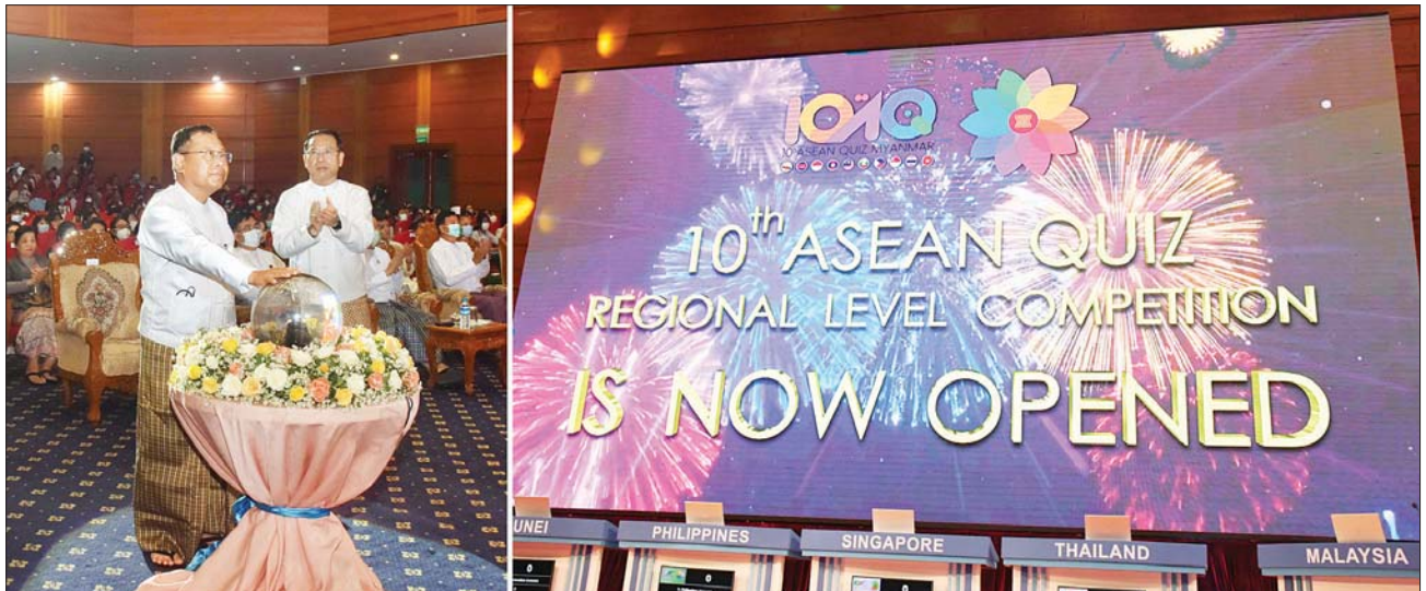
နိုင်ငံတော်စီမံအုပ်ချုပ်ရေးကောင်စီဝင် ပြည်ထောင်စုဝန်ကြီး ဒုတိယဗိုလ်ချုပ်ကြီး စိုးထွဋ် ဒသမအကြိမ်မြောက် အာဆီယံဥက္ကဋ္ဌအဖွဲ့ ပြိုင်ပွဲ (ဒေသတွင်းအဆင့်)ကို စက်ခလုတ်နှိပ်၍ ဖွင့်လှစ်ပေးစဉ်။

နေပြည်တော် ဒီဇင်ဘာ ၁၄ မြန်မာနိုင်ငံက အိမ်ရှင်အဖြစ် ကျင်းပသည့် ဒသမအကြိမ်မြောက် အာဆီယံ ဥက္ကဋ္ဌအဖွဲ့ ပြိုင်ပွဲ- ဒေသတွင်းအဆင့် (10 th ASEAN Quiz - Regional Level) ကို ယနေ့တွင် နေပြည်တော်ရှိ မြန်မာ အပြည်ပြည်ဆိုင်ရာ ကွန်ဗင်းရှင်းဗဟိုဌာန-၂၅ ကျင်းပရာ ပထမဆုံးကို မြန်မာနိုင်ငံ၊ ဒုတိယဆုကို မလေးရှားနိုင်ငံ၊ တတိယဆုကို လာအိုနိုင်ငံတို့က ရရှိကြသည်။