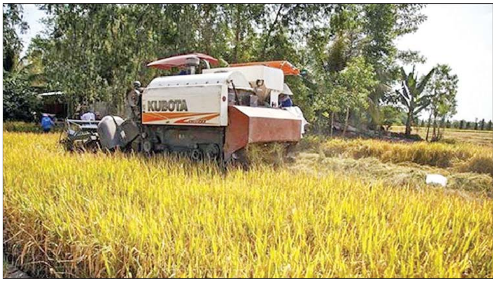
ဗီယက်နမ်နိုင်ငံ လောင်အန်းပြည်နယ် မဲခေါင်မြစ်ဝကျွန်းပေါ်ဒေသတွင် စပါးရိတ်သိမ်းနေစဉ်။

ဟနွိုင်း ဒီဇင်ဘာ ၁၄ ဗီယက်နမ်နိုင်ငံသည် ၂၀၃၀ ပြည့်နှစ်တွင် စိုက်ပျိုးရေးကဏ္ဍ၌ နိုင်ငံခြားရင်းနှီးမြှုပ်နှံမှု အမေရိကန်ဒေါ်လာ ၃၄ ဘီလီယံအထိ ရှိလာရန် ရည်မှန်းထားကြောင်း ဒီဇင်ဘာ ၁၄ ရက်တွင် ဗီယက်နမ် နယူးစ်သတင်းစာ၏ ဖော်ပြချက်အရ သိရသည်။ ဗီယက်နမ်နိုင်ငံသည် ကော်ပိုရေးရှင်းအဖွဲ့ကြီးများနှင့် ပူးပေါင်းဆောင်ရွက်ရေး အားကောင်းအောင် လုပ်ဆောင်ခြင်းအပါအဝင် ၂၀၃၀ ပြည့်နှစ် ရည်မှန်းချက်ပြည့်မီရေး အစီအမံများကို မိတ်ဆက် ရှင်းလင်းခဲ့ကြောင်း သိရသည်။ ဗီယက်နမ်နိုင်ငံကဲ့သို့ စိုက်ပျိုးရေးအခြေခံသော နိုင်ငံအတွက် စိုက်ပျိုးရေးကဏ္ဍ၌ နိုင်ငံခြားရင်းနှီးမြှုပ်နှံမှု ပမာဏသည် လွန်စွာ နည်းပါးနေသေးသည်ဟု စိုက်ပျိုးရေးနှင့် ကျေးလက် ဖွံ့ဖြိုးတိုးတက်ရေး