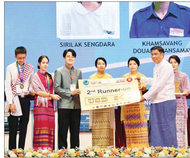
ပြည်ထောင်စုဝန်ကြီး ဒေါက်တာမျိုးသိန်းကျော် တတိယဆုရရှိသည့် လာအိုနိုင်ငံမှ ကြီးကြပ်သူနှင့် ကျောင်းသား ကျောင်းသူများအား ဆုပေးအပ်ချီးမြှင့်စဉ်။

ယဉ်ကျေးမှုဝန်ကြီးဌာနမှ အနုပညာရှင်များက “ပြည်ထောင်စု၏ ထာဝရအလှများ” တေးသီချင်းဖြင့် ကပြဖျော်ဖြေတင်ဆက်ကြသည်။ အမှတ်တရလက်ဆောင်ပေး ထို့နောက် နိုင်ငံတော်စီမံအုပ်ချုပ်ရေးကောင်စီဝင် ပြည်ထောင်စုဝန်ကြီး ဒုတိယဗိုလ်ချုပ်ကြီး စိုးထွဋ်က အကဲဖြတ်ခွင့်များ၊ ကမ္ဘောဒီးယား၊ အင်ဒိုနီးရှားနှင့် လာအိုနိုင်ငံတို့မှ ကြီးကြပ်သူနှင့် ပြိုင်ပွဲဝင်များအား လည်းကောင်း၊ ပြည်ထောင်စုဝန်ကြီး ဦးမောင်မောင်အုန်းက မလေးရှား၊ မြန်မာနှင့် ဗီယက်နမ်နိုင်ငံတို့မှ ကြီးကြပ်သူနှင့် ပြိုင်ပွဲဝင်များ၊ အာဆီယံ