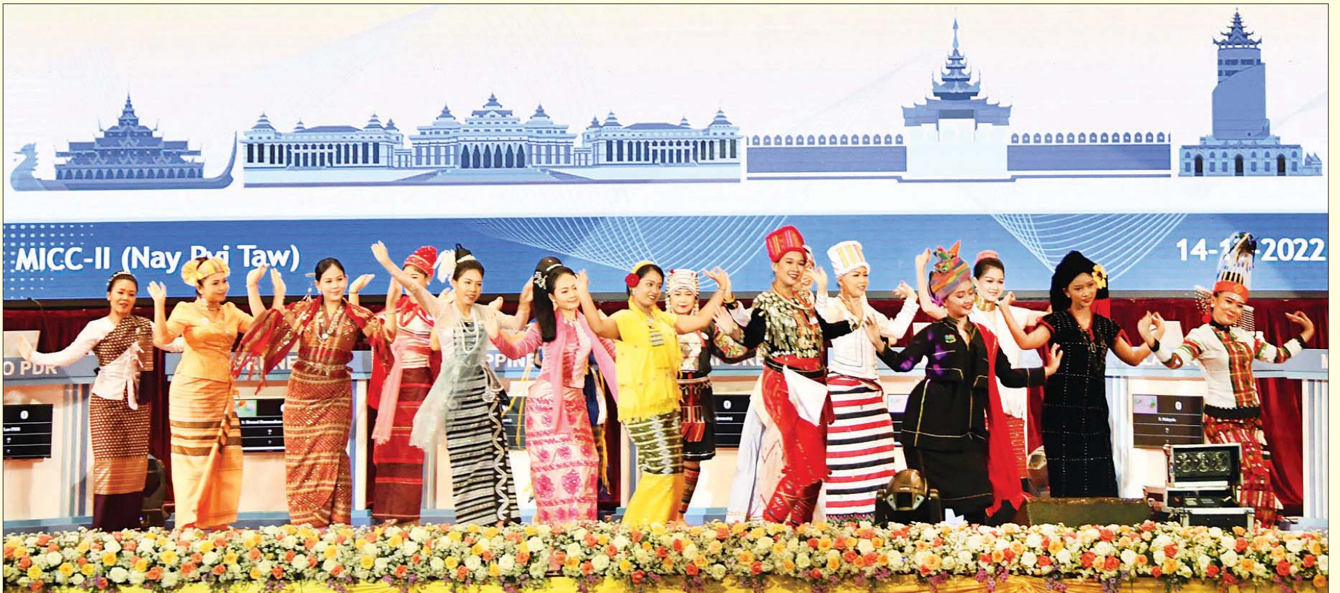
သာသနာရေးနှင့် ယဉ်ကျေးမှုဝန်ကြီးဌာနမှ အနုပညာရှင်များက “ပြည်ထောင်စု၏ ထာဝရအလှများ” တေးသီချင်းဖြင့် ကပြဖျော်ဖြေတင်ဆက်ကြစဉ်။