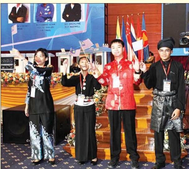
မလေးရှားနိုင်ငံကိုယ်စားပြု ပါဝင်ယှဉ်ပြိုင်မည့် ကျောင်းသား ကျောင်းသူများနှင့် ကြီးကြပ်သူတို့ နှုတ်ဆက်စဉ်။