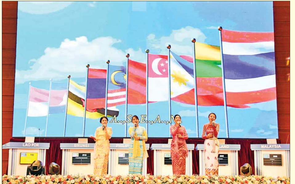
မြန်မာ့အသံနှင့် ရုပ်မြင်သံကြားမှ ဝန်ထမ်းများက “မင်္ဂလာပါ အာဆီယံ” တေးသီချင်းဖြင့် ဖျော်ဖြေ တင်ဆက်ကြစဉ်။