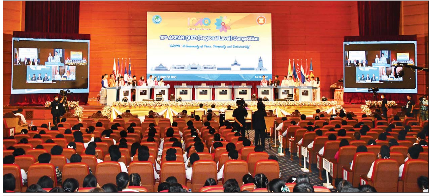
ဒသမအကြိမ်မြောက် အာဆီယံဥက္ကဋ္ဌအဖွဲ့ ပြိုင်ပွဲ (ဒေသတွင်းအဆင့်)တွင် အာဆီယံနိုင်ငံများမှ ကိုယ်စားပြုကျောင်းသား ကျောင်းသူများ ယှဉ်ပြိုင်နေမှုကို တွေ့ရစဉ်။

အာဆီယံနိုင်ငံများမှ ခေါင်းဆောင်များ လက်မှတ်ရေးထိုးထားပြီး အာဆီယံပဋိညာဉ်စာတမ်း