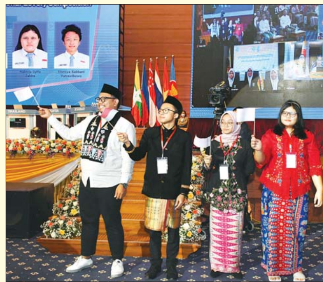
အင်ဒိုနီးရှားနိုင်ငံကိုယ်စားပြု ပါဝင်ယှဉ်ပြိုင်မည့် ကျောင်းသား ကျောင်းသူများနှင့် ကြီးကြပ်သူတို့ နှုတ်ဆက်စဉ်။