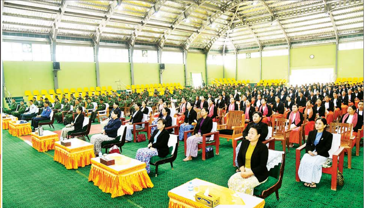
နိုင်ငံတော်စီမံအုပ်ချုပ်ရေးကောင်စီဥက္ကဋ္ဌ တပ်မတော်ကာကွယ်ရေးဦးစီးချုပ် ဗိုလ်ချုပ်မှူးကြီး မင်းအောင်လှိုင် မြောက်ပိုင်းတိုင်းစစ်ဌာနချုပ် ပူတာအိုတပ်နယ်မှ အရာရှိ၊ စစ်သည်၊ မိသားစုများအား တွေ့ဆုံအမှာစကား ပြောကြားစဉ်။