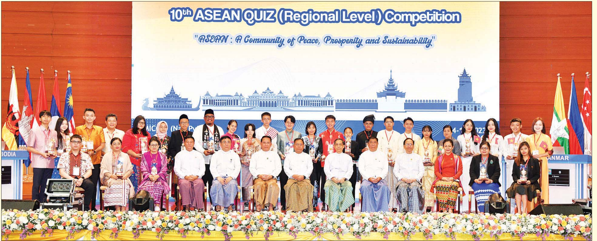
နိုင်ငံတော်စီမံအုပ်ချုပ်ရေးကောင်စီဝင် ပြည်ထောင်စုဝန်ကြီး ဒုတိယဗိုလ်ချုပ်ကြီး စိုးထွဋ်နှင့် ပြည်ထောင်စုဝန်ကြီးများ ဒသမအကြိမ်မြောက် အာဆီယံဥက္ကဏ်စမ်းပဟေဠိပြိုင်ပွဲ (ဒေသတွင်းအဆင့်) ပြိုင်ပွဲဝင်နိုင်ငံများမှ ကြီးကြပ်သူနှင့် ပြိုင်ပွဲဝင်များ၊ အာဆီယံအထွေထွေအတွင်းရေးမှူးချုပ်ရုံးမှ အကြီးတန်းအရာရှိတို့နှင့်အတူ စုပေါင်းမှတ်တမ်းတင်ဓာတ်ပုံရိုက်စဉ်။