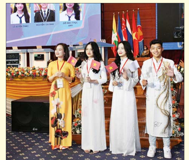
ဗီယက်နမ်နိုင်ငံကိုယ်စားပြု ပါဝင်ယှဉ်ပြိုင်မည့် ကျောင်းသား ကျောင်းသူများနှင့် ကြီးကြပ်သူတို့ နှုတ်ဆက်စဉ်။