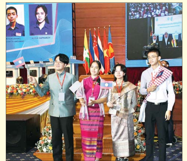
လာအိုနိုင်ငံကိုယ်စားပြု ပါဝင်ယှဉ်ပြိုင်မည့် ကျောင်းသား ကျောင်းသူများနှင့် ကြီးကြပ်သူတို့ နှုတ်ဆက်စဉ်။