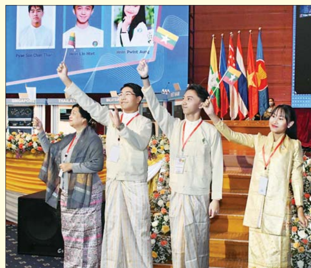
မြန်မာနိုင်ငံကိုယ်စားပြု ပါဝင်ယှဉ်ပြိုင်မည့် ကျောင်းသား ကျောင်းသူများနှင့် ကြီးကြပ်သူတို့ နှုတ်ဆက်စဉ်။