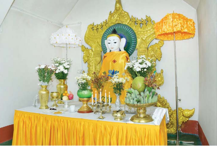
နိုင်ငံတော်စီမံအုပ်ချုပ်ရေးကောင်စီဥက္ကဋ္ဌ နိုင်ငံတော်ဝန်ကြီးချုပ် ဗိုလ်ချုပ်မှူးကြီး မင်းအောင်လှိုင်နှင့် ဇနီး ဒေါ်ကြူကြူလှ ကောင်းမှုလုံစေတီတော်မြတ်ကြီးအတွင်းရှိ ဗုဒ္ဓရုပ်ပွားတော်မြတ်အား ဖူးမြော်ကြည်ညိုစဉ်။

လိုအပ်သည်များ မှာကြား ဦးစွာ နိုင်ငံတော်စီမံအုပ်ချုပ်ရေးကောင်စီဥက္ကဋ္ဌ နိုင်ငံတော်ဝန်ကြီးချုပ်နှင့် အဖွဲ့ဝင်များအား ပူတာအိုခရိုင်အထွေထွေအုပ်ချုပ်ရေးမှူး ဦးခေါင်လန်တီး၊ စေတီတော်မြတ်ကြီးဂေါပကအဖွဲ့ ဥက္ကဋ္ဌ ဦးသန့်ဆိုင်နှင့် အဖွဲ့ဝင်များ၊ ဒေသခံတိုင်းရင်းသားပြည်သူများ က လိုက်လံနွေးထွေးစွာ ကြိုဆိုနှုတ်ဆက်ကြသည်။ ထို့နောက် ကောင်းမှုလုံစေတီတော်မြတ်ကြီးအတွင်းရှိ ဗုဒ္ဓရုပ်ပွားတော်မြတ်အား ပန်း၊ ရေချမ်း ကပ်လှူပူဇော်၍ ဖူးမြော်ကြည်ညိုကြသည်။ ယင်းနောက် စေတီတော်မြတ်ကြီးအား လက်ယာရစ်လှည့်လည် ဖူးမြော်ကြည်ညိုပြီး စေတီတော်မြတ်ကြီး ရေရှည်တည်တံ့ခိုင်မြဲရေး၊ ဘုရားဖူးလာမိတည်သူများ