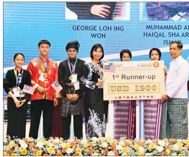
ပြည်ထောင်စုဝန်ကြီး ဦးကိုကိုလှိုင် ဒုတိယဆုရရှိသည့် မလေးရှားနိုင်ငံမှ ကြီးကြပ်သူနှင့် ကျောင်းသား ကျောင်းသူများအား ဆုပေးအပ်ချီးမြှင့်စဉ်။