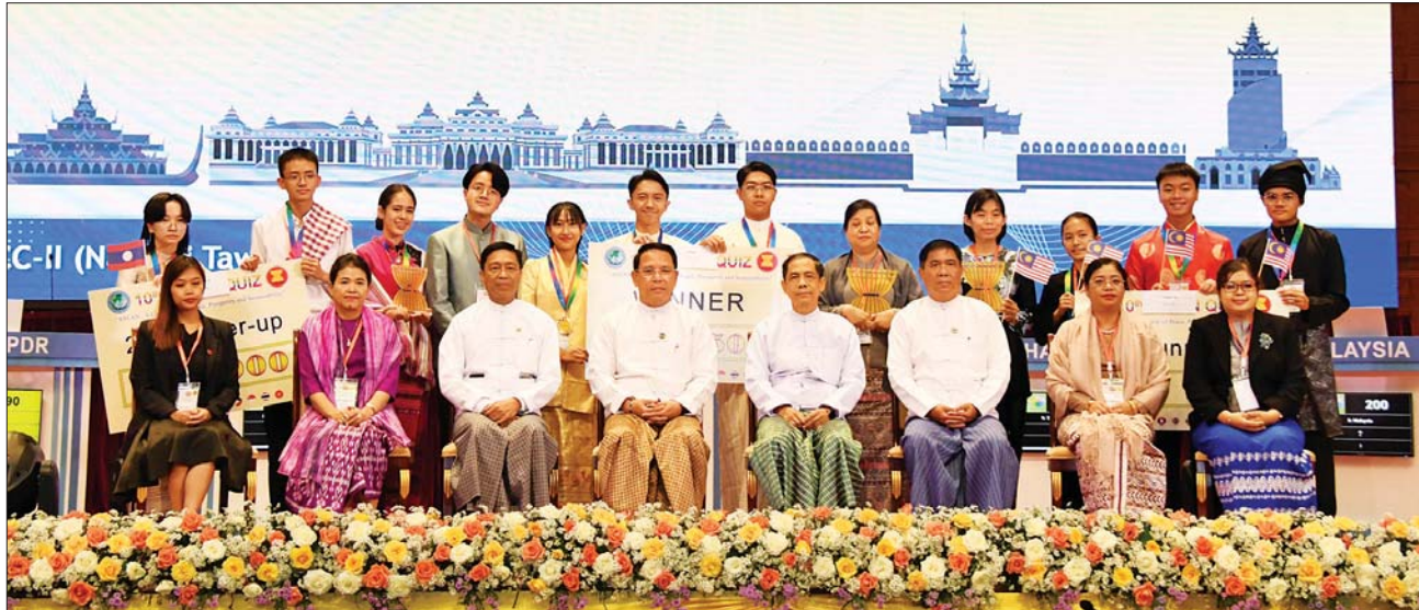
ပြည်ထောင်စုဝန်ကြီးများ ဆုရရှိသည့်နိုင်ငံများမှကြီးကြပ်သူနှင့် ကျောင်းသား ကျောင်းသူများနှင့်အတူ မှတ်တမ်းတင်ဓာတ်ပုံရိုက်စဉ်။

သီချင်းများ ပျော်ရွှင်စွာသီဆိုကြသည်။ ထို့ပြင် လာအို၊ ကမ္ဘောဒီးယား၊ ဗီယက်နမ်၊ မလေးရှား၊ အင်ဒိုနီးရှားနိုင်ငံတို့မှ ကျောင်းသား ကျောင်းသူများက သက်ဆိုင်ရာနိုင်ငံအလိုက် ရိုးရာအက၊ တေးသီချင်းများဖြင့် ပျော်ရွှင်စွာ စုဖွဲ့သီဆိုကြသည်။ အသိအမှတ်ပြုလက်မှတ်ပေး ထို့နောက် ပြည်ထောင်စုဝန်ကြီး ဦးမောင်မောင်အုန်းက ပါဝင်ယှဉ်ပြိုင်ခဲ့ကြသည့် အာဆီယံနိုင်ငံများမှ ပြိုင်ပွဲဝင်များနှင့် ကြီးကြပ်သူများအား ကျေးဇူးတင်စကားပြောကြားပြီး ပြိုင်ပွဲဝင် ၁၈ ဦးအား ပြိုင်ပွဲသို့ ဝင်ရောက်ယှဉ်ပြိုင်ခြင်းအတွက် အသိအမှတ်ပြု လက်မှတ်များ တစ်ဦးချင်းစီ ပေးအပ်သည်။