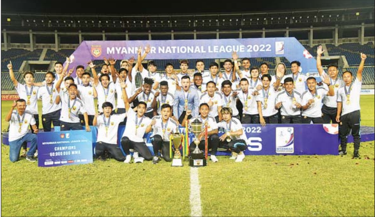
၂၀၂၂ ရာသီ MNL အမှတ်ပေးချန်ပီယံ ရှမ်းယူနိုက်တက်အသင်း။

ရန်ကုန် ဒီဇင်ဘာ ၁၄ မြန်မာနေရှင်နယ်လိဂ်သည် ၂၀၂၃ ရာသီ MNL အမှတ်ပေးပြိုင်ပွဲကို အသင်းအရေအတွက် ၁၂ သင်း ပြန်လည်တိုးမြှင့်ကျင်းပရန် စီစဉ်ထားကြောင်း တရားဝင် သတင်းထုတ်ပြန်ခဲ့သည်။ ၂၀၂၃ ရာသီ MNL ပြိုင်ပွဲကို ၂၀၂၃ ခုနှစ် ဖေဖော်ဝါရီ ၃၀ တွင် စတင်ကာလ အထိ ကျင်းပမည်ဖြစ်ပြီး မြန်မာနေရှင်နယ်လိဂ်၏ သတင်းထုတ်ပြန်မှုအရ လိဂ်ကော်မတီအစည်းအဝေး (၃/၂၀၂၂) ဆုံးဖြတ်ချက်အရ MNL အမှတ်ပေးပြိုင်ပွဲကို အသင်းအရေအတွက် ၁၂ သင်း ပြန်လည်တိုးမြှင့်ကျင်းပသွားမည်ဖြစ်သည်။ ထို့ကြောင့် ၂၀၂၂ ရာသီ MNL ပြိုင်ပွဲတွင် စာမျက်နှာ ၂၀ ကော်လံ ၁ ❖