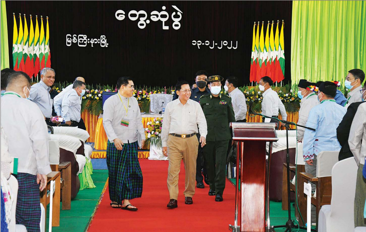
နိုင်ငံတော်စီမံအုပ်ချုပ်ရေးကောင်စီဥက္ကဋ္ဌ နိုင်ငံတော်ဝန်ကြီးချုပ် ဗိုလ်ချုပ်မှူးကြီး မင်းအောင်လှိုင် တက်ရောက်လာကြသည့် အသေးစား၊ အငယ်စားနှင့် အလတ်စား စီးပွားရေး (MSME) လုပ်ငန်းရှင်များအား ရင်းရင်းနှီးနှီး နှုတ်ဆက်စဉ်။

အလားတူ မိမိတို့အနေဖြင့် စက်သုံးဆီများ ကို ပြည်ပမှ နှစ်စဉ်တင်သွင်းနေရမှုကြောင့် နိုင်ငံခြား ငွေ သုံးစွဲမှုများ များစွာကုန်ကျလျက်ရှိကြောင်း၊ ထို့ကြောင့် စက်သုံးဆီများကို တတ်နိုင်သမျှ ချွေတာ သုံးစွဲရန်လိုကြောင်း၊ စက်သုံးဆီသုံးစွဲရန် မလိုအပ် သည့် စက်ဘီးကဲ့သို့သောယာဉ်များကို တိုင်းချစ်