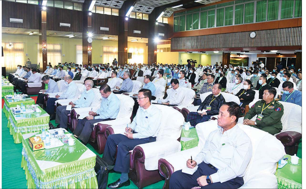
နိုင်ငံတော်စီမံအုပ်ချုပ်ရေးကောင်စီဥက္ကဋ္ဌ နိုင်ငံတော်ဝန်ကြီးချုပ် ဗိုလ်ချုပ်မှူးကြီး မင်းအောင်လှိုင် ကချင်ပြည်နယ်အတွင်းရှိ အသေးစား၊ အငယ်စားနှင့် အလတ်စား စီးပွားရေး (MSME) လုပ်ငန်းရှင်များနှင့် တွေ့ဆုံ ဆွေးနွေးစဉ်။