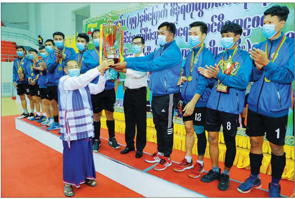
နိုင်ငံတော်စီမံအုပ်ချုပ်ရေးကောင်စီအဖွဲ့ဝင် မန်းငြိမ်းမောင် ပထမဆုရ ရန်ကုန်တိုင်းဒေသကြီး ဘော်လီဘော(အမျိုးသား) အသင်းအား တံခွန်စိုက်ခိုင်းဆု ပေးအပ်ချီးမြှင့်စဉ်။

နေပြည်တော် ဒီဇင်ဘာ ၁၃ အားကစားနှင့် လူငယ်ရေးရာ ဝန်ကြီးဌာန အားကစားနှင့် ကာယပညာဦးစီးဌာနနှင့် မြန်မာ နိုင်ငံ ဘော်လီဘောအဖွဲ့ချုပ်တို့ ပူးပေါင်း၍ (၇၅) နှစ်မြောက် စိန်ရတုလွတ်လပ်ရေးနေ့ အထိမ်း အမှတ် နိုင်ငံတော်စီမံအုပ်ချုပ်ရေး ကောင်စီဥက္ကဋ္ဌဖလား ပြည်နယ် နှင့်တိုင်းဒေသကြီး (အလွတ်တန်း ဖိတ်ခေါ်) ဘော်လီဘော (အမျိုး သား/အမျိုးသမီး)ပြိုင်ပွဲ ဗိုလ်လုပွဲ ပွဲစဉ်များကို ယနေ့နံနက် ၁၁ နာရီ က နေပြည်တော် ဝဏ္ဏသိဒ္ဓိ အားကစားရုံ(B)၌ ဆက်လက် ကျင်းပရာ နိုင်ငံတော်စီမံ အုပ်ချုပ်ရေးကောင်စီအဖွဲ့ဝင်များ ဖြစ်ကြသော မန်းငြိမ်းမောင်၊ ဒေါ်အေးနုစိန်၊ ဦးစိုင်းလုံးဆိုင်၊ ဒေါက်တာ ဗညားအောင်မိုး၊ ဦးရွှေကြိမ်း၊ ပြည်ထောင်စု ဝန်ကြီး များ၊ဒုတိယဝန်ကြီးများအားကစား နှင့် လူငယ်ရေးရာဝန်ကြီးဌာနမှ တာဝန်ရှိပုဂ္ဂိုလ်များ၊ မြန်မာနိုင်ငံ ဘော်လီဘောအဖွဲ့ချုပ်မှ တာဝန်ရှိ သူများ၊ ဌာနခွဲများမှ အရာထမ်း/ အမှုထမ်းများနှင့် အားကစား ဝါသနာရှင်များ တက်ရောက် ကြည့်ရှုအားပေးကြသည်။(ယာပုံ) အနိုင်ရရှိ ဝဏ္ဏသိဒ္ဓိ အားကစားရုံ(B)၌ ဘော်လီဘောပြိုင်ပွဲ ဗိုလ်လုပွဲ ပွဲစဉ်များအဖြစ် (အမျိုးသမီး) ပြိုင်ပွဲတွင် ရန်ကုန်တိုင်းဒေသကြီး အသင်းက စစ်ကိုင်းတိုင်းဒေသကြီး အသင်းကို သုံးပွဲပြတ်ဖြင့်လည်း ကောင်း၊ (အမျိုးသား) ပြိုင်ပွဲတွင် ရန်ကုန်တိုင်းဒေသကြီးအသင်းက မန္တလေးတိုင်းဒေသကြီးအသင်းကို သုံးပွဲ တစ်ပွဲဖြင့်လည်းကောင်း ယှဉ်ပြိုင်အနိုင်ရရှိသည်။