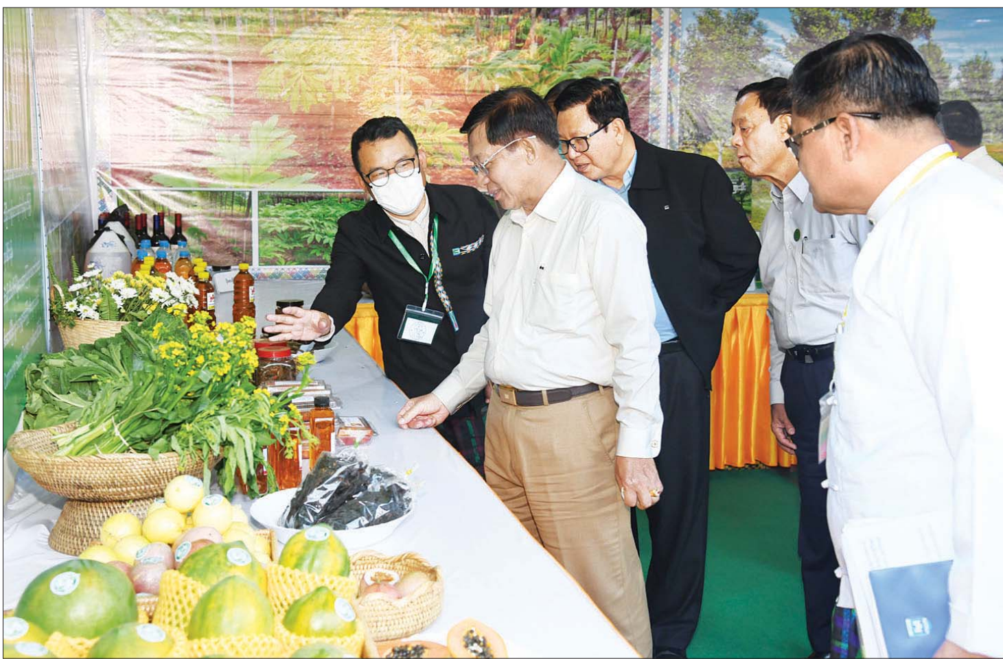
နိုင်ငံတော်စီမံအုပ်ချုပ်ရေးကောင်စီဥက္ကဋ္ဌ နိုင်ငံတော်ဝန်ကြီးချုပ် ဗိုလ်ချုပ်မှူးကြီး မင်းအောင်လှိုင်နှင့် အဖွဲ့ဝင်များ ခင်းကျင်းပြသထားရှိသည့် ပြကွက်များကို စိတ်ဝင်တစား ကြည့်ရှုလေ့လာစဉ်။

နေပြည်တော် ဒီဇင်ဘာ ၁၃ နိုင်ငံတော်စီမံအုပ်ချုပ်ရေးကောင်စီဥက္ကဋ္ဌ နိုင်ငံတော်ဝန်ကြီးချုပ် ဗိုလ်ချုပ်မှူးကြီး မင်းအောင်လှိုင်သည် ယနေ့မုန့်လွှဲပိုင်းတွင် ကချင်ပြည်နယ်အတွင်းရှိ အသေးစား၊ အငယ်စားနှင့် အလတ်စား စီးပွားရေး (MSME) လုပ်ငန်းရှင်များအား မြစ်ကြီးနားမြို့ မြို့တော်ခန်းမ၌ တွေ့ဆုံ၍ စီးပွားရေးလုပ်ငန်းများ ဖွံ့ဖြိုးတိုးတက်ရေးအတွက် ဆွေးနွေးပြောကြားသည်။ အဆိုပါ တွေ့ဆုံပွဲသို့ နိုင်ငံတော်စီမံအုပ်ချုပ်ရေးကောင်စီဥက္ကဋ္ဌ နိုင်ငံတော်ဝန်ကြီးချုပ်နှင့်အတူ ကောင်စီတွဲဖက်အတွင်းရေးမှူး ဒုတိယဗိုလ်ချုပ်ကြီး ရဲဝင်းဦး၊ ကောင်စီဝင် Jeng Phang နော်တောင်၊ စောဒန်နီယယ်၊ ပြည်ထောင်စုဝန်ကြီးများ ဖြစ်ကြသည့် ဒုတိယဗိုလ်ချုပ်ကြီး ထွန်းထွန်းနောင်၊ ဦးဝင်းရှိန်၊ ဦးလှမိုး၊ ဒေါက်တာ ချာလီသန်းနှင့် ဦးအောင်နိုင်ဦး၊ ကချင်ပြည်နယ်ဝန်ကြီးချုပ် ဦးခက်ထိန်နန်၊ ကာကွယ်ရေးဦးစီးချုပ်ရုံးမှ တပ်မတော်အရာရှိကြီးများ၊ မြောက်ပိုင်းတိုင်းစစ်ဌာနချုပ်တိုင်းမှူး၊ ဒုတိယဝန်ကြီးများ၊ ပြည်နယ်အစိုးရအဖွဲ့ဝင်များ၊ ကချင်ပြည်နယ်အတွင်းရှိ အသေးစား၊ အငယ်စားနှင့် အလတ်စား စီးပွားရေး (MSME) လုပ်ငန်းရှင်များနှင့် တာဝန်ရှိသူများ တက်ရောက်ကြသည်။ စာမျက်နှာ ၃ ကော်လံ ၁ □