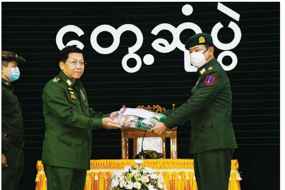
နိုင်ငံတော်စီမံအုပ်ချုပ်ရေးကောင်စီဥက္ကဋ္ဌ တပ်မတော်ကာကွယ်ရေးဦးစီးချုပ် ဗိုလ်ချုပ်မှူးကြီး မင်းအောင်လှိုင် အရာရှိ၊ စစ်သည်၊ မိသားစုများအတွက် စားသောက်ဖွယ်ရာပစ္စည်းများကို ပေးအပ်ရာ တိုင်းမှူးက လက်ခံရယူစဉ်။

မိသားစု တစ်စု၊ တပ်ရင်း၊ တပ်ဖွဲ့များအလိုက် စသည်ဖြင့် အခြေခံမှစ၍ စည်းလုံးညီညွတ်ပြီး တပ်မတော်တစ်ရပ်လုံး စည်းလုံးညီညွတ်မည်ဆိုပါက မည်သူမျှ တပ်မတော်ကို ထိပါး၍ရမည်မဟုတ် ကြောင်း၊ တပ်မတော်အင်အားရှိမှ တိုင်းပြည် အင်အားရှိမည်ဖြစ်ပြီး တပ်တွင်းစည်းလုံးညီညွတ်မှုကို ခိုင်ခိုင်မာမာဖြင့်တည်ဆောက်နိုင်မှသာလျှင် နိုင်ငံ တည်တံ့ခိုင်မြဲရေးအတွက်လည်း စိတ်ချနိုင်မည်ဖြစ် ကြောင်း၊ တပ်မတော်အနေဖြင့် ပြည်သူများနှင့် လက်တွဲပြီး ဒို့တာဝန်အရေးသုံးပါးကို ခေတ်အဆက် ဆက် ကာကွယ်စောင့်ရှောက်လျက် ရှိကြောင်း၊ မည်သည့်အစိုးရ၊ မည်သည့်ခေတ်ပင် ဖြစ်စေ တပ်မတော်အနေဖြင့် နိုင်ငံတော်ကို ကာကွယ် စောင့်ရှောက်သူ Guardian အနေဖြင့် တည်ရှိနေမည် ဖြစ်ကြောင်း၊ တပ်မတော်အနေဖြင့် စွမ်းရည်၊