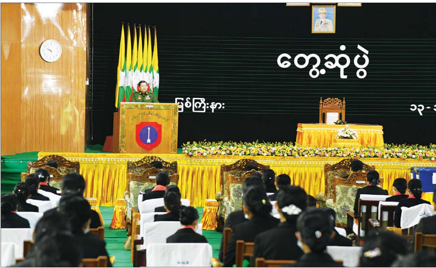
နိုင်ငံတော်စီမံအုပ်ချုပ်ရေးကောင်စီဥက္ကဋ္ဌ တပ်မတော်ကာကွယ်ရေးဦးစီးချုပ် ဗိုလ်ချုပ်မှူးကြီး မင်းအောင်လှိုင် မြစ်ကြီးနားတပ်နယ်မှ အရာရှိ၊ စစ်သည်၊ မိသားစုများနှင့် တွေ့ဆုံပွဲတွင် အမှာစကားပြောကြားစဉ်။

အရာရှိ စစ်သည်၊ မိသားစုများအနေဖြင့် မိမိနိုင်ငံ၏ နိုင်ငံရေးသမိုင်းကြောင်းကို မှန်မှန်ကန်ကန်သိရှိရန် လိုအပ်မည်ဖြစ်ကြောင်း၊ သမိုင်းကြောင်းကို လေ့လာကြည့်မည်ဆိုပါက ၁၉၄၈ ခုနှစ် လွတ်လပ်ရေးရရှိပြီး