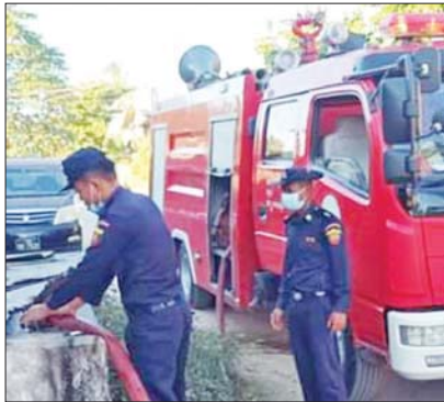
သီပေါမြို့နယ်၌ မီးဘေးကြိုတင်ကာကွယ်ရေး အသိပညာပေး

များကို စနစ်တကျထုတ်ပိုးခြင်း၊ စွန့်ပစ်ခြင်း၊ ထင်းမီးဖိုများ အသုံးပြုလျှင် မီးဘေးကြိုတင်ကာကွယ်ရေး အကာအရံများနှင့် လုံခြုံစွာ အသုံးပြုရန်၊ ဂက်စမီးဖိုအသုံးပြုသူများအနေဖြင့် အသုံးမပြုမီ သေချာစစ်ဆေးအသုံးပြုရန်၊ လျှပ်စစ်မီး အသုံးပြုသူများအား ဝန်အားမျှတသော လျှပ်စစ်ပိုင်ယာများ အသုံးပြုရန်၊ ဟောင်းနွမ်းပေါက်ပြုသည့် လျှပ်စစ်ပစ္စည်းများကို အစားထိုးလဲလှယ်ဆောင်ရွက်ရန်၊ နေအိမ်ဝင်းအတွင်း မီးလောင်လွယ်သော ဆီအမျိုးမျိုး သိုလှောင်ထားခြင်း၊ ဖြန့်ဖြူးရောင်းချခြင်း မပြုရန် စသည့် ဆောင်ရန်ရှောင်ရန်များကို အသိပညာပေးခြင်းများ ဆောင်ရွက်ခဲ့ကြောင်း သိရသည်။ စိုင်း(သီပေါ)