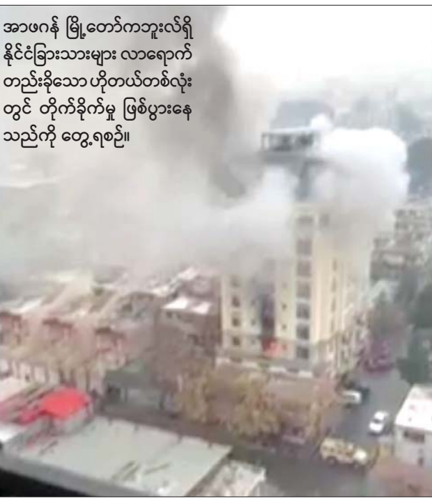
အာဖဂန် မြို့တော်ကဘူးလ်ရှိ နိုင်ငံခြားသားများ လာရောက်တည်းခိုသော ဟိုတယ်တစ်လုံးတွင် တိုက်ခိုက်မှု ဖြစ်ပွားနေသည်ကို တွေ့ရစဉ်။

က တည်ထောင်ခဲ့သော ဆေးရုံမှ တာဝန်ရှိသူ တစ်ဦးက ပြောကြားလိုက်သည်။ သေဆုံးသွားသူများမှာ နိုင်ငံသား မည်သူမည်ဝါဖြစ်ကြောင်းကို တာဝန်ရှိသူများက အတည်မပြုနိုင်သေးကြောင်း သိရသည်။ ဒဏ်ရာ ရရှိသူများတွင် တရုတ်နိုင်ငံသား ငါးဦး ပါဝင်ကြောင်း တရုတ်နိုင်ငံခြားရေးဝန်ကြီးဌာနက ပြောကြားလိုက်သည်။ ထို့အပြင် စစ်ဘက်နှင့် ရဲဘက်အရာရှိများလည်း သေဆုံးခဲ့သည်။ အဆိုပါတိုက်ခိုက်မှုကို စစ်ဘက်က အပြင်းအထန်ရှုတ်ချခဲ့သည်။ အကြမ်းဖက် တိုက်ခိုက်မှုသည် အန္တရာယ်ရှိပြီး မိမိတို့အလွန် တုန်လှုပ်မိကြောင်း စစ်ဘက် ပြောရေးဆိုခွင့်ရှိသူက ပြောကြားလိုက်သည်။ အင်န်အိတ်ချ်က