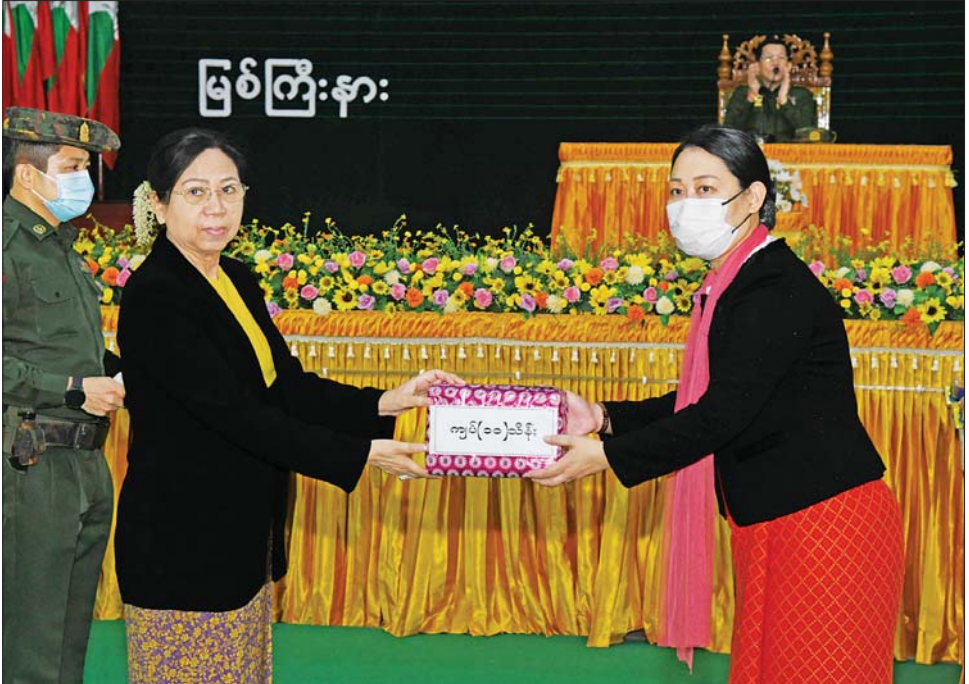
နိုင်ငံတော်စီမံအုပ်ချုပ်ရေးကောင်စီဥက္ကဋ္ဌ တပ်မတော်ကာကွယ်ရေးဦးစီးချုပ် ဗိုလ်ချုပ်မှူးကြီး မင်းအောင်လှိုင်၏ ဇနီး ဒေါ်ကြူကြူလှ တပ်နယ်မိခင်နှင့်ကလေး စောင့်ရှောက်ရေးအသင်းအတွက် ချီးမြှင့် ငွေများကို ပေးအပ်ရာ တိုင်းမှူး၏ဇနီးက လက်ခံရယူစဉ်။

ရှင်းလင်းတင်ပြမှုများနှင့် ပတ်သက်၍ နိုင်ငံတော် စီမံအုပ်ချုပ်ရေးကောင်စီဥက္ကဋ္ဌ တပ်မတော်ကာကွယ် ရေးဦးစီးချုပ်က နယ်မြေဒေသတည်ငြိမ်အေးချမ်းရေး၊ တရားဥပဒေစိုးမိုးရေးနှင့် တပ်တွင်းစည်းလုံးညီညွတ် ရေးတို့နှင့် ပတ်သက်၍ လိုအပ်သည်များ လမ်းညွှန် မှာကြားခဲ့ကြောင်း သတင်းရရှိသည်။