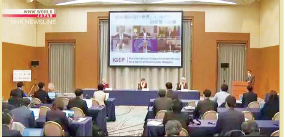
နျူကလီးယားလက်နက်ဖျက်သိမ်းရေးဖိုရမ် ကျင်းပစဉ်။