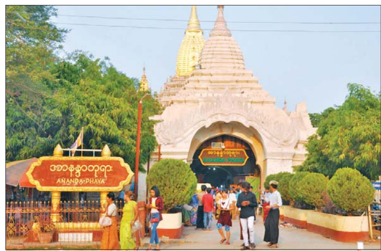
၂၀၂၂ ခုနှစ် ခရီးသွားရာသီအတွင်း ပုဂံရှေးဟောင်းယဉ်ကျေးမှုနယ်မြေ၌ ခရီးသွားများဖြင့် စည်ကားခဲ့သည်ကို တွေ့ရစဉ်။

စိတ်အေးချမ်းသာစွာတည်းခို လည်ပတ် နိုင်ရန် ပုဂံရှေးဟောင်းယဉ်ကျေးမှုနယ်မြေ ၌ ဟိုတယ်နှင့် တည်းခိုရိပ်သာ ၁၅၄ လုံးနှင့် စည်ပင်သာယာက ကြီးကြပ် ဆောင်ရွက်သည့် တည်းခိုခန်းပေါင်း ၇၅ ခုရှိကြောင်း သိရသည်။ “ပုဂံမှာ ခရီးသွားလုပ်ငန်းက အဓိက ဆိုတော့ ခရီးသွားဝင်ရောက်ဖို့ဆိုရင် အပြိုင်အဆိုင် ဝန်ဆောင်မှုပေးကြတယ်။ လာမယ့် နှစ်ဆန်းပိုင်း ပြာသိုလပြည့် အာနန္ဒာ ဘုရားပွဲမှာ ပြည်တွင်း၊ ပြည်ပ ခရီးသွားဝင်ရောက်မှု များနိုင်တယ်။ ဒီဇင်ဘာနှစ်သစ်ကူးမှာလည်း ခရီးသွား တွေဝင်လာဖို့ရှိတာကြောင့် ဟိုတယ်တွေ မှာ ကြိုတင်အခန်းတွေ ယူနေကြပါပြီ။ အချို့ဆိုရင် မိသားစုလိုက်ယူထားကြ တယ်” ဟု ဟိုတယ်လုပ်ငန်းရှင်တစ်ဦးက ပြောကြားသည်။ ယခုနှစ် ခရီးသွားရာသီအတွက် မိသားစုလိုက်ဖြစ်စေ၊ မိတ်ဆွေသူငယ်ချင်း