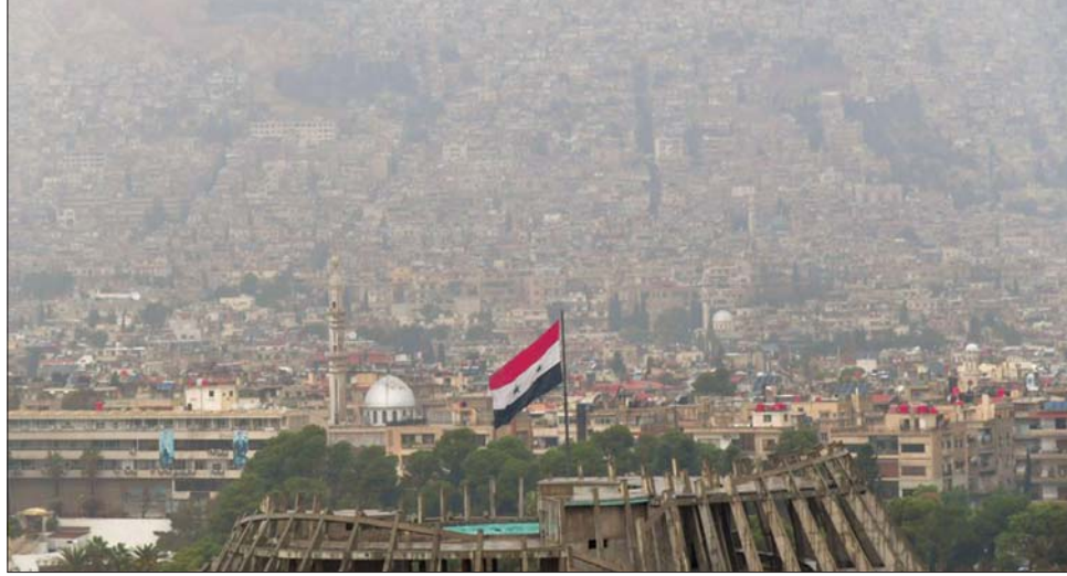
ဒမတ်စကတ်မြို့တွင် မြို့များ ဖုံးလွှမ်းနေသည်ကို နိုဝင်ဘာ ၂၉ ရက်က တွေ့ရစဉ်။

လာသည့်အတွက် စက်သုံးဆီပြတ်လပ်မှုကို ပိုမိုဆိုးရွားစေခဲ့သည်။ ဆီးရီးယားနိုင်ငံရှိ အဓိက မြို့ကြီးများတွင် စက်သုံးဆီ ရောင်းချသည့် နေရာများ၌ စက်သုံးဆီပြတ်လပ်မှုနှင့် ကြုံတွေ့နေရသည်။ ထို့ကြောင့် ကားအသုံးပြုမှုများကို လျှော့ချနေရပြီး မှောင်ခိုဈေးကွက်မှ ဝယ်ယူမှုများကိုပါ ပြုလုပ်လာကြသည်။ လွန်ခဲ့သည့် ၁၁နှစ် ဆီးရီးယားစစ်ပွဲ စတင်ခဲ့သည့်အချိန်မှ စတင်ကာ ပထမဆုံး အကြိမ်အဖြစ် စက်သုံးဆီ ချွေတာရန်အတွက် မြို့တွင်းအားကစားပွဲ အားလုံးကို ဆိုင်းငံ့ခဲ့သည်။ လက်ရှိဖြစ်ပေါ်နေသည့် စက်သုံးဆီအကျပ်အတည်းမှာ အမေရိကန်၏ ပိတ်ဆို့မှုများကြောင့်ဖြစ်သည်ဟု ဆီးရီးယားအစိုးရက အပြစ်တင်ခဲ့သည်။