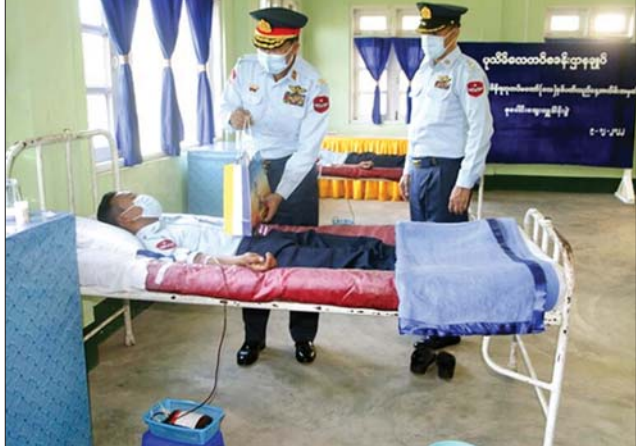
ဌာနချုပ်မှူး၊ လေတပ်စခန်းမှူးများ၊ အုပ်မှူးများ၊ တာဝန်ရှိသူများနှင့် စုပေါင်းသွေးလှူဒါန်း

နေပြည်တော် ဒီဇင်ဘာ ၁၁ (၇၅) နှစ်မြောက် စိန်ရတု တပ်မတော်(လေ) နှစ်ပတ်လည်နေ့ အထိမ်းအမှတ်ကို ကြိုဆိုဂုဏ်ပြုသောအားဖြင့် ကာကွယ်ရေးဦးစီးချုပ်ရုံး(လေ) ကွပ်ကဲမှုအောက်တပ်များမှ အရာရှိ၊ စစ်သည်၊ မိသားစုဝင်များ စုပေါင်းသွေးလှူဒါန်းခြင်းကို ဒီဇင်ဘာ ၈ ရက်မှစ၍ သက်ဆိုင်ရာ နယ်မြေခံ တပ်မတော်ဆေးရုံများတွင် ဆောင်ရွက်လျက်ရှိသည်။ အဆိုပါ စုပေါင်းသွေးလှူဒါန်းပွဲများကို သက်ဆိုင်ရာနယ်မြေအလိုက်မှ လေတပ်ကွပ်ကဲမှု