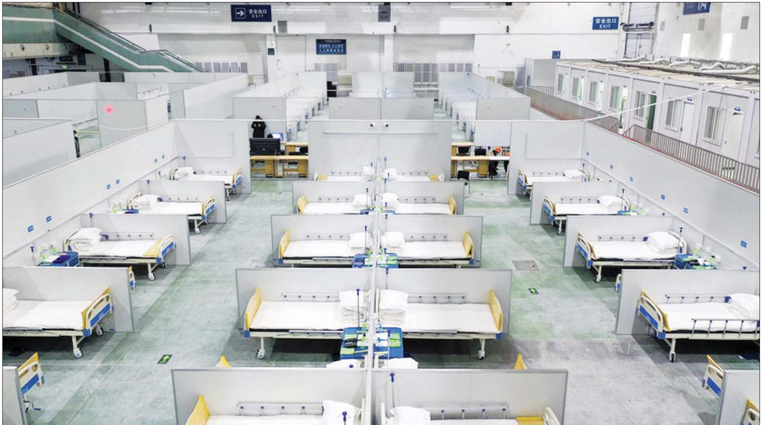
တရုတ်နိုင်ငံ အရှေ့မြောက်ပိုင်း ကျိုင်းပြည်နယ်၏ မြို့တော်ချန်ချမ်းရှိ ကိုဗစ်-၁၉ လူနာများအတွက် ယာယီဆေးရုံတစ်ခု၏ အတွင်းပိုင်းကို တွေ့ရစဉ်။

“ကျွန်တော်တို့ရဲ့ ဆေးအဖွဲ့တွေက အသက် ၁၀၀ ကျော် အဘွားလီအတွက် သီးသန့်ကုသမှုအစီအစဉ်ကို ပြုလုပ်ခဲ့ပြီး သူ့ကို စိတ်ပိုင်းဆိုင်ရာ အကြံဉာဏ်တွေ ပေးတာအပြင် အာဟာရဖြစ်စေမယ့် အစားအသောက်တွေကိုလည်း စီမံ ချိန်ညှိပေးခဲ့ပါတယ်။ ဒီအတောအတွင်း မှာပဲ သူ့မိသားစုဝင်တွေနဲ့လည်း အဆက် မပြတ်အောင် လုပ်ဆောင်ပေးခဲ့ပါတယ်”