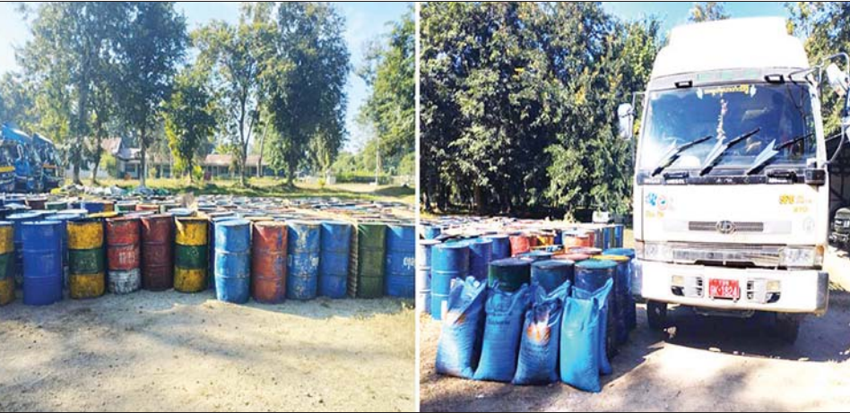
ကချင်ပြည်နယ် တရားမဝင်ကုန်သွယ်မှုတိုက်ဖျက်ရေး အထူးအဖွဲ့၏ ဖမ်းဆီးရမိမှု။