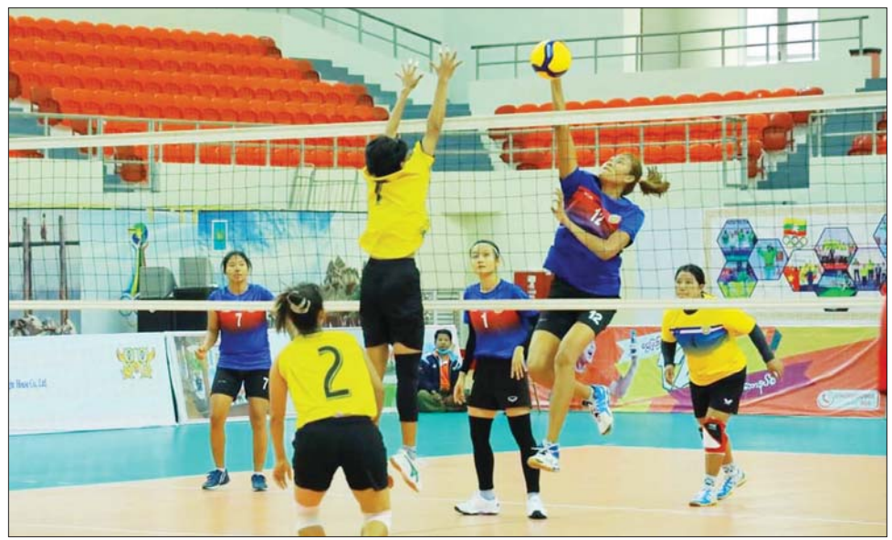
အသင်းနှင့် မန္တလေးတိုင်းဒေသ ကြီးအသင်း ဘော်လီဘော (အမျိုးသား) တတိယလှပွဲ စဉ် များအဖြစ် ကရင်ပြည်နယ်အသင်း ဖြစ်၍ မည်သူမဆို အခမဲ့လာ နှင့် နေပြည်တော်အသင်းတို့ ရောက်ကြည့်ရှုအားပေးနိုင်ကြောင်း ဆက်လက်ယှဉ်ပြိုင် ကစားကြမည် သိရှိရသည်။ အားကာမောင်

ဒေသကြီးအသင်းကို သုံးပွဲပြတ် ဖြင့်လည်းကောင်း၊ စစ်ကိုင်းတိုင်း ဒေသကြီးအသင်းက မန္တလေး တိုင်းဒေသကြီးအသင်းကို သုံးပွဲ ပြတ်ဖြင့်လည်းကောင်း၊ ဘော်လီ ဘော (အမျိုးသား) ဆီမီးဖိုင်နယ် ပြိုင်ပွဲ ပွဲစဉ်များတွင် ရန်ကုန်တိုင်း ဒေသကြီးအသင်းက ကရင် ပြည်နယ်အသင်းကို သုံးပွဲပြတ်ဖြင့် လည်းကောင်း၊ မန္တလေးတိုင်း ဒေသကြီးအသင်းက နေပြည်တော် အသင်းကို သုံးပွဲပြတ်ဖြင့် လည်း ကောင်း အနိုင်ရရှိသည်။ ဒီဇင်ဘာ ၁၂ ရက် နံနက် ၉ နာရီမှစတင်၍ ဝဏ္ဏသိဒ္ဓိ အားကစားရုံ(B)၌ ဘော်လီဘော (အမျိုးသမီး) တတိယလှပွဲ ပွဲစဉ် များအဖြစ် မကျေးတိုင်းဒေသကြီး