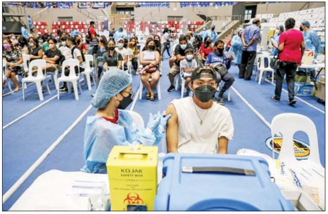
ကျန်းမာရေးဝန်ထမ်းတစ်ဦးက ကိုဗစ်ကာကွယ်ဆေးထိုးနှံပေးစဉ်။

ဝန်းကျင်၌ ကိုဗစ် -၁၉ ကူးစက်ခံရ လည်း သိရသည်။ လူဦးရေသန်း သူစုစုပေါင်းမှာ ၁၃ သန်းကျော်ရှိ ၁၁၀ ဝန်းကျင်အနက် ကာကွယ် လာသည်။ ဇန်နဝါရီ ၁၅ ရက် ဆေးအကြိမ်ပြည့်ထိုးပြီး ဦးရေမှာ ၇၃ ဒသမ ၈ သန်းအထိ ရှိလာ ကြောင်း သိရသည်။ ဆင်ဟွာ