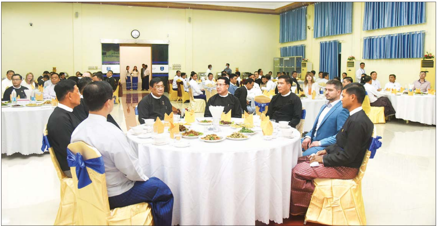
မြန်မာ-ရုရှား နှစ်နိုင်ငံပူးပေါင်း၍ စီမံကိန်းများ အကောင်အထည်ဖော်ဆောင်ရွက်မည့် အစီအစဉ်အရ လျှပ်စစ်စွမ်းအားဝန်ကြီးဌာန၊ သိပ္ပံနှင့် နည်းပညာဝန်ကြီး ဌာနနှင့် ရုရှားဖက်ဒရေးရှင်းနိုင်ငံ (Russian State Atomic Energy Corporation “ROSATOM”) တို့ ပူးပေါင်းဆောင်ရွက်မည့် စီမံကိန်းဆိုင်ရာများ တွေ့ဆုံဆွေးနွေးခြင်း အထိမ်းအမှတ် ဂုဏ်ပြုညစာစားပွဲ အခမ်းအနားကျင်းပစဉ်။

ဂုဏ်ပြုညစာစားပွဲသို့ ပြန်ကြားရေးဝန်ကြီးဌာန ပြည်ထောင်စုဝန်ကြီး ဦးမောင်မောင်အုန်း၊ လျှပ်စစ် စွမ်းအားဝန်ကြီးဌာန ပြည်ထောင်စုဝန်ကြီးဦးသောင်း ဟန်၊ စွမ်းအင်ဝန်ကြီးဌာန ပြည်ထောင်စုဝန်ကြီး ဦးမျိုးမြင့်ဦး၊ သိပ္ပံနှင့် နည်းပညာဝန်ကြီးဌာန ပြည်ထောင်စုဝန်ကြီး ဒေါက်တာမျိုးသိန်းကျော်နှင့် ဆောက်လုပ်ရေးဝန်ကြီးဌာန ပြည်ထောင်စုဝန်ကြီး ဦးမျိုးသန့်၊ ROSATOM မှ ကိုယ်စားလှယ်များ၊ ဖိတ်ကြားထားသော ဝန်ကြီးဌာနများမှ ဌာနဆိုင်ရာ အကြီးအကဲများနှင့် တာဝန်ရှိသူများ တက်ရောက် ကြသည်။