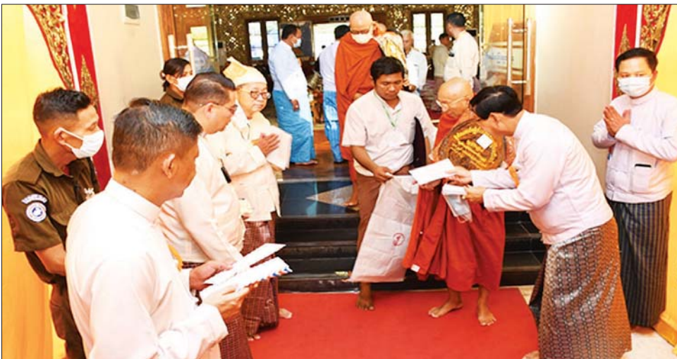
အဖွဲ့ဝင်များ၊ ဖိတ်ကြားထားသူများနှင့် အလှူရှင် တက်ရောက်လာကြသူများက သီဟိုဠ်ပရိယတ္တိ စာသင်တိုက်ကြီး၏ ဦးစီးပဓာန နာယက ဆရာတော် ဦးစော တိုင်းဒေသကြီးဝန်ကြီးချုပ်၊ တိုင်းမှူးနှင့် ထံမှ ငါးပါးသီလ ခံယူဆောက်တည်ကြပြီး ဆရာ

နေပြည်တော် ဒီဇင်ဘာ ၁၁ ရန်ကုန်တိုင်းဒေသကြီး ဗိုလ်တထောင်မြို့နယ်ရှိ ဗိုလ်တထောင်ကျိုက်ဒေးအပ် ဆံတော်ဦးစေတီတော် (၄၉)ကြိမ်မြောက် ဗုဒ္ဓပူဇော်၊ ဓမ္မပူဇော်၊ သံဃပူဇော် ပွဲတော် သံဃပူဇော် ဆွမ်းဆန်စိမ်းလောင်းလှူပွဲကို ယနေ့မုန့်လှူပွဲအားဖြင့် စတင်ကျင်းပရာ ရန်ကုန်တိုင်းဒေသကြီး သံဃာ့ကောသလအဖွဲ့ ဒုတိယ ဥက္ကဋ္ဌ ရှမ်းပြည်နယ်(မြောက်ပိုင်း) ကျောက်မဲမြို့နယ် သီဟိုဠ်ပရိယတ္တိစာသင်တိုက်ကြီး၏ ဦးစီးပဓာန နာယက ဆရာတော် အဂ္ဂမဟာပဏ္ဍိတ ဘဒ္ဒန္တ စန္ဒ နာယက အမှုဆောင်သံဃာတော်များနှင့် သာသနာ့ နှယ်ဝင် သီလရှင်ဆရာကြီးများ ကြွရောက်တော်မူ ကြပြီး တိုင်းဒေသကြီးဝန်ကြီးချုပ် ဦးစိုးသိန်း၊ ရန်ကုန်တိုင်းစစ်ဌာနချုပ် တိုင်းမှူး ဗိုလ်ချုပ် ညွှန်ကြားရေးမှူးချုပ် တိုင်းဒေသကြီးဝန်ကြီးများ၊ ဂေါပက