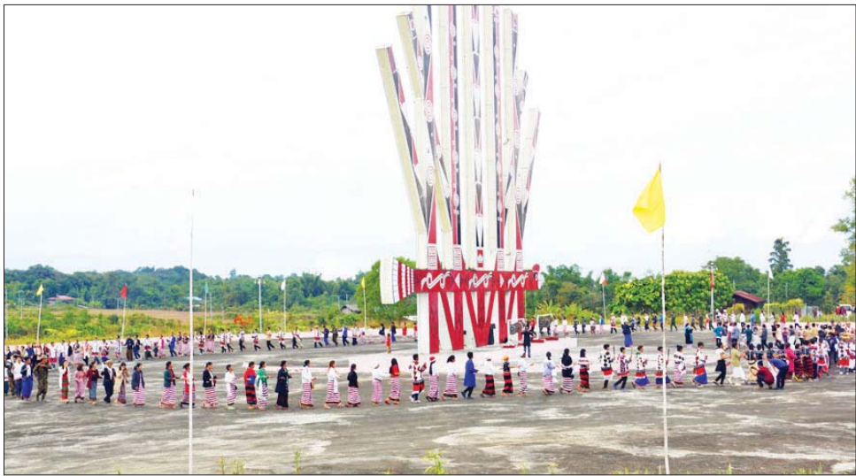
ရဝမ်အမျိုးသားနေ့အဖြစ် သတ်မှတ်ခဲ့ခြင်းဖြစ်ပြီး များ သွေးစည်းညီညွတ်ရေးနှင့် ရေရှည်တည်တံ့ခိုင်မြဲရန်၊ ရဝမ်အမျိုးသားများ ဘက်စုံဖွံ့ဖြိုးရေးအတွက် ညှိနှိုင်းဆောင်ရွက်ကြရန် ရည်ရွယ်ချက် (၄)ချက်ဖြင့် ကျင်းပခြင်းဖြစ်ကြောင်း သိရသည်။ ဖုန်ကန်(ပူတာအို)

ရဝမ်စာပေ ရရှိရေးအတွက် ဒေသအသီးသီးမှ ရဝမ်များ ပထမဆုံးအကြိမ် စုစည်းတွေ့ဆုံစည်းဝေးခဲ့သည့် ၁၉၄၉ ခုနှစ် ရဝမ်စာပေအစည်းအဝေးမှ စတင်ခဲ့သော ရဝမ်စာပေနေ့ ဒီဇင်ဘာ ၉ ရက်ကို