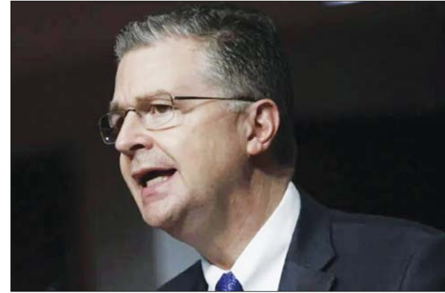
အရှေ့အာရှနှင့် ပစိဖိတ်ရေးရာ လက်ထောက် နိုင်ငံခြားရေးဝန်ကြီး ဒန်နီရယ် ခရစ်တန် ဘရင်ဒ်။

ဝန်ကြီးဌာနက ပြောကြားသည်။ ယခုခရီးစဉ်သည် လေးနှစ်အတွင်း အမေရိကန် ထိပ်တန်း အောက်ဖိစီ