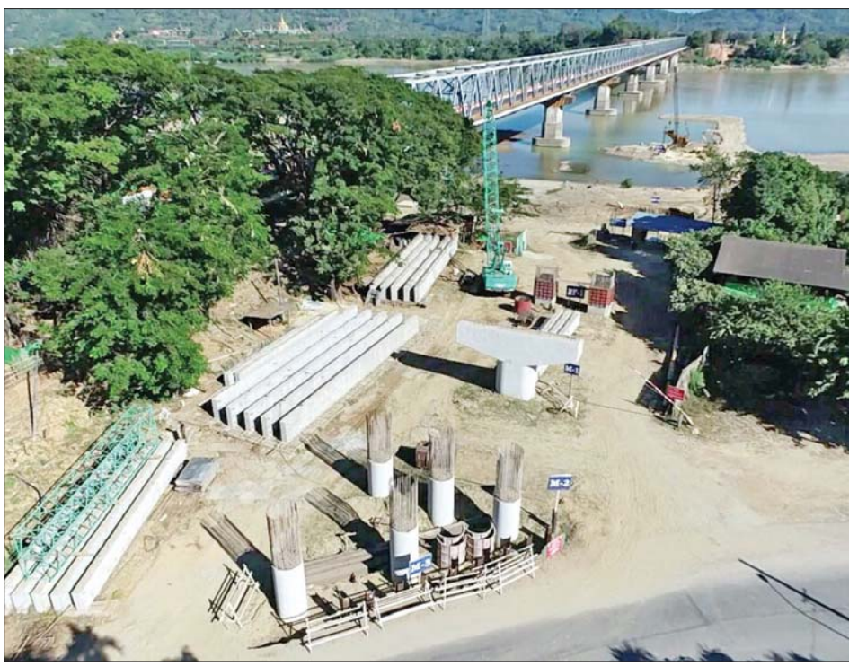
ဗလမင်းထင်တံတားအမှတ် (၂) မြစ်ကြီးနားဘက်ကမ်း တည်ဆောက်ရေးလုပ်ငန်းများကို တံတားအမှတ် (၁)နှင့် ယှဉ်လျက် ဆောင်ရွက်နေစဉ်။