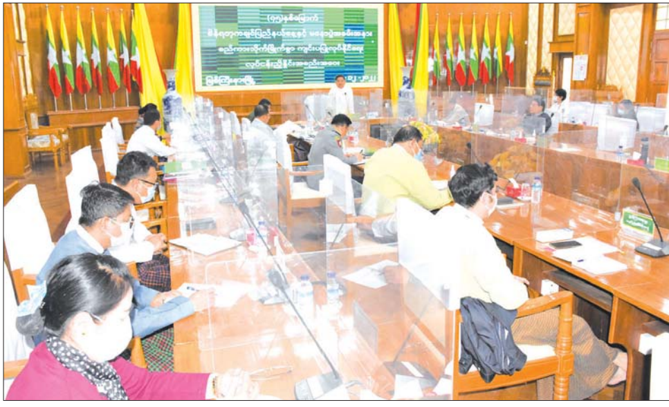
ထုတ်ကုန်ပြခန်းများ ပြသနိုင်ရေး၊ ဂုဏ်ထူးဆောင် ခဲ့ကြပြီး ပြည်နယ်ဝန်ကြီးချုပ်က ညှိနှိုင်းပေါင်းစပ် ဆုတံဆိပ်နှင့် ဂုဏ်ထူးဆောင်လက်မှတ်များ အပ်နှင်း ဆောင်ရွက်ပေးခဲ့သည်။ ရေး စသည်တို့အပါအဝင် လိုအပ်သည်များကို ဆွေးနွေး ပြည်နယ် (ပြန်/ဆက်)

တွင် (၇၅)နှစ်မြောက် စိန်ရတုနှစ်သို့ ရောက်ရှိပြီဖြစ်ပါ ကြောင်း၊ ကချင်ပြည်နယ်နေ့သည် ပြည်နယ်အတွင်းရှိ ဌာနတိုင်းရင်းသားများအားလုံး၏ အထိမ်းအမှတ်နေ့ ဖြစ်သည့်အပြင် လာမည့် စိန်ရတုကချင်ပြည်နယ်နေ့ အခမ်းအနားကို မနောပွဲတော်ဖြင့် ထူးခြားစည်ကား စွာ ကျင်းပပြုလုပ်နိုင်ရေး ဆပ်ကော်မတီအသီးသီး အနေဖြင့် လုပ်ငန်းတာဝန်များအလိုက် ကြိုတင်စီစဉ် ဆောင်ရွက်သွားရမည်ဖြစ်ကြောင်း မှာကြားသည်။ ထို့နောက် တက်ရောက်လာကြသည့် ပြည်နယ် ဝန်ကြီးများနှင့် ဆပ်ကော်မတီအသီးသီးမှ ပြည်နယ်အဆင့်ဌာနဆိုင်ရာများက အခမ်းအနား ကျင်းပနိုင်ရေးအတွက် ဆပ်ကော်မတီအလိုက် လုပ်ငန်းတာဝန်များ ကြိုတင်ပြင်ဆောင်ရွက်ထားရှိမှု များကို ရှင်းလင်းတင်ပြကြပြီး ကချင်ပြည်နယ်နေ့ အထိမ်းအမှတ်အဖြစ် ဇန်နဝါရီ ၉ ရက်နှင့် ၁၀ ရက် နေ့များတွင် မနောပွဲအကဖြင့် ဆင်နွှဲနိုင်ရေး၊ တိုင်းရင်းသားရိုးရာ အကပဒေသာဖြင့် ကပြဖျော်ဖြေ နိုင်ရေး၊ ဌာနဆိုင်ရာပြခန်းများအပါအဝင် ဒေသ