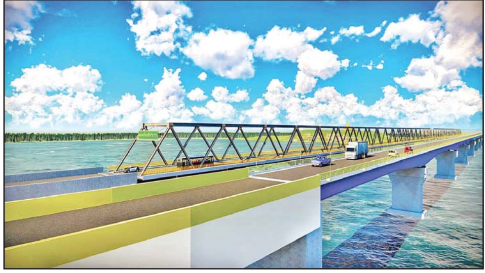
မန္တလေး- လားရှိုး- ဗန်းမော်- မြစ်ကြီးနားလမ်းပေါ်ရှိ ဗလမင်းထင်တံတားအမှတ် (၂) တည်ဆောက် ပြီးစီးပါက တွေ့မြင်ရမည့်ပုံ။

* တံတားဦးစီးဌာနအနေဖြင့် ရွေးချယ်ထားသော တံတားအူကြောင်း သုံးခုအနက် နည်းပညာဆိုင်ရာ နှိုင်းယှဉ်ချက်၊ စီးပွားရေးဆိုင်ရာ နှိုင်းယှဉ်ချက်၊ လူမှုရေး ရှုထောင့် အထွေထွေနှိုင်းယှဉ်ချက်များအရ လျာထားတံတားအူကြောင်း (၁) ကို ရွေးချယ်ခဲ့သည်။ ၂၀၂၂-၂၀၂၃ ဘဏ္ဍာနှစ်တွင် ရေလယ်တိုင် Rp2 , Rp3, Rp4 Bored Pile လုပ်ငန်းများ၊ ကမ်းကပ်ခုံ (A2) Abutment Bored Pile လုပ်ငန်းများ၊ ချဉ်းကပ်တံတား (မြစ်ကြီးနားဘက်ကမ်း) သံကူကွန်ကရစ်ရက်မ တင်ခြင်းလုပ်ငန်းများကို တံတားဦးစီးဌာနမှ အရှိန်အဟုန် ဖြင့် ဆောင်ရွက်လျက်ရှိ . .