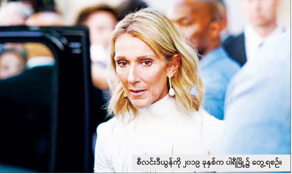
စီလင်းဒီယွန်ကို ၂၀၁၉ ခုနှစ်က ပါရီမြို့၌ တွေ့ရစဉ်။

စင်ကာပူ ဒီဇင်ဘာ ၉ စင်ကာပူနိုင်ငံ၌ ဒီဇင်ဘာ ၉ ရက်တွင် ကိုဗစ်-၁၉ ရောဂါ ထပ်မံကူးစက်ခံရ သူ ၁၃၄၃ ဦး တွေ့ရှိသဖြင့် အဆိုပါရောဂါကူးစက်ခံရသူပေါင်း ၂၁၇၉၀၄၄ ဦး ရှိလာပြီဖြစ်သည်။ လက်ရှိတွင် ကိုဗစ်-၁၉ ရောဂါကြောင့် ဆေးရုံတက်ရောက်ကုသမှု ခံယူနေသူပေါင်း ၁၃၇ ဦးရှိပြီး ပါးဦးမှာ အထူးကြပ်မတ်ကုသဆောင်တွင် ကုသမှုခံယူနေကြောင်း နိုင်ငံ၏ ကျန်းမာရေးဝန်ကြီးဌာနက ထုတ်ပြန် သည့် အချက်အလက်များအရ သိရသည်။ ဒီဇင်ဘာ ၉ ရက်တွင် ကိုဗစ်-၁၉ ကြောင့် ထပ်မံသေဆုံးသူ မရှိသော် လည်း အဆိုပါရောဂါဖြင့် သေဆုံးသူပေါင်း ၁၇၀၇ ဦးရှိကြောင်း သိရ သည်။ ဆင်ဟွာ