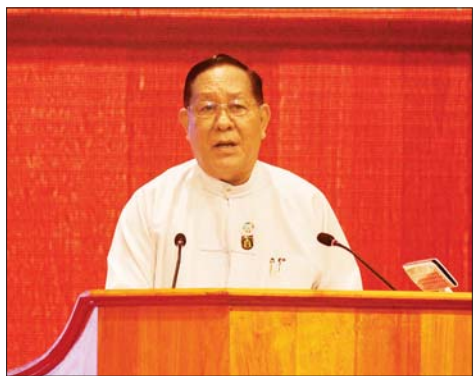
ပြည်ထောင်စုတရားသူကြီးချုပ် ဦးထွန်းထွန်းဦး ရှင်းလင်းတင်ပြစဉ်။

❖ အဂတိလိုက်စားမှုသည် အကျင့်ပျက်ခြစားမှုများနှင့် လူများ၏ စိတ်ဓာတ်နှင့် စာရိတ္တများပျက်စီးစေပြီး နိုင်ငံအတွက် အန္တရာယ်ဖြစ်သဖြင့် နိုင်ငံတော်က အဂတိလိုက်စားမှုတိုက်ဖျက်ရေးဥပဒေကို ၂၀၁၃ ခုနှစ်၊ ဩဂုတ်လ ၇ ရက်နေ့တွင် ပြဋ္ဌာန်းထားပြီး ထိရောက်သည့် ဟန့်တားဆောင်ရွက်မှုများနှင့် အရေးယူဆောင်ရွက်ခြင်းများကို ဆောင်ရွက်လျက်ရှိ ◆ အဂတိလိုက်စားမှုလျော့နည်းကျဆင်းစေရေး ဆောင်ရွက်ရာတွင် စုံစမ်းစစ်ဆေးရေးယူမှု တစ်ခုတည်းဖြင့် ဆောင်ရွက် မည်ဆိုပါက လုံလောက်မှုမရှိနိုင်။ အဂတိလိုက်စားမှုကို လုံးဝလက်မခံသည့် ယဉ်ကျေးမှုတစ်ရပ် ပေါ်ထွန်းလာစေရေးနှင့် အကျင့်ပျက်ခြစားမှုများ မရှိစေရေးအတွက် အခြေခံအကျဆုံးဖြစ်သည့် အသိပညာပေးရေးနှင့် တားဆီးကာကွယ်ရေး လုပ်ငန်းစဉ်များကိုပါ အချိန်နှင့်တစ်ပြေးညီ အလေးထားလုပ်ဆောင်သွားကြရန်လိုအပ်