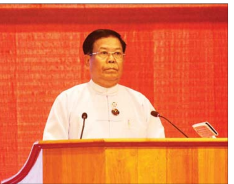
အဂတိလိုက်စားမှုတိုက်ဖျက်ရေးကော်မရှင် ဥက္ကဋ္ဌ ဦးသန်းဆွေ ရှင်းလင်းတင်ပြစဉ်။

ထိုသို့ ဆောင်ရွက်ရာတွင် နိုင်ငံတော်ဖွံ့ဖြိုး တိုးတက်မှုနှင့် တည်ငြိမ်အေးချမ်းမှုကို ဘက် ပေါင်းစုံမှ ထိခိုက်စေနိုင်သည့် အဂတိလိုက်စားမှုများ လျော့နည်းကျဆင်းသွားစေရေးအတွက် အလွန်အရေး ကြီးပါကြောင်း၊ အဂတိလိုက်စားမှုသည် အကျင့်ပျက် ခြစားမှုများနှင့် လူများ၏စိတ်ဓာတ်နှင့် စာရိတ္တများ ပျက်စီးစေပြီး နိုင်ငံအတွက် အန္တရာယ်ဖြစ်သဖြင့်