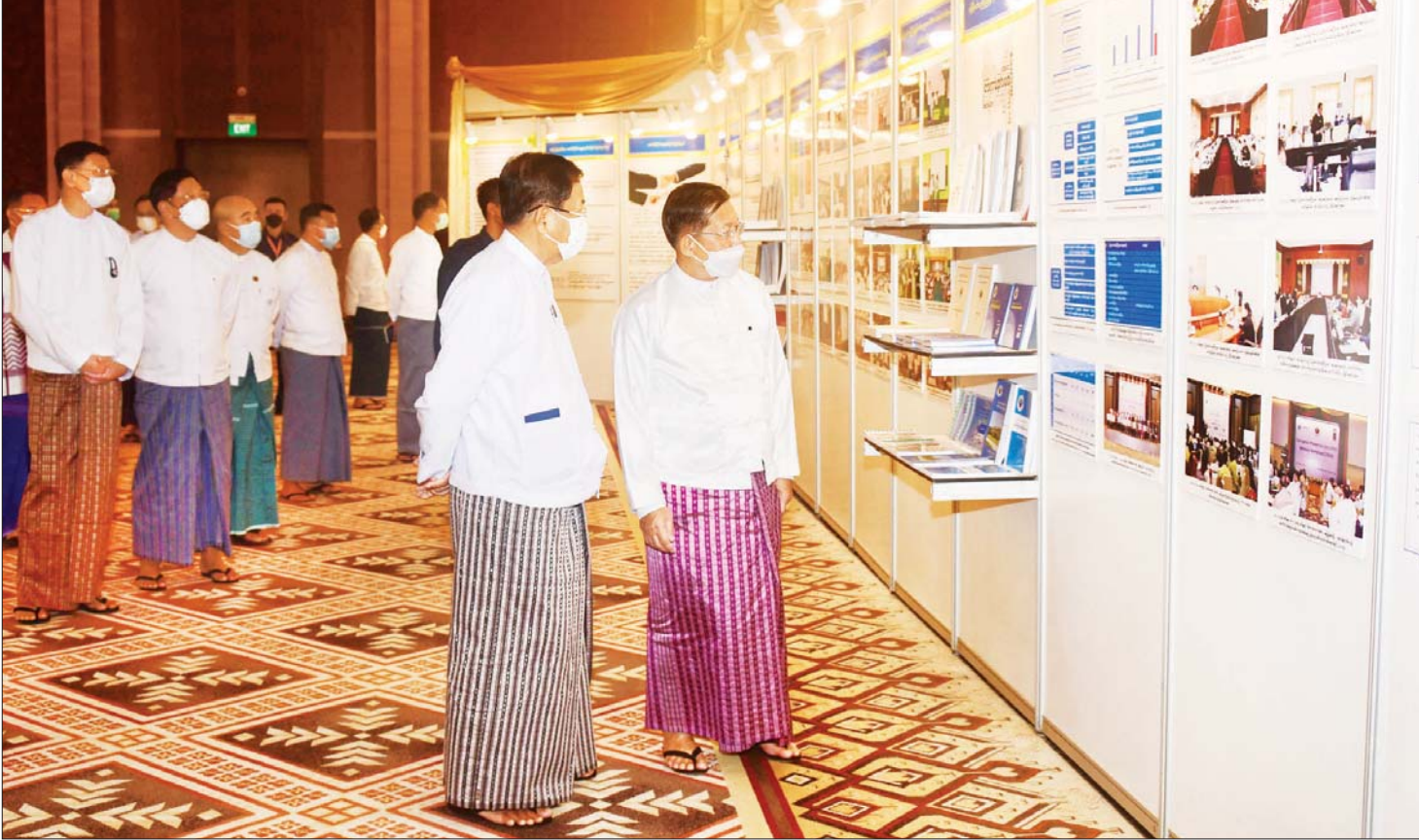
နိုင်ငံတော်စီမံအုပ်ချုပ်ရေးကောင်စီဥက္ကဋ္ဌ နိုင်ငံတော်ဝန်ကြီးချုပ် ဗိုလ်ချုပ်မှူးကြီး မင်းအောင်လှိုင်နှင့် အခမ်းအနားတက်ရောက်လာကြသူများ အပြည်ပြည်ဆိုင်ရာ အဂတိလိုက်စားမှုတိုက်ဖျက်ရေးနေ့ အခမ်းအနားတွင် ခင်းကျင်းပြသထားသည့်များကို ကြည့်ရှုစဉ်။

○ အဂတိလိုက်စားမှုများသည် အသွင်အမျိုးမျိုးဆောင်ပြီး ဖြစ်ပေါ်နေခြင်းဖြစ်သည့်အတွက် ဥပဒေကြောင်းအရ သာမက ကောင်းမွန်သော ကိုယ်ကျင့်တရားထွန်းကားရေး နည်းလမ်းများအရပါ ဆောင်ရွက်ရမည်ဖြစ်။ နိုင်ငံဝန်ထမ်း၊ ပြည်သူ့ဝန်ထမ်းများသာမက အများပြည်သူများနှင့်လည်း သက်ဆိုင်သည့် အကြောင်းအရာဖြစ်သည့် အတွက် အားလုံးပါဝင်ဆောင်ရွက်ကြရန်လိုအပ်