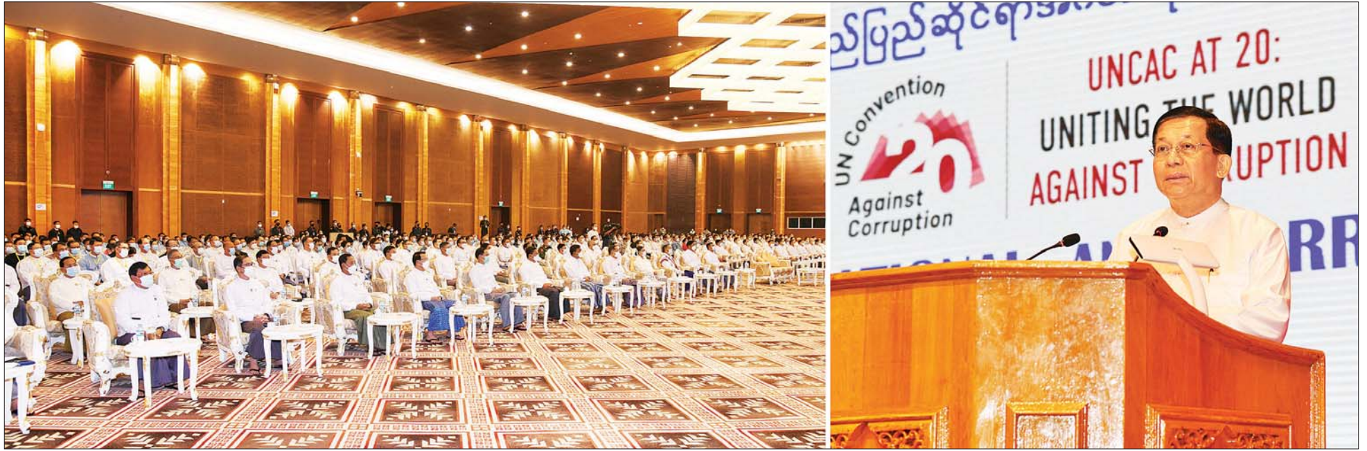
နိုင်ငံတော်စီမံအုပ်ချုပ်ရေးကောင်စီဥက္ကဋ္ဌ နိုင်ငံတော်ဝန်ကြီးချုပ် ဗိုလ်ချုပ်မှူးကြီး မင်းအောင်လှိုင် အပြည်ပြည်ဆိုင်ရာ အဂတိလိုက်စားမှုတိုက်ဖျက်ရေးနေ့အခမ်းအနားတွင် အမှာစကားပြောကြားစဉ်။