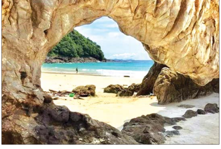
စမတ်ကျွန်း၏ ကျောက်စရစ်ကမ်းခြေနှင့် သဲသောင်ပြင်ကမ်းခြေ သဘာဝအလှအပများ။