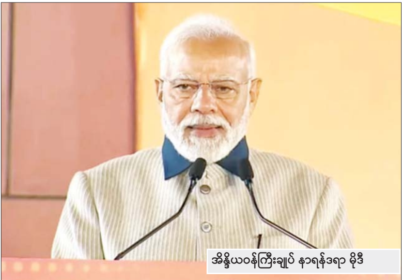
အိန္ဒိယဝန်ကြီးချုပ် နာရန်ဒရာ မိုဒီ

နယူးဒေလီ ဒီဇင်ဘာ ၉ အိန္ဒိယနိုင်ငံတွင် ပြည်နယ်လွှတ်တော် ရွေးကောက်ပွဲများကို ကျင်းပရာ ဝန်ကြီးချုပ် နာရန်ဒရာမိုဒီ၏ အာဏာရပါတီသည် ၎င်း၏ မွေးရပ်မြေဖြစ်သည့် ဂူဂျာရတ်ပြည်နယ်တွင် မဲအပြတ်အသတ်အနိုင်ရရှိကြောင်း သိရသည်။ အဆိုပါရလဒ်သည် ဝန်ကြီးချုပ်မိုဒီ၏ တတိယအကြိမ်မြောက် အနိုင်ရရှိရန်ရည်ရွယ်ချက်နှင့်အတူ ၂၀၂၄ ခုနှစ် အထွေထွေ ရွေးကောက်ပွဲ မတိုင်မီ ၎င်း၏ ပါတီအတွက် ကြီးမားသည့် တိုးတက်မှုတစ်ခုအဖြစ် တွေ့မြင်ရသည်။ ဘာရာတီယာ ဂျနာတာ ပါတီသို့မဟုတ် ဘီဂျေပီသည် ဂူဂျာရတ်ပြည်နယ်အတွင်း ၈၅ ရာခိုင်နှုန်းကျော် နေရာယူထားသည်။ အဆိုပါအရေအတွက်မှာ ၁၉၄၇ ခုနှစ် အိန္ဒိယ နိုင်ငံ လွတ်လပ်ရေးရရှိသည့်အချိန်မှစကာ အနောက်နိုင်ငံသမိုင်းတွင် ပါတီထဲမှ