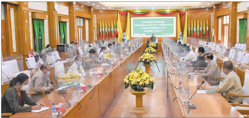
စစ်ဆေးတွေ့ရှိချက်များအပေါ် သုံးသပ်တင်ပြသည်။ လုပ်ငန်းနှင့်အညီ စနစ်တကျ ကြပ်မတ်ဆောင်ရွက် ဆွေးနွေးတင်ပြမှုများအပေါ် ပြည်နယ်ဝန်ကြီးချုပ် နိုင်ရေး ညှိနှိုင်းပေါင်းစပ်ဆောင်ရွက်ပေးခဲ့ကြောင်း က မတည်လွှဲပြောင်းသွားမည့်ရန်ပုံငွေများကို လုပ်ထုံး သိရသည်။ ပြည်နယ်(ပြန်/ဆက်)

လွှဲပြောင်းအပ်နှံနိုင်ရေးနှင့် စပ်လျဉ်း၍ ဘဏ္ဍာရေး လုပ်ထုံးလုပ်နည်းနှင့်အညီ ကြပ်မတ်သုံးစွဲသွားရမည့် လုပ်ငန်းစဉ်များကို ရှင်းလင်းပြောကြားပြီး တက်ရောက် လာကြသည့် ကော်မတီအဖွဲ့ဝင်များနှင့် ခရိုင်စီမံ အုပ်ချုပ်ရေးအဖွဲ့ဥက္ကဋ္ဌများက ချေးငွေများကို ကျေးရွာ ကော်မတီများထံ လွှဲပြောင်းအပ်နှံသွားမည့် အစီအမံများ၊ ဘဏ္ဍာရေးလုပ်ထုံးလုပ်နည်းနှင့်အညီ ကြပ်မတ် ဆောင်ရွက်ရမည့် ကိစ္စရပ်များနှင့် ထပ်မံရင်းနှီးမတည် ပေးနိုင်ရေး လုပ်ငန်းကဏ္ဍအလိုက် မြေပြင်ကွင်းဆင်း