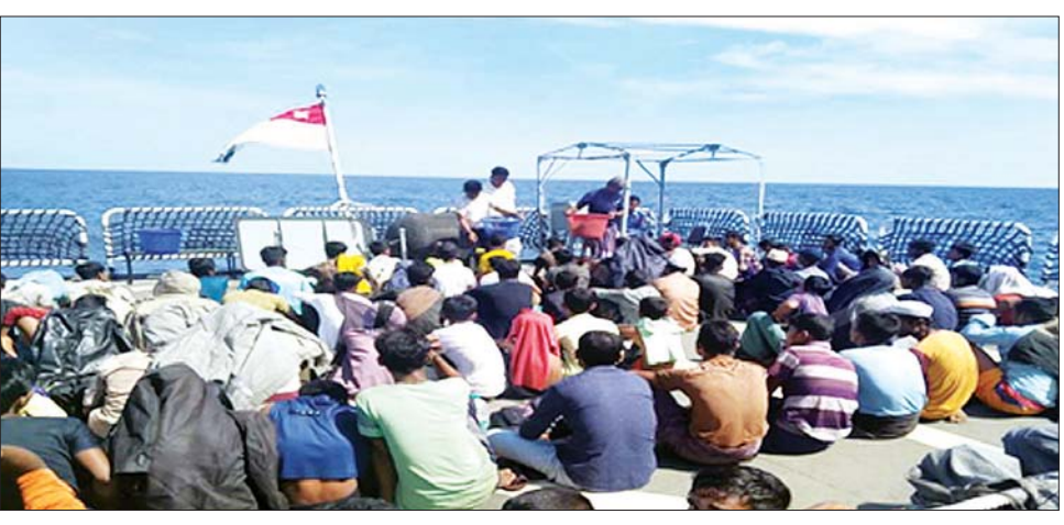
စစ်ရေယာဉ်ဖြင့် လွှဲပြောင်းကယ်ဆယ်လာသော ဘင်္ဂါလီလူမျိုးများ။

ရေပြင်အတွင်း ဖြတ်သန်းလာစဉ် ဒီဇင်ဘာ ၇ ရက် နံနက် ၅ နာရီ ၄၅ မိနစ်ခန့်တွင် မြိတ်မြို့၏ အနောက်တောင်ဘက် ၁၅၅ မိုင်ခန့်အကွာသို့အရောက်၌ ဘင်္ဂါလီ လူမျိုးများ တင်ဆောင်လာသည့်