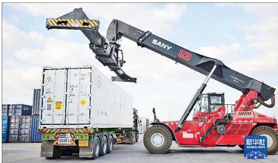
တရုတ်-လာအို-ထိုင်း သုံးနိုင်ငံ ပူးပေါင်းဆောင်ရွက်မှု ပို့ဆောင်ရေး လမ်းကြောင်းကြီး၏ အခန်းကဏ္ဍကို သည် ဒေသခွဲဖွံ့ဖြိုးတိုးတက်မှုအဆင့်ကို လက်တွေ့ ပိုမိုသိသာ ပေါ်လွင်စေမည်ဖြစ်ကြောင်း သိရ မြှင့်တင်ပေးမည်ဖြစ်ရာ နိုင်ငံတကာ ကုန်စည်ထောက်ပံ့ သည်။

တစ်ချိန်တည်းတွင် တရုတ်-လာအို ရထားလမ်းဖောက်လုပ်မှုကို ခိုင်မာစွာမြှင့်တင်မှုနှင့် အတူ တရုတ်-လာအို ရထားလမ်းသည် ထိုင်းနိုင်ငံ၏ ရထားလမ်းစနစ်နှင့် အပြန်အလှန် ချိတ်ဆက်မှုကို အရှိန်မြှင့်တင်၍ အင်ဒိုချိုင်းနားကျွန်းဆွယ်ကို ဖြတ်သန်းပြီးဆွဲသည့် ရထားလမ်းကြောင်းကြီးဖြစ်လာစေရန် မြှင့်တင်ဆောင်ရွက်လျက်ရှိကြောင်း၊ အနာဂတ်တွင် ရထားလမ်းကို အဓိကထားသည့်