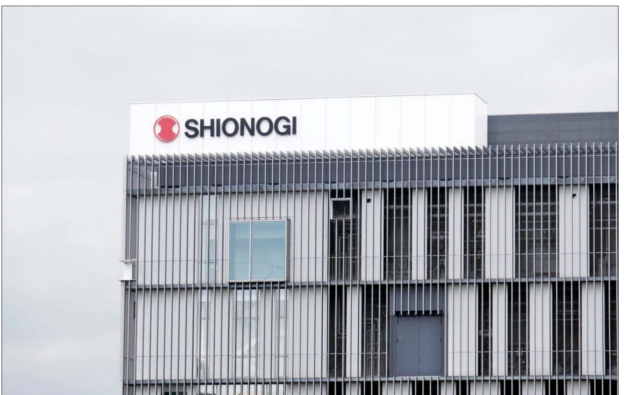
ဂျပန်နိုင်ငံက ပထမဆုံး ပြည်တွင်းထုတ် ကိုဗစ်-၁၉ရောဂါ ကာကွယ်ကုသဆေးဖြစ်သည့် ဇိုကိုဗာကို ထုတ်လုပ်ဖြန့်ချိသည့် ရှီအိုနိုဂီ ဆေးဝါးကုမ္ပဏီ။

တခြားနိုင်ငံတွေထက် ဂျပန်နိုင်ငံမှာ ကိုဗစ်-၁၉ ကူးစက်ဖြစ်ပွားမှု နှုန်း နည်းပါးကြောင်း ၎င်းက ဆက်လက်ထောက်ပြ ပြောဆိုခဲ့ပါတယ်။ ကိုဗစ်-၁၉ ဟာ နေ့စဉ်လူနေမှုမှာဝင်နေတဲ့ ခြိမ်းခြောက်လျက်ရှိသော်လည်း ကျန်းမာရေးနည်းလမ်းများအတိုင်း လိုက်နာနေထိုင်မယ်ဆိုပါက ရောဂါကူးစက်ဖြစ်ပွားမှုဒဏ်က ကာကွယ်နိုင်မှာဖြစ်ပါတယ်။