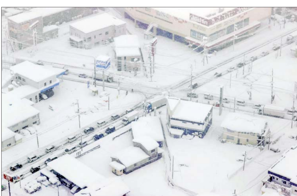
၂၀၂၁ ခုနှစ် ဆီးနှင်းများ ကျဆင်းမှုကြောင့် ကားတန်းရှည်ကြီးဖြစ်နေသည်ကို တွေ့ရစဉ်။

ယခုလို ပုံစံဖြစ်ခြင်းဖြစ်သည်။ ယင်းဖြစ်ရပ်ကြောင့် ကမ္ဘာ့အန္တရ် ရာသီဥတုကို သက်ရောက်နိုင်ခြေရှိ သည်ဟု ယူဆရသည်။ လာနီညာ ဖြစ်ပေါ်လာရသည့် အခါ ဂျပန်နိုင်ငံ၏ ရာသီဥတုမှာ ပုံမှန်ထက်ပို၍ အေးလာပြီး ဂျပန်ပင်လယ် ကမ်းရိုးတန်း တစ်လျှောက် ဆီးနှင်းများ ထူထပ်စွာ ကျဆင်းလာနိုင် သည်။ ဆီးနှင်းများ စံချိန်တင်ကျဆင်း ၂၀၂၁ ခုနှစ် နှစ်ကုန်ပိုင်းတွင် ပင်လယ် ကမ်းရိုးတန်းဒေသ၌ ဆီးနှင်းများ စံချိန်တင် ကျဆင်း ခဲ့ကာ အနောက်ပိုင်း ရှိဂါခရိုင်၌ ဆီးနှင်းများကြောင့် ကားများ လမ်းပိတ်ခဲ့ပြီး နှစ်ကီလိုမီတာ