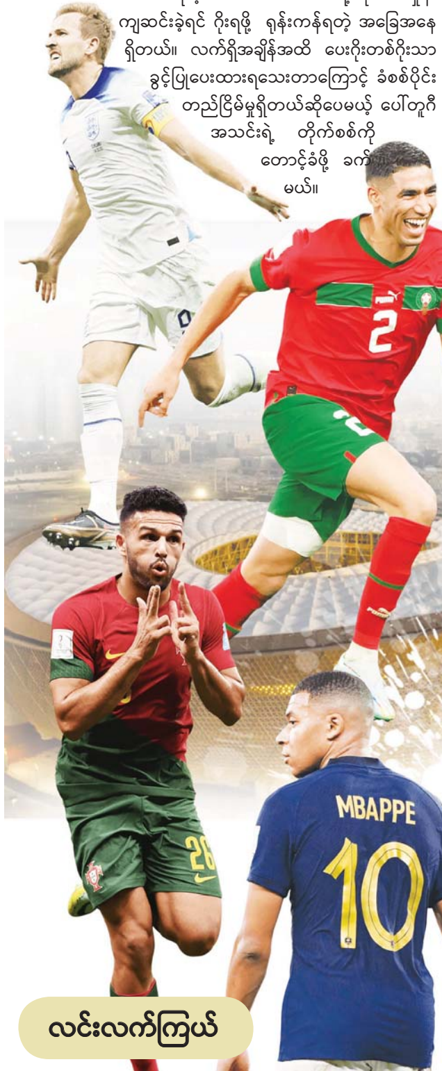
လင်းလက်ကြယ်