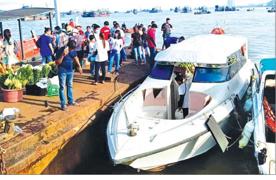
စမတ်ကျွန်းသို့ လာရောက်လည်ပတ်ကြသည့် ပြည်တွင်း၊ ပြည်ပခရီးသွားများ။

ခရီးသွားလုပ်ငန်း ပိုပြီးဖွံ့ဖြိုးစေချင်ရင် ပုဂ္ဂလိက လုပ်ငန်းတွေကို လွှဲအပ်ပေးသင့်တယ်လို့ထင်တယ်။ အရင်အစိုးရလက်ထက်က ဌာနဆိုင်ရာကပဲ ထိန်းသိမ်းထားပြီး လိုအပ်တဲ့ အပြင်အဆင် ဝန်ဆောင်မှုတွေ မလုပ်ပေးထားလို့ ကျွန်းက လှပ ပေမယ့် ထင်ရှားကျော်ကြားလာခြင်းမရှိဘူး။ ဒီအတိုင်း ကျွန်းပတ်ကြည့်ရုံနှင့် မပြီးပါဘူး။ ကျွန်းကို အမြဲ တစေ ထိန်းသိမ်းထားဖို့၊ ကျွန်းပေါ်မှာ ခရီးသည် တွေ သက်သောင့်သက်သာ အနားယူမယ့်နေရာတွေ၊ စနစ်တကျအမှိုက်စွန့်ပစ်ဖို့နေရာတွေနဲ့ သဘာဝ ပတ်ဝန်းကျင်ကို ဖျက်ဆီးမယ့်သူတွေကို စောင့်ကြည့် မယ့် ဝန်ထမ်းတွေ စသဖြင့်အများကြီးလိုပါတယ်။ ပုဂ္ဂလိကလုပ်ငန်းရှင်တွေကို ငှားရမ်းမယ်၊ လွှဲပြောင်း ပေးထားမယ်ဆိုရင် ထိန်းသိမ်းမှုပိုမိုအားကောင်း လာမှာဖြစ်သလို ကျွန်းနဲ့ပတ်သက်ပြီး ကြော်ငြာ တွေနဲ့ ခရီးသည်တွေ ဒီထက်ပိုမိုဝင်ရောက်လာမှာ ဖြစ်ပါတယ်” ဟု ၎င်း၏အမြင်ကို ပြောသည်။