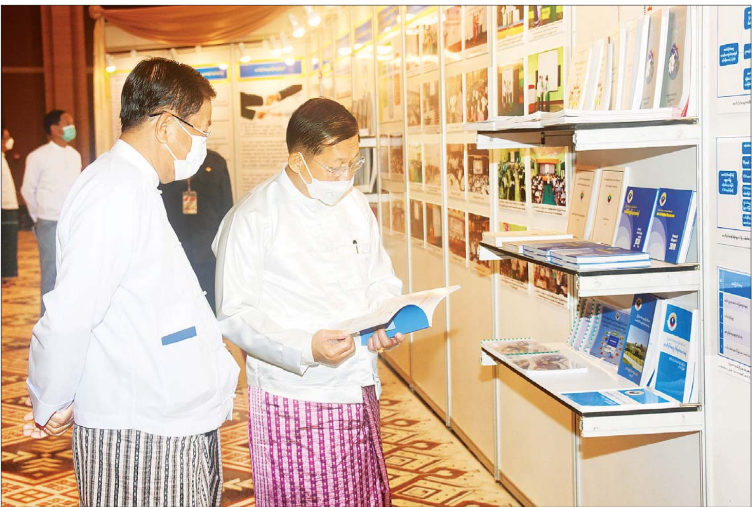
နေပြည်တော် ဒီဇင်ဘာ ၉

နိုင်ငံတော်ဖွံ့ဖြိုးတိုးတက်မှုနှင့် တည်ငြိမ်အေးချမ်းမှုကို ဘက်ပေါင်းစုံမှ ထိခိုက်စေနိုင်သည့် အဂတိလိုက်စားမှုများ လျော့နည်းကျဆင်းသွားစေရေးသည် အလွန်အရေးကြီး အဂတိလိုက်စားမှုတိုက်ဖျက်ရေးကို အမျိုးသားရေးတာဝန်တစ်ရပ်အဖြစ် ပါဝင်ဆောင်ရွက်