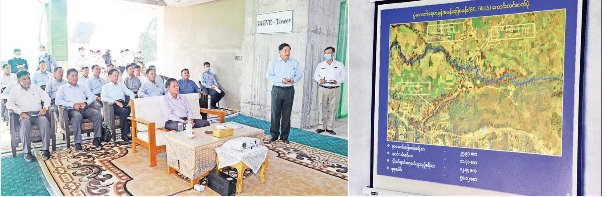
နိုင်ငံတော်စီမံအုပ်ချုပ်ရေးကောင်စီဥက္ကဋ္ဌ နိုင်ငံတော်ဝန်ကြီးချုပ် ဗိုလ်ချုပ်မှူးကြီး မင်းအောင်လှိုင်အား မြန်မာစီးပွားရေးကော်ပိုရေးရှင်းဥက္ကဋ္ဌ ဒုတိယဗိုလ်ချုပ်ကြီး ညိုစောက ပွဲကောက်ရေတံခွန်အပန်းဖြေစခန်း (B.E FALLS) သမိုင်းအကျဉ်းနှင့် လုပ်ငန်းဆောင်ရွက်မှုအခြေအနေများ ရှင်းလင်းတင်ပြစဉ်။