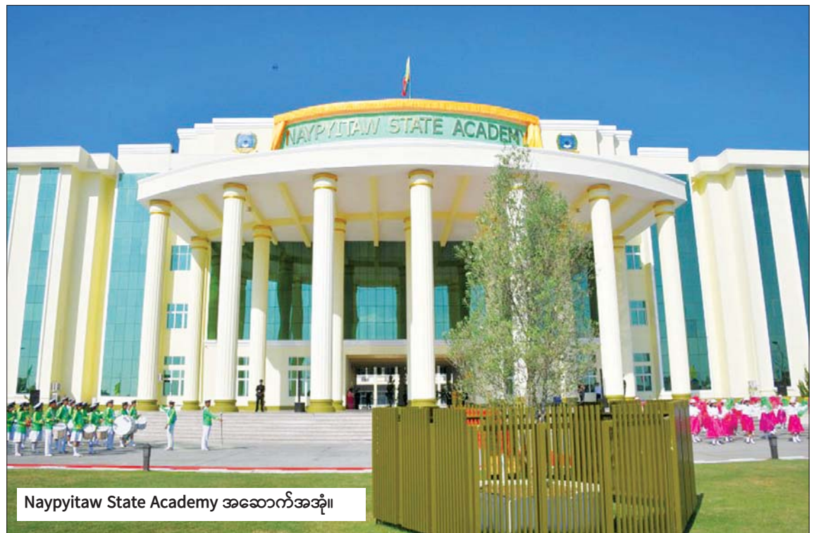
Naypyitaw State Academy အဆောက်အအုံ။

နိုင်ငံတော်အစိုးရ၏ အားပေးမှုနှင့် ယခုဖွင့်လှစ်လိုက်သော Naypyitaw State Academy ကြီးကို တက္ကသိုလ် ဆရာ ဆရာမများ၊ စီမံခန့်ခွဲရေးဝန်ထမ်း များ၊ တက္ကသိုလ်နယ်မြေဝန်ထမ်းများက ပညာသင်ကြားရန် တက်ရောက်နေသော ကျောင်းသား ကျောင်းသူများနှင့်အတူ နိုင်ငံတော်အဆင့်မှသည် ကမ္ဘာ့အဆင့် ထိပ်တန်းပညာရေးများ သင်ကြားပေး နေသော အကယ်ဒမီကြီးဖြစ်အောင် ပိုင်းဝန်းကြိုးစားသွားကြမည်ဟု ယုံကြည် မိပါတော့သည်။ ။