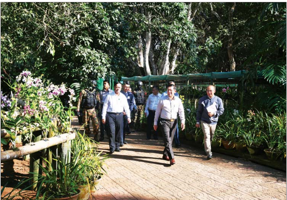
နိုင်ငံတော်စီမံအုပ်ချုပ်ရေးကောင်စီဥက္ကဋ္ဌ နိုင်ငံတော်ဝန်ကြီးချုပ် ဗိုလ်ချုပ်မှူးကြီး မင်းအောင်လှိုင် အမျိုးသားကန်တော်ကြီးဥယျာဉ်အတွင်း လှည့်လည်ကြည့်ရှုစစ်ဆေးစဉ်။

နေပြည်တော် ဒီဇင်ဘာ ၂ နိုင်ငံတော်စီမံအုပ်ချုပ်ရေးကောင်စီဥက္ကဋ္ဌ နိုင်ငံတော်ဝန်ကြီးချုပ် ဗိုလ်ချုပ်မှူးကြီး မင်းအောင်လှိုင်သည် ယနေ့မုန်းလွဲပိုင်းတွင် ကောင်စီတွဲဖက်အတွင်းရေးမှူး ဒုတိယ ဗိုလ်ချုပ်ကြီး ရဲဝင်းဦး၊ ပြည်ထောင်စုဝန်ကြီးများဖြစ်ကြသည့် ဦးလှမိုး၊ ဦးခင်မောင်ရီ၊ ကာကွယ်ရေးဦးစီးချုပ်ရုံးမှ တပ်မတော်အရာရှိကြီးများ၊ အလယ်ပိုင်းတိုင်းစစ်ဌာနချုပ် တိုင်းမှူး ဗိုလ်ချုပ်ကိုကိုဦးနှင့် အဖွဲ့ဝင်များလိုက်ပါ၍ ပြင်ဦးလွင်မြို့ရှိ အမျိုးသားကန်တော်ကြီးဥယျာဉ် ထိန်းသိမ်းဆောင်ရွက်ထားရှိမှု အခြေအနေများအား သွားရောက်ကြည့်ရှုစစ်ဆေးသည်။