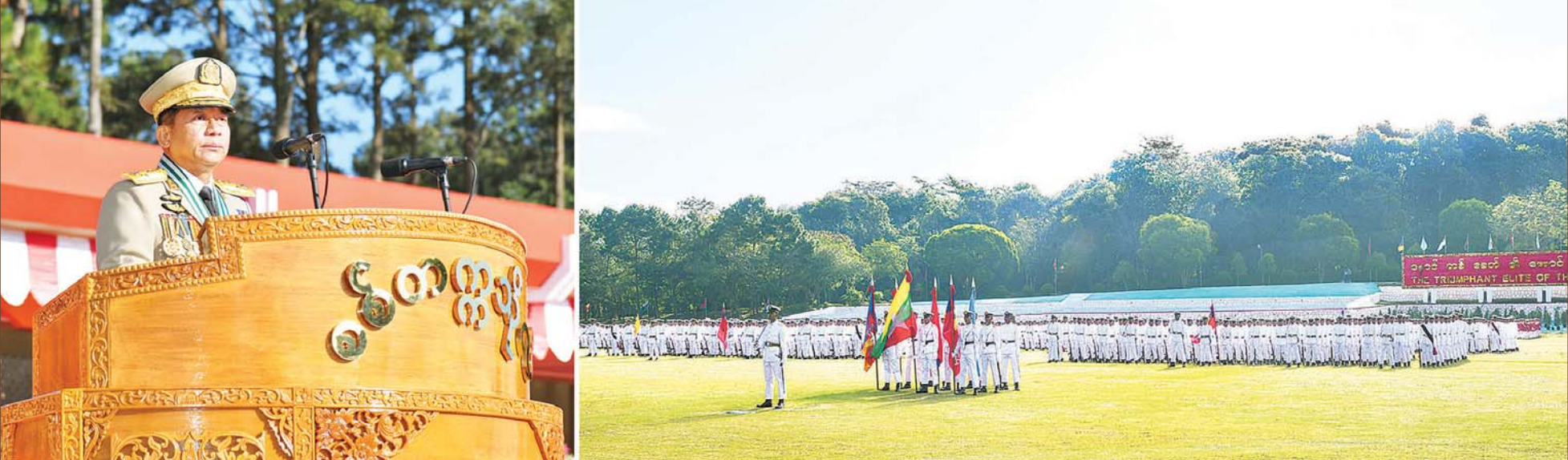
နိုင်ငံတော်စီမံအုပ်ချုပ်ရေးကောင်စီဥက္ကဋ္ဌ တပ်မတော်ကာကွယ်ရေးဦးစီးချုပ် ဗိုလ်ချုပ်မှူးကြီး မဟာသရေစည်သူ မင်းအောင်လှိုင် စစ်တက္ကသိုလ် ဗိုလ်လောင်းသင်တန်းအမှတ်စဉ် (၆၄) သင်တန်းဆင်းဂုဏ်ပြု စစ်ရေးပြအခမ်းအနားတွင် မိန့်ခွန်းပြောကြားစဉ်။

စာမျက်နှာ ၃ မှ တပ်မတော်သည် ပြည်ထောင်စုမပြိုကွဲရေး၊ တိုင်းရင်းသားစည်းလုံးညီညွတ်မှုမပြိုကွဲရေး၊ အချုပ်အခြာအာဏာတည်တံ့ခိုင်မြဲရေးဟူသည့် ဒို့တာဝန်အရေးသုံးပါးကို အမျိုးသားရေးမူဝါဒအဖြစ် အမြဲဦးထိပ်ပန်ဆင်ပြီး နိုင်ငံတော်ကာကွယ်ရေးတာဝန်၊ လေ့ကျင့်ရေးတာဝန်၊ ပြည်သူ့အကျိုးပြုလုပ်ငန်းတာဝန်ဟူသည့် တပ်မတော်၏ အဓိကလုပ်ငန်းတာဝန် ၃ ရပ်ကို အစဉ်တစိုက် ထမ်းဆောင်လျက် ရှိကြောင်း။