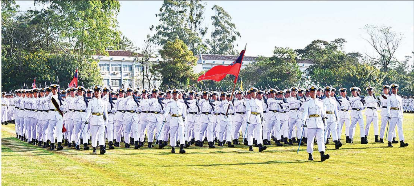
နိုင်ငံတော်စီမံအုပ်ချုပ်ရေးကောင်စီဥက္ကဋ္ဌ တပ်မတော်ကာကွယ်ရေးဦးစီးချုပ် ဗိုလ်ချုပ်မှူးကြီး မဟာသရေစည်သူ မင်းအောင်လှိုင် အား ဗိုလ်လောင်းတပ်ခွဲများက အနေးလျှောက်၊ အမြန်လျှောက်ဖြင့် ချီတက် အလေးပြုကြစဉ်။