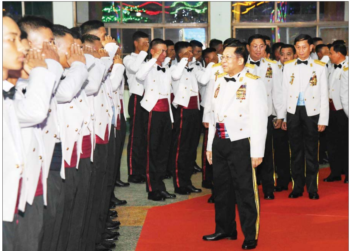
နိုင်ငံတော်စီမံအုပ်ချုပ်ရေးကောင်စီဥက္ကဋ္ဌ တပ်မတော်ကာကွယ်ရေးဦးစီးချုပ် ဗိုလ်ချုပ်မှူးကြီး မင်းအောင်လှိုင် သင်တန်းဆင်း အရာရှိများအား ရင်းရင်းနှီးနှီးလိုက်လံနှုတ်ဆက်စဉ်။

ဌာနတို့မှ နည်းပြအရာရှိများနှင့် ဆရာ၊ ဆရာမများ၊ ဖိတ်ကြားထားသည့် ဧည့်သည်တော်များ တက်ရောက်ကြ သည်။ ဂုဏ်ပြုညစာ အတူတကွ သုံးဆောင် ဦးစွာ နိုင်ငံတော်စီမံအုပ်ချုပ်ရေး ကောင်စီဥက္ကဋ္ဌ တပ်မတော်ကာကွယ်ရေး ဦးစီးချုပ်က သင်တန်းဆင်း အရာရှိများ အား တစ်ဦးချင်း ရင်းရင်းနှီးနှီး လိုက်လံ နှုတ်ဆက်သည်။ ထို့နောက် နိုင်ငံတော်စီမံ အုပ်ချုပ်ရေးကောင်စီဥက္ကဋ္ဌ တပ်မတော် ကာကွယ်ရေးဦးစီးချုပ်နှင့် အဖွဲ့ဝင်များ သည် သင်တန်းဆင်းအရာရှိများ၊ ညစာ စားပွဲ တက်ရောက်လာကြသူများနှင့်အတူ ဂုဏ်ပြုညစာကို အတူတကွ သုံးဆောင်ကြ သည်။ ကြည့်ရှုအားပေး ညစာမသုံးဆောင်မီနှင့် သုံးဆောင် နေစဉ်အတွင်း ပြည်သူ့ဆက်ဆံရေးနှင့်