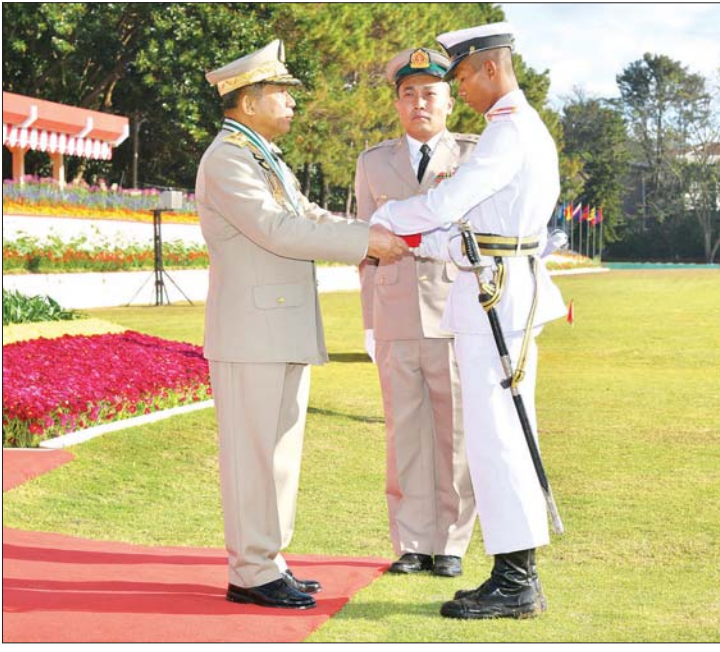
နိုင်ငံတော်စီမံအုပ်ချုပ်ရေးကောင်စီဥက္ကဋ္ဌ တပ်မတော်ကာကွယ်ရေးဦးစီးချုပ် ဗိုလ်ချုပ်မှူးကြီး မဟာသရေစည်သူ မင်းအောင်လှိုင် စာပေထူးချွန်ဆု (ဝိဇ္ဇာ) ရရှိသူ ဗိုလ်လောင်းအမှတ် ၃၄၉၈၅၊ ဗိုလ်လောင်း ဇွဲညီမင်းပိုင်အား ဆုပေးအပ်ချီးမြှင့်စဉ်။

ထို့နောက် နိုင်ငံတော်စီမံအုပ်ချုပ်ရေးကောင်စီဥက္ကဋ္ဌ တပ်မတော်ကာကွယ်ရေးဦးစီးချုပ် ဗိုလ်ချုပ်မှူးကြီး မဟာသရေစည်သူ မင်းအောင်လှိုင်က သင်တန်းဆင်းမိန့်ခွန်း ပြောကြားရာတွင် “တပ်မတော် (ကြည်း၊ ရေ၊ လေ)အတွက် လိုအပ်သည့် လက်ရုံးရည် နှလုံးရည်နှင့်ပြည့်စုံသော အရာရှိကောင်းများ မွေးထုတ်ပေးရန်” ဟူသည့် စစ်တက္ကသိုလ်၏ ရည်ရွယ်ချက်နှင့်အညီ တပ်မတော်၏ ခေါင်းဆောင်ငယ်များအဖြစ် မွေးထုတ်လိုက်ခြင်းသည် တိုင်းပြည်တာဝန်၊ နိုင်ငံ့တာဝန်ကို တပ်ရင်း၊