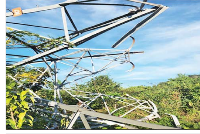
ဓာတ်အားလိုင်း တိုင်အမှတ် (၄၇) ပျက်စီးမှုမှတ်တမ်းဓာတ်ပုံ။