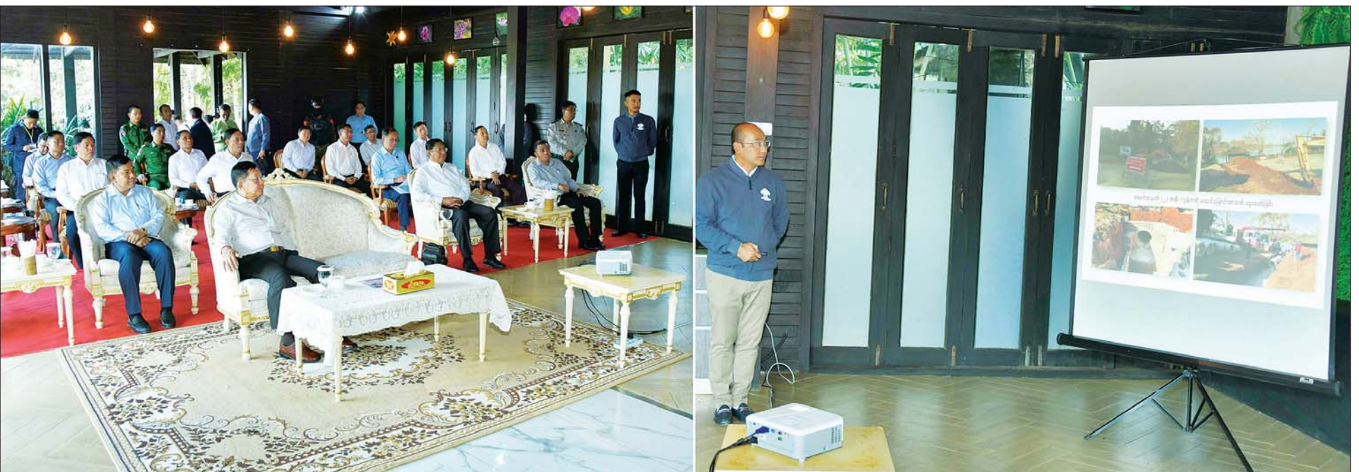
နိုင်ငံတော်စီမံအုပ်ချုပ်ရေးကောင်စီဥက္ကဋ္ဌ နိုင်ငံတော်ဝန်ကြီးချုပ် ဗိုလ်ချုပ်မှူးကြီး မင်းအောင်လှိုင်အား အမျိုးသားကန်တော်ကြီးဥယျာဉ်ဆိုင်ရာ အချက်အလက်များနှင့်ပတ်သက်၍ တာဝန်ရှိသူတစ်ဦးက ရှင်းလင်းတင်ပြစဉ်။