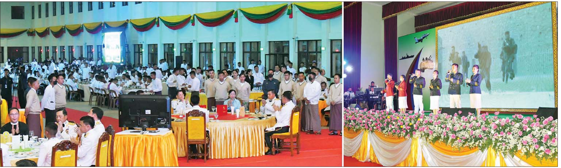
နိုင်ငံတော်စီမံအုပ်ချုပ်ရေးကောင်စီဥက္ကဋ္ဌ တပ်မတော်ကာကွယ်ရေးဦးစီးချုပ် ဗိုလ်ချုပ်မှူးကြီး မင်းအောင်လှိုင်နှင့် တက်ရောက်လာကြသူများ စစ်တက္ကသိုလ် ဗိုလ်လောင်းသင်တန်း အမှတ်စဉ်(၆၄) သင်တန်းဆင်းဂုဏ်ပြု ညစာစားပွဲအခမ်းအနားတွင် မြဝတီတေးဂီတအဖွဲ့က တေးသီချင်းများဖြင့် သီဆိုတီးမှုတ် ဖျော်ဖြေနေမှုကို ကြည့်ရှုအားပေးစဉ်။