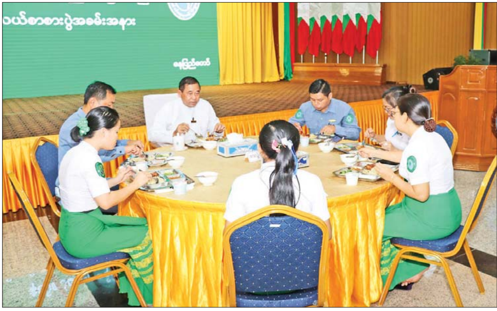
ပြည်ထောင်စုဝန်ကြီး ဒုတိယဗိုလ်ချုပ်ကြီး ထွန်းထွန်းနောင် ဝန်ထမ်းများနှင့်အတူ မိတ်ဆုံနေ့လယ်စာ လက်ရည်တစ်ပြင်တည်း သုံးဆောင်စဉ်။

ပေးအပ်သော တာဝန်များကို အဆိုပါ မိတ်ဆုံနေ့လယ်စာ ကျရာအခန်းကဏ္ဍမှ အလေးထား စားပွဲသို့ ဒုတိယဝန်ကြီးများ ကြိုးစား ဆောင်ရွက်ကြသည့် ဖြစ်ကြသည့် ဗိုလ်ချုပ် ခွန်သန့် အတွက် ကျေးဇူးတင်ရှိပါကြောင်း၊ ဇော်ထူးနှင့် ဗိုလ်ချုပ်ဖြိုးသန့်၊ ဆက်လက်၍လည်း မိသားစု အမြဲတမ်းအတွင်းဝန်၊ ညွှန်ကြား ရေးမှူးချုပ်၊ ဌာနအကြီးအကဲများ၊ ဝန်ကြီးရုံးနှင့် ဦးစီးဌာနများမှ အရာထမ်း၊ အမှုထမ်းများ တက်ရောက် သုံးဆောင်ခဲ့ကြပြီး လစဉ် ကျင်းပလျက်ရှိကြောင်း သိရသည်။ သတင်းစဉ်