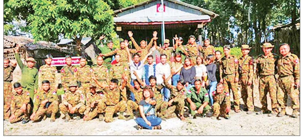
MRTV မှ ဖျော်ဖြေရေးအဖွဲ့၊ သူ့အဖွဲ့သားများ ရှေ့တန်းတစ်နေရာတွင် တပ်မတော်သားများနှင့် အမှတ်တရ စုပေါင်းဓာတ်ပုံ။