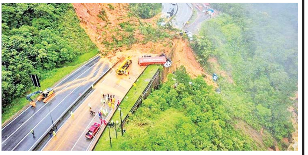
ဘရာဇီးနိုင်ငံ အဝေးပြေး လမ်းပိုင်းတစ်နေရာ၌ မြေပြို ကျနေသည်ကို တွေ့ရစဉ်။

ဆော်ပေါလို ဒီဇင်ဘာ ၂ ဘရာဇီးနိုင်ငံ တောင်ပိုင်း ဆန်တာကာထရီနာ ပြည်နယ် ၌ မိုးသည်းထန်စွာရွာသွန်းပြီး ရေကြီး မြေပြိုမှုများကြောင့် အနည်းဆုံး နှစ်ဦး သေဆုံးခဲ့ပြီး မီးသတ်သမားတစ်ဦး ပျောက်ဆုံးလျက်ရှိကြောင်း ပြည်နယ် မီးသတ်ဌာနနှင့် ပြည်နယ် အရပ်ဘက် ကာကွယ်ရေးရုံးက ဒီဇင်ဘာ ၁ ရက်က ပြောကြား လိုက်သည်။ ဘရာဇီးနိုင်ငံ တောင်ပိုင်း မြေပြိုမှုအတွင်း အမျိုးသား တစ်ဦးသေဆုံးခဲ့သည်။ နောက် တစ်ဦးမှာ ပါဟိုကာမြို့ရှိ ရေလွှမ်း နေသော လမ်းကို ဖြတ်ကူးရာမှ ဓာတ်လိုက် သေဆုံးခဲ့ခြင်းဖြစ် ကြောင်း သိရသည်။ ထို့အပြင် ဆန်တာကာ ထရီနာပြည်နယ် နာဗီဂန်တက်စ် အပန်းဖြေကမ်းခြေ တစ်ခု၌ လှေနှစ်မြုပ်ပြီး မီးသတ်သမား တစ်ဦးလည်း ပျောက်ဆုံးလျက်ရှိ သည်။ အာဂျင်တီးနားနှင့် နယ်နိမိတ် ချင်းထိစပ်လျက်ရှိသော ဆန်တာ ကာထရီနာပြည်နယ်၌ လူ ၆၀၀ ကျော်ကို ၎င်းတို့၏ နေအိမ်များမှ ဘေးလွတ်ရာသို့ ကယ်တင်ခဲ့ရ သည်။ ဆင်ဟွာ