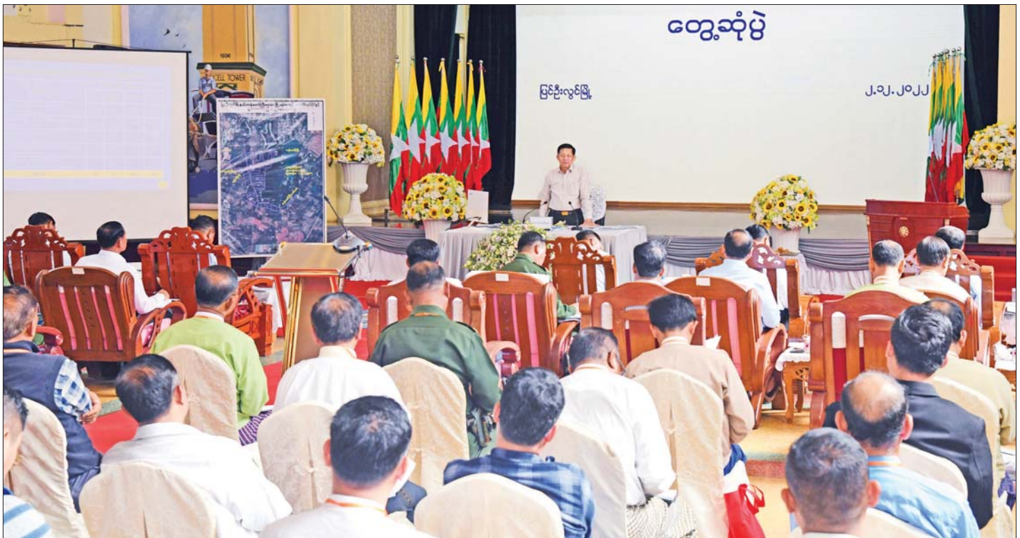
နိုင်ငံတော်စီမံအုပ်ချုပ်ရေးကောင်စီဥက္ကဋ္ဌ နိုင်ငံတော်ဝန်ကြီးချုပ် ဗိုလ်ချုပ်မှူးကြီး မင်းအောင်လှိုင် ပြင်ဦးလွင်မြို့ရှိ ကော်ဖီလုပ်ငန်းရှင်များအား တွေ့ဆုံပွဲတွင် ဆွေးနွေးပြောကြားစဉ်။

ယင်းနောက် တက်ရောက်လာကြသည့် ကော်ဖီလုပ်ငန်းရှင်များက ပြည်တွင်းမှထွက်ရှိသည့် ကော်ဖီများ ပြည်တွင်းနှင့် ပြည်ပဈေးကွက်သို့ ဖြန့်ဖြူး