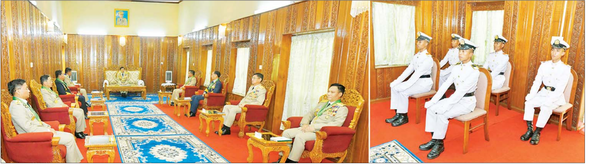
နိုင်ငံတော်စီမံအုပ်ချုပ်ရေးကောင်စီဥက္ကဋ္ဌ တပ်မတော်ကာကွယ်ရေးဦးစီးချုပ် ဗိုလ်ချုပ်မှူးကြီး မဟာသရေစည်သူ မင်းအောင်လှိုင် ထူးချွန်ဆုရရှိကြသည့် ဗိုလ်လောင်း ငါးဦးကို တွေ့ဆုံ၍ ဂုဏ်ပြုအမှာစကား ပြောကြားစဉ်။

စာမျက်နှာ ၄ မှ ထို့ကြောင့် မိမိတို့ တပ်မတော်အနေဖြင့် ပြည်တွင်းငြိမ်းချမ်းရေးရရှိရန်အတွက် ငြိမ်းချမ်းရေး မူဝါဒ (၆) ရပ်ကို ချမှတ်ပြီး တိုင်းရင်းသားလက်နက် ကိုင်အဖွဲ့အစည်းများကို စစ်မှန်သည့် ပြည်ထောင်စု စိတ်ဓာတ်အရင်းခံနှင့် ငြိမ်းချမ်းရေးဆောင်ရွက်ရန် အတွက် နိုင်ငံတော်အစိုးရ၊ ပြည်သူတို့နှင့်အတူ အား သွန်ခွန်စိုက်ကြိုးပမ်းနေခြင်းဖြစ်ကြောင်း။