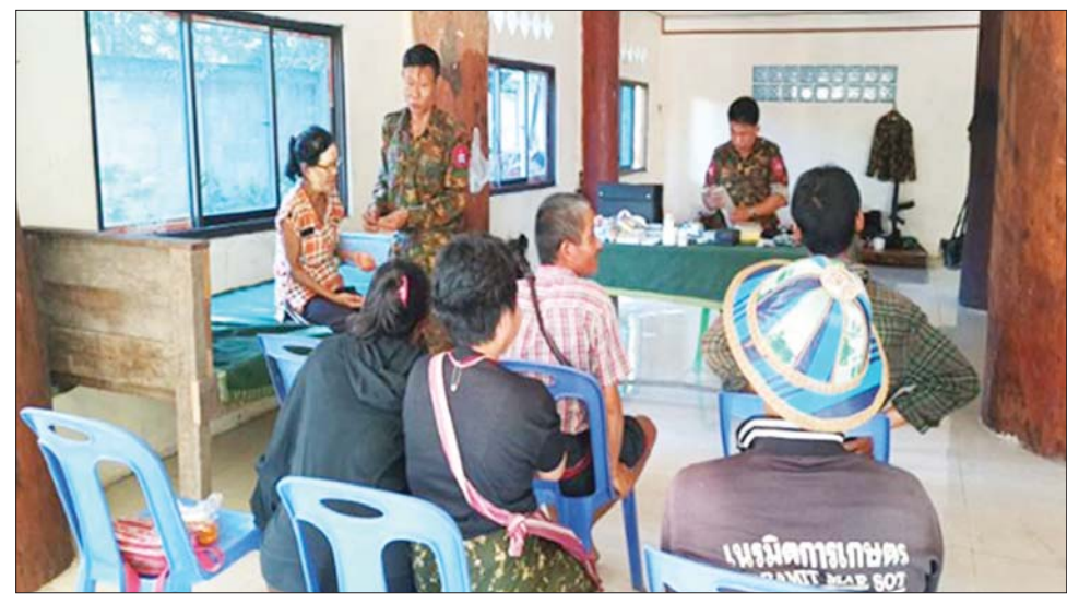
လာသူများအား သက်ဆိုင်ရာ တာဝန်ရှိသူများက နေ့ညမပျက် ပြန်လည်ကြိုဆို၍ လက်ခံလျက်ရှိပြီး စနစ်တကျ ဆန်နှင့် စားသောက်ဖွယ်ရာများ၊ လူသုံး ကုန်ပစ္စည်းများ ထောက်ပံ့ ပေးအပ်ကာ လိုအပ်သည့် ကူညီ ကယ်ဆယ်ရေး လုပ်ငန်းများနှင့် ကျန်းမာရေး စောင့်ရှောက်မှုများ (အပေါ်ပုံ) ဆောင်ရွက်ပေးလျက်ရှိ ကြောင်း သတင်းရရှိသည်။ သတင်းစဉ်

စွာ ပြန်လည်နေထိုင်လိုသည့် ခေတ္တထွက်ပြေး တိမ်းရှောင်နေ သည့် ဒေသခံတိုင်းရင်းသားများမှာ ဝမ်းသာအားရဖြင့် ပြန်လည် ဝင်ရောက်လျက်ရှိရာ ယနေ့ တွင် သေဘောဘိုးကျေးရွာသို့ အမျိုးသား ၃၂ ဦး၊ အမျိုးသမီး ၃၂ ဦး၊ ဘလက်ဒိုကျေးရွာသို့ အမျိုး သား ၄၆ ဦး၊ အမျိုးသမီး ၅၂ ဦး၊ ထပ်မံဝင်ရောက်လာခဲ့ပြီး နိုဝင်ဘာ ၂၈ ရက်မှ ယနေ့အထိ သေဘော ဘိုးကျေးရွာနှင့် ဘလက်ဒိုကျေးရွာ များသို့ ပြန်လည်ဝင်ရောက်လာ သည့် ဒေသခံတိုင်းရင်းသား အမျိုးသား ၂၉၁ ဦး၊ အမျိုးသမီး ၃၀၈ ဦး စုစုပေါင်း ၅၉၉ ဦးရှိပြီဖြစ် ကြောင်း သိရှိရသည်။ အဆိုပါ ပြန်လည်ဝင်ရောက်