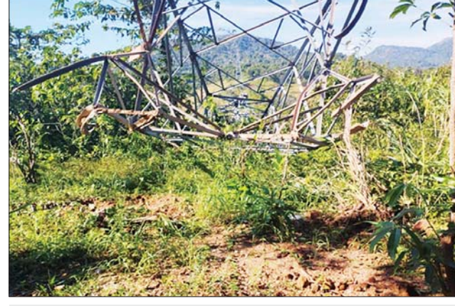
ဓာတ်အားလိုင်း တိုင်အမှတ် (၄၆) ပျက်စီးမှုမှတ်တမ်းဓာတ်ပုံ။