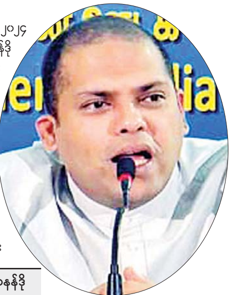
သီရိလင်္ကာနိုင်ငံ ခရီးသွားဝန်ကြီး ဟာရင် ဖာနန်ဒို

ကိုလံဘို ဒီဇင်ဘာ ၂ သီရိလင်္ကာနိုင်ငံသည် လာမည့်နှစ်တွင် နိုင်ငံခြားခရီးသွား ၁ ဒသမ ၅ သန်းနီးပါးနှင့် ၂၀၂၄ ခုနှစ်တွင် ခရီးသွားသုံးသန်းလာရောက်မျှော်မှန်းထားကြောင်း ခရီးသွားဝန်ကြီး ဟာရင် ဖာနန်ဒို က ဒေသတွင်းမီဒီယာသို့ ပြောကြားလိုက်သည်။ လွန်ခဲ့သော လအနည်းငယ်အတွင်း နိုင်ငံခြားခရီးသွား လာရောက်မှု တိုးတက်လာခဲ့ ကြောင်းနှင့် လေကြောင်းလိုင်းများစွာ သီရိလင်္ကာနိုင်ငံသို့ စတင်ပျံသန်းရန် စီစဉ်လျက်ရှိကြောင်း ခရီးသွားဝန်ကြီးက ထပ်လောင်းပြောကြားသည်။ ခရီးသွားလုပ်ငန်းသည် သီရိလင်္ကာနိုင်ငံ၏ အဓိကနိုင်ငံခြားငွေ လဲလှယ်သည့်လုပ်ငန်း တစ်ခုဖြစ်သည်။ သီရိလင်္ကာနိုင်ငံသည် ဒေသတွင်း တခြားနိုင်ငံများထက် စီးပွားရေး ပြန်လည်သက်ဝင်နှိုးထူ နှေးလျက်ရှိသည်။ သီရိလင်္ကာနှင့် အိမ်နီးချင်းမော်လဒိုက်နိုင်ငံ သည် လွန်ခဲ့သည့်လများအတွင်း နိုင်ငံခြားခရီးသွား တစ်လပျမ်းမျှ ၁၀၀၀၀၀ ကျော် ဝင်ရောက်စဉ်က သီရိလင်္ကာနိုင်ငံသို့ လာရောက်လည်ပတ်သော နိုင်ငံခြားခရီးသွား ဦးရေသည် ၃၀၀၀၀ မှ ၆၀၀၀၀ အထိသာရှိကြောင်း တရားဝင်စာရင်းများတွင် ဖော်ပြထား သည်။ ဆင်ဟွာ