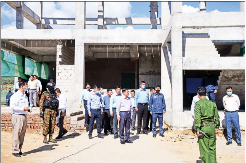
နိုင်ငံတော်စီမံအုပ်ချုပ်ရေးကောင်စီဥက္ကဋ္ဌ နိုင်ငံတော်ဝန်ကြီးချုပ် ဗိုလ်ချုပ်မှူးကြီး မင်းအောင်လှိုင် Sky Cable တည်ဆောက်နေမှုကို ကြည့်ရှုစစ်ဆေးစဉ်။

အကွက်ချမှုမရှိခြင်း၊ ဈေးဆိုင်ခန်းများ များပြားလာခြင်း၊ စည်းကမ်းမဲ့အမှိုက်စွန့်ပစ်ခြင်း၊ သစ်ပင်များ ခုတ်လှဲခြင်းများကြောင့် သဘာဝပတ်ဝန်းကျင်နှင့် ဂေဟစနစ် ပျက်စီးယိုယွင်းမှုများ ဖြစ်ပေါ်လာခဲ့ကြောင်း၊ ထို့ကြောင့် နိုင်ငံတော်စီမံအုပ်ချုပ်ရေးကောင်စီဥက္ကဋ္ဌ နိုင်ငံတော်ဝန်ကြီးချုပ် လာရောက်စစ်ဆေးစဉ် လမ်းညွှန်ချက်များအရ အဆင့်မြှင့်တင် ပြုပြင်ထိန်းသိမ်း ဆောင်ရွက်ခဲ့ခြင်းဖြစ်ကြောင်း၊ ရေတံခွန်အတွင်း ရေသန့်စင်စေရေး သဘာဝရေသန့်စင်စနစ်ကို အသုံးပြုထားသဖြင့် ရေကစားလိုသူများအနေဖြင့်လည်း သန့်ရှင်းပြီး ကျန်းမာရေးနှင့် ညီညွတ်စွာ ရေကစားမှုပြုနိုင်မည်ဖြစ်ကြောင်း၊ အပန်းဖြေစခန်းအတွင်း ရေတံခွန် သုံးခုရှိပြီး မြန်မာနိုင်ငံတွင် ပထမဆုံး LED မှန်တံတားကိုလည်း ကမ္ဘာ့အဆင့်မီစွာဖြင့် ထည့်သွင်းဆောက်လုပ်ထားကာ မှန်တံတားအောက်ခြေ ရှုခင်းများကို ရင်ခုန်စိတ်လှုပ်ရှားစွာ ခံစားနိုင်မည်ဖြစ်ကြောင်း၊ ပန်းမြို့တော်၊ ခရီးသွားမြို့တော်ဖြစ်သည်နှင့်အညီ ပန်းမျိုးစုံကို စိုက်ပျိုးထားရှိပြီး နှစ်စဉ်ပန်းပွဲတော်များကိုလည်း ကျင်းပပြုလုပ်သွားမည်ဖြစ်ကြောင်း၊ လာရောက်လည်ပတ်သူများ စိတ်အပန်းဖြေစေရန် ရည်ရွယ်၍ အဆင့်မြှင့်တင်ဆောင်ရွက်ထားပြီး မှန်တံတား၊ ကြိုးတံတားများအပြင် log house၊ coffee shop၊ တောတွင်းလျှောက်လမ်းများ၊ အပန်းဖြေနေရာများ၊ ကလေးကစားကွင်းများ စသည်တို့ကို ပြည့်စုံအောင် ထည့်သွင်း အဆင့်မြှင့်တင်ထားရှိသည့်အပြင် ယခုအခါတွင် အရည် ၅၅၄ မီတာရှိ Sky Cable ကိုလည်း တည်ဆောက်လျက်ရှိပြီး မကြာမီအချိန်အတွင်း ဖွင့်လှစ်နိုင်ရေးအတွက် ဆောင်ရွက်လျက်ရှိကြောင်း သတင်းရရှိသည်။ သတင်းစဉ်