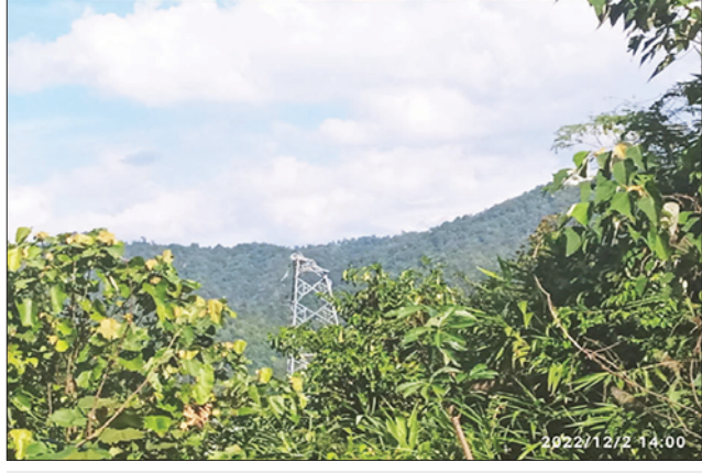
ဓာတ်အားလိုင်း တိုင်အမှတ် (၄၅) ပျက်စီးမှုမှတ်တမ်းဓာတ်ပုံ။

အကြမ်းဖက်မှု လုပ်ရပ်များကို ကျူးလွန်ခဲ့သူများအား ဥပဒေနှင့် အညီ ထိရောက်စွာအရေးယူနိုင် ရေး လုံခြုံရေးတပ်ဖွဲ့ဝင်များက စုံစမ်းဖော်ထုတ်လျက်ရှိကြောင်း သတင်းရရှိသည်။ သတင်းစဉ်