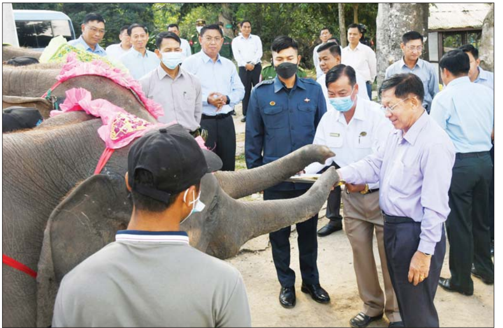
နိုင်ငံတော်စီမံအုပ်ချုပ်ရေးကောင်စီဥက္ကဋ္ဌ နိုင်ငံတော်ဝန်ကြီးချုပ် ဗိုလ်ချုပ်မှူးကြီး မင်းအောင်လှိုင် ပွဲကောက်ရေတံခွန်အပန်းဖြေစခန်းအတွင်းရှိ ဆင်ကလေးများကို အစာကျွေးစဉ်။