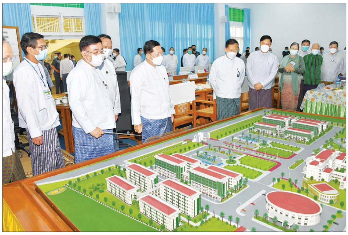
နိုင်ငံတော်စီမံအုပ်ချုပ်ရေးကောင်စီဥက္ကဋ္ဌ နိုင်ငံတော်ဝန်ကြီးချုပ် ဗိုလ်ချုပ်မှူးကြီးမင်းအောင်လှိုင် Naypyitaw State Academy အဆောက်အအုံ ပုံစံငယ်များကို ကြည့်ရှုစဉ်။

အဆင့်မြင့်တက္ကသိုလ်များတွင် ဂုဏ် ယူလောက်သော ပရဝဏ်နှင့် အဆောက် အအုံများရှိခြင်း၊ National Landmark များအဖြစ် တည်ရှိခြင်း၊ တော်သော ဆရာ၊ တော်သောကျောင်းသားများကို ရွေးချယ်မွေးမြူကာ လေ့ကျင့်ပေးခြင်း၊ ကောင်းသောပညာဝန်းကျင် (Academic Atmosphere) ရှိခြင်း၊ မိမိနှစ်သက်ရာ ပညာရပ်နယ်ပယ်ကို အထူးအလေးပြု ကာ သုတေသနပြုနိုင်ရန် ငွေကြေး ထောက်ပံ့မှုရှိခြင်း၊ စာကြည့်တိုက် ကောင်းရှိခြင်း၊ သုတေသနလုပ်ငန်းများ အတွက် ပစ္စည်းကိရိယာ စုံလင်ခြင်း၊ ကျောင်းသား ကျောင်းသူအဆောင်များ၊ မိသားစုနေအိမ်၊ စားသောက်ဆိုင်များ၊ ဈေးနှုန်းသင့်လျော်သော စတိုးဆိုင်များ၊ အားကစား အပန်းဖြေနည်းအစုံ၊ ဝါသနာ ပါရာ အနုပညာ လိုက်စားစရာ အစုံ အလင်ရှိသော ပျော်ရွှင်ဖွယ်ရာ အဖွဲ့ အစည်းဖြစ်ခြင်း စသည့်အချက်များ