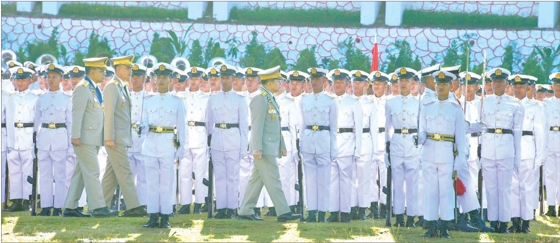
နိုင်ငံတော်စီမံအုပ်ချုပ်ရေးကောင်စီဥက္ကဋ္ဌ တပ်မတော်ကာကွယ်ရေးဦးစီးချုပ် ဗိုလ်ချုပ်မှူးကြီး မဟာသရေစည်သူ မင်းအောင်လှိုင် စစ်တက္ကသိုလ် ဗိုလ်လောင်းသင်တန်းအမှတ်စဉ် (၆၄) သင်တန်းဆင်းဂုဏ်ပြုစစ်ရေးပြအခမ်းအနားတွင် ဗိုလ်လောင်းတပ်ခွဲများအား စစ်ဆေးစဉ်။

ခေါင်းဆောင်ငယ်များဖြစ်လာကြမည့်သူများဖြစ်သည့်အတွက် ခေါင်းဆောင်မှုအင်္ဂါရပ်များနှင့်အညီ ကျင့်ကြံအားထုတ်နေထိုင်ပြီး အမိစစ်တက္ကသိုလ်၏ဂုဏ်ကို ဆောင်နိုင်သော လက်ရုံးရည်၊ နှလုံးရည်ပြည့်ဝသည့် နောင်တစ်ခေတ်၏ ခေါင်းဆောင်ကောင်းများဖြစ်အောင် ကြိုးစားဆောင်ရွက်သွားကြရန်လို