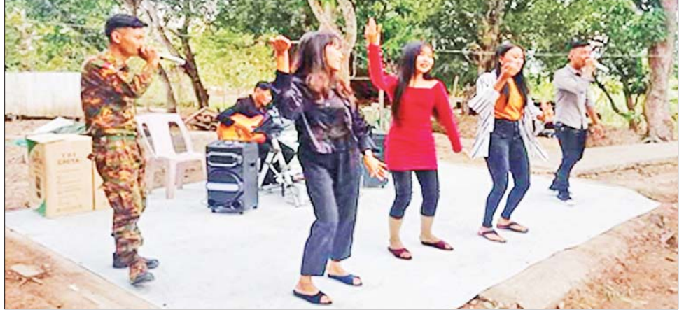
နယ်လှည့်ပြည်သူ့ဆက်ဆံရေးအဖွဲ့များမှ စစ်သည်၊ စစ်သမီးများ ရှေ့တန်းတစ်နေရာ၌ ဖျော်ဖြေ နေစဉ်။

သီဆိုကပြဖျော်ဖြေကြရာ ရှေ့တန်းစခန်းများရှိ တပ်မတော်သားများနှင့် နယ်ခြားစောင့်တပ်ဖွဲ့များက လုံခြုံရေးအရ အလှည့်ကျစနစ်ဖြင့် စိတ်ပျော်ရွှင် ကြည်နူးချမ်းမြေ့စွာဖြင့် ကြည့်ရှုအားပေးခဲ့ကြကြောင်း နှင့် ဖျော်ဖြေမှုအပေါ် ဝမ်းသာပီတိဖြစ်စွာနှင့် ရှေ့တန်းအရောက် လာရောက်ဖျော်ဖြေပေးကြသူ များကို မိမိတို့၏ ချေးနှံစာဖြင့်ရရှိသည့် လစာအချို့မှ စုပေါင်း၍ ဂုဏ်ပြုဆုငွေများလည်း ပေးအပ်ချီးမြှင့်ခဲ့ ကြကြောင်း သတင်းရရှိသည်။ သတင်းစဉ်