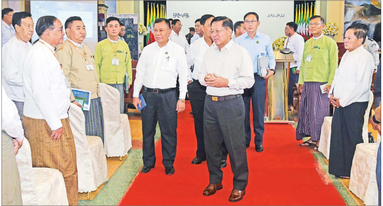
နိုင်ငံတော်စီမံအုပ်ချုပ်ရေးကောင်စီဥက္ကဋ္ဌ နိုင်ငံတော်ဝန်ကြီးချုပ် ဗိုလ်ချုပ်မှူးကြီး မင်းအောင်လှိုင် တက်ရောက်လာသည့် ကော်ဖီလုပ်ငန်းရှင်များအား ရင်းရင်းနှီးနှီး နှုတ်ဆက်စဉ်။

ပြည်ထောင်စုဝန်ကြီးများက ပြင်ဦးလွင်မြို့နယ်အတွင်း ကော်ဖီစိုက်ပျိုးမှုနှင့် ပတ်သက်၍ ဆွေးနွေးတင်ပြ