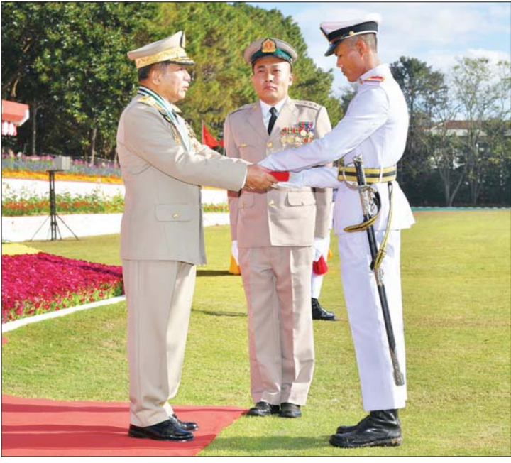
နိုင်ငံတော်စီမံအုပ်ချုပ်ရေးကောင်စီဥက္ကဋ္ဌ တပ်မတော်ကာကွယ်ရေးဦးစီးချုပ် ဗိုလ်ချုပ်မှူးကြီး မဟာသရေစည်သူ မင်းအောင်လှိုင် စာပေထူးချွန်ဆု (သိပ္ပံ) ရရှိသူ ဗိုလ်လောင်းအမှတ် ၃၅၂၄၄၊ ဗိုလ်လောင်း မျိုးမင်းအောင်အား ဆုပေးအပ်ချီးမြှင့်စဉ်။

တပ်ဖွဲ့များတွင် အခြေခံကျကျ တာဝန်ထမ်းဆောင်နိုင်စေရန်ဖြစ်ကြောင်း၊ တပ်မတော်သည် လွတ်လပ်ရေး ကြိုးပမ်းမှုမင်းကြောင်းနှင့်အတူ ယှဉ်တွဲပေါ်ပေါက်လာခဲ့သည့် တပ်မတော်ဖြစ်ကြောင်း၊ ဗမာ့လွတ်လပ်ရေးတပ်မတော် (BIA) အဖြစ် တပ်မတော်၏ ဖခင် ဗိုလ်ချုပ်အောင်ဆန်း ဦးဆောင်ဖွဲ့စည်းခဲ့ပြီး ဗမာ့ကာကွယ်ရေးတပ်မတော် (BDA)၊ ဗမာ့အမျိုးသားတပ်မတော် (BNA)၊ မျိုးချစ်ဗမာ့တပ်မတော် (PBF)၊ ဗမာ့တပ်မတော် (Burma Army)အဖြစ် အဆင့်ဆင့်ပြောင်းလဲဖွဲ့စည်းခဲ့ပြီး နယ်ချဲ့ဆန့်ကျင်ရေး၊ ဖက်ဆစ်တော်လှန်ရေးများမှ လွတ်လပ်ရေးရသည့်အထိ ပြည်သူကို ဦးဆောင်လက်တွဲ တိုက်ပွဲဝင်ခဲ့သည့် တပ်မတော်ဖြစ်ကြောင်း။